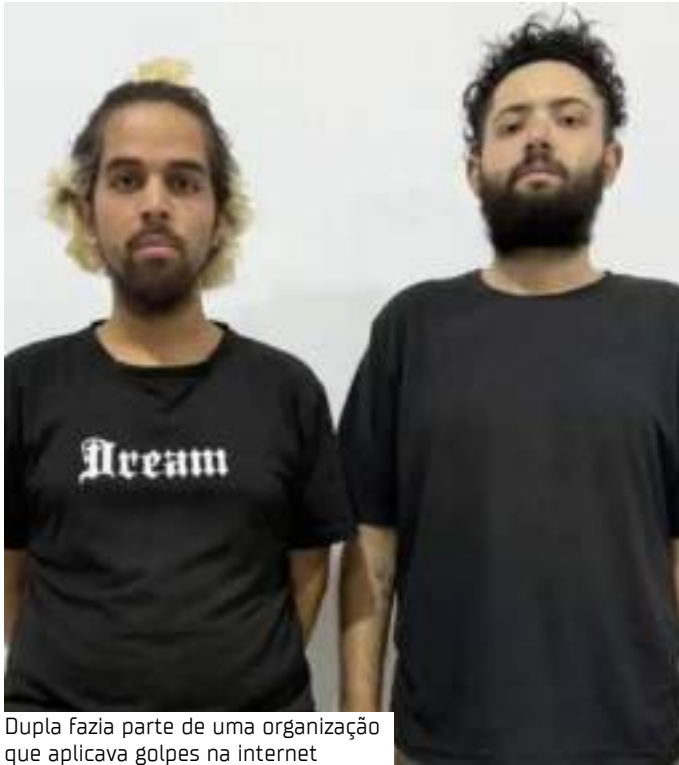
Dupla fazia parte de uma organização que aplicava golpes na internet