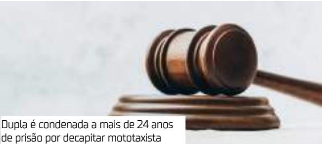
Dupla é condenada a mais de 24 anos de prisão por decapitar mototaxista