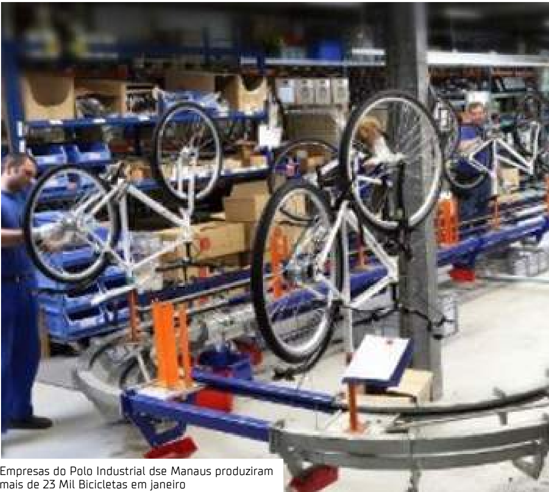
Empresas do Polo Industrial de Manaus produziram mais de 23 Mil Bicicletas em janeiro

A fabricação nacional de motocicletas, quase totalmente concentrada no Polo Industrial de Manaus (PIM), está entre as seis maiores do mundo. No segmento de bicicletas, com as principais fábricas também instaladas no PIM, o Brasil se encontra na quarta posição entre os principais produtores mundiais. No total, as fabricantes do Setor de Duas Rodas geram 18,7 mil empregos diretos em Manaus/AM e mais de 150 mil em todo o Brasil.