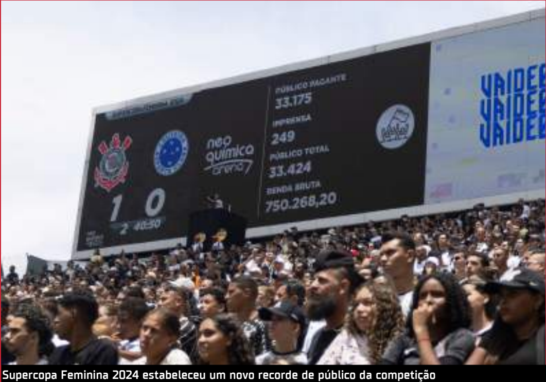
Supercopa Feminina 2024 estabeleceu um novo recorde de público da competição