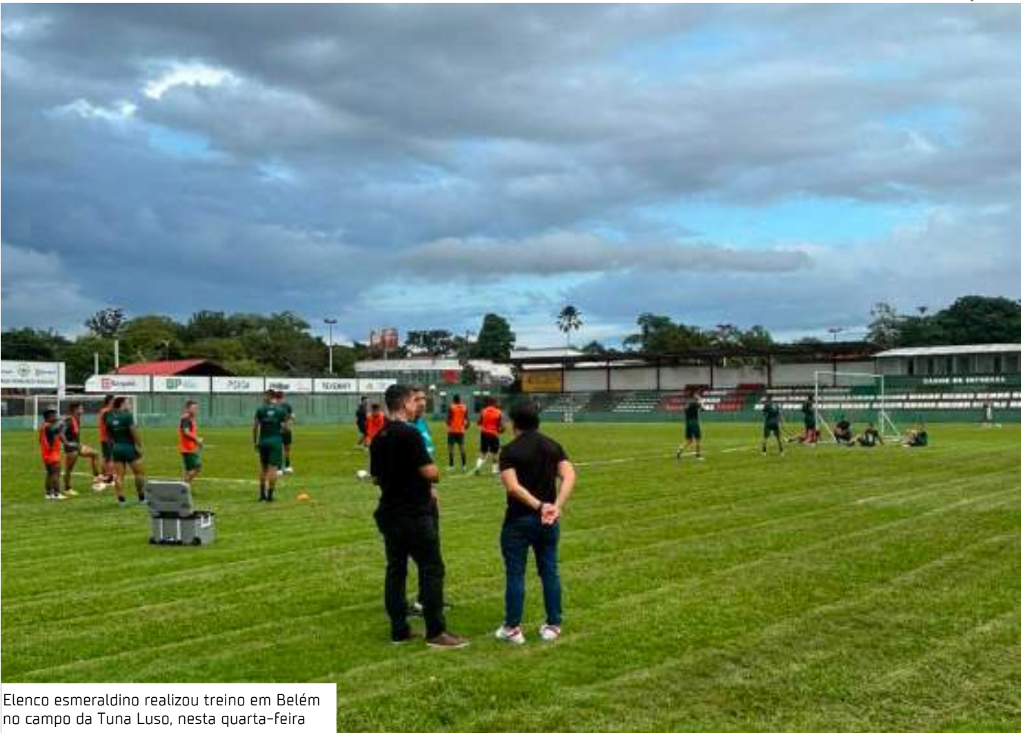
Elenco esmeraldino realizou treino em Belém no campo da Tuna Luso, nesta quarta-feira