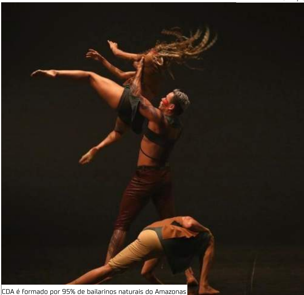
CDA é formado por 95% de bailarinos naturais do Amazonas