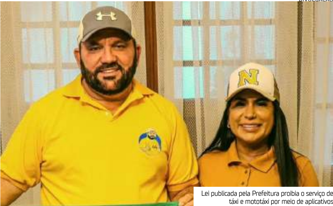
Lei publicada pela Prefeitura proíbe o serviço de táxi e mototáxi por meio de aplicativos