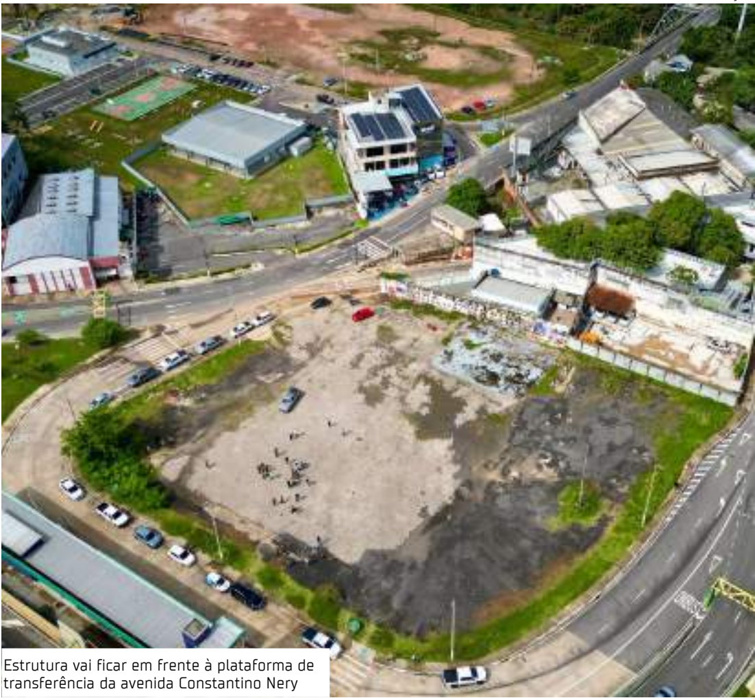
Estrutura vai ficar em frente à plataforma de transferência da avenida Constantino Nery

A Cidade do Autismo oferecerá atendimentos