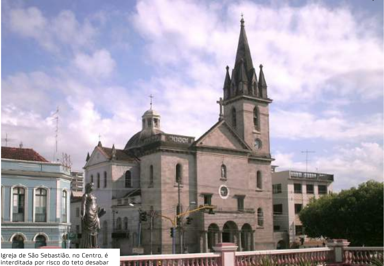
Igreja de São Sebastião, no Centro, é interditada por risco do teto desabar