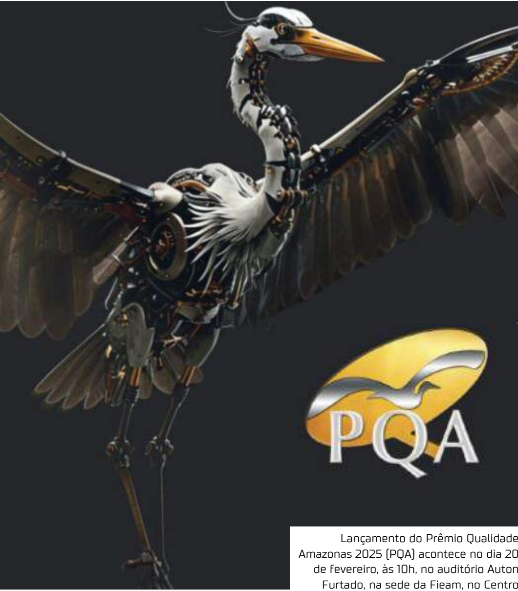
Lançamento do Prêmio Qualidade Amazonas 2025 (PQA) acontece no dia 20 de fevereiro, às 10h, no auditório Auton Furtado, na sede da Fieam, no Centro

Desde 1994, o Prêmio Qualidade Amazonas já reconheceu mais de 700 organizações, incentivando a excelência em gestão e processos organizacionais. Em 2025, continua promovendo a busca por melhorias contínuas em duas modalidades principais: Gestão, focada na evolução corporativa, e Processo, voltada para inovações e práticas sustentáveis. O prêmio, promovido pela Fieam por meio do Dampi (Departamento de Assistência à Média e Pequena Indústria), é considerado o "Oscar da Qualidade" por reconhecer as melhores organizações do Amazonas nas categorias de Gestão e Processo. As vencedoras são escolhidas após um rigoroso processo de avaliação que dura meses e envolve mais de 80 profissionais dedicando mais de mil horas nesta tarefa.