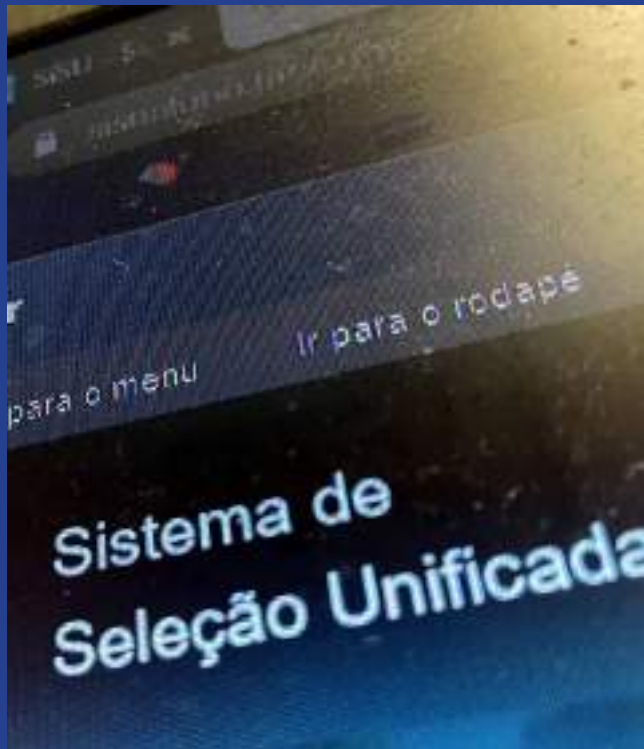
Programa do MEC facilita acesso ao ensino superior gratuito