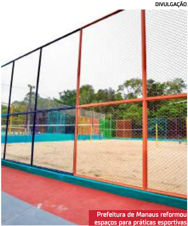
Prefeitura de Manaus reformou espaços para práticas esportivas