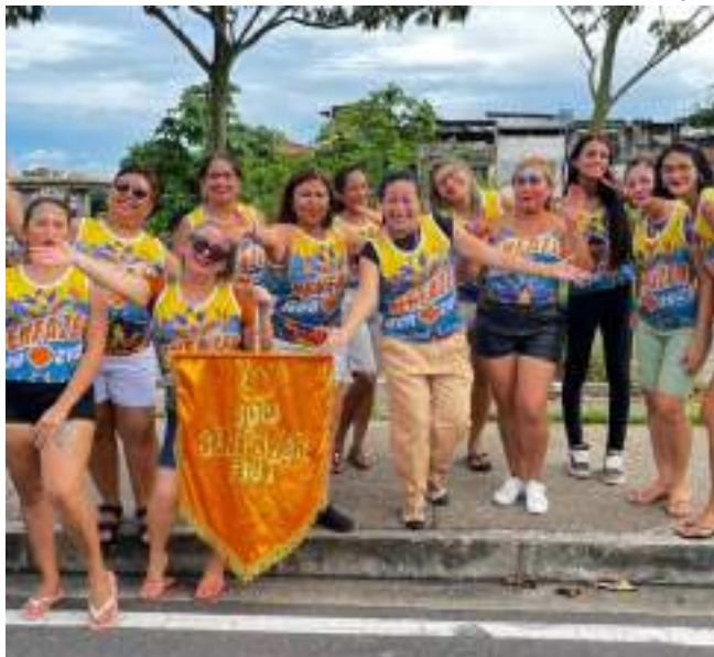
Evento vai gerar renda para mulheres empreendedoras e famílias