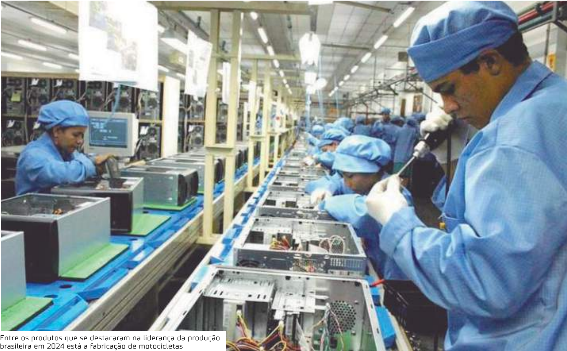
Entre os produtos que se destacaram na liderança da produção brasileira em 2024 está a fabricação de motocicletas

Na reunião, o presidente do Codam, governador do Amazonas Wilson Lima (União Brasil), falou, além dos investimentos, sobre os 2,2 mil novos postos de empregos.