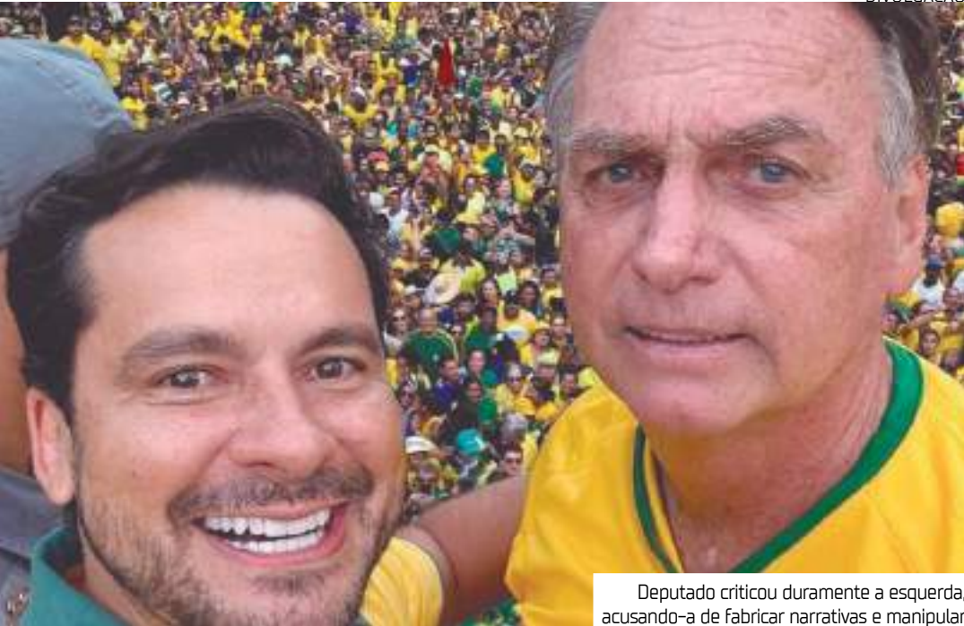
Deputado criticou duramente a esquerda, acusando-a de fabricar narrativas e manipular

Parlamentares da direita amazonense se manifestaram nas redes sociais em defesa do ex-presidente Jair Bolsonaro (PL) nesta quarta-feira (19). As declarações vieram após a Procuradoria-Geral da República (PGR) apresentar uma denúncia de 272 páginas que aponta Bolsonaro como figura central em uma suposta tentativa de golpe de Estado no Brasil. O deputado federal Alberto Neto (PL) criticou duramente a esquerda, acusando-a de fabricar narrativas e manipular informações sob o pretexto de defender a democracia. Segundo ele, essa estratégia se assemelha a práticas adotadas por regimes ditatoriais. Ele também afirmou que a população e a comunidade internacional estão atentas à situação política no país. Para o parlamentar, há uma perseguição contra a oposição, o que, em