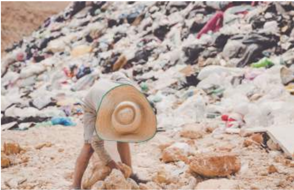
Decisão é resultado do descumprimento da Ação Civil Pública movida pelo pelo MPF

A Justiça Federal determinou uma multa diária de R$ 5 mil ao município de Tabatinga, por não cumprir a sentença que obriga a adoção de medidas para regularizar o manejo de resíduos sólidos no lixão da cidade. A decisão é resultado do descumprimento da Ação Civil Pública nº 7994-68.2010.4.01.3200, movida pelo Ministério Público Federal (MPF). Em 2013, a Justiça Federal condenou o município a implementar uma série de medidas essenciais para a adequação da gestão do lixo, incluindo: Cercamento do perímetro do lixão e instalação de portão com guarita; Controle de resíduos e escavação de valas respeitando o lençol freático; Aterramento de resíduos a céu aberto e manutenção de valas específicas; Contenção de