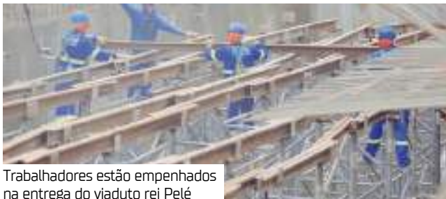
Trabalhadores estão empenhados na entrega do viaduto rei Pelé

Com a garantia de antecipação da entrega, a expectativa é que a estrutura desafogue um dos pontos mais críticos do trânsito de Manaus.