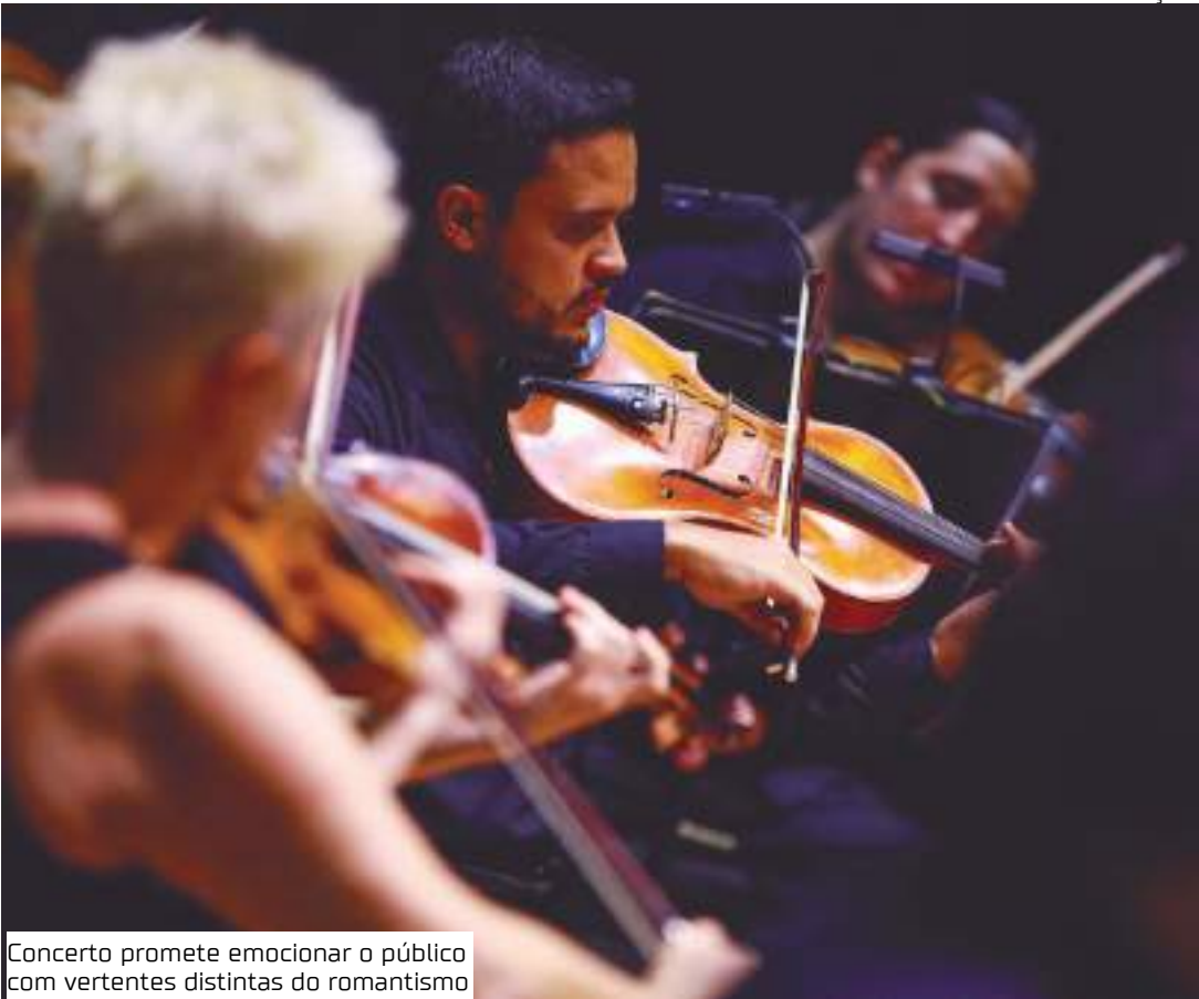
Concerto promete emocionar o público com vertentes distintas do romantismo

A apresentação traz uma obra pouco conhecida de Giacomo Puccini, que ficou famoso mundialmente por suas óperas. Segundo o maestro, essa peça, escrita para orquestra de cordas, foge do estilo operístico pelo qual o compositor italiano é mais lembrado. “Ano passado foi o centenário da morte dele, o mundo inteiro tocou muitas obras