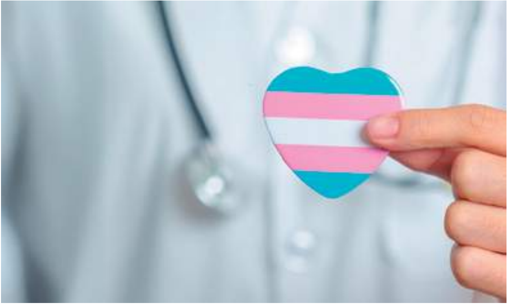
MPF cobra avanço na habilitação de ambulatório especializado à população transexual no Amazonas

O encontro, realizado em 6 de fevereiro, discutiu os entraves para a habilitação da Policlínica Codajás como referência no atendimento integral às pessoas transexuais. Na ocasião, foram expostas as falhas na implementação da política pública de saúde voltada à população trans, destacando que o Estado do Amazonas adotou apenas parte das medidas recomendadas pelo MPF. A recomendação, que previa ações para garantir a oferta de atendimento ambulatorial e hospitalar especializado, ainda não foi plenamente cumprida por problemas burocráticos, como o indeferimento de licença sanitária, itens pendentes relativos à licença ambiental e necessidade de conclusão do projeto