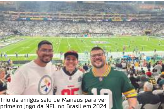
Trio de amigos saiu de Manaus para ver primeiro jogo da NFL no Brasil em 2024