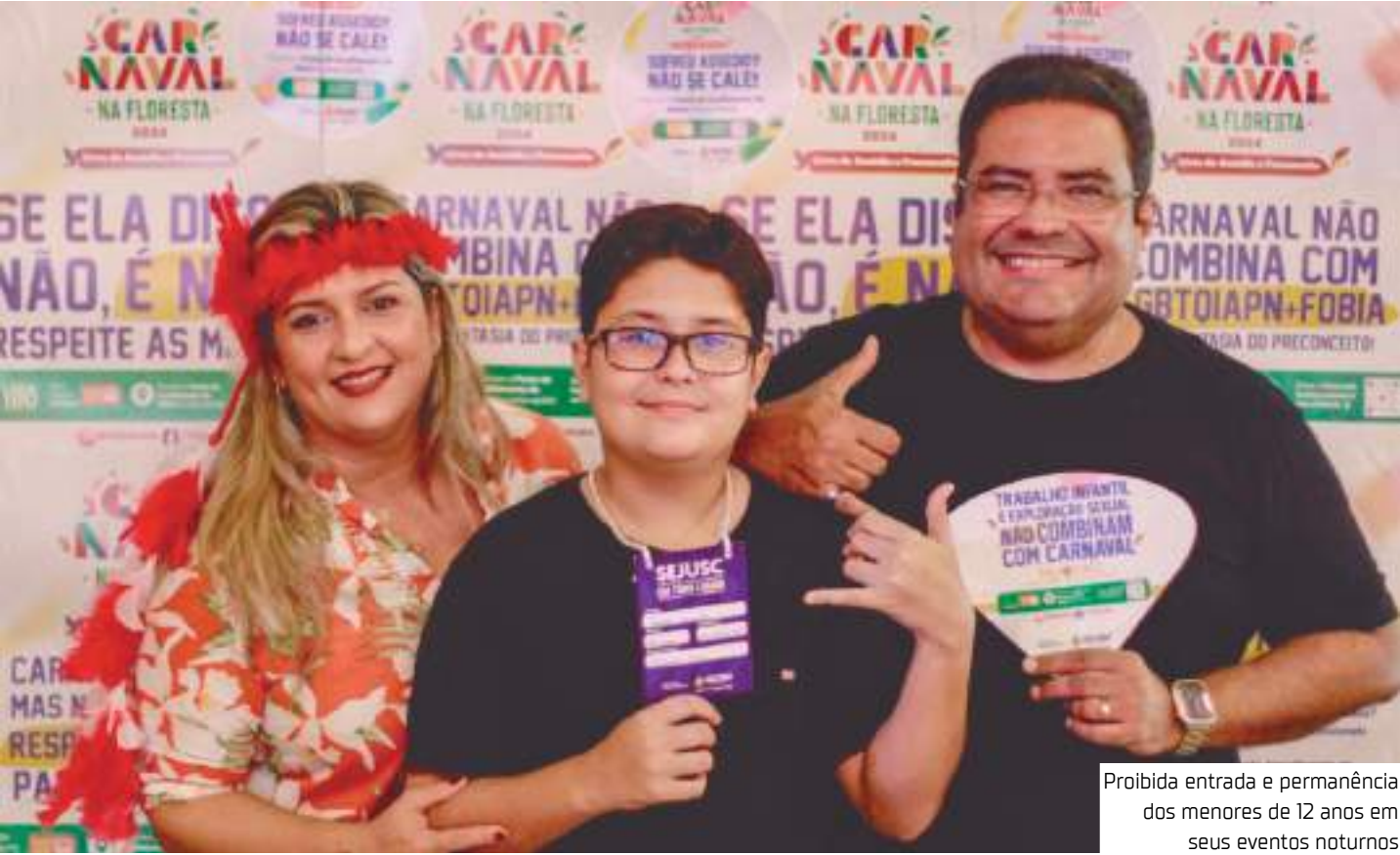
Proibida entrada e permanência dos menores de 12 anos em seus eventos noturnos

A medida é válida para bandas, blocos e desfiles de escolas de samba. As agremiações são responsáveis por requerer o alvará de crianças e adolescentes que participam dos ensaios