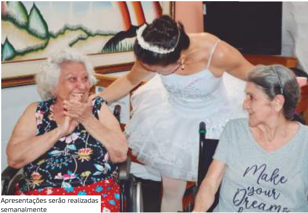
Apresentações serão realizadas semanalmente

As atividades do projeto “Cultura Ativa” serão realizadas semanalmente, com a participação voluntária de artistas locais, educadores e fazedores de cultura de Manaus. A programação incluirá oficinas interativas, apresentações culturais e