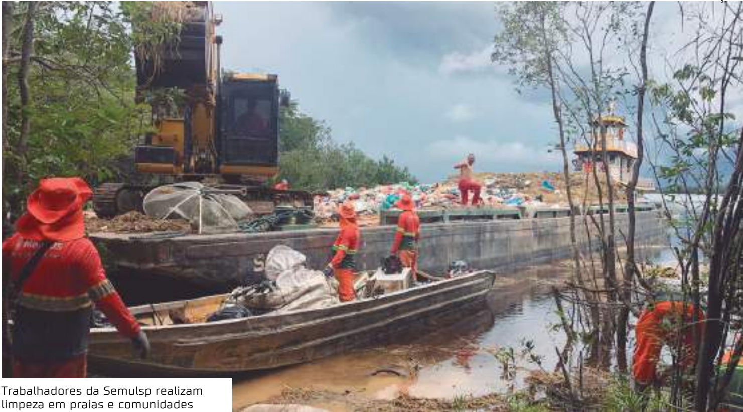
Trabalhadores da Semulsp realizam limpeza em praias e comunidades

A ação, que ocorre regularmente, atende praias bastante frequentadas, como as praias da Lua e do Tupé, além de comunidades ribeirinhas como Livramento, Nossa Senhora de Fátima, Abelha, Santa Maria, São Sebastião, Ebenezer, Agrovila, Julião, Baixote, Arara, São João do Tupé e Bela Vista do Jaraqui. O trabalho se estende ainda