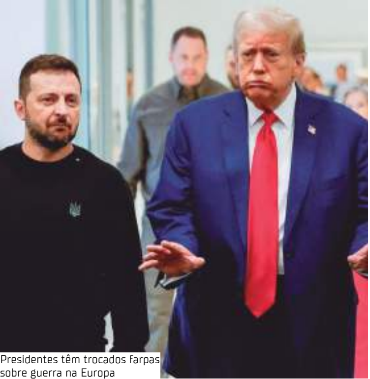
Presidentes têm trocados farpas sobre guerra na Europa

sem os EUA, a Ucrânia nunca conseguirá resolver o conflito. Trump também criticou a Europa, afirmando que a guerra na Ucrânia é “muito mais importante para a Europa do que para nós”. “Temos um grande e belo oceano como separação”, declarou. Pouco tempo depois da postagem de Trump, o ministro das Relações Exteriores da Ucrânia, Andrii Sybiha, declarou que seu povo e o presidente Zelensky “se recusaram a ceder à pressão do [presidente russo] Putin” e afirmou: “Ninguém pode forçar a Ucrânia a desistir” e “defenderemos nosso direito de existir.”