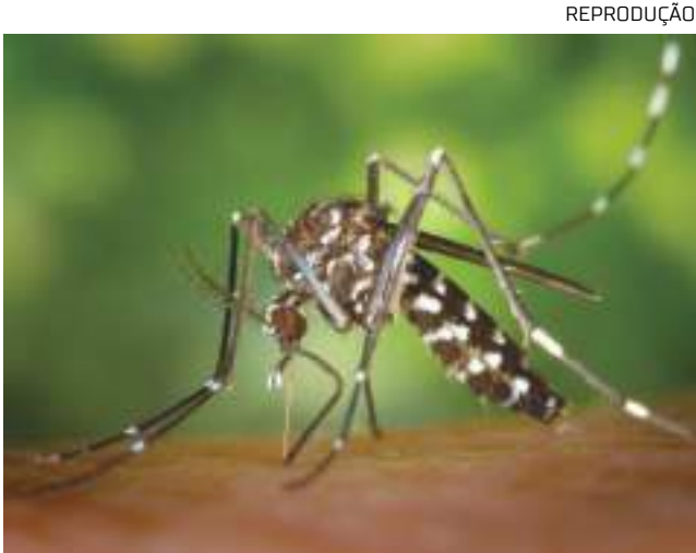
Estado reconheceu alta incidência da dengue