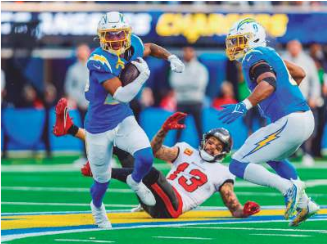
Mandante do jogo, time de Los Angeles leva cores da bandeira brasileira no uniforme: azul e amarelo