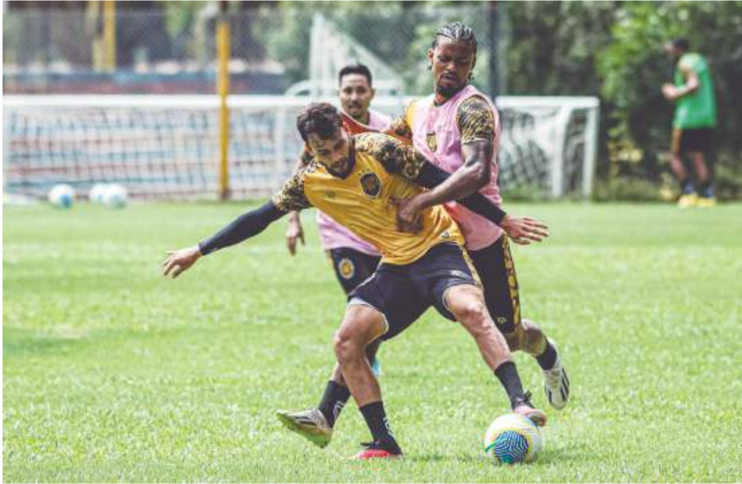
Delegação realizou a última atividade antes do confronto na tarde desta quarta (19), na Associação Esportiva e Recreativa Tubarão (Aert)

"Sabemos da importância que é um jogo da Copa do Brasil, uma partida única. Tivemos um período mais longo para o próximo jogo, estamos preparados. Nossa equipe é bem focada nos objetivos, vamos chegar lá