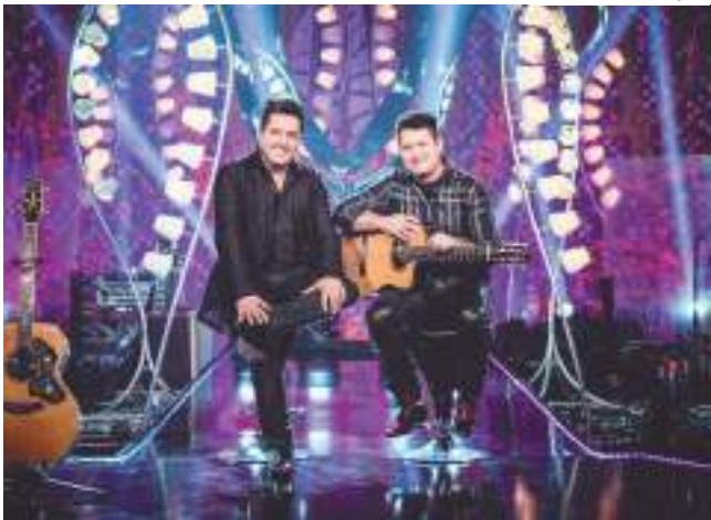
Show vai acontecer em maio, no Studio 5