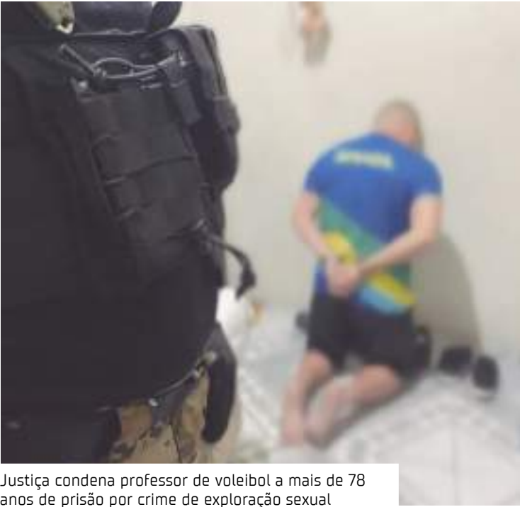
Justiça condena professor de voleibol a mais de 78 anos de prisão por crime de exploração sexual

A Denúncia formulada pelo MPE foi recebida pela Justiça em 5 de março de 2024. Após o réu apresentar sua resposta à Acusação, o Juízo a analisou e concluiu pela ausência de motivos para uma absolvição sumária. A primeira audiência de instrução foi realizada em 21 de junho de 2024, na qual foram colhidos os depoimentos das vítimas, bem como das testemunhas arroladas pelo Ministério Público e pela Defesa. A instrução processual com os depoimentos das testemunhas e o interrogatório do réu foi encerrada no dia 23 de agosto do ano passado.