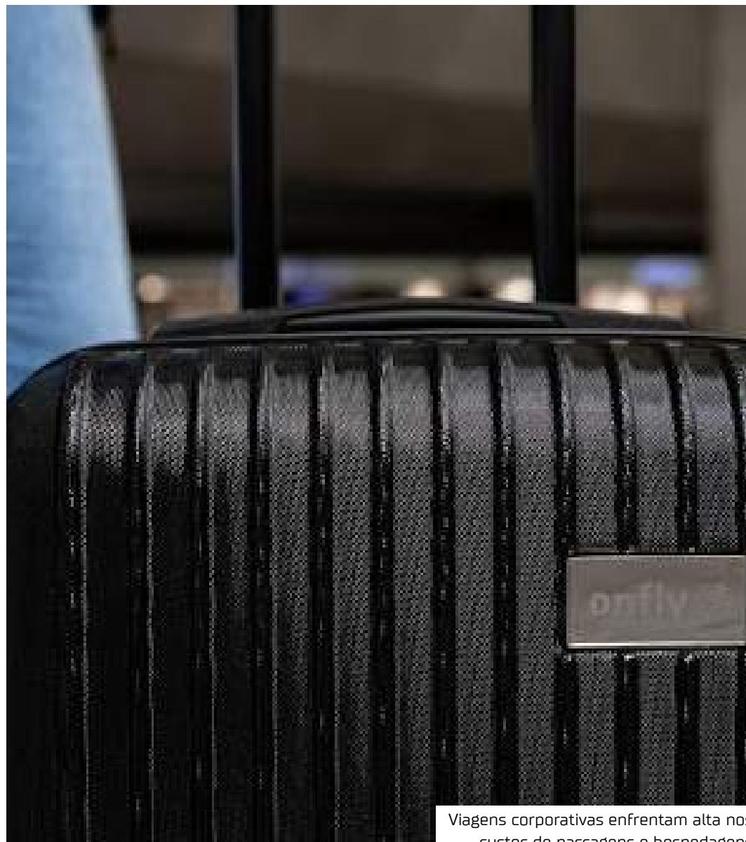
Viagens corporativas enfrentam alta nos custos de passagens e hospedagens

Outro ponto de destaque foi o aumento da taxa de passagens compradas do exterior para o Brasil durante o Carnaval. Em 2024, 4,5% dos bilhetes emitidos para os principais destinos da festa vieram do exterior, enquanto em 2025 esse percentual subiu para 6,3%, um crescimento de 40%.