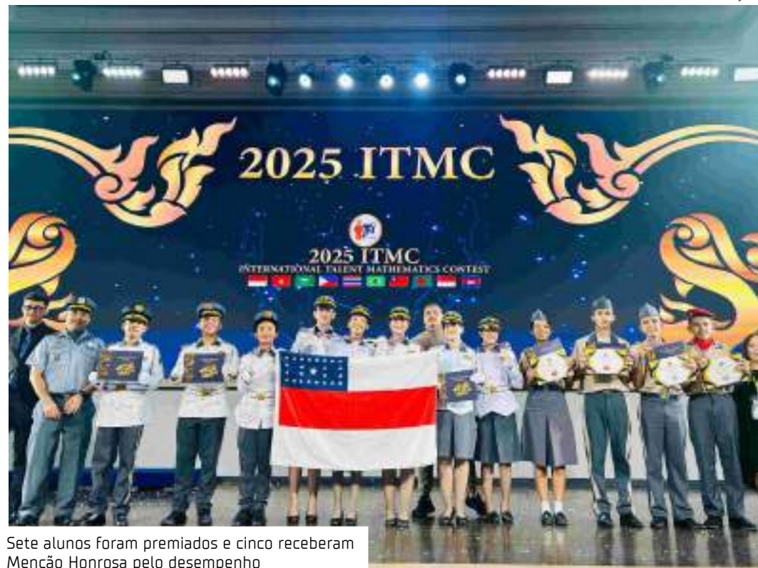
Sete alunos foram premiados e cinco receberam Menção Honrosa pelo desempenho

"Eu me sinto muito honrada de representar o nosso estado, nunca imaginei participar de uma competição internacional, isso é uma grande,