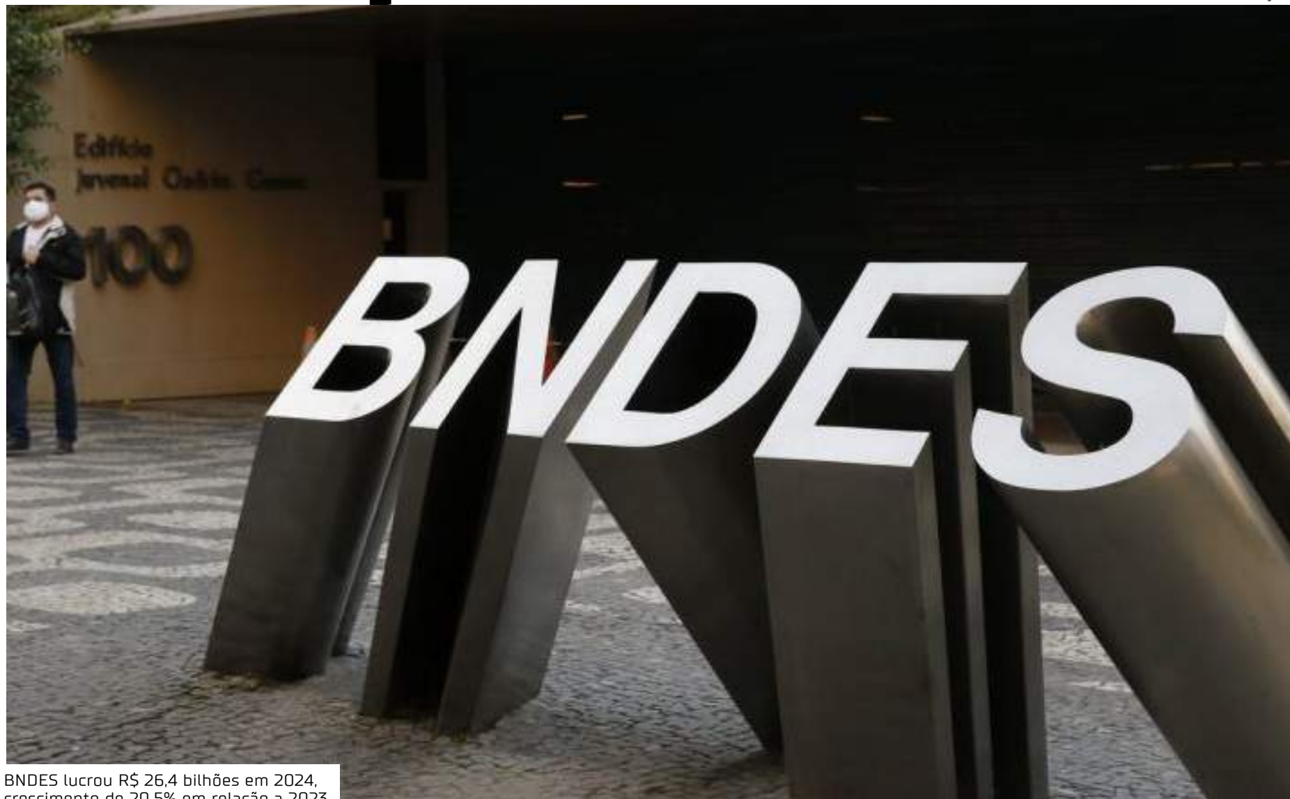
BNDES lucrou R$ 26,4 bilhões em 2024, crescimento de 20,5% em relação a 2023

“Os resultados de 2024 contribuem para fortalecer a economia do Amazonas e demonstram que, no governo do presidente Lula, o BNDES retomou a missão de promover o desenvolvimento econômico em todas as regiões do país. Em 2024, 84% dos recursos aprovados foram destinados para infraestrutura. E continua-