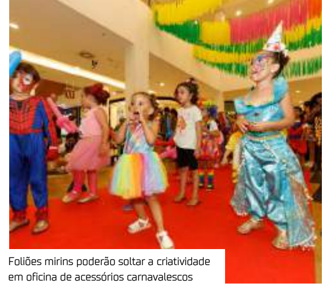
Folhês mirins poderão soltar a criatividade em oficina de acessórios carnavalescos