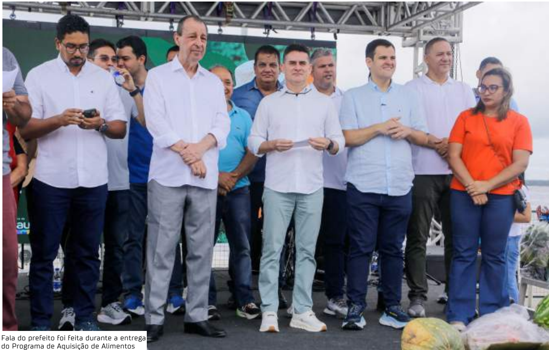
Fala do prefeito foi feita durante a entrega do Programa de Aquisição de Alimentos

“Não tem condições de trabalharmos com esse número. A nossa equipe de meio ambiente, toda a secretaria, tem pouco mais de 20 cargos comissionados. Com esse quantitativo, não temos como desenvolver um trabalho