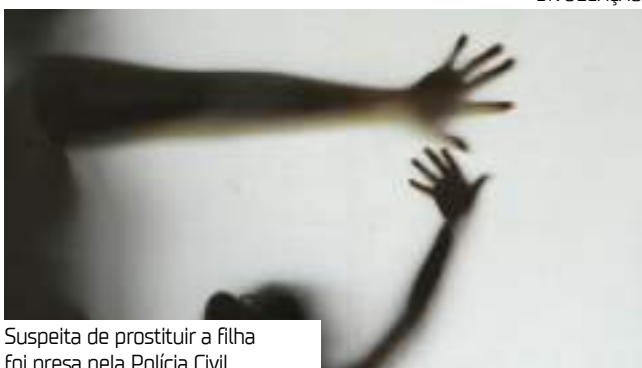
Suspeita de prostituir a filha foi presa pela Polícia Civil