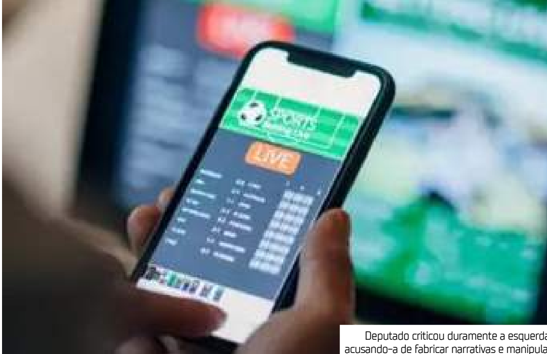
Deputado criticou duramente a esquerda, acusando-a de fabricar narrativas e manipular

“Aumentou em até sete vezes o número de pessoas que foram atendidas por dependência em apostas na rede pública desde 2020”, segundo dados do Sistema Único de Saúde (SUS). Nosso