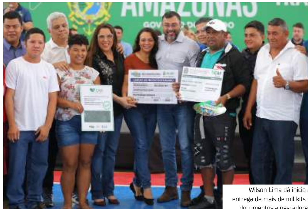
Wilson Lima dá início à entrega de mais de mil kits e documentos a pescadores

A entrega dos kits inicia nos municípios de Iranduba e Novo Airão (a 115 quilômetros de Manaus), beneficiando associações e entidades ligadas à pesca. Cada kit é composto por itens como camisas de proteção UV, chapéu, lona, colete