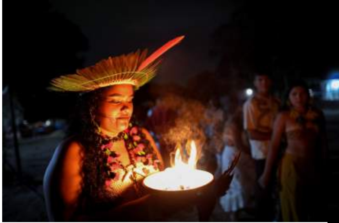
Ritual terá defumação, danças e cantos em celebração às boas vibrações para 'Ainda Estou Aqui'