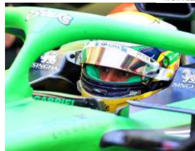
Bortoleto pilotou o novo modelo C45 da Sauber