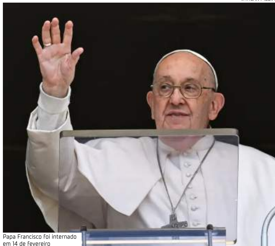
Papa Francisco foi internado em 14 de fevereiro

A saúde de Jorge Bergoglio preocupa o mundo inteiro. Católicos rezam por sua rápida recuperação de sua cidade natal de Buenos Aires até a Praça de São Pedro, onde na terça-feira fiéis e cardeais rezaram um rosário pela segunda noite consecutiva.