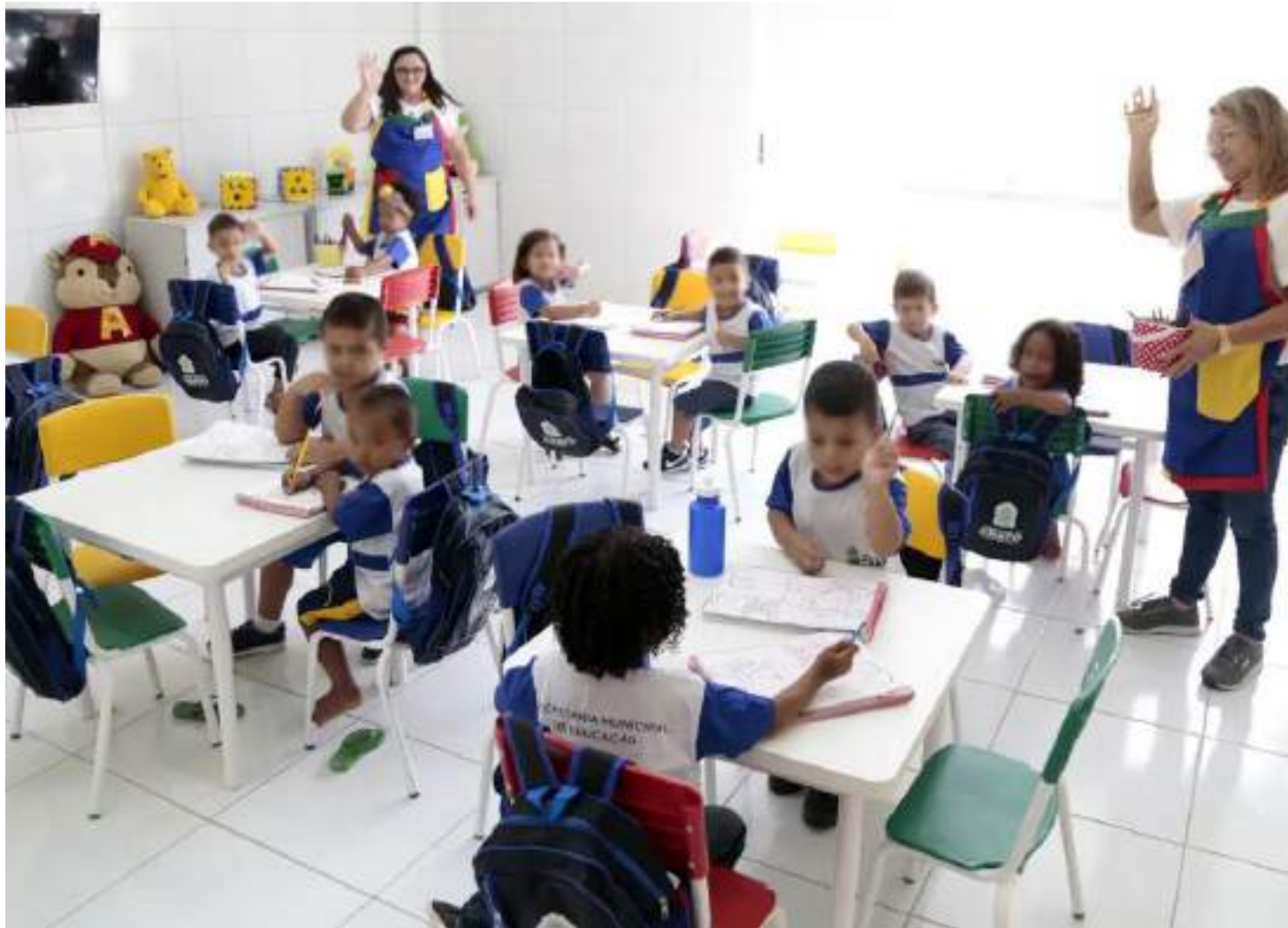
Apesar do avanço, o país ainda não atingiu as metas do Plano Nacional de Educação (PNE)

Apenas 646 municípios brasileiros atingiram a meta. Em relação às regiões, Sudeste e Sul estão acima da média nacional, com 41,5% e 41%, respectivamente. Em seguida, abaixo da média nacional, aparecem Centro-Oeste (29%) e Nordeste (28,7%). Com uma taxa de apenas 16,6%, menos da metade da média do país, o Norte aparece em último lugar.