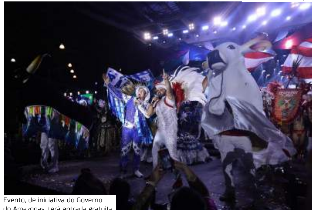
Evento, de iniciativa do Governo do Amazonas, terá entrada gratuita