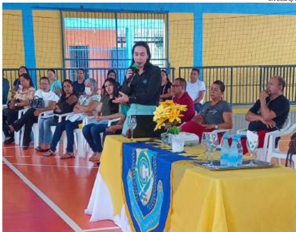
Atividade contou com a presença de pais de alunos das escolas públicas de Parintins

Além disso, foi introduzido o conceito de nomofobia – termo derivado da expressão “no mobile phone phobia”, que descreve o medo ou pavor de ficar sem o aparelho portátil –, buscando conscientizar os presentes sobre os impactos do uso