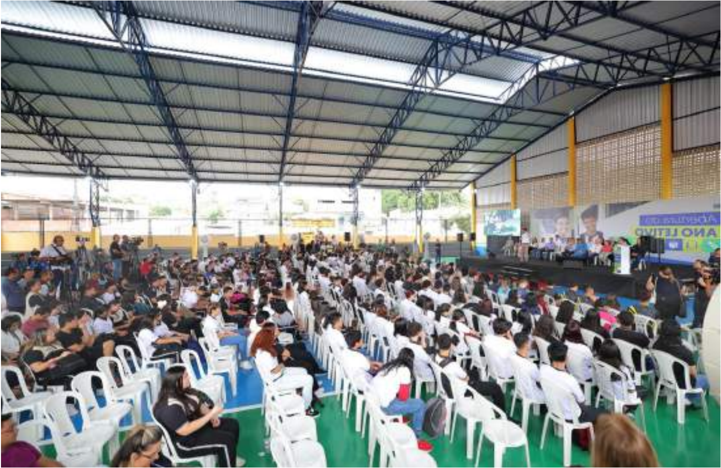
Programa foi apresentado na abertura do ano letivo de 2025 para 187 mil estudantes amazonenses

O projeto atenderá, nesta primeira edição, 480 estu-