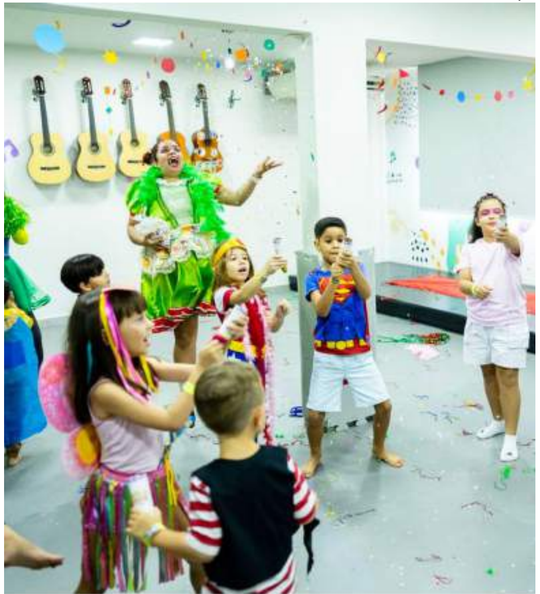
Festa com programação variada é destinada para crianças de seis meses a dez anos

Além de eventos temáticos como o “Infante Folia”, o Espaço Cultural Infante conta com programas fixos de atividade, dedicados ao desenvolvimento infantil. Fundado em julho de 2019 com a proposta de ser “o lugar onde a imaginação é quem manda”, o projeto busca ser um ponto de apoio às escolas e recebe famílias com crianças de seis meses de idade até 10 anos.