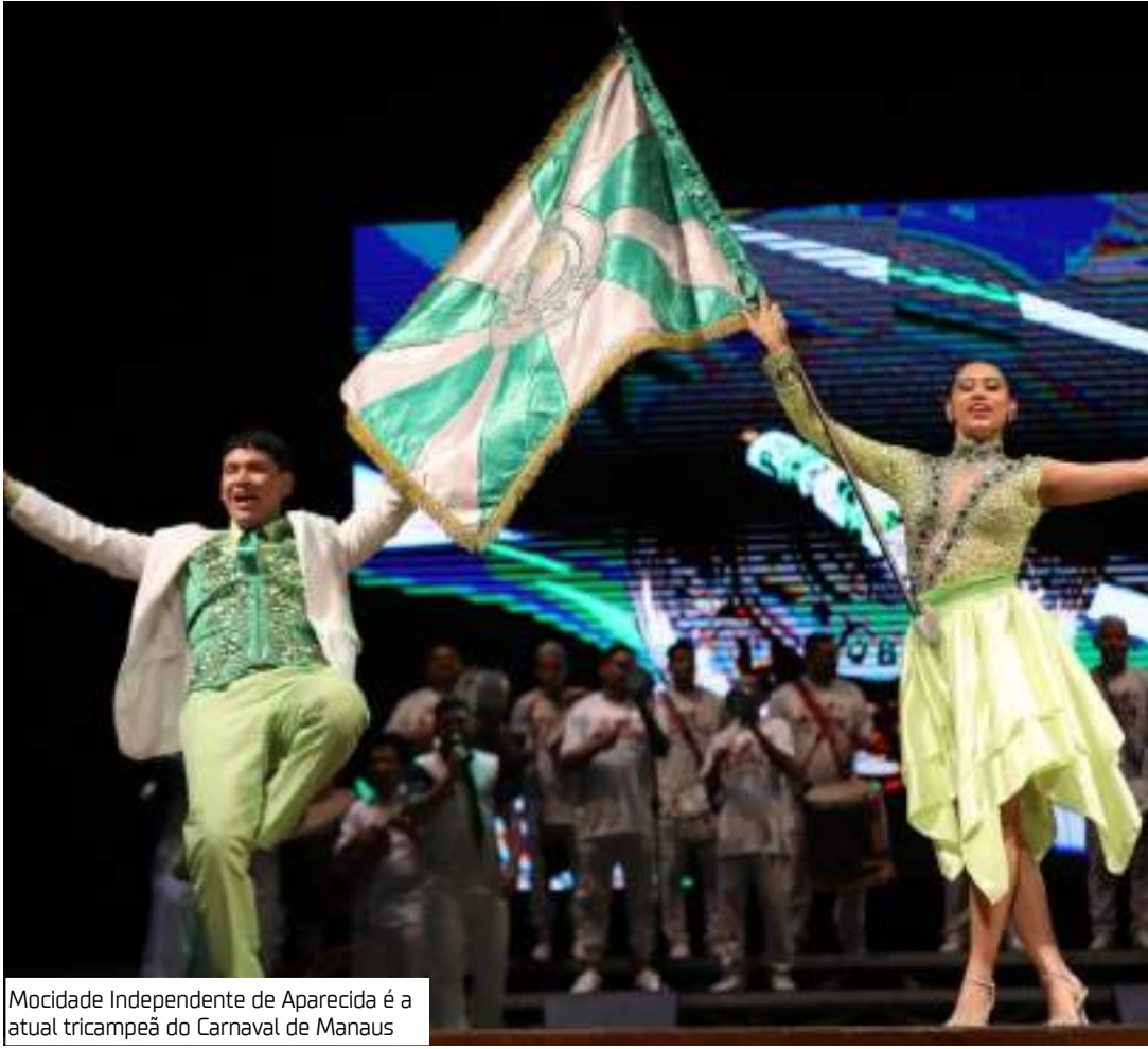
Mocidade Independente de Aparecida é a atual tricampeã do Carnaval de Manaus

A Vitória Régia, por sua vez, promove um ensaio técnico de rua reunindo todos os segmentos da escola. A concentração acontece às 17h na quadra da escola, com saída