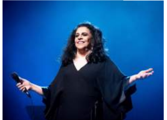
Gal Costa é considerada uma das artistas mais plurais da história