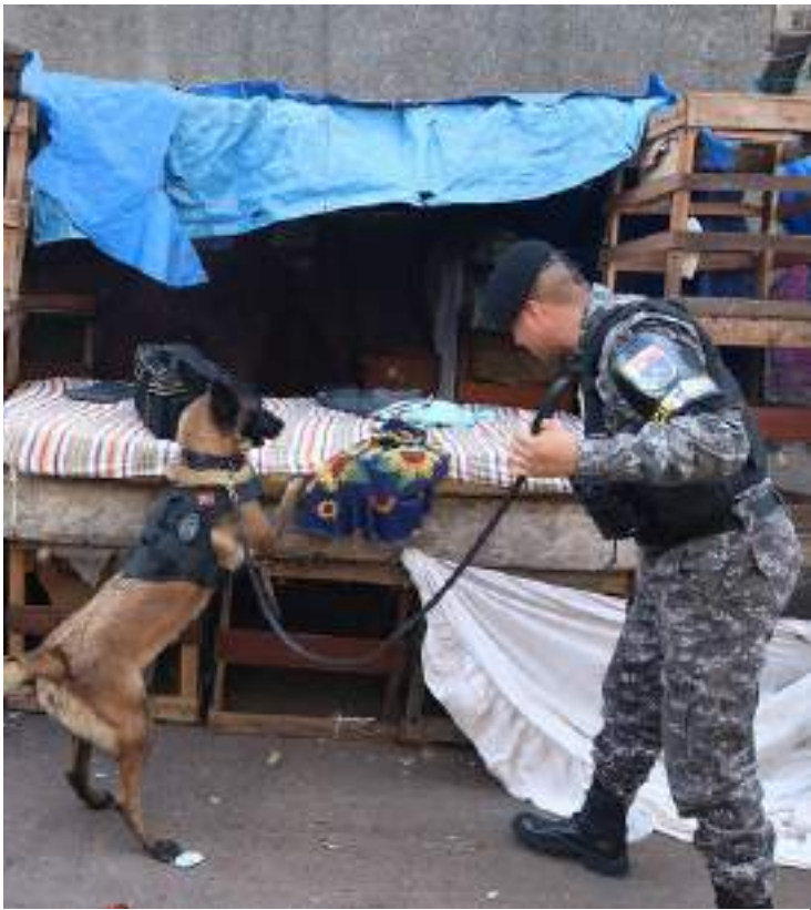
Investimento em segurança pública é uma das alternativas do governo para combater o narcotráfico