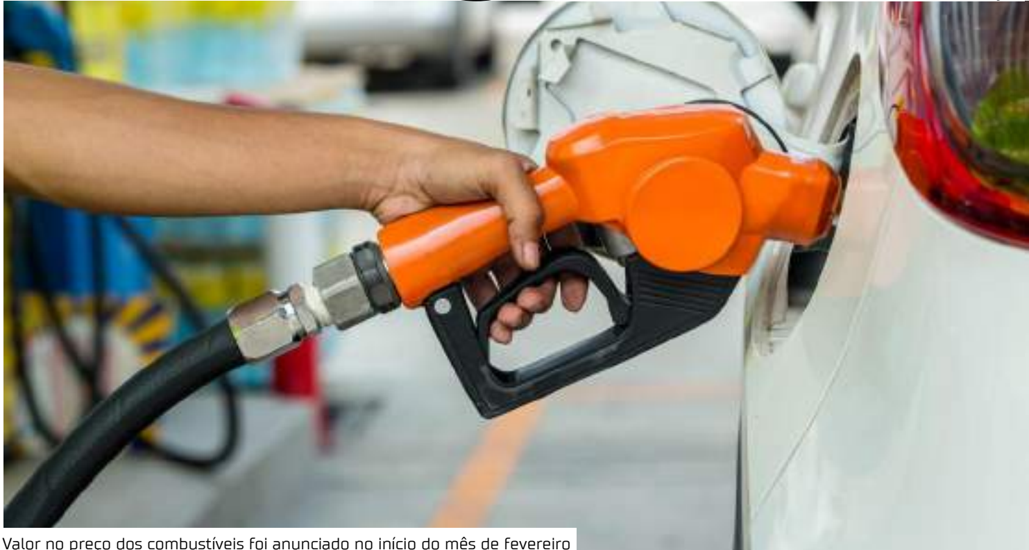
Valor no preço dos combustíveis foi anunciado no início do mês de fevereiro

impacto sobre o Índice Nacional de Preços ao Consumidor Amplo (IPCA), hoje já pressionado com o aumento no preço dos alimentos e que vai sofrer em fevereiro também com o custo do material escolar e com a