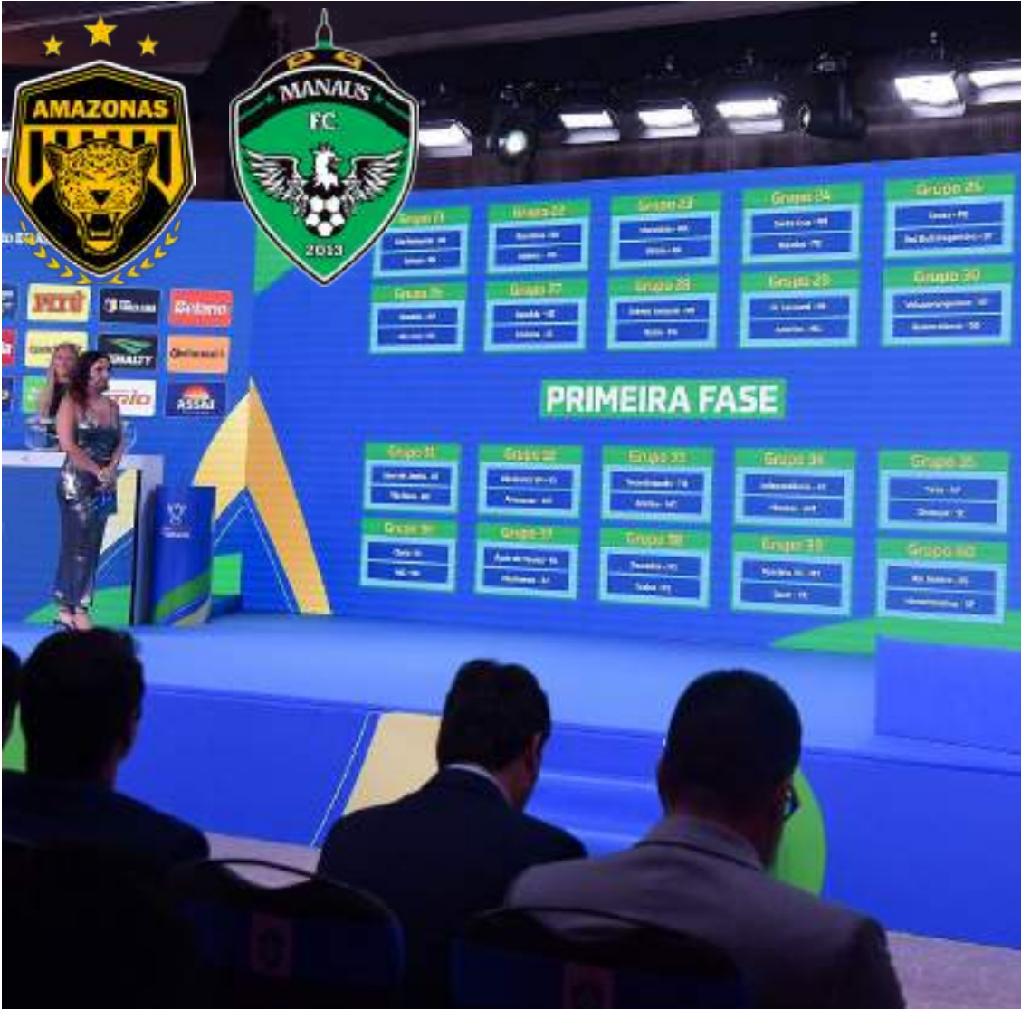
Segunda parte do duelo mostra confrontos dos representantes amazonenses no torneio: grupos 32 e 34

O Gavião Real, por sua vez, pode enfrentar um time de Série A na segunda fase. O atual líder do grupo A do Campeonato Amazonense enfrenta ou Tocantinópolis-TO ou Atlético-MG em caso de classificação. O Manaus disputou a Copa do Brasil