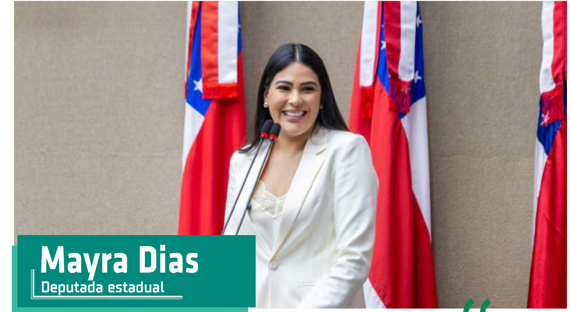
Mayra Dias Deputada estadual

A representatividade feminina no parlamento é fundamental para avançarmos na construção de um Amazonas mais justo e igualitário. É meu compromisso em 2025 é seguir ampliando o espaço das mulheres na política, fortalecendo políticas públicas que