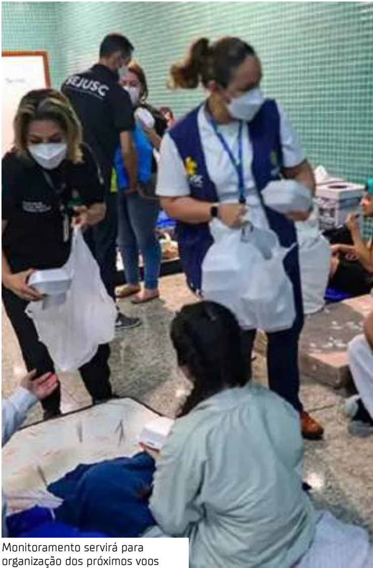
Monitoramento servirá para organização dos próximos voos