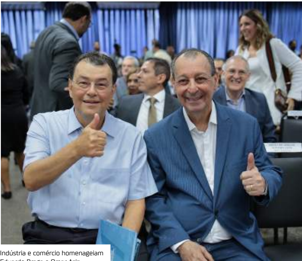
Indústria e comércio homenageiam Eduardo Braga e Omar Aziz