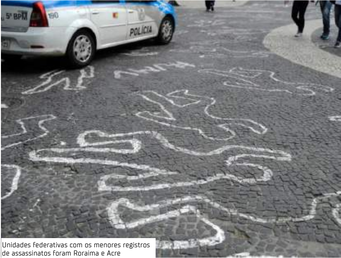
Unidades federativas com os menores registros de assassinatos foram Roraima e Acre

Os estados com o maior número de assassinatos em 2024 foram: Bahia (4.480), Rio de Janeiro (3.504), Pernambuco (3.381), Ceará (3.272), Minas Gerais (3.042), São Paulo (2.937), Pará (2.570) e Maranhão (2.053). Já as unidades federativas com os menores registros de assassinatos foram Roraima (119 casos) e Acre (168 casos).