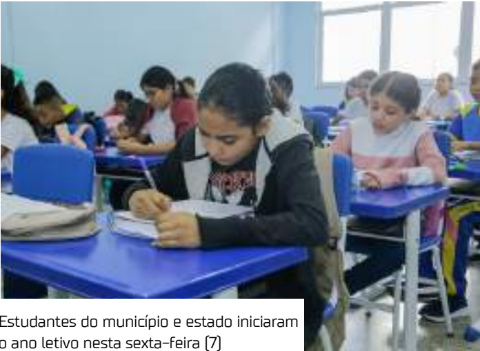
Estudantes do município e estado iniciaram o ano letivo nesta sexta-feira (7)

Já para os 187 mil estudantes das escolas estaduais, o governador Wilson Lima lançou o programa Sine Primeiro Emprego. A