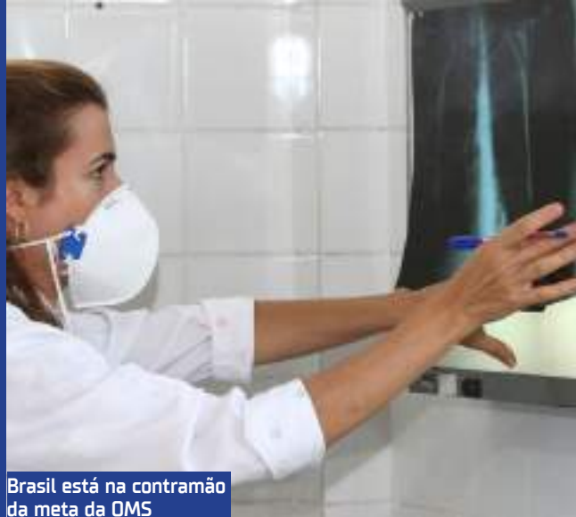
Brasil está na contramão da meta da OMS