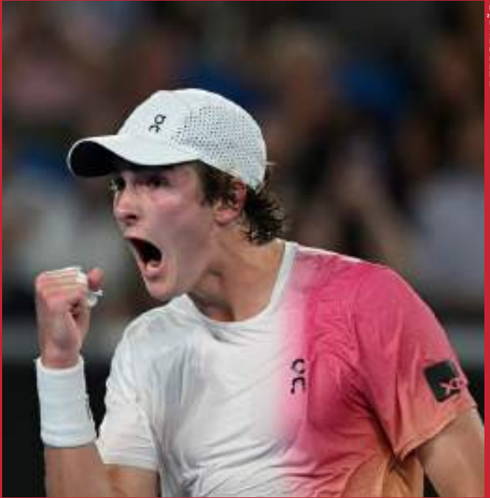
Nova promessa do tênis brasileiro pode enfrentar um argentino