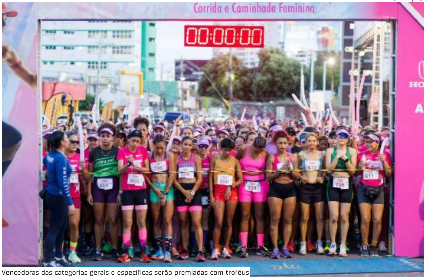
Vencedoras das categorias gerais e específicas serão premiadas com troféus

A segunda edição da prova iniciará às 6h, com a largada e chegada no Estacionamento G1 do Amazonas Shopping, localizado na avenida Darcy Vargas, bairro Chapada. O percurso será de 6 km e contará com as seguintes categorias: Individual, Pessoas com Deficiência Visual (acompanhas