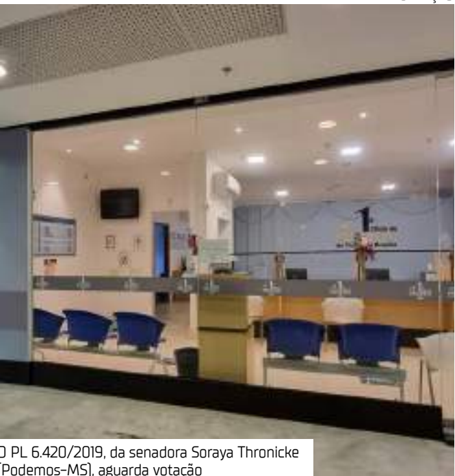
O PL 6.420/2019, da senadora Soraya Thronicke (Podemos-MS), aguarda votação

Uma das prioridades legislativas do governo federal este ano é a aprovação do projeto de lei que dá aos cartórios o poder de cobrar dívidas, o que hoje é feito pelos oficiais de justiça. O PL 6.420/2019, da senadora Soraya Thronicke (Podemos-MS), aguarda votação na Comissão de Constituição e Justiça (CCJ) e está na lista prioritária do governo Lula. O projeto de lei cria a execução extrajudicial de dívidas, que passaria a ser uma das atribuições dos tabeliães de protesto. O texto “desjudicializa” parte das execuções civis, que são as cobranças de obrigações não cumpridas pelos devedores. O objetivo é facilitar e tornar mais rápida a cobrança de dívidas, desafogando o Judiciário, ou seja, aliviar a sobrecarga de processos judiciais e tornar a execução civil mais rápida e eficaz. De acordo com o relatório Justiça em Números 2024, do Conselho Nacional de Justiça (CNJ), o Judiciário brasileiro tem aproximadamente 84 milhões de processos em andamento. “A desjudicialização dos títulos executivos extrajudiciais e judiciais condenatórios de pagamento de quantia certa representará uma economia de R$ 65 bilhões para os cofres públicos. Objetivando simplificar e desburocratizar a execução de títulos executivos civis e, por conseguinte, alavancar a economia do