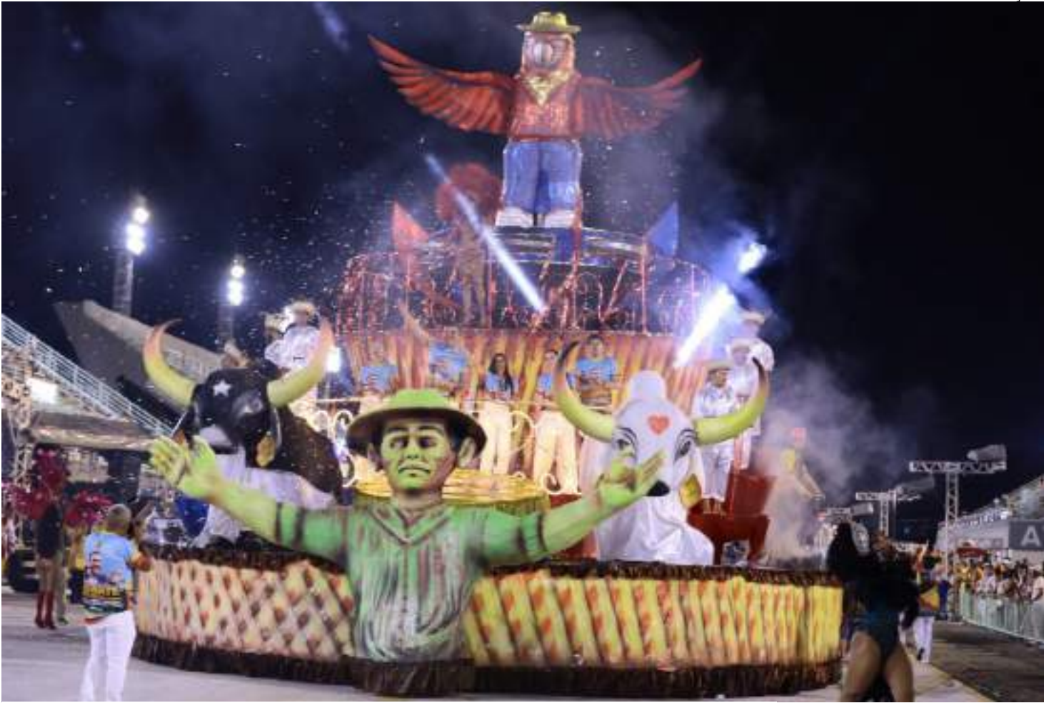
Apresentações ocorrem a partir das 21h nos dias 27 e 28 de fevereiro

O governador Wilson Lima anunciou o repasse do Estado durante encontro com presidentes e representantes das escolas de samba nesta quinta-feira (13). Na ocasião, o governador destacou a importância do evento para injeção