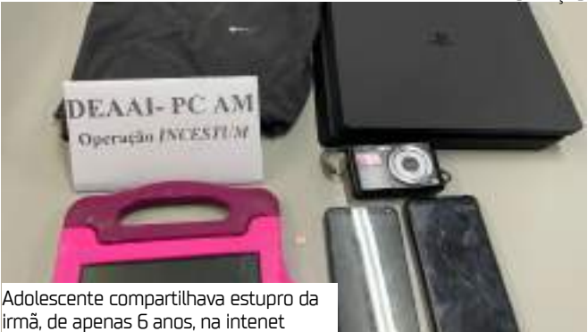
Adolescente compartilhava estupro da irmã, de apenas 6 anos, na internet

De acordo com a delegada Joyce Coelho, a investigação começou após a mãe do adolescente registrar um boletim de ocorrência no final de dezembro de 2024, quando recebeu uma foto de abuso enviada pela ex-namorada do suspeito. A adolescente revelou os abusos cometidos pelo filho, o que levou à prisão do adolescente. “O boletim de ocorrência foi registrado no dia 23 de dezembro de 2024 pela mãe, após ela receber uma foto de visualização única, que foi enviada pela até então namorada do adolescente. Após uma briga com o namorado, a adolescente acabou contando para a ex-sogra o que o irmão fazia com a criança”, relatou a delegada Joyce Coelho.