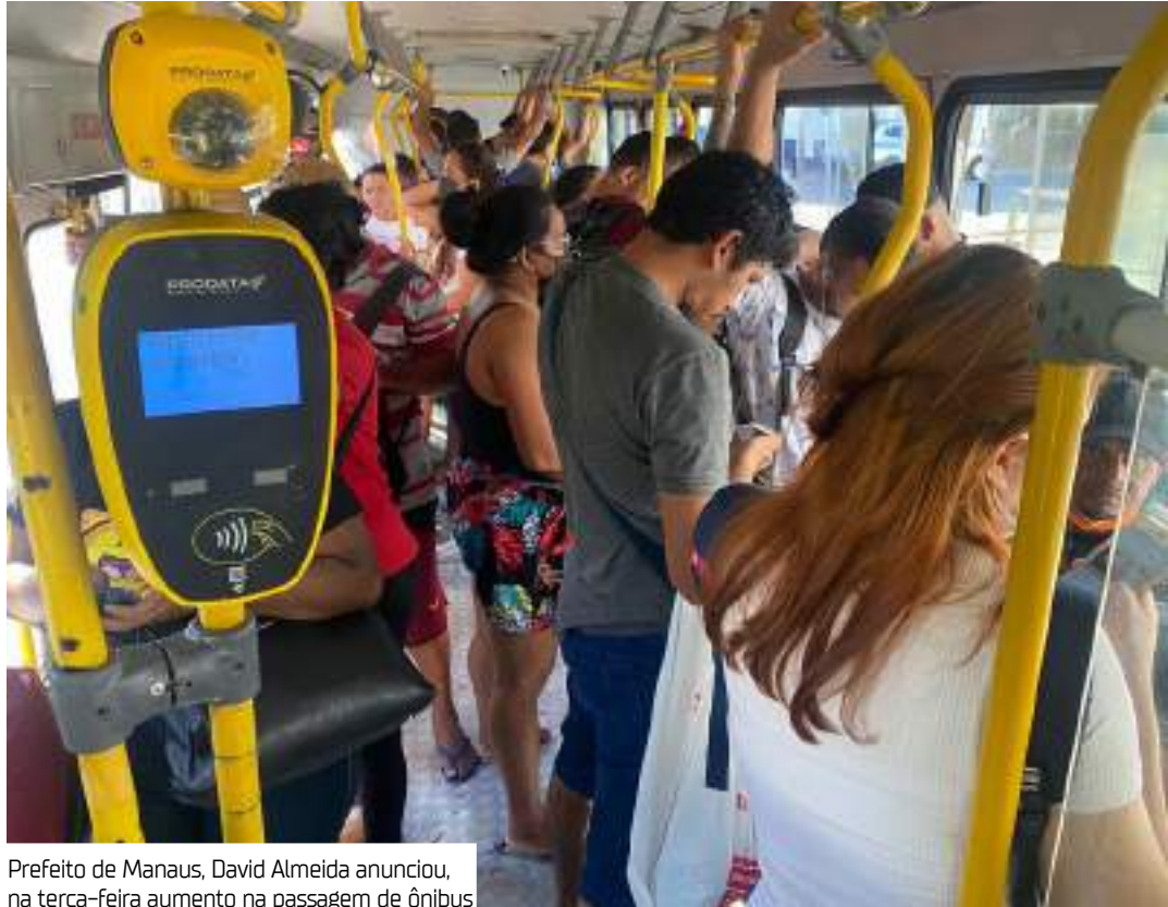
Prefeito de Manaus, David Almeida anunciou, na terça-feira aumento na passagem de ônibus

tos argumenta na ação que o reajuste foi anunciado sem a devida publicidade dos critérios técnicos, ferindo princípios da administração pública, como a transparência e a eficiência. A petição ressalta que o aumento da passagem foi determinado de forma unilateral pelo prefeito, sem consulta prévia ou divulgação de informações que justifiquem o aumento. Outro ponto questionado na ACP é a justificativa do Executivo municipal de que a renovação da frota motivaria o reajuste tarifário. O MPAM ressalta que a substituição de veículos é uma obrigação contratual das concessionárias e deveria ocorrer regularmente para garantir um transporte de qualidade. Além disso, a Prefeitura ainda não entregou 52 ônibus do total previsto para 2024, conforme acordo firmado em outra ação civil pública.