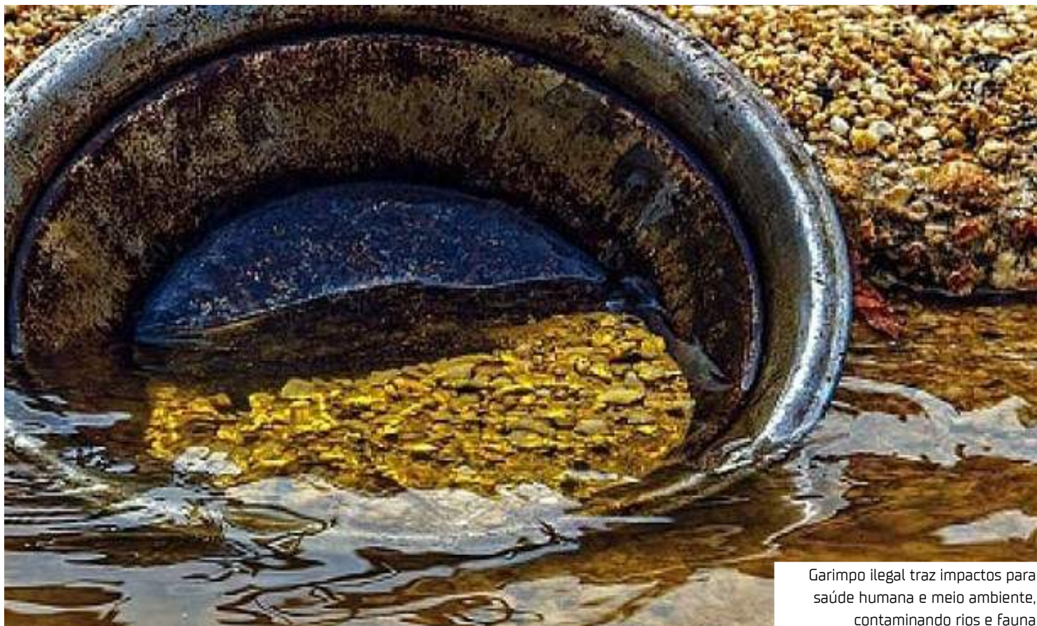
Garimpo ilegal traz impactos para saúde humana e meio ambiente, contaminando rios e fauna

O Ministério Público Federal (MPF) celebrou termo de ajustamento de conduta (TAC) com a B2Brazil, maior plataforma de comércio exterior das Américas, para impedir a venda ilegal de mercúrio metálico, substância altamente tóxica utilizada na mineração ilegal de ouro. A medida faz parte do Projeto Rede Sem Mercúrio, iniciativa do 2º Ofício da Amazônia Ocidental para impedir que big techs (grandes empresas de tecnologia) e marketplaces (plataformas de comércio) facilitem o comércio clandestino desse metal. Investigações realizadas pelo MPF mostraram que a plataforma estava sendo utilizada para importação ilegal de mercúrio, sem qualquer controle sobre o destinatário e sem as autorizações necessárias para a internacionalização do produto no Bra-