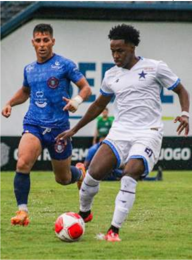
Manauara e Nacional avançaram com sete pontos na fase classificatória, mas o Robô da Amazônia levou a vantagem nos gols marcados