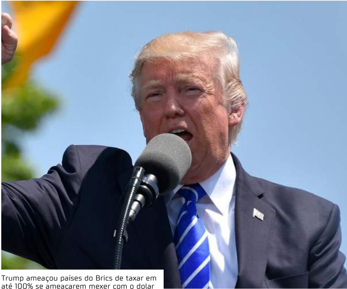
Trump ameaçou países do Brics de taxar em até 100% se ameaçarem mexer com o dólar

Desta vez não há uma tarifa específica para países específicos, mas uma orientação geral de reciprocidade aos países que impõem dificuldades ao comércio com os EUA. “Os outros países podem reduzir ou eliminar suas tarifas. Queremos um sistema nivelado”, disse Trump, em coletiva de imprensa na Casa Branca. A imposição de tarifas pelos EUA está alinhada com as promessas do presidente Trump de taxar seus parceiros comerciais. Os principais alvos são países que os EUA têm déficit na balança comercial — ou seja, gastam mais com importações do que recebem com exportações. Chamado de “Plano Justo e Recíproco”, o memorando buscará “corrigir desequilíbrios de