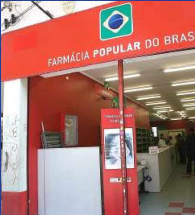
Ampliação beneficia mais de 1 milhão de pessoas por ano