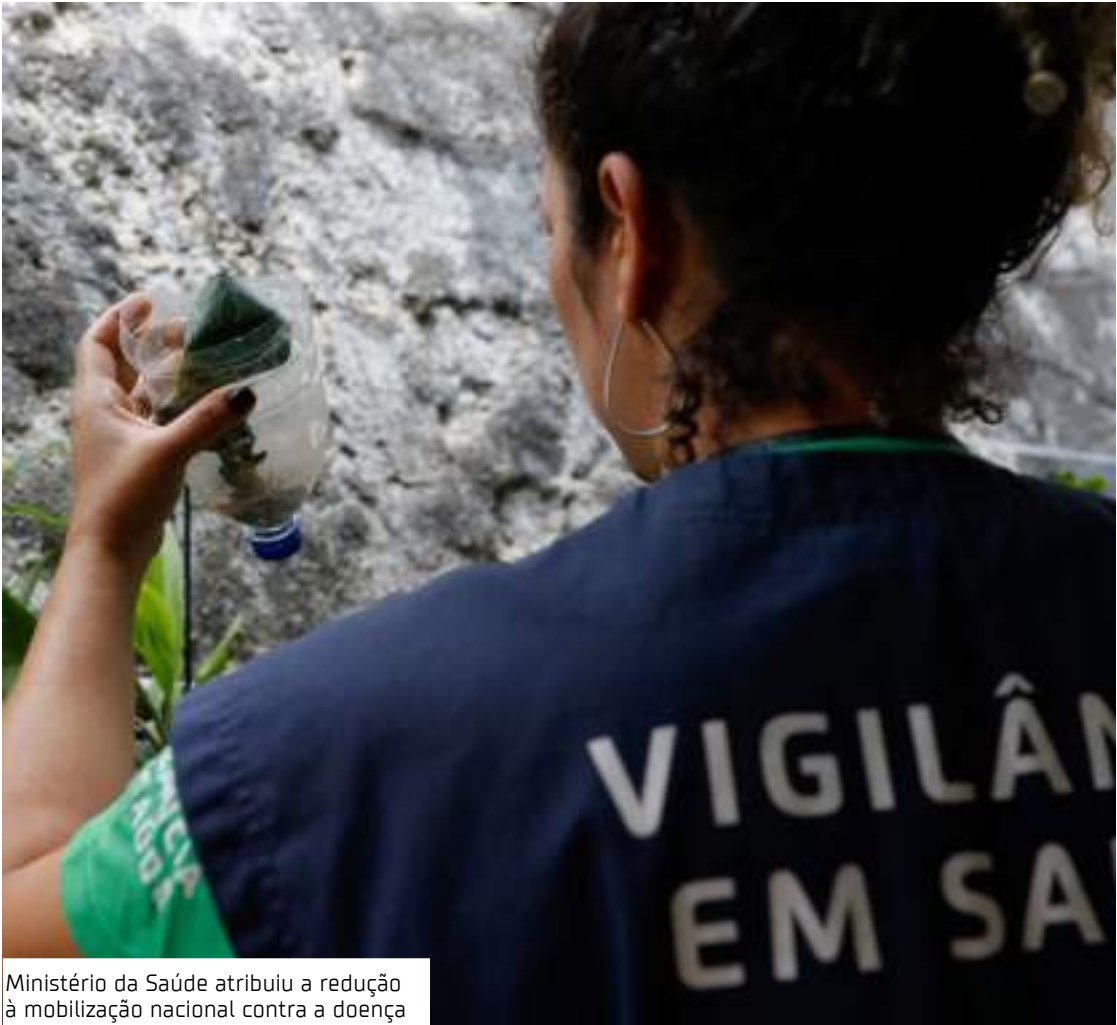
Ministério da Saúde atribuiu a redução à mobilização nacional contra a doença

São Paulo lidera o ranking nacional, com 164.463 casos prováveis em 2025, um aumento de 60% em relação a 2024. O estado também registra um aumento preocupante