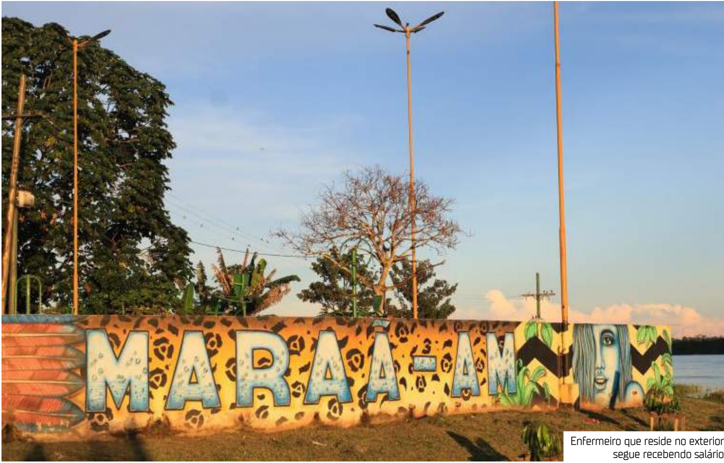
Enfermeiro que reside no exterior segue recebendo salário