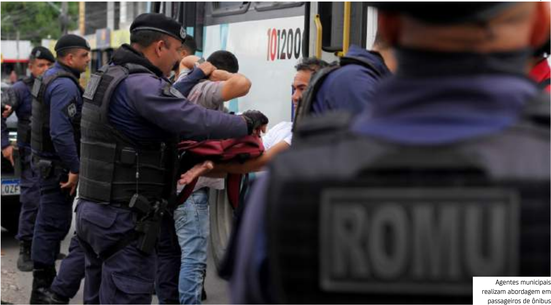
Agentes municipais realizam abordagem em passageiros de ônibus

Além do patrulhamento ostensivo, a gestão municipal mantém um moderno sistema de monitoramento em tempo real. No Centro de Controle da Cidade (CCC), agentes de trânsito e fiscais de transporte acompanham diariamente as viagens e a movimentação dos passageiros por meio de câmeras espalhadas nos principais pontos da capital.