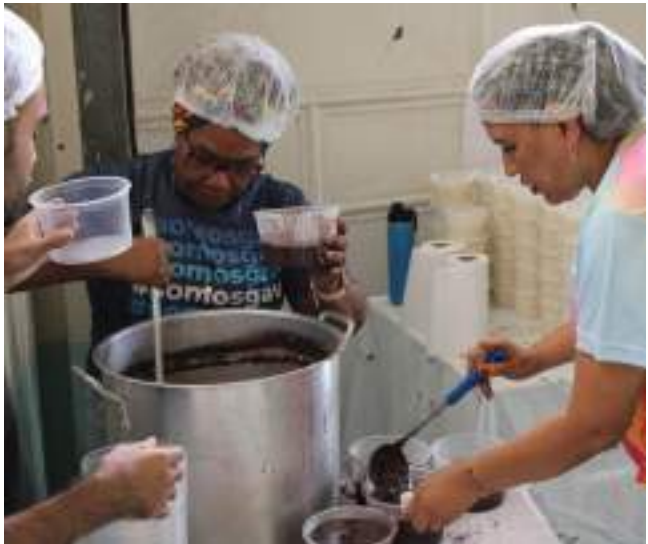
Evento arrecada fundos para projetos sociais do NACER