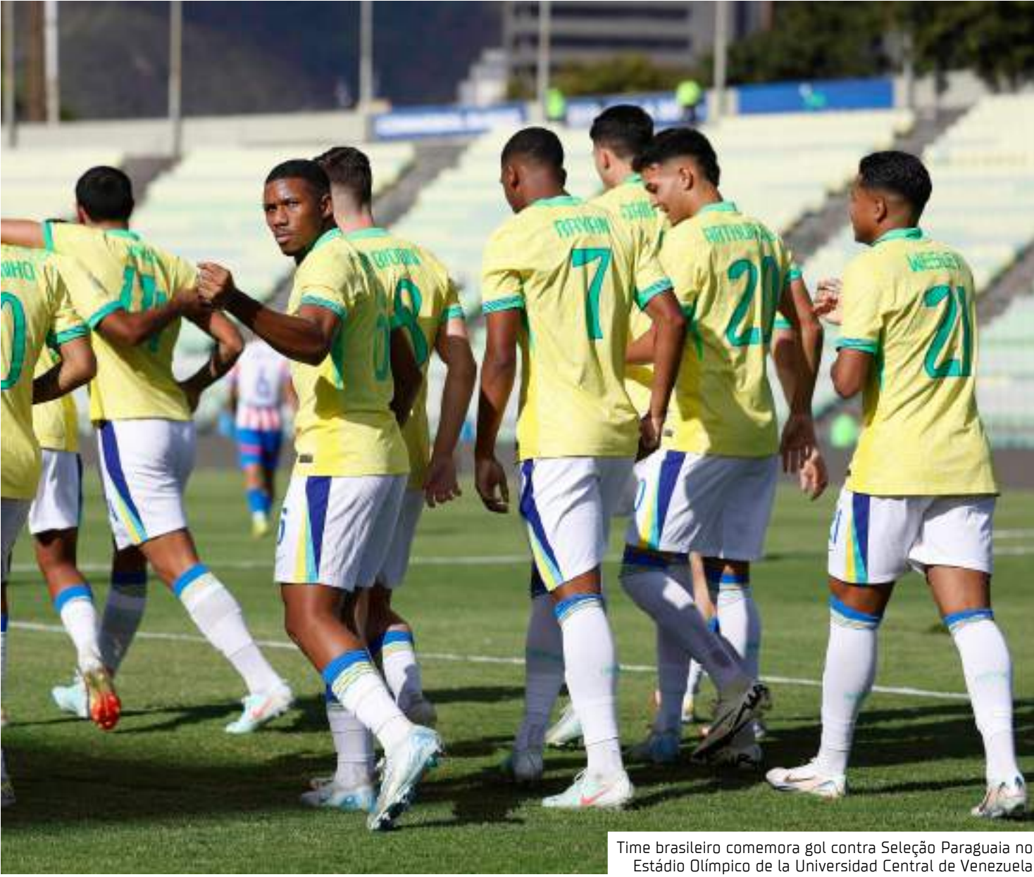
Time brasileiro comemora gol contra Seleção Paraguaia no Estádio Olímpico de la Universidad Central de Venezuela