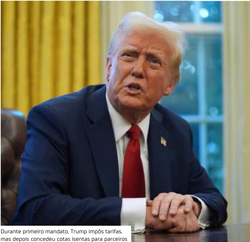
Durante primeiro mandato, Trump impôs tarifas, mas depois concedeu cotas isentas para parceiros

Os EUA, no entanto, têm uma tarifa de 25% sobre as caminhonetes, uma fonte vital de lucros para a General Motors, a Ford e as operações da Stellantis nos EUA.