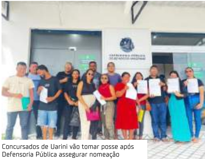
Concursados de Uarini vão tomar posse após Defensoria Pública assegurar nomeação

De acordo com o titular da Defensoria Pública Especiali-