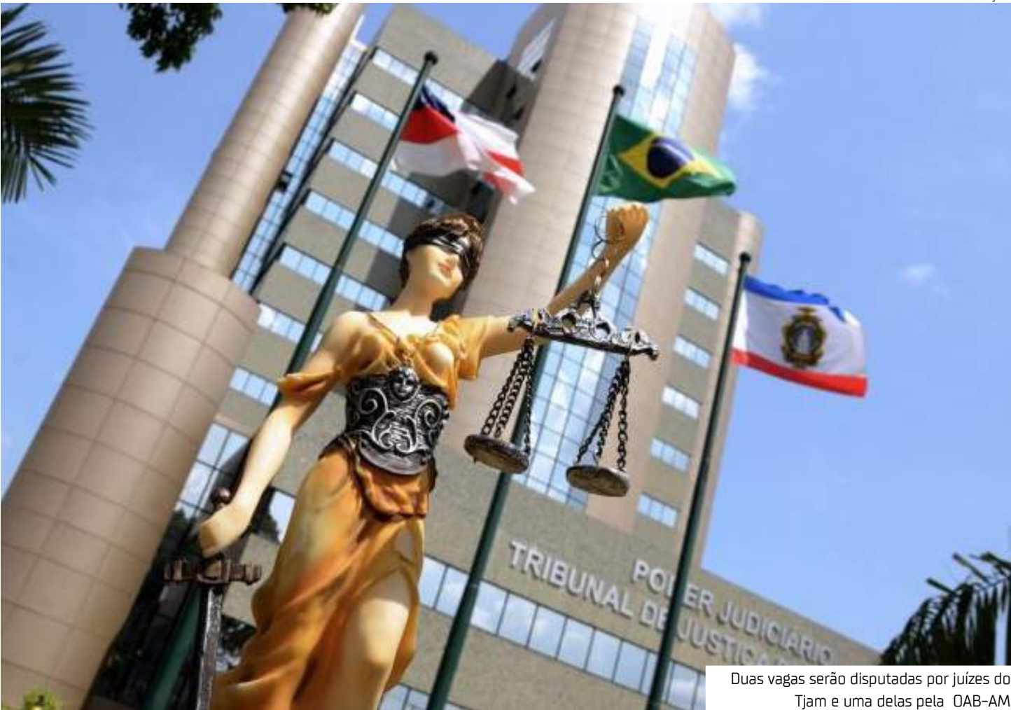
Duas vagas serão disputadas por juizes do Tjam e uma delas pela OAB-AM