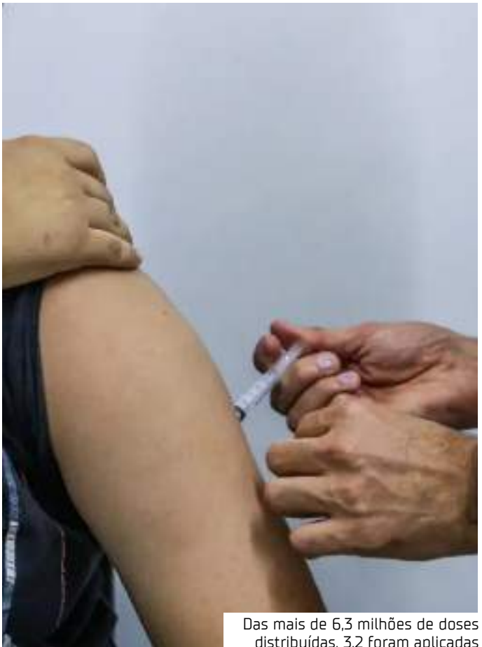
Das mais de 6,3 milhões de doses distribuídas, 3,2 foram aplicadas

A definição de um público-alvo e de regiões prioritárias, segundo o ministério, se fez necessária em razão da capacidade limitada de fornecimento de doses pelo fabricante. A primeira remessa, por exemplo, chegou ao Brasil em janeiro do ano passado e contava com apenas cerca de 757 mil doses. A pasta adquiriu todo o quantitativo disponibilizado pelo fabricante para 2024 – 5,2 milhões de doses e contratou 9 milhões de doses para 2025.