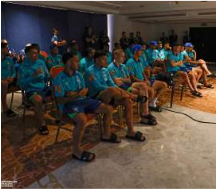
Atletas da Seleção Sub-20 assistem ao vídeo enviado por Rodrygo