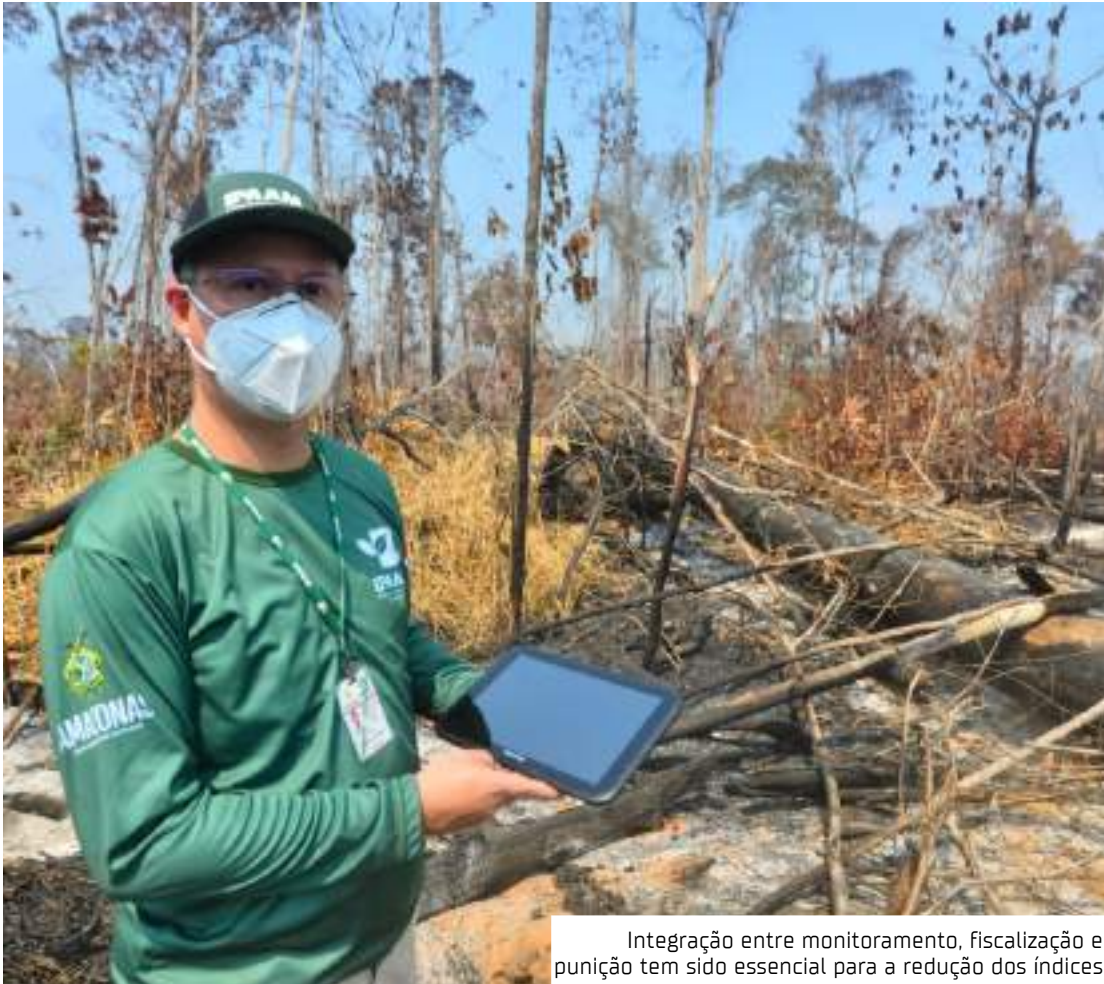
Integração entre monitoramento, fiscalização e punição tem sido essencial para a redução dos índices

“O uso de imagens de satélite nos permite detectar rapidamente qualquer alteração na cobertura