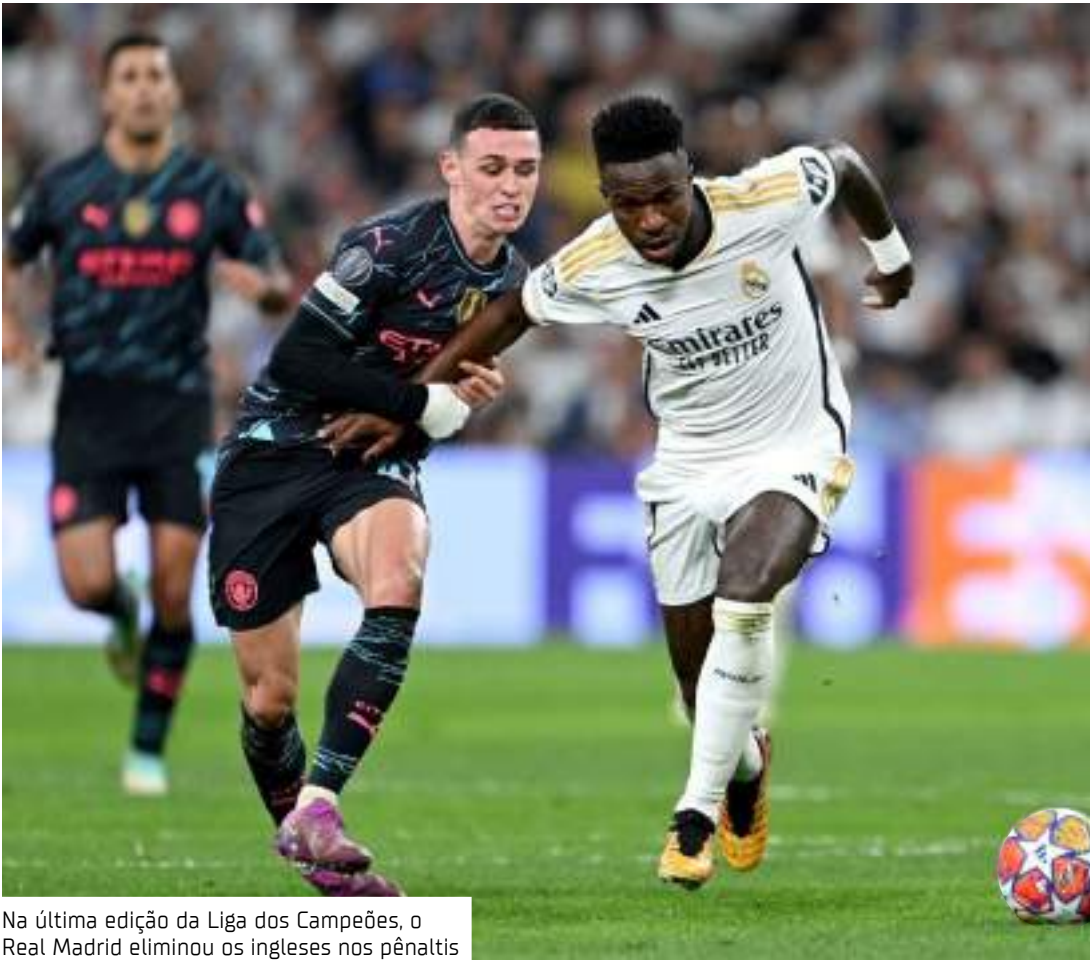
Na última edição da Liga dos Campeões, o Real Madrid eliminou os ingleses nos pênaltis

Ederson; Akanji, Stones, Rúben Dias e Gvardiol; Kovacic (Nico González), Bernardo Silva e De Bruyne; Foden, Haaland e Savinho. Já o Real Madrid convive com a ‘bruxa solta’ no deu setor defensivo. Por questões físicas, Alaba, Carvajal, Éder Militão, Lucas Vázquez e Rüdiger estão fora da partida. Com isso, Ancelotti quebra a cabeça para armar o setor e deve fazer improvisações. Valverde, por exemplo, deve ser lateral-direito, enquanto Tchouaméni atuará na zaga. O time de Carlo Ancelotti deve ir a campo com: Courtois; Valverde, Tchouaméni, Asencio e Mendy; Camavinga, Ceballos e Bellingham; Rodrygo, Mbappé e Vinícius Jr.