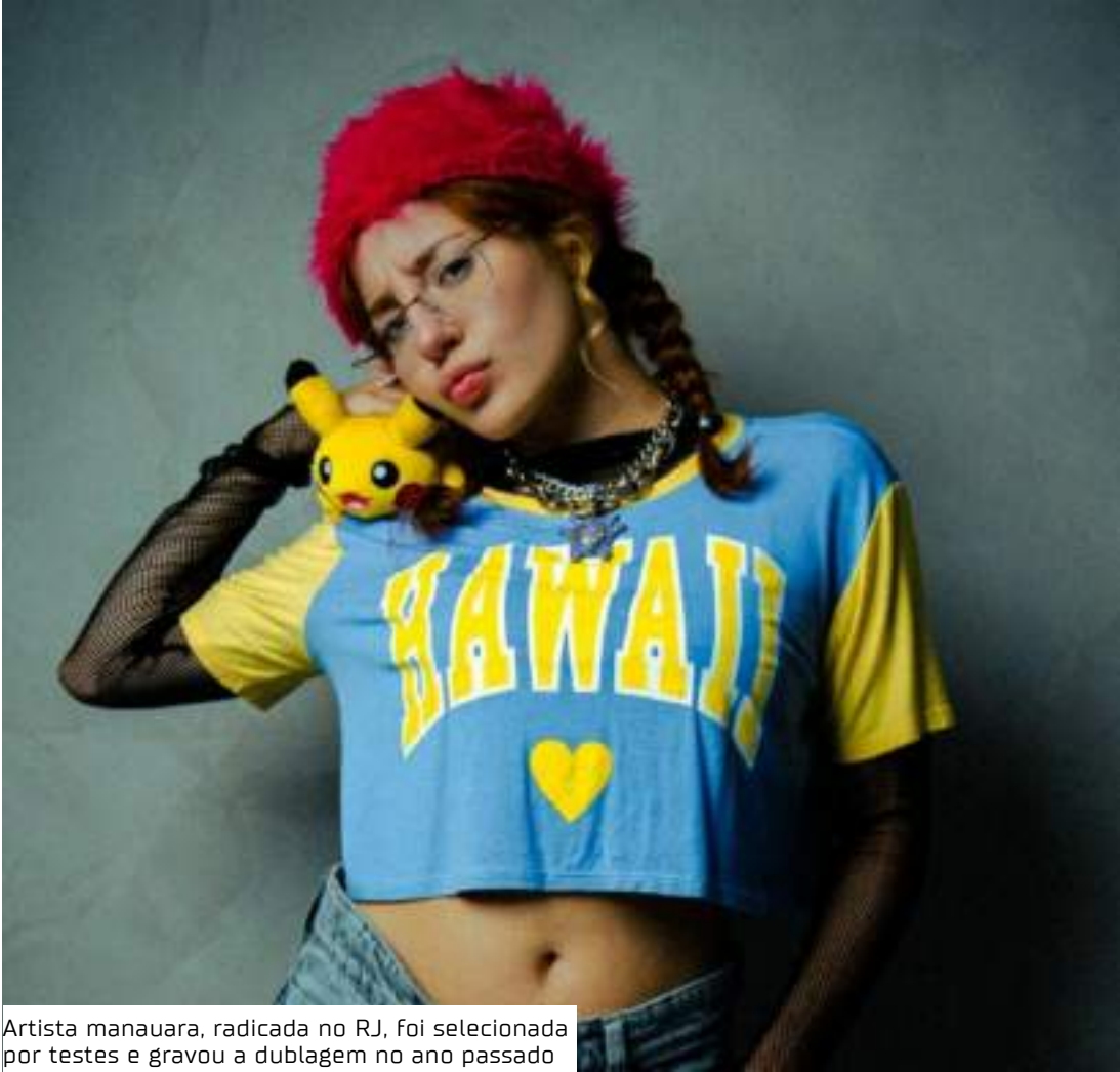
Artista manauara, radicada no RJ, foi selecionada por testes e gravou a dublagem no ano passado

Musical de Rita Lee Além da participação no