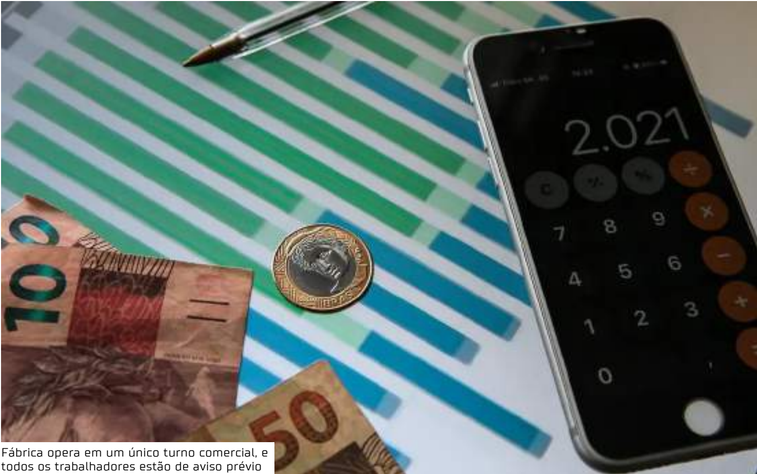
Fábrica opera em um único turno comercial, e todos os trabalhadores estão de aviso prévio

Com relação aos bens industrializados, o comitê apontou que movimento recente de aumento do dólar pressiona preços e margens,