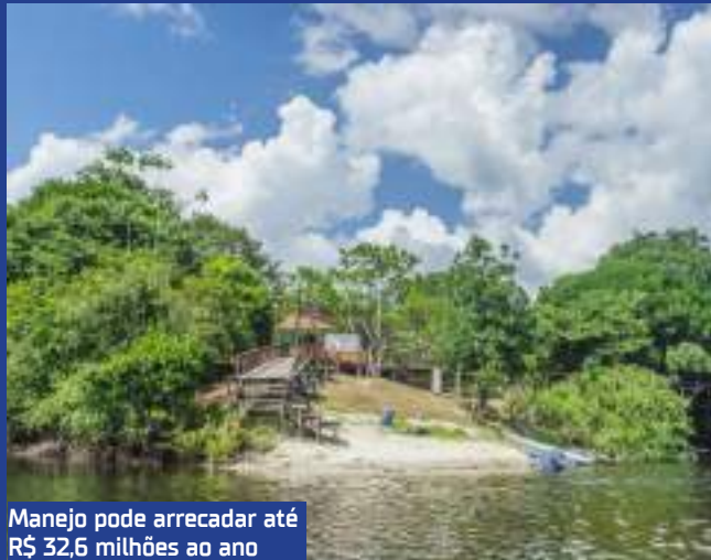
Manejo pode arrecadar até R$ 32,6 milhões ao ano