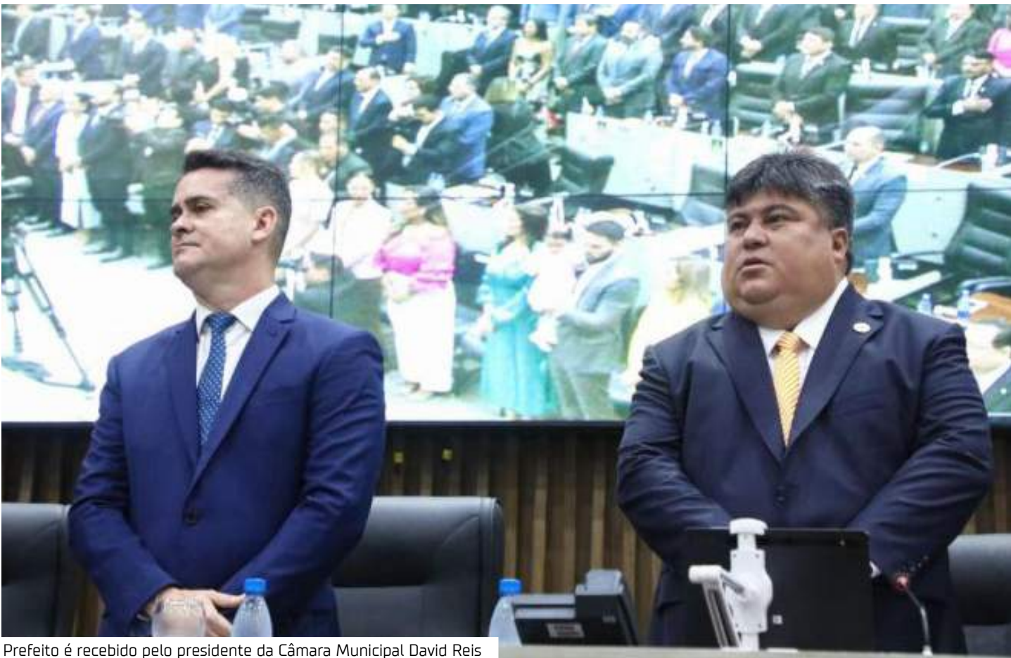
Prefeito é recebido pelo presidente da Câmara Municipal David Reis

Avanços históricos Na mensagem, o prefeito David Almeida ressaltou os avanços históricos já alcançados. Na saúde, destacou a revitalização e construção de 97 Unidades de Saúde da Família (USFs), incluindo unidades rurais e fluviais. Além disso, o município contratou 264 novos médicos através do programa “Mais Médicos”. Conforme a mensagem, na educação, Manaus subiu de 13º para 6º lugar no ranking das capitais do país no ensino fundamental, e a oferta de vagas em creches dobrou, atendendo mais crianças. Em infraestrutura e mobilidade, o programa “Asfalto Manaus” revitalizou mais de 3.500 vias urbanas, e o sistema de transporte coletivo foi modernizado com ônibus equipados com câmeras de monitoramento e a construção de novas ciclovias. No setor social, o prefeito destacou a ampliação do Cadastro Único (CadÚnico), que beneficiou mais de 487 mil famílias, e o programa “Prato do Povo”, que aumentou a oferta de refeições para a população.