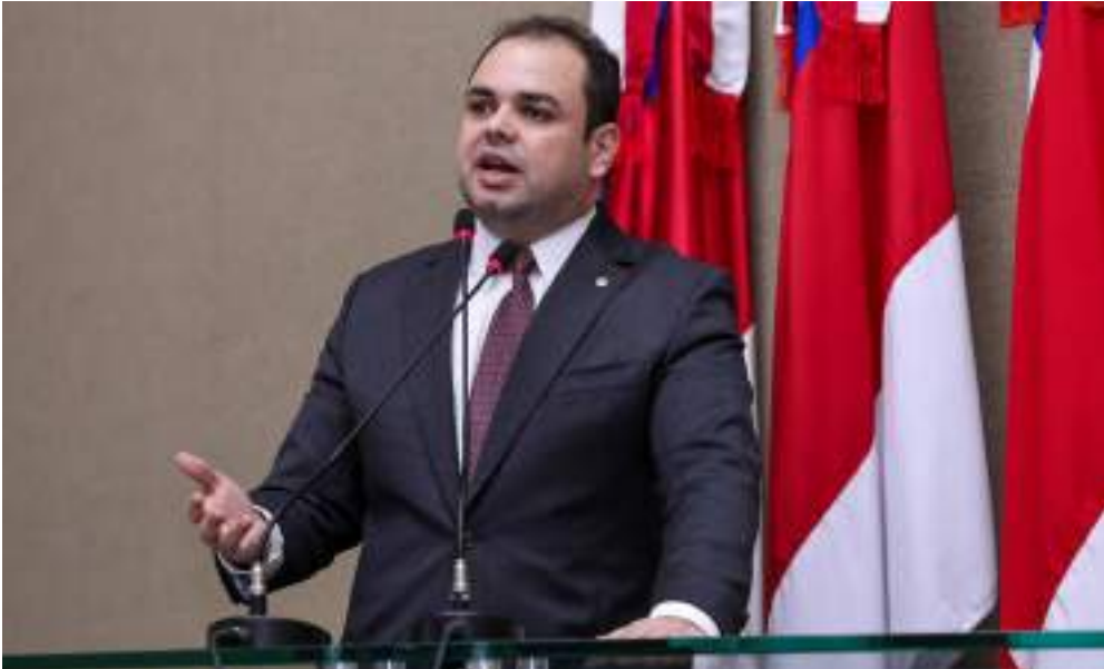
Cemaden emitiu nesta segunda-feira (10), aviso para risco de eventos geo-hidrológicos na capital do Amazonas.

Com a previsão de 60 a 100 milímetros por dia de chuva para os próximos dias em Manaus, o deputado estadual Roberto Cidade (UB), presidente da Assembleia Legislativa do Amazonas (Aleam), volta a cobrar que a Prefeitura de Manaus instale um Comitê Municipal Permanente de Crise. O objetivo é monitorar e atuar, de forma antecipada, diante das situações emergenciais que se apresentam em razão do período de chuvas, das cheias e das vazantes históricas dos rios e igarapés. “Manaus precisa de um trabalho melhor coordenado e com equipes que trabalhem, conjuntamente, a longo prazo e de forma permanente para que a população possa ser atendida de imediato, caso algum problema mais sério se apresente”, destacou o deputado presidente. Apresentada mediante o Requerimento nº