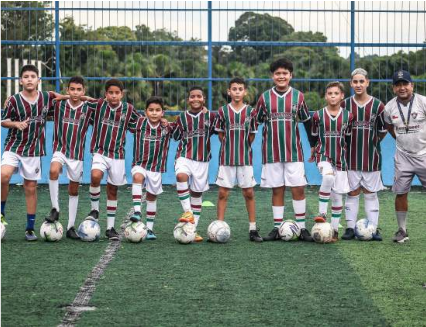
Escola de Futebol Guerreirinhos Manaus atende alunos de 5 a 16 anos de idade em duas unidades

Escola de Futebol Guerreirinhos Manaus investe em inclusão