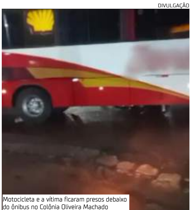
Motocicleta e a vítima ficaram presos debaixo do ônibus na Colônia Oliveira Machado

O Departamento Técnico Científico (DPTC) e o Instituto Médico Legal (IML) foram acionados para realizar a perícia e a remoção do corpo.