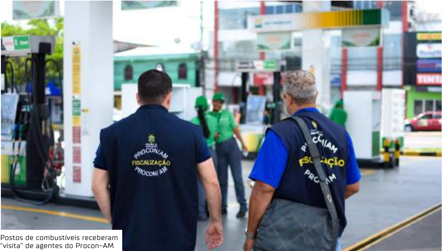
Postos de combustíveis receberam “visita” de agentes do Procon-AM

Conforme o diretor-presidente do Procon-AM, Jalil Fraxe, a função do órgão é verificar se há práticas de preço abusivo, mas não determina um valor como teto, para a revenda de combustíveis.