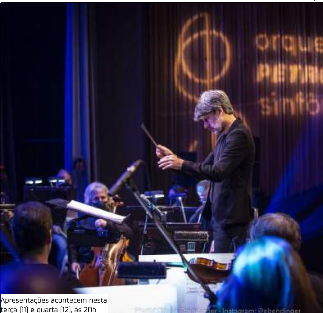
Apresentações acontecem nesta terça (11) e quarta (12), às 20h