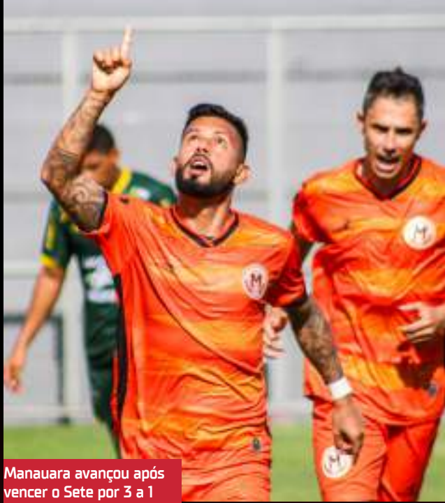
Manauara avançou após vencer o Sete por 3 a 1