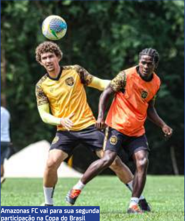
Amazonas FC vai para sua segunda participação na Copa do Brasil