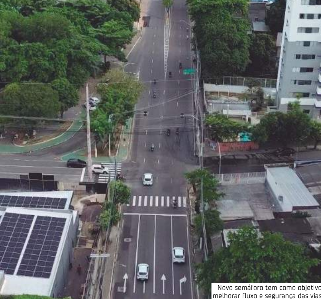
Novo semáforo tem como objetivo melhorar fluxo e segurança das vias

Motoristas que trafegam pelo local devem redobrar a atenção e respeitar a nova configuração semaforica para evitar infrações e garantir um trânsito mais seguro para todos.