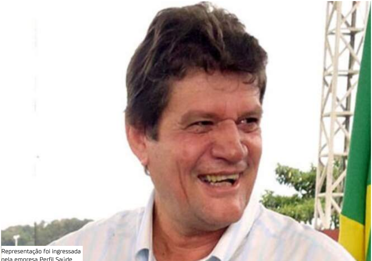
Representação foi ingressada pela empresa Perfil Saúde

“Em atenção ao poder geral de cautela conferido aos Tribunais de Contas, verifica-se que esta Corte é competente para prover cautelares a fim de neutralizar situações de lesividade ao interesse público, assim, conferindo real efetividade às suas deliberações finais”, disse a conselheira.