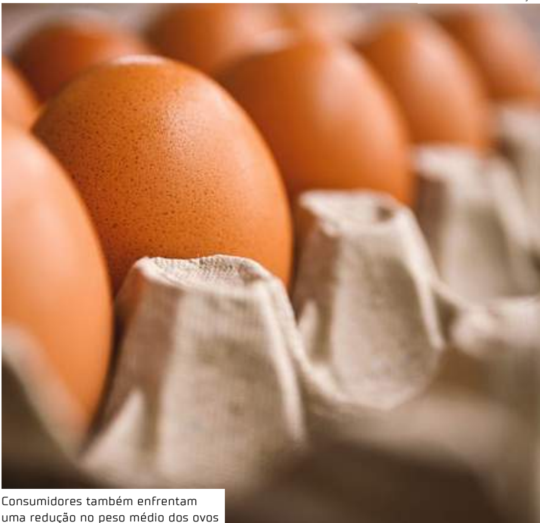
Consumidores também enfrentam uma redução no peso médio dos ovos

Esse valor reflete um aumento de 0,14% em relação ao último preço registrado, indicando uma valorização do produto.