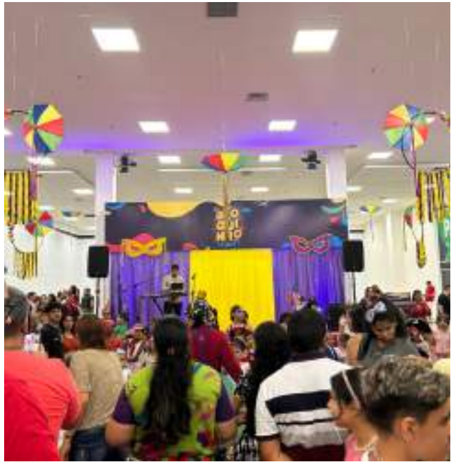
Evento gratuito acontece nos dias 22 e 23