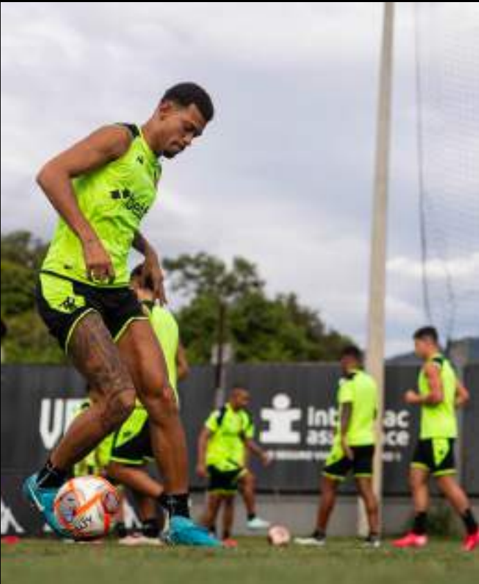
Cruzmaltino vem de derrota para o Flamengo