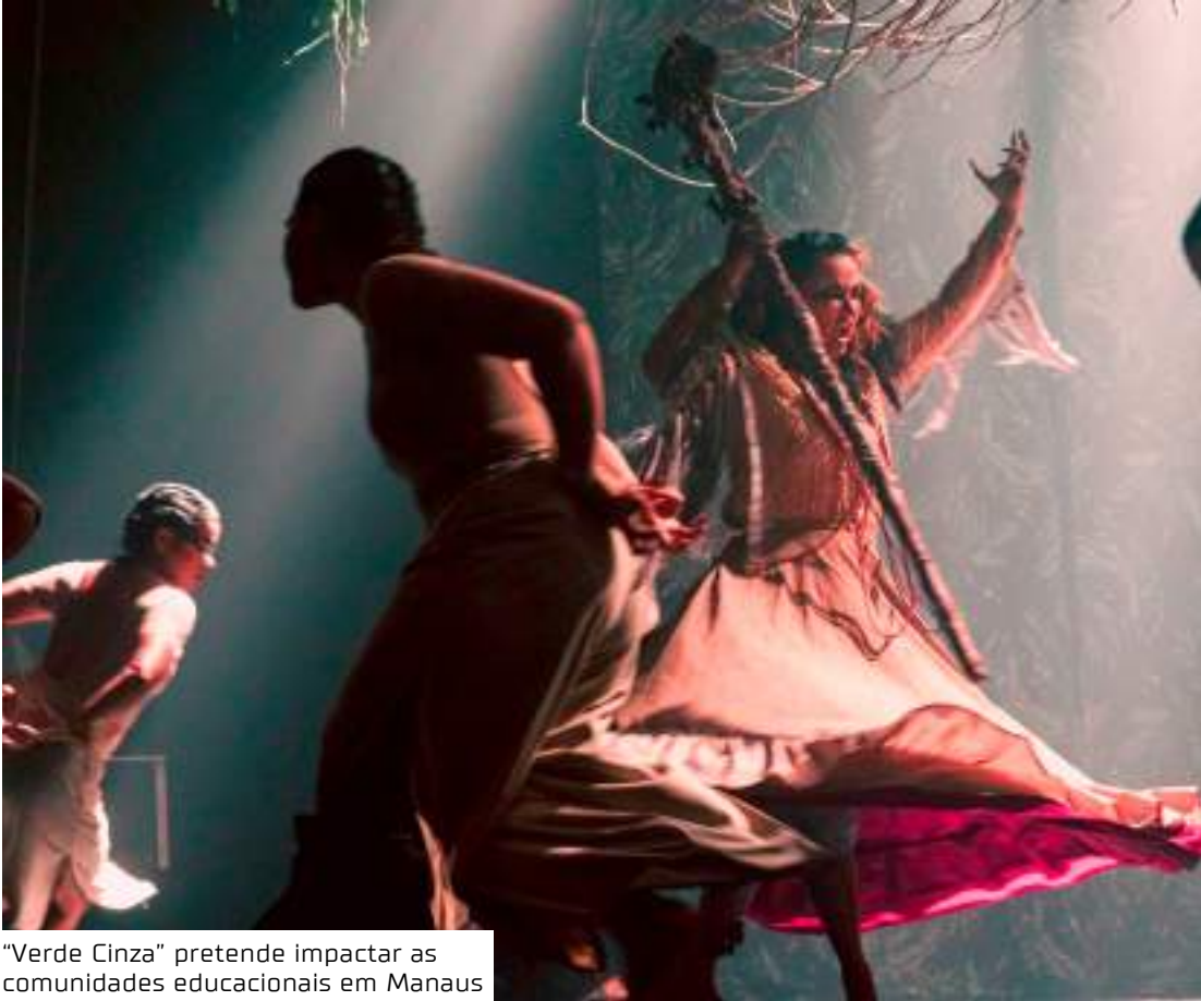
“Verde Cinza” pretende impactar as comunidades educacionais em Manaus

“Verde Cinza” pretende impactar significativamente as comunidades educacionais em Manaus. O objetivo é mostrar as dificuldades enfrentadas pelas famílias na região amazônica com as queimadas e as condições de seca agravadas pelas mudanças climáticas.