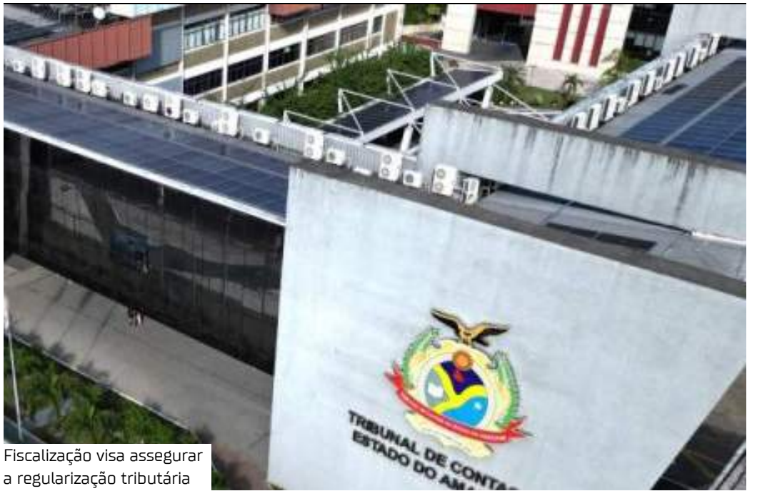
Fiscalização visa assegurar a regularização tributária

A fiscalização busca garantir que todos os entes municipais cumpram a legislação tributária vigente, especialmente no que se