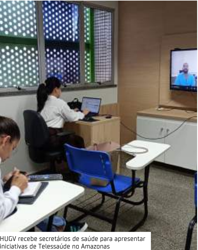
HUGV recebe secretários de saúde para apresentar iniciativas de Telessaúde no Amazonas

Vinculada ao Ministério da Educação (MEC), a Ebserh foi criada em 2011 e, atualmente, administra 45 hospitais universitários federais, apoiando e impulsionando suas atividades por meio de uma gestão de excelência. Como hospitais vinculados a universidades