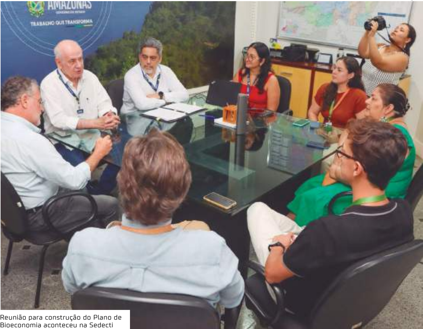
Reunião para construção do Plano de Bioeconomia aconteceu na Sedecti

Para o titular da Sedecti, Serafim Corrêa, a bioeconomia tem se consolidado como um pilar estratégico para o desenvolvimento sustentável da Amazônia, unindo ino-