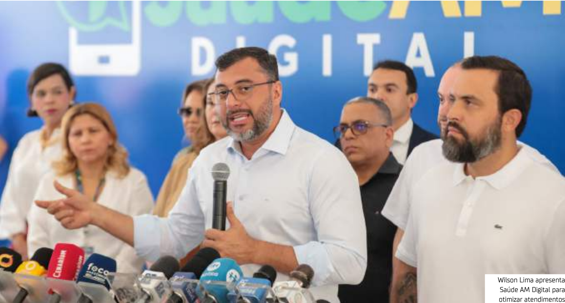
Wilson Lima apresenta Saúde AM Digital para otimizar atendimentos

De acordo com a Secretaria de Estado de Saúde (SES-AM), atualmente a quantidade de consultas por mês chega a 600 mil procedimentos agendados, no entanto, o índice de absenteísmo (não comparecimento) alcança 60% para os procedimentos agendados via Sistema de Regulação (Sisreg). A iniciativa, que começou a funcionar nesta segunda-