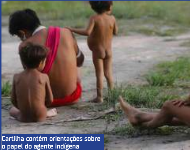
Cartilha contém orientações sobre o papel do agente indígena