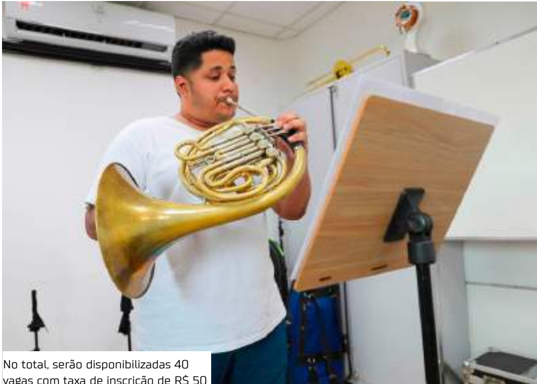
No total, serão disponibilizadas 40 vagas com taxa de inscrição de R$ 50

As aulas serão realizadas na Escola Superior de Artes e Turismo (Esat/UEA), localizada na avenida Leonardo Malcher, 1.728, Praça 14 de Janeiro. Para a conclusão do curso, o aluno realizará uma apresentação musical, individual ou em grupo, obrigatório para cada aluno (a), de forma presencial, de acordo com o programa do curso. Para ser considerado aprovado ao final do curso, o aluno deve apresentar frequência mínima de 75% nas aulas.