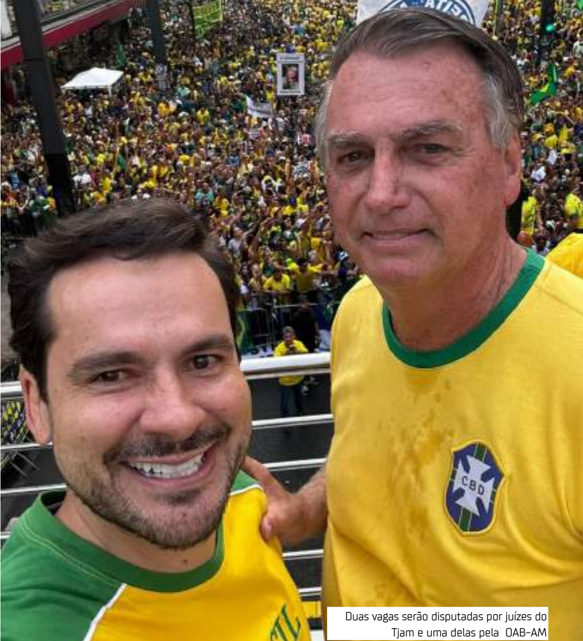
Duas vagas serão disputadas por juízes do Tjam e uma delas pela OAB-AM

readores Capitão Carpê e Coronel Rosses, todos do PL, confirmaram participação no evento. De acordo com o Movimento Conservador no Amazonas, políticos de direita em todo o país estão convocando seus seguidores para a mobilização. Em um vídeo publicado nesta segunda-feira (17), ao lado do ex-presidente Jair Bolsonaro (PL), o vereador Coronel Rosses questionou seus seguidores sobre o retorno de Bolsonaro à presidência nas eleições de 2026. “Quem quer o nosso eterno presidente de volta em 2026?” Inelegível O ex-presidente Jair Bolsonaro (PL) foi declarado inelegível pelo Tribunal Superior Eleitoral (TSE) em junho de 2023, por abuso de poder político e uso indevido dos meios de comunicação. Com essa decisão, ele está impedido de concorrer às eleições até 2030. Sérgio Kruke, líder do Movimento Conservador no Amazonas, justificou a escolha do local. “A Praça do Congresso é o palco escolhido para o protesto. O ato nesse local trará a