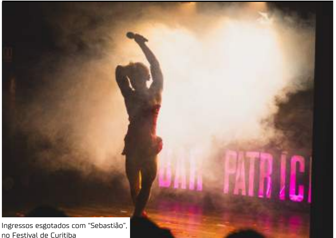
Ingressos esgotados com “Sebastião”, no Festival de Curitiba

obra propõe uma imersão no período entre 1900 e 1920, nas dependências do Hotel Cassina – onde atualmente fica o Casarão da Inovação Cassina – e mostra a exploração e a