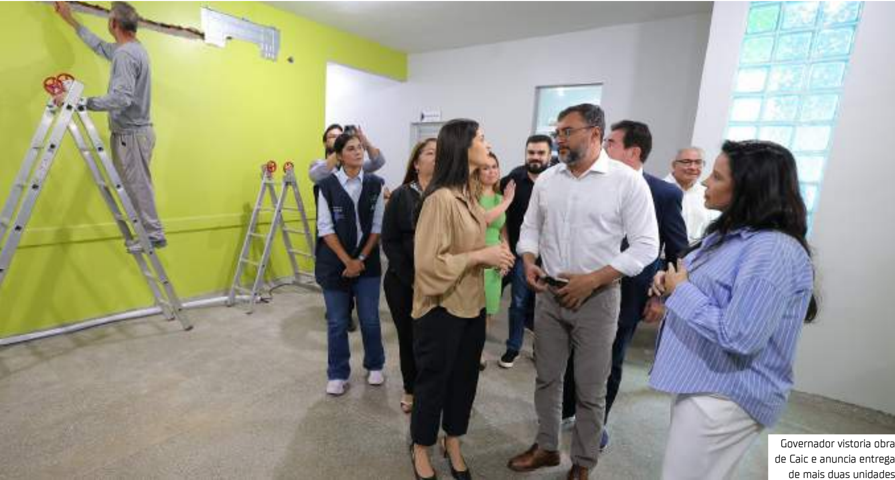
Governador vistoria obra de Caic e anuncia entrega de mais duas unidades

O anúncio foi feito durante vistoria às obras do Caic Alexandre Montoril, localizado no bairro Petrópolis, zona sul, uma das duas unidades que serão reabertas em março quando, também, será reinaugurado o Caic Edson Melo, no bairro Zumbi, zona leste. As duas unidades fazem parte do planejamento que inclui a revitalização de 11 centros a serem reinaugurados pela atual gestão, reforçando a atenção básica e serviços de