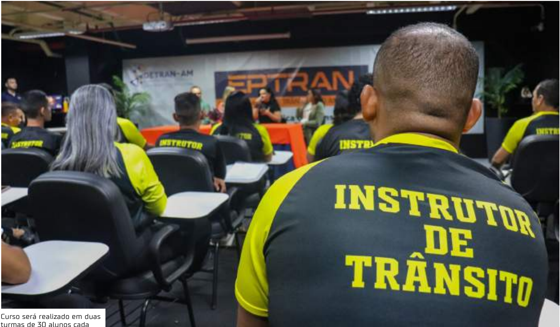
Curso será realizado em duas turmas de 30 alunos cada

Os interessados devem consultar todas as infor-