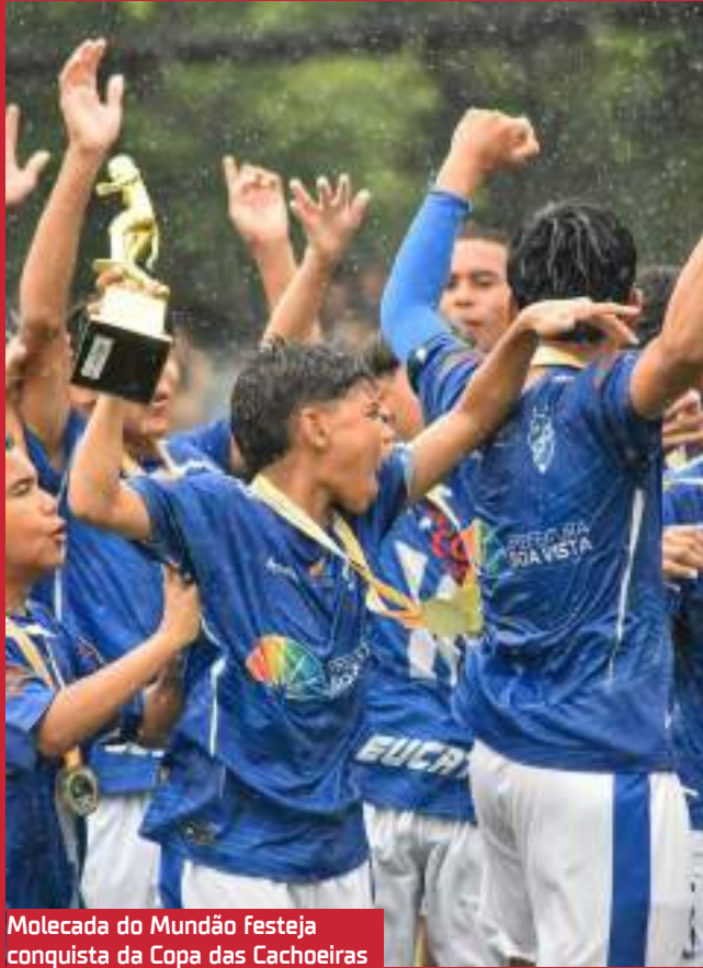
Molecada do Mundão festeja conquista da Copa das Cachoeiras