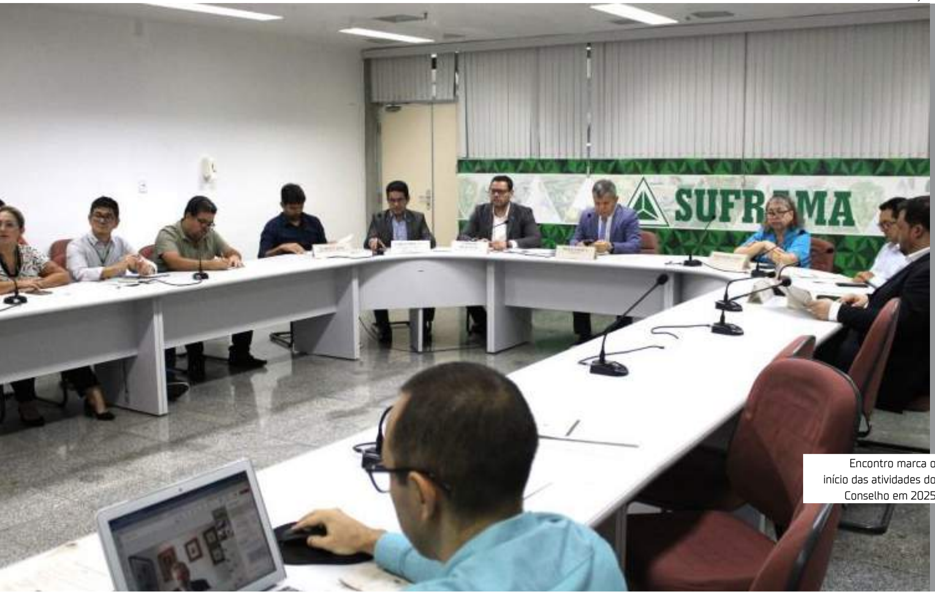
Encontro marca o início das atividades do Conselho em 2025

legação do CAS, 18 projetos industriais que serão comunicados ao Conselho. Juntos, somam R$ 580 milhões em investimentos e devem gerar 582 novos postos de trabalho. Entre os destaques está o projeto da Adata Electronics Brazil S/A, que prevê a fabricação de circuito integrado eletrônico tipo módulo de memória RAM e unidade de armazenamento SSD. O investimento estimado