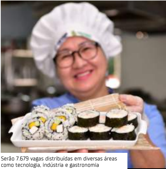
Serão 7.679 vagas distribuídas em diversas áreas como tecnologia, indústria e gastronomia

completa para quem deseja ingressar na gastronomia, abordando técnicas de cozinha regional e nacional, além de gestão de estoque e segurança alimentar.