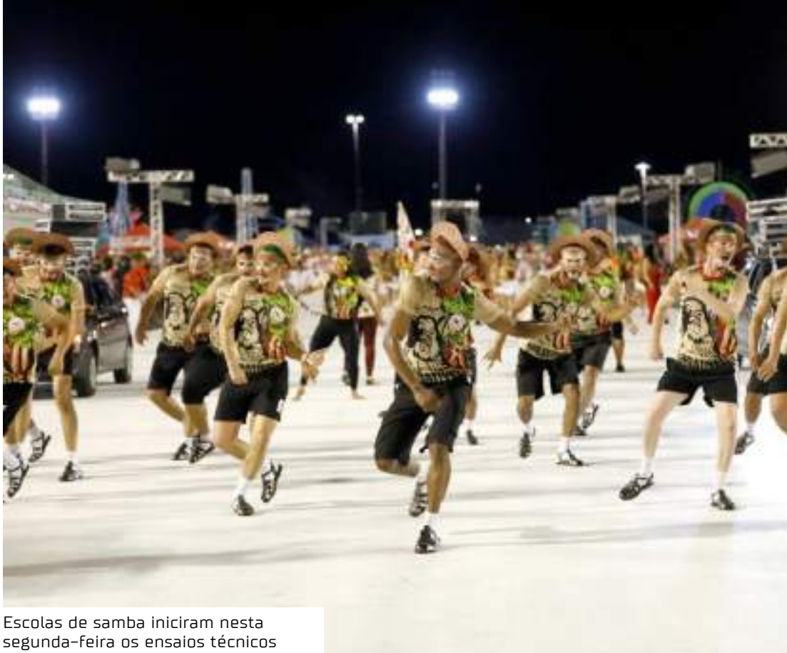
Escolas de samba iniciaram nesta segunda-feira os ensaios técnicos

A Amazonas Band celebra seus 25 anos com show especial no Teatro Amazonas, na terça-feira (25), às 20h. O grupo, reconhecido como uma das principais big bands do país, apresentará um repertório que reúne clássicos de Djavan,