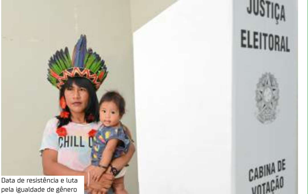
Data de resistência e luta pela igualdade de gênero

O acervo, inaugurado em 26 de abril de 2012, reúne elementos que descrevem a história do processo eleitoral no Amazonas, em todas as suas fases. Podem ser encontradas desde as primeiras urnas de madeira até a urna eletrônica, comprovando como a tecnologia transformou a vo-