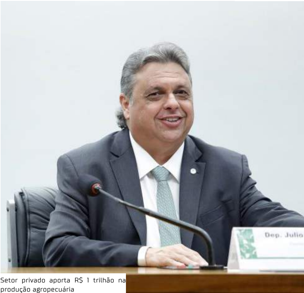
Setor privado aporta R$ 1 trilhão na produção agropecuária

o setor privado aporta R$ 1 trilhão na produção agropecuária. Portanto, os recursos públicos seriam apenas um complemento, subsidiando parte dos financiamentos. No dia 20 de fevereiro, o governo anunciou a suspensão de subsídios associados ao Plano Safra em razão da falta de uma autorização orçamentária para o gasto. Com a medida provisória, o crédito deverá ser retomado. Exportação Em reunião na quinta-feira (20), os líderes partidários decidiram votar nesta semana dois projetos para facilitar a exportação de produtos de pequenas empresas: o PL 4043/24, que reduz tributos para o pequeno exportador, e o PLP 167/24, que facilita, para o pequeno empresário, a devolução de crédito de impostos já pagos de produtos exportados.