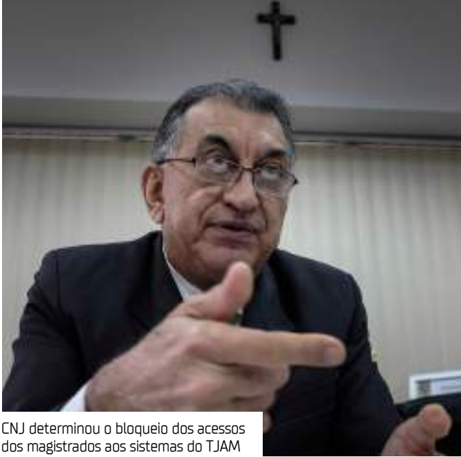
CNJ determinou o bloqueio dos acessos dos magistrados aos sistemas do TJAM

A decisão foi tomada na Reclamação Disciplinar 0000779-08.2025.2.00.0000. Na ação a Eletrobrás (Centrais