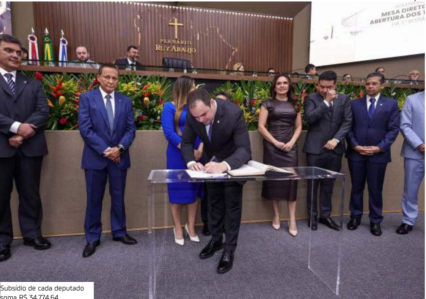
Subsídio de cada deputado soma R$ 34.774,64,

Cotão Além dos salários, cada deputado recebe um montante de R$ 49,8 mil da Cota para o Exercício da Atividade Parlamentar (Ceap), o famoso “Cotão”.