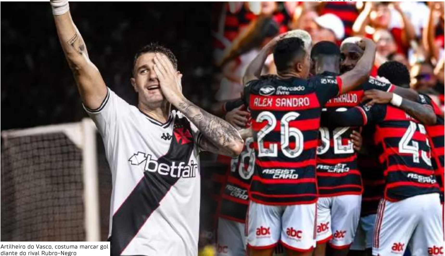
Artilheiro do Vasco, costuma marcar gol diante do rival Rubro-Negro

ção em cima do Botafogo, e destacou a confirmação da vaga da Copa do Brasil 2026. Com o gol contra o Glorioso, o argentino se isolou como o artilheiro da competição.