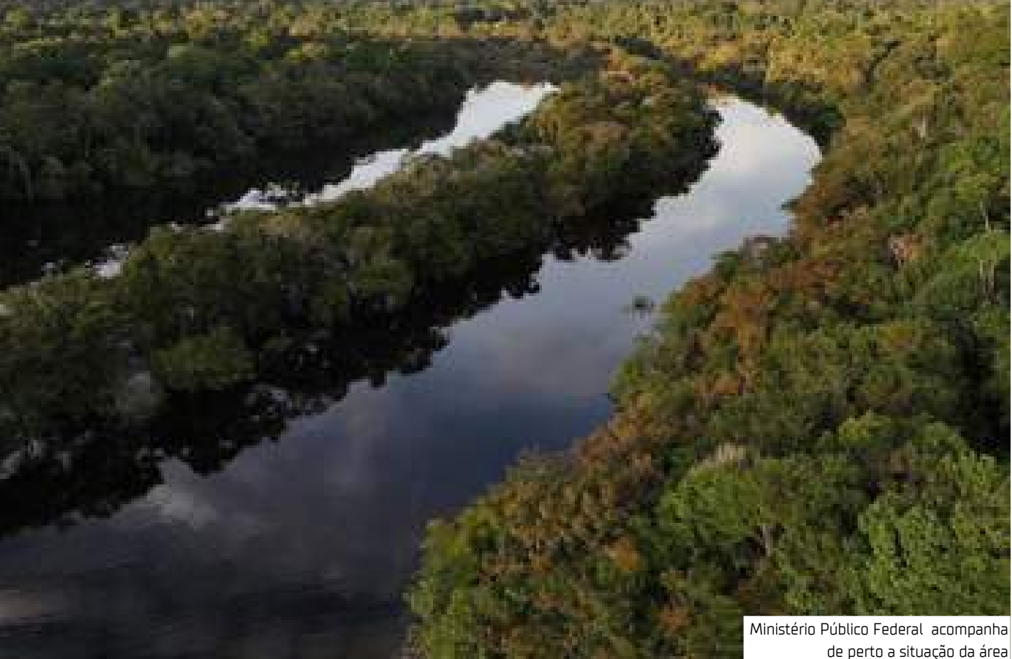
Ministério Público Federal acompanha de perto a situação da área

sições teóricas, debates e expedições de monitoramento em campo, quando foi possível constatar indícios da presença de povos isolados. “Constatamos sinais e vestígios materiais que indicam a existência