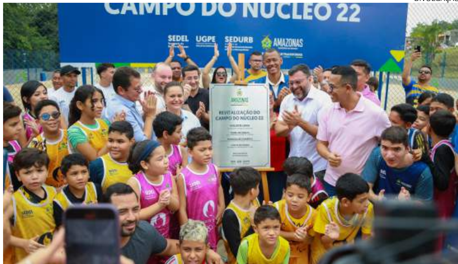
Investimentos fortalecem esporte comunitário e profissional do Amazonas, garantindo infraestrutura de qualidade

Desde 2021, já foram entregues 37 campos comunitários, sendo 31 em Manaus e seis no interior. Entre os mais recentes estão o Campo do Suplano, no bairro Petrópolis, o Estádio Rio Preto da Eva, no município de mesmo nome, além de quatro campos inaugurados na Zona Norte da capital, nos núcleos 16, 21, 22 e 24 do bairro Cidade Nova.