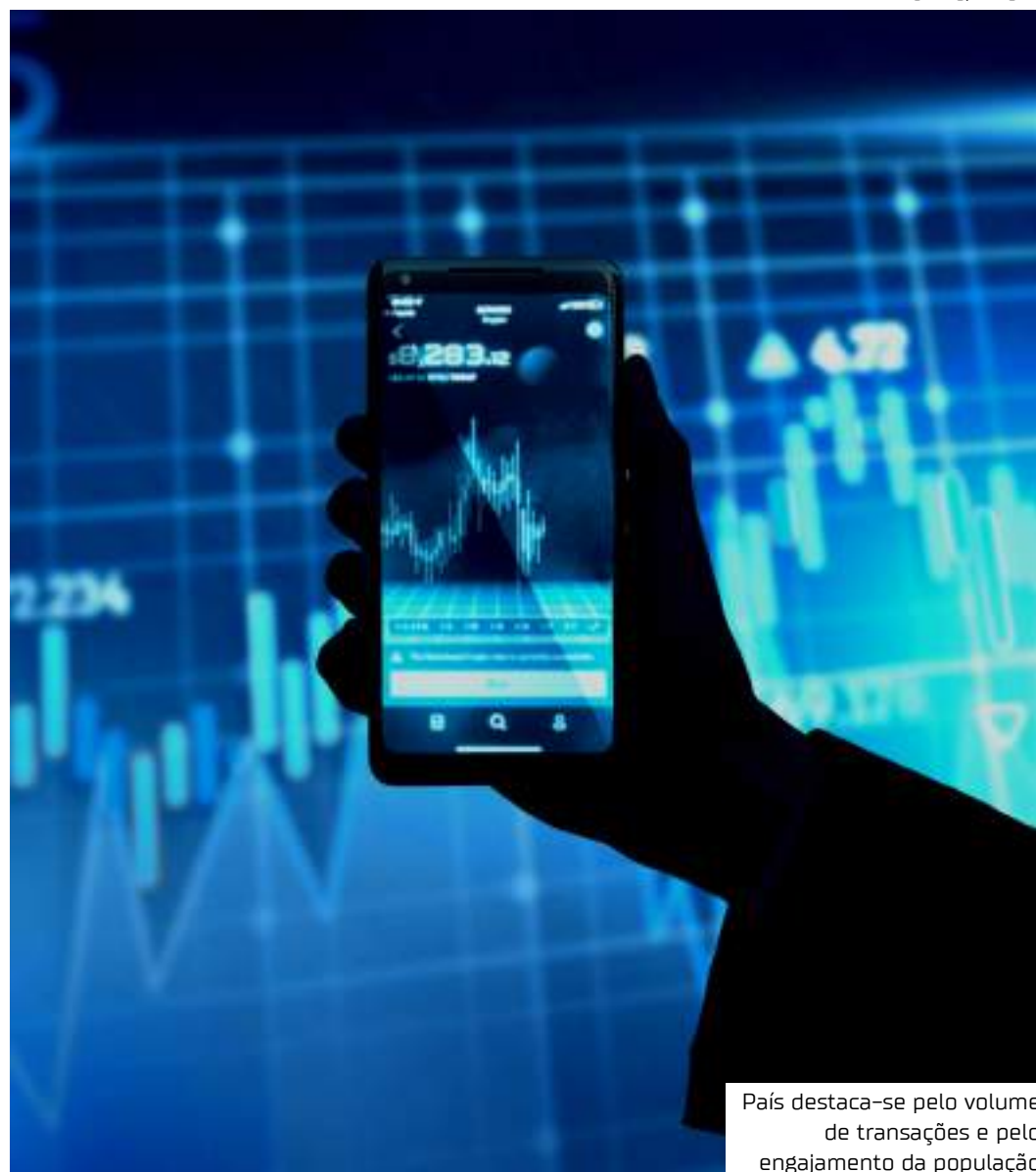
País destaca-se pelo volume de transações e pelo engajamento da população

Por fim, o texto permite a apropriação de créditos de IBS e CBS, promovendo a isonomia tributária ao possibilitar que contribuintes no regime regular aproveitem créditos com base nos valores pagos aos fornecedores.