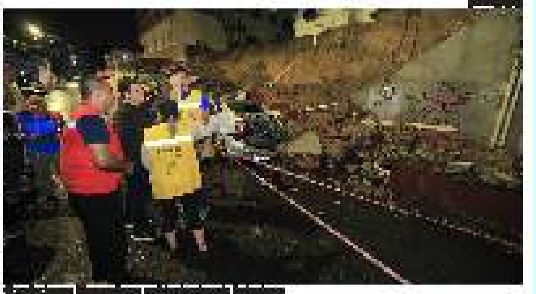
Consequências de tempestade registrada em Itacaré