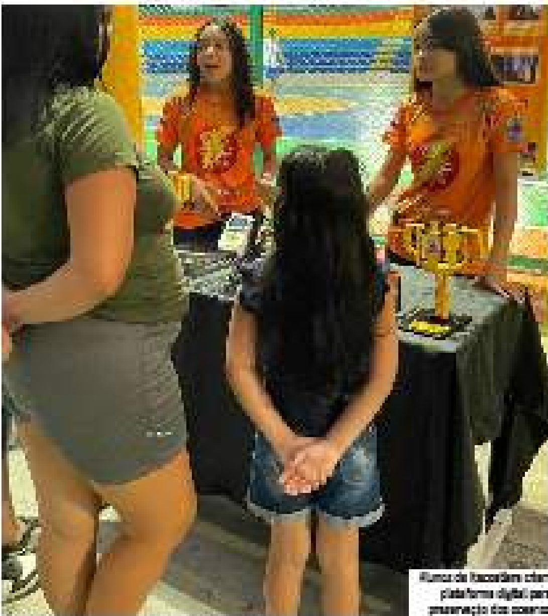
Alunos de Itacaré criam plataforma digital para preservação dos oceanos

Equipes EBITRANS representam instituições no Festival Sesi da Educação