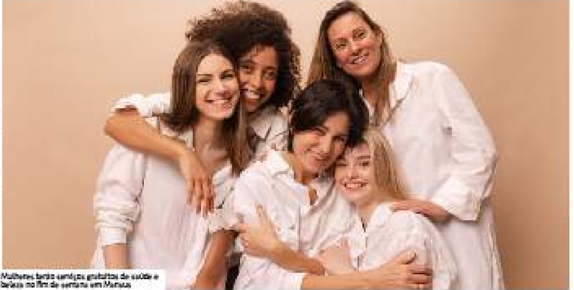
Mulheres terão serviços gratuitos de saúde e beleza no fim de semana em Manaus

Projeto médico e beleza nos dias 8 e 9 desta mês, em homenagem ao Dia Internacional da Mulher