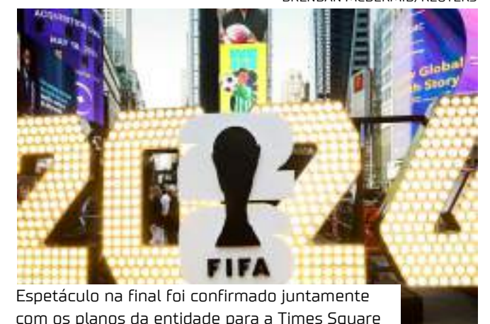
Espectáculo na final foi confirmado juntamente com os planos da entidade para a Times Square