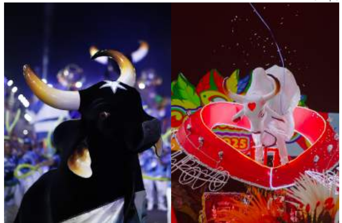
Caprichoso e Garantido desfilaram seus espetáculos pelas ruas da ilha Tupinambarana

A participação da Corte Vermelha e Branca trouxe ainda mais brilho ao evento, com a Rainha do Carnaval, a Rainha da Diversidade e o Rei Momo