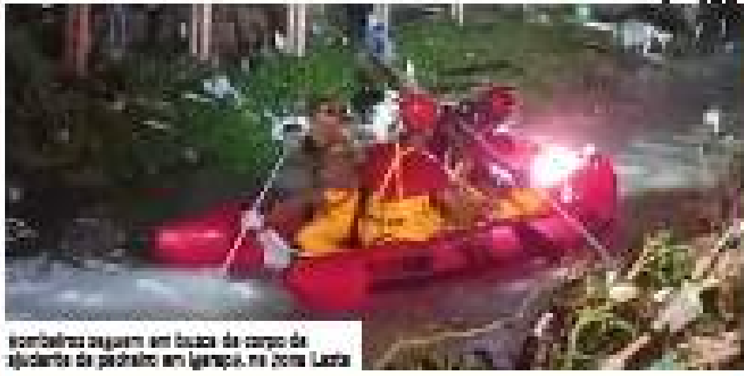
Sombrias paguem em busca do corpo do afundado do peixeiro em Igarapé, na Zona Leste

As equipes de busca do Comando Militar de Manaus (CMM) continuam as buscas pelo corpo do homem desaparecido em Manaus, após o acidente com o barco no rio Negro.