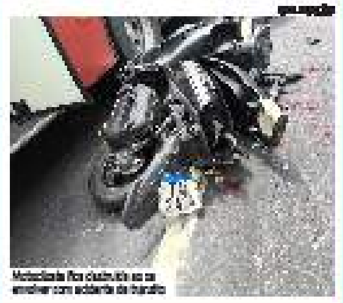
Motociclista foi distribuído ao ar em acidente com colisão de tráfego