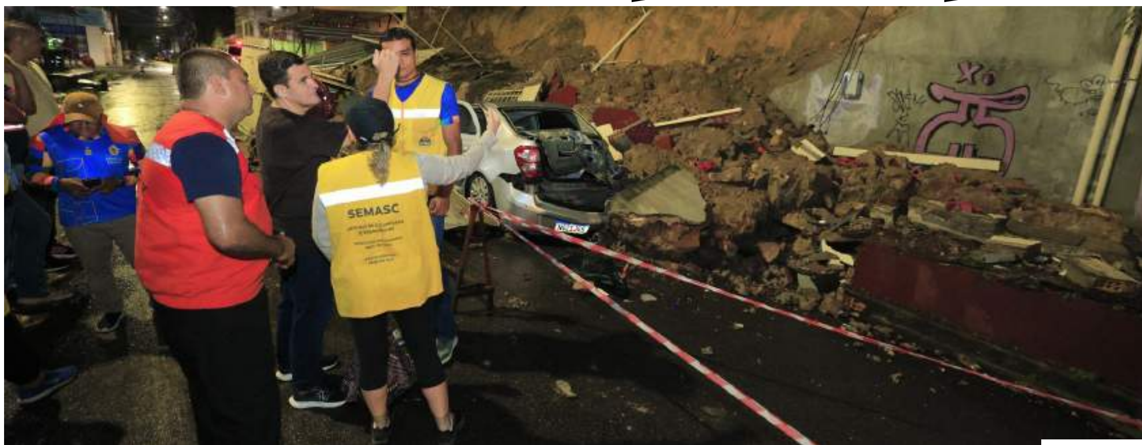
Dia a Dia 8