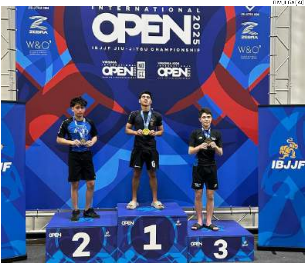
Na trajetória para o título, Oscar enfrentou três adversários e venceu todos por finalização