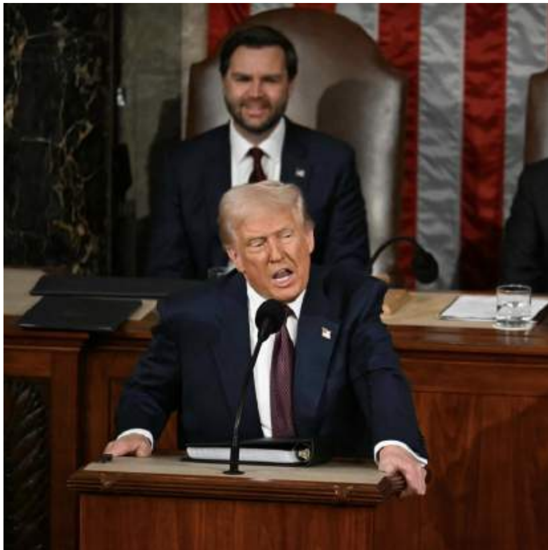
Mandatário republicano indicou que não pretende recuar na promessa de aplicar novas tarifas

"Há países que usam tarifas contra nós há décadas e agora é a nossa vez de começar a usá-las contra eles. A União Europeia, China, Brasil e Índia, México e Canadá e diversas outras nações cobram tarifas