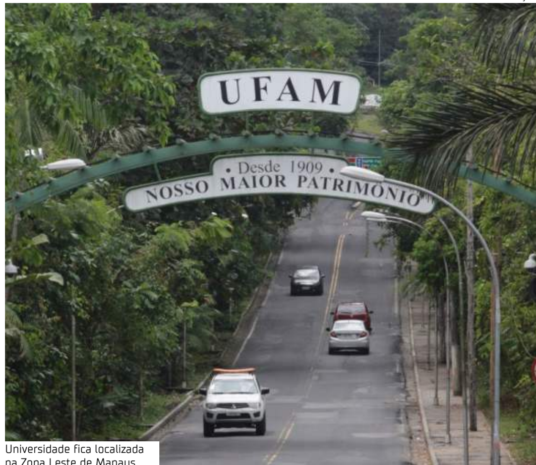
Universidade fica localizada na Zona Leste de Manaus