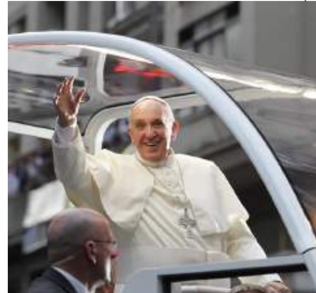
Prognóstico do pontífice permanece reservado