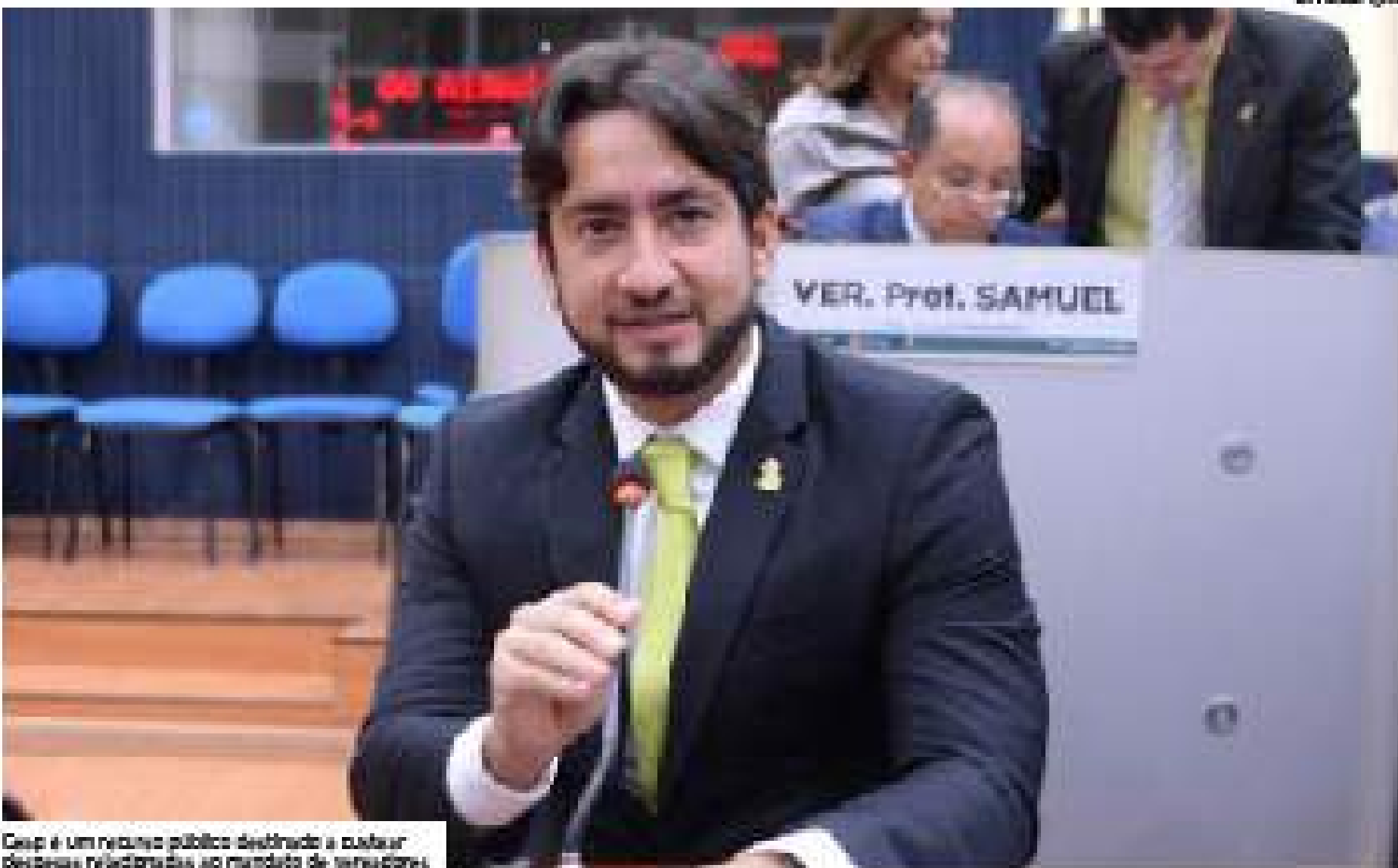
Caspi é um recurso público destinado a custear despesas relacionadas ao mandato de vereadores.

Empresa não atua no ramo de comunicação, conforme dados da Receita