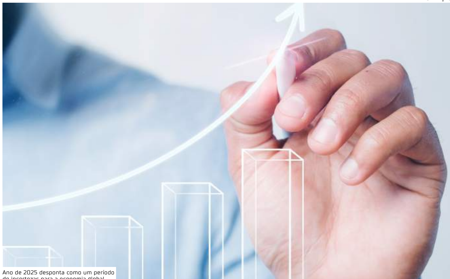
Ano de 2025 desponta como um período de incertezas para a economia global

Apesar de longo do ano, o crescimento foi forte na Europa, bem como nos EUA e no Japão. Alguns mercados-chave emergentes, como a Índia e partes da Ásia, como Singapura e Coreia do Sul, também registraram um crescimento decente. 17 países dos 49 do Índice registraram dividendos recordes, incluindo al-