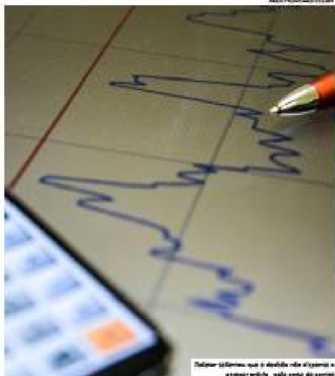
Deputados podem aprovar contas do governo sem parecer do TCE

A decisão foi dada em um julgamento do Plenário do STF em 15 de maio de 2023. O voto vencedor foi do ministro Ricardo Lewandowski, que afirmou que a aprovação das contas do governo é uma função essencialmente legislativa e não depende do parecer do TCE.