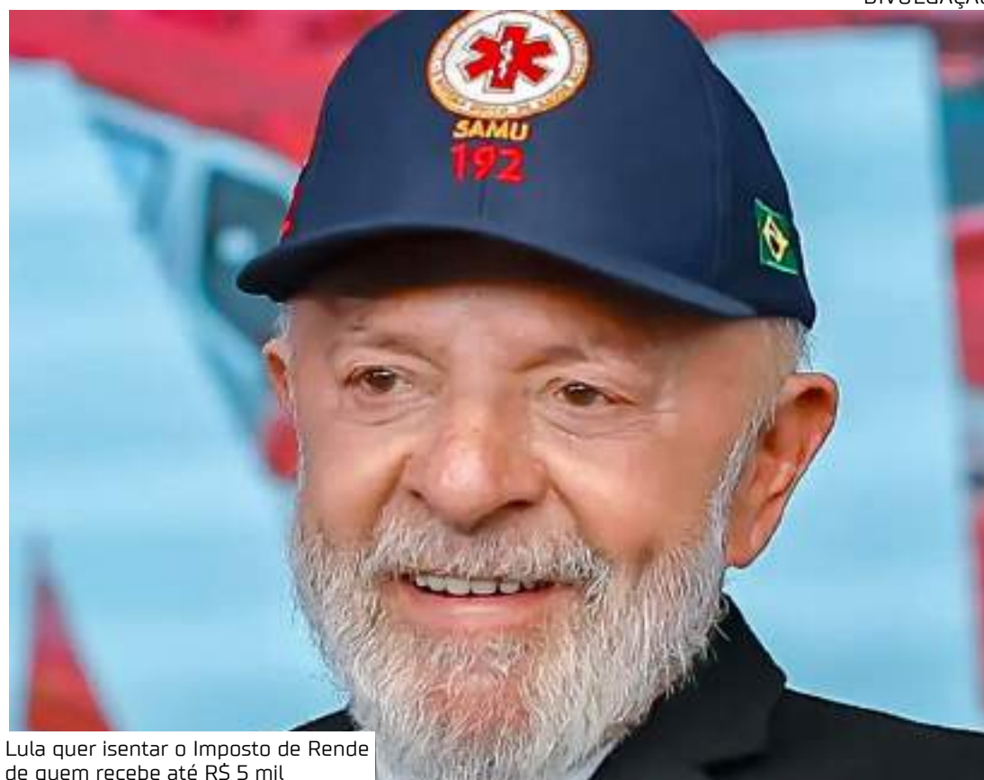
Lula quer isentar o Imposto de Renda de quem recebe até R$ 5 mil

"A verdade é que quem paga imposto de renda nesse país é quem tem desconto na fonte, porque não tem como sonegar. É descontado na folha de pagamento dele. Mas quem ganha muito, às vezes nem