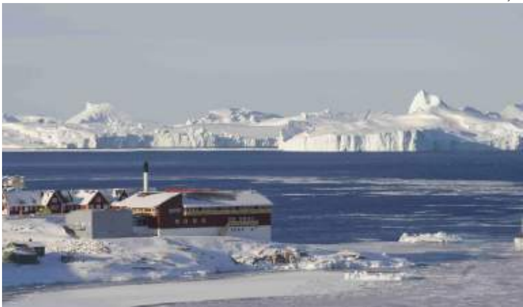
Ilha não está aberta à proposta, disse o chanceler dinamarquês