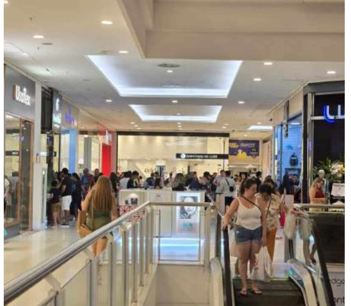
Shopping Ponta Negra promove a Semana do Consumidor de 13 a 21 de março

A Info Store estendeu sua Semana do Consumidor até 16 de março, com descontos de até 25% para pagamentos via Pix. A promoção inclui geladeiras, máquinas de lavar, ar-condicionado, fones de ouvido, celulares, notebooks e videogames, disponíveis tanto nas lojas