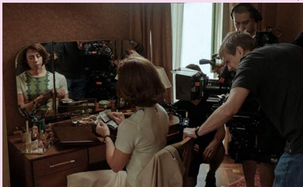
Filme já estreou em países como Itália, Chile, Colômbia, Israel, México, Alemanha, Espanha, Polônia e Austrália

Em sua 19ª semana em cartaz, "Ainda Estou Aqui" já alcançou 5,7 milhões de espectadores e segue em exibição em mais de 700 salas. O filme quebrou recordes e se consolidou em diferentes rankings do cinema brasileiro: 11º maior público da história do cinema nacional; maior lançamento brasileiro da Sony Pictures; segunda maior bilheteria da Sony Pictures no Brasil (R$ 115,3 milhões), atrás apenas de "Homem-Aranha: Sem Volta para Casa"; melhor desempenho de um filme brasileiro pós-pandemia; e 7º filme nacional mais assistido do século.