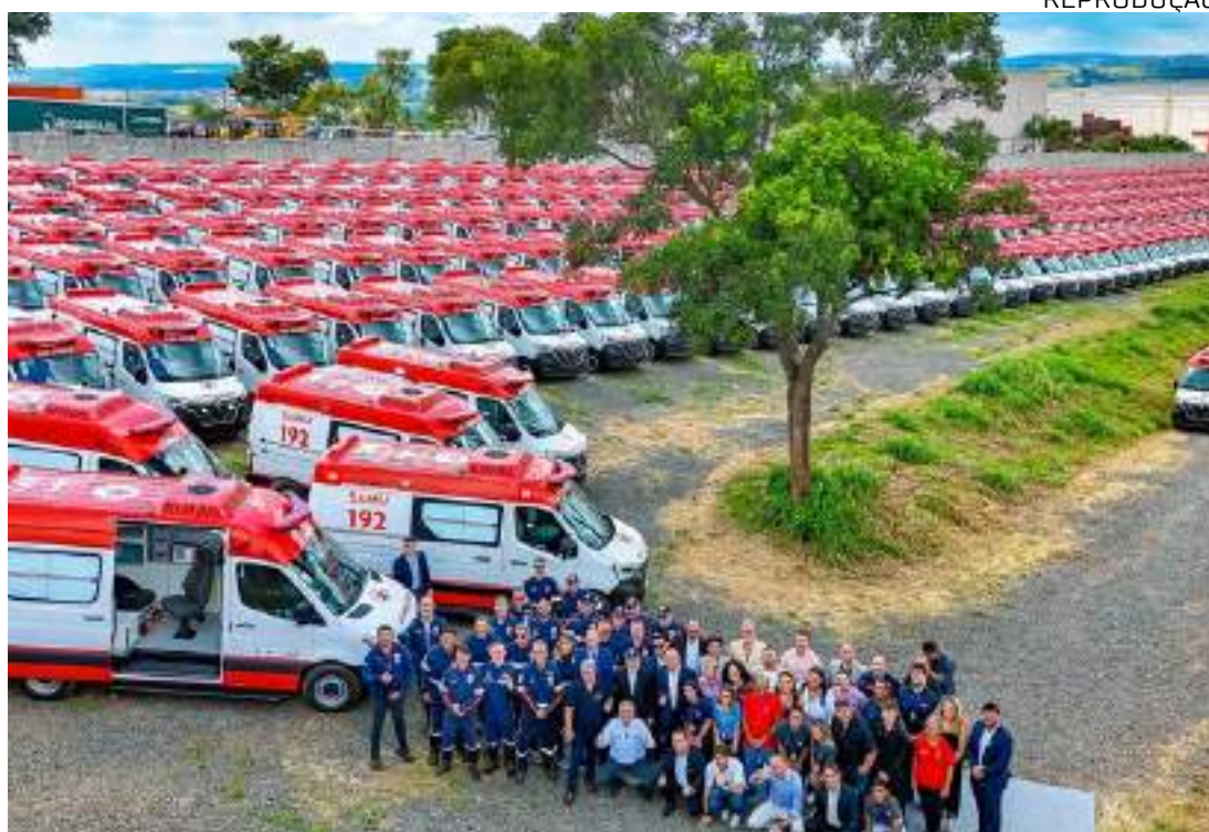
Presidente Lula e comitiva diante das ambulâncias entregues em Sorocaba

"O Estado brasileiro não tinha ambulâncias antes de