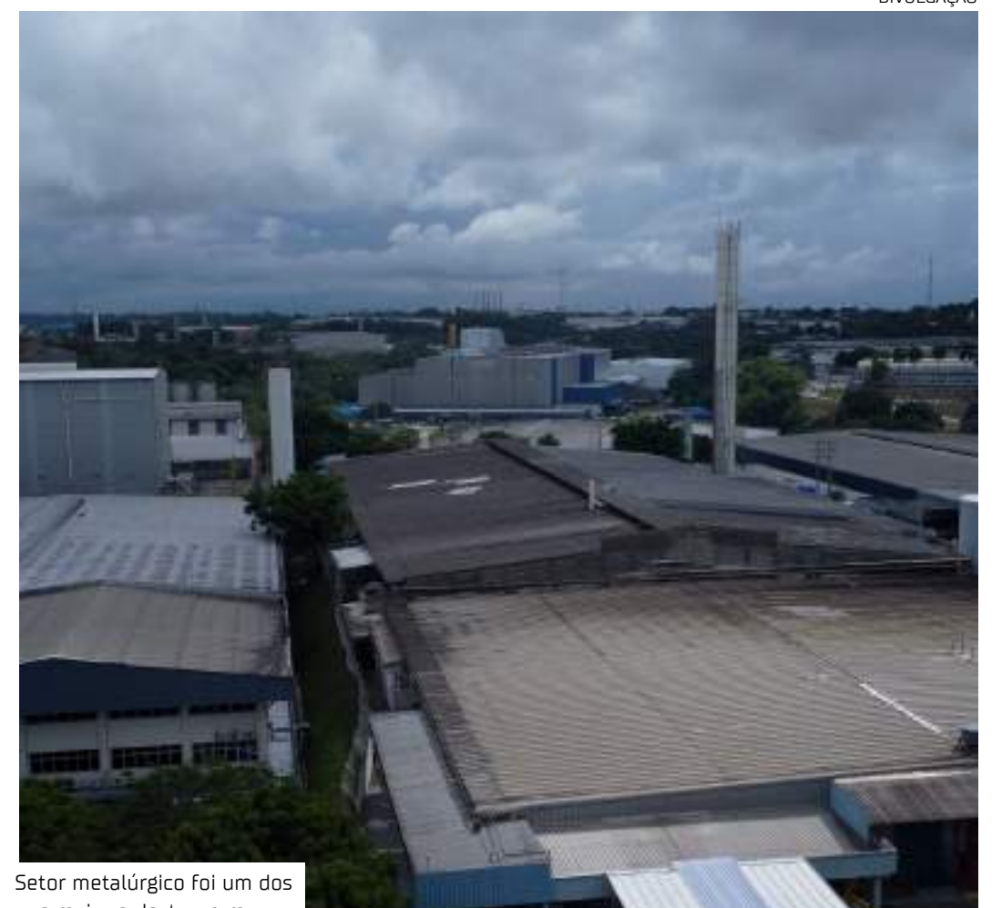
Setor metalúrgico foi um dos que mais se destacaram