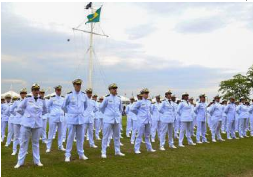
Marinha do Brasil abre 174 vagas em concursos públicos para candidatos de nível superior

A Marinha do Brasil anunciou a abertura de seis editais de concursos públicos, oferecendo 174 vagas para profissionais de nível superior que desejam ingressar na Força como Oficiais de carreira. As inscrições estão disponíveis de 30 de abril a 14 de maio de 2025, com taxa no valor de R$ 140,00.