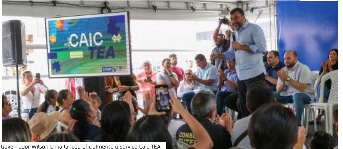
Governador Wilson Lima lançou oficialmente o serviço Caic TEA

A unidade da zona sul recebeu serviços nas áreas interna e externa, com pintura geral do prédio, revisão das instalações elétricas, hidráulicas e sanitárias, intervenções nas salas dos consultórios médicos, banheiros, setores administrativos, recepção e área de espera. O investimento foi de R$ 1,8 milhão, incluindo a obra