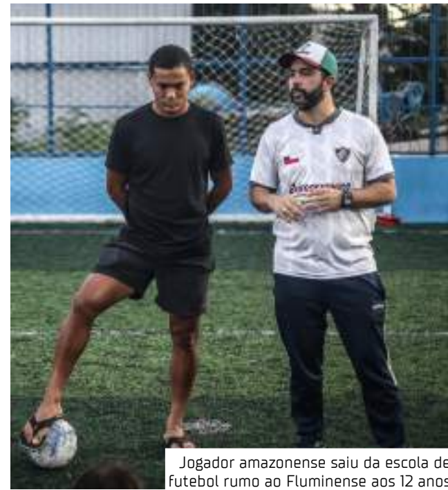
Jogador amazonense saiu da escola de futebol rumo ao Fluminense aos 12 anos