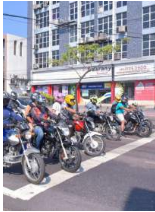
Amazonas registrou 309 mortes em decorrência de acidente envolvendo motociclistas