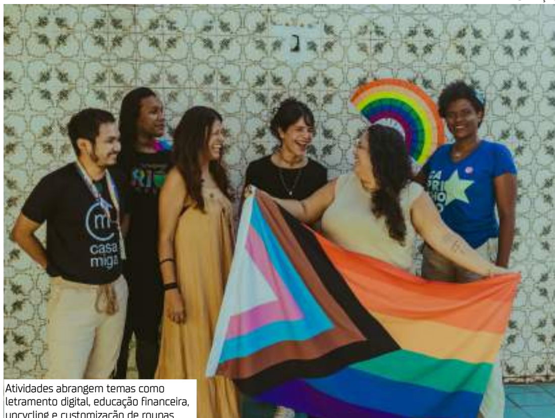
Atividades abrangem temas como letramento digital, educação financeira, upcycling e customização de roupas