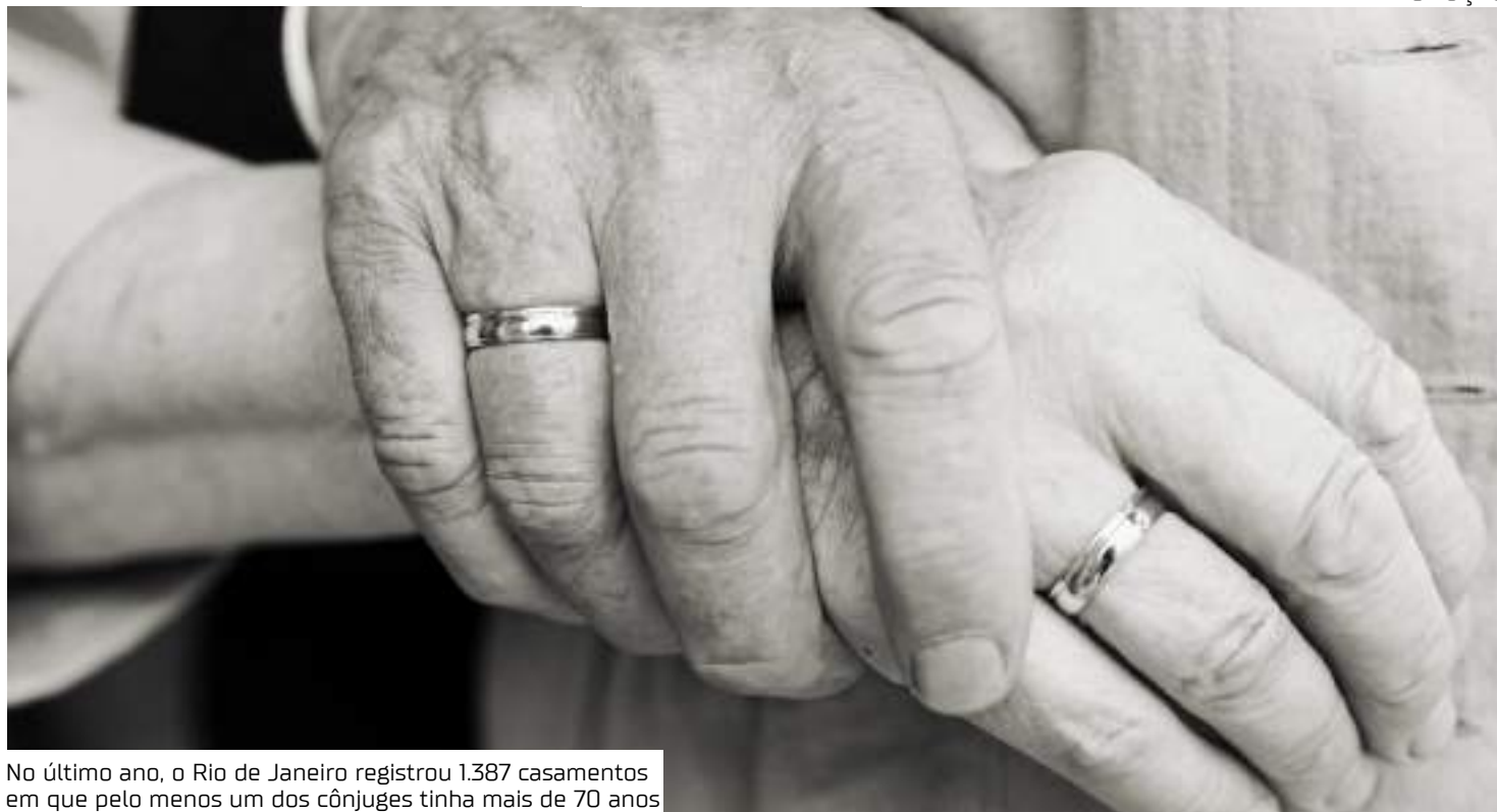
No último ano, o Rio de Janeiro registrou 1.387 casamentos em que pelo menos um dos cônjuges tinha mais de 70 anos

A decisão do STF, tomada em fevereiro do ano passado, acabou com a obrigação da separação de bens para