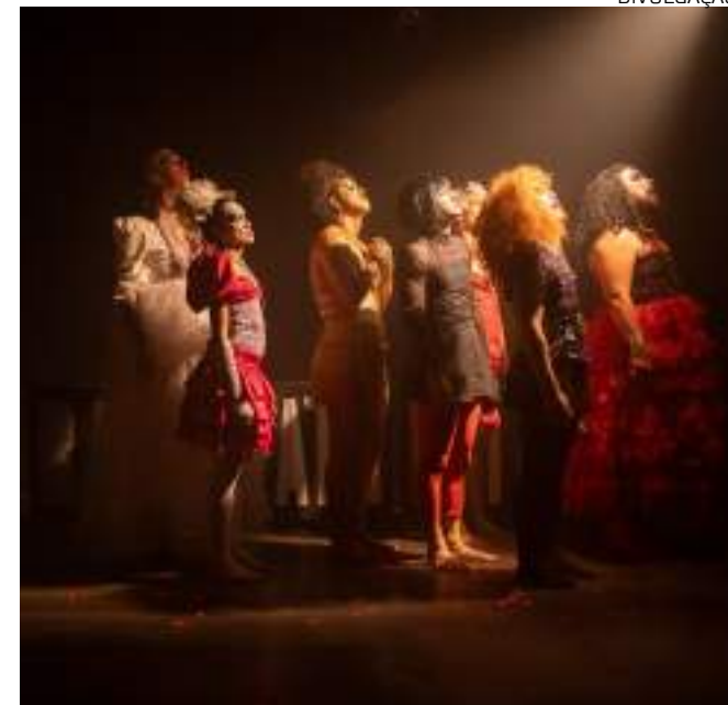
Estreia marca um novo capítulo para o grupo de teatro Ateliê 23