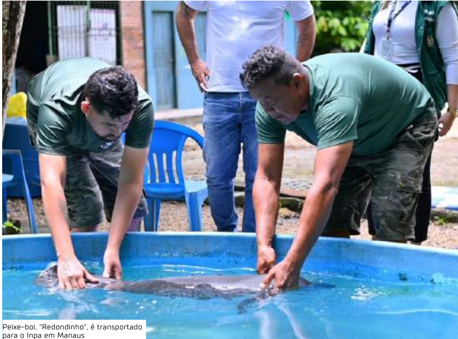
Peixe-boi, "Redondinho", é transportado para o Inpa em Manaus

"A articulação entre a Secretaria de Desenvolvimento Ambiental de Uruará,