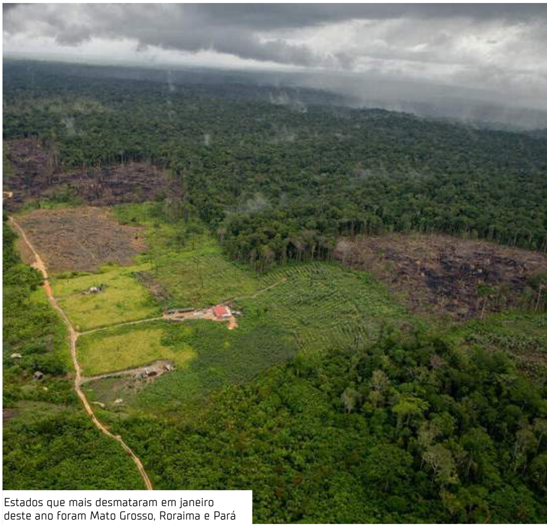
Estados que mais desmataram em janeiro deste ano foram Mato Grosso, Roraima e Pará

O desmatamento na Amazônia Legal aumentou 68% em janeiro de 2025 em relação ao mesmo período do ano anterior, atingindo 133 km 2 de destruição florestal. A área é a sexta maior desmatada da série histórica