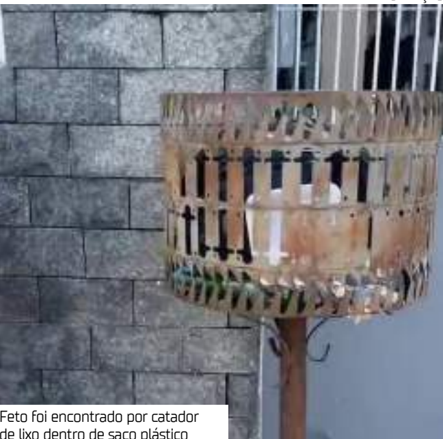
Feto foi encontrado por catador de lixo dentro de saco plástico