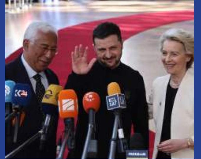
Líderes fizeram reunião com o presidente da Ucrânia