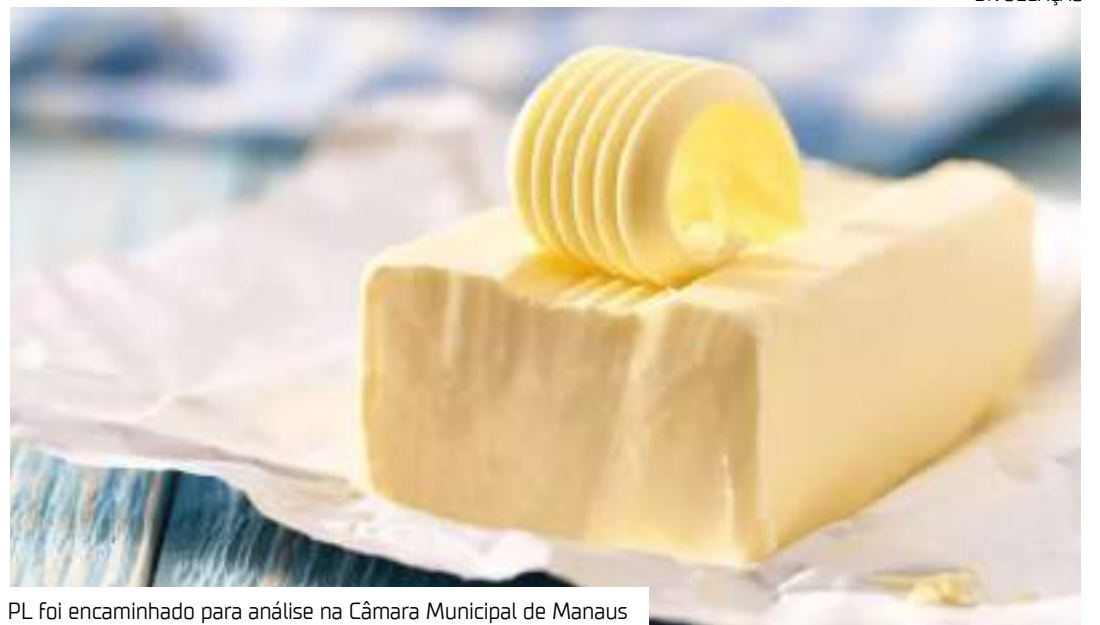
PL foi encaminhado para análise na Câmara Municipal de Manaus