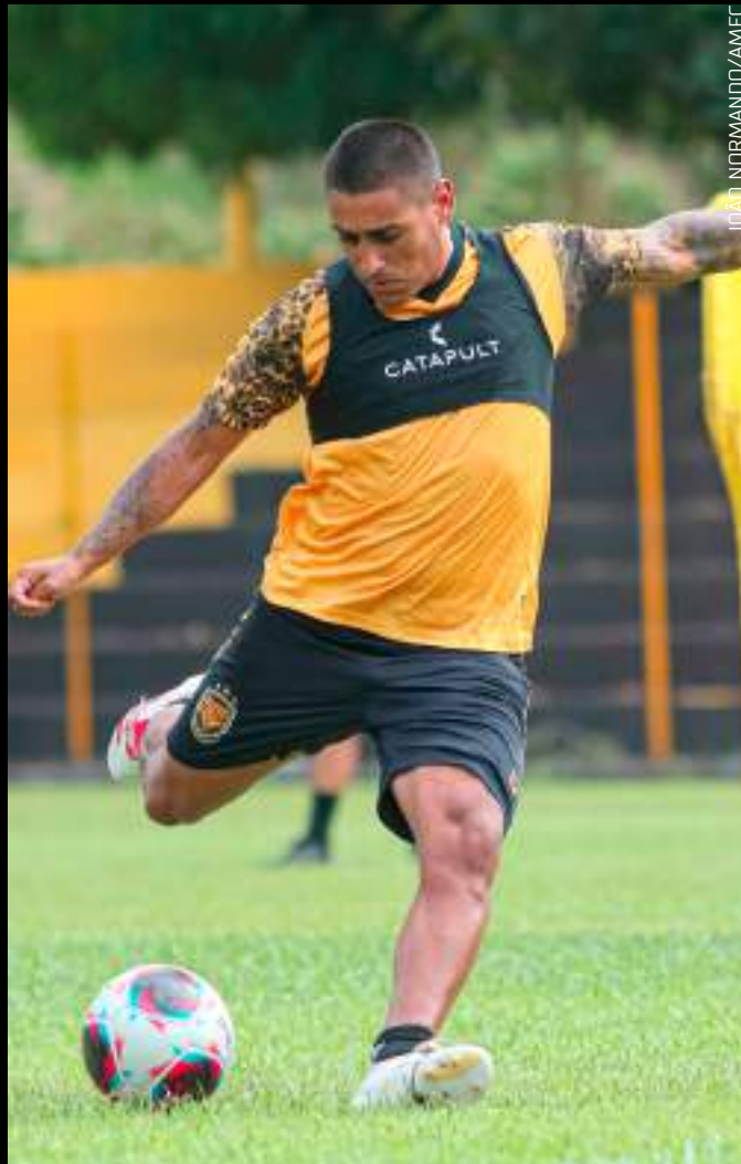
Camisa 22 do Amazonas reconhece a importância do confronto

Com valores a partir de R$ 20, os ingressos para a partida de domingo já estão disponíveis para venda online, na plataforma ingresso.fly.com, e presencialmente nos seguintes pontos de venda: Lojas da Onça (shoppings Amazonas e Grande Circular); Lojas da Nação Rubro-Negra (shoppings Amazonas, Sumaúma e Manauara) e Ótica Veja (shopping Grande Circular).