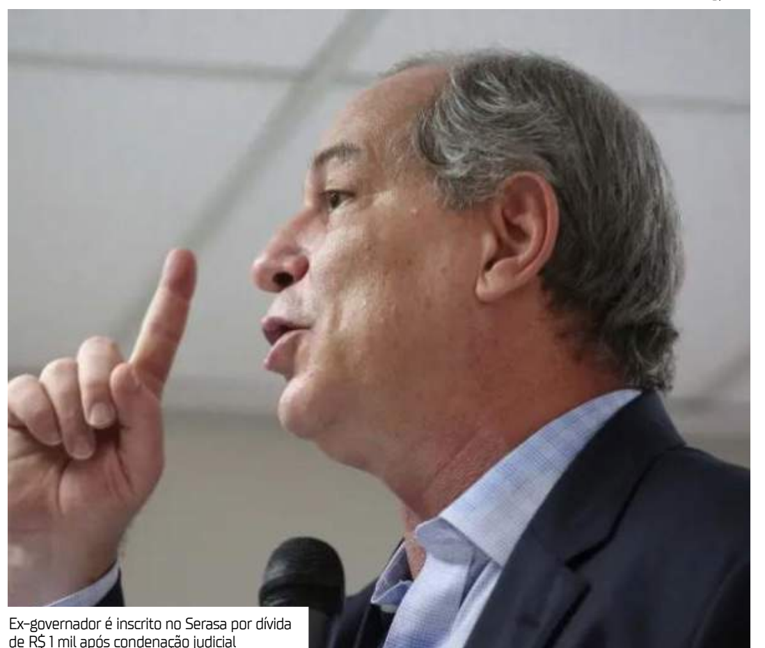
Ex-governador é inscrito no Serasa por dívida de R$ 1 mil após condenação judicial

Essa não é a primeira vez que Ciro enfrenta problemas financeiros relacionados a processos judiciais. Em 2024, o Tribunal de Justiça de São Paulo (TJ-SP) autorizou a penhora de bens do ex-governador do Ceará pelo não pagamento de uma dívida de R$ 31 mil. O montante era referente a honorários advocatícios decorrentes de uma ação que Ciro perdeu contra jornalistas da Abril Comunicações em 2018.