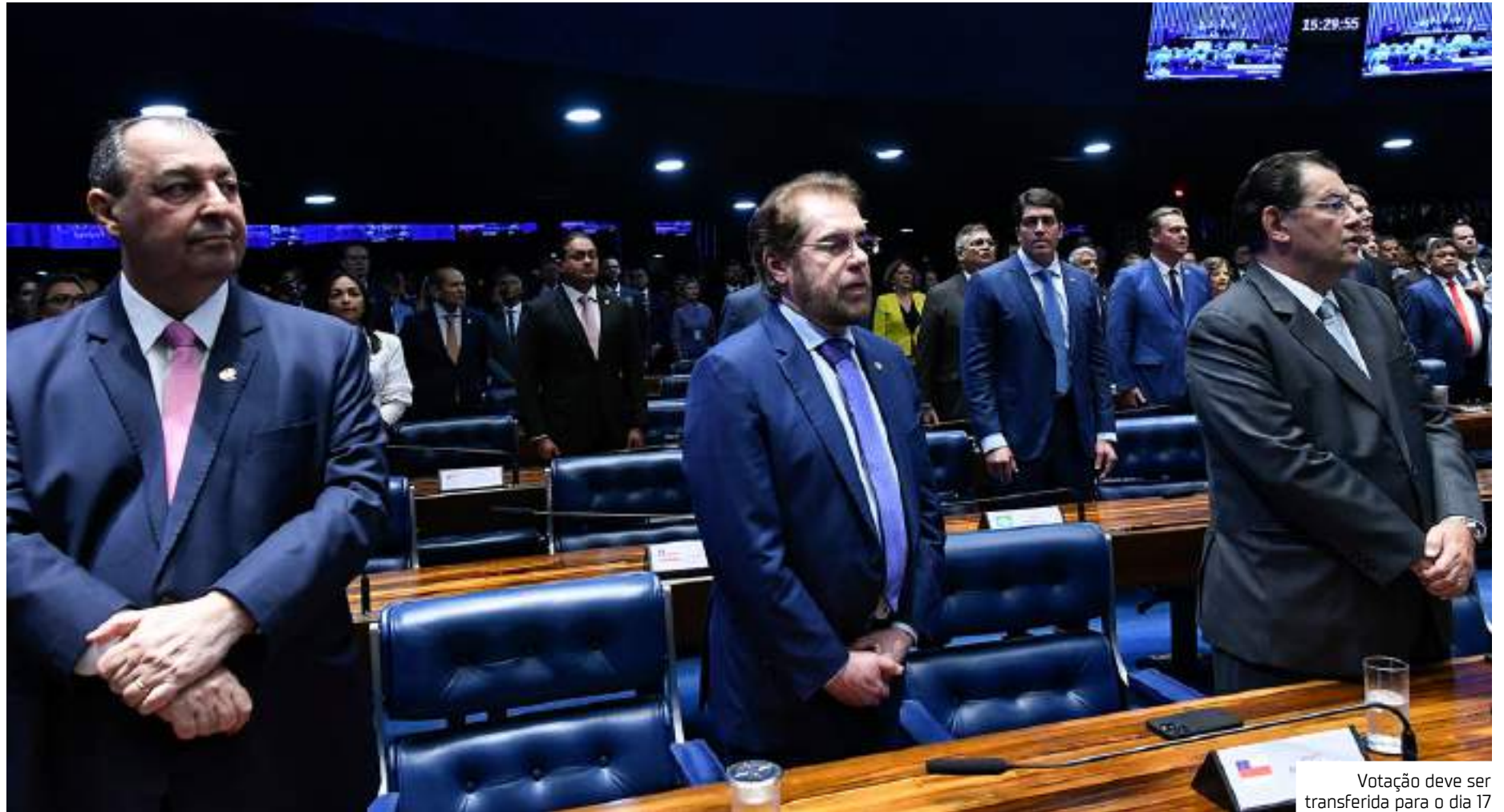
Votação deve ser transferida para o dia 17

Já o senador Omar Aziz (PSD), que entrará na briga pelo comando do Governo do Amazonas, deverá "dividir para conquistar", levando em consideração os núme-