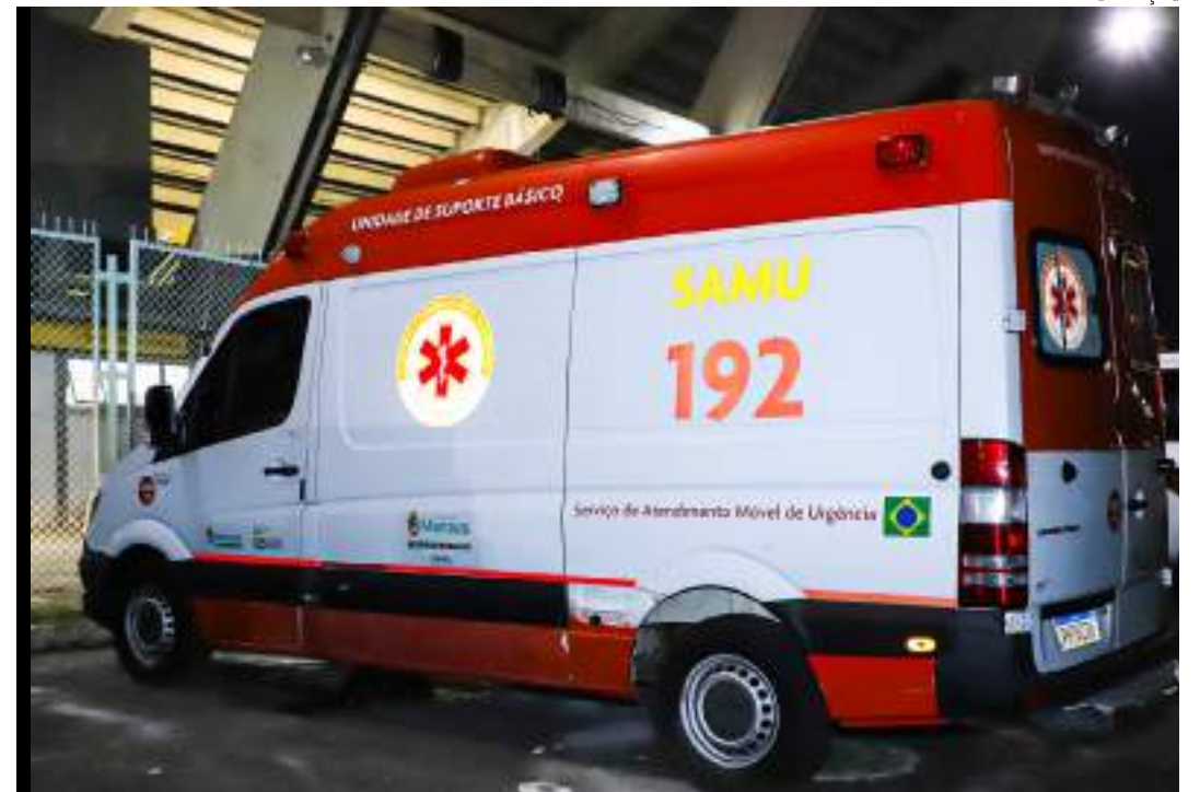
Serviço de saúde funciona 24 horas prestando atendimento pré-hospitalar na capital