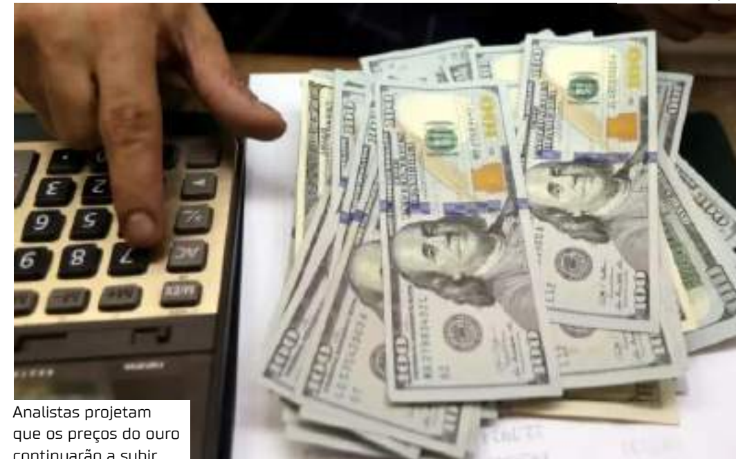
Analistas projetam que os preços do ouro continuarão a subir