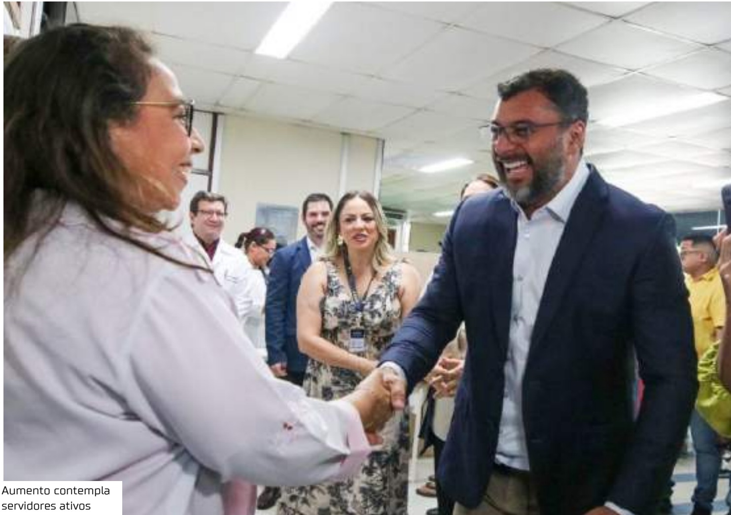
Aumento contempla servidores ativos

Periódica de Desempenho (APD) dos servidores da saúde do Amazonas, conforme disposto nos Decretos n.º 46.221, de