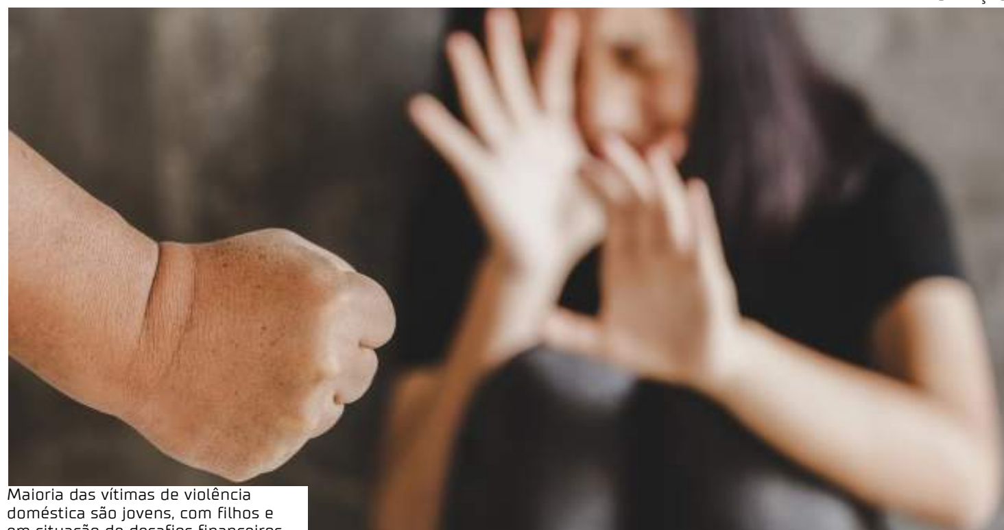
Maioria das vítimas de violência doméstica são jovens, com filhos e em situação de desafios financeiros

Os estudos revelam que a maioria das vítimas é jovem, tem filhos e enfrenta desafios financeiros que dificultam o rompimento do ciclo da violên-