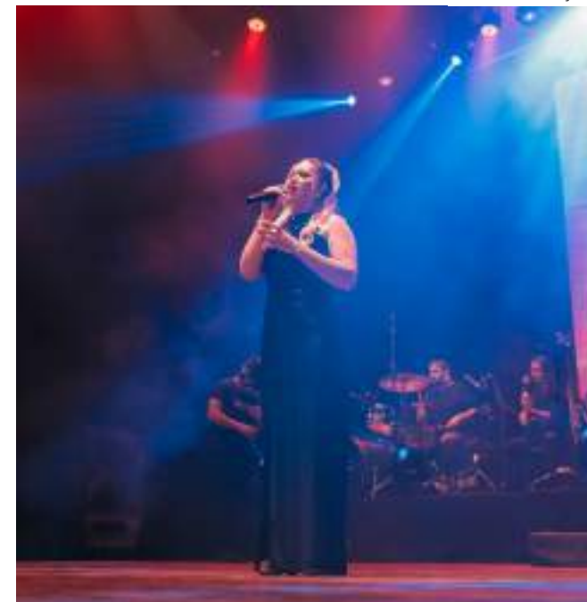
Calouros irão concorrer a prêmios que chegam a R$ 7.500

Os interessados em mostrar o talento na música têm até o dia 31 de março para se inscrever no 45º Festival de Calouros do Sesc, nas categorias "Adulto" e "Kids". As inscrições são gratuitas e de forma on-line, por meio do site: www.sesc-am.com.br .