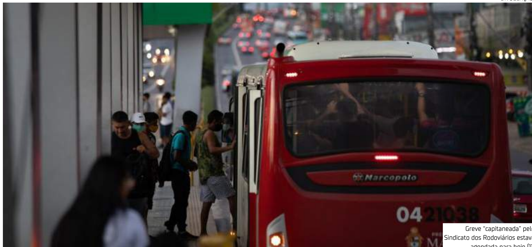
Greve "capitaneada" pelo Sindicato dos Rodoviários estava agendada para hoje (11)

Em sua decisão, o desembargador destacou que, embora o direito à greve seja garantido, é fundamental esgotar todas as tentativas de negociação pacífica antes de recorrer a essa me-