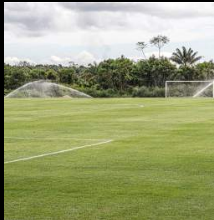
Clube inaugurou a estrutura em abril de 2023

Por fim, a reportagem entrou em contato com o Manaus FC para obter um posicionamento, mas ainda não recebeu resposta. Enquanto isso, o clube se recupera da derrota nos pênaltis para o Amazonas FC na final do primeiro turno do Campeonato Amazonense, no último domingo (9), na Arena da Amazônia.