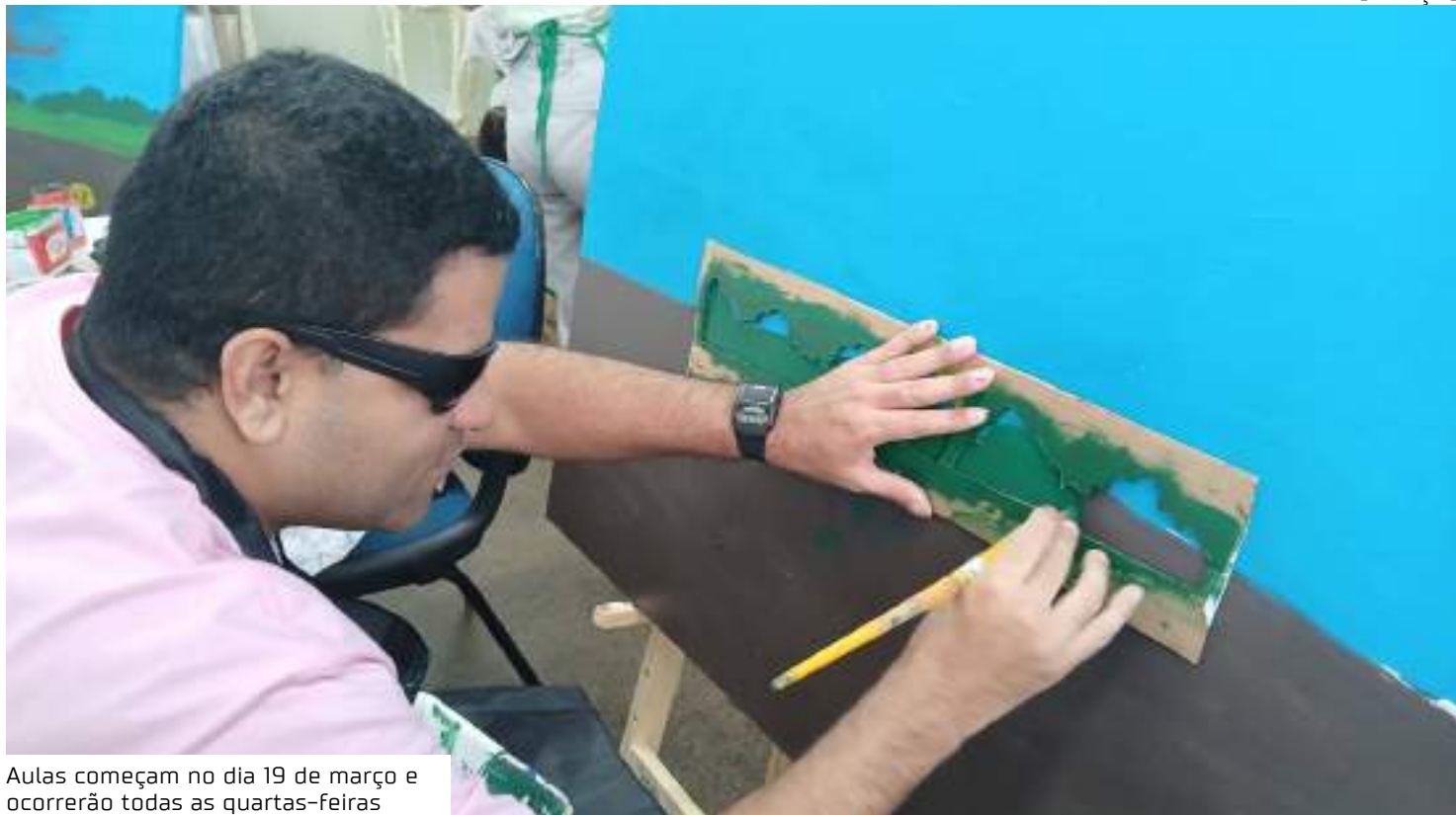
Aulas começam no dia 19 de março e ocorrerão todas as quartas-feiras