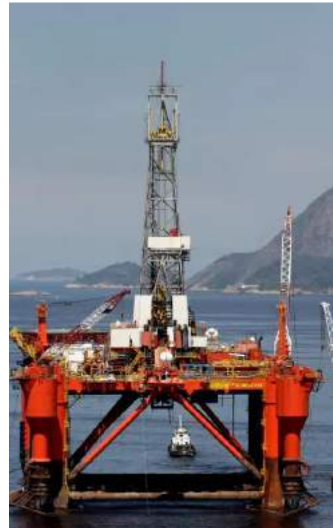
No total, foram 183 feridos em 731 acidentes, de acordo com ANP

As atividades de exploração e produção de petróleo no país registraram 731 acidentes em 2024, de acordo com a Agência Nacional do Petróleo, Gás Natural e Biocombustíveis. Cento e oitenta e três pessoas ficaram feridas, sendo 78 com gravidade. Uma morte foi registrada.