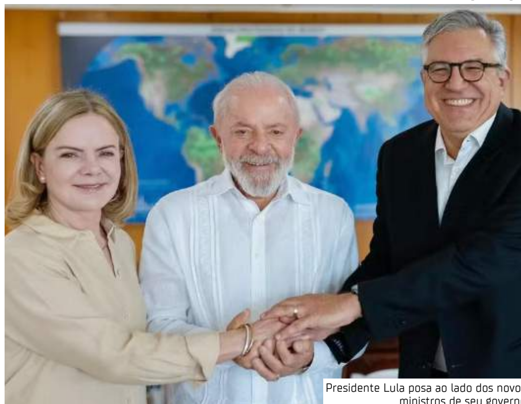
Presidente Lula posa ao lado dos novos ministros de seu governo

Padilha também criticou a desinformação sobre vaci-