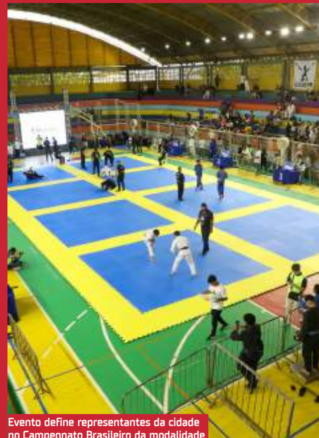
Evento define representantes da cidade no Campeonato Brasileiro da modalidade