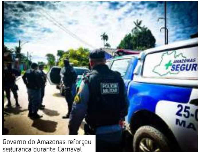
Governo do Amazonas reforçou segurança durante Carnaval

Mais de 4.500 servidores, entre policiais militares, civis e bombeiros atuaram, no período, garantindo a segurança dos eventos carnavalescos. A Polícia Militar apreendeu