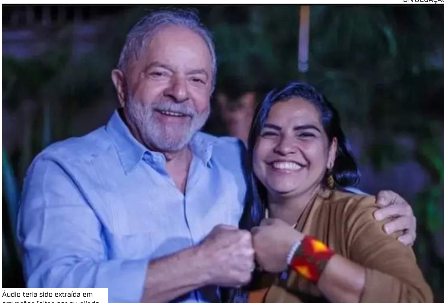
Áudio teria sido extraído em gravações feitas por ex-aliado