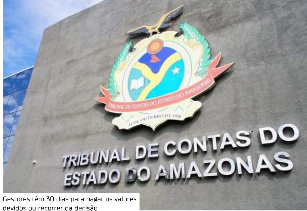
Gestores têm 30 dias para pagar os valores devidos ou recorrer da decisão

Outro ponto destacado foi a insuficiência de caixa para cobrir obrigações financeiras, o que, segundo o relator, demonstra falta de planejamento orçamentário. Além disso, o controle interno da Câmara não estava devidamente estruturado, descumprindo normas do próprio Tribunal de Contas.