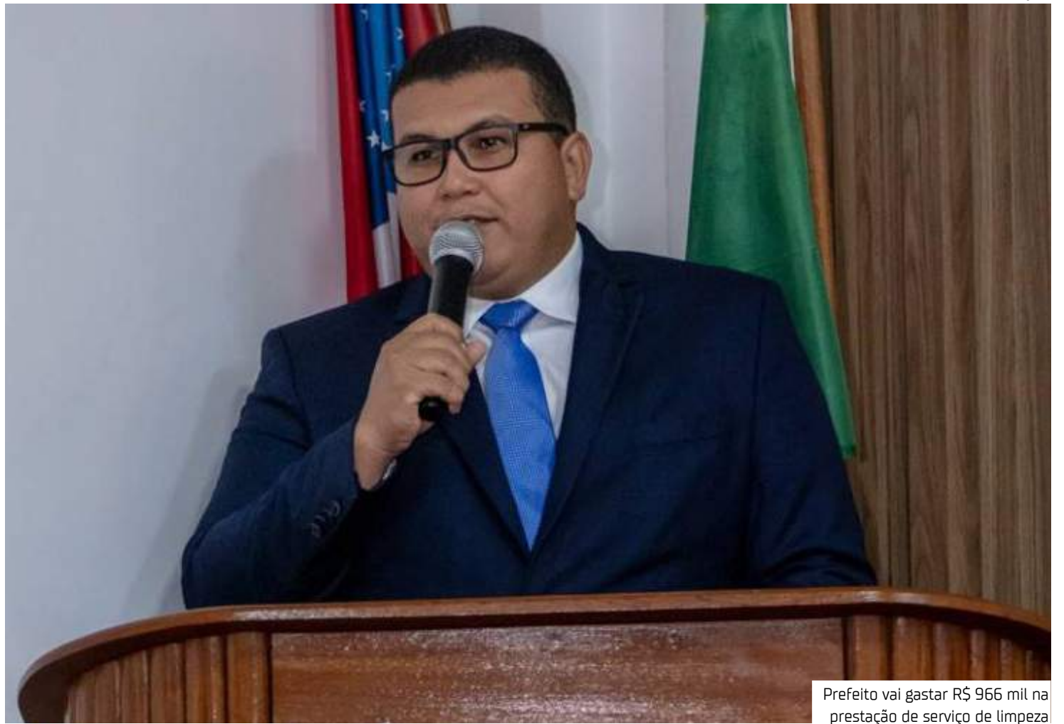
Prefeito vai gastar R$ 966 mil na prestação de serviço de limpeza

Segundo a publicação, o prefeito vai pagar R$ 27,41 por 7,5 mil serviços de controle de pragas do tipo afugentamento para combater pombos e morcegos, em área interna,