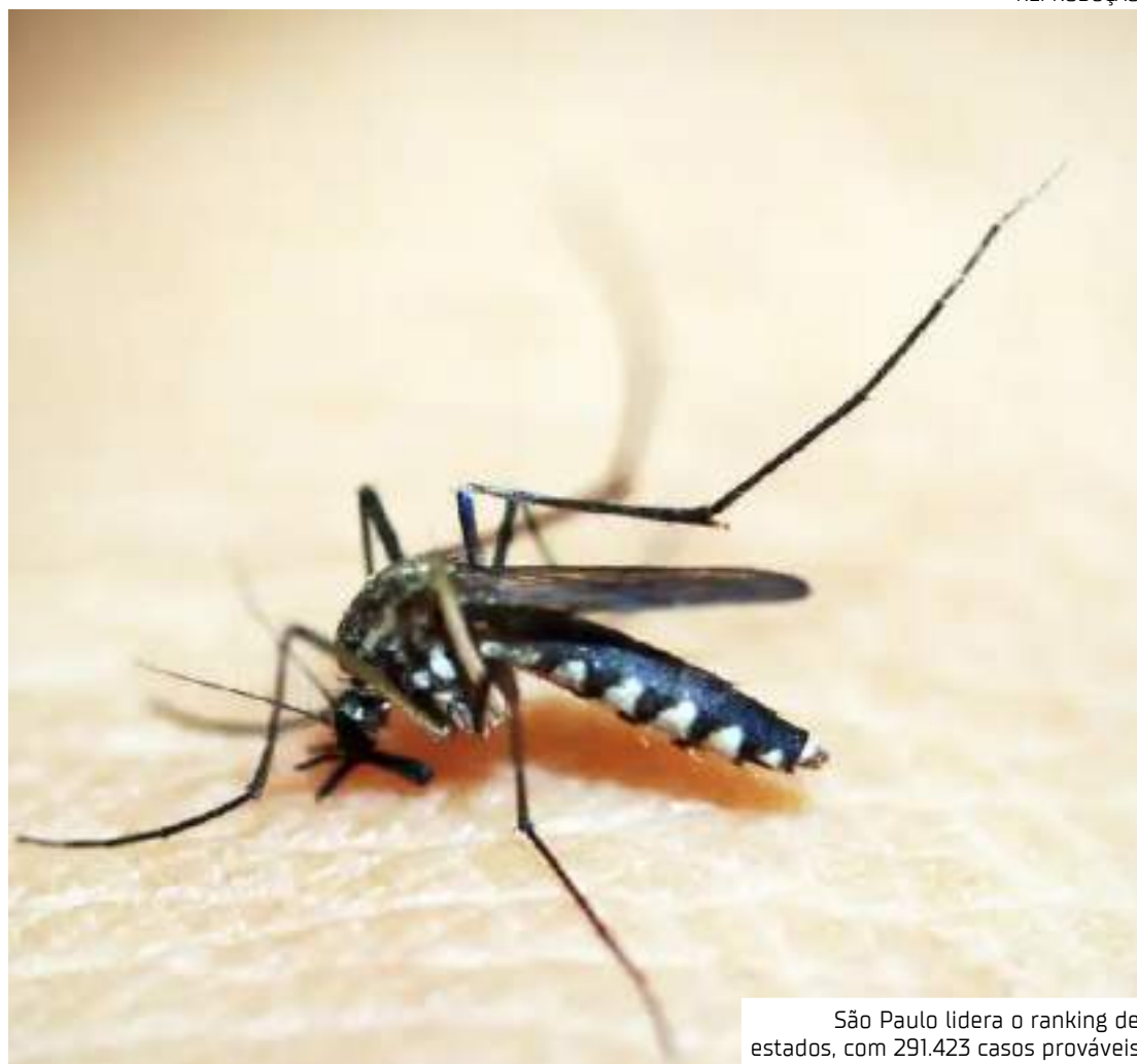
São Paulo lidera o ranking de estados, com 291.423 casos prováveis

Em nota, o Ministério da Saúde informou que, nos dois primeiros meses de 2025, o Brasil registrou uma redução de 69,25% nos casos prováveis de dengue em comparação com o mesmo período de 2024.