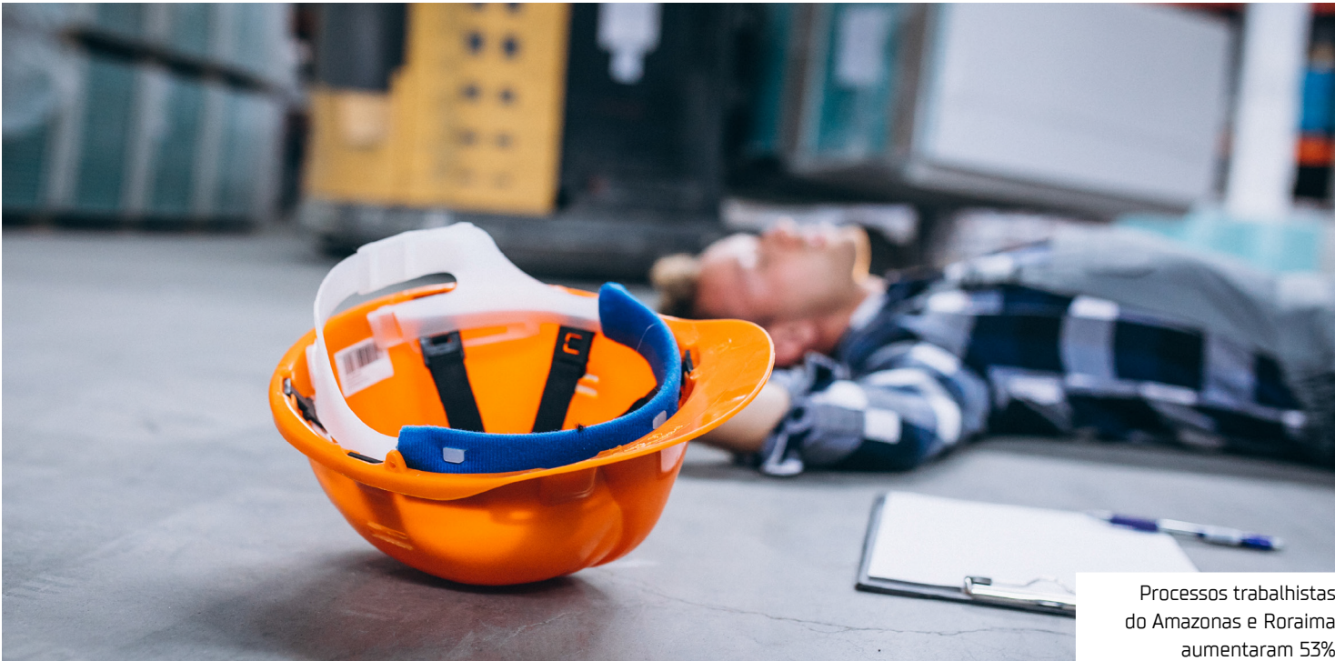
Processos trabalhistas do Amazonas e Roraima aumentaram 53%