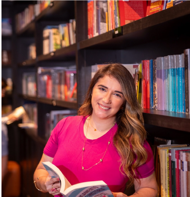
Obra conecta passado e presente com narrativa leve e reflexiva