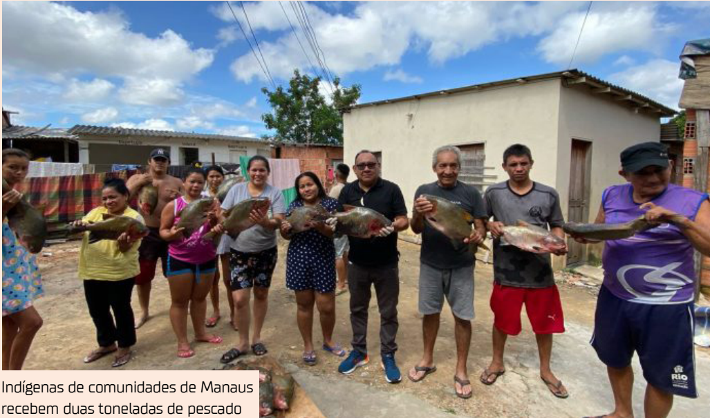
Indígenas de comunidades de Manaus recebem duas toneladas de pescado