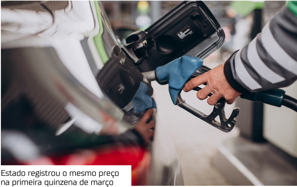
Estado registrou o mesmo preço na primeira quinzena de março