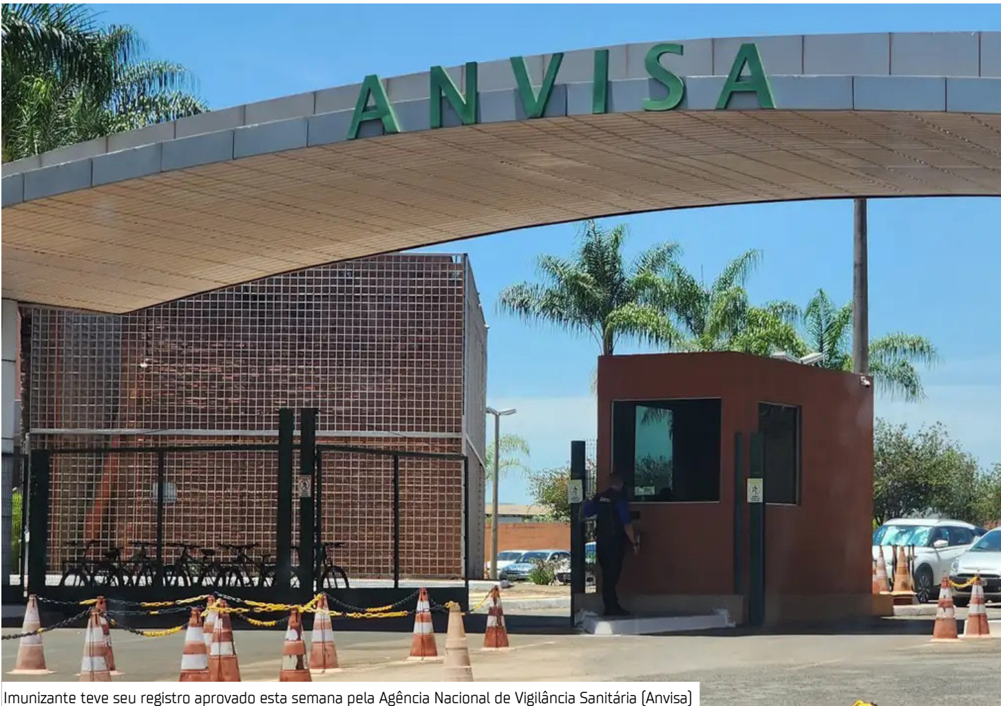
Imunizante teve seu registro aprovado esta semana pela Agência Nacional de Vigilância Sanitária (Anvisa)

será realizada na Alemanha, pela empresa IDT Biologika GmbH. Contudo, a transferência de tecnologia para o Instituto Butantan já está prevista, possibilitando a fabricação futura no Brasil.