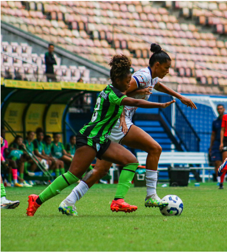
3B vem de derrota para o América-MG, na Arena da Amazônia, por 1 a 0, enquanto a Ferroviária-SP venceu o São Paulo pelo mesmo placar na Fonte Luminosa

As Feras da Amazônia buscam pontuar pela primeira vez no Brasileirão Feminino. Até aqui, foram quatro derrotas em quatro jogos para Fluminense, São Paulo, Flamengo e América-MG – os duelos contra Flu e Coelhas foram na Arena da Amazônia. O time amazonense é o único zerado na competição e já até trocou o comando técnico: Roberto Neves saiu e chegou o português Paulo Morgado.