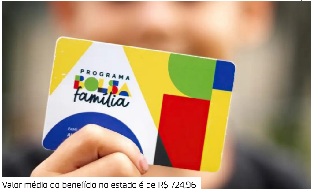
Valor médio do benefício no estado é de R$ 724,96

Mais de 645,5 mil famílias nos 62 municípios do Amazonas serão contempladas em abril com o Bolsa Família. Para isso, o investimento do Governo Federal no estado supera R$ 467,12 milhões, valor que garante um benefício médio de R$ 724,96. O cronograma de pagamentos teve início ontem (15), e segue até o dia 30, de acordo com o final do Número de Identificação Social – NIS (confira abaixo). No pacote de benefícios incluídos na retomada do programa desde 2023, mais de 350 mil crianças de zero a seis anos recebem o Benefício Primeira Infância no Amazonas neste mês. Isso significa um adicional de R$ 150 destinado a cada integrante dessa faixa etária na composição familiar. O in-