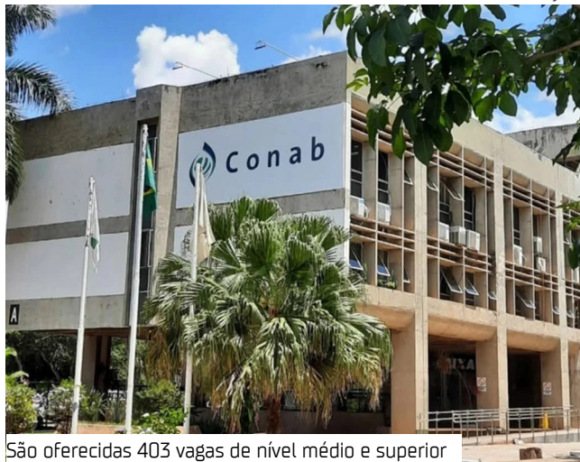
São oferecidas 403 vagas de nível médio e superior