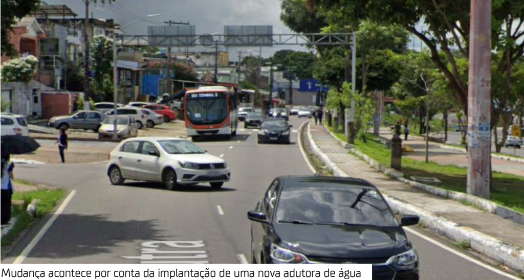
Mudança acontece por conta da implantação de uma nova adutora de água

Durante o período da obra, que inicia às 13h desta quinta-feira (17) e segue até às 18h da próxima segunda-