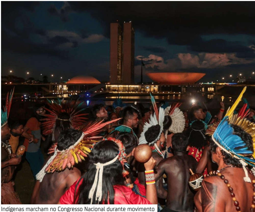
Indígenas marcham no Congresso Nacional durante movimento

Policiais militares e um grupo de indígenas entraram em confronto, hoje (15), durante uma operação de desocupação de área pública no Setor Noroeste, área nobre do Plano Piloto, em Brasília. Segundo a Polícia Militar, não há, até o início da tarde desta terça-feira, registro de feridos no local.