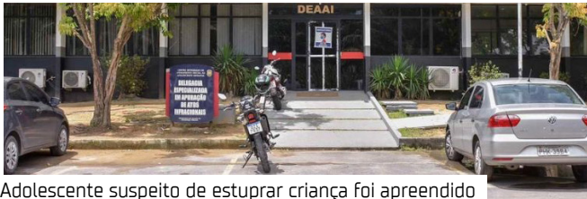
Adolescente suspeito de estupro de criança foi apreendido