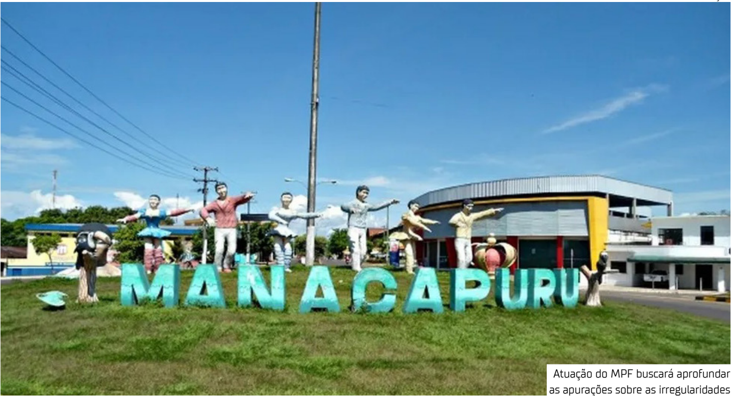
Atuação do MPF buscará aprofundar as apurações sobre as irregularidades