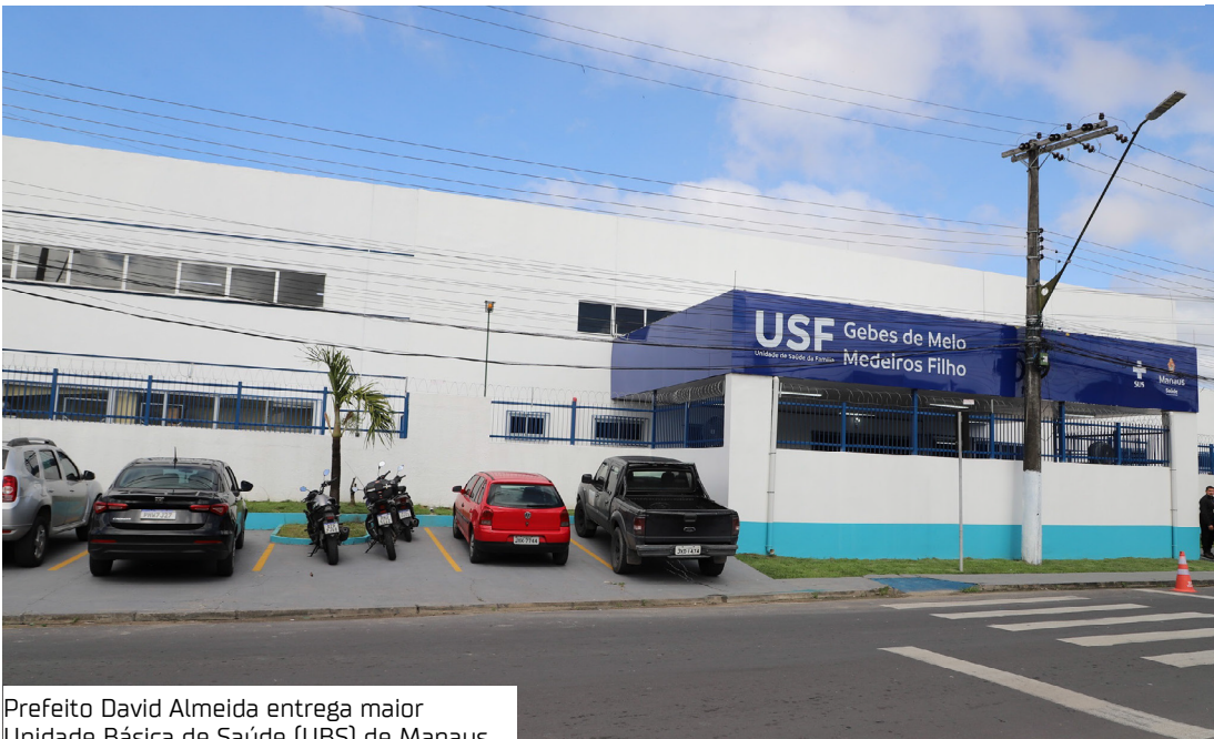
Prefeito David Almeida entrega maior Unidade Básica de Saúde (UBS) de Manaus

Com mais de R$3,8 milhões investidos, o prefeito de Manaus, David Almeida, reinaugurou, nesta terça-feira (15), a Unidade de Saúde da Família (USF) Gebes Medeiros, no bairro Jorge Teixeira I, Zona Leste da capital. A entrega marca a centésima obra concluída na área da saúde desde 2021, pela Secretaria Municipal de Saúde (Sems), reafirmando o compromisso da gestão atual com a melhoria dos serviços públicos e a qualidade de vida da população. Desde 2021, a Prefeitura de Manaus já entregou 100 obras na saúde, entre construções, reformas e ampliações. Desse total, 11 são unidades de grande porte — 10 delas de porte 4. Até o fim deste ano, mais cinco unidades serão reformadas, outras seis novas UBSs de porte 4 serão construídas, além de dois Centros de Atenção Psicossocial (Caps) e a novíssima Unidade de Atendimento Móvel de Urgência (Samu 192). "Quando a gente entra numa unidade, a gente não entra para