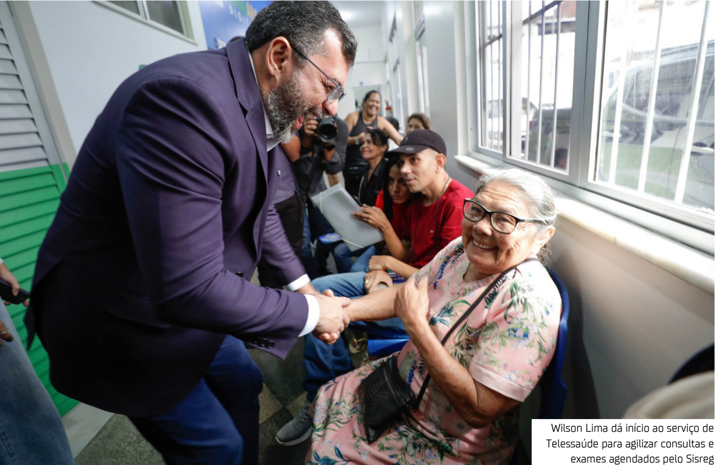
Wilson Lima dá início ao serviço de Telessaúde para agilizar consultas e exames agendados pelo Sisreg

unidades do Estado a contar com salas de Telessaúde onde, também, poderão ser realizadas Teleconsultas e serão feitos os Telelaudos.