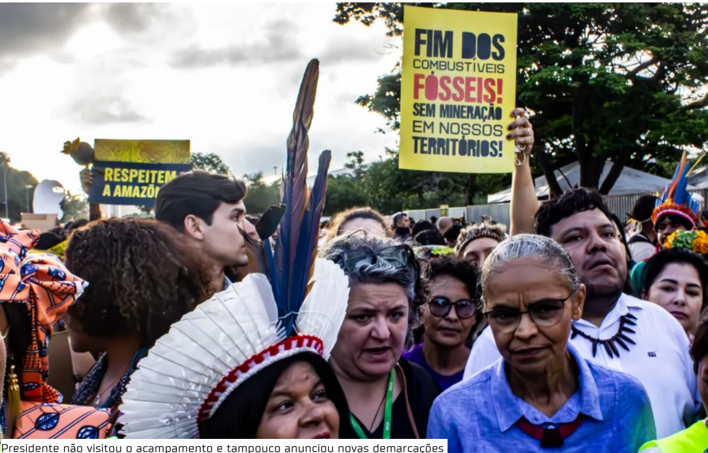
Presidente não visitou o acampamento e tampouco anunciou novas demarcações

Presidente Figueiredo reacende a discussão sobre a efetividade e a importância da cota de gênero como mecanismo para garantir maior representatividade feminina na política. A decisão do TRE-AM sublinha a necessidade de uma fiscalização rigorosa por parte da Justiça Eleitoral para coibir práticas que desvirtuem o espírito da lei.