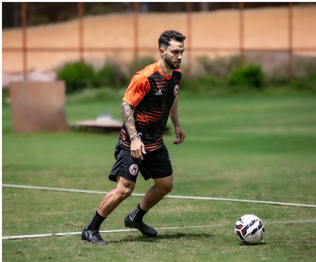
Meia de 31 anos é a 10ª contratação do clube para Série D