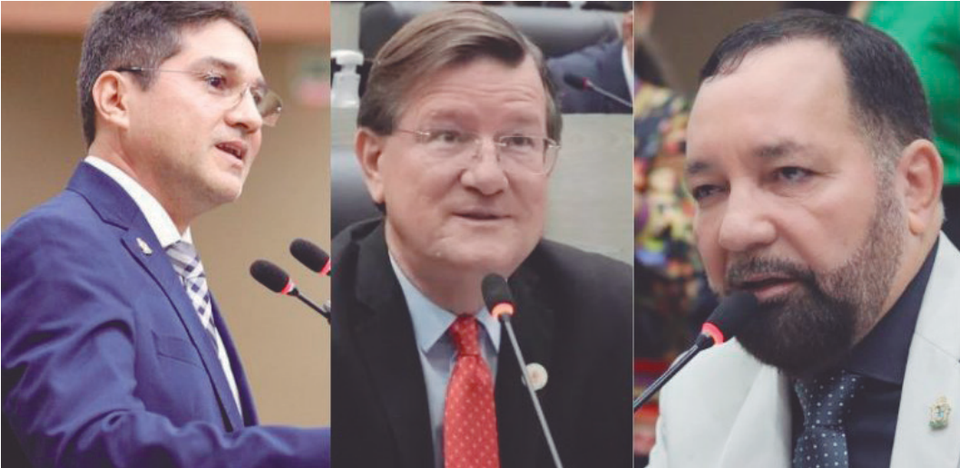
Impasse teve início quando a Mesa Diretora encerrou as votações sem realizar leitura de um PL

No plenário da CMM, a diretora-presidente destacou que o estudo é uma exigência legal, realizado anualmente, e tem como objetivo estimar os recursos necessários para garantir o pagamento dos benefícios previdenciários dos servidores municipais ao longo dos