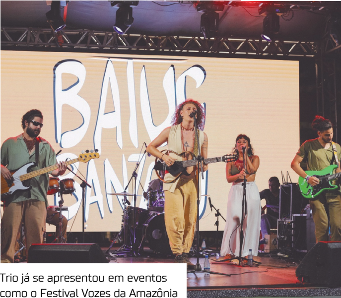
Trio já se apresentou em eventos como o Festival Vozes da Amazônia