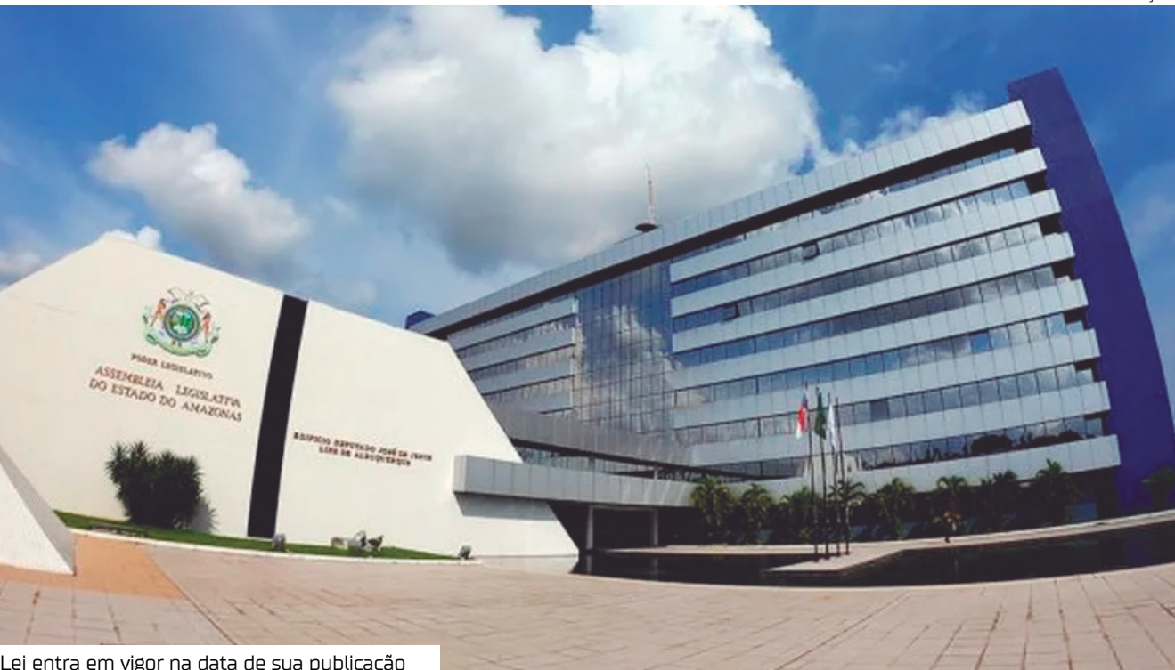
Lei entra em vigor na data de sua publicação

Em votação realizada ontem (23), a Assembleia Legislativa do Estado do Amazonas (Aleam) aprovou a proposta que reajusta o vencimento dos servidores ativos e inativos do órgão. A medida cumpre a data-base dos servidores do Poder Legislativo estadual.