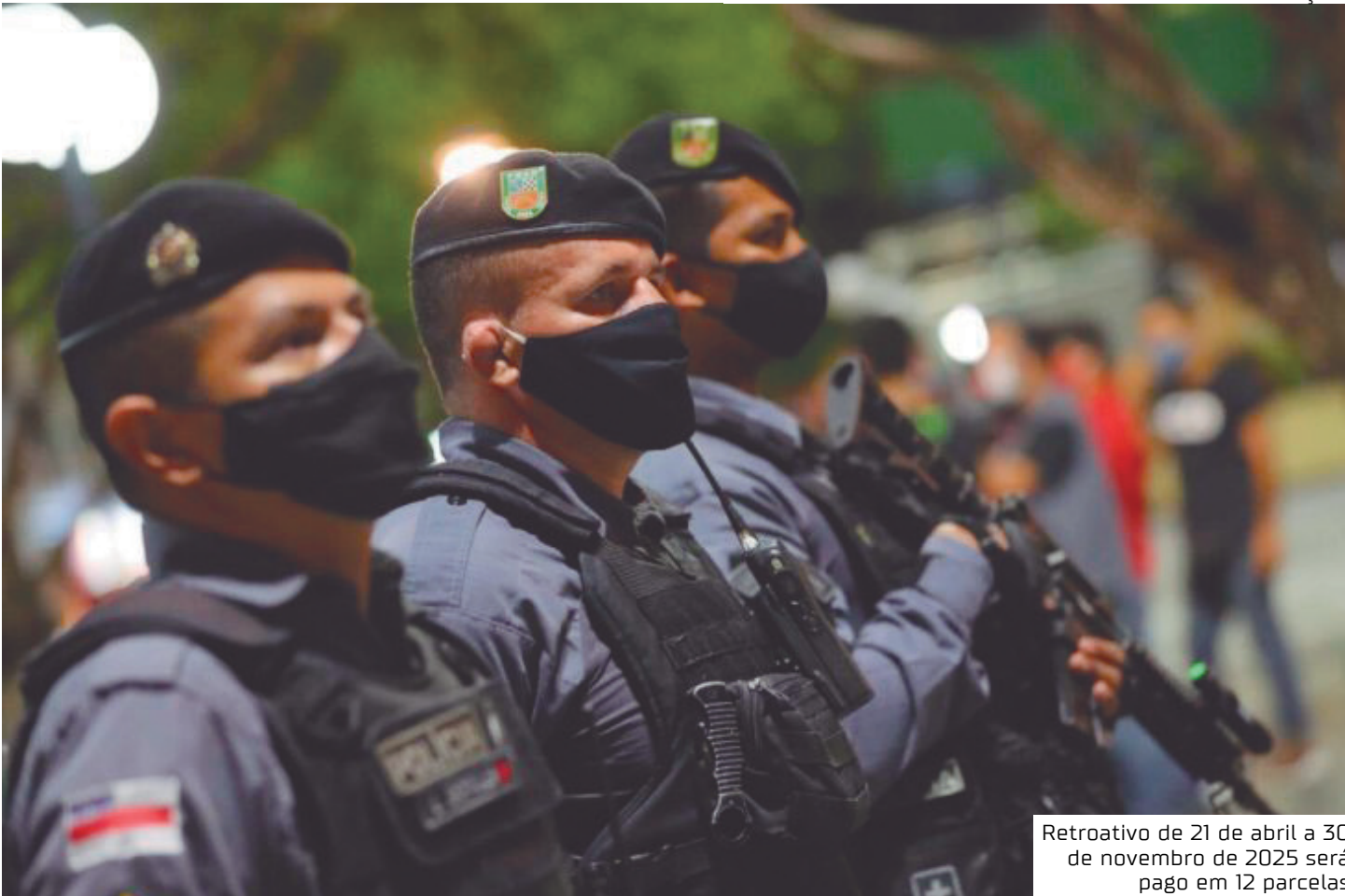
Retroativo de 21 de abril a 30 de novembro de 2025 será pago em 12 parcelas

Os valores constantes nas tabelas de remuneração e de indenização de compensação orgânica e atividade técnica da Polícia Militar e do Corpo de Bombeiros Militar serão reajustados em 3,93% a partir de 21 de abril de 2025, referente à data-base de 2024. Um novo reajuste de 5,48% será aplicado a partir da mesma data, cor-