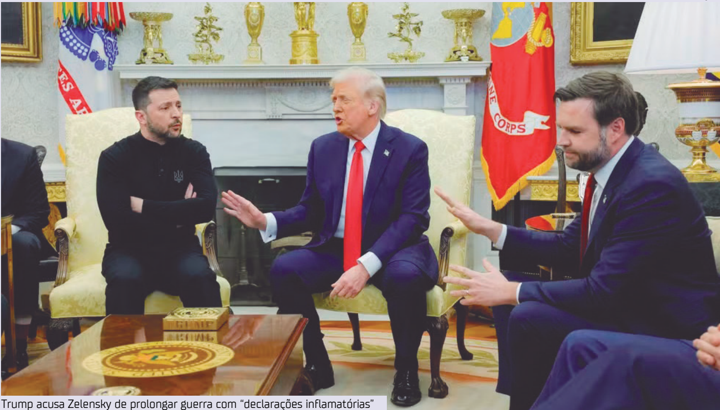
Trump acusa Zelensky de prolongar guerra com “declarações inflamatórias”

Obras garantidas pelo PAC Jader Filho também assegurou que o Novo Programa de Aceleração do Crescimento (PAC) terá recursos garantidos. “Não haverá falta de verba. Prefeitos, governadores e empresários podem tocar as obras com tranquilidade. Precisamos acelerar ainda mais esse processo”, reforçou. A lista completa dos 38 municípios beneficiados inclui Manaus e outras capitais como São Paulo, Rio de Janeiro, Salvador, Belém e Fortaleza.