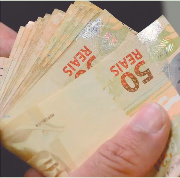
Trabalhadores podem enviar a documentação para liberação