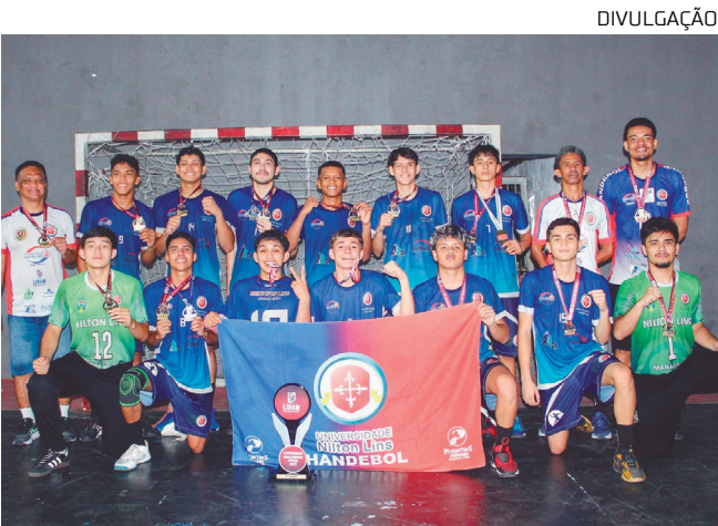
Equipe superou o HCM/Manauara na final e faturou o título