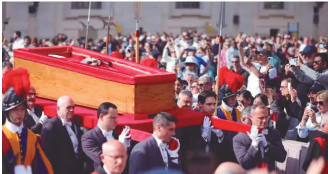
Pontífice está sendo velado na Basílica de São Pedro

está programada para as 7h e o fechamento à meia-noite. Amanhã (25), véspera do funeral, ela estará aberta das 7h às 19h. Sepultamento O Vaticano divulgou, nesta quarta, como será o enterro do papa Francisco. Segundo o comunicado, no sábado (26), ao final da missa de corpo presente, o caixão pontífice será levado até a Basílica Papal de Santa Maria Maggiore para o sepultamento. O rito será presidido pelo cardeal camerlengo, Kevin Farrell. Cardeais, outros membros da Igreja Católica, secretários de Francisco e convidados também participarão da cerimônia. O funeral, no sábado, está marcado para começar às 5h, horário de Brasília.