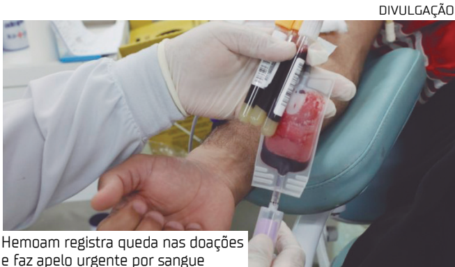
Hemoam registra queda nas doações e faz apelo urgente por sangue