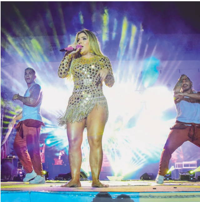
Artista leva o melhor do Tecnomelody à Arena da Amazônia

Manu Bahtidão desembarca em Manaus para uma noite inesquecível! Com seu estilo único, ela promete entregar o melhor do Tecnomelody para o público amazonense em um show que promete ser histórico. A apresentação faz parte da turnê de 20 anos da dupla Jorge e Mateus, que acontece neste sábado (26), na Arena da Amazônia. Os portões abrem às 20h.