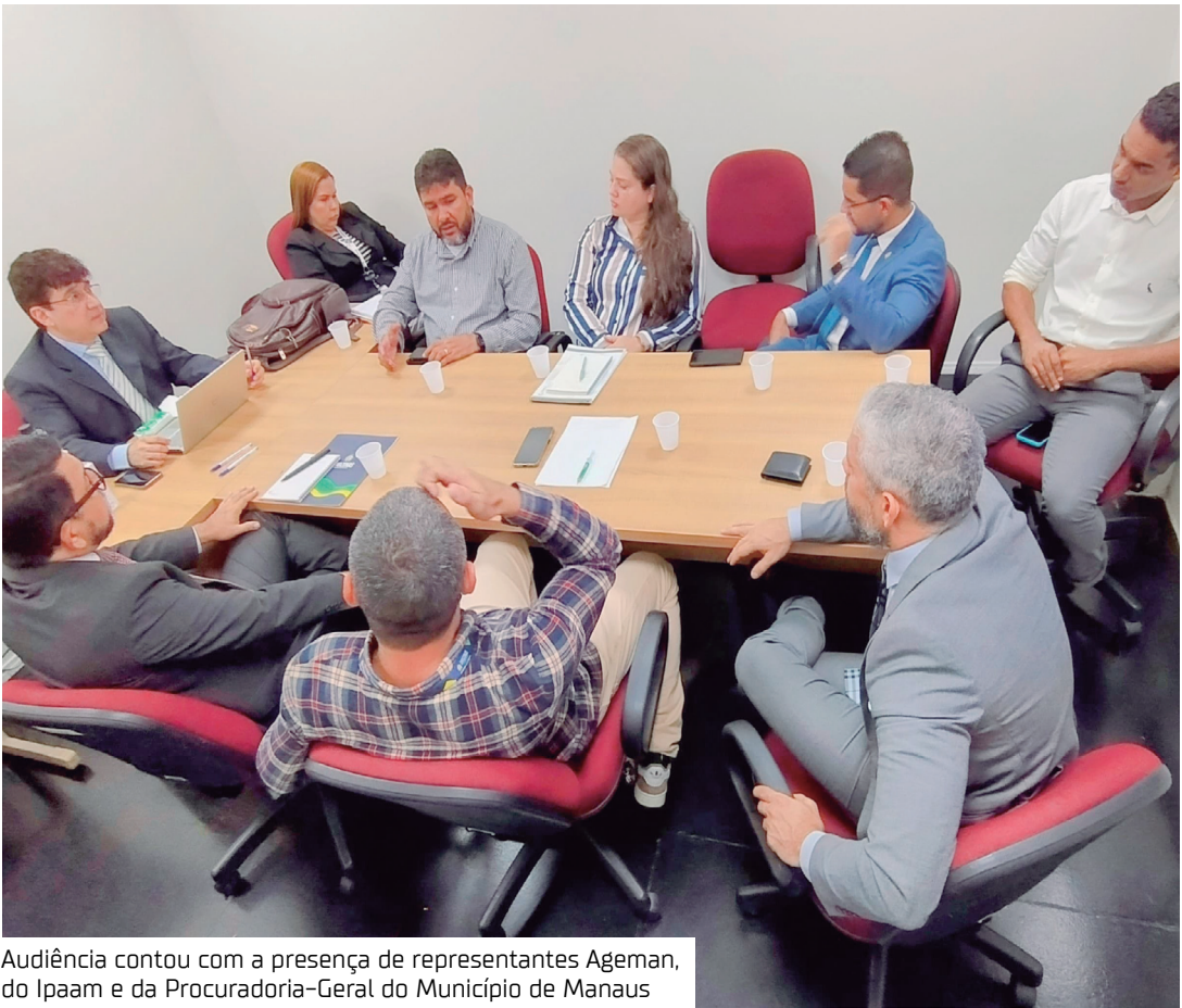
Audiência contou com a presença de representantes Ageman, do Ipaam e da Procuradoria-Geral do Município de Manaus