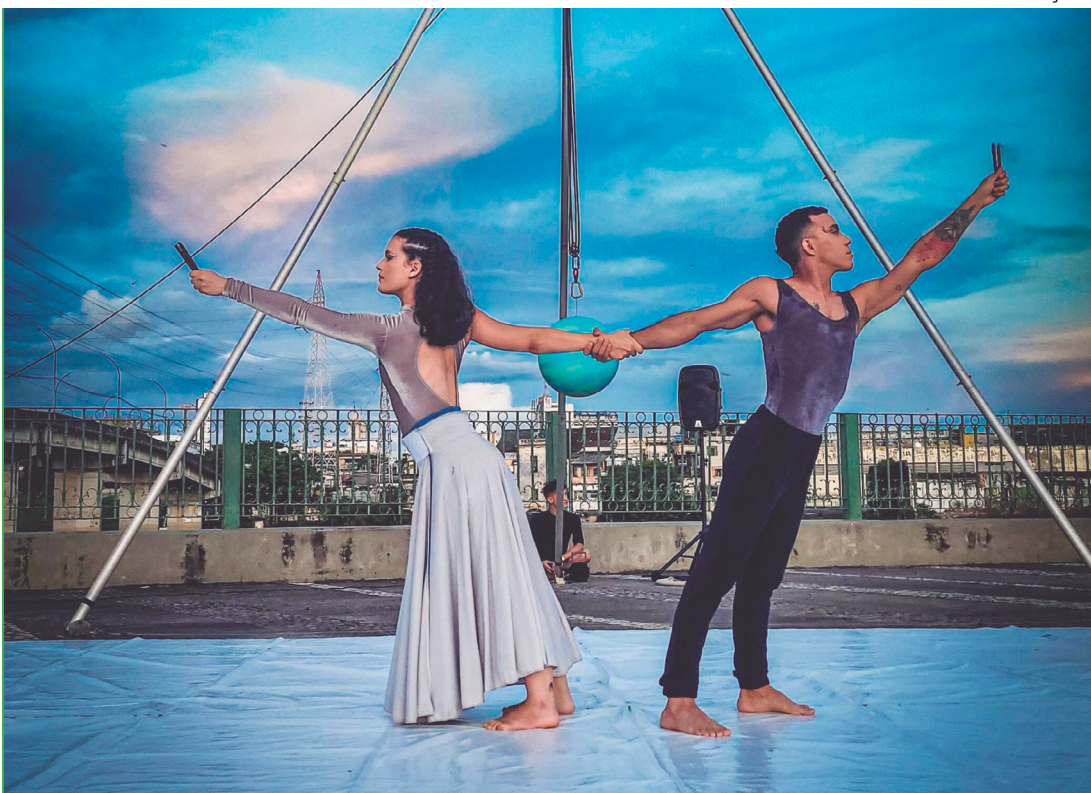
Projeto ofereceu duas oficinas práticas sobre técnicas circenses para estudantes universitários

Além das apresentações, o projeto ofereceu duas oficinas práticas sobre técnicas circenses para estudantes universitários. Com aulas de acrobacia de solo e tecido acrobático, as oficinas buscaram despertar o interesse pela linguagem do circo, for-