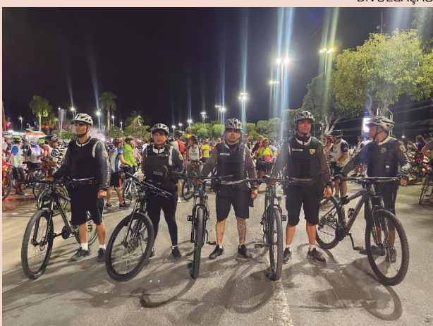
Evento da Ciclopatrulha ocorre no dia 30