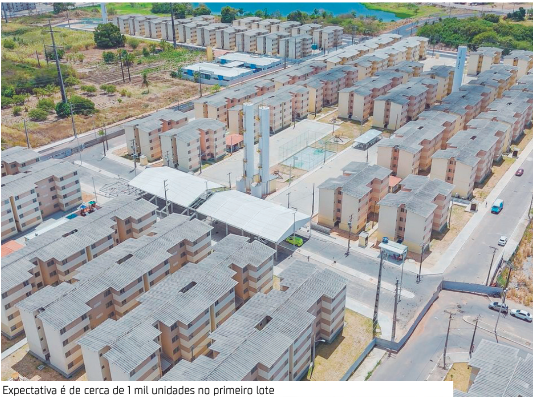
Expectativa é de cerca de 1 mil unidades no primeiro lote

O Programa Minha Casa, Minha Vida (MCMV) vai destinar 3% das moradias subsidiadas pelo Fundo de Arrendamento Residencial (FAR) a pessoas em situação ou trajetória de rua. A medida, anunciada pelo ministro das Cidades, Jader Filho, garante que os imóveis serão gratuitos, com direito a acompanhamento e ações de reinserção social dos beneficiários. A expectativa é que cerca de mil unidades habitacionais sejam ofertadas neste primeiro lote, contemplando 38 cidades brasileiras. Manaus está entre os municípios selecionados, ao lado de todas as capitais e outras cidades com mais de mil pessoas cadastradas como “sem moradia” no CadÚnico. “Essas cidades têm a obrigação de destinar, no mínimo, 3% de todos os empre-