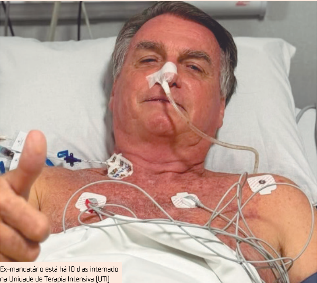
Ex-mandatário está há 10 dias internado na Unidade de Terapia Intensiva (UTI)

O STF decidiu em março tornar Bolsonaro e outros sete réus no inquérito sobre tentativa de golpe. São eles: Alexandre Ramagem, Almir Garnier Santos, Anderson Torres, Mauro Cid, Paulo Sérgio Nogueira e Walter Braga Netto. Foram imputados a eles os crimes de abolição violenta do estado democrático de direito; golpe de estado; organização criminosa; dano qualificado e deterioração de patrimônio tombado.