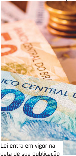
Lei entra em vigor na data de sua publicação