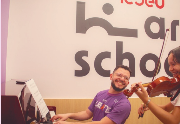
Novo espaço oferece cursos em dança, música, teatro e artes visuais

O Instituto Cultural Brasil Estados Unidos (ICBEU Manaus) inaugura, no dia 14 de abril, uma nova escola de artes na unidade localizada na Avenida Joaquim Nabuco, no Centro da capital. A proposta amplia as ações de arte educação desenvolvidas pela instituição, que desde 2022 vem incorporando cursos de tecnologia e artes ao seu tradicional ensino da língua inglesa.