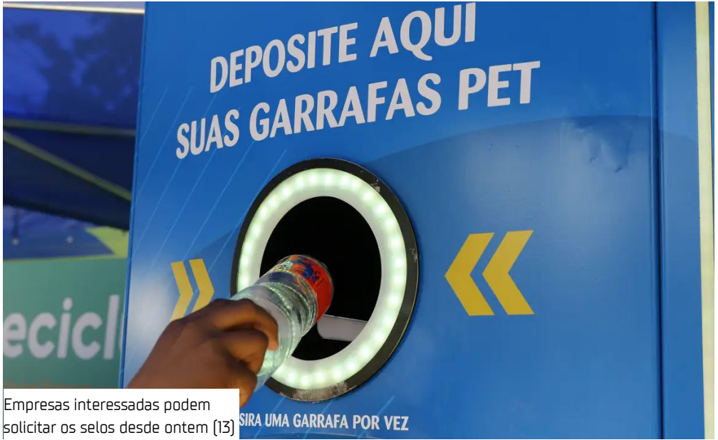
Empresas interessadas podem solicitar os selos desde ontem (13)

A Agência Brasileira de Desenvolvimento Industrial (ABDI) e a Associação Brasileira da Indústria do Plástico (Abiplast) lançaram, nesta semana, dois selos de rastreamento de materiais plásticos. O lançamento ocorreu durante o encontro Circularidade e Inovação – o Futuro do Conteúdo Reciclado em Produtos Plásticos, ontem (13), em São Paulo. O Selo de Conteúdo Reciclado é voltado para marcas e indústrias que utilizam plástico reciclado em seus produtos. Já o Selo de Rastreabilidade é direcionado a empresas recicladoras e transformadoras de plástico que querem oferecer o rastreabilidade de seus produtos aos seus clientes. As empresas interessadas já podem solicitar os selos