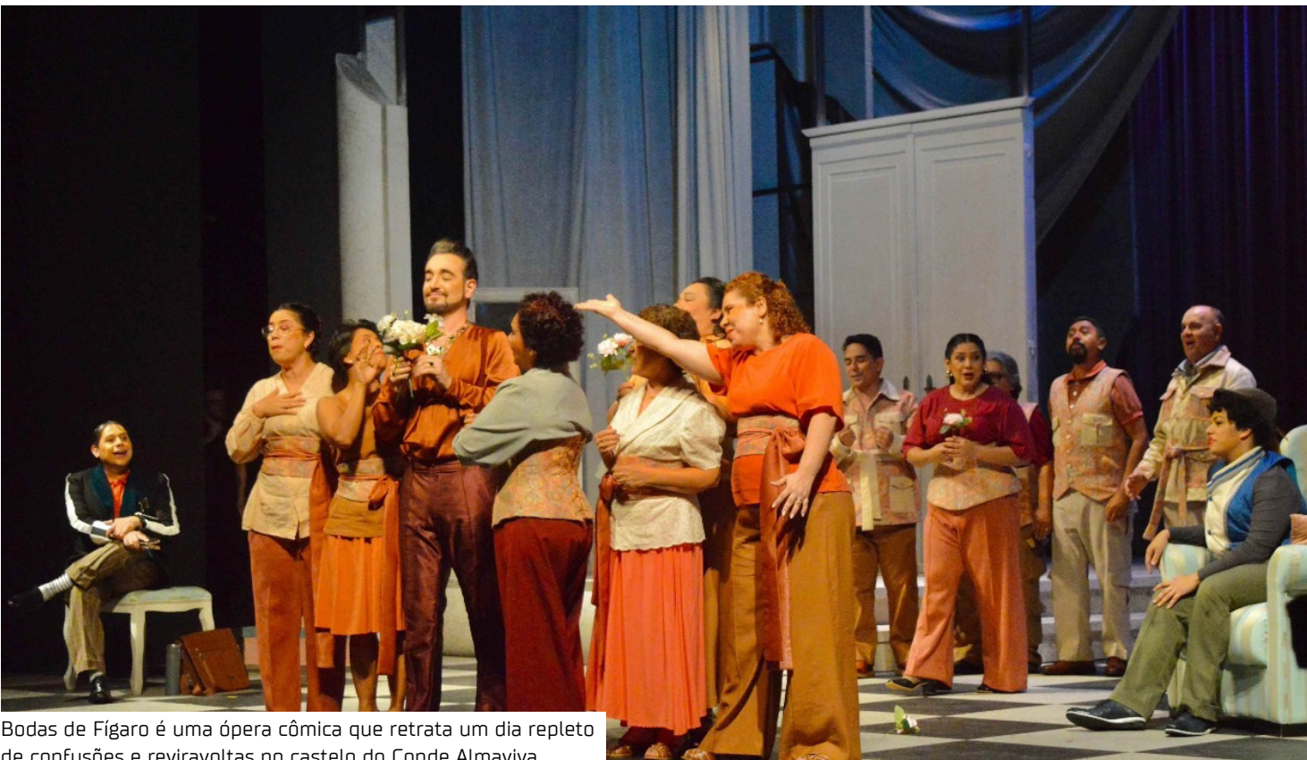
Bodas de Fígaro é uma ópera cômica que retrata um dia repleto de confusões e reviravoltas no castelo do Conde Almaviva