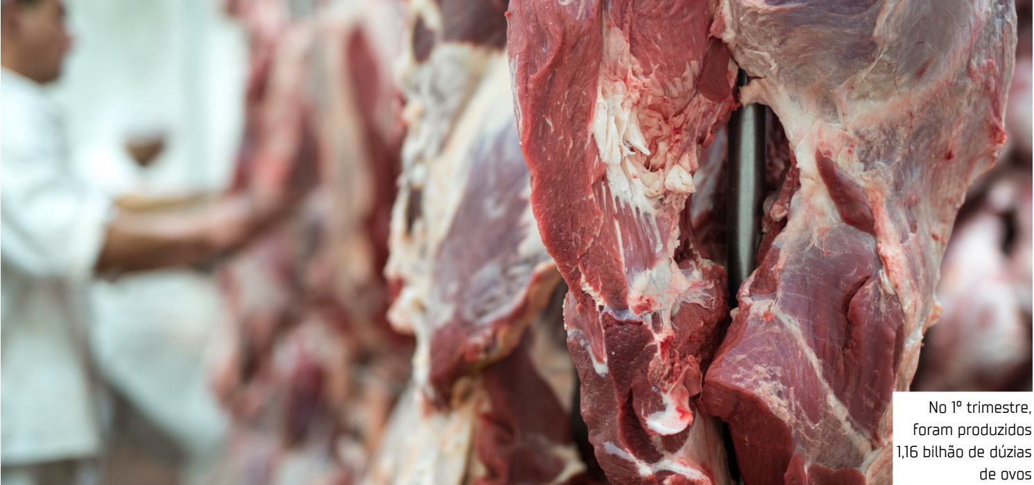
No 1º trimestre, foram produzidos 1,16 bilhão de dúzias de ovos

imediatamente anterior, somando 10,08 milhões de peças inteiras de couro cru inteiro de bovino. No 1º trimestre de 2025, foram produzidos 1,16 bilhão de dúzias de ovos de galinha, um incremento de 5,6% em relação ao mesmo período do ano anterior e redução de 3,2% em comparação ao 4º trimestre de 2024. Bovinos No 1º trimestre de 2025, foram abatidas 9,71 milhões de cabeças de bovinos sob algum tipo de serviço de inspeção sanitária. Comparado ao mesmo período do ano anterior, esse número representa uma variação positiva de 3,8% e, em relação ao 4º trimestre de 2024, o aumento foi de 1,5%. A produção de 2,45 milhões de toneladas de carcaças bovinas no 1º trimestre de 2025 teve um incremento de 1,6% em relação ao mesmo trimestre do ano anterior e queda de 2,0% em relação ao apurado no 4º trimestre de 2024. Suínos Foram abatidas 14,25 milhões de cabeças de suínos, no 1º trimestre de 2025, re-