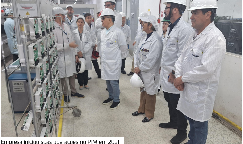
Empresa iniciou suas operações no PIM em 2021

A Suframa visitou ontem (13) a planta da Nansen no Polo Industrial de Manaus (PIM), localizada na avenida Abiurana, bairro Distrito Industrial, zona Sul da capital amazonense. Uma das mais tradicionais fabricantes de medidores de energia elétrica do mundo, a Nansen é provedora de tecnologia e soluções completas focadas em Smarts Grids, infraestrutura para mobilidade elétrica e geração de energia elétrica e solar. A empresa iniciou suas operações no PIM em 2021 com 500 colaboradores e, hoje, já conta com 950 funcionários trabalhando em três turnos de produção. Com capacidade produtiva de sete milhões de medidores por ano, a Nansen atua principalmente nas unida-