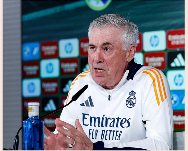
Técnico falou pela primeira vez após anúncio da CBF