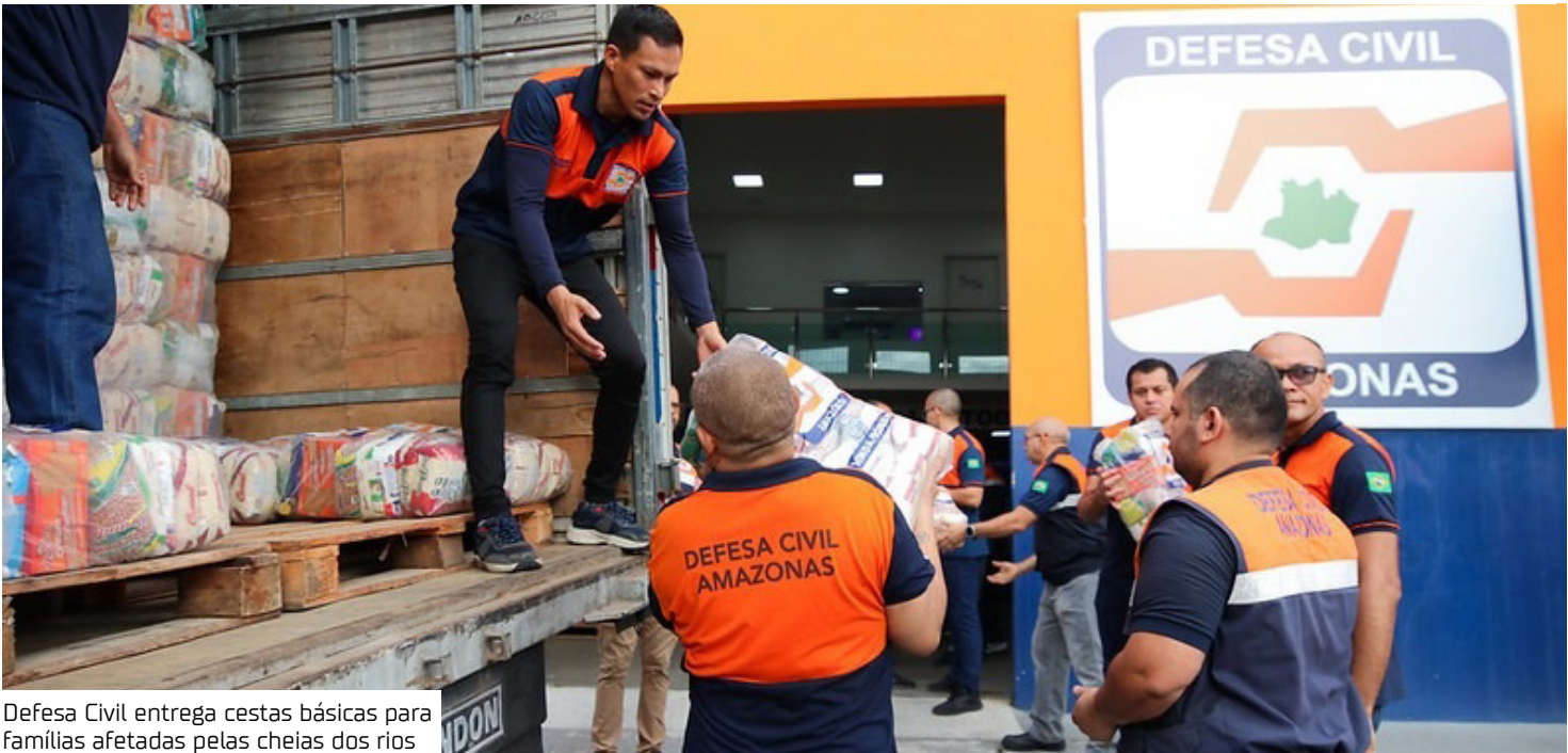
Defesa Civil entrega cestas básicas para famílias afetadas pelas cheias dos rios

O Governo do Estado já injetou 250 toneladas em cestas básicas, 600 caixas d'água de 500 litros, 46.518