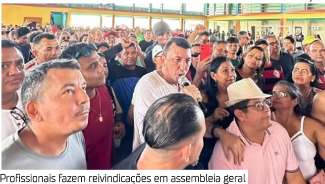
Profissionais fazem reivindicações em assembleia geral

o evento reuniu milhares de trabalhadores no Clube dos Subtenentes, no bairro de Flores, Zona Norte da capital, para deliberar sobre as pautas da categoria. Segundo o diretor do sindicato, Carles Waldemar, os trabalhadores reivindicam aumento salarial, reajuste no valor do vale-alimentação, entre outros benefícios. A categoria também aprovou uma mudança na convenção coletiva para que o empregador passe a fornecer vale-combustível — uma vez que o vale-transporte não atende às necessidades de quem possui veículo próprio.