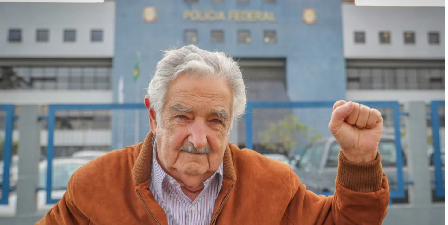
Mujica era conhecido como “presidente mais pobre do mundo”, por seu estilo de vida simples

cebido diagnóstico de câncer no esôfago. Desde então, passou a ter uma vida mais reclusa, com raras aparições. Ele vivia em uma chácara nos arredores de Montevideu. O tumor acabou se espalhando para outras partes do corpo, e Mujica vinha fazendo tratamento paliativo nos últimos tempos, segundo declarou sua esposa, Lucia Topolansky, ao jornal uruguaio La Diaria. De acordo com ela, o ex-presidente estava em estágio terminal e recebendo conforto por parte da equipe médica. Por causa das condições de saúde, Pepe não chegou a ir votar nas eleições regionais do país, realizadas no último domingo (11). Mujica presidiu o Uruguai de 2010 a 2015. Ele era conhecido como “presidente mais pobre do mundo”, por seu estilo de vida simples. Dirigia um fusca dos anos 1970 e doava parte do salário para projetos sociais. Também ficou marcado pelas reflexões políticas com forte teor filosófico. Defensor da integração dos