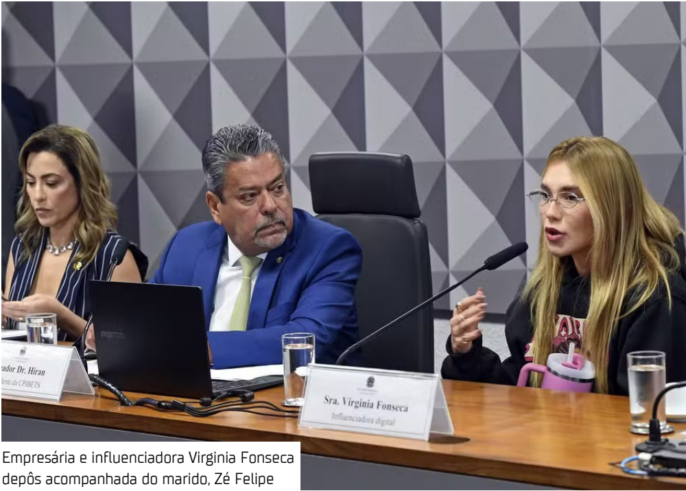
Empresária e influenciadora Virginia Fonseca após acompanhada do marido, Zé Felipe

Virginia poderia ficar em silêncio depois de conseguir o benefício no Supremo Tribunal Federal (STF). Porém, o silêncio só é permitido em questões que ela julgar que possam incriminá-la. De acordo com a decisão do ministro Gilmar Mendes, além de ficar em silêncio, a influenciadora será assistida por advogado durante todo o depoimento e deverá “ser inquirida com dignidade”, vedada sua submissão a constrangimentos, em especial ameaças de prisão ou de processo, caso exerça os direitos explicitados.