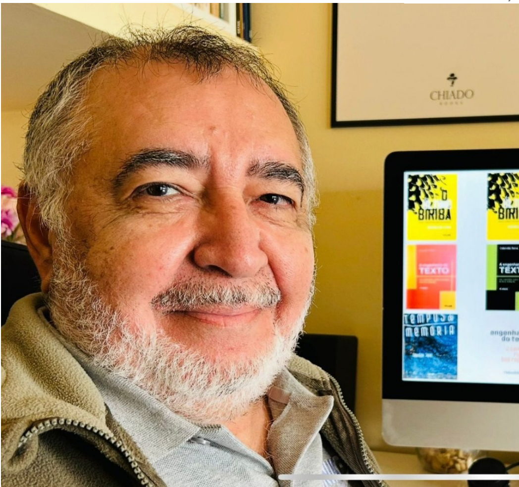
Após oito anos longe de Manaus, autor retorna para lançamento do livro

O livro “Memórias de menino” já está à venda na Livraria Valer, com desconto especial até o dia do lançamento, quando o autor estará presente em sessão de autógrafos.