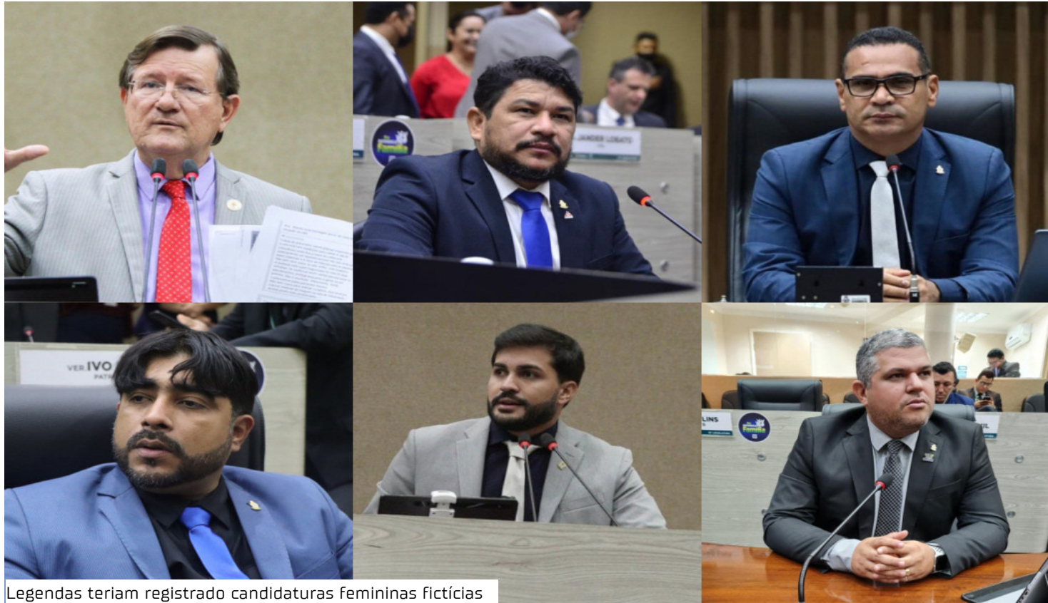
Legendas teriam registrado candidaturas femininas fictícias