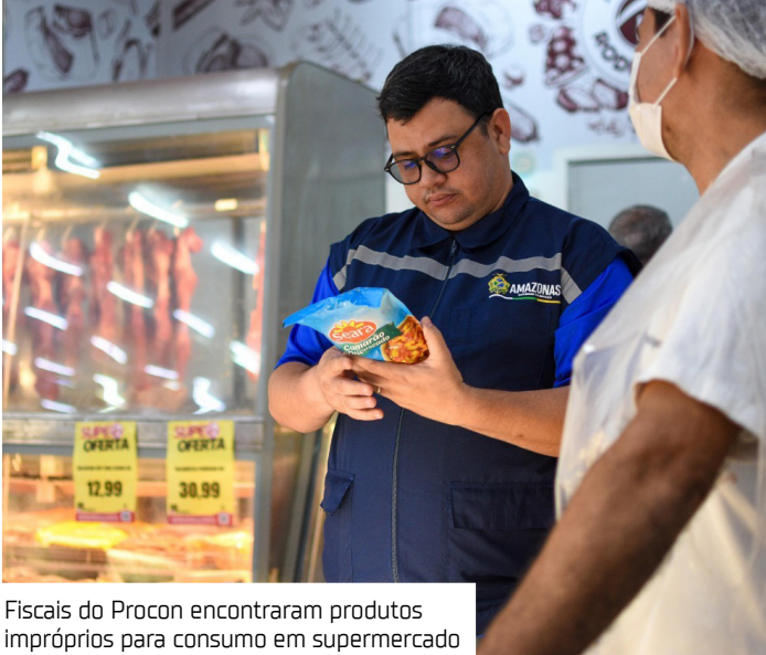
Fiscais do Procon encontraram produtos impróprios para consumo em supermercado

Durante a fiscalização, os agentes do Procon-AM identificaram diversos alimentos com embalagens violadas, mal condicionadas, vencidas ou com prazos de validade ilegíveis. Foram apreendidos itens como linguiça, calabresa, frango, carne bovina, sal-sicha, além de produtos enlatados e congelados, totalizando mais de 46 kg.