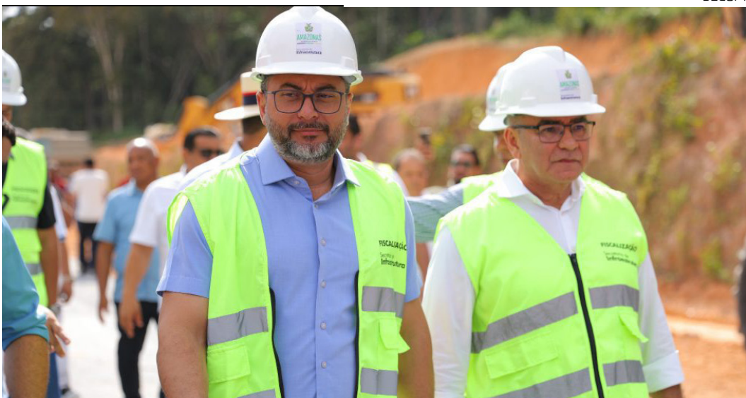
Frentes de obra iniciam no quilômetro 42, onde são executados serviços de terraplenagem

“Essa obra eu considero a mais importante do Amazonas,