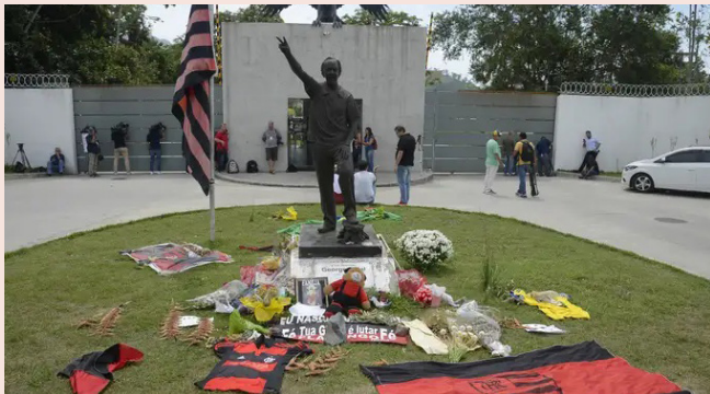
Tragédia de 2019 deixou dez adolescentes mortos e três feridos