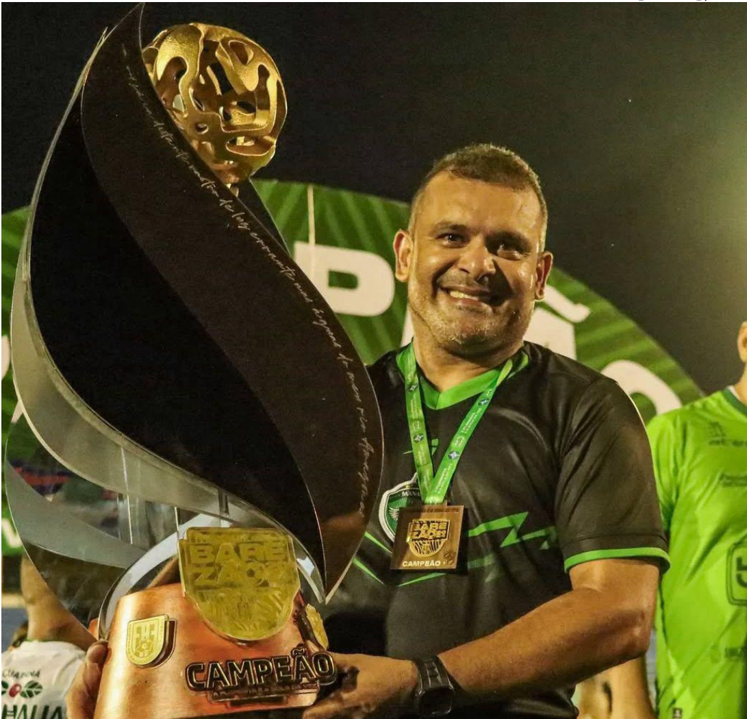
Técnico foi campeão do Campeonato Amazonense de 2024 pelo Gavião Real

“Muito feliz de estar retornando ao Manaus, uma equipe onde fui muito feliz em 2024. Então estou muito esperançoso, muito alegre com esse retorno. Esperamos concluir esse ano de 2025 com o acesso à Série C. Eu acho que o Manaus tem totais condições de primeiro se classificar e de-