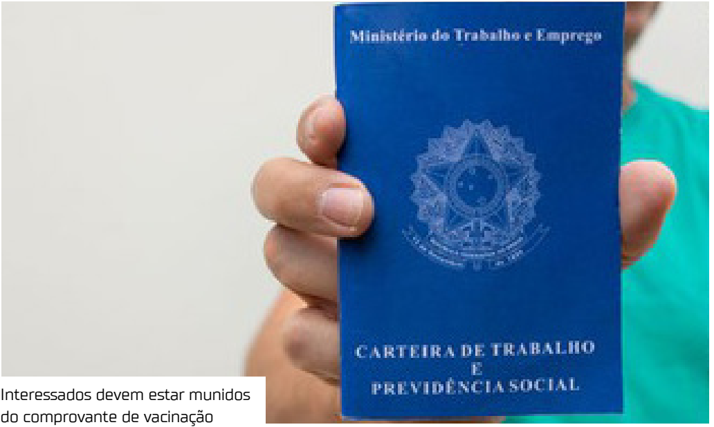
Interessados devem estar munidos do comprovante de vacinação

pecialmente ao finalizarem novas qualificações. Para vagas específicas, podem ser solicitados documentos adicionais, como cursos ou certificações, por isso, é essencial estar atento aos "Requisitos Obrigatórios" de cada vaga. A Semtepi ressalta que, obedecendo ao disposto no artigo 5º, da Constituição Federal, e ao artigo 373-A, da Consolidação das Leis Trabalhistas (CLT), critérios referentes a sexo, idade, cor ou situação familiar, não podem ser informados na divulgação das vagas disponibilizadas. Os candidatos devem estar cientes das diretrizes de vestimenta estabelecidas pelo órgão.