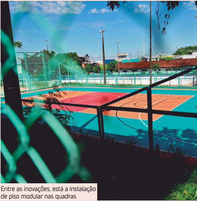
Entre as inovações, está a instalação de piso modular nas quadras