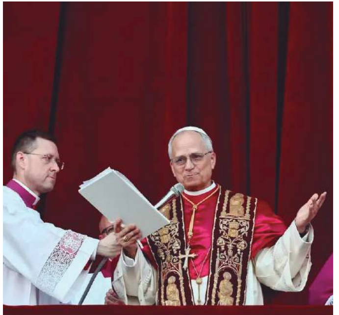
Cerimônia marca início do pontificado do recém-eleito líder católico

Em seguida, segundo comunicado publicado pela Santa Sé, o novo pontífice começou a ler um texto previamente preparado em que refletiu sobre uma frase que Simão Pedro dirige a Jesus, contida no capítulo 16 do Evangelho de Mateus: “Tu és o Cristo, o Filho do Deus vivo”.