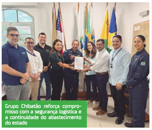
Grupo Chibatão reforça compromisso com a segurança logística e a continuidade do abastecimento do estado