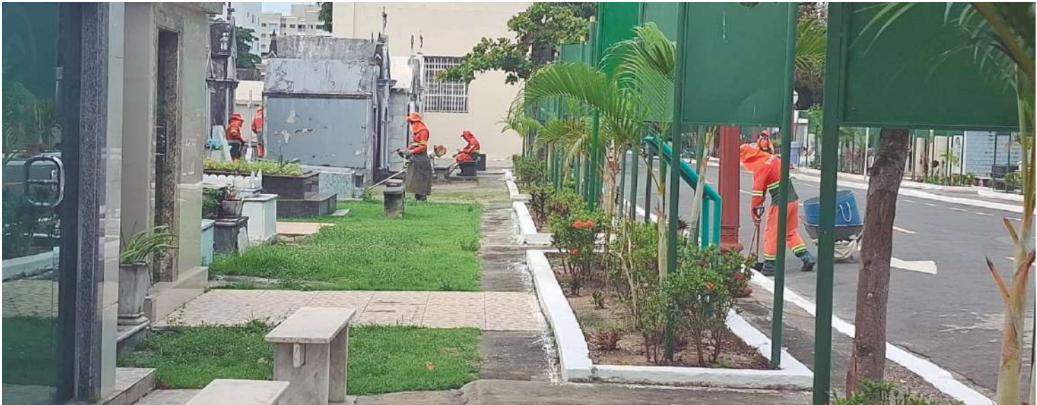
Dia das mães é a segunda data de maior visitação anual aos campos-santos da cidade