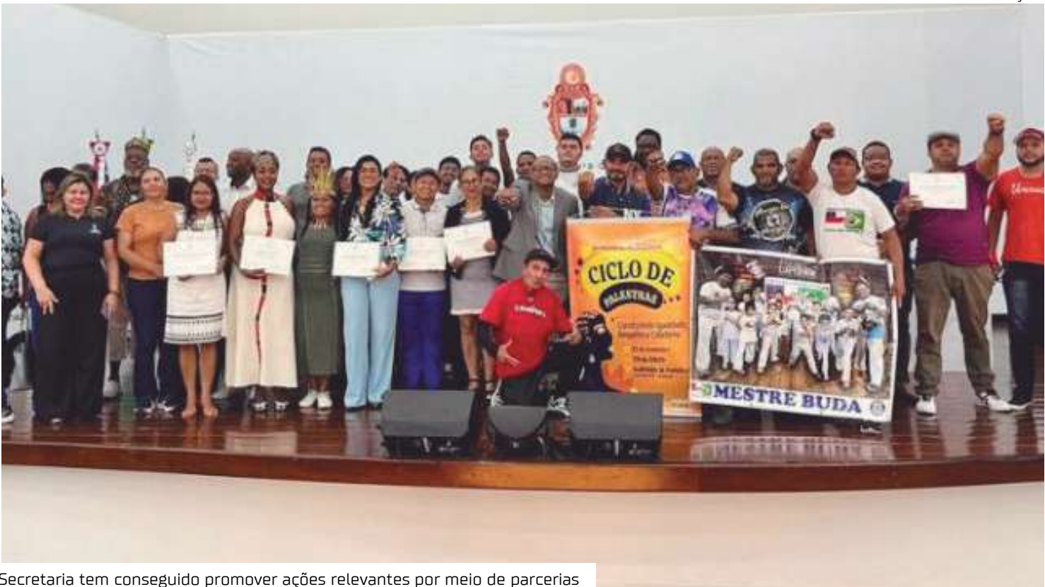
Secretaria tem conseguido promover ações relevantes por meio de parcerias