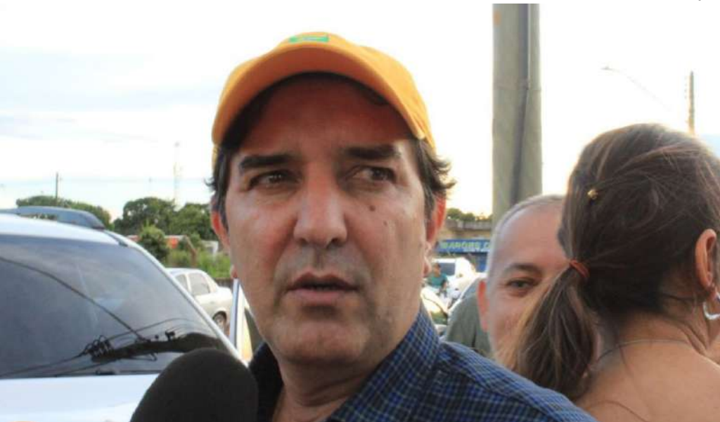
Informação consta no Diário Oficial da Associação Amazonense de Municípios