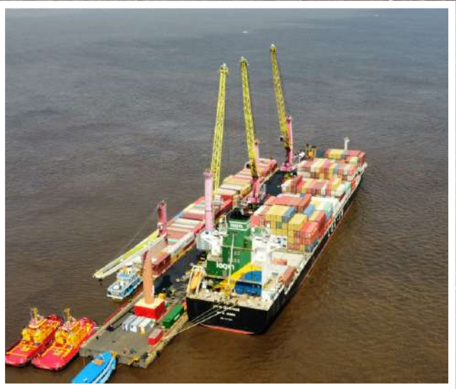
Pier reforça o modelo de antecipação iniciado com sucesso em 2024

A Marinha do Brasil autorizou oficialmente a operação emergencial do píer flutuante provisório do Grupo Chibatão no município de Itacoatiara, como parte das ações preventivas para enfrentar os desafios logísticos da estiagem prevista para 2025. Em reunião com o Capitão dos Portos da Amazônia Ocidental, André Carvalhaes, na Capitania Fluvial, no qual a autoridade marítima autorizou à instalação da estrutura — reconhecendo sua compatibilidade com a segurança da navegação e o ordenamento do espaço aquaviário.