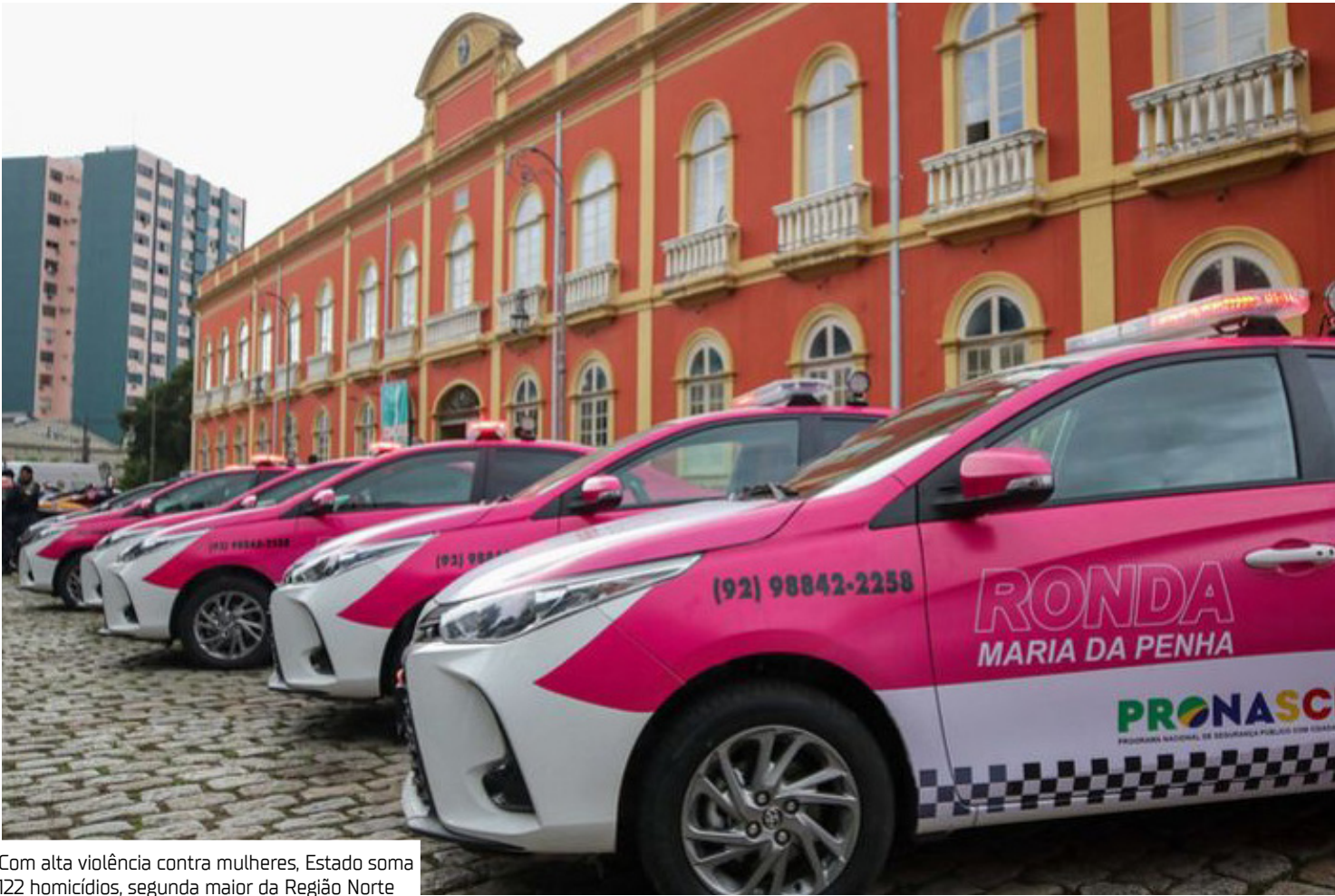
Com alta violência contra mulheres, Estado soma 122 homicídios, segunda maior da Região Norte

sido apontado como espaço de risco contínuo para mulheres. Quando observado de modo geral, no Brasil, 35% dos assassinatos de mulheres ocorreram dentro de casa em 2023, percentual usado como indicador aproximado de feminicídio — já que o sistema de saúde não distingue essa categoria específica de homicídio.