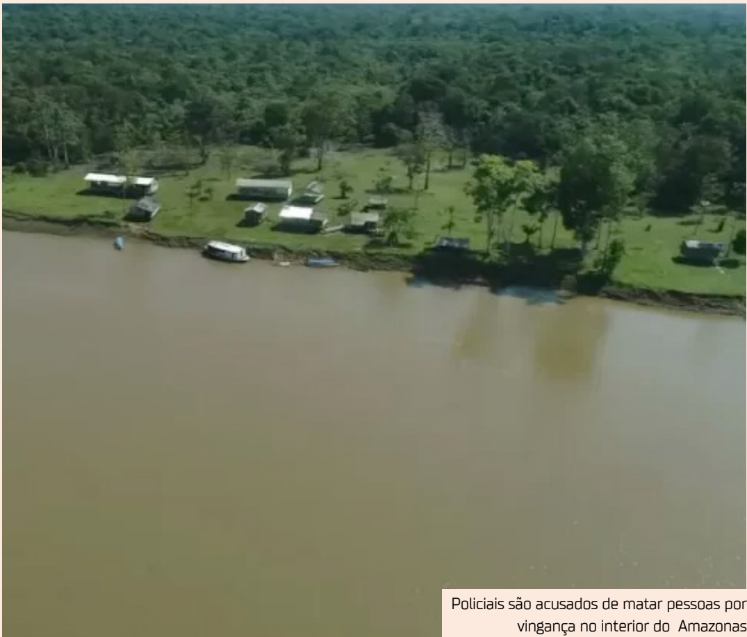
Policiais são acusados de matar pessoas por vingança no interior do Amazonas

O MPF requer a condenação dos réus, a perda dos cargos públicos e pagamento de indenizações. Para as famílias das vítimas de homicídio, o valor mínimo pedido é de R$ 500 mil. Para o caso de tortura, a indenização requerida é de R$ 100 mil.