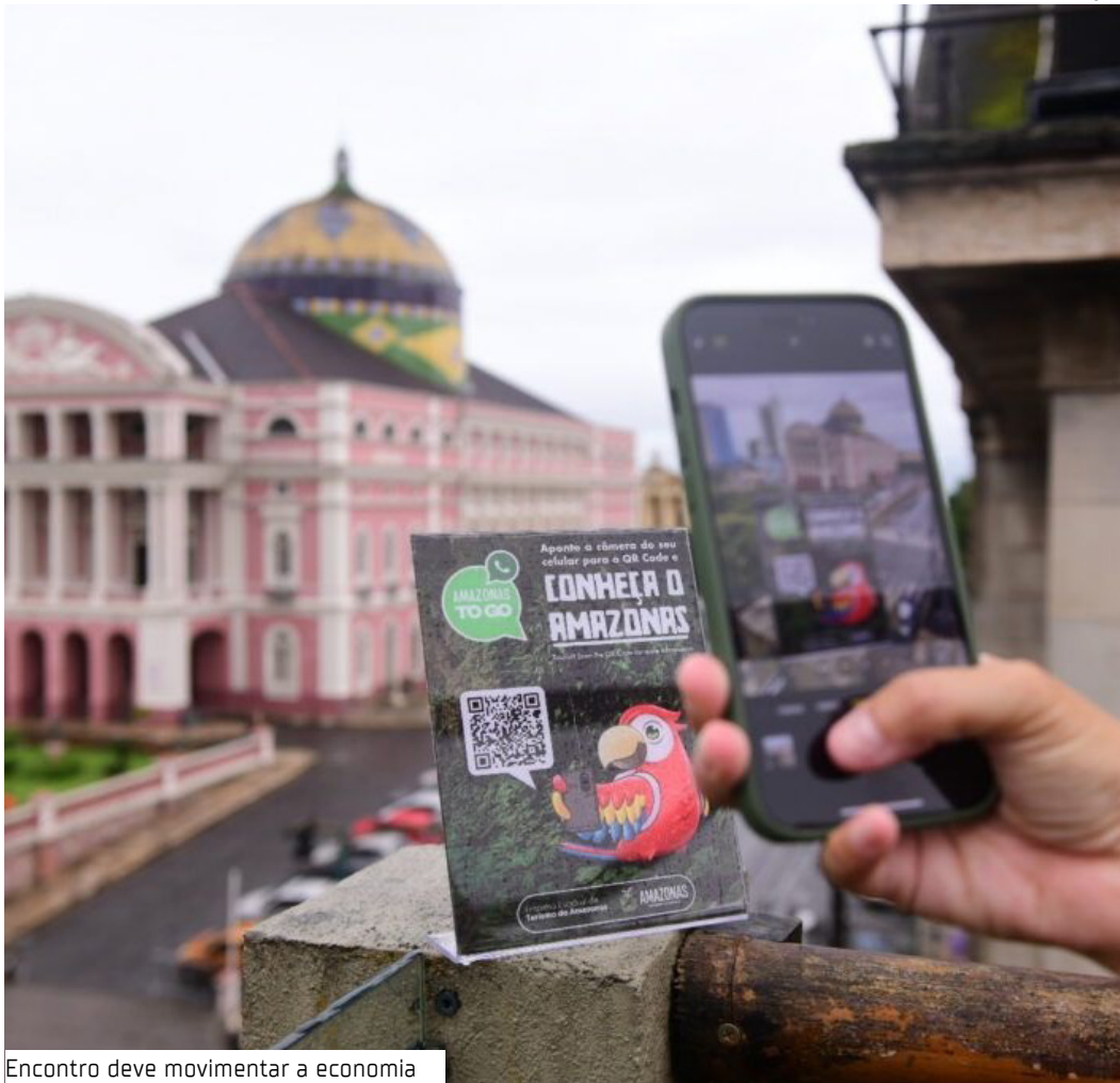
Encontro deve movimentar a economia

“A 3ª Conta Amazonas e o 3º Festival Amazonas de Turismo aguardam todos os apaixonados pelo turismo, do Brasil e do mundo, para escreverem juntos um novo capítulo desta história de sucesso”, destacam os organizadores.