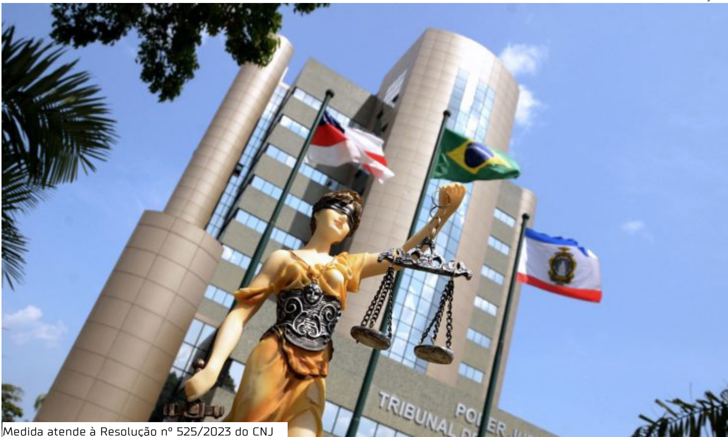
Medida atende à Resolução nº 525/2023 do CNJ

A administração do Tribunal de Justiça providenciará as seguintes certidões para o proces-