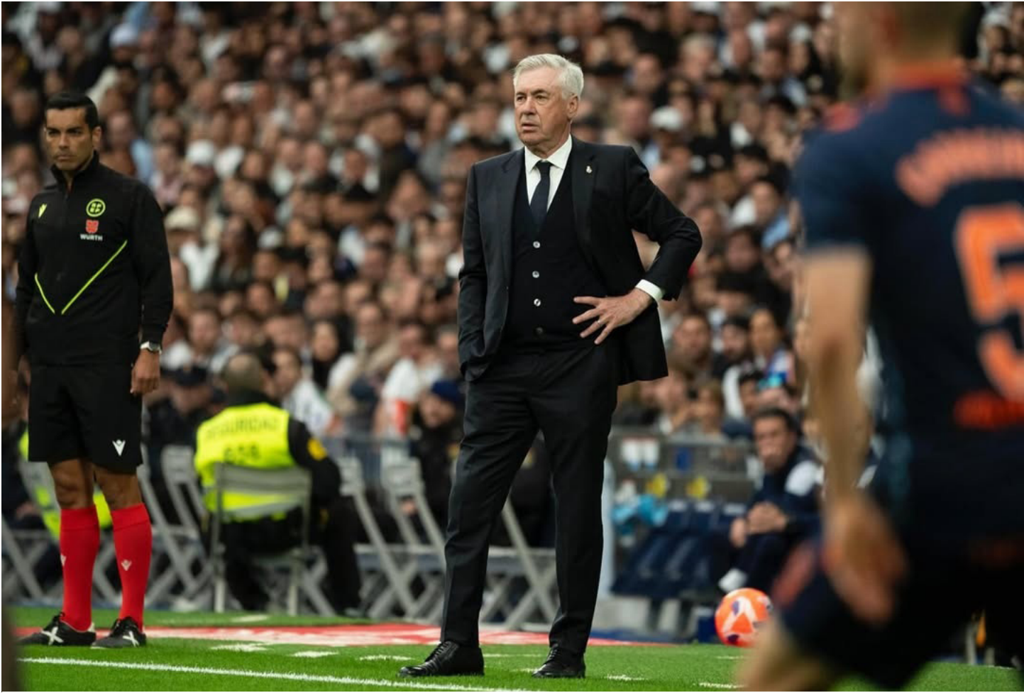
Técnico italiano comanda o Real Madrid até o dia 24 de maio, quando enfrenta a Real Sociedad pelo Campeonato Espanhol

A maior Seleção da história do futebol agora será liderada pelo técnico mais vitorioso do mundo. Carlo Ancelotti, sinônimo de conquistas históricas, foi anunciado nesta segunda-feira (12) pelo presidente da CBF, Ednaldo Rodrigues, como o novo técnico da Seleção Brasileira. Ele vai comandar o Brasil até a Copa do Mundo de 2026 e já treinará a Amarelinha nos dois próximos jogos pelas Eliminatórias diante do Equador e Paraguai, no próximo mês. “Trazer Carlo Ancelotti para comandar o Brasil é mais do que um movimento estratégico. É uma declaração ao mundo de que estamos determinados a recuperar o lugar mais alto do pódio. Ele é o maior técnico da história e, agora, está à frente da maior seleção do planeta. Juntos, escreveremos novos capítulos gloriosos do futebol brasileiro”, afirmou Ednaldo Rodrigues, presidente da CBF. Carlo Ancelotti não precisa de apresentações. Maior vencedor da Champions League,