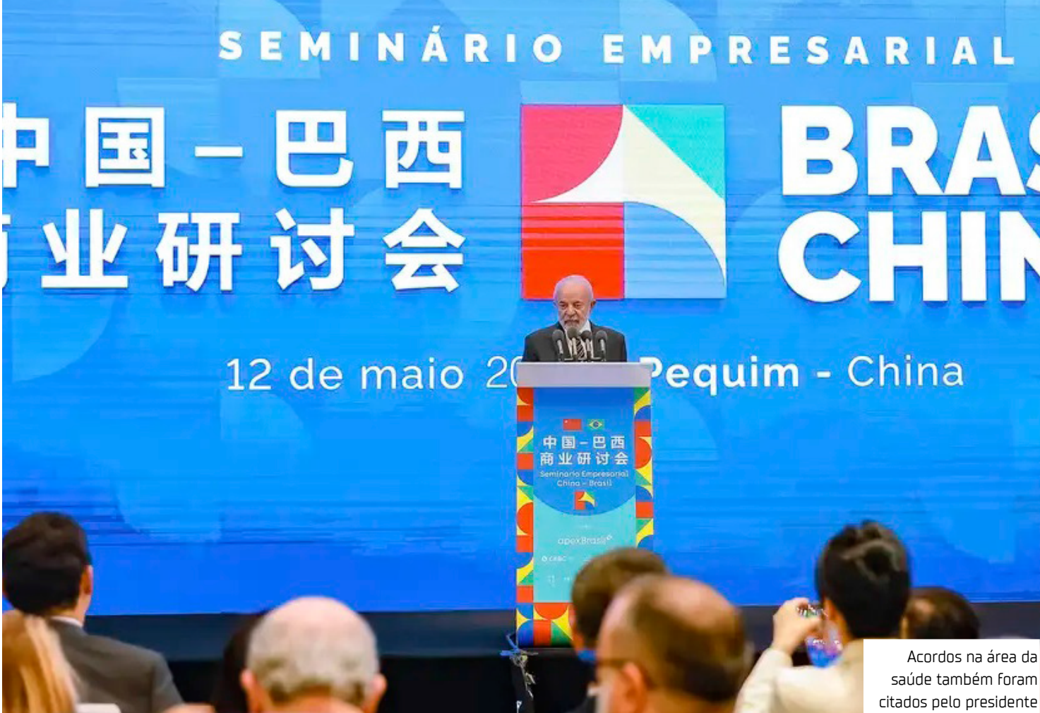
Acordos na área da saúde também foram citados pelo presidente

Para o presidente brasileiro, tais feitos são con-