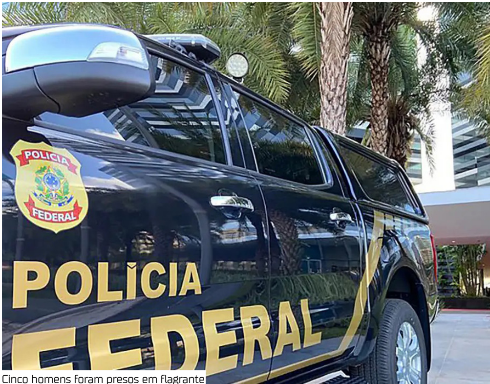
Cinco homens foram presos em flagrante

A Polícia Federal, em ação conjunta com a Polícia Civil e com o Ministério Público Federal, deflagrou uma operação com o objetivo de prender criminosos envolvidos na fabricação clandestina de cigarros no estado do Rio de Janeiro. Na ação, os policiais localizaram uma fábrica clandestina de cigarros paraguaio falsificados em Vigário Geral, bairro na zona norte do Rio. Cinco homens foram presos em flagrante, todos suspeitos de atuar como gerentes e supervisores da fabricação ilegal. O galpão operava ple-