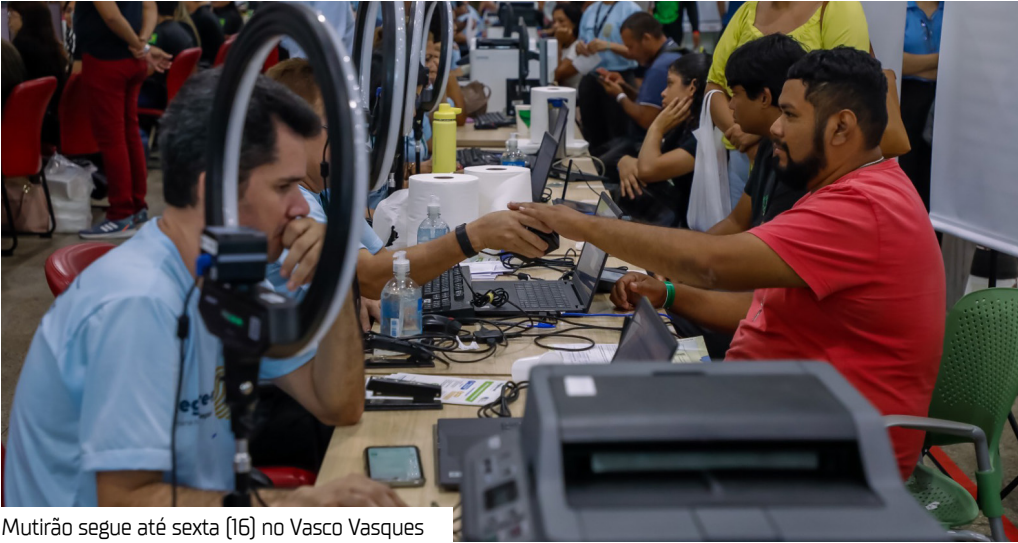
Mutirão segue até sexta (16) no Vasco Vasques

O Tribunal Regional Eleitoral do Amazonas (TRE-AM) deu início, ontem (12), ao mutirão ‘Registre-se’, iniciativa que visa ampliar o acesso da população aos documentos civis básicos e facilitar a regularização eleitoral. A ação acontece até sexta-feira (16), das 8h às 17h, no Centro de Convenções Vasco Vasques, no bairro de Flores.