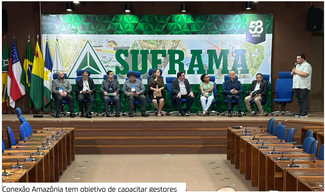
Conexão Amazônia tem objetivo de capacitar gestores

Teve início, ontem (12), no auditório da Suframa, o Conexão Amazônia, promovido pela Superintendência do Desenvolvimento da Amazônia (Sudam). O evento que se encerra na terça-feira (13) reúne autoridades e especialistas para discutir políticas públicas e financiamento de projetos sustentáveis.