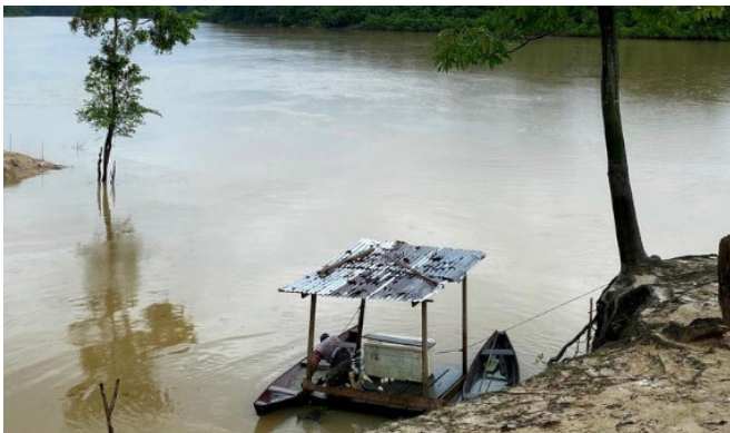
Naufrágio aconteceu no rio Javari, no Amazonas