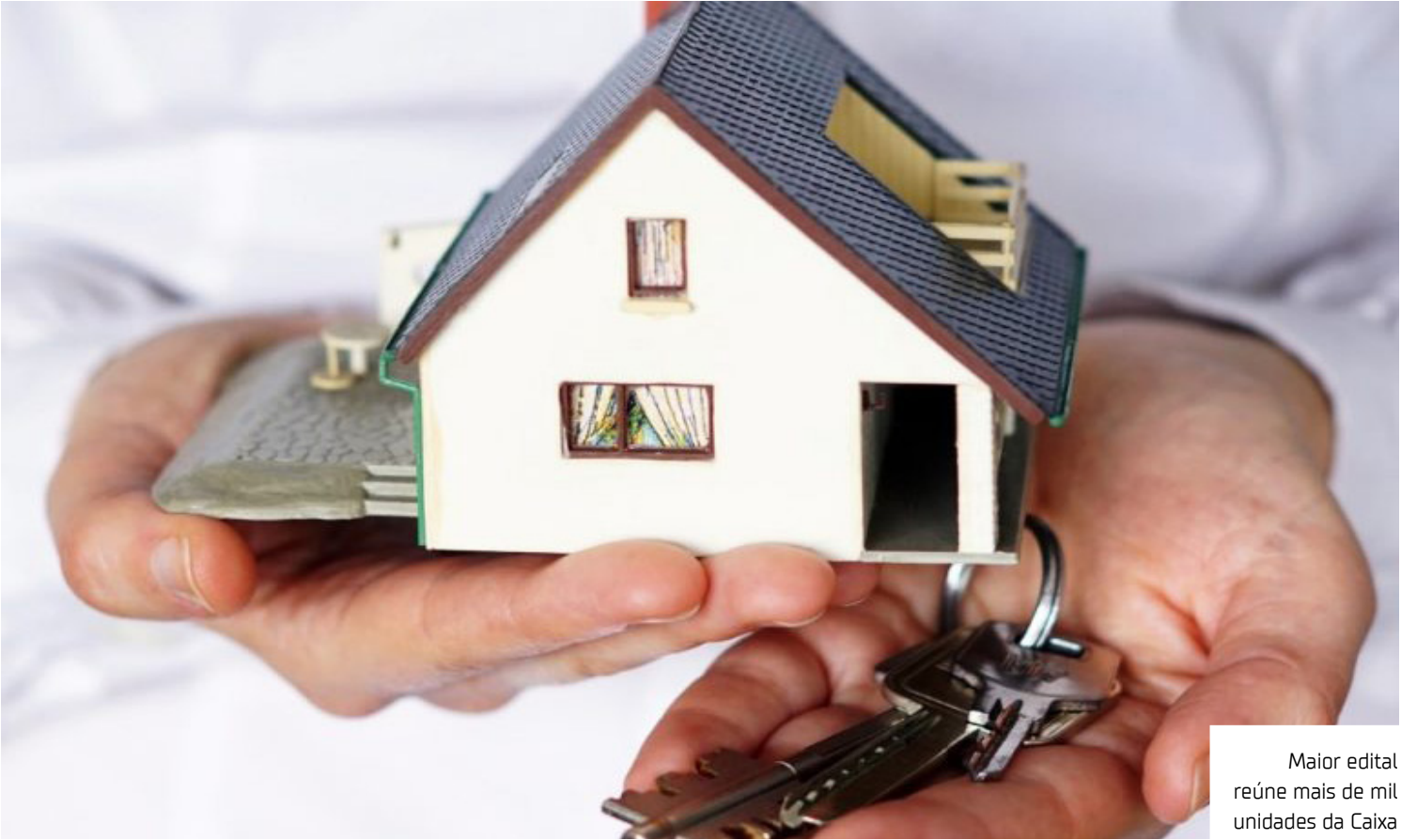
Maior edital reúne mais de mil unidades da Caixa

Os interessados devem fazer seus lances nos dias 14, 21 e 29 de maio e 5 de junho (encerramento dos respectivos prazos) por meio do site www.fidalgoleiloes.com.br .