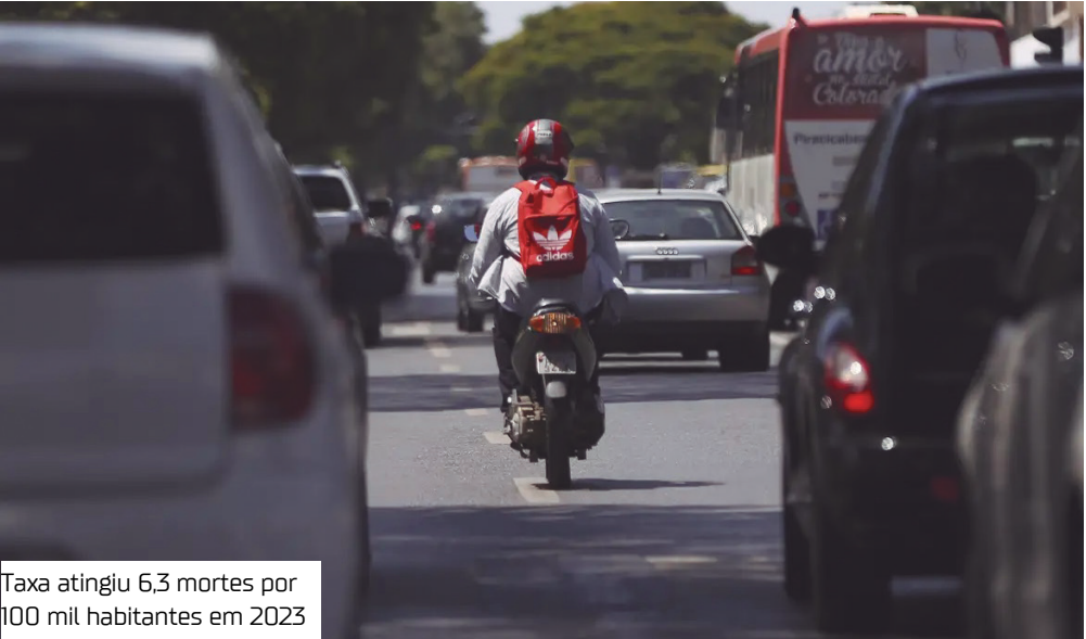
Taxa atingiu 6,3 mortes por 100 mil habitantes em 2023