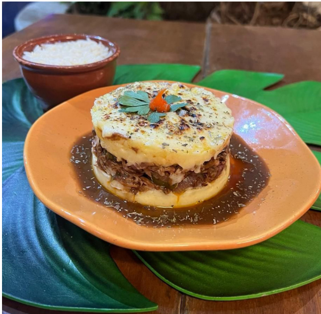
Sabores da Amazônia e cultura brasileira no mesmo espaço