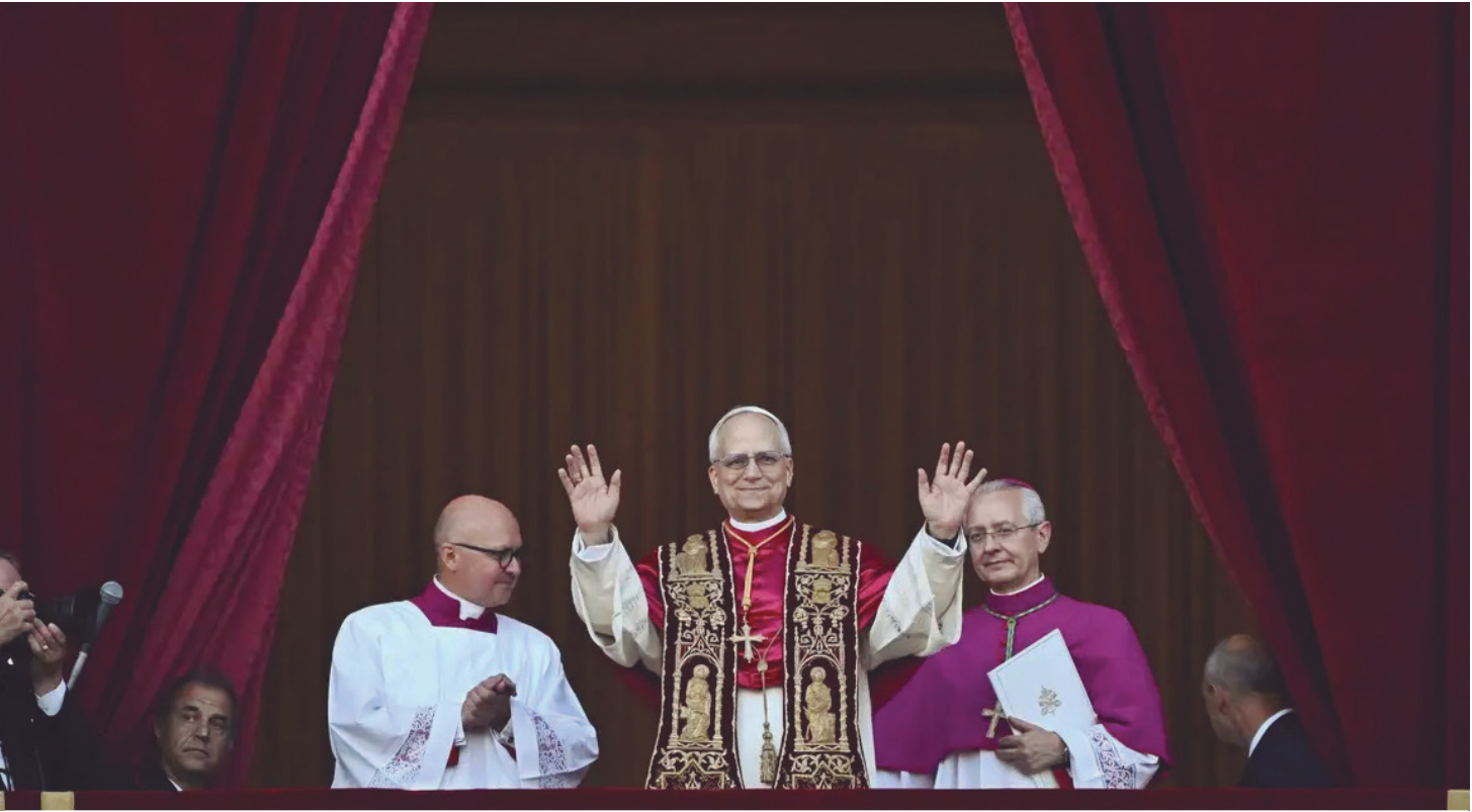
Leão XIV concedeu hoje a primeira entrevista coletiva

um de nós, em nossos diferentes papéis e serviços, para nunca ceder à mediocridade”. “A Igreja deve aceitar o desafio dos tempos e, da mesma forma, não pode haver comunicação e jornalismo