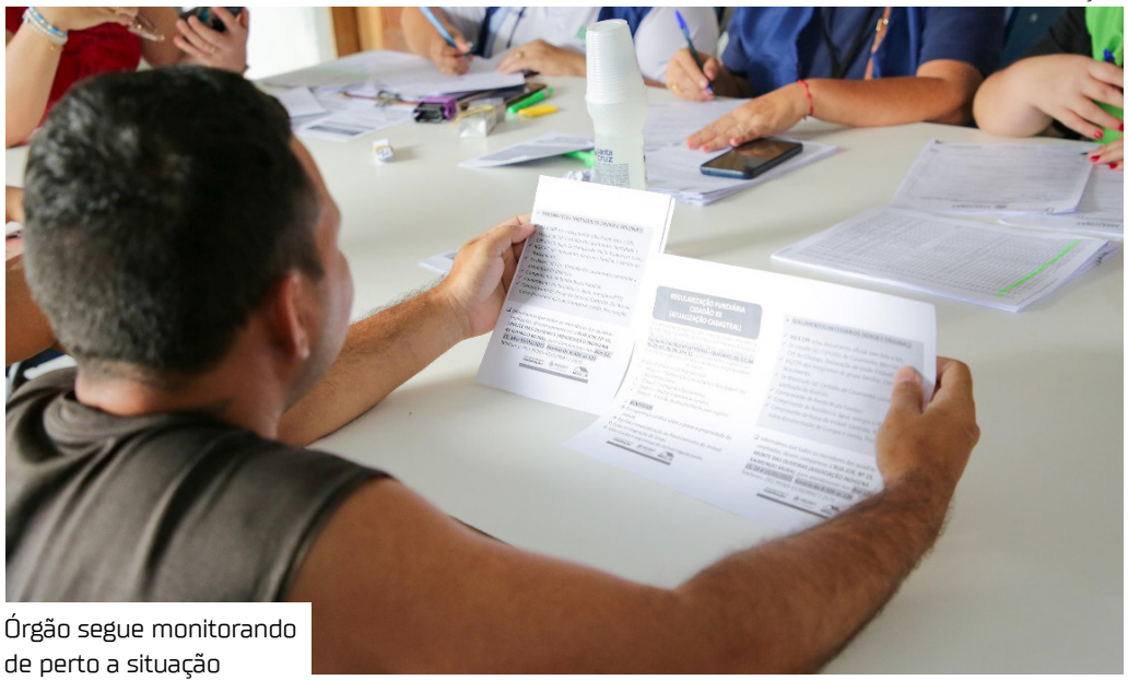
Órgão segue monitorando de perto a situação