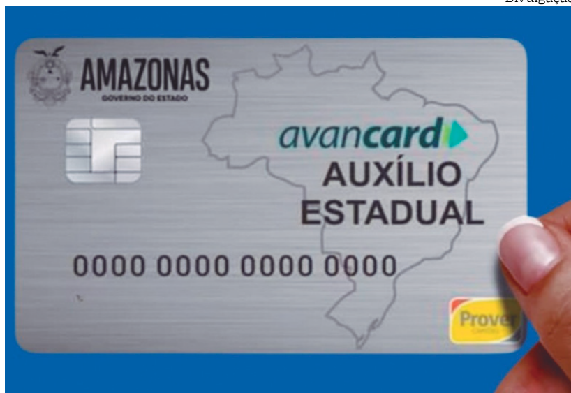
Nova lei proíbe uso do Auxílio Estadual em jogos de azar

O Auxílio Estadual é o maior programa de transferência de renda da história do Amazonas. Criado pelo Governo do Estado, garante R$ 150 mensais a 300 mil famílias em situação de vulnerabilidade social.