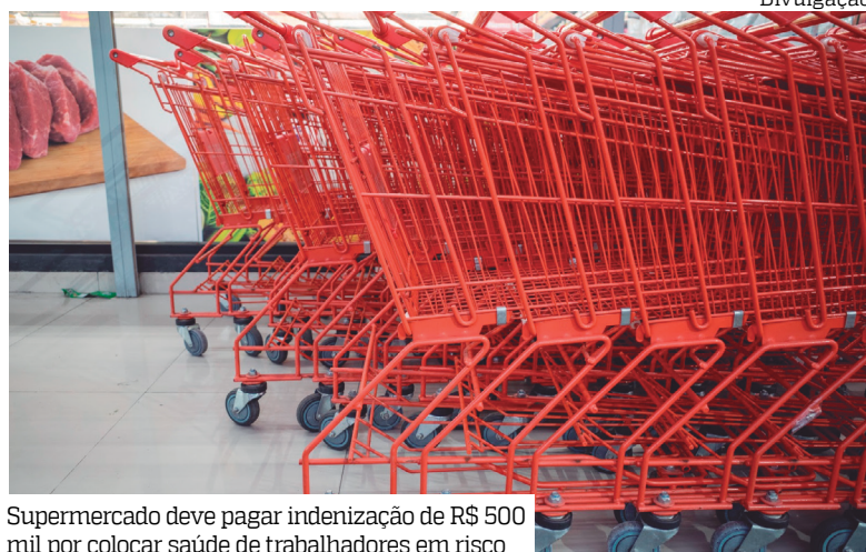
Supermercado deve pagar indenização de R$ 500 mil por colocar saúde de trabalhadores em risco

A 1ª Turma do Tribunal Regional do Trabalho da 11ª Região (AM/RR) decidiu aumentar de R$ 50 mil para R$ 500 mil o valor da indenização que a rede Supermercados DB deverá pagar por descumprir, de forma repetida, regras básicas de segurança e saúde no trabalho. A decisão também obriga a empresa a corrigir uma série de problemas encontrados nas lojas, como máquinas perigosas sem proteção, uso incorreto de