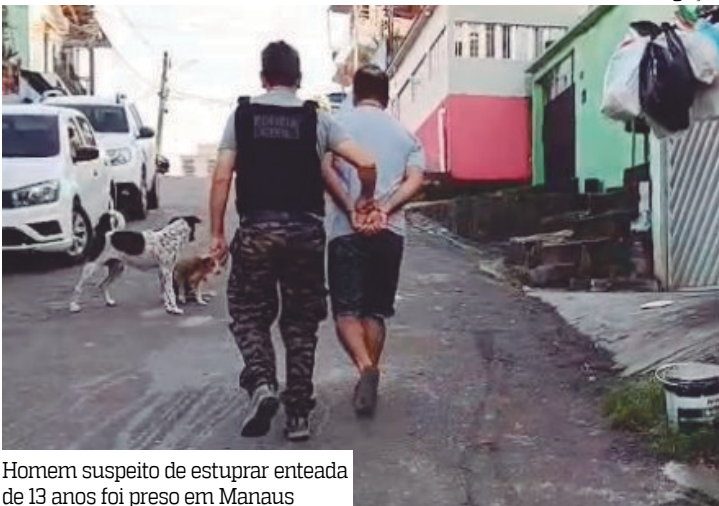
Homem suspeito de estuprar enteada de 13 anos foi preso em Manaus

Um homem de 35 anos, foragido da Justiça de Rondônia, foi preso por estupro de vulnerável contra sua enteada, que hoje tem 13 anos, na quarta-feira (9), em Manaus.