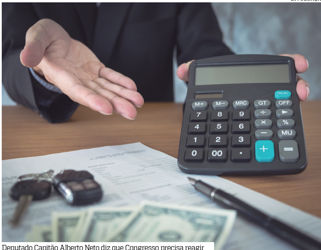
Deputado Capitão Alberto Neto diz que Congresso precisa reagir

A declaração foi rebatida pelo ex-vice-presidente da Câmara dos Deputados, Marcelo Ramos (PT). Em tom crítico, Ramos ironizou a tentativa de associar o governo brasileiro às decisões econômicas unilaterais tomadas por Trump.