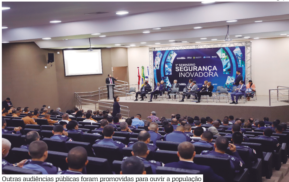
Outras audiências públicas foram promovidas para ouvir a população

Nessas ocasiões, discutiram-se temas como melhorias para as forças policiais,