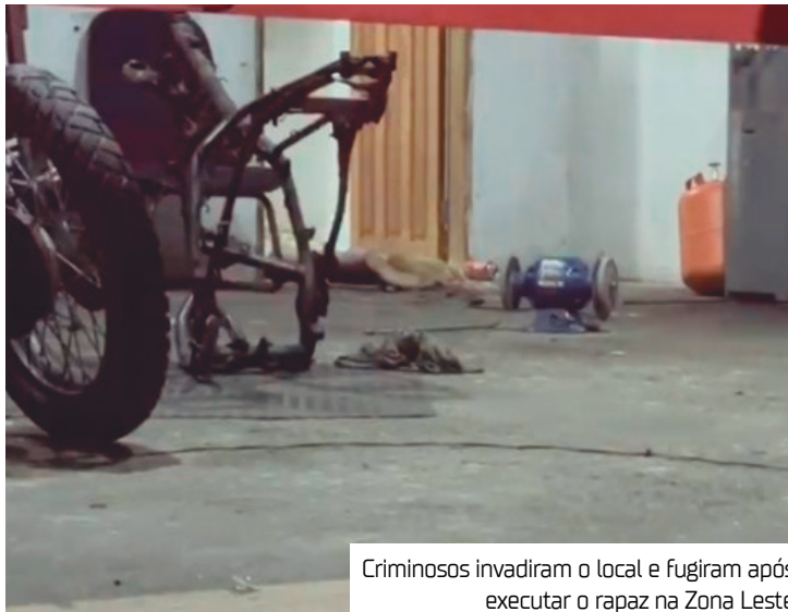
Criminosos invadiram o local e fugiram após executar o rapaz na Zona Leste

A Delegacia Especializada em Homicídios e Sequestros (DEHS) irá investigar o caso para identificar a motivação do crime e os autores do assassinato.