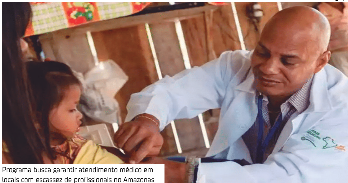
Programa busca garantir atendimento médico em locais com escassez de profissionais no Amazonas

etapa nacional do programa, que selecionou 3.173 médicos para 1.618 municípios e 26 DSEIs em todo o país. O edital teve recorde de inscrições, com mais de 45 mil candidatos.