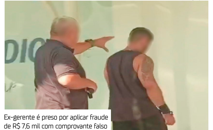
Ex-gerente é preso por aplicar fraude de R$ 7,6 mil com comprovante falso