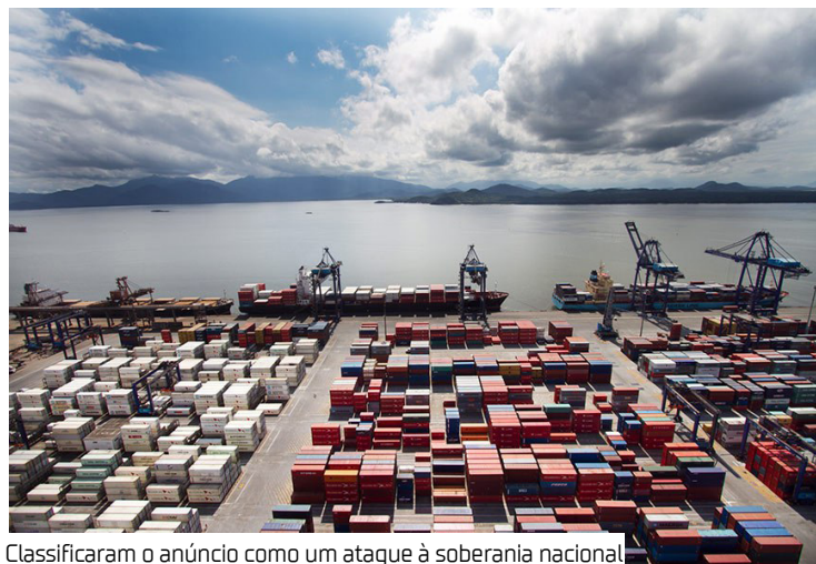
Classificaram o anúncio como um ataque à soberania nacional

A decisão do presidente dos Estados Unidos, Donald Trump, de impor tarifas de 50% sobre todos os produtos importados do Brasil provocou forte repercussão no Senado. A medida, considerada inédita nas relações comerciais entre os dois países, foi duramente criticada por parlamentares da base governista, que classificaram o anúncio como um ataque à soberania nacional. Já os senadores da oposição res-