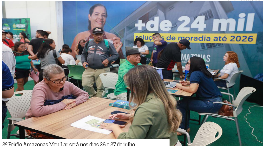
2º Feirão Amazonas Meu Lar será nos dias 26 e 27 de julho

O Programa Amazonas Meu Lar é coordenado pela Secretaria de De-