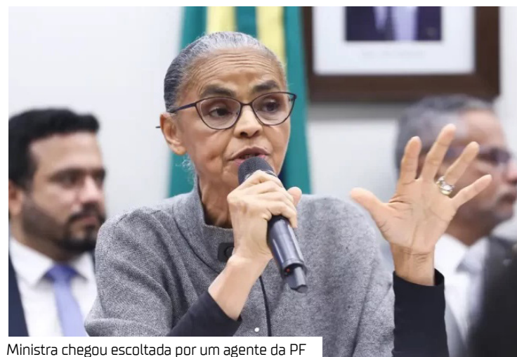
Ministra chegou escoltada por um agente da PF

A ministra do Meio Ambiente, Marina Silva, desembarcou em Manaus ontem (21) com escolta da Polícia Federal. O voo saiu de Brasília e chamou atenção pela presença de uma agente da PF acompanhando a ministra de perto.