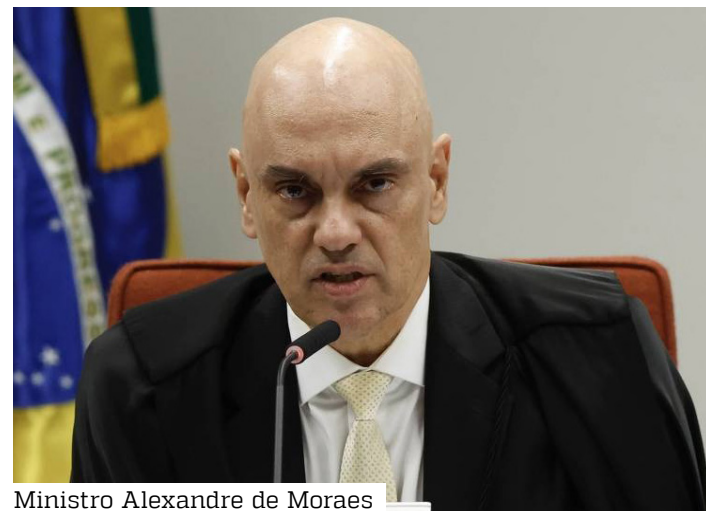
Ministro Alexandre de Moraes

A proibição da entrada dos ministros nos EUA foi anunciada na sexta passada (18) pelo secretário de Estado, Marco Rubio, em rede social.