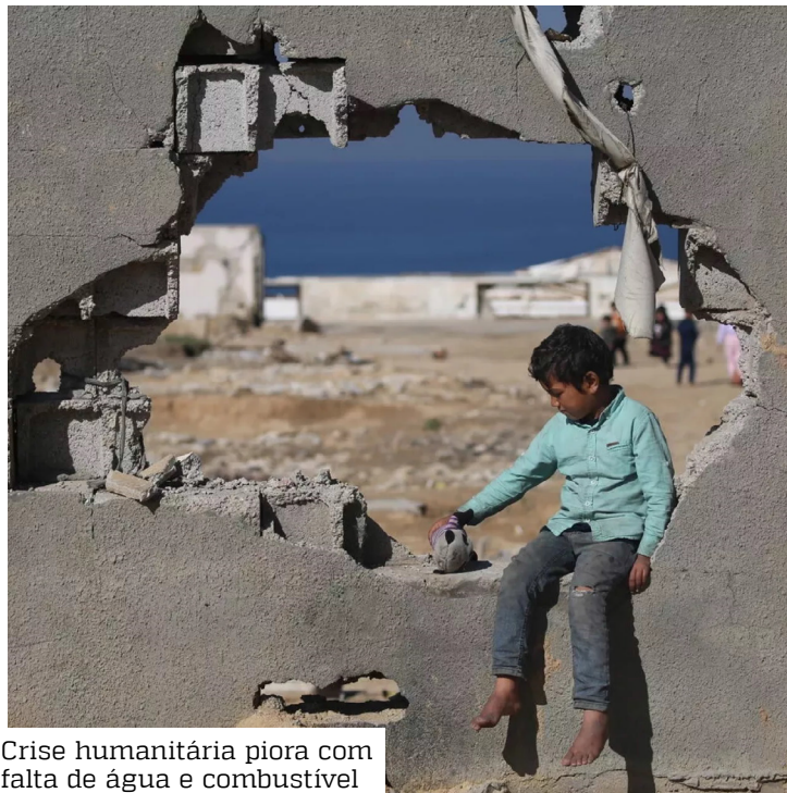
Crise humanitária piora com falta de água e combustível

O Ministério da Saúde de Gaza, controlado pelo Ha-