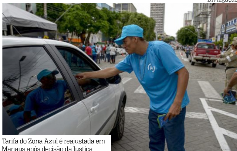
Tarifa do Zona Azul é reajustada em Manaus após decisão da Justiça