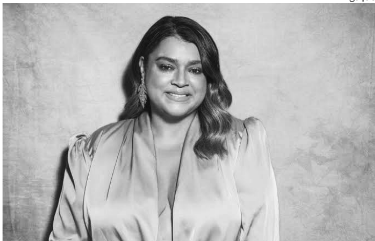
Corpo de Preta Gil, falecida aos 50 anos, será trasladado para o Rio