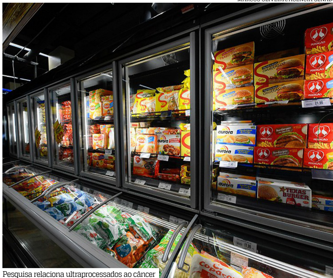
Pesquisa relaciona ultraprocessados ao câncer

“Infelizmente, a indústria de alimentos não tem a obrigação de declarar nos rótulos dos alimentos os processos utilizados em seus produtos e muito menos as finalidades desses processos. Em alguns casos, isso pode tornar mais