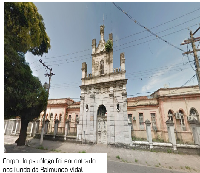
Corpo do psicólogo foi encontrado nos fundos da Raimundo Vidal