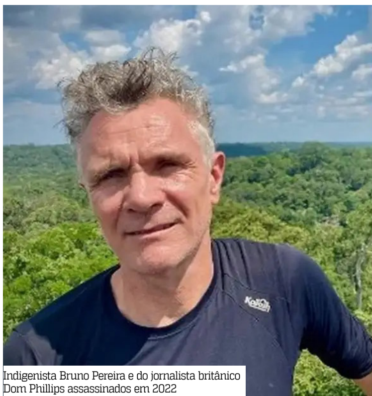
Indigenista Bruno Pereira e do jornalista britânico Dom Phillips assassinados em 2022