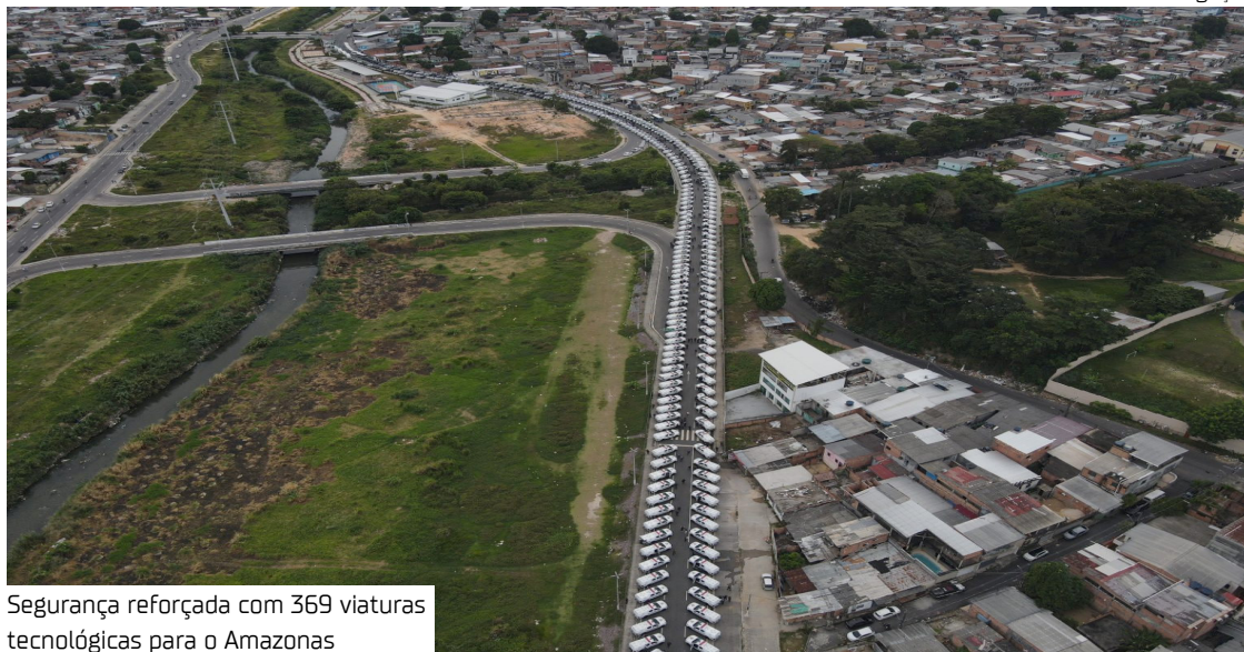
Segurança reforçada com 369 viaturas tecnológicas para o Amazonas

"Isso significa que um carro que passar por uma das nossas viaturas e tiver qualquer restrição ou envolvido em crimes, automaticamente o sistema vai disparar e a polícia vai fazer a abordagem. Nosso poli-