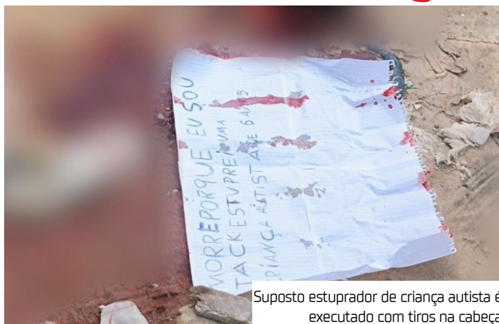
Suposto estuprador de criança autista é executado com tiros na cabeça

Equipes do Departamento de Polícia Técnico-Científico (DPTC) e do Instituto Médico Legal (IML) realizaram a perícia e removeram