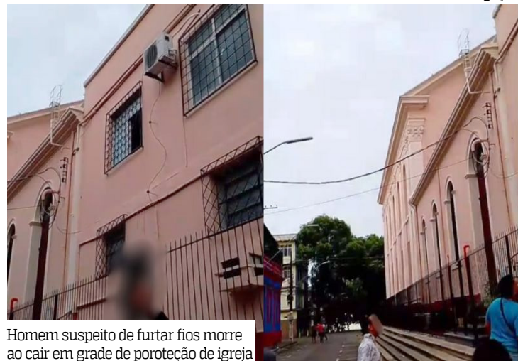
Homem suspeito de furtar fios morre ao cair em grade de proteção de igreja