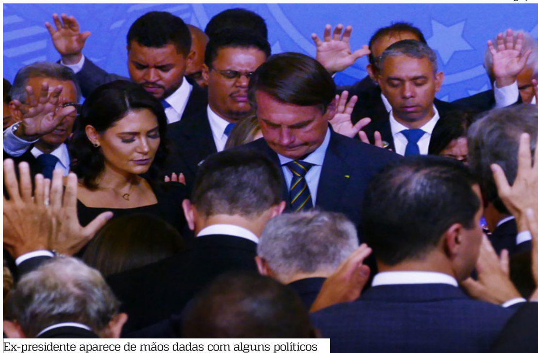
Ex-presidente aparece de mãos dadas com alguns políticos

Para reforçar essa mobilização, o partido convocou reuniões extraordinárias para esta terça-feira (22) nas comissões que preside: a Comissão de Segurança Pública e a Comissão de Relações Exteriores. As sessões têm como objetivo exclusivo aprovar moções de apoio a Bolsonaro, ignorando a determinação judicial do uso da tornozeleira eletrônica.