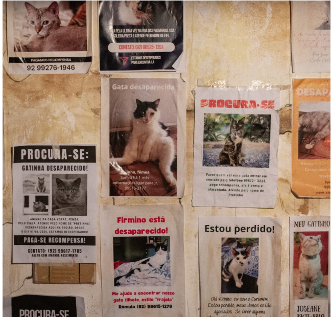
A exibição do filme acontece no dia 23 de julho, com entrada gratuita