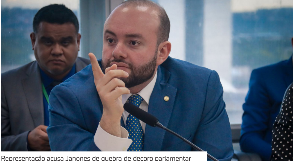
Representação acusa Janones de quebra de decoro parlamentar

O deputado Fausto Jr. (União Brasil-AM) foi escolhido como relator do processo que pode levar à suspensão cautelar do mandato do deputado André Janones (Avante-MG). A representação foi apresentada pela Mesa Diretora da Câmara, que acusa Janones de quebra de decoro parlamentar.