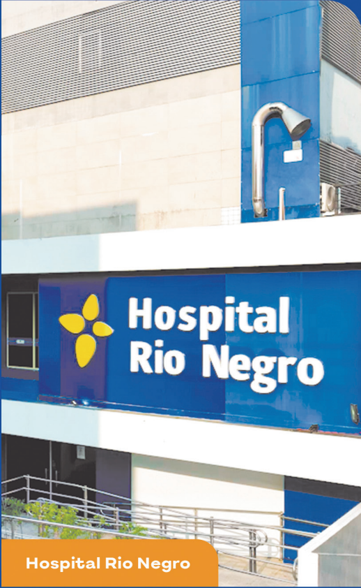
Hospital Rio Negro