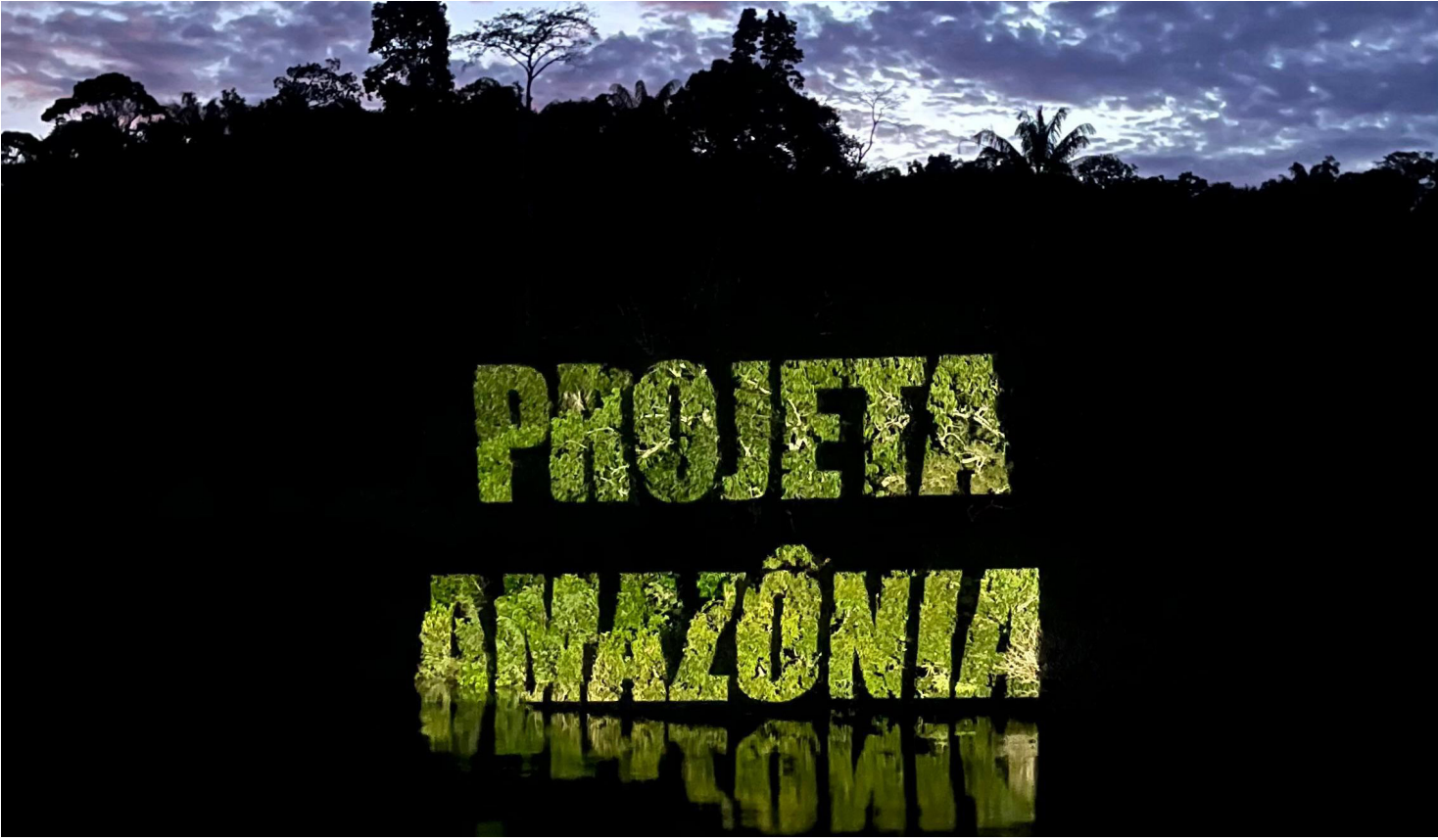
Projeto nasceu da necessidade de transformar indignação em arte e engajamento social

APÓS EXIBIÇÃO NAS COPAS DAS ÁRVORES, OBRAS ESTARÃO EXPOSTAS NO MUSA EM AGOSTO