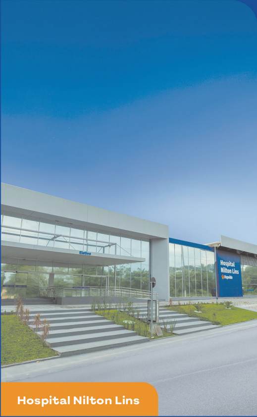
Hospital Nilton Lins