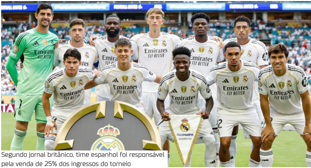
Segundo jornal britânico, time espanhol foi responsável pela venda de 25% dos ingressos do torneio

Os clubes classificados para o Mundial de 2029