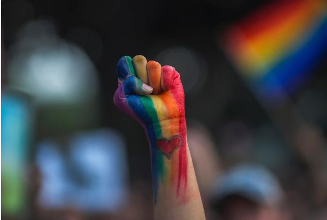
Tribunal Regional do Trabalho da 11ª Região (AM/RR) vem reforçando seu compromisso com a inclusão

Nesse cenário, o Tribunal Regional do Trabalho da 11ª Região (AM/RR) vem reforçando seu compromisso com a inclusão e a representatividade, buscando transformar garantias legais em ações concretas, como o 1º Ciclo pelo Orgulho e pela Diversidade no Poder Judiciário do Amazonas, que ocorrerá nesta amanhã (17) e sexta-feira (18).