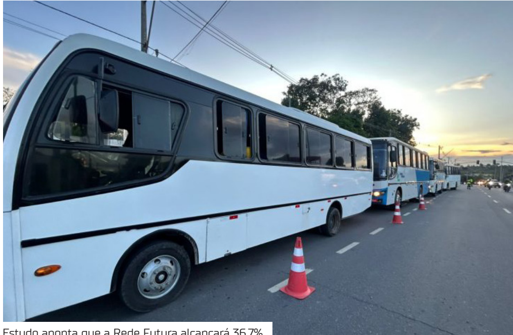
Estudo aponta que a Rede Futura alcançará 36,7%

A região metropolitana de Manaus tem potencial para ampliar em 41 quilômetros a rede de transporte público coletivo de média e alta capacidade (TPC-MAC) até 2054. Com isso, poderá alcançar 48 km de expansão e ampliar de 212,9 mil para 393,7 mil o número de pessoas que utilizam diariamente corredores de transporte.