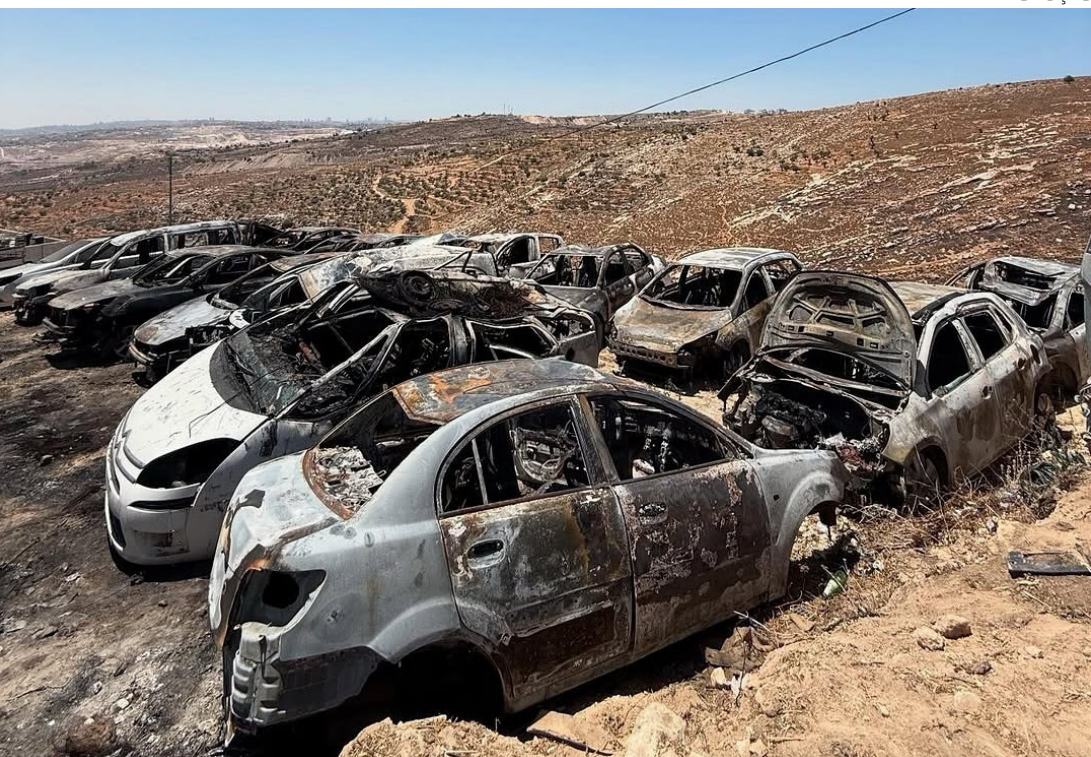
Israel intensifica ataques em Gaza, Líbano, Síria e Cisjordânia

O Ministério da Saúde de Gaza confirmou que a ofensiva sionista já matou pelo menos 58.386 civis e feriu 139.077, incluindo crianças e mulheres. Estima-se que 1.139 pessoas tenham morrido em Israel durante os ataques de 7 de outubro de 2023, e mais de 200 foram feitas reféns.