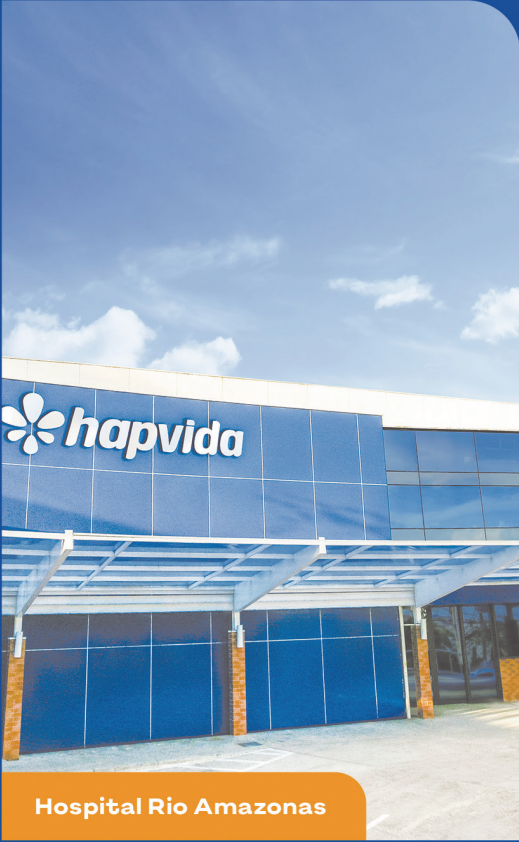
Hospital Rio Amazonas