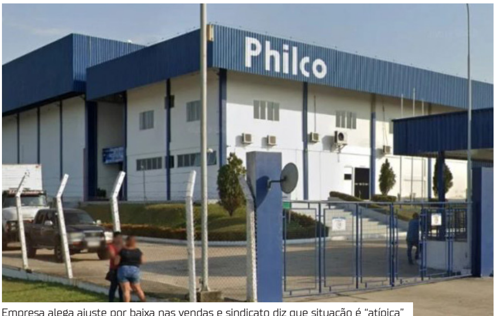
Empresa alega ajuste por baixa nas vendas e sindicato diz que situação é “atípica”

aumento de 1%, mantendo a estabilidade do setor. A Philco figura entre as dez maiores empregadoras do Polo Industrial de Manaus. A empresa disse que a última grande demissão ocorreu durante a pandemia de covid-19, quando também enfrentou queda nas vendas de produtos sazonais. Santana observou que o polo industrial vive atualmente um recorde de empregos, com 132 mil trabalhadores. Segundo ele, fazia três anos que o setor não registrava demissões em massa. Mesmo assim, acredita que os profissionais desligados não terão dificuldade para se recolocar, já que há escassez de mão de obra qualificada na região.