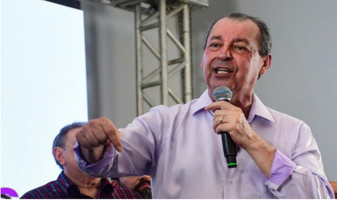
Parlamentar tem se mostrado um dos principais defensores da pavimentação da rodovia

“O que me deixou triste foi a ministra Marina dizer: ‘você querem pra passear’. Mas, e se a gente quiser para passear, nós não temos esse direito?”, questionou Aziz.