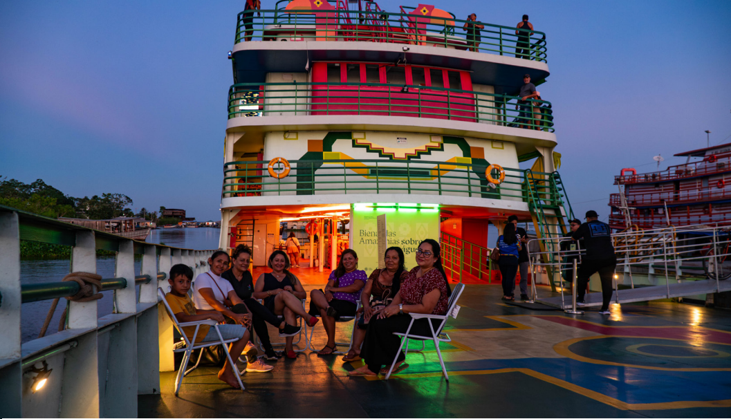
Projeto promove oficinas gratuitas de colagem, contação de histórias, teatro, cartografia e culinária

Agendamento de grupos: Formulário para grupos: https://docs.google.com/forms/d/e/1FAIpQLSdvK2GA90oqgJxT945CYtQDY070SdRYnV2Gda891a6SYK885g/viewform