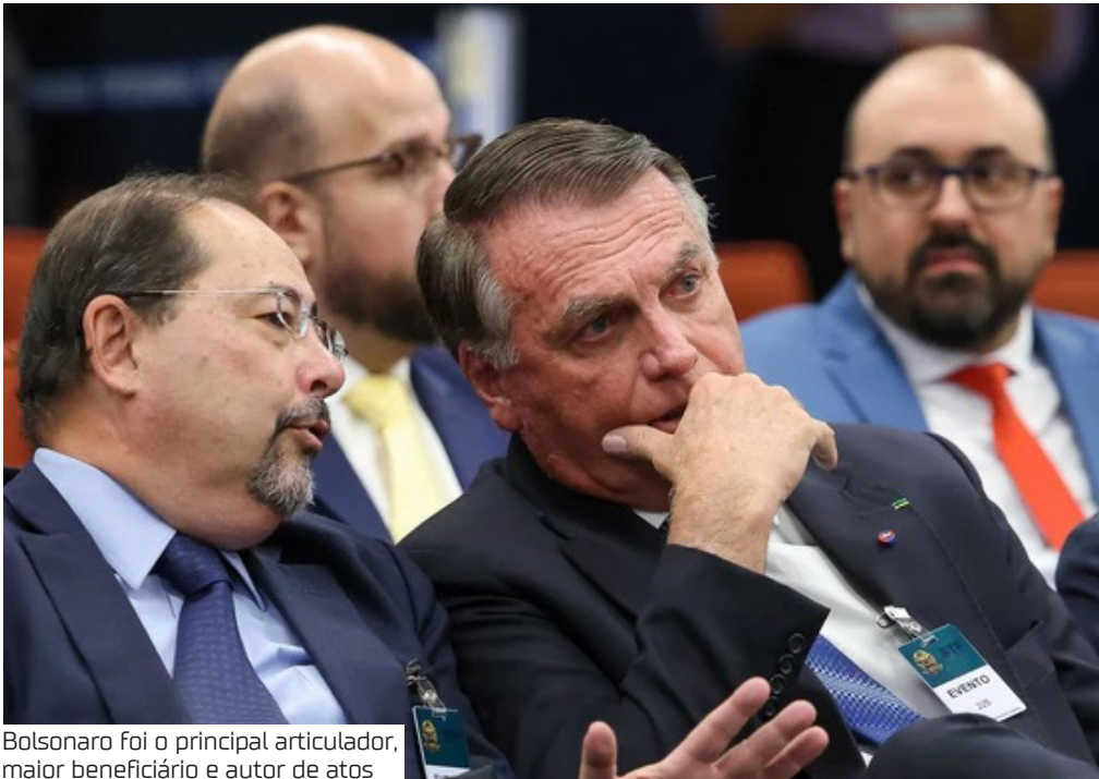
Bolsonaro foi o principal articulador, maior beneficiário e autor de atos