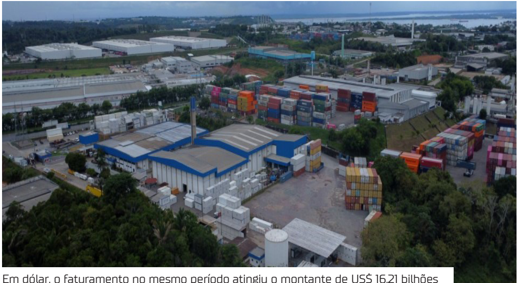
Em dólar, o faturamento no mesmo período atingiu o montante de US$ 16,21 bilhões

Em continuidade aos bons resultados no primeiro semestre de 2025, o Polo Industrial de Manaus (PIM) fechou o período de janeiro a maio com faturamento de R$ 93,34 bilhões, o que representa crescimento de 14,08% em relação a igual intervalo do ano passado (R$ 81,82 bilhões). Em dólar, o faturamento no mesmo período atingiu o montante de US$ 16,21 bilhões. Em maio, o PIM empregou um total de 130.462 trabalhadores, entre efetivos, temporários e terceirizados. O quantitativo indica crescimento de 7,82% na comparação com o resultado obtido em maio de 2024 (120.995 trabalhadores). A média mensal de empregos do PIM em 2025, até maio, é de 131.550 trabalhadores. Os subsetores do PIM