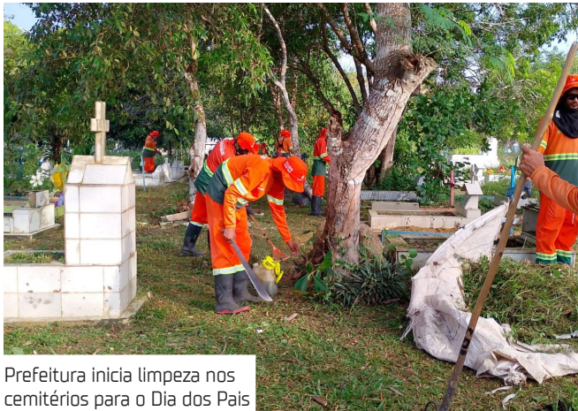
Prefeitura inicia limpeza nos cemitérios para o Dia dos Pais

A cidade conta com dez cemitérios públicos — seis em áreas urbanas e quatro em comunidades rurais. A força-tarefa da Semulsp inclui serviços de capinação, varrição, poda, remoção de resíduos e manutenção geral, garantindo que os espaços estejam organizados e acolhedores para receber as famílias manauaras.