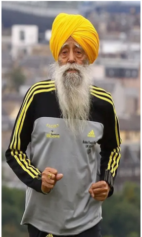
Fauja completou uma prova com mais de 100 anos