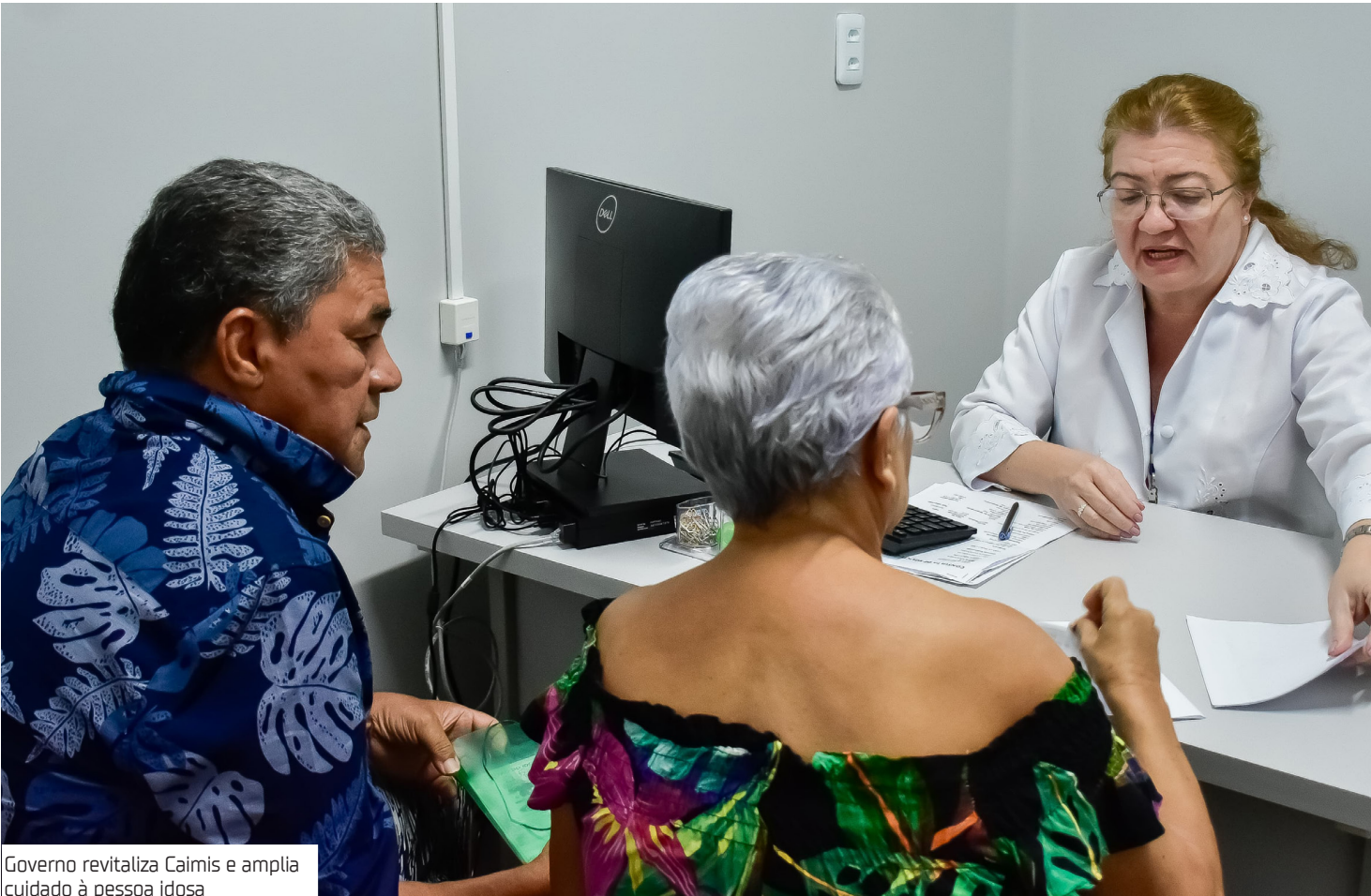
Governo revitaliza Caimis e amplia cuidado à pessoa idosa

De acordo com a secretária executiva de Atenção Especializada e Políticas