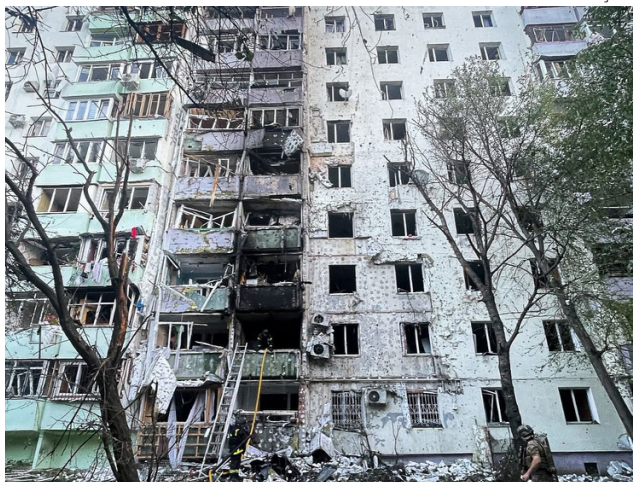
Moscou pode negociar, diz chancelaria, mas não sob pressão

A Rússia reagiu com um misto de desafio e cautela ontem (15) ao ultimato feito na véspera por Donald Trump, segundo o qual o americano deu 50 dias para Vladimir Putin parar a Guerra da Ucrânia, sob pena de novas sanções.