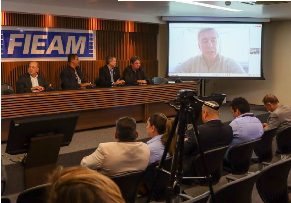
Nesta primeira edição, quatro empresas apresentaram seus investimentos, expectativas de expansão