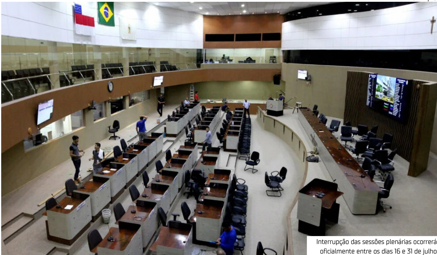
Interrupção das sessões plenárias ocorrerá oficialmente entre os dias 16 e 31 de julho

Em nota ao Em Tempo, a CMM esclareceu que as atividades institucionais seguem nos demais setores da Casa,