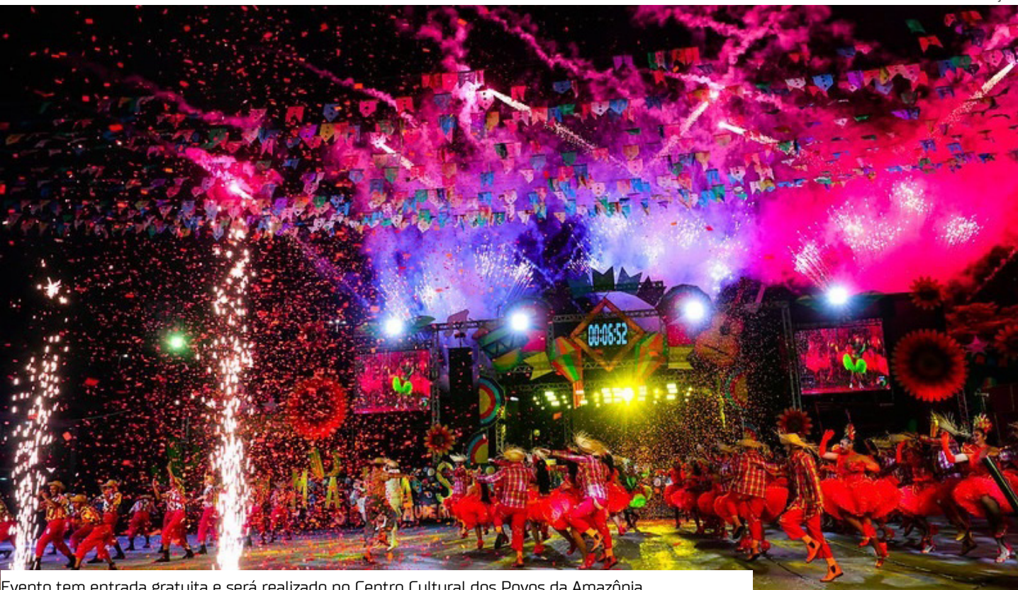
Evento tem entrada gratuita e será realizado no Centro Cultural dos Povos da Amazônia

Boi-bumbá Nos dias 25 e 26 de julho, será a vez dos seis bois-bumbás de Manaus se apresentarem no Sambódromo, na zona centro-oeste da capital. Ao longo de 14 dias, todas as 76 agremiações participantes serão avaliadas por um júri técnico e concorrerão ao título de campeãs em suas respectivas categorias. O festival celebra a riqueza da cultura amazonense com cerca de 15 gêneros artísticos, reunindo apresentações de cirandas, quadrilhas (tradicional, alternativa, cômica e de duelo), danças nacionais, internacionais, regionais, afro e nordestinas. Também integram a programação manifestações como o garrote (nas modalidades tradicional e regional), cacetinho, danças indígenas e o tradicional boi-bumbá.