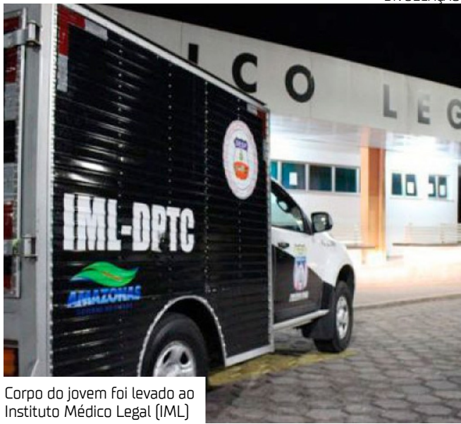
Corpo do jovem foi levado ao Instituto Médico Legal (IML)

Uma mulher foi arremessada em uma churrasqueira após sofrer um acidente de trânsito em