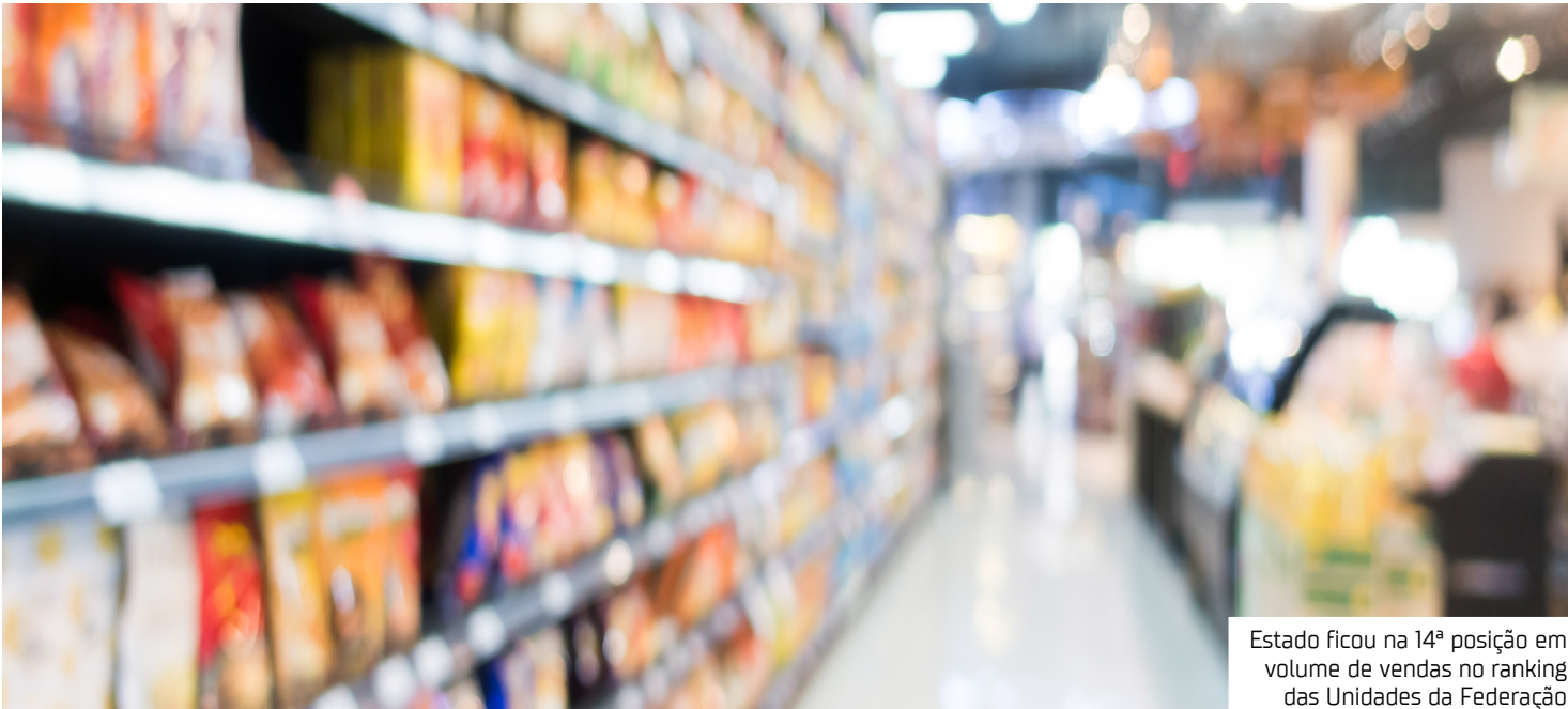
Estado ficou na 14ª posição em volume de vendas no ranking das Unidades da Federação

No índice que compara o resultado do mês com o mesmo mês do ano anterior, o Amazonas encerrou janeiro com variação de -0,2% em volume de vendas, uma diferença de -1,9 ponto percentual (p. p.) em relação ao resultado nacional (2,1%). O resultado deixou o comércio varejista do Estado entre os três piores do índice em maio no ranking nacional das Unidades da Federação. Junto com o Estado, Tocantins (-5,5%) e Rio de Janeiro (-0,9%) tiveram os piores resultados. Os estados com os melhores resultados no índice foram