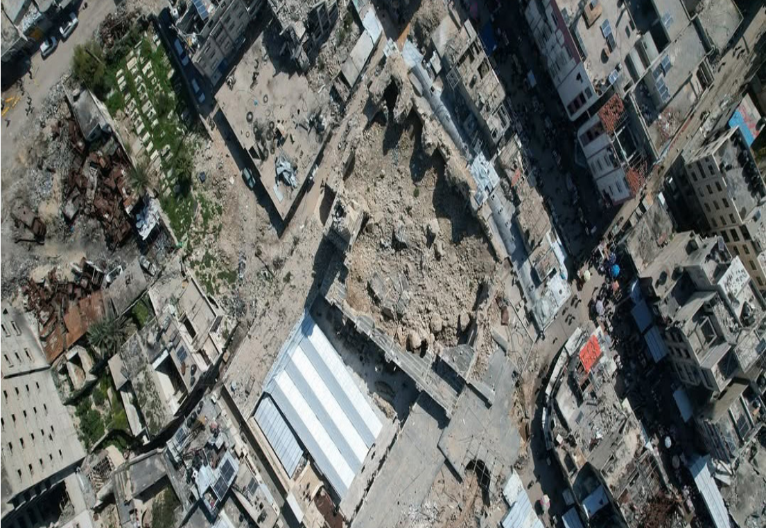
Catar diz que não houve progresso nas negociações de cessar-fogo entre Israel e Hamas

“Não acho que possa dar um prazo no momento, mas posso dizer desde já que precisaremos de tempo para isso”, disse Majed al-Ansari, porta-voz do Ministério das Relações Exteriores do Catar, na terça-feira, terceiro dia de negociações em Doha. “O que está acontecendo agora é que ambas as delegações estão em Doha. Estamos