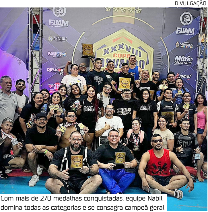
Com mais de 270 medalhas conquistadas, equipe Nabil domina todas as categorias e se consagra campeã geral

vo nas diferentes classes da competição mostra que a equipe Nabil vem investindo fortemente na formação de atletas desde a base até os níveis mais avançados. A presença constante no pódio evidencia um trabalho técnico consistente, com preparação física, tática e emocional adequada às exigências do alto rendimento.