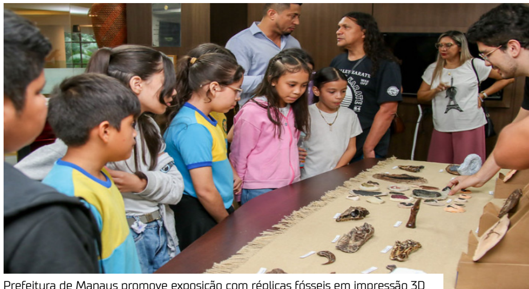
Prefeitura de Manaus promove exposição com réplicas fósseis em impressão 3D

Em alusão ao Dia Mundial da Ciência, a Prefeitura de Manaus, por meio da Secretaria Municipal de Educação (Semed), realizou, ontem (8), a abertura da exposição “Dos Fósseis ao Plástico: A linha Cronológica da História Natural da Vida no Planeta Terra”, que acontece no Espaço da Cidadania Ambiental/ Ecam, que fica no piso açaí do Manauara Shopping, zona Centro-Sul da cidade, de segunda a sexta-feira, das 10h às 21h, que ficará aberto ao público até o dia 22/7.