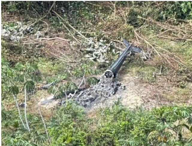
Aeronave prestava serviço ao Ministério da Saúde

Dois indígenas morreram em um acidente de helicóptero ocorrido na segunda-feira (7) na Terra Indígena Yanomami, em Roraima. A aeronave prestava serviço contratado pelo Ministério da Saúde por meio da empresa Voare Táxi Aéreo. Outras três pessoas que estavam a bordo foram resgatadas com vida e levadas para atendimento médico em Boa Vista. A informação é do diretor de Segurança Operacional da Voare, Haroldo de Sousa, ontem (8).