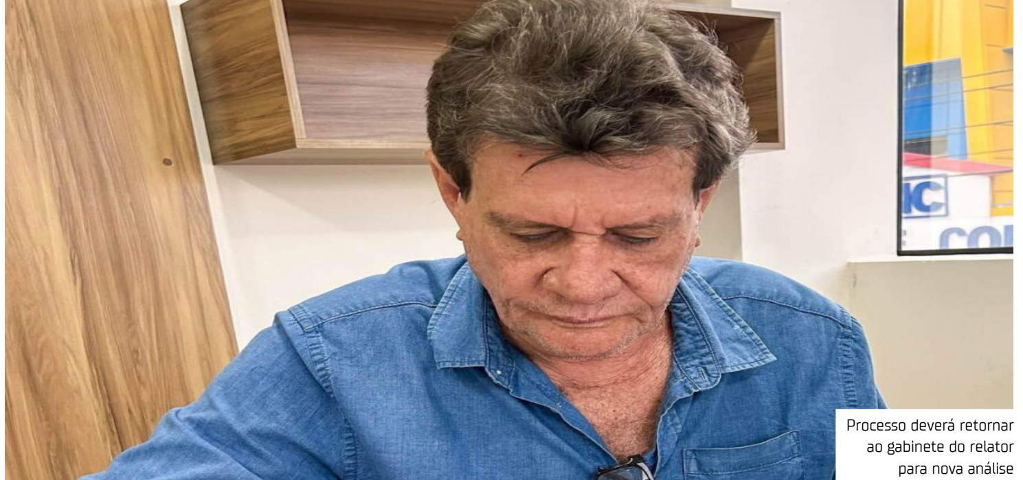
Processo deverá retornar ao gabinete do relator para nova análise

A unidade técnica do TCE-AM confirmou os indícios de violação aos princípios constitucionais da legalidade, impessoalidade, moralidade e eficiência, previstos no artigo 37 da Constituição Federal, e sugeriu que