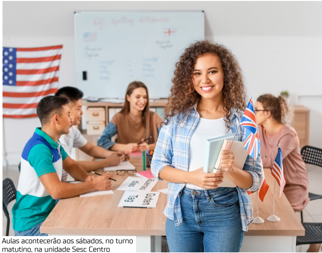
Aulas acontecerão aos sábados, no turno matutino, na unidade Sesc Centro

As aulas acontecerão aos sábados, no turno matutino, na unidade Sesc Centro, com início previsto para dia 26 de julho. Para mais informações, os interessados podem ir diretamente na secretaria da instituição ou entrar em contato: (92) 98415-7811 (WhatsApp) / 2121-5382.