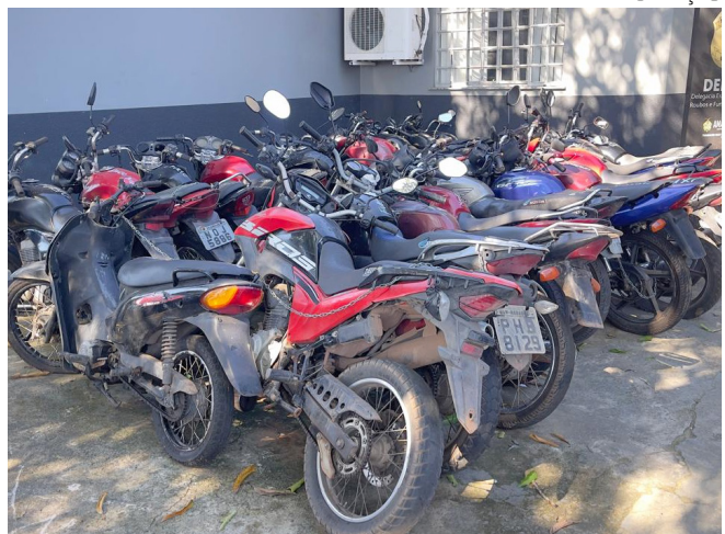
Motocicletas foram recuperadas em operações da PC no interior

“Muitos compradores são enganados com motos adulteradas ou clonadas. É essencial verificar a procedência do veículo antes da compra”, alertou o delegado.