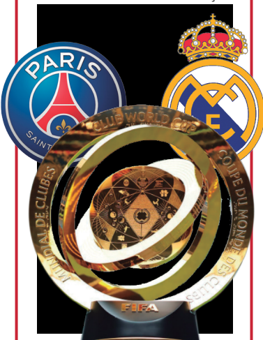
Real e PSG se enfrentam hoje (9), pelo Mundial de Clubes