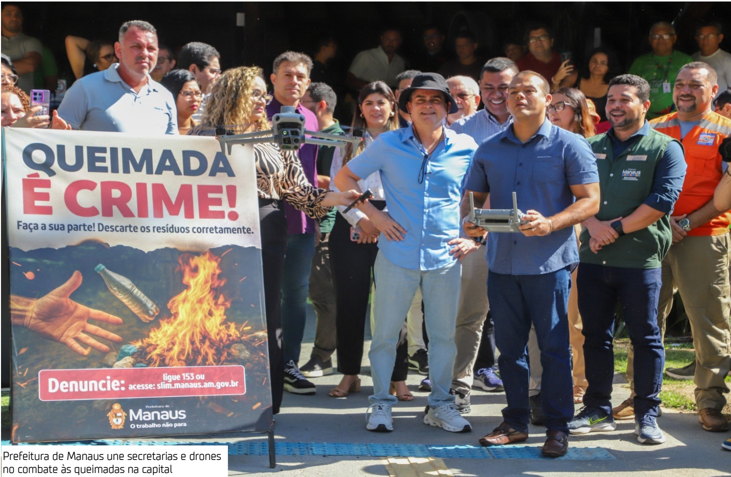
Prefeitura de Manaus une secretarias e drones no combate às queimadas na capital

Uma das principais inovações da campanha é o uso dos drones DJI Matrice 4T e DJI Matrice 30T, que colocam a Prefeitura de Manaus como a primeira instituição pública