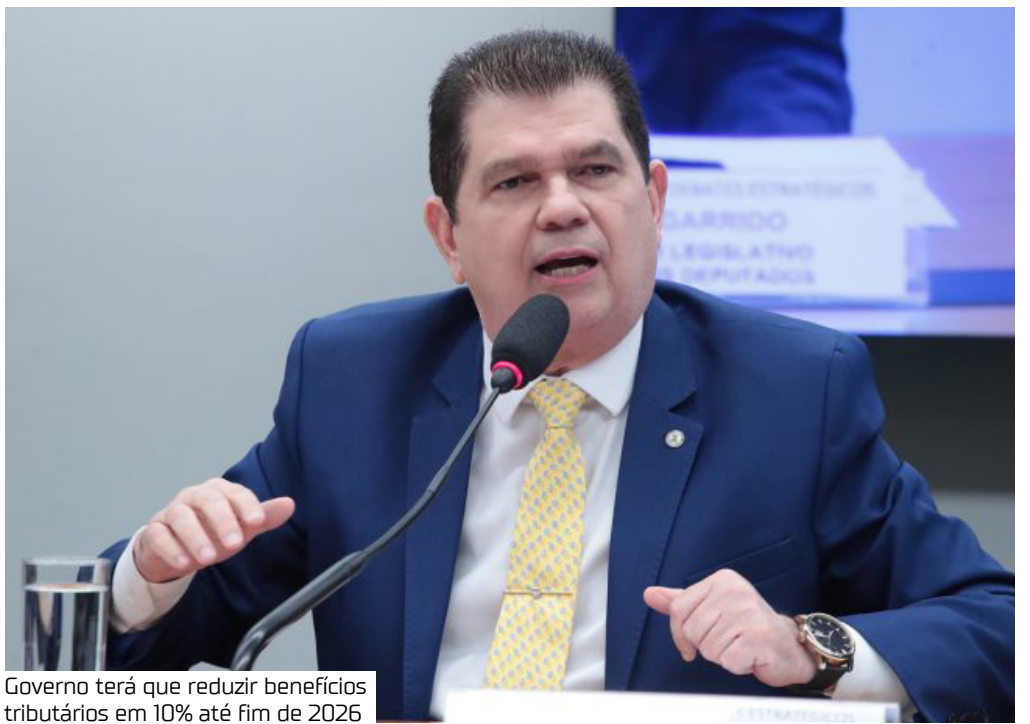
Governo terá que reduzir benefícios tributários em 10% até fim de 2026