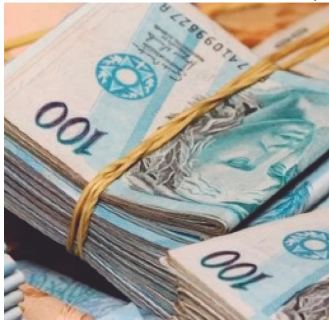
MIDR anuncia R$ 1 bi em operações para regiões Norte e Centro-Oeste