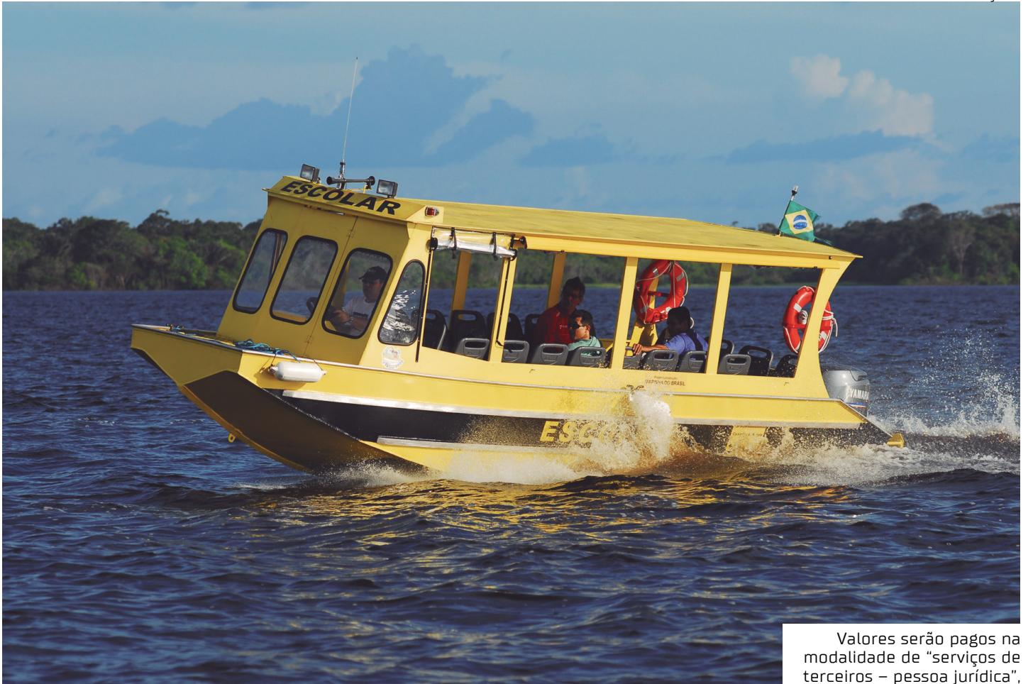
Valores serão pagos na modalidade de “serviços de terceiros – pessoa jurídica”.