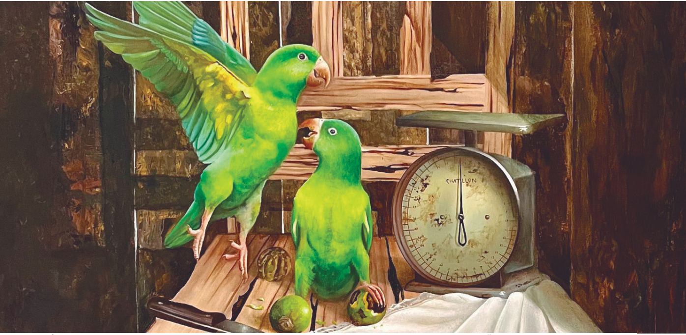
Mostra reúne trabalhos de 26 artistas que representam a ancestralidade e a força criativa da região

Uma Amazônia que pulsa em cores, formas e narrativas diversas. É isso que o público vai encontrar na exposição ‘Arte da Amazônia para o Mundo’, que será aberta ao público hoje (10), no Piso Castanheiras, no Centro Cultural do Manauara Shopping, Zona sul de Manaus. Com curadoria de Belisário Arce, a mostra celebra os 15 anos da Associação PanAmazônia e reúne 50 obras de 26 artistas amazônidas, entre nomes consagrados e novos talentos das artes plásticas regionais. Mais do que um evento comemorativo, a exposição propõe um mergulho sensível nas memórias, símbolos e tensões da Amazônia — conectando ancestralidade, crítica social e inovação estética. São esculturas, pinturas, técnicas mistas e arte digital,