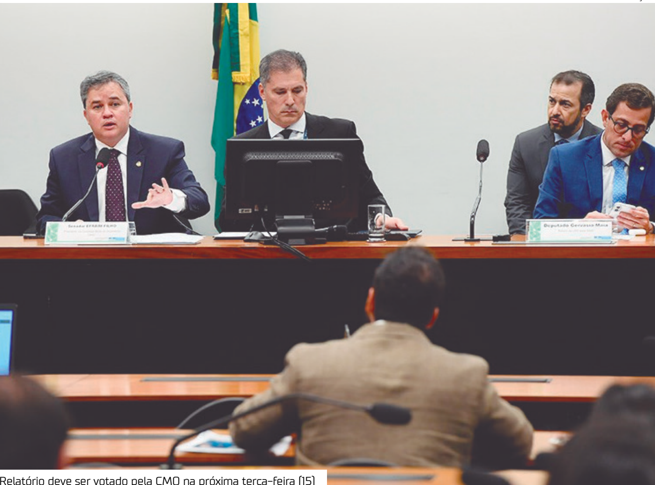
Relatório deve ser votado pela CMO na próxima terça-feira [15]

A Comissão Mista de Orçamento (CMO) recebeu nesta na terça-feira (8) o relatório preliminar do projeto da Lei de Diretrizes Orçamentárias (LDO) de 2026 (PLN 2/2025). O texto estabelece as regras para que os parlamentares apresentem emendas à proposta do governo, principalmente para o anexo de prioridades e metas para 2026. A LDO orienta a elaboração e a execução do Orçamento anual. Elaborado pelo deputado Gervásio Maia (PSB-PB), o relatório deve ser votado pela CMO na próxima terça-feira (15).