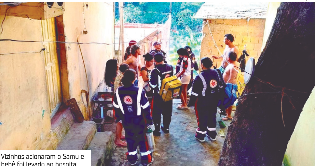
Vizinhos acionaram o Samu e bebê foi levado ao hospital

tre entulhos no quintal, ainda com o cordão umbilical, acabou socorrido com vida pelo Serviço de Atendimento Móvel de Urgência (Samu). Ele segue internado na maternidade Ana Braga, em estado estável e sem risco de morte.