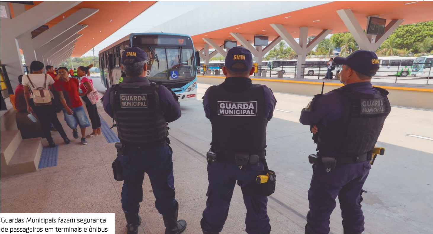
Guardas Municipais fazem segurança de passageiros em terminais e ônibus

Desde 2021, a prefeitura, por meio do Instituto Municipal de Mobilidade Urbana (IMMU), passou a instalar câmeras de segurança em todos os veículos, também adotou o sistema de biometria facial, além do