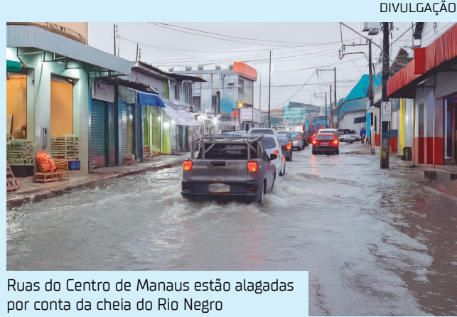
Ruas do Centro de Manaus estão alagadas por conta da cheia do Rio Negro

A travessa Tabelião Lessa, ao lado do mercado, e a rua dos Barés, nos fundos do prédio histórico, estão cobertas pela água.