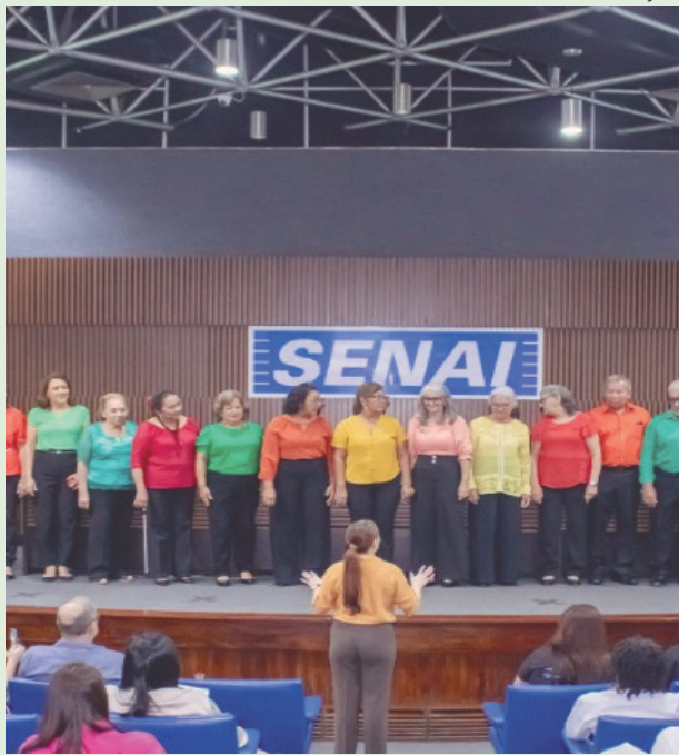
Trabalhadores com mais de 50 anos sofrem resistência