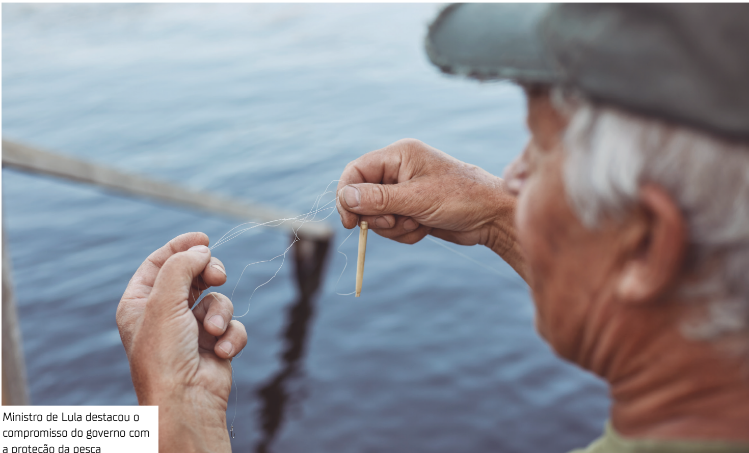
Ministro de Lula destacou o compromisso do governo com a proteção da pesca

A medida foi regulamentada pelo Governo Federal em junho, por meio de medida provisória nº 1.303/2025 e o Decreto nº 12.527/2025. Além disso, a Controladoria-Geral da União (CGU) deu início, na última segunda-feira (07/07) a um trabalho de auditoria sobre o Seguro-defeso, em 23 cidades dos Estados do Acre, Amazonas,