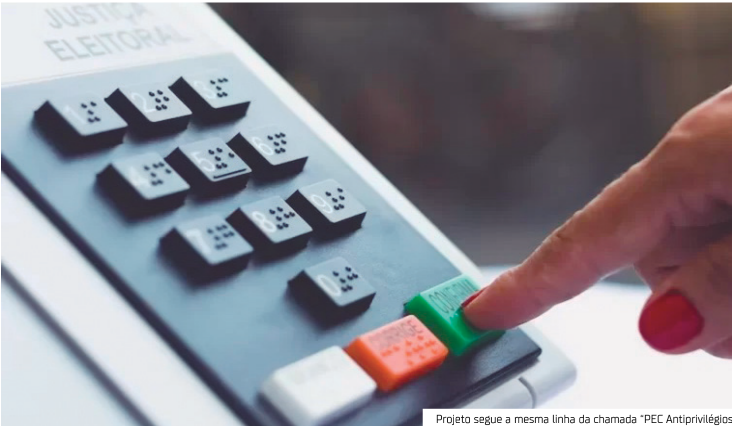
Projeto segue a mesma linha da chamada “PEC Antiprivilégios

“PEC Antiprivilégios”, já em tramitação, que visa cortar benefícios considerados excessivos no serviço público. Ambas compartilham o mesmo espírito: reestruturar o funcionamento da política nacional para torná-la mais enxuta, eficiente e responsável com o dinheiro público. A nova PEC surge em um momento de forte debate sobre o tamanho do Legislativo e os gastos do setor público. Ela vai na contramão de iniciativas como o recente aumento no número de deputados federais, aprovado pelo Congresso — medida que seu autor foi contra, defendendo em vez disso a redistribuição das cadeiras já existentes. A articulação por trás da proposta é liderada por parlamentares de diferentes partidos, unidos pela convicção de que política deve ser sinônimo de serviço, e não de privilégios. Entre os nomes à frente desse movimento está o deputado federal Amom Mandel (Cidadania-AM). “Não uso cotão. Nunca gasto um centavo com carro oficial. Meu gabinete funciona com custo mínimo e resulta-