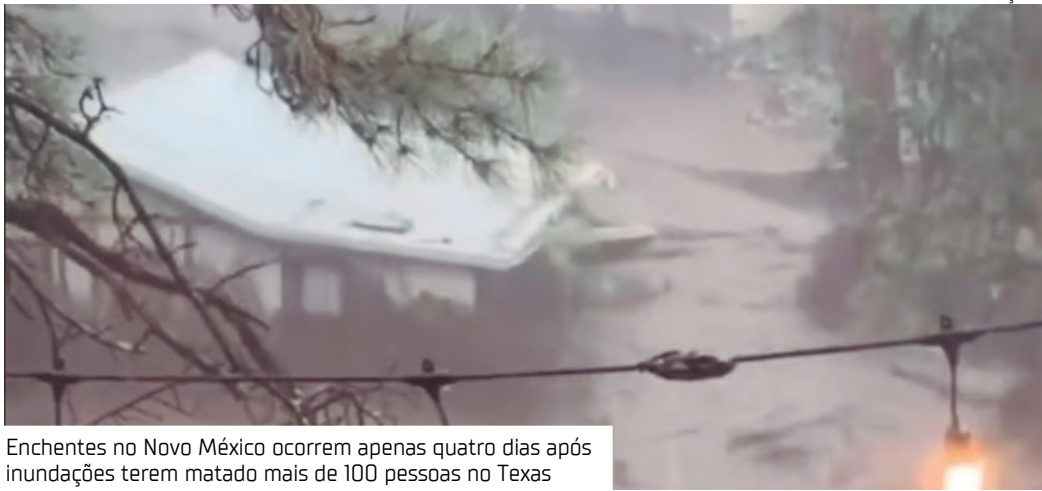
Enchentes no Novo México ocorrem apenas quatro dias após inundações terem matado mais de 100 pessoas no Texas

A porta-voz do Departamento de Segurança Inter-