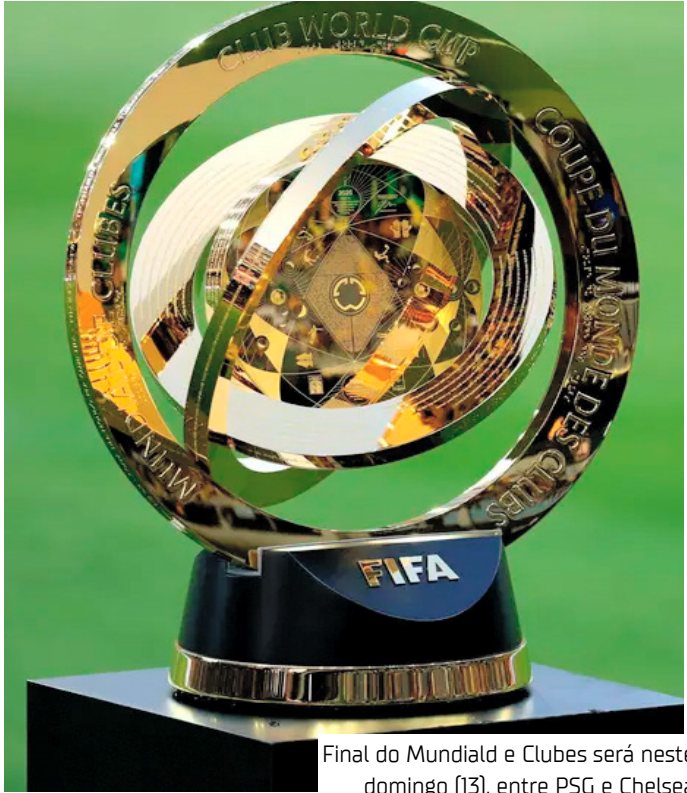
Final do Mundial de Clubes será neste domingo (13), entre PSG e Chelsea

O campeão levará para casa 40 milhões de dólares só por vencer a final, o que na conversão atual representa cerca de R$ 200 milhões. O vice-campeão ficará com 30 milhões de dólares, ou aproximadamente R$ 165 milhões. Além da quantia que depende do resultado da decisão, Chelsea e PSG já garantiram muito dinheiro no Mundial até aqui. Prêmio por participar do torneio, por vitórias e empates na fase de grupos, e por cada classificação até a última etapa. O valor total para um destes clubes pode chegar até a casa dos 125 milhões de dólares, aproximadamente R$ 700 milhões. Chelsea e PSG na decisão do Mundial de Clubes Para chegar à final, o Chelsea eliminou o Fluminense na semifinal. Com dois gols do brasileiro João Pedro, a vaga foi conquistada com uma vitória por 2 a 0. Do outro lado da chave, o PSG não tomou conhecimento do Real Madrid e venceu por 4 a 0, com dois gols de Fabián Ruiz, um de Ousmane Dembélé e um de Gonçalo Ramos.