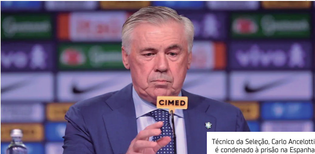
Técnico da Seleção, Carlo Ancelotti é condenado à prisão na Espanha

O técnico da Seleção Brasileira, Carlo Ancelotti, foi condenado a um ano de prisão por fraude fiscal na Espanha. O treinador italiano também deverá pagar uma multa no valor de 386,36 mil euros (R$ 2,47 milhões, na cotação atual). A condenação é da Seção 30 do Tribunal Provincial de Madrid, e foi divulgada pela agência de notícias EFE. Segundo a agência, a prisão e a multa se referem a um suposto delito fiscal cometido em 2014. Ancelotti foi denunciado por suposta fraude também em 2015, mas foi absolvido. Ao Lance! a CBF informou que acompanha o caso, e que o processo é conduzido pelo staff pessoal do Carlo Ancelotti. O treinador ainda