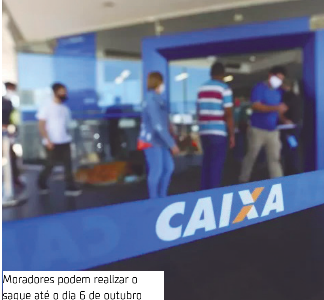
Moradores podem realizar o saque até o dia 6 de outubro