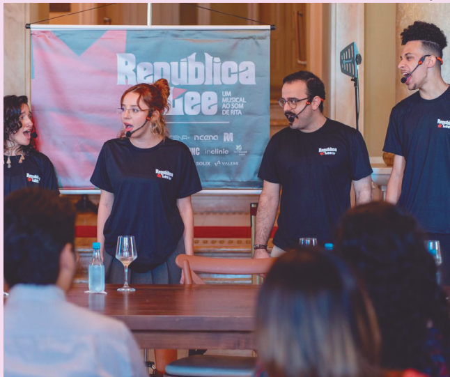
Espectáculo inspirado em Rita Lee, tem sessão neste sábado (12)