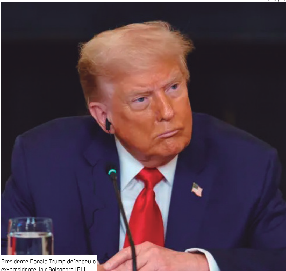
Presidente Donald Trump defendeu o ex-presidente Jair Bolsonaro (PL)

“A forma como o Brasil tem tratado o ex-Presidente Bolsonaro, um líder altamente respeitado em todo o mundo durante seu mandato, inclusive pelos Estados Unidos, é uma vergonha internacional. Esse julgamento não deveria estar ocorrendo. É uma Caça às Bruxas que deve acabar