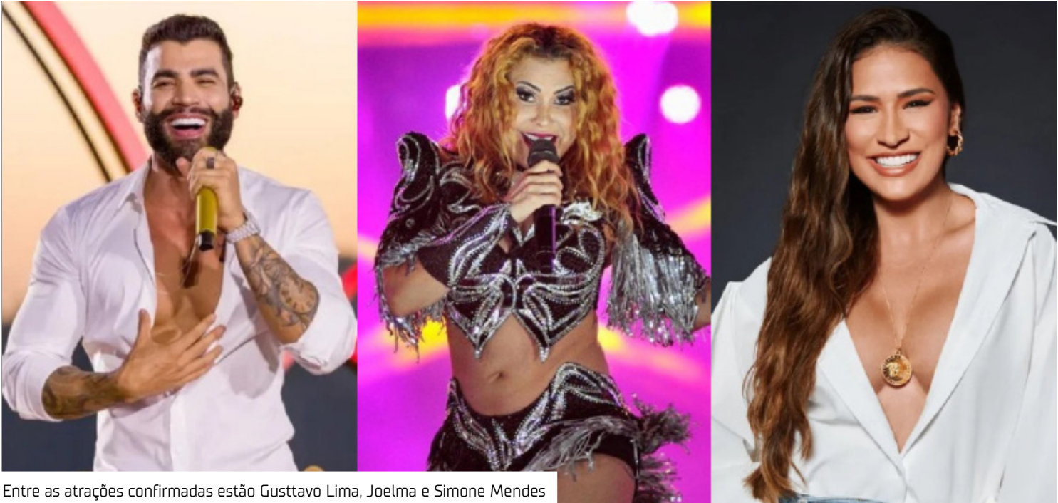
Entre as atrações confirmadas estão Gustavo Lima, Joelma e Simone Mendes