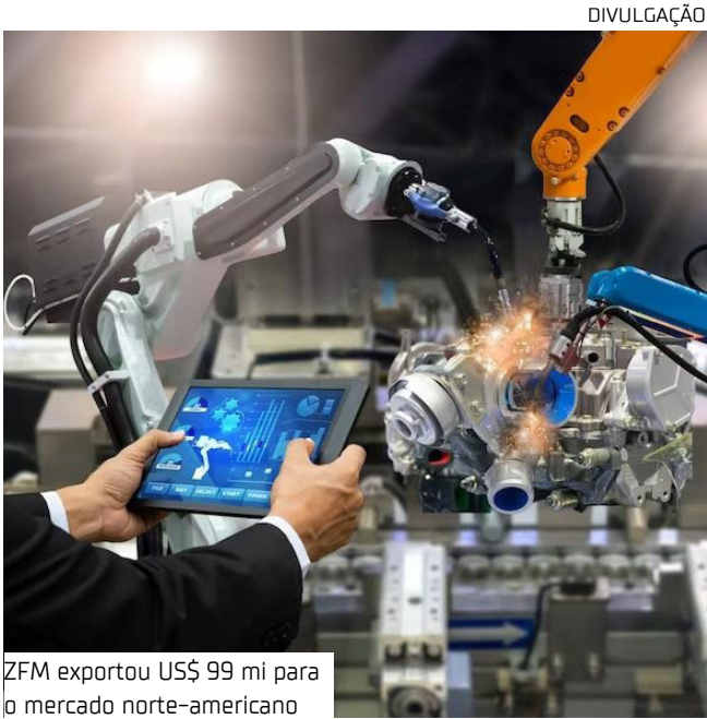
ZFM exportou US$ 99 mi para o mercado norte-americano