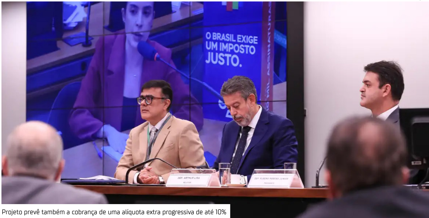
Projeto prevê também a cobrança de uma alíquota extra progressiva de até 10%

O Projeto de Lei (PL) 1.087/2025, que reforma o Imposto de Renda (IR), foi aprovado ontem (16), em votação simbólica, na Comissão Especial da Câmara dos Deputados que analisa o texto. Apresentada pelo governo federal, a proposta prevê isenção do Imposto sobre a Renda da Pessoa Física (IRPF) para quem ganha até R$ 5 mil mensais e reduz parcialmente o imposto para aqueles que recebem até R$ 7 mil. O texto agora pode ser votado no plenário da Casa, o que deve ocorrer em agosto. Os deputados aprovaram o parecer do relator, Arthur Lira (PP-AL), que, entre outros pontos, ampliou de R$ 7 mil para R$ 7.350,00 o valor para a redução parcial do imposto. O projeto prevê