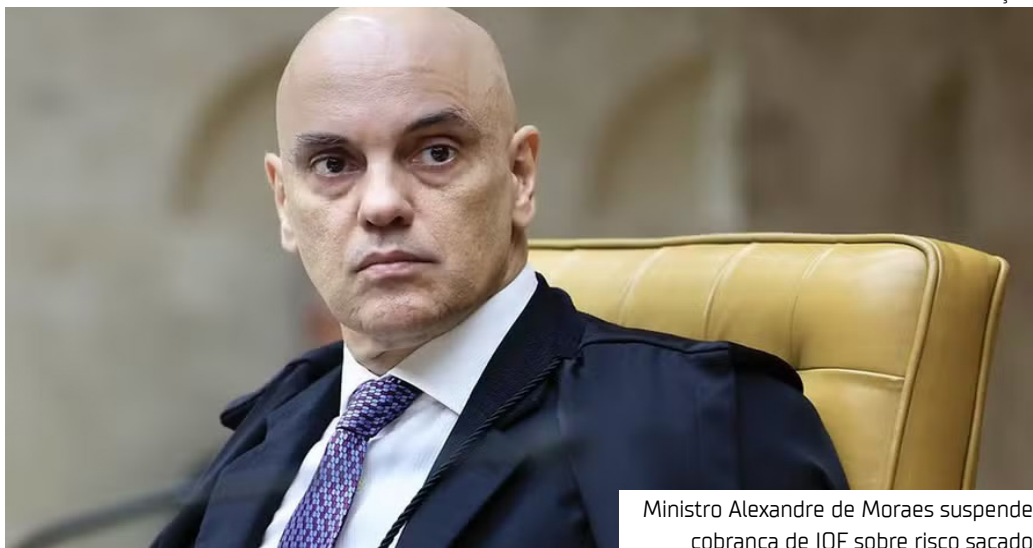
Ministro Alexandre de Moraes suspende cobrança de IOF sobre risco sacado

crédito” feriram o princípio da segurança jurídica, pois o próprio Poder Público sempre considerou tratar-se de coisas diversas”, aponta o ministro. Moraes destacou que o decreto que promoveu as mudanças no IOF foi editado seguindo o que é previsto pela Constituição, que autoriza o Executivo a alterar alíquotas de tributos com função extrafiscal — como o IOF. Segundo ele, a medida não extrapolou os limites legais previstos na Lei nº 8.894/1994, que disciplina o imposto. “Não restou comprovado qualquer desvio de finalidade na alteração das alíquotas pelo ato do Presidente da República”, afirma.