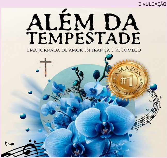
Lançamento da obra ocorrerá no Palácio Rio Negro, Centro de Manaus