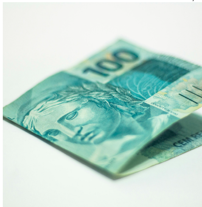
Desinformação afeta o planejamento financeiro e o acesso a reajustes

“Essas informações mostram o quanto o desconhecimento trabalhista ainda é um desafio no país. Sem saber o que é dissídio, muitos trabalhadores deixam de acompanhar se o reajuste foi aplicado corretamente ou de se planejar com base nesse aumento”, explica a redação da Meutudo.