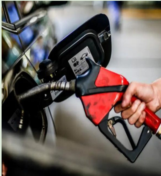
Gasolina apresentou queda de 0,47% no Brasil