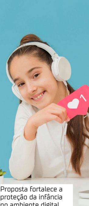
Proposta fortalece a proteção da infância no ambiente digital