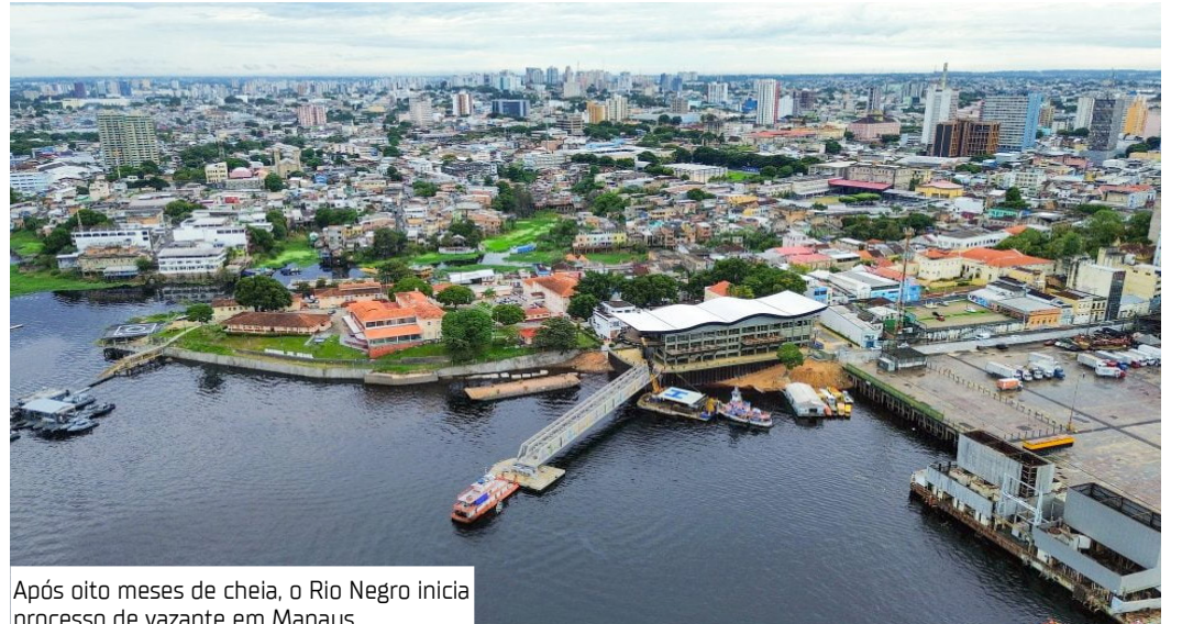
Após oito meses de cheia, o Rio Negro inicia processo de vazante em Manaus

Mesmo com o início da vazante, os efeitos da cheia ainda são sentidos. Especialistas alertam que as águas devem continuar baixando nas próximas semanas, mas a normalização total pode demorar até setembro, dependendo das condições climáticas.