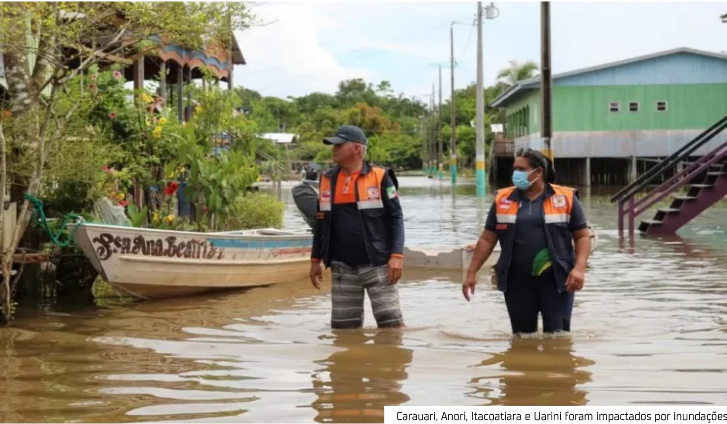
Carauari, Anori, Itacoatiara e Uarini foram impactados por inundações

conhecimento abrangeu municípios da Bahia, Ceará, Minas Gerais, Paraíba, Paraná, Pernambuco, Rio Grande do Norte, Rio Grande do Sul e Santa Catarina, afetados por eventos como chuvas intensas, estiagens, geadas, deslizamentos e queda de granizo. As portarias com os reconhecimentos foram publicadas no Diário Oficial da União (DOU). No caso dos municípios amazonenses, o cenário de inundações exige atenção redobrada, dada a extensão territorial e os desafios logísticos enfrentados pelas comunidades ribeirinhas e isoladas. Como solicitar recursos Com o reconhecimento da situação de emergência, as prefeituras podem acessar recursos federais por meio do Sistema Integrado de Informações sobre Desastres (S2iD). Após o envio dos planos de trabalho e análise técnica da Defesa Civil Nacional, os valores aprovados são oficializados por portaria publicada no DOU.