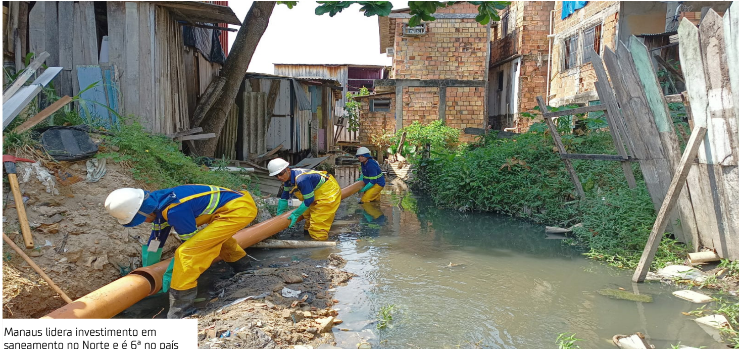
Manaus lidera investimento em saneamento no Norte e é 6ª no país

“Investir em saneamento é salvar vidas. É dar dignidade para quem sempre foi esquecido. Manaus está mostrando que é possível fazer diferente: mais de R$ 1 bilhão investidos, rede de esgoto chegando onde nunca tinha chegado, água tratada nos bicos, nos rip-raps, nas áreas mais vulneráveis da cidade. Isso é justiça social. Isso é cuidar de gente. E a gente