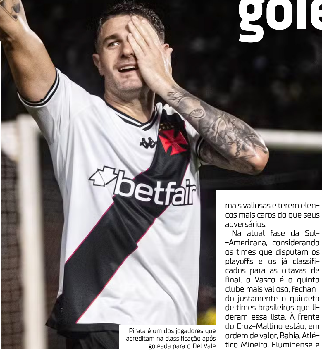
Pirata é um dos jogadores que acreditam na classificação após goleada para o Del Vale

mais valiosas e terem elencos mais caros do que seus adversários.