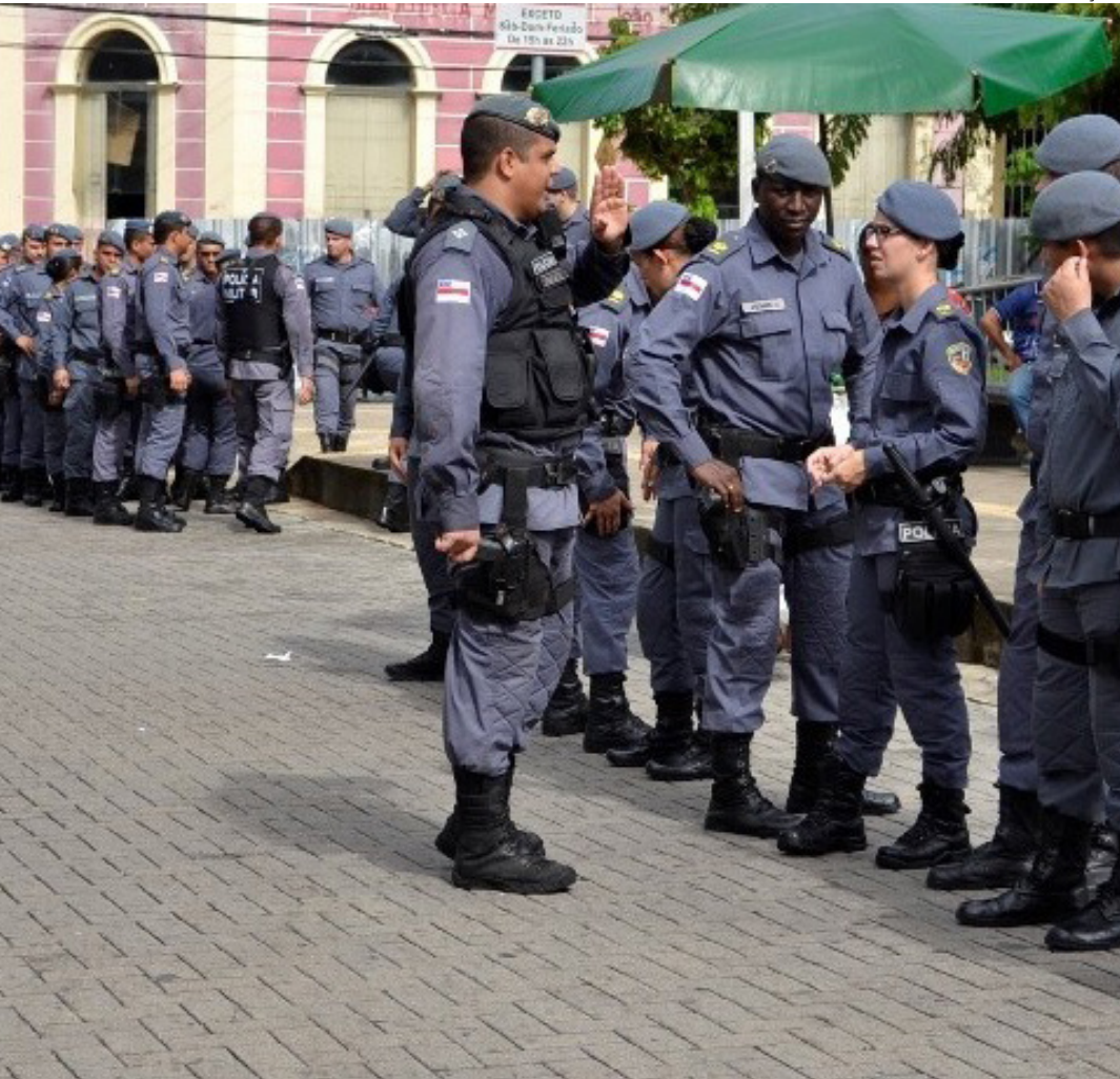
Iniciativa torna possível a realização exames específicos voltados à saúde ocular dos servidores