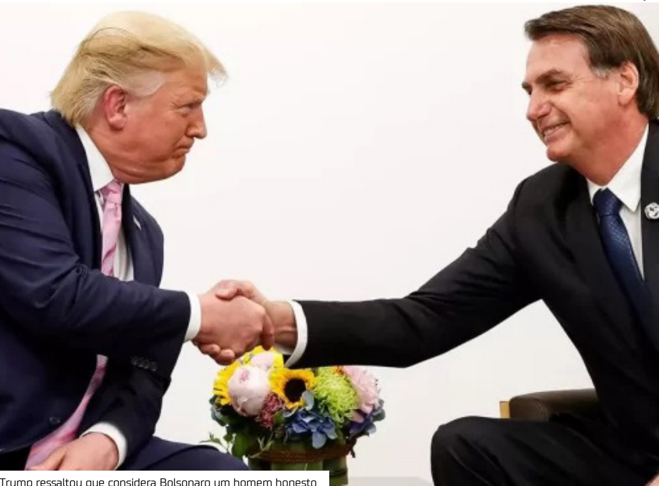
Trump ressaltou que considera Bolsonaro um homem honesto

O ex-presidente Jair Bolsonaro (PL) expressou sua admiração pelo presidente dos Estados Unidos, Donald Trump, em entrevista ao portal Poder360 na terça-feira (15). Bolsonaro afirmou ter uma relação próxima com Trump e se declarou “apaixonado por ele”. “Trump é imprevisível. Eu gosto dele. Eu sou apaixonado por ele. Sou apaixonado pelo povo americano, pela política americana. Nunca escondi isso. Trump sempre me tratou como um irmão”, declarou Bolsonaro. O ex-presidente também destacou o orgulho por ter sido mencionado