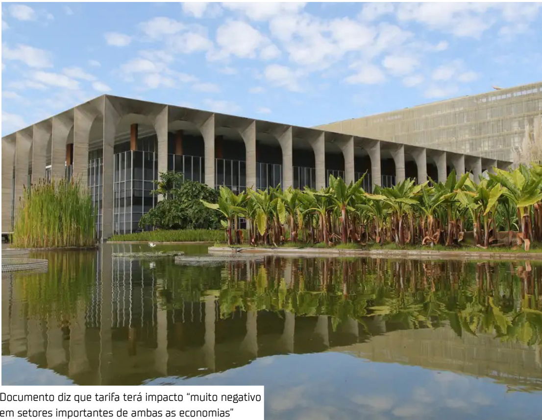
Documento diz que tarifa terá impacto “muito negativo em setores importantes de ambas as economias”

O governo Lula informou ontem (16) que enviou uma nova carta ao governo dos Estados Unidos na qual manifestou “indignação” com a tarifa de 50% sobre produtos brasileiros, informou estar disposto a negociar e cobrou resposta a uma outra mensagem enviada em maio. Segundo o governo, a carta enviada em maio continha uma proposta confidencial sobre possibilidades de negociação de tarifas comerciais. A nova carta afirma às autoridades americanas que o Brasil acumula com os EUA “grandes déficits comerciais” em bens e em serviços e acrescenta que, nos últimos 15 anos, esse saldo negativo para o Brasil chegou a quase US$ 410 bilhões, segundo dados do próprio governo americano. Os números desmentem o argumento de Trump que, ao justificar a tarifa de 50% sobre produtos brasileiros na semana passada, afirmou que a relação comercial dos EUA com o Brasil é “injusta” e causa déficits comerciais à