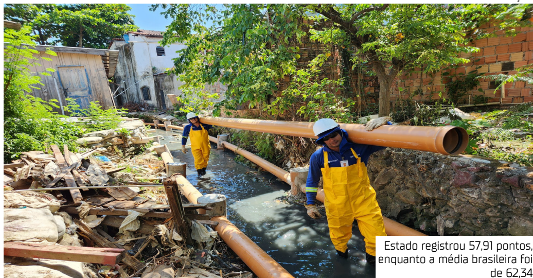
Estado registrou 57,91 pontos, enquanto a média brasileira foi de 62,34

O Amazonas ficou abaixo da média nacional no Índice de Progresso Social (IPS) 2025, de acordo com dados divulgados pelo Projeto Amazônia 2030, em junho. O estado registrou 57,91 pontos, enquanto a média dos estados brasileiros foi de 62,34. O IPS é uma ferramenta que mede o desempenho social e ambiental dos territórios brasileiros com base em 57 indicadores extraídos de fontes públicas. A pontuação geral varia de 0 a 100 e serve como instrumento para planejamento e aprimoramento de políticas públicas. Segundo a avaliação, a capital Manaus alcançou 63,19 pontos, ficando na 21ª colocação entre as capitais do país. A cidade é a segunda melhor avaliada da região