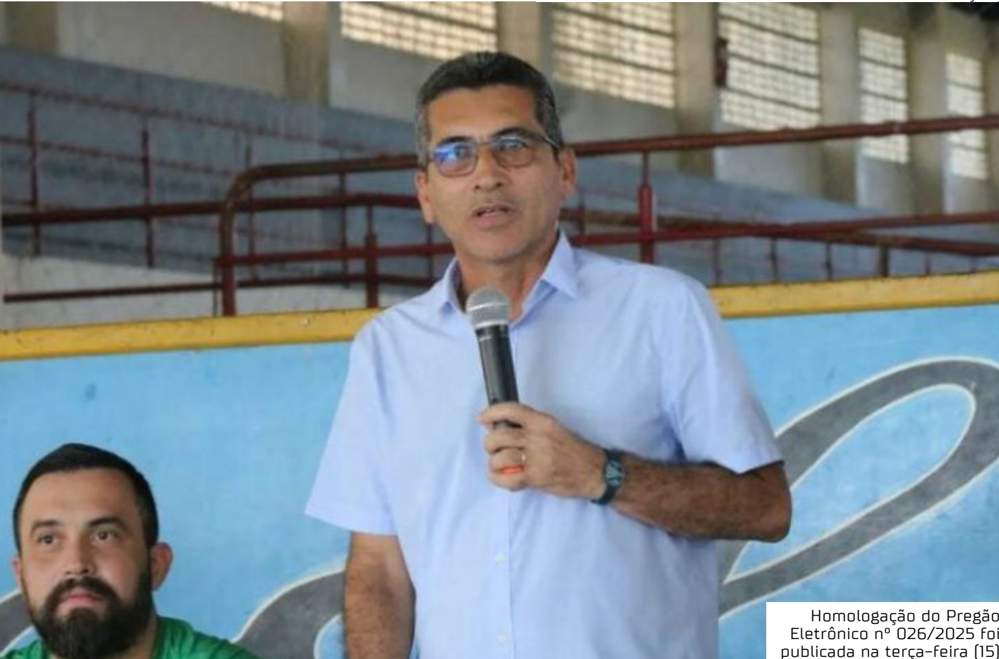
Homologação do Pregão Eletrônico nº 026/2025 foi publicada na terça-feira (15)

vez que a Megacon firma contrato milionário com a Prefeitura de Manicoré. Em fevereiro deste ano, a empresa foi contratada por R$ 3.087.591,42 para realizar serviços de capina e roçagem nas áreas externas de escolas rurais, após vencer o Pregão Eletrônico nº 001/2025 com a proposta de menor preço. Em 2023, a mesma empresa prestou serviços semelhantes para a zona urbana, por R$ 3,5 milhões, além de outro contrato, também em 2023, no valor de R$ 1,8 milhão, para capinar áreas de escolas da zona rural do município.