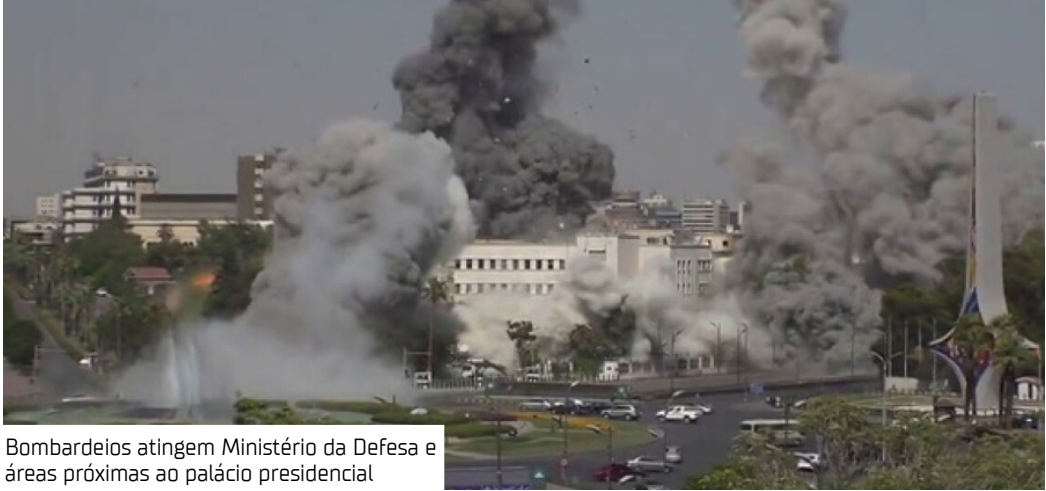
Bombardeios atingem Ministério da Defesa e áreas próximas ao palácio presidencial

Israel classifica governo sírio como jihadista Israel descreveu os atuais