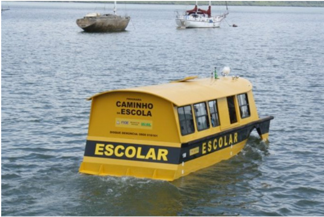
Quase 4% das crianças e jovens de 4 a 17 anos estão fora da escola no Amazonas

O Ministério Público Federal (MPF) enviou recomendação urgente à Secretaria de Estado de Educação e Desporto Escolar do Amazonas (Seduc) para garantir a educação de alunos em aldeias e comunidades tradicionais em todo o estado. Com centenas de estudantes indígenas e ribeirinhos sem aulas ou com ensino precário, a pasta tem até 15 de julho para responder acerca do acatamento da recomendação, bem