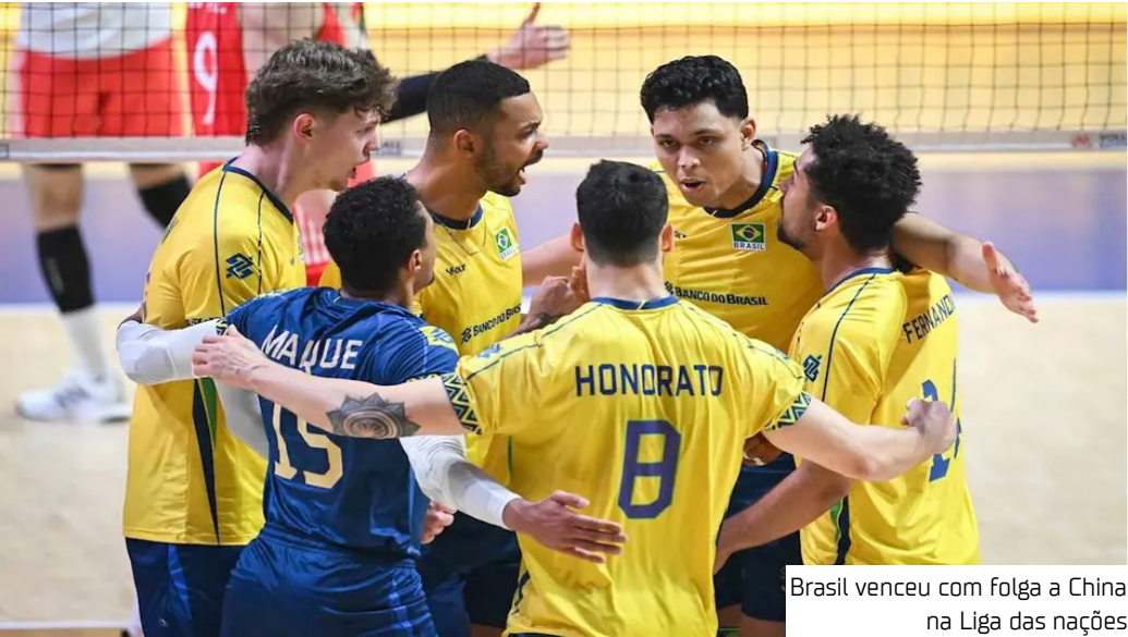
Brasil venceu com folga a China na Liga das nações