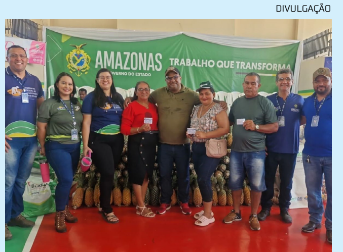
Governo do Amazonas beneficia produtores rurais de Careiro da Várzea

“Por determinação do governador Wilson Lima, estamos concentrando esforços em promover a regularização de documentos dos produtores para que eles possam ter acesso ao crédito rural e outras políticas públicas destinadas ao segmento”, concluiu.