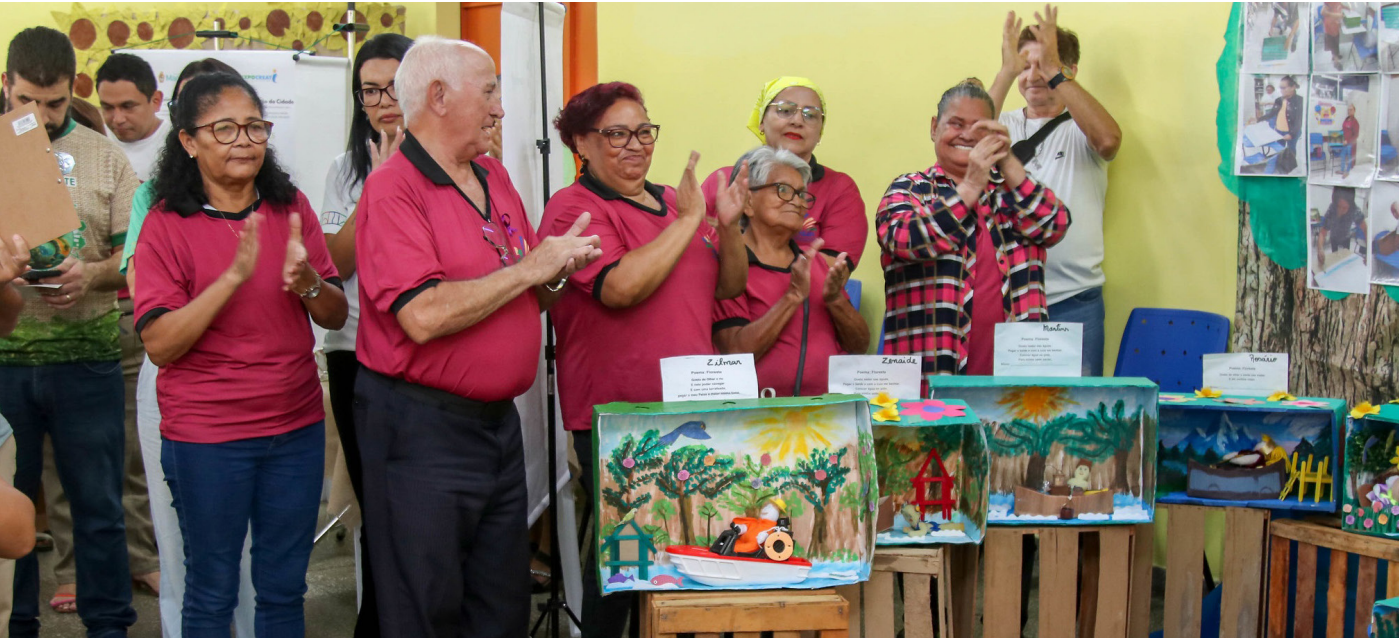
Com tema amazônico, idosos participam de feira de Ciências da Semed

Com o tema “O Encontro das Águas: do mito à ciência amazônica”, a Prefeitura de Manaus, por meio da Secretaria Municipal de Educação (Semed), realizou, ontem (30), a feira de Ciências, Tecnologia e Educação Ambiental, etapa Centro Municipal de Escolarização do Adulto e da Pessoa Idosa (Cemeapi). O evento, que ocorreu no auditório da Escola Municipal de Educação Especial (Emee) André Vidal de Araújo, localizado na avenida Maceió, Zona Centro-Sul, contou com a participação de 50 idosos.