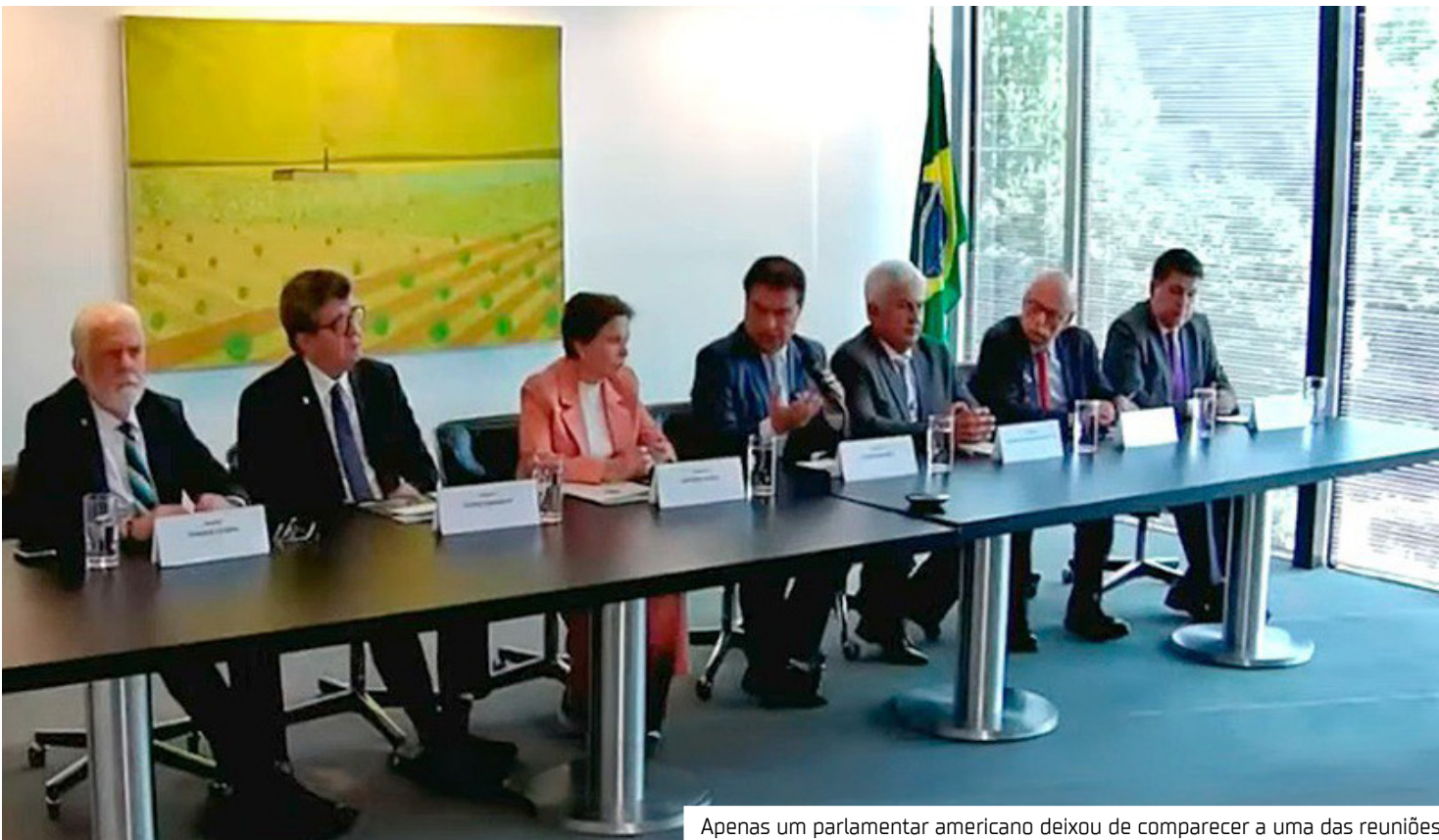
Apenas um parlamentar americano deixou de comparecer a uma das reuniões

se reuniu com nove parlamentares americanos, sendo oito do Partido Democrata e um do Partido Republicano, o mesmo do presidente Donald Trump. No dia anterior, a comitiva multipartidária esteve com empresários. Entre os congressistas visitados estão os democratas Tim Kaine, Ed Markey, Mark Kelly, Chris Coons, Jeanne Shaheen, Martin Heinrich e o republicano Thom Tillis, além da deputada Sydney Kamlager-Dove, co-presidente do Brazil Caucus. Os senadores brasileiros apresentaram aos americanos as implicações da medida tarifária nos estados representados por esses congressistas. Presidente da Comissão de Relações Exteriores e Defesa Nacional (CRE) do Senado e coordenador da missão, o senador Nelsinho Trad (PSD-MS) disse que nunca coube à comitiva, formada por oito senadores brasileiros, negociar, visto que tal prerrogativa é exclusiva dos Poderes Executivos, mas que conseguiram, sim, conscientizar os americanos da situação “perde-perde”