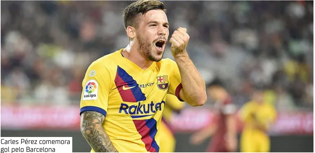
Carles Pérez comemora gol pelo Barcelona

Ex-Barcelona, Carles Pérez foi hospitalizado após sofrer uma mordida de um cachorro em seu órgão genital, segundo a imprensa grega. O jogador não se encontra em estado grave, mas não deve retornar ao treino tão cedo. Neste momento, o espanhol se encontra sob observação e levou seis pontos na região em que foi mordido. Formado no Barcelona, Pérez atualmente defende o Aris Salonica, da Grécia, embora pertença ao Celta de Vigo. A chegada na Grécia era vista como uma nova oportunidade para Carles Pérez após uma campanha irregular no Benfica. No entanto, os planos do jogador foram adiados, uma vez que não há prazo para a reincorporação