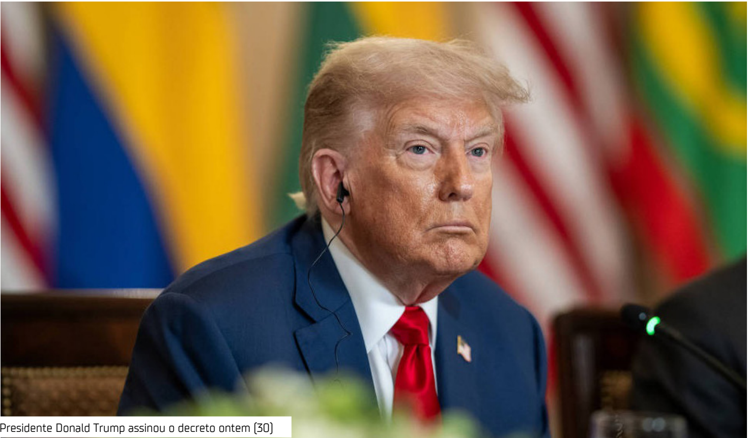
Presidente Donald Trump assinou o decreto ontem (30)

O texto não faz qualquer menção ao comércio bilateral