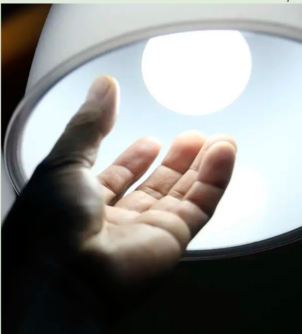
Multas ainda estão sendo questionadas na justiça