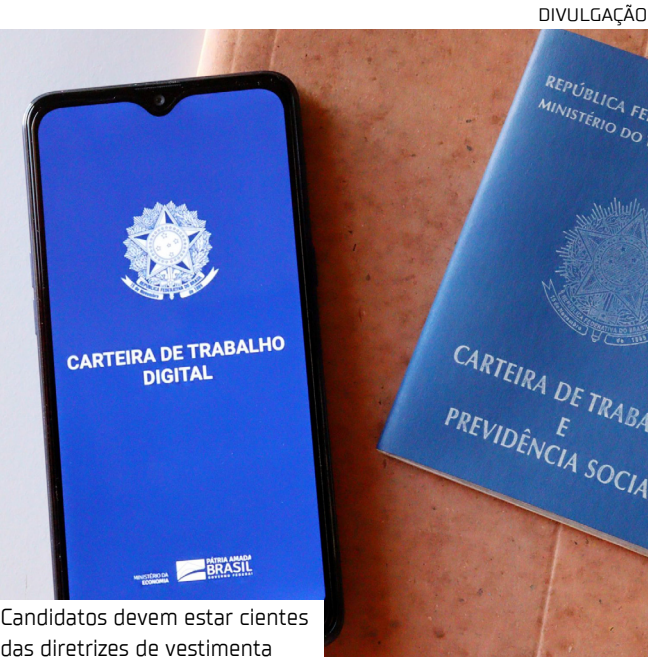
Candidatos devem estar cientes das diretrizes de vestimenta

Os interessados devem estar munidos do comprovante de vacinação (Covid-19), currículo, certificados de cursos e documentos pessoais (RG, CPF, PIS, CTPS, comprovante de escolaridade e residência). Não é necessário apresentar cópias, somente os documentos originais.