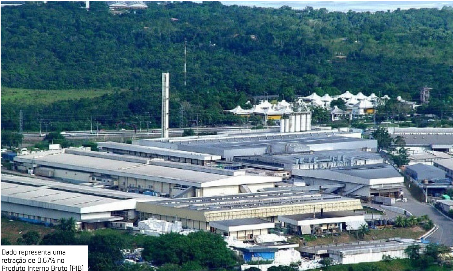
Dado representa uma retração de 0,67% no Produto Interno Bruto (PIB)

A Superintendência da Zona Franca de Manaus (Suframa) decidiu adotar cautela diante da informação de perda de R$ 1,1 bilhão do Produto Interno Bruto (PIB) das importações do Polo Industrial de Manaus (PIM), relacionado ao aumento das tarifas de importação anunciado