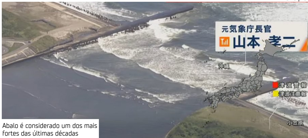
Abalo é considerado um dos mais fortes das últimas décadas

O tsunami gerado pelo terremoto atingiu partes da península de Kamchatka com ondas entre 3 e 4 metros, segundo as autoridades russas. Em vídeo publicado nas