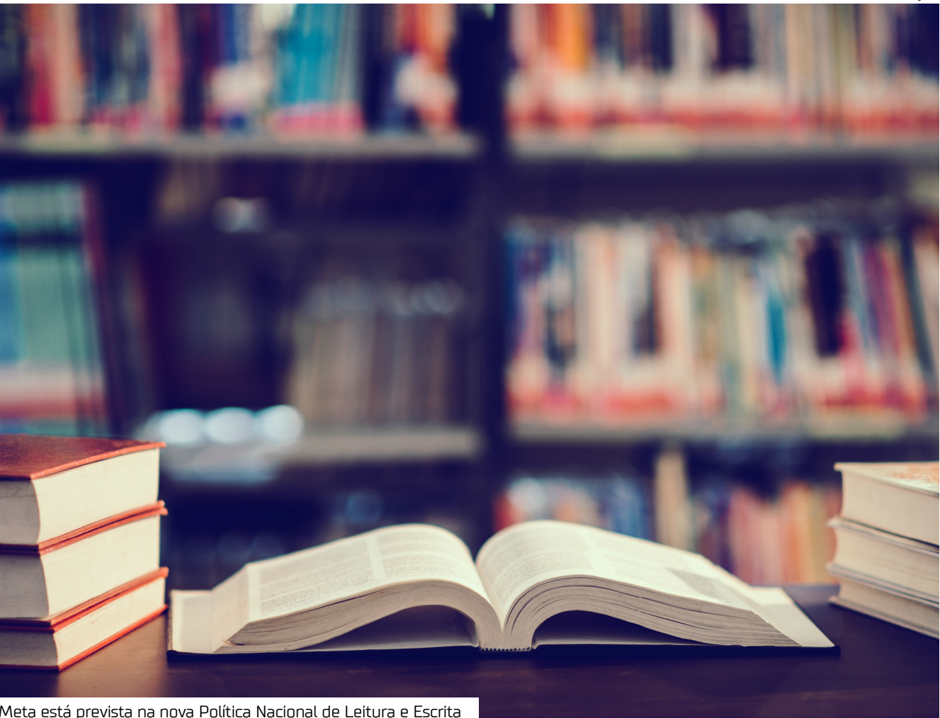
Meta está prevista na nova Política Nacional de Leitura e Escrita