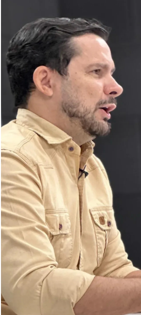
Informação foi divulgada nas redes sociais do deputado