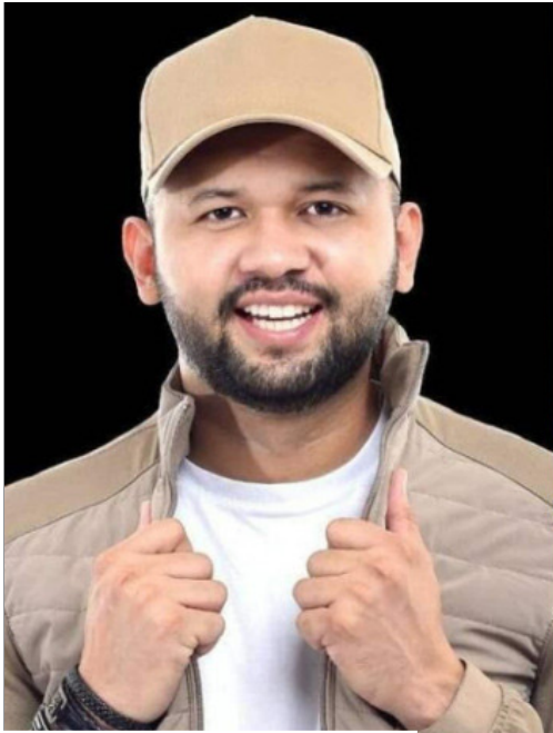
Festival contará com shows musicais, desfiles e exposições gastronômicas

Além da programação artística, a Feira da Agroindústria acontece simultaneamente à festa, com foco na agricultura familiar e nos produtos locais, como o cupuaçu.