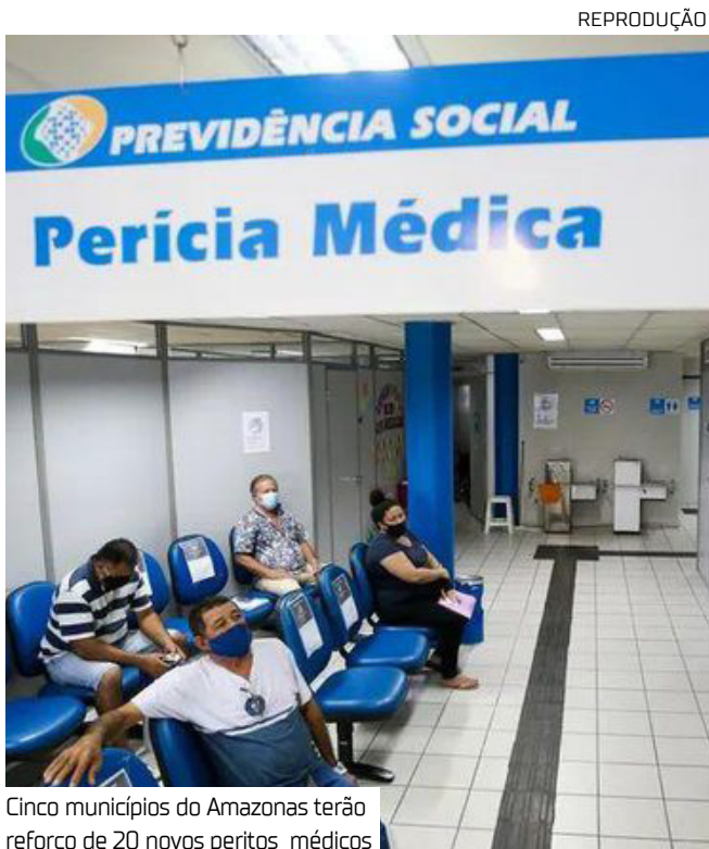
Cinco municípios do Amazonas terão reforço de 20 novos peritos médicos

As contratações são fruto de concurso público realizado em fevereiro deste ano, após 15 anos sem contratações. Nesta quarta-feira (30), o Ministério da Previdência Social publicou no Diário Oficial da União a nomeação dos primeiros 250 profissionais. A chegada dos novos servidores vai contribuir de maneira significativa com a agilidade no atendimento e o enfrentamento à fila do INSS.