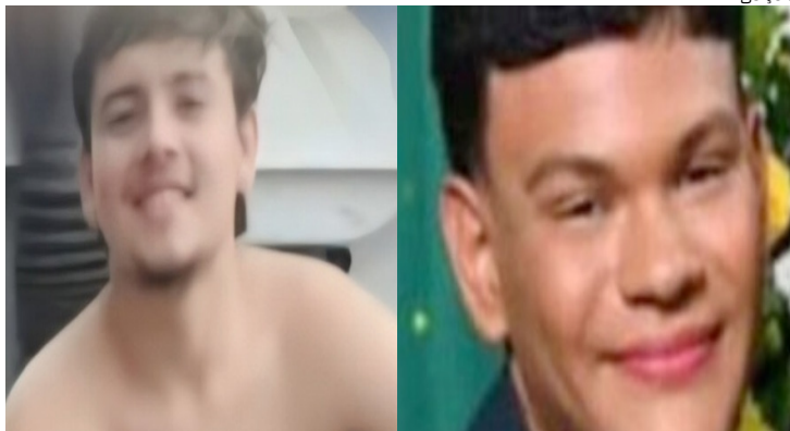
Suspeito (à esquerda) confessou a polícia ter cometido crime passionai