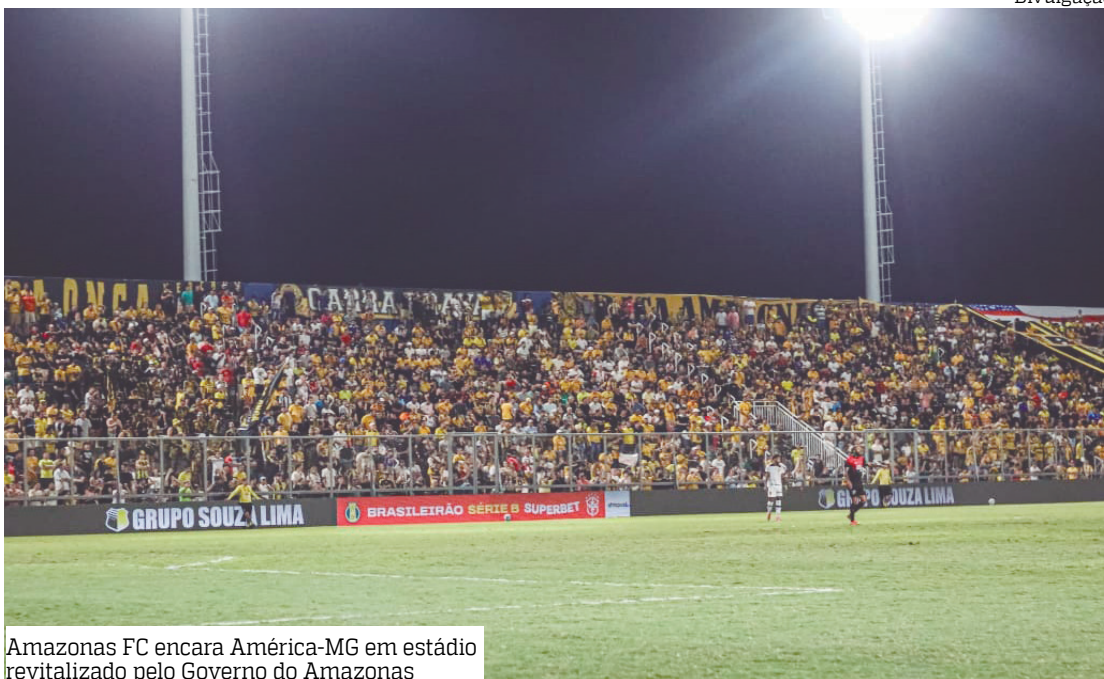
Amazonas FC encara América-MG em estádio revitalizado pelo Governo do Amazonas