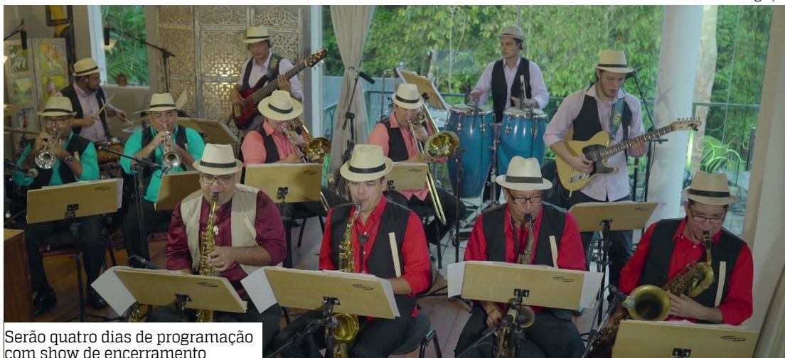
Serão quatro dias de programação com show de encerramento

A programação inclui shows, rodas de conversa, oficinas e exibição de documentários. No encerramento, o Largo de São Sebastião recebe atrações como Água