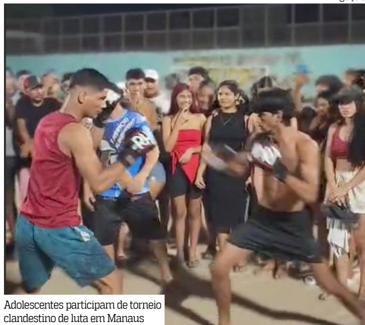
Adolescentes participam de torneio clandestino de luta em Manaus

Adolescentes foram flagrados participando de lutas clandestinas no campo da Comunidade São Cristóvão, no bairro Zumbi dos Palmares, zona leste de Manaus, na noite de terça-feira (12).