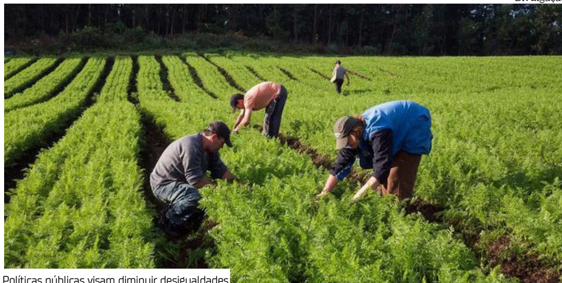
Políticas públicas visam diminuir desigualdades

O programa AgroAmigo, que oferece microcrédito para agricultores familiares, têm desempenhado papel fundamental para o Brasil sair do Mapa da Fome. O país conseguiu reduzir para menos de 2,5% o número de pessoas em situação de insegurança alimentar, resultado de políticas públicas que visam diminuir desigualdades, gerar emprego e apoiar pequenos produtores rurais.