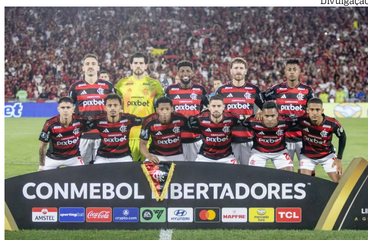
Flamengo costuma lotar o Maracanã em jogos nacionais e internacionais

A vitória do Flamengo por 1 a 0 diante do Internacional na quarta-feira (13), pelo jogo de ida das oitavas de final da Libertadores, registrou o maior público de times brasileiros como mandantes nesta edição da competição. O Maracanã recebeu 63.567 pagantes (68.483 torcedores presentes). Além disso, a renda bruta também chamou atenção: R$ 5.176.821,50.