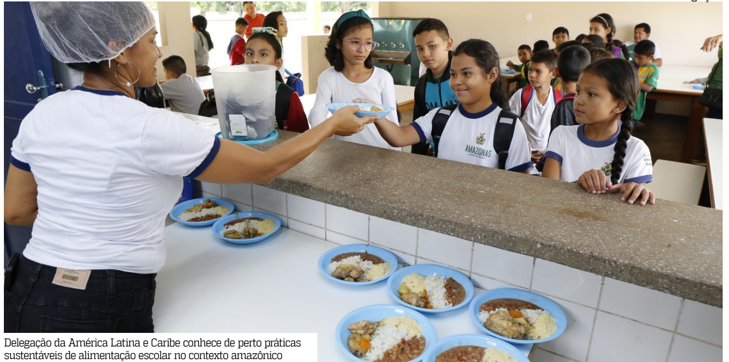
Delegação da América Latina e Caribe conhece de perto práticas sustentáveis de alimentação escolar no contexto amazônico

Participam representantes dos governos de Belize, Brasil, Chile, Colômbia, Costa Rica, Cuba, El Salvador, Equador, Guatemala, Honduras, Paraguai, República Dominicana, São Cristóvão e Névis, Santa Lú-