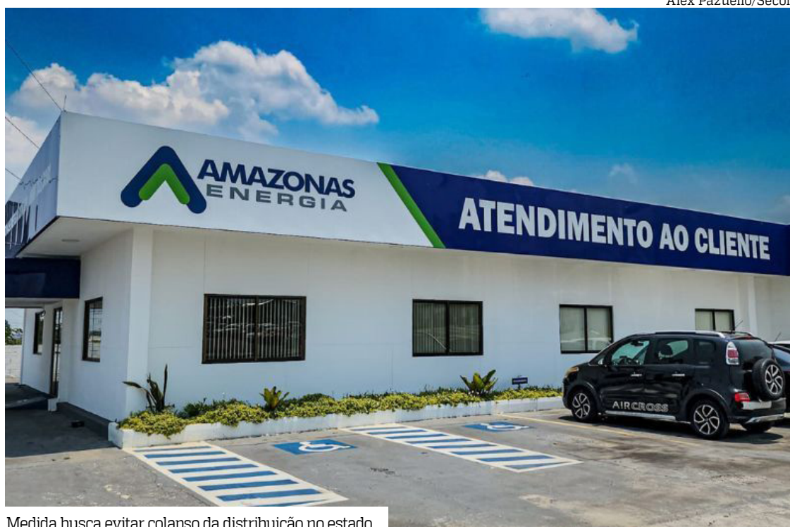
Medida busca evitar colapso da distribuição no estado

A liberação dos recursos considera decisão da juíza