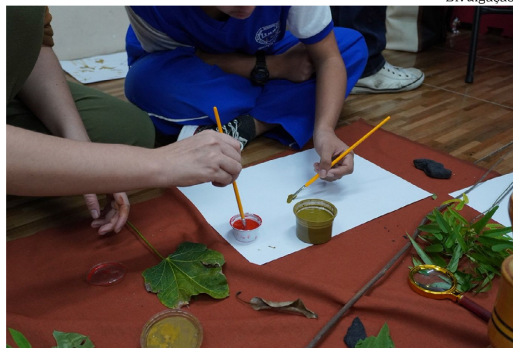
Atividade é planejada para respeitar os diferentes ritmos e necessidades