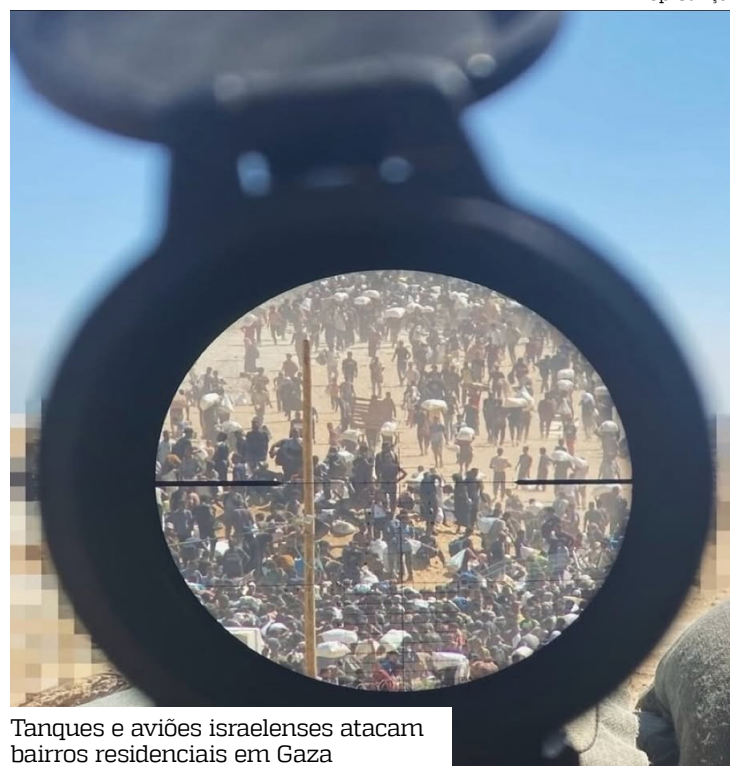
Tanques e aviões israelenses atacam bairros residenciais em Gaza

De acordo com o Ministério da Saúde de Gaza, controla-