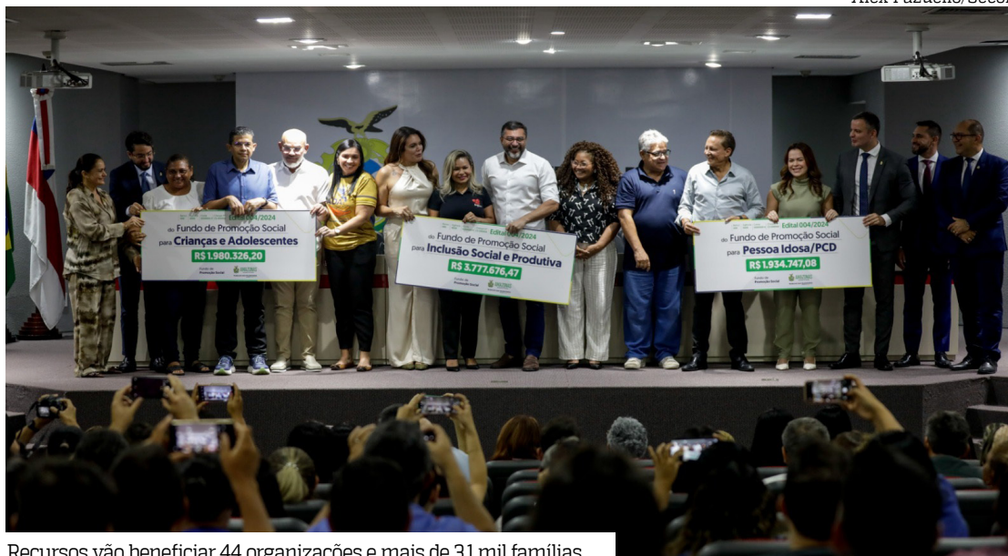
Recursos vão beneficiar 44 organizações e mais de 3,1 mil famílias

A assinatura dos Termos de Fomento foi realizada durante cerimônia promovida pelo Fundo de Promoção Social e Erradicação da Pobreza (FPS). Ao todo, os planos de trabalho contemplam mais de 3,1 mil famílias residentes em Manaus e nos municípios de Coari, Humaitá, Maués, Manacapuru e Parintins, ampliando a presença do