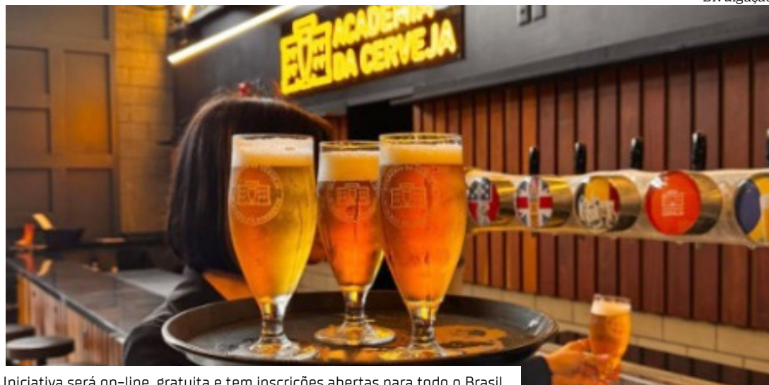
Iniciativa será on-line, gratuita e tem inscrições abertas para todo o Brasil

Mais do que simples pontos de encontro, os bares são espaços de socialização e fazem parte da cultura, e do coração, dos brasileiros. E quem dá vida a esse cenário são os garçons, almas dos bares e balcões, que têm o dia 11 de agosto dedicado a eles. Para celebrar os homens e mulheres tão importantes para esse setor, a partir do dia 15, estarão abertas as inscrições para o curso Bora Formar: Garçons, oferecido gratuitamente pela Academia da Cerveja, a escola de conhecimento e cultura cervejeira da