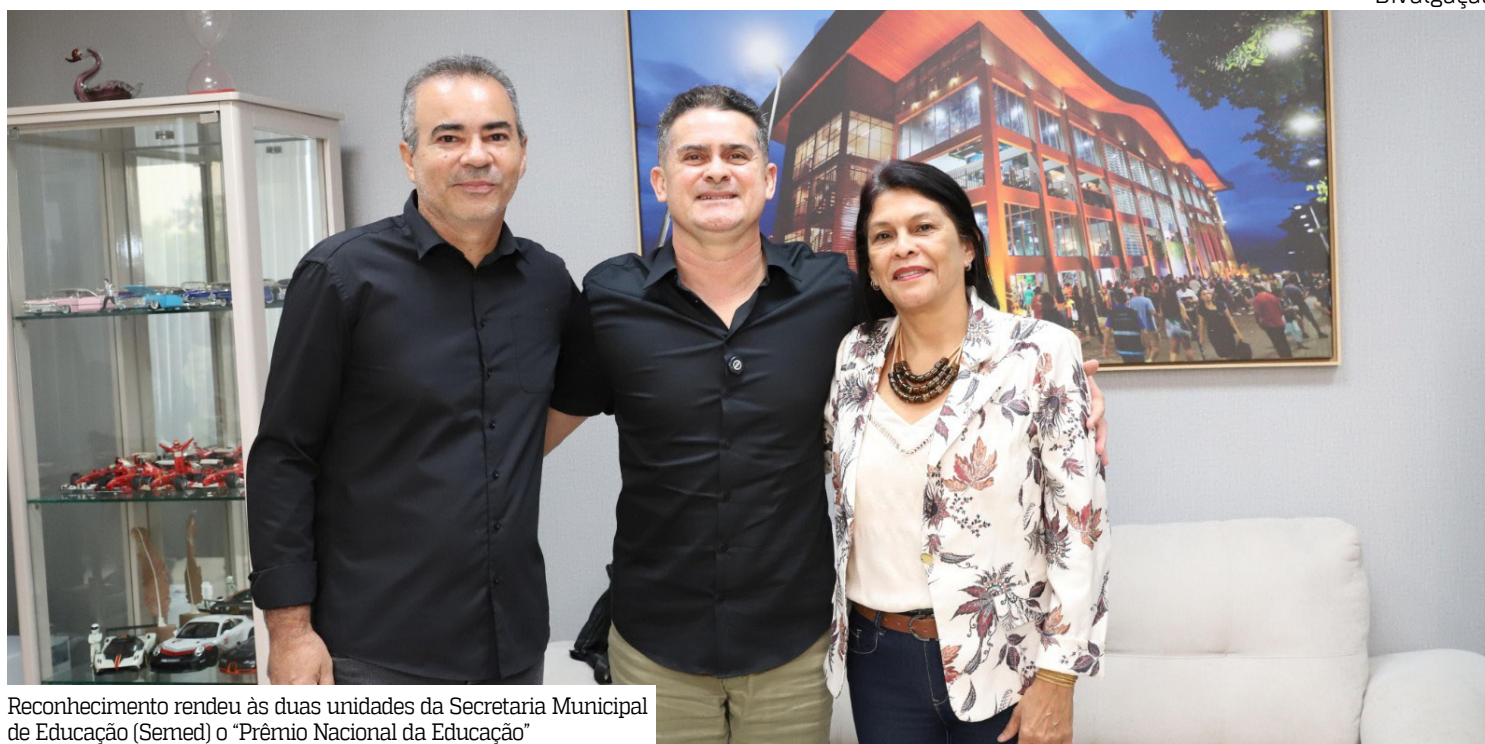
Reconhecimento rendeu às duas unidades da Secretaria Municipal de Educação (Semed) o “Prêmio Nacional da Educação”