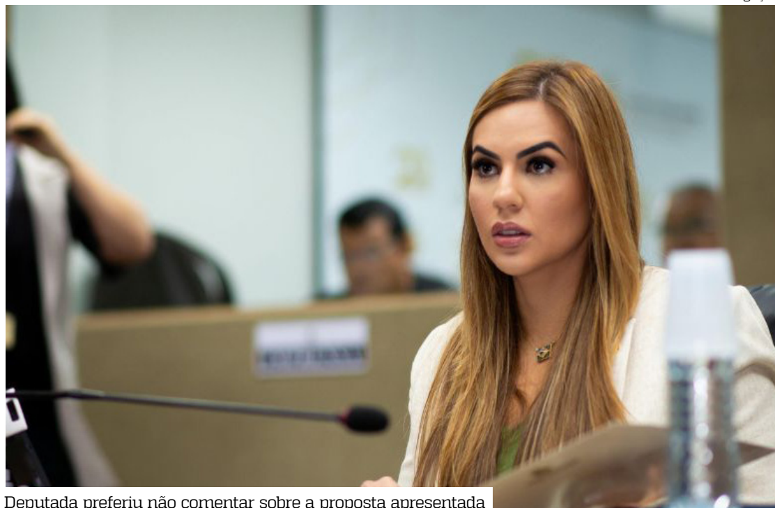
Deputada preferiu não comentar sobre a proposta apresentada

Referências a símbolos de outros estados em propostas locais já ocorreram