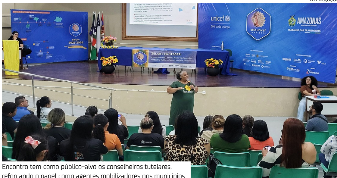
Encontro tem como público-alvo os conselheiros tutelares, reforçando o papel como agentes mobilizadores nos municípios

No estado, as ações do Selo Unicef são coordenadas pela Secretaria de Desenvolvimento Urbano e Metropolitano (Sedurb). E são desenvolvidas