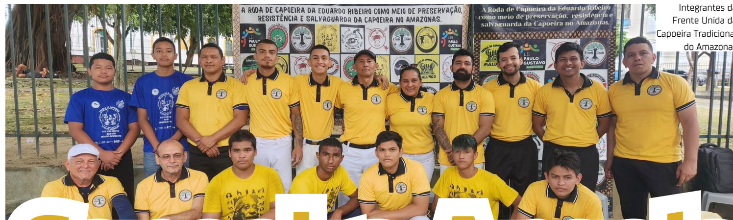
Integrantes da Frente Unida da Capoeira Tradicional do Amazonas