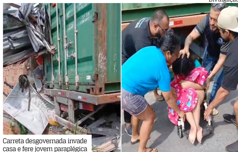
Carreta desgovernada invade casa e fere jovem paraplégica

Uma jovem paraplégica, que usa cadeira de rodas, ficou ferida na manhã de ontem (11), após uma carreta desgovernada invadir a casa onde mora, na Avenida Jurunas, no conjunto Boas Novas, bairro Cidade Nova, zona norte de Manaus. Vizinhos retiraram a vítima debaixo do veículo em uma cena angustiante registrada em vídeo.