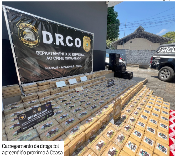
Carregamento de droga foi apreendido próximo à Ceasa

Pedro Rodrigues de Souza, de 51 anos, foi preso em flagrante com 700 quilos de cocaína pura, avaliados em mais de R$ 40 milhões. A apreensão aconteceu no bairro Vila Buriti, nas proximidades do Porto da Ceasa, Zona Sul de Manaus. A droga estava acondicionada em 19 sacos de fibra dentro de um caminhão baú.