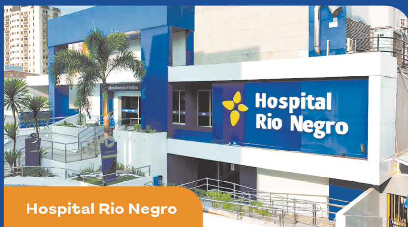
Hospital Rio Negro