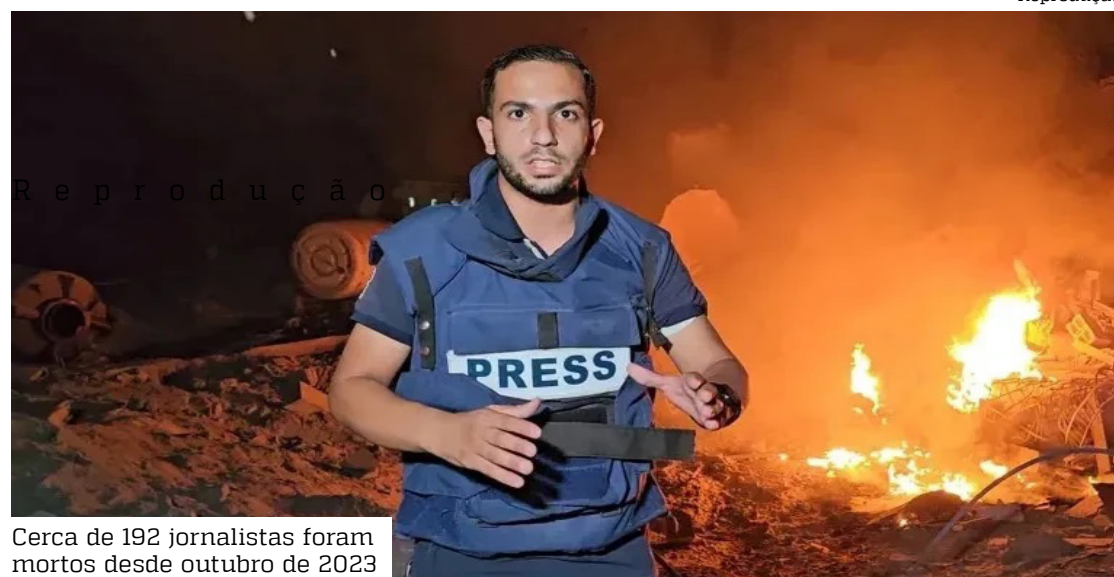
Cerca de 192 jornalistas foram mortos desde outubro de 2023

De acordo com o Projeto Custos da Guerra, da Universidade Brown (EUA), jamais tantos jornalistas morreram em um único conflito arma-