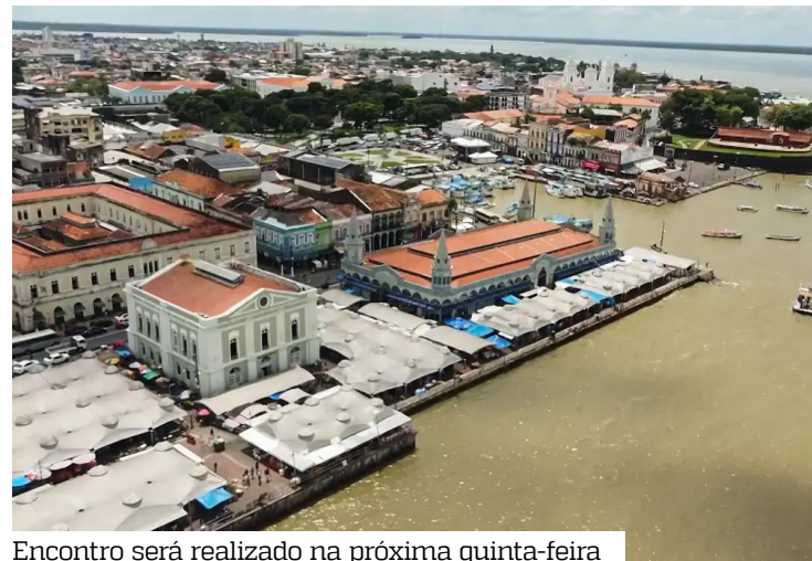
Encontro será realizado na próxima quinta-feira

Na última semana uma comitiva do Departamento de Salvaguarda e Segurança das Nações Unidas (UNDSS) realizou inspeções nos locais que receberão eventos da COP30, em hospedagens, sistemas de transporte, estruturas de saúde e segurança. Os planos de segurança, saúde e mobilidade apresentados pelos governos federal, estadual e municipal foram aprovados pela equipe técnica da ONU.