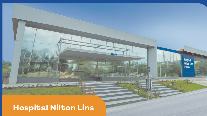
Hospital Nilton Lins