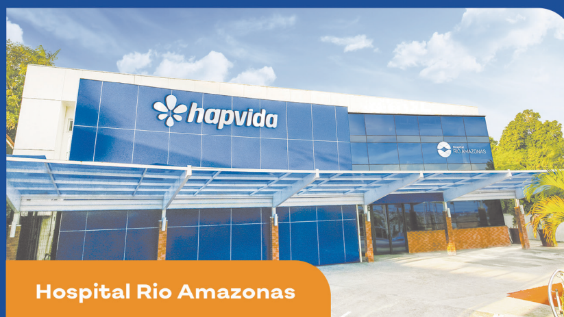
Hospital Rio Amazonas