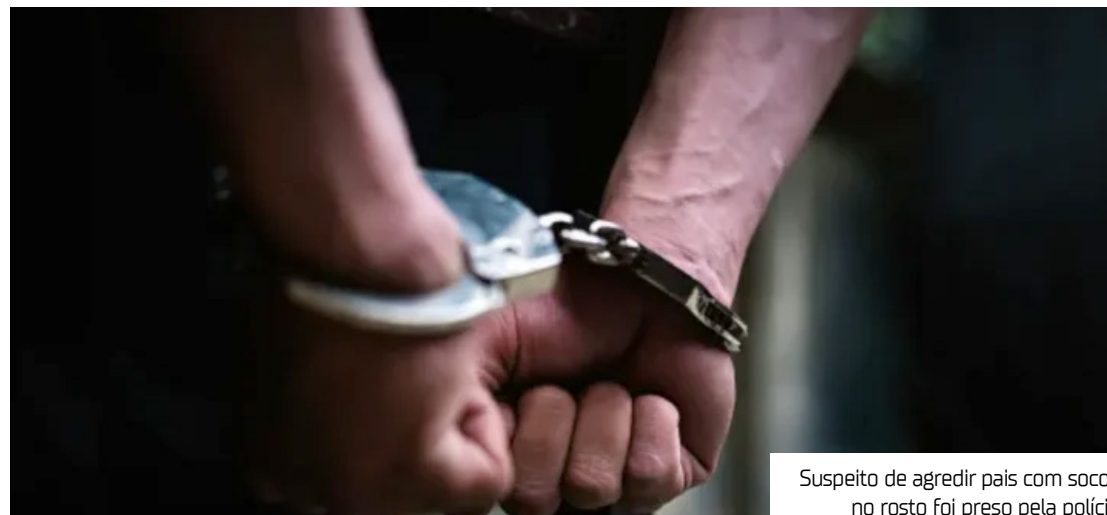
Suspeito de agredir pais com socos no rosto foi preso pela polícia