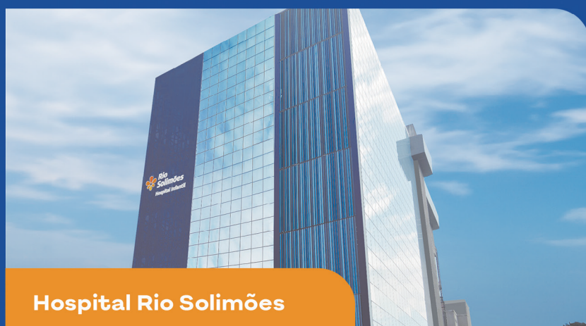
Hospital Rio Solimões

São 5 hospitais na capital, incluindo o novo Hospital Nilton Lins, um grande complexo com clínicas, unidades de diagnóstico e atendimento especial para TEA.