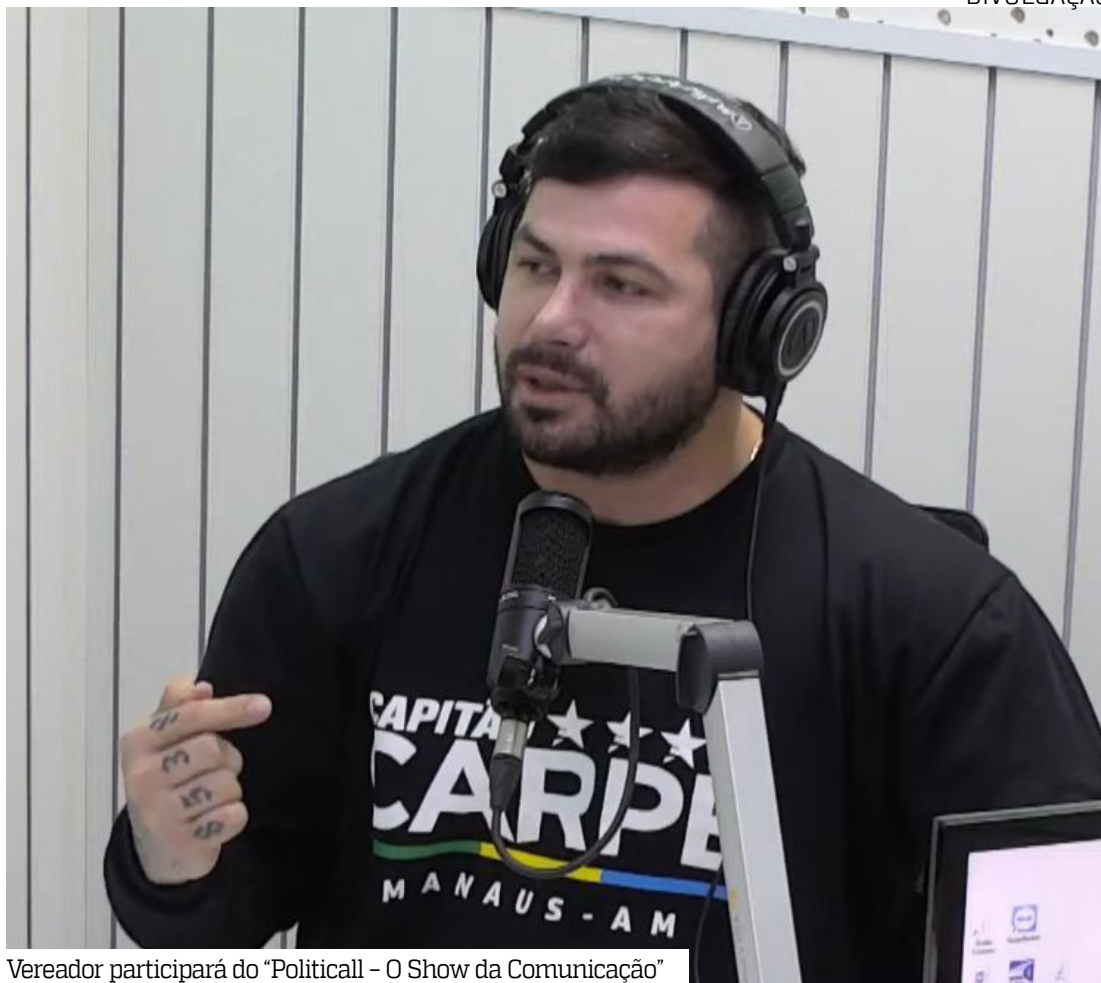
Vereador participará do "Political - O Show da Comunicação"