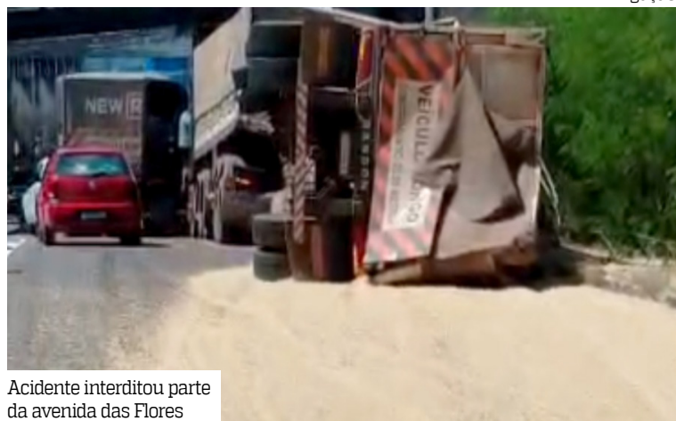
Acidente interditou parte da avenida das Flores

Uma carreta carregada de soja tombou na manhã de ontem (25), no cruzamento da avenida das Torres com a avenida Timbiras, sentido bairro-Centro, na zona norte de Manaus. Parte da carga se espalhou pela pista, provocando lentidão no trânsito e risco de acidentes.