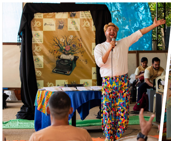
Oficinas de escrita criativa, poesia slam e contação de histórias percorrem cinco municípios

A iniciativa busca fortalecer a expressão artística, valorizar narrativas amazônicas e promover espaços de cura e acolhimento por meio de oficinas de escrita criativa, poesia slam (competição de poesia falada e performática)