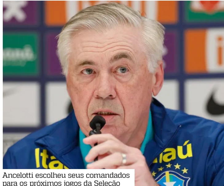
Ancelotti escolheu seus comandados para os próximos jogos da Seleção

Maracanã uma despedida amarga para os chilenos, enquanto a Bolívia, mesmo com campanha irregular, segue sonhando com uma vaga na repescagem, o que promete dar ainda mais peso ao confronto.