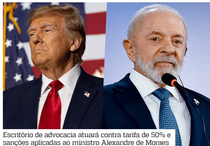
Escritório de advocacia atuará contra tarifa de 50% e sanções aplicadas ao ministro Alexandre de Moraes

Fontes envolvidas nas tratativas afirmam que o ministro não foi consultado sobre o novo contrato da AGU, pois o acordo firmado com o escritório nos EUA tem caráter amplo. O seja, a equipe jurídica estará disponível para defender interesses do Estado brasileiro, inclusive Moraes, caso ele opte por utilizar os serviços.