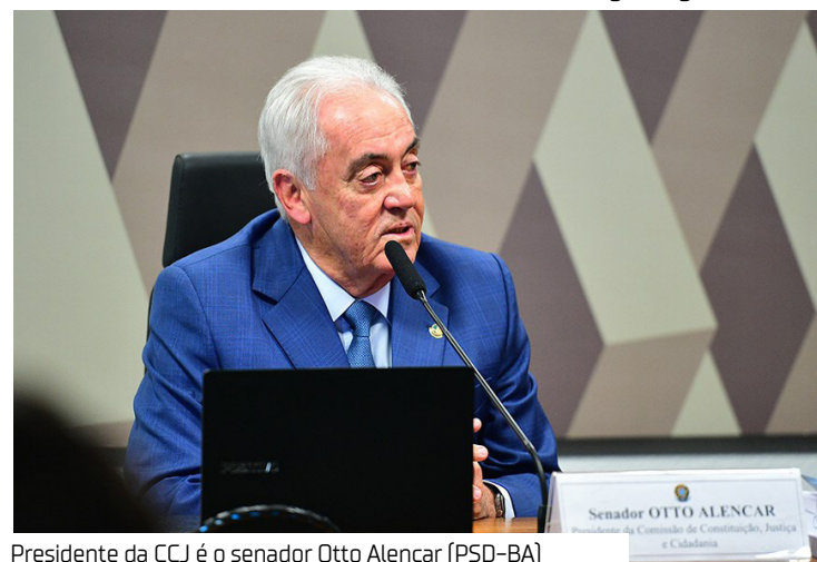
Presidente da CCJ é o senador Otto Alencar (PSD-BA)

A Comissão de Constituição, Justiça e Cidadania (CCJ) do Senado se reúne amanhã (27), a partir das 9h, para votar uma pauta com sete projetos de lei. Um deles proíbe a fiança em casos de pedofilia, outro tipifica o crime de violência eletrônica contra a mulher e também há uma proposta sobre crimes violentos.