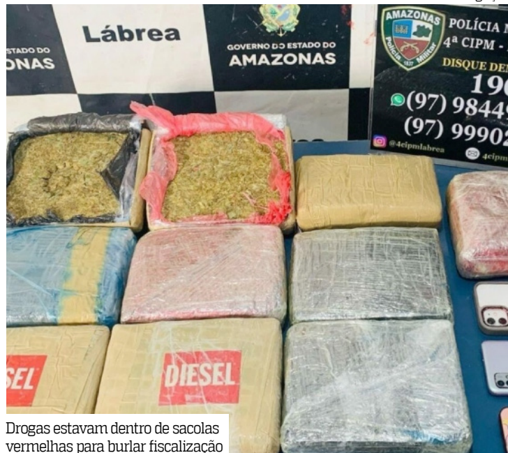
Drogas estavam dentro de sacolas vermelhas para burlar fiscalização

Duas mulheres, de 25 e 20 anos, foram presas, no sábado (23), no Terminal Rodoviário de Lábrea, a 702 km de Manaus, em flagrante com mais de 10 quilos de maconha tipo skunk.