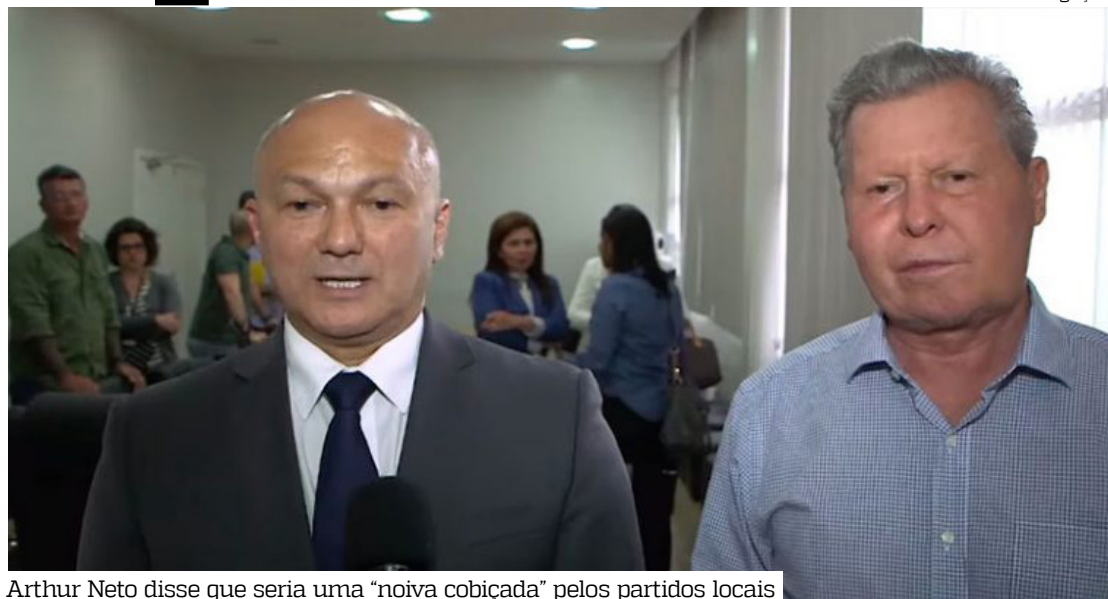
Arthur Neto disse que seria uma “noiva cobiçada” pelos partidos locais

Arthur Neto, que já foi ministro de Fernando Henrique Cardoso, senador e deputado federal, deixou o PSDB em 2021 e, desde então, estava sem partido. Sua escolha pelo Republicanos chama atenção porque, até pouco tempo atrás, ele demonstrava proximidade com o PL, partido comandado por Valdemar Costa Neto e principal sigla de apoio ao