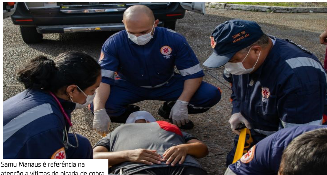
Samu Manaus é referência na atenção a vítimas de picada de cobra

“Temos aqui um centro de referência, que é a Fundação de Medicina Tropical, em integração com um serviço de urgên-