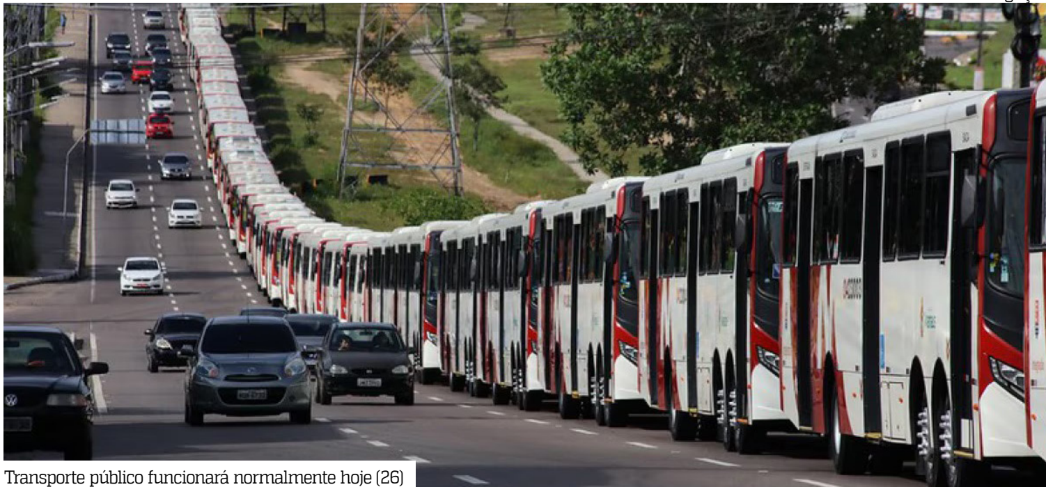
Transporte público funcionará normalmente hoje (26)

A decisão do Sindicato dos Trabalhadores em Transporte Coletivo Urbano e Rodoviário de Manaus e Região Metropolitana (STTRM) foi