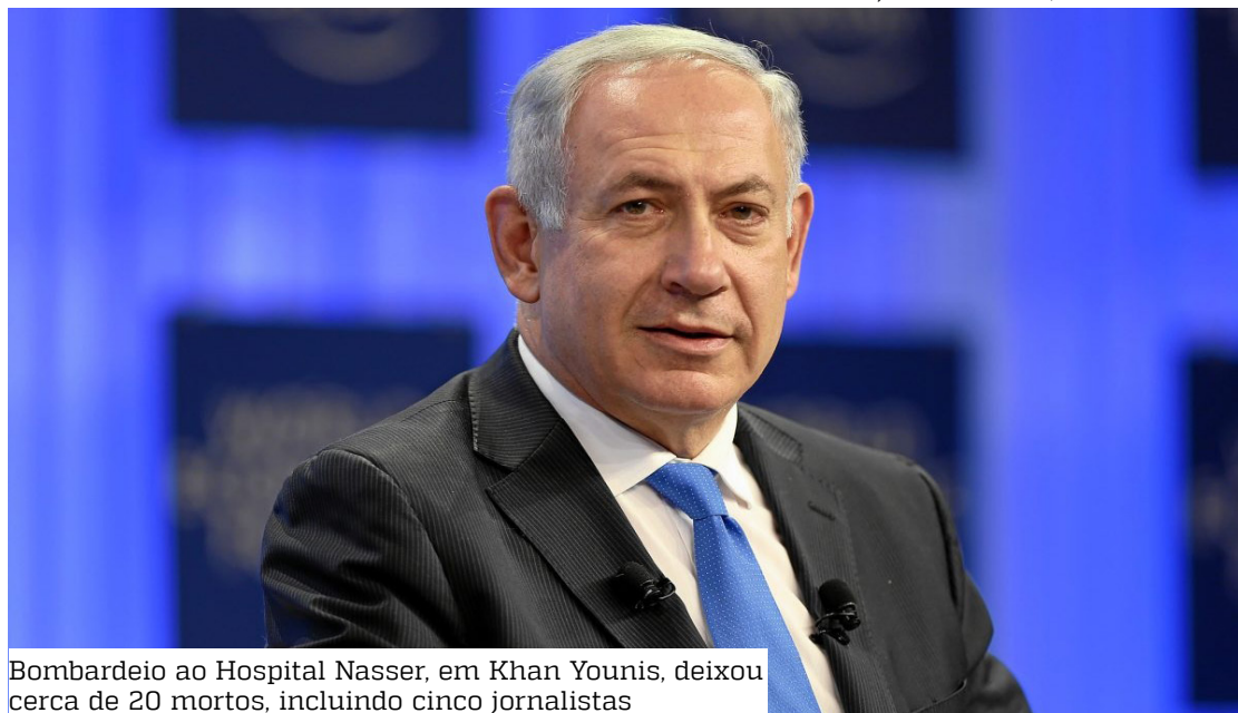
Bombardeio ao Hospital Nasser, em Khan Younis, deixou cerca de 20 mortos, incluindo cinco jornalistas

Antes da declaração de Netanyahu, o chefe do Estado-Maior das Forças Armadas de Israel, general Eyal Zamir, determinou a abertura de uma investigação imediata. Ele confirmou que uma operação havia sido autorizada na área anteriormente.