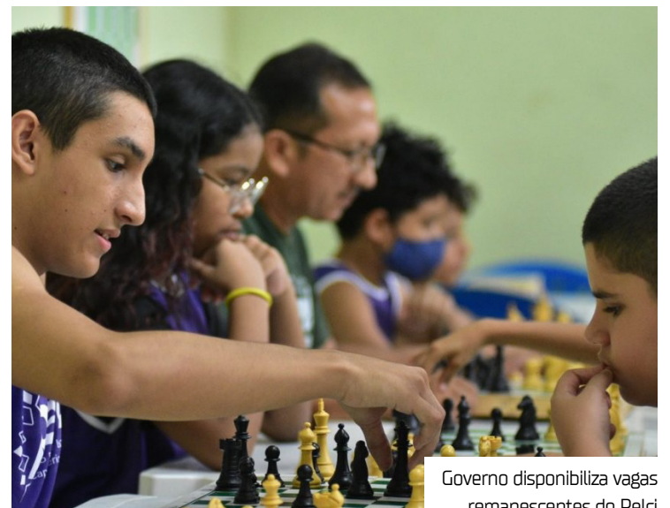
Governo disponibiliza vagas remanescentes do Pelci

Presente em 10 municípios do interior e com 37 núcleos ativos na capital, o Pelci já transformou a realidade de mais de 15 mil pessoas, garantindo acesso gratuito ao esporte em mais de 17 modalidades. Reconhecido internacionalmente, o Pelci foi indicado ao Prêmio das Nações Unidas para o Serviço Público (UNPSA), reforçando seu papel como política pública de inclusão social, formação cidadã e descoberta de novos talentos.