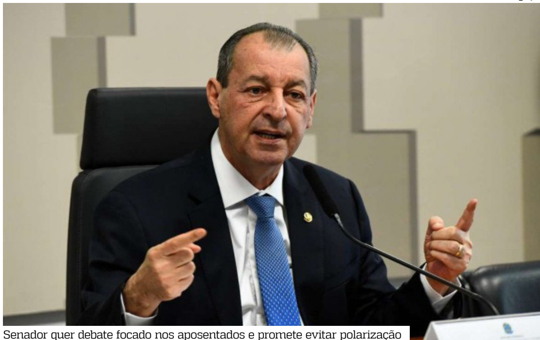
Senador quer debate focado nos aposentados e promete evitar polarização

O nome do parlamentar amazonense foi indicado pelo presidente do Senado, Davi Alcolumbre (União-AP), conforme publicado pelo portal Metrópoles, que ouviu fontes ligadas tanto à base do gover-