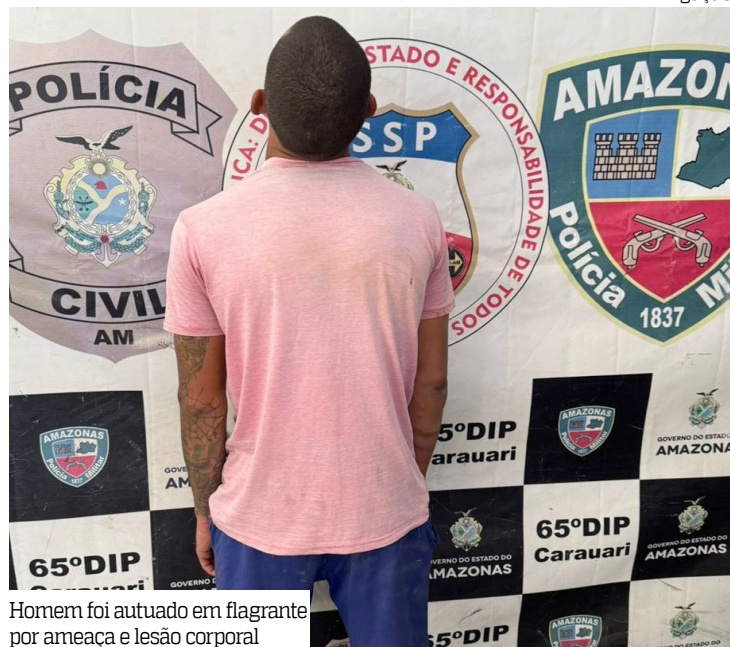
Homem foi autuado em flagrante por ameaça e lesão corporal

Um homem de 29 anos foi preso por agredir o pai e ameaçar a mãe em Carauari, no interior do Amazonas. A prisão ocorreu no bairro Nova República.