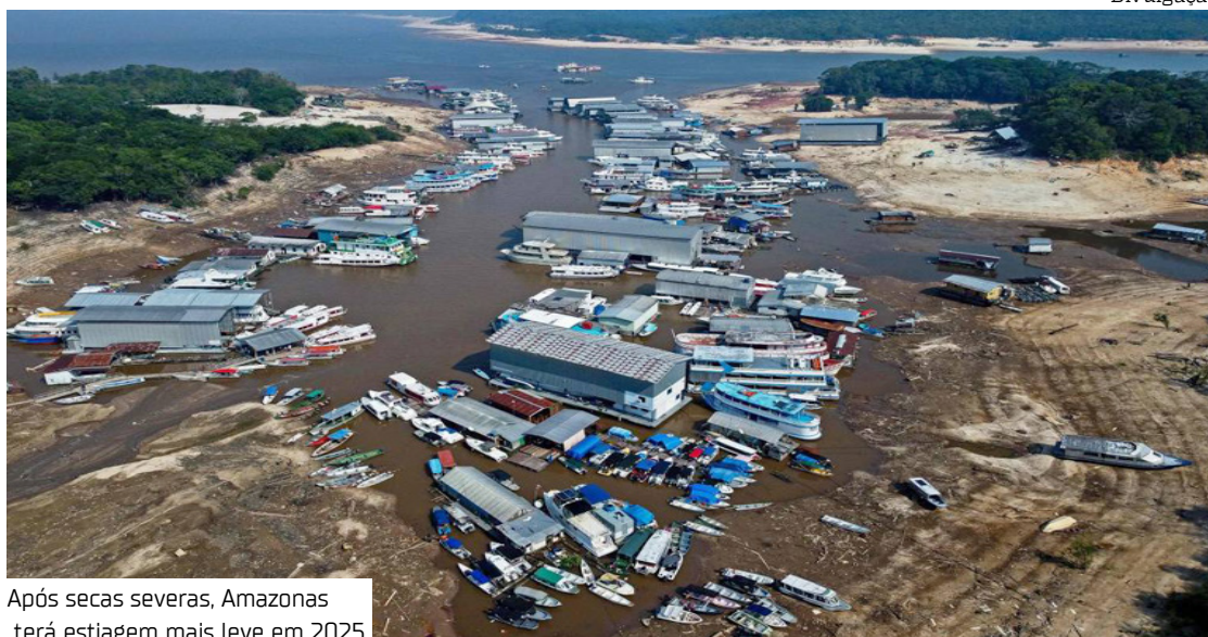
Após secas severas, Amazonas terá estiagem mais leve em 2025

“A nossa principal preocupação é com relação à saúde e também ao abastecimento de água. Nós temos o programa Água Boa, em que monitoramos essas áreas onde há maior dificuldade das pessoas captarem água. Na sequência,