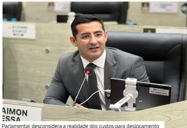
Parlamentar desconsidera a realidade dos custos para deslocamento