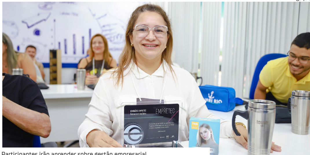
Participantes irão aprender sobre gestão empresarial

A Prefeitura de Manaus, por meio da Secretaria Municipal do Trabalho, Empreendedorismo e Inovação (Semtepi), abre hoje, (5), as inscrições para 25 vagas no curso de capacitação empreendedora, o Empretec. As aulas vão acontecer de 25 a 30/8, no prédio do Serviço Brasileiro de Apoio às Micro e Pequenas (Sebrae), localizado na avenida Leonardo Malcher, nº 924, bairro Centro, zona Centro-Sul da capital.