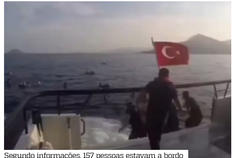
Segundo informações, 157 pessoas estavam a bordo

fazem uma grande operação para recuperar os corpos de um grande número de migrantes de nacionalidade etíope que morreram afogados na costa da província de Abyan quando tentavam entrar ilegalmente no território iemenita”, afirmou a Secretaria de Segurança do governo da província em um comunicado. “Muitos corpos foram encontrados espalhados pelas praias, o que sugere que várias vítimas estão desaparecidas”.