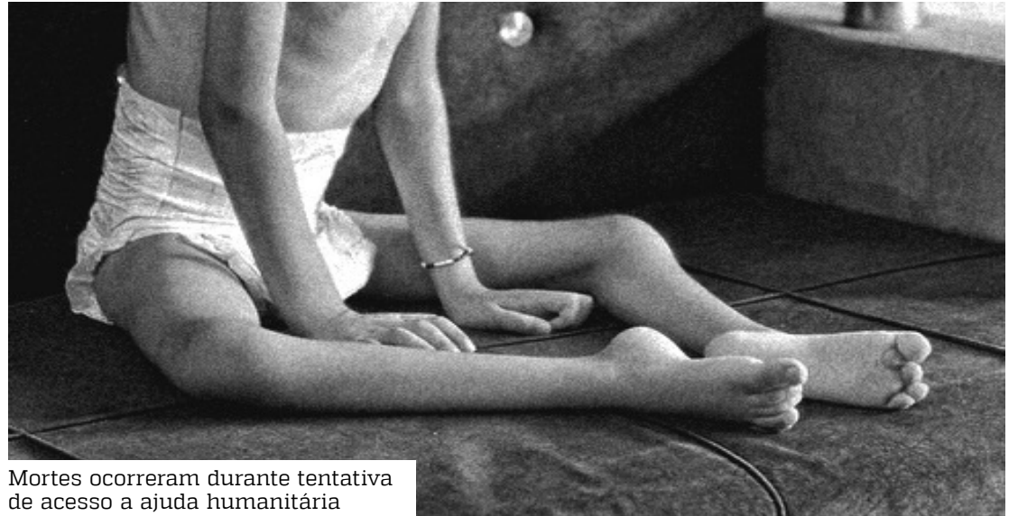
Mortes ocorreram durante tentativa de acesso a ajuda humanitária

ataques em Gaza, o ministro da Segurança Nacional de Israel, Itamar Ben-Gvir, realizou orações neste domingo na mesquita de Al-Aqsa, um dos locais mais sagrados para muçulmanos e judeus, localizada em Jerusalém Oriental.