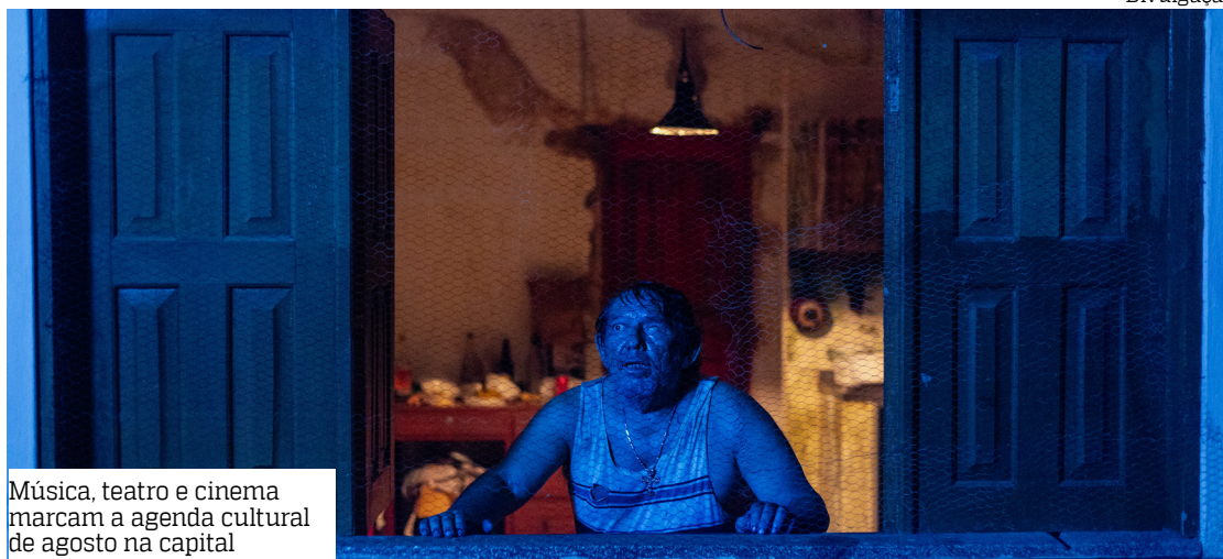
Música, teatro e cinema marcam a agenda cultural de agosto na capital

A entrada antecipada pode ser confirmada por meio de Pix (musicistacileno@gmail.com) e custa R$ 25. Reservas de mesa podem ser feitas no contato