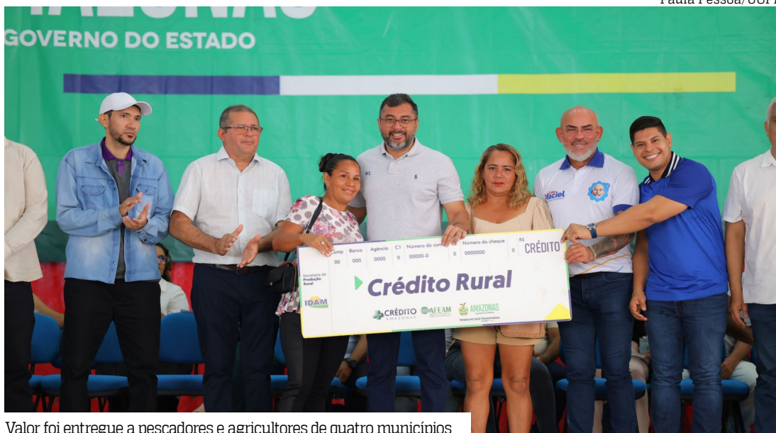
Valor foi entregue a pescadores e agricultores de quatro municípios

Do montante entregue, R$ 1,4 milhão atendeu à pesca artesanal de Coari, enquanto R$ R$ 392,5 mil foram destinados a pescadores de Codajás. Viabilizado pelo Instituto de Desenvolvimento Agropecuário e Florestal Sustentável do Estado do Amazonas (Idam) e Agência de Fomento do Estado do Amazonas (Afeam), o crédito rural foi entregue em forma de equipamen-