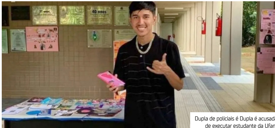
Dupla de policiais é Dupla é acusada de executar estudante da Ufam