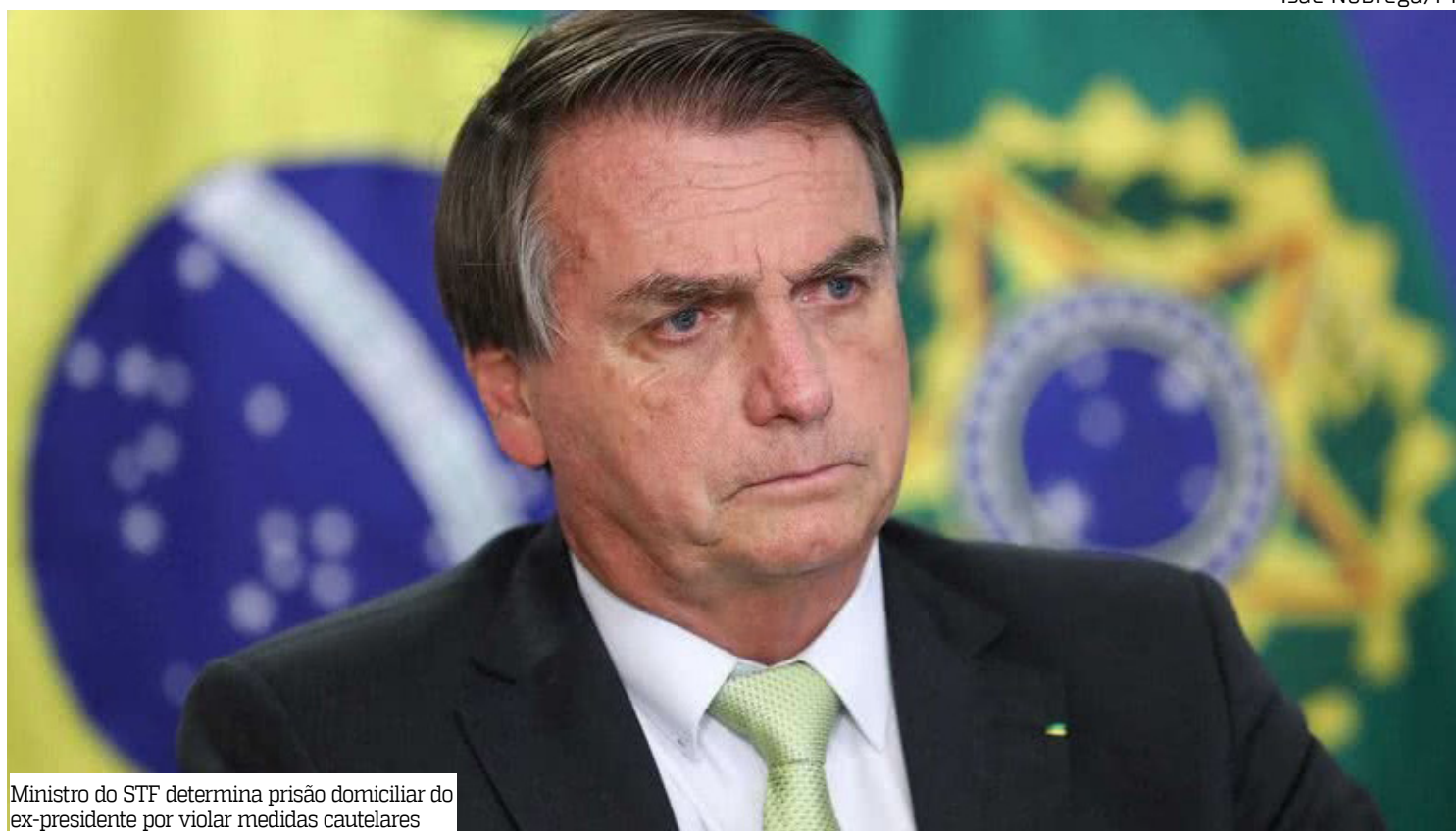
Ministro do STF determina prisão domiciliar do ex-presidente por violar medidas cautelares

Segundo o magistrado, “os apoiadores de Jair Bolsonaro e seus filhos, deliberadamente, utilizaram as falas e a participação - ainda que por telefone e pelas redes sociais - do réu para a propagação de ataques e impulsionamento dos manifestantes com a nítida intenção de pressionar e coagir esta Suprema Corte”.