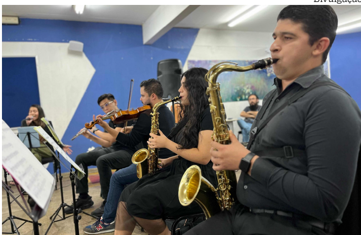
Clássicos da música brasileira ganham nova vida em concerto gratuito

A força da música popular brasileira será celebrada em um espetáculo especial na sexta-feira (8), às 19h, no Teatro da Instalação, Centro de Manaus, com a apresentação da Orquestra de Repertório Popular do Liceu de Artes e Ofícios Claudio Santoro. A iniciativa conta com o apoio do Governo do Amazonas, por meio da Secretaria de Cultura e Economia Criativa, e tem entrada gratuita.