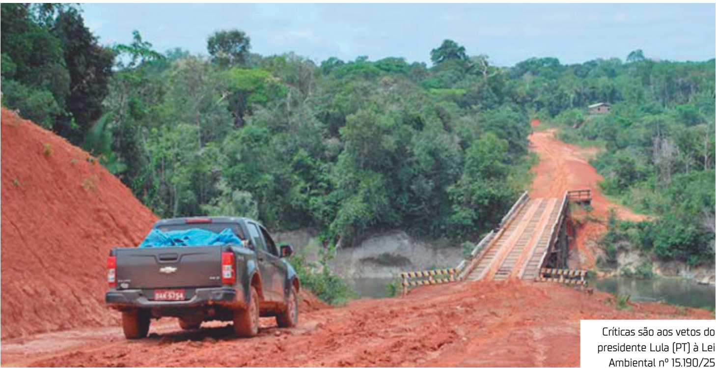
Críticas são aos vetos do presidente Lula (PT) à Lei Ambiental nº 15.190/25