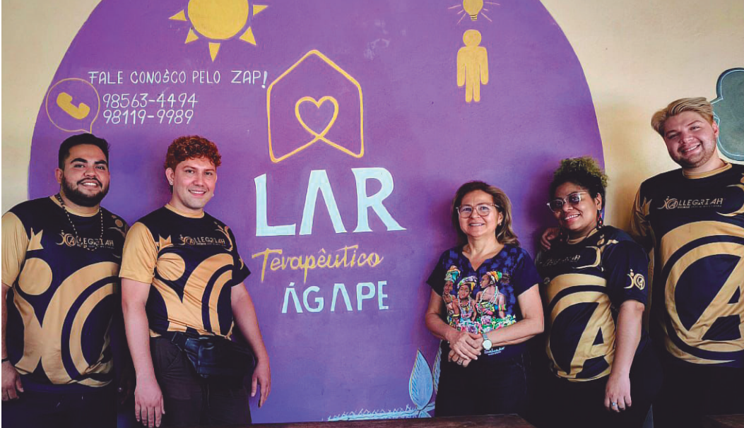
Iniciativa promove oficinas de poesia slam, contação de histórias e escritóvências