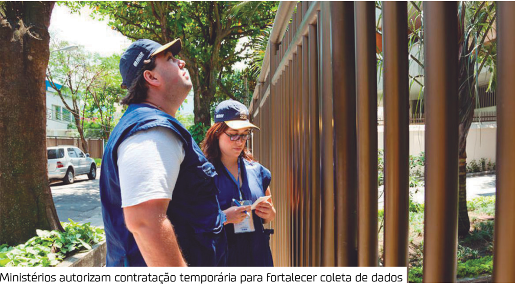
Ministérios autorizam contratação temporária para fortalecer coleta de dados