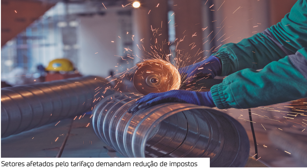
Setores afetados pelo tarifaço demandam redução de impostos

O Governo Federal deverá exigir a manutenção de empregos em contrapartida à linha de crédito oferecida pelo Banco Nacional de Desenvolvimento Econômico e Social (BNDES) aos setores impactados pelo tarifaço imposto pelo presidente dos Estados Unidos, Donald Trump, que teve início na última quarta-feira (6). De acordo com a imprensa, o assunto foi deliberado internamente pelo presidente Luiz Inácio Lula da Silva (PT) na segunda-feira (11).