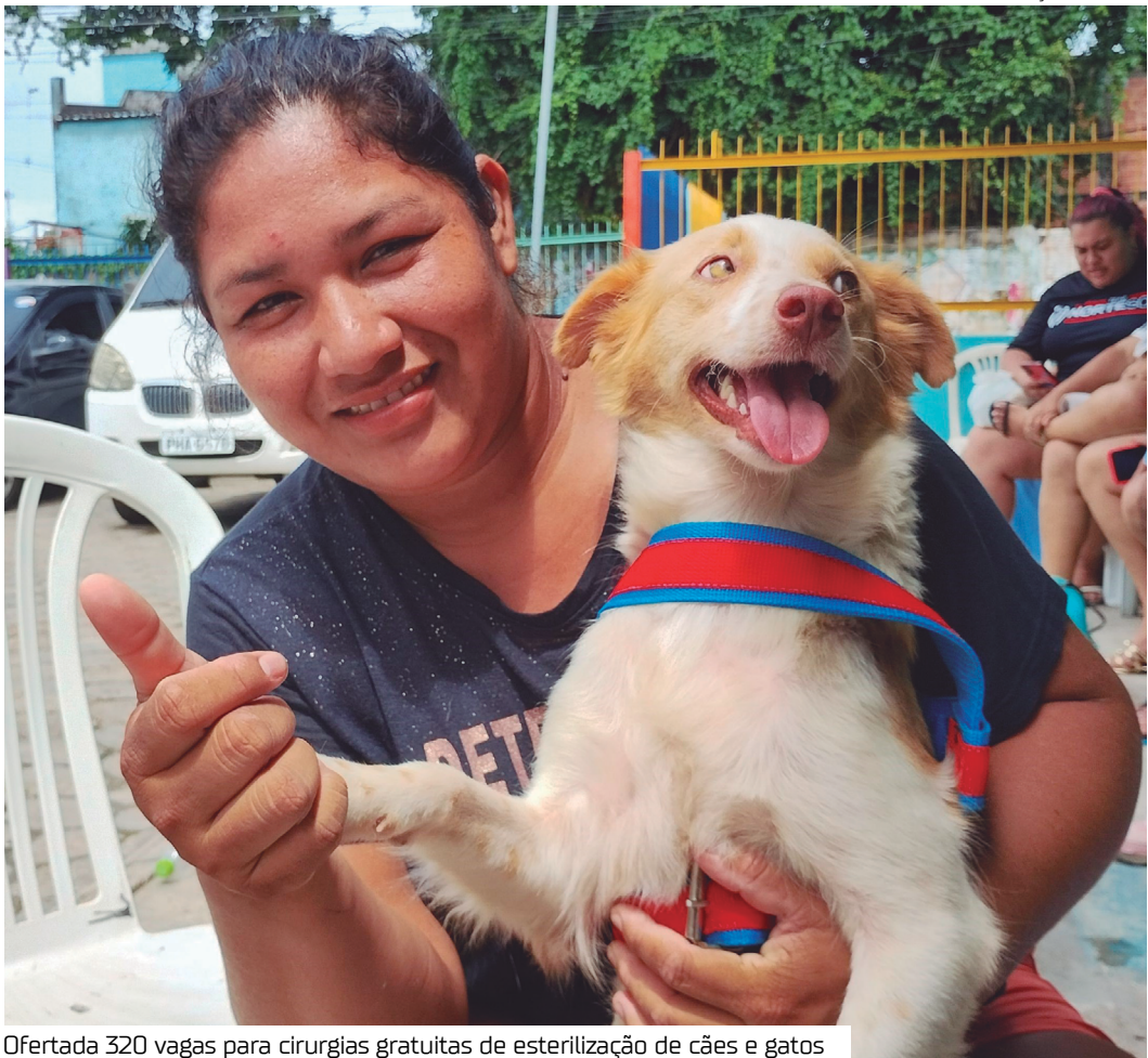
Ofertada 320 vagas para cirurgias gratuitas de esterilização de cães e gatos

“Também no castramóvel vamos ofertar a vacinação contra a raiva de cães e gatos, com idade a partir de três meses, sem a necessidade de agendamento. O serviço é gratuito e estará disponível nos dias 17 a 21 deste mês, das 9h às 12h”, complementa o gerente.