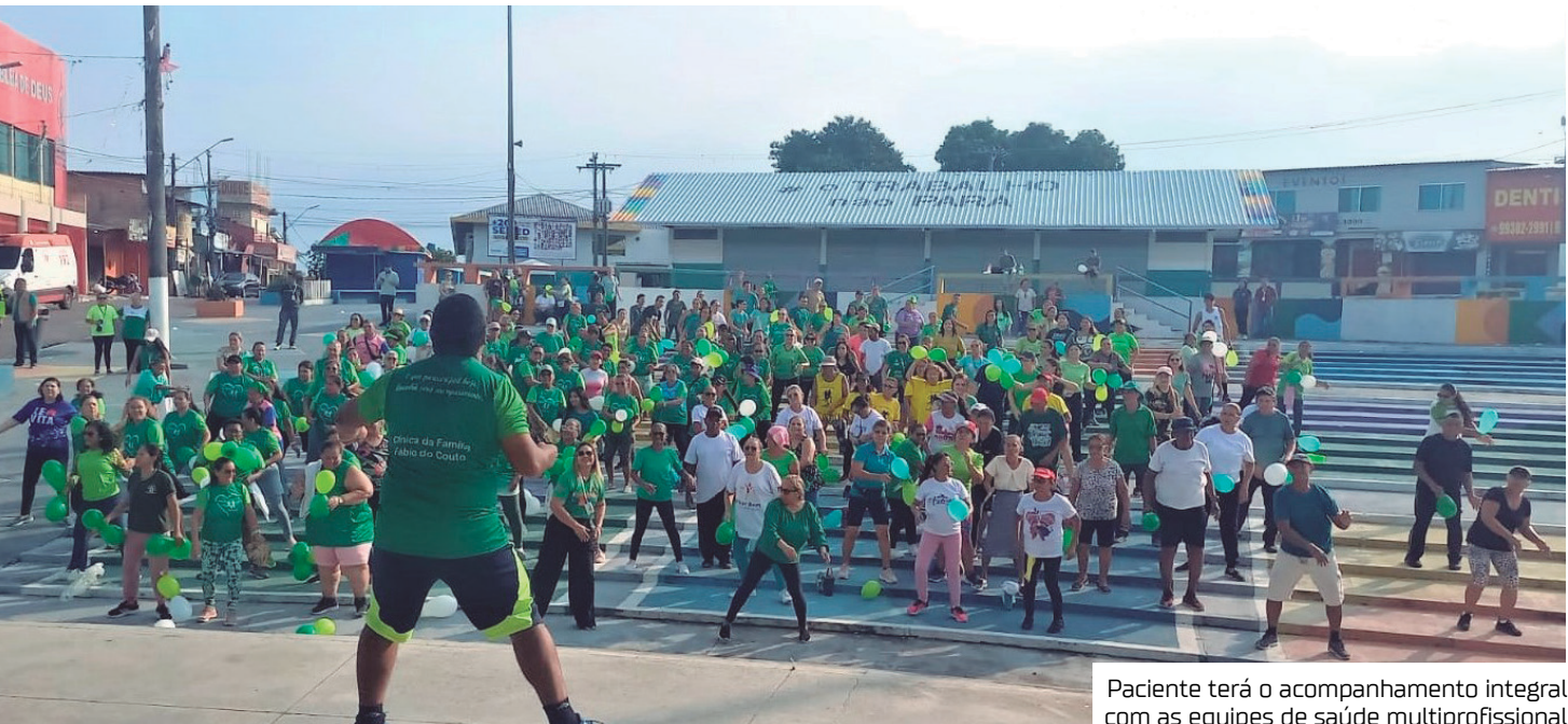
Paciente terá o acompanhamento integral com as equipes de saúde multiprofissional

Após a avaliação da equipe de saúde, com revisão do