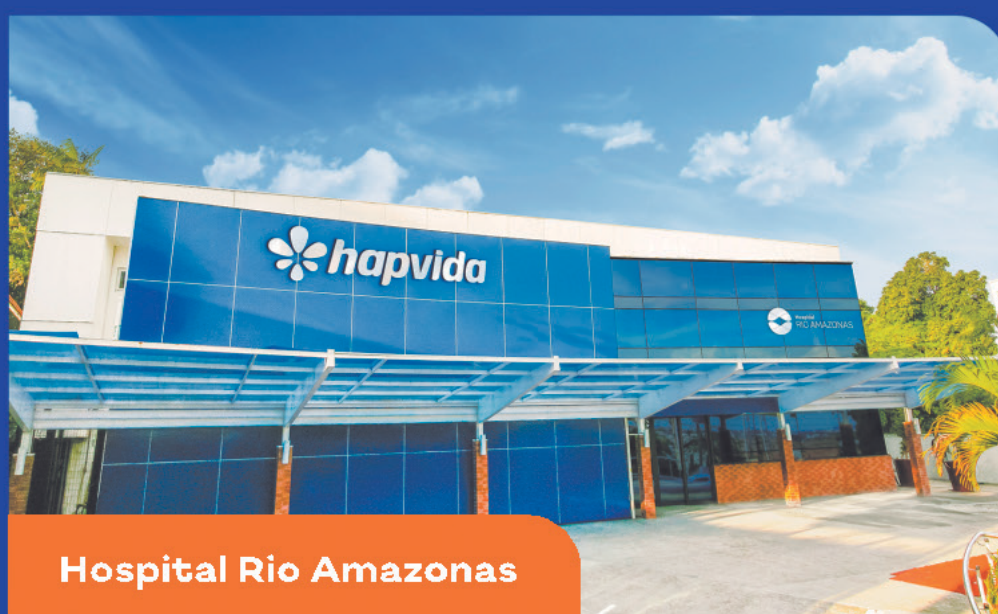
Hospital Rio Amazonas