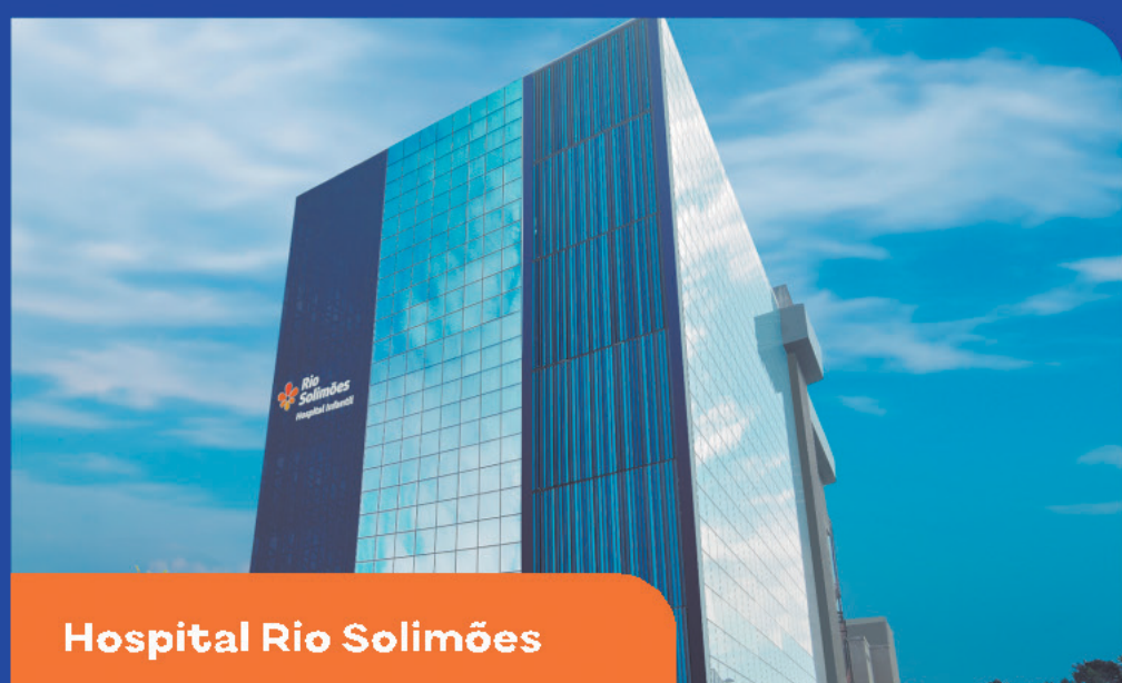
Hospital Rio Solimões

São 5 hospitais na capital, incluindo o novo Hospital Nilton Lins , um grande complexo com clínicas, unidades de diagnóstico e atendimento especial para TEA.