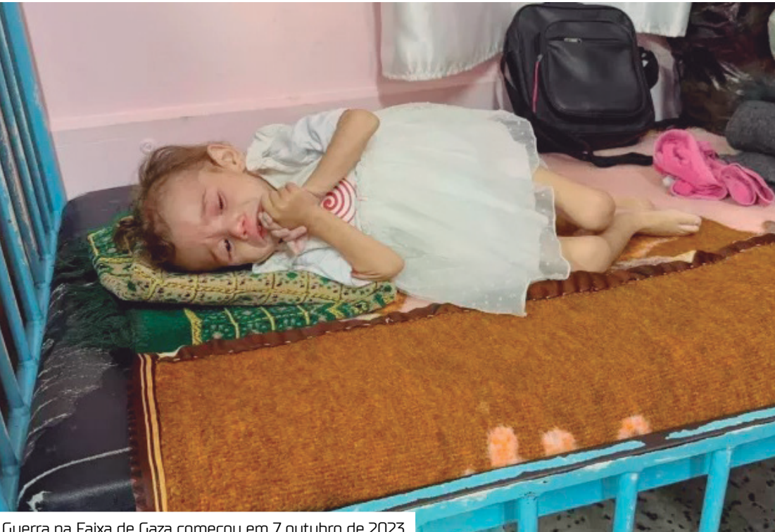
Guerra na Faixa de Gaza começou em 7 outubro de 2023

A posição dos 27 países da UE em relação a Israel segue dividida desde o início da ofensiva militar contra o Hamas, desencadeada após os ataques do grupo palestino em 7 de outubro de 2023. Enquanto nações