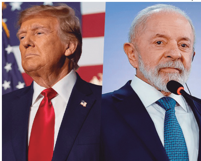
Relatório do governo Trump acusa censura e repressão a bolsonaristas

O governo dos Estados Unidos, sob a gestão do republicano Donald Trump, afirmou que a situação dos direitos humanos no Brasil “se deteriorou” ao longo de 2024. A acusação está no Relatório de Práticas de Direitos Humanos, divulgado ontem (12) pelo Departamento de Estado americano e entregue ao Congresso dos EUA.