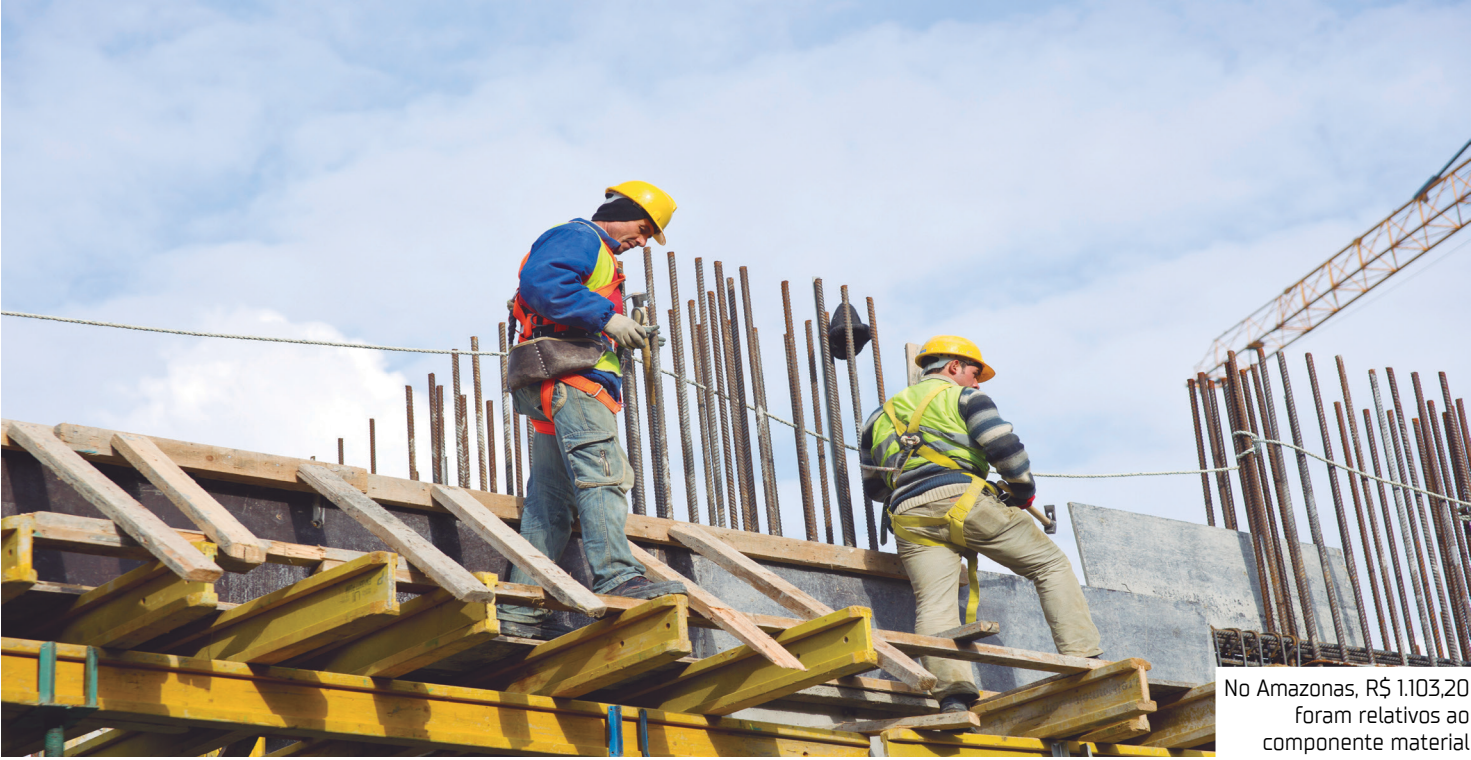
No Amazonas, R$ 1.103,20 foram relativos ao componente material

Criado em 1969, o Índice Nacional da Construção Civil (SINAPI) tem como objetivo a produção de informações de custos e índices de forma sistematizada