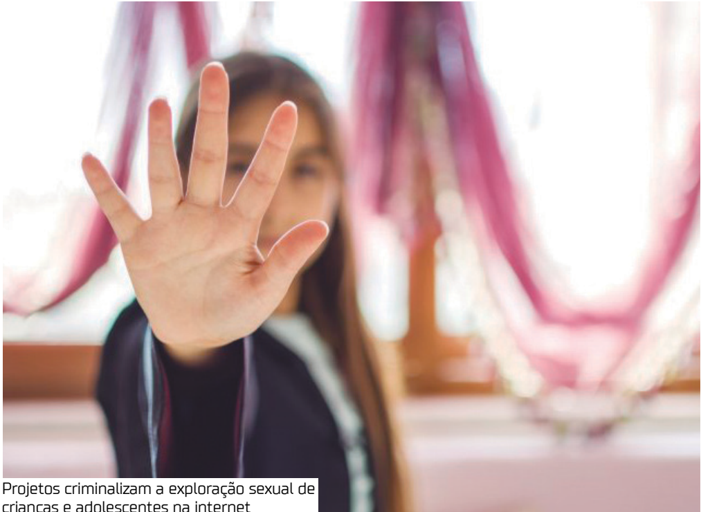
Projetos criminalizam a exploração sexual de crianças e adolescentes na internet