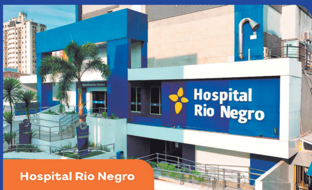
Hospital Rio Negro