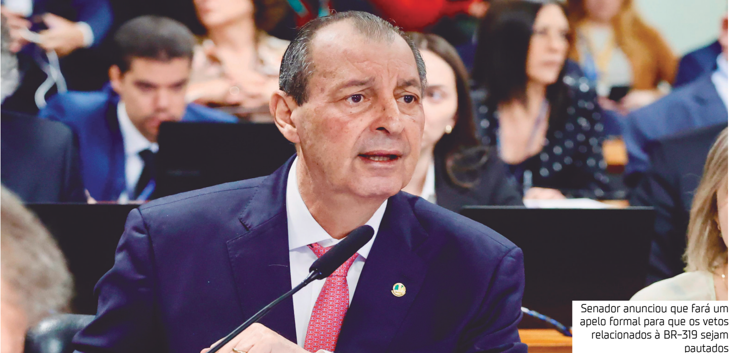
Senador anunciou que fará um apelo formal para que os vetos relacionados à BR-319 sejam pautados

O senador Eduardo Braga (MDB-AM) também fez um