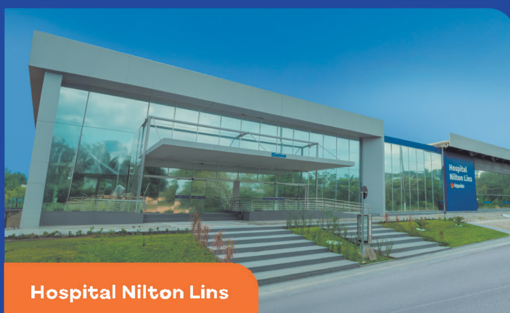
Hospital Nilton Lins