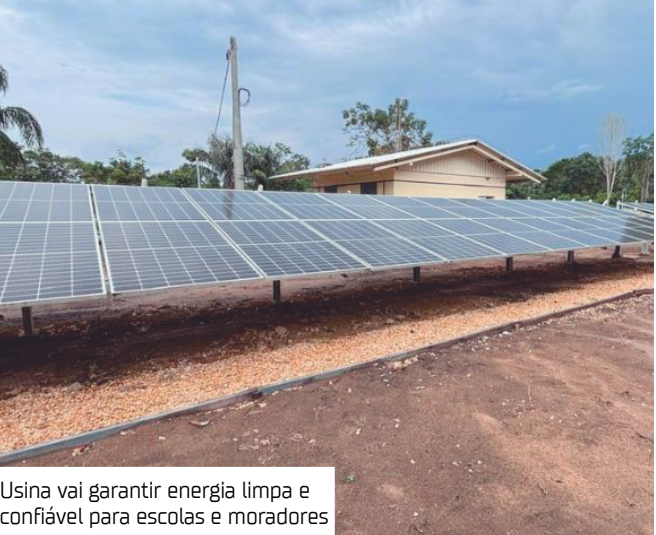
Usina vai garantir energia limpa e confiável para escolas e moradores