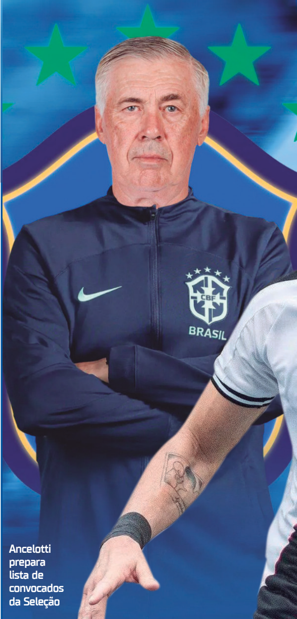
Ancelotti prepara lista de convocados da Seleção

Cruzeiro x Atlético-MG Corinthians x Athletico-PR Botafogo x Vasco Fluminense x Bahia