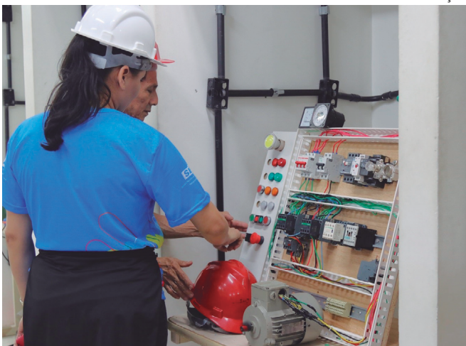
Senai abre inscrições para 2.855 vagas gratuitas em cursos de qualificação

Mais informações, incluindo a lista completa de cursos e horários, podem ser acompanhadas pelas redes sociais do Senai Amazonas e site www.fleam.org.br/senai