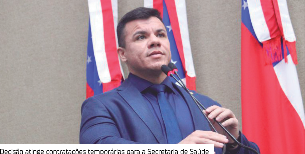
Decisão atinge contratações temporárias para a Secretaria de Saúde