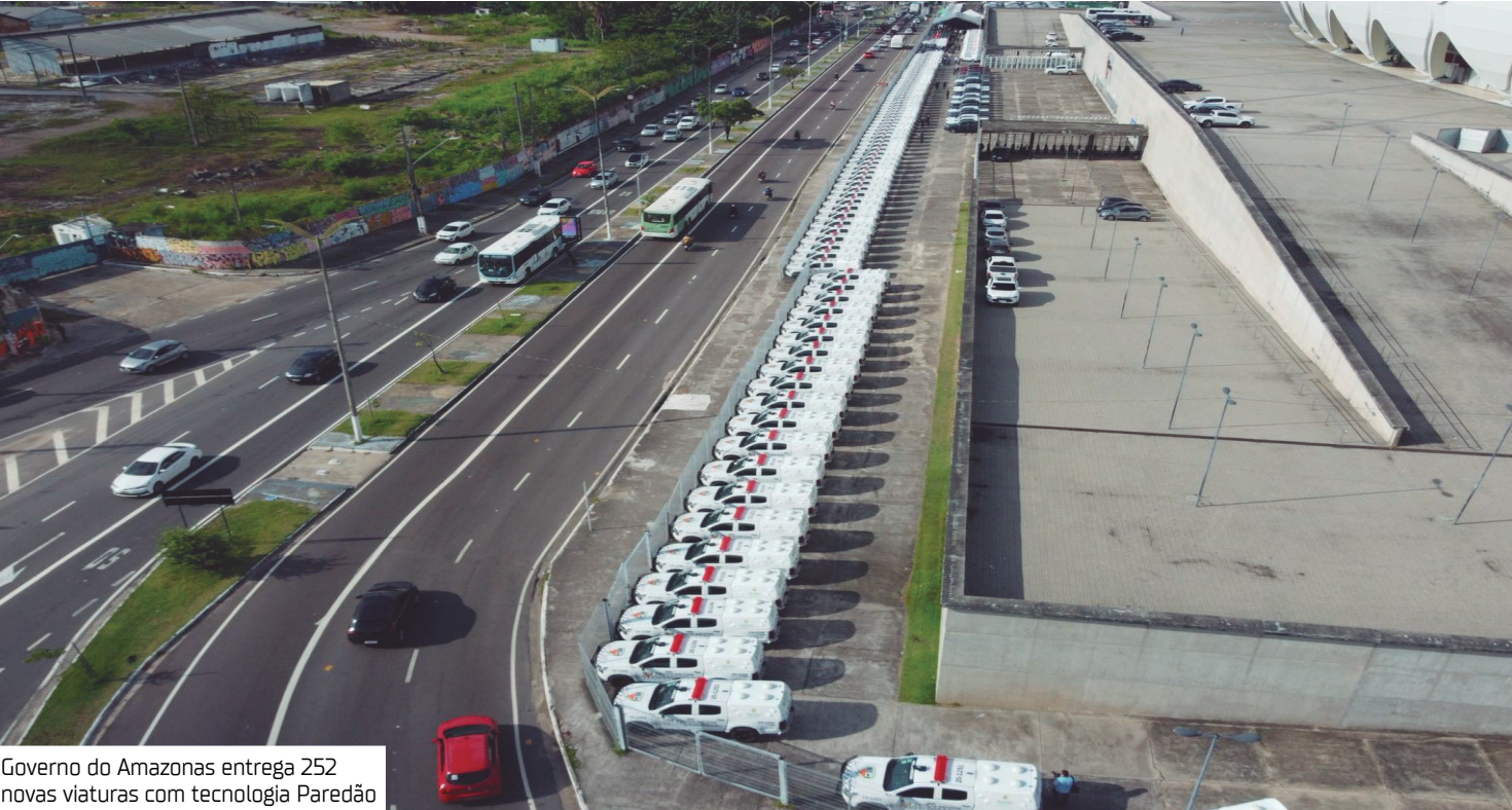
Governo do Amazonas entrega 252 novas viaturas com tecnologia Paredão