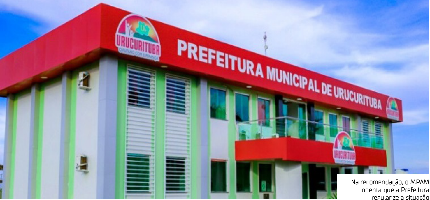
Na recomendação, o MPAM orienta que a Prefeitura regularize a situação

“Considerando que, no âmbito da estrutura administrativa do município de Urucurituba, constatou-se, por meio da coleta de informações, que existem pessoas nomeadas para cargos em comissão de chefe de divisão, chefe de seção e chefe de setor, que, na realidade, exercem atividades técnicas, corriqueiras e burocráticas, que deveriam ser