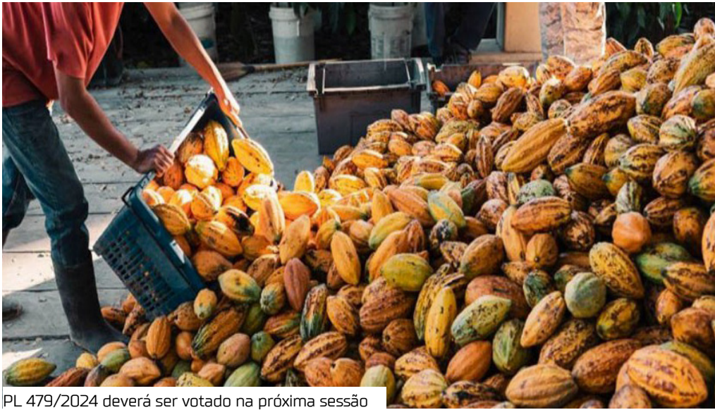
PL 479/2024 deverá ser votado na próxima sessão

A Comissão de Desenvolvimento Regional (CDR) adiou ontem (26) a votação do projeto que estabelece o programa Renova Cacau, que concede anistia total às dívidas contraídas pelos cacauicultores da Bahia em um programa anterior de incentivo ao setor. Foi concedida vista coletiva ao PL 479/2024, que deverá ser votado na próxima sessão deliberativa do colegiado.