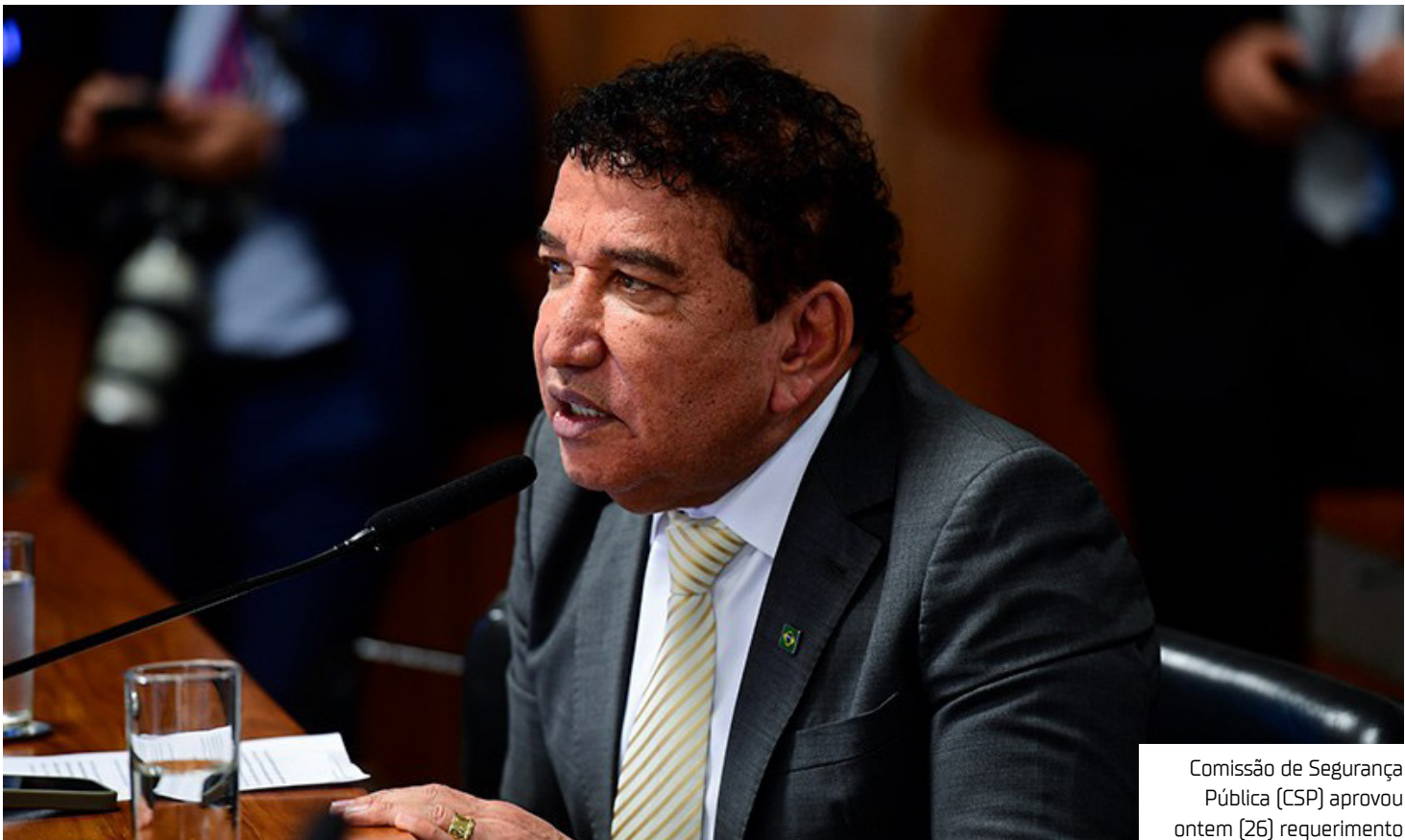
Comissão de Segurança Pública (CSP) aprovou ontem (26) requerimento