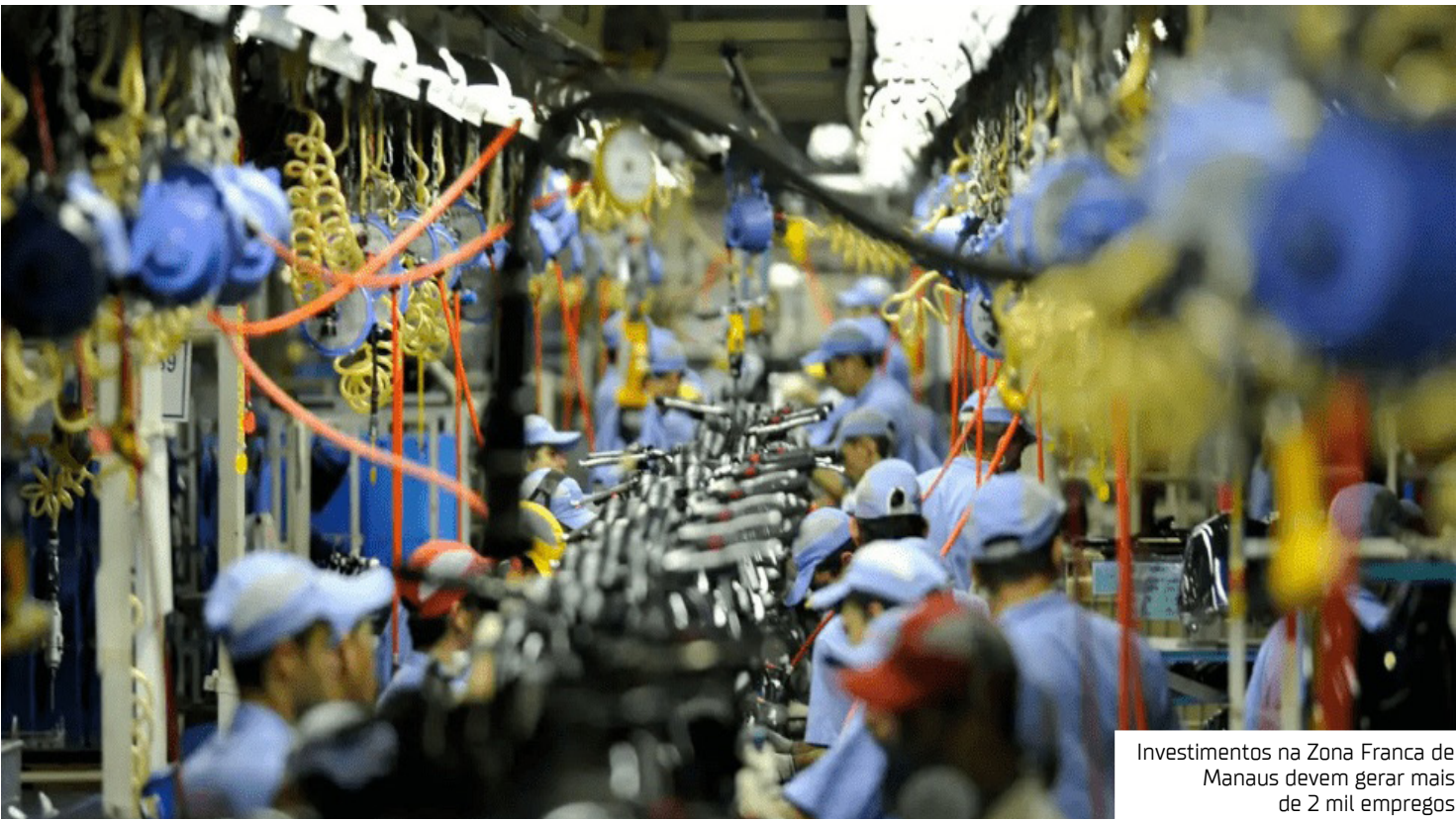
Investimentos na Zona Franca de Manaus devem gerar mais de 2 mil empregos

Outros projetos que se destacam na pauta incluem as proposições da empresa Essilor da Amazonia Indústria e Comércio Ltda, de implantação, para produção de lentes com tratamento multicamadas e lente orgânica, com previsão de geração de 158 postos de trabalho e investimentos de R$ 292,8 milhões; Reicon Condutores Elétricos Ltda, de diversificação, visando à fabricação de vergalhão de cobre ou fio de cobre trefilado, com previsão de geração de 86 postos de trabalho e investimentos de R$ 137 milhões; Vitamedic Indústria Farmacêutica Ltda, de implantação, para produção de medicamentos sólidos, com previsão de geração de 52 novos postos de trabalho e investimentos de R$ 91,2 milhões; e HAP Logística Ltda, de implantação, para exercer a atividade de serviço de trans-