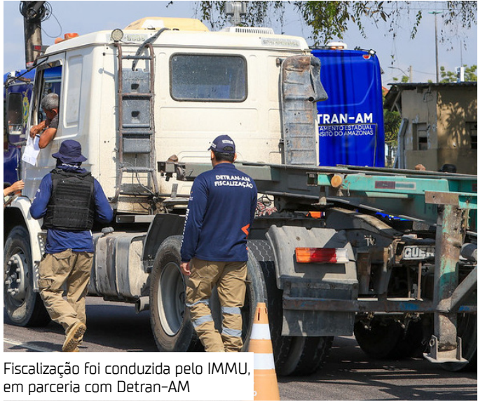
Fiscalização foi conduzida pelo IMMU, em parceria com Detran-AM