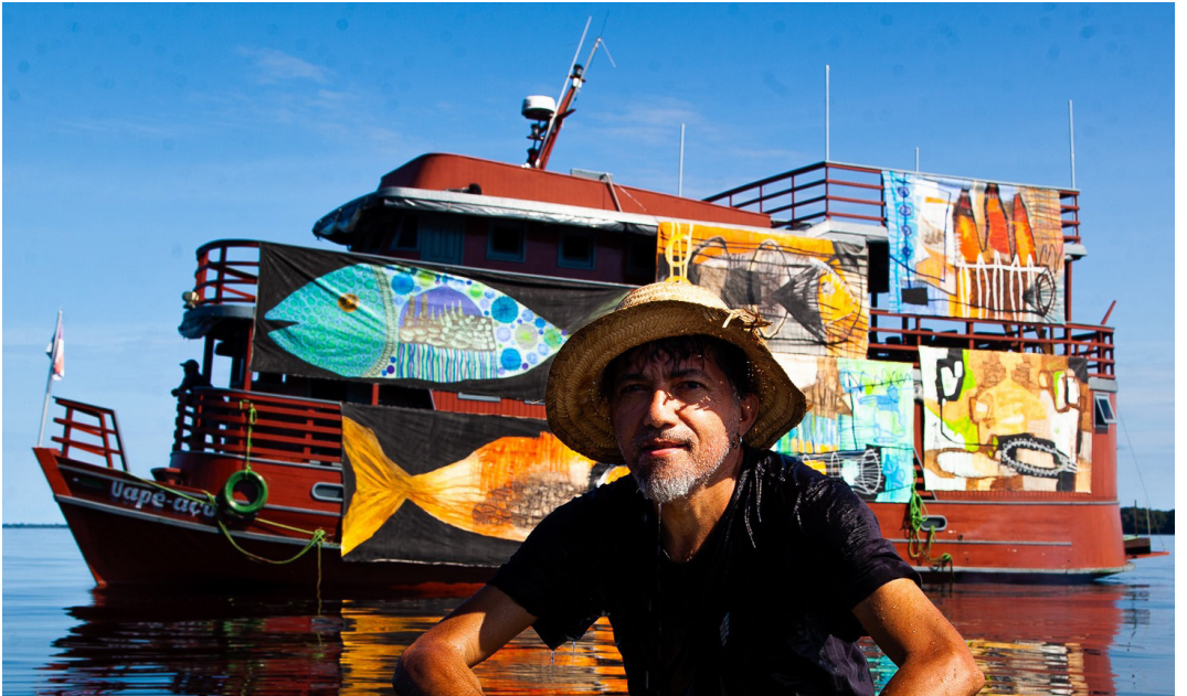
Reis integrará o painel "Da Amazônia para o Mundo: Arte, Cultura e Potência Global"

"Sou natural de Óbidos, no Pará, e a minha relação com o meio ambiente, arte e sustentabilidade, creio que começou na infância, por influência dos meus pais. Minha mãe bordava e meu pai era pescador, então acredito que a veia artística veio da minha mãe. O fato de meu pai ser pescador e eu sempre ter tido contato visual com vários elementos, como lamparinas, cuias, remos, os rios amazônicos, nossos peixes e nossa floresta influenciaram de certa forma, mesmo de maneira inconsciente, meu jeito de criar minhas obras com esse olhar para a preservação