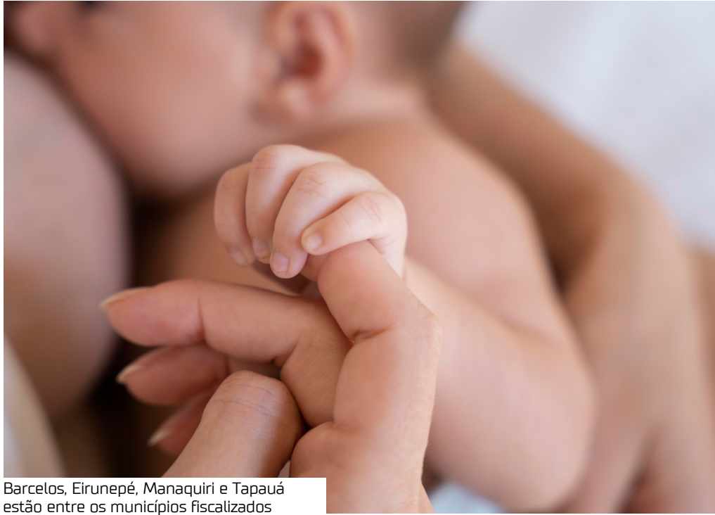
Barcelos, Eirunepé, Manaquiri e Tapauá estão entre os municípios fiscalizados