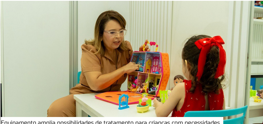
Equipamento amplia possibilidades de tratamento para crianças com necessidades

Manaus passa a contar, na rede privada, com o PediaSuit. A responsável pela novidade é a Clínica Sapere, primeira instituição particular da capital amazonense a oferecer o equipamento. O PediaSuit é reconhecido internacionalmente por auxiliar na reabilitação corporal de crianças com diferentes condições neurológicas e motoras.