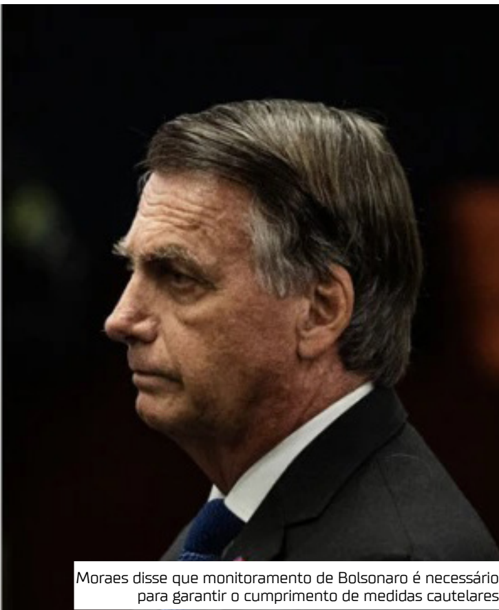
Moraes disse que monitoramento de Bolsonaro é necessário para garantir o cumprimento de medidas cautelares

Moraes disse que monitoramento de Bolsonaro é necessário para garantir o