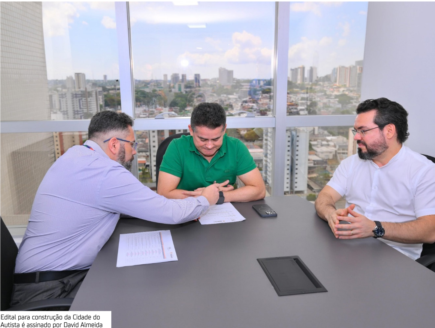
Edital para construção da Cidade do Autista é assinado por David Almeida

“Estamos virando a chave na atenção e no tratamento das pessoas com o espectro autista. Ainda este ano daremos a ordem de serviço para transformar este sonho em realidade”, afirmou o prefeito. Segundo ele, o empreendimento contará com investimento de R$ 17,4 milhões, sendo R$ 7 milhões oriundos de emendas parlamentares, R$ 5 milhões do deputado federal Silas Câmara e