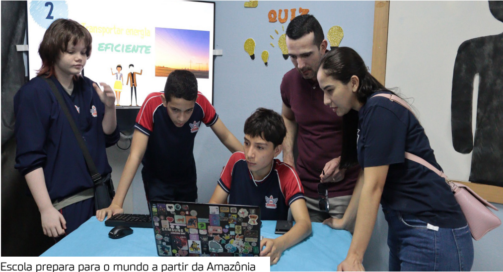
Escola prepara para o mundo a partir da Amazônia