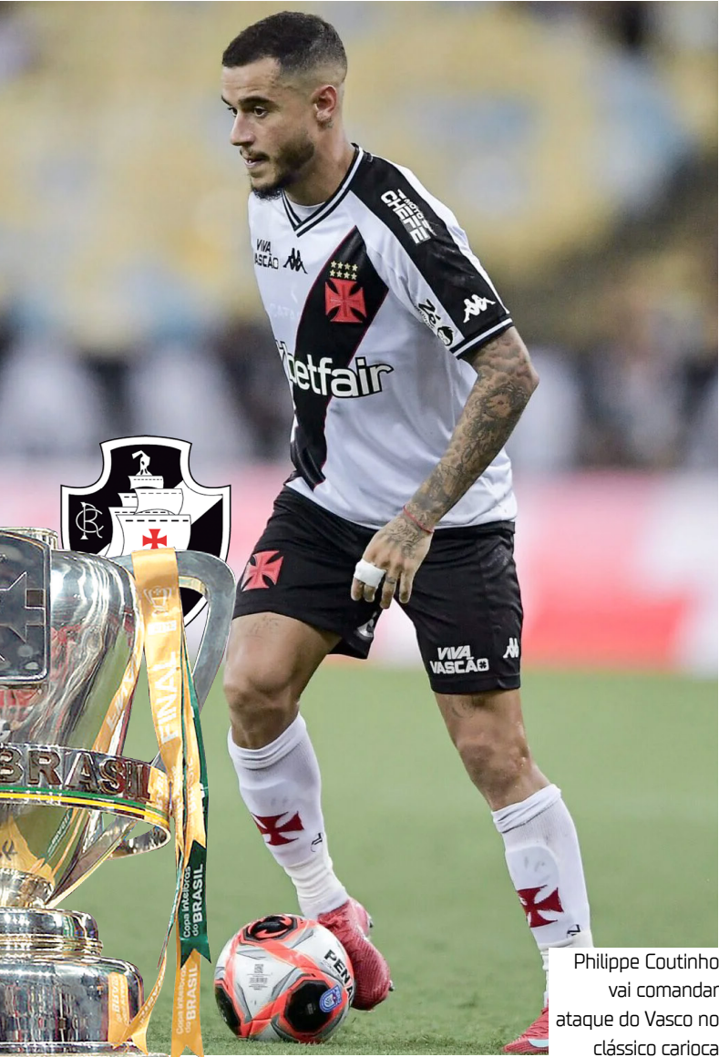
Philippe Coutinho vai comandar ataque do Vasco no clássico carioca

O Vasco da Gama recebe o Botafogo hoje (27), às 20h30, no estádio de São Januário, no Rio de Janeiro, pelo primeiro jogo das quartas de final da Copa do Brasil. O duelo marca mais um capítulo do tradicional Clássico da Amizade, com clima de decisão e promessa de casa cheia.