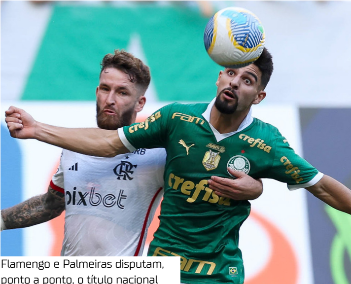
Flamengo e Palmeiras disputam, ponto a ponto, o título nacional