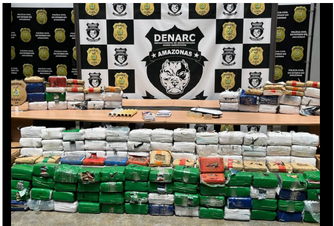
Droga apreendida seria enviada para a Europa

No local, a polícia também encontrou uma rinha de galos. A Delegacia Especializada em Crimes Contra o Meio Ambiente e Urbanismo (Dema) foi acionada para investigar o caso.