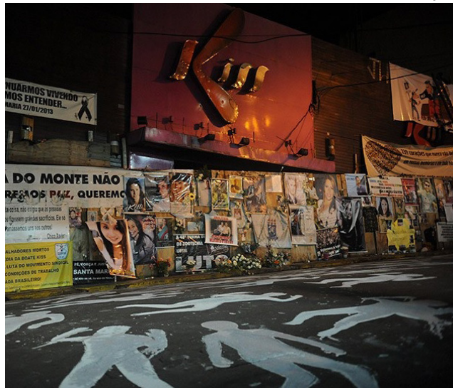
Tragédia deixou 242 mortos e 636 feridos

A 1ª Câmara Especial Criminal do Tribunal de Justiça do Rio Grande do Sul (TJRS) julgou nesta terça-feira (26) os recursos apresentados pelas defesas dos quatro condenados pelo incêndio na Boate Kiss. Os desembargadores decidiram manter as condenações e as prisões, mas reduziram, por unanimidade, as penas dos réus. A tragédia ocorreu em 27 de janeiro de 2013, em Santa Maria (RS), e deixou 242 mortos e 636 feridos.