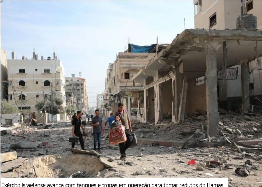
Exército israelense avança com tanques e tropas em operação para tomar redutos do Hamas

Apesar da oposição, após a aprovação do plano, ele ordenou a mobilização dos reservistas e iniciou a evacuação dos civis das áreas afetadas.