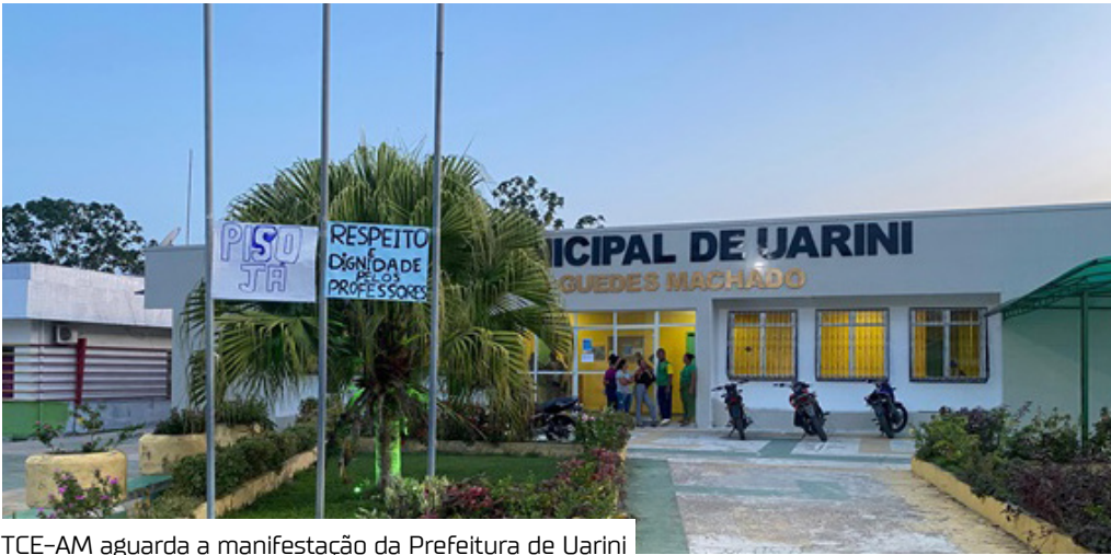
TCE-AM aguarda a manifestação da Prefeitura de Urarini

O Tribunal de Contas do Amazonas (TCE-AM) concedeu prazo de cinco dias para que a Prefeitura de Urarini, localizada a 595 quilômetros de Manaus, se manifeste sobre possíveis irregularidades no Pregão Eletrônico nº 028/2025. O certame trata da contratação de serviços de manutenção corretiva e preventiva na iluminação pública, com fornecimento de materiais elétricos, por meio de registro de preços, para atender a Secretaria Municipal de Obras e Serviços Públicos (Semob).