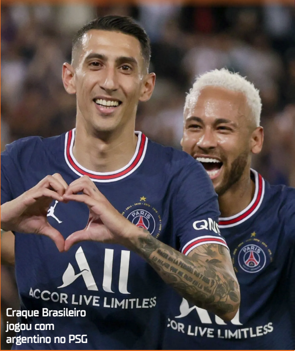
Craque Brasileiro jogou com argentino no PSG

A primeira partida de Vojvoda no comando será diante do Fluminense, no domingo (31).