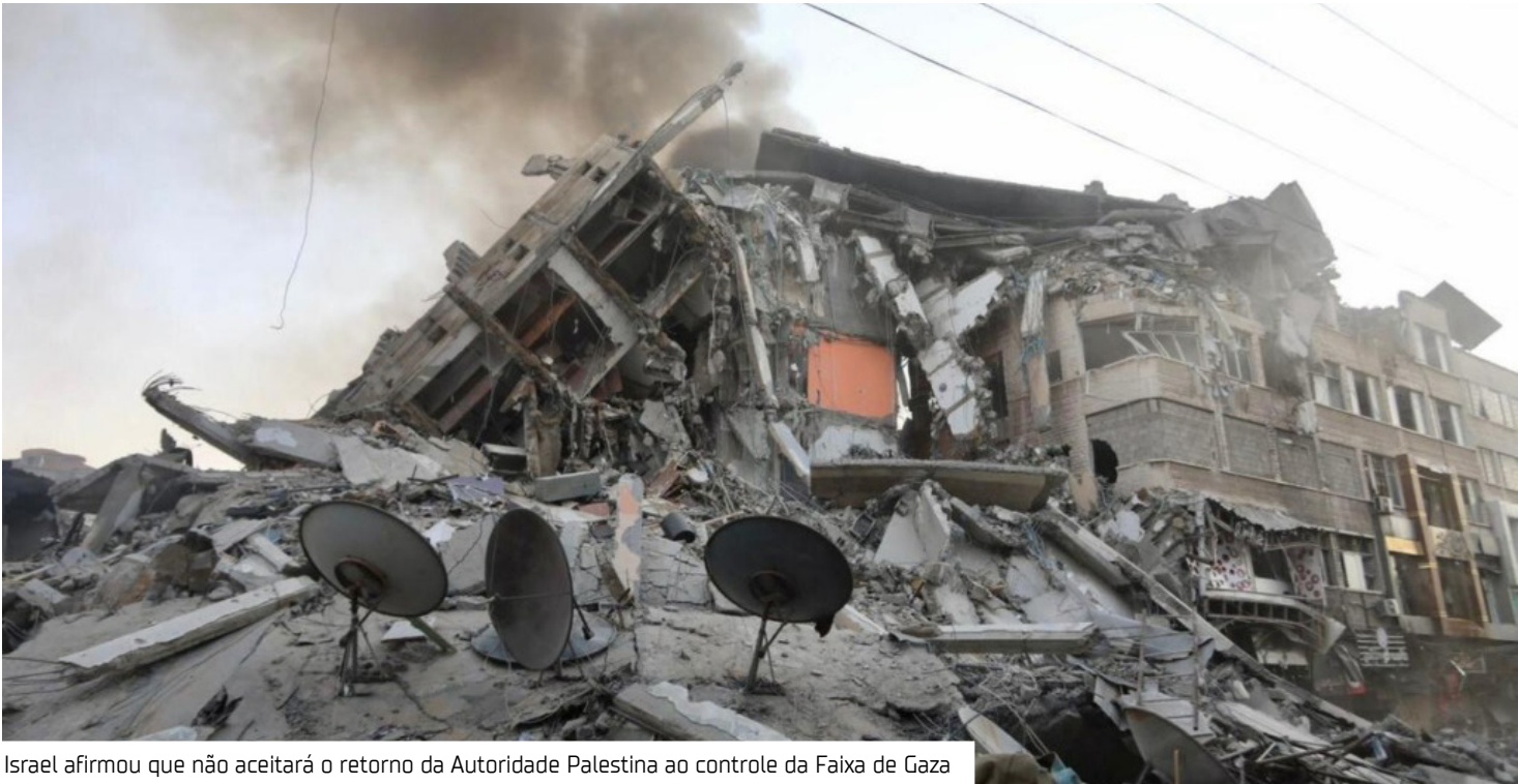
Israel afirmou que não aceitará o retorno da Autoridade Palestina ao controle da Faixa de Gaza

Nosul de Gaza, tanques destruíram casas no leste de Khan