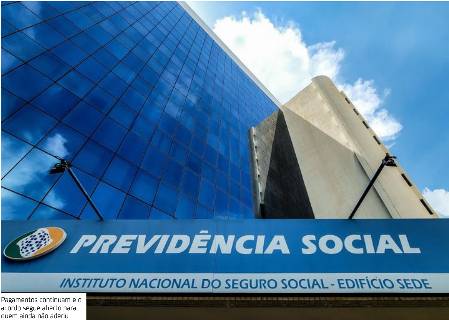
Pagamentos continuam e o acordo segue aberto para quem ainda não aderiu

Um total de 30.946 aposentados e pensionistas do Amazonas que foram vítimas de descontos indevidos em benefícios do INSS já receberam ressarcimento por parte do Governo Federal. Os valores são pagos de forma integral, com correção pela inflação (IPCA), diretamente na conta onde o segurado recebe o benefício. Até 11 de agosto, o Governo Federal já liberou mais de R$ 1 bilhão a 1,6 milhão de aposentados e pensionistas em ressarcimentos em todo o Brasil. Os pagamentos no Amazonas já superam R$ 23 milhões. Os aposentados e pensionistas que receberam a reparação correspondem a 67,3% do total de 46 mil pessoas vítimas de descontos indevidos que estão aptas a receber os valores de volta no estado. O total estimado para ressarcir todos os prejudicados é de R$ 33,4 milhões. “O governo que investigou a fraude ao INSS está devolvendo devidamente o dinheiro que foi roubado dos