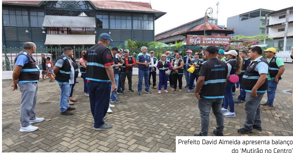
Prefeito David Almeida apresenta balanço do ‘Mutirão no Centro’

O prefeito destacou que o Centro exige uma atenção especial e que a experiência será levada a outras áreas. “Aqui é uma pegada mais forte, porque o Centro é referência de toda a cidade. Vamos destinar 90 dias, ou mais se for preciso, e realizar ações contínuas a cada 30 dias para manter o ordenamento. Assim que acessarmos os recursos do empréstimo, vamos recuperar a infraestrutura de todas as zonas e bairros de Manaus”, disse.