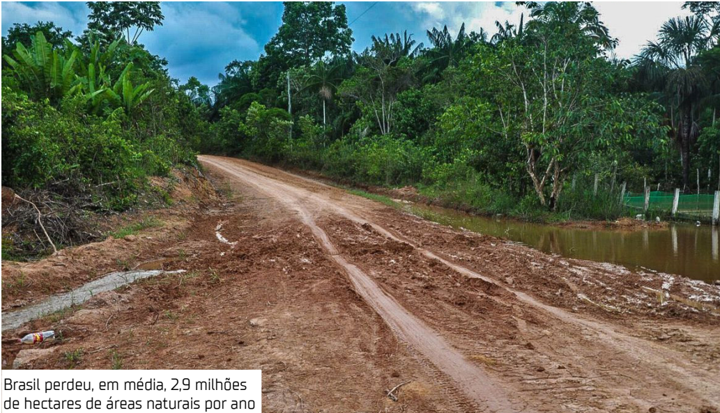
Brasil perdeu, em média, 2,9 milhões de hectares de áreas naturais por ano

Nesse período, o Brasil perdeu, em média, 2,9 milhões de hectares de áreas naturais por ano. A formação florestal foi a mais suprimida, com