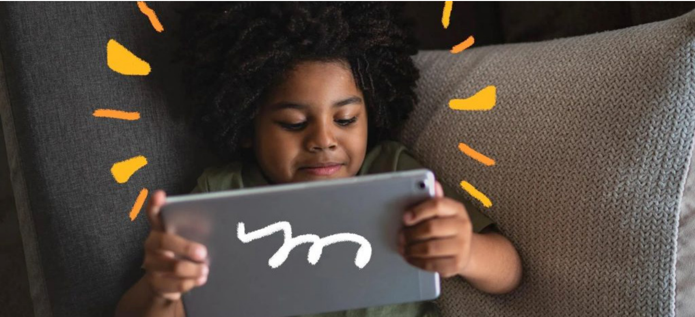
Aplicativo permitirá denúncias anônimas e acionamento de botão do pânico em casos de aliciamento virtual