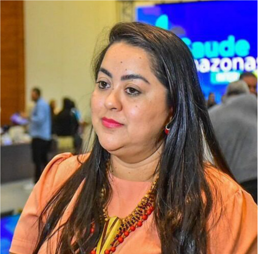
Vencedora da licitação é a empresa HSX Engenharia e Construções Ltda

Maués. Em fevereiro, por exemplo, a chefe do Executivo municipal assinou duas contratações diretas com dispensa de licitação com duas construtoras, somando o valor global de R$ 8.071.863,53. Eventos Já em abril deste ano, mesmo após decretar calamidade financeira em Maués no início de seu mandato, a prefeita autorizou, a contratação de uma empresa de Manaus para prestar serviços em eventos culturais do município. A vencedora da contratação foi a empresa Unipublicidade Organização de Eventos Ltda., que abocanhou valor global de R$ 7,5 milhões dos cofres públicos. A empresa é investigada pelo Ministério Público do Amazonas (MPAM) e pelo Tribunal de Contas (TCE-AM) por contratações de preços elevados com a Manauscult.