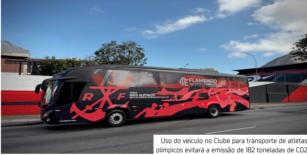
Uso do veículo no Clube para transporte de atletas olímpicos evitará a emissão de 182 toneladas de CO 2