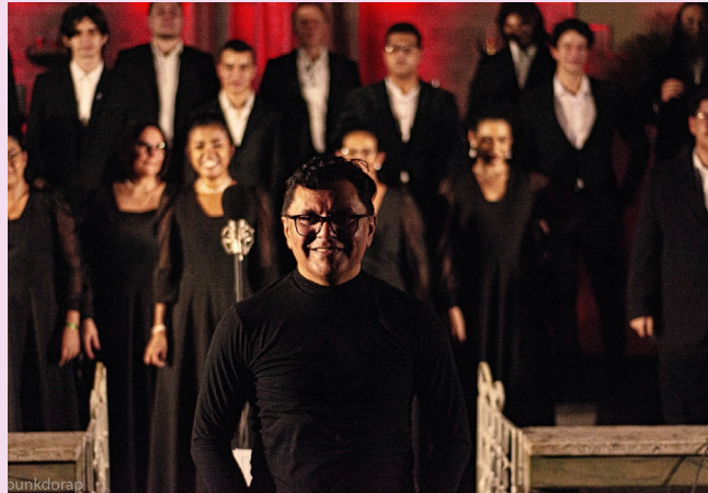
Grupo apresenta repertório afro-indígena no Teatro da Instalação