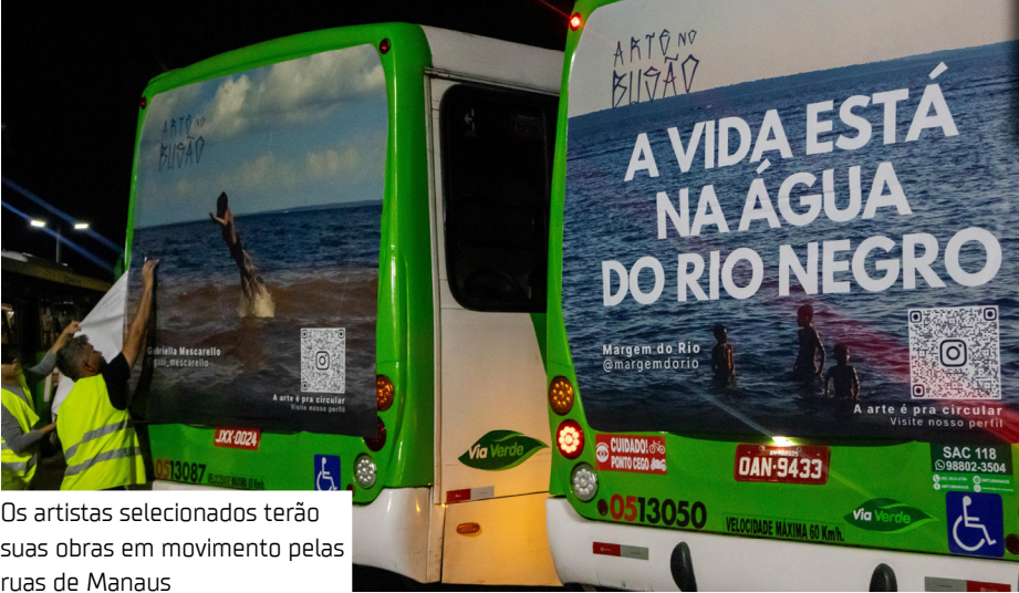
Os artistas selecionados terão suas obras em movimento pelas ruas de Manaus

“O projeto não só me permite expor minha arte, mas também estar ao lado de artistas talentosos e democratizar a arte, levando-a ao dia a dia das pessoas sem que precisem pagar ingresso ou se deslocar até um espaço cultural. Tudo fica ainda mais especial por saber que minha obra vai circular na linha 219, onde andei de ônibus pela primeira vez em Manaus, no bairro do Planalto, e minhas tias, que sempre me apoiam, estão orgulhosas que minha arte