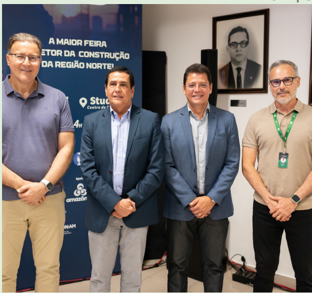
Feira acontece num bom momento para a construção civil