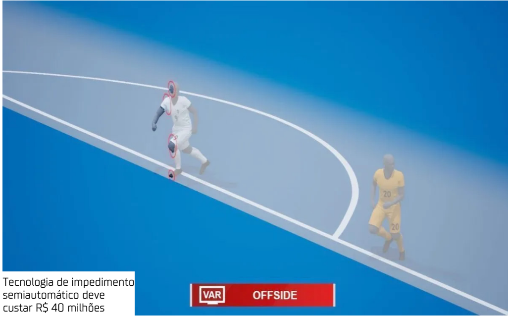
Tecnologia de impedimento semiautomático deve custar R$ 40 milhões

O impedimento semiautomático está se tornando uma realidade no futebol brasileiro. A Confederação Brasileira de Futebol (CBF) já está trabalhando para iniciar os trâmites que viabilizariam a nova medida em alguns estádios nesta edição do Brasileirão. A ideia é de que todas as praças estejam preparadas para receber o impedimento semiautomático na próxima edição, em 2026. A CNN apurou detalhes sobre os avanços na implementação. Quanto vai custar o impedimento semiautomático? Ao todo, os valores