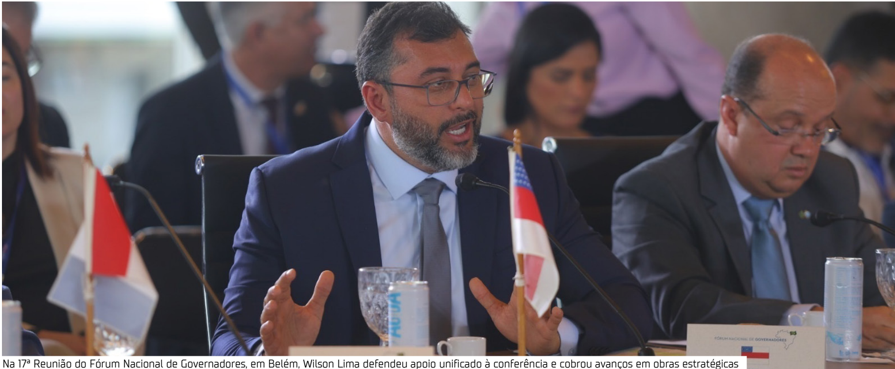
Na 17ª Reunião do Fórum Nacional de Governadores, em Belém, Wilson Lima defendeu apoio unificado à conferência e cobrou avanços em obras estratégicas

Segundo Wilson Lima, o documento deve deixar claro o que os estados esperam da conferência, incluindo financiamento mais justo, mecanismos para que os recursos cheguem à ponta, fortalecimento