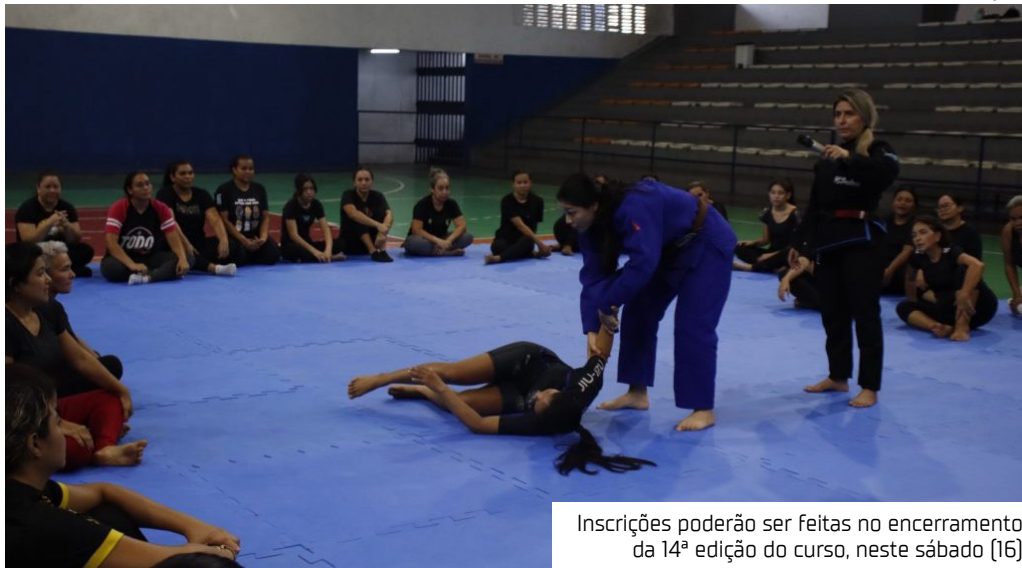
Inscrições poderão ser feitas no encerramento da 14ª edição do curso, neste sábado (16)

O Governo do Amazonas, por meio da Secretaria de Estado do Desporto e Lazer (Sedel), abre matrículas para mulheres interessadas em seguir praticando atividades esportivas nos núcleos fixos do projeto Formando Campeões, após a conclusão do Curso de Defesa Pessoal Feminina.