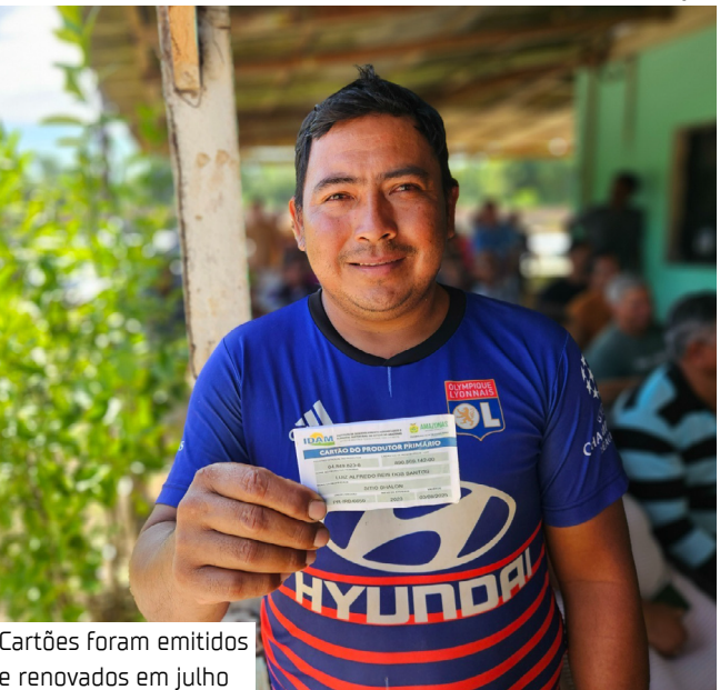
Cartões foram emitidos e renovados em julho