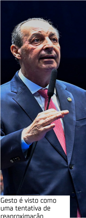
Gesto é visto como uma tentativa de reaproximação