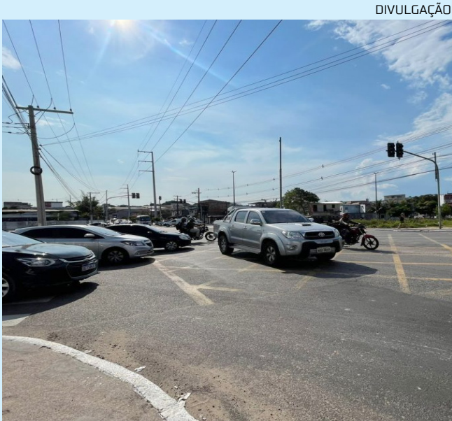
Avenida Silves vai sofrer alterações a partir de sábado (16)

lação geral, a medida tem como objetivo simplificar a operação semafórica, reduzir pontos de retenção e melhorar o escoamento do trânsito na zona Sul. Alternativas de trajeto Os motoristas que trafegam pela avenida Silves e desejam acessar a rua Paranaíba terão duas opções seguras: seguir até a rotatória da Suframa e retornar antes dela, ou utilizar a avenida Rodrigo Otávio, que também oferece acesso rápido e direto ao destino. A prefeitura reforça que a mudança deve reduzir significativamente o tempo de espera nos semáforos e garantir maior fluidez em uma das principais vias de ligação entre o Centro e o Distrito Industrial, beneficiando tanto veículos particulares quanto o transporte de cargas e mercadorias.