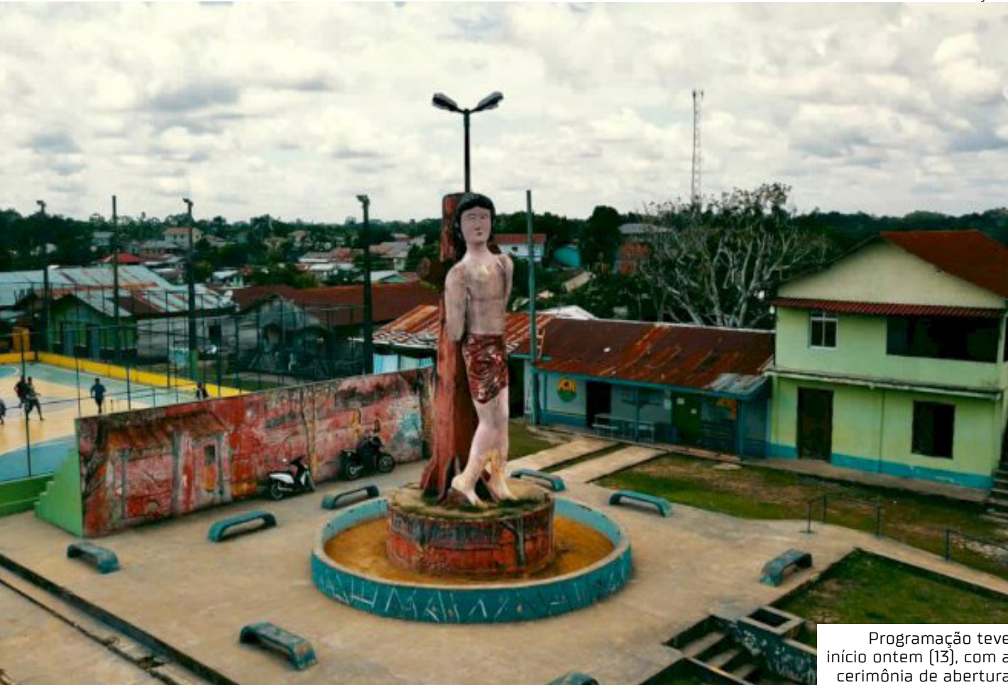
Programação teve início ontem (13), com a cerimônia de abertura

O município de Atalaia do Norte, distante 1.136 quilômetros de Manaus, será palco de dois importantes encontros regionais que reúnem lideranças políticas, educacionais e comunitárias do Alto Solimões: o 3º Encontro dos Municípios do Alto Solimões (G9) e o 7º Fórum dos Dirigentes Municipais de Educação do Alto Solimões (Fordime/AS). O evento começou ontem (13) e segue até sexta-feira (15). O evento deste ano contará com a presença do senador Eduardo Braga (MDB), que ouvirá as demandas dos gestores do interior. O parlamentar segue em caravana, participando da inauguração de obras em algumas cidades interioranas. Após os compromissos, Braga segue para o Fordime, que acontece em Atalaia do Norte. O senador Omar Aziz (PSD) não conseguiu acompanhar a caravana de Braga devido a um mal-estar. Entre os nomes confirmados no evento estão o deputado federal Saulo Vianna (União Brasil). Prefeituras Participam do encontro delegações dos municípios de Amaturá, Benjamin Constant, Fonte Boa, Jutai, São Paulo de Olivença, Santo Antônio do Içá, Tabatinga, Tonantins