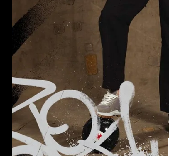
Vegetti é o garoto propaganda do Gigante da Colina