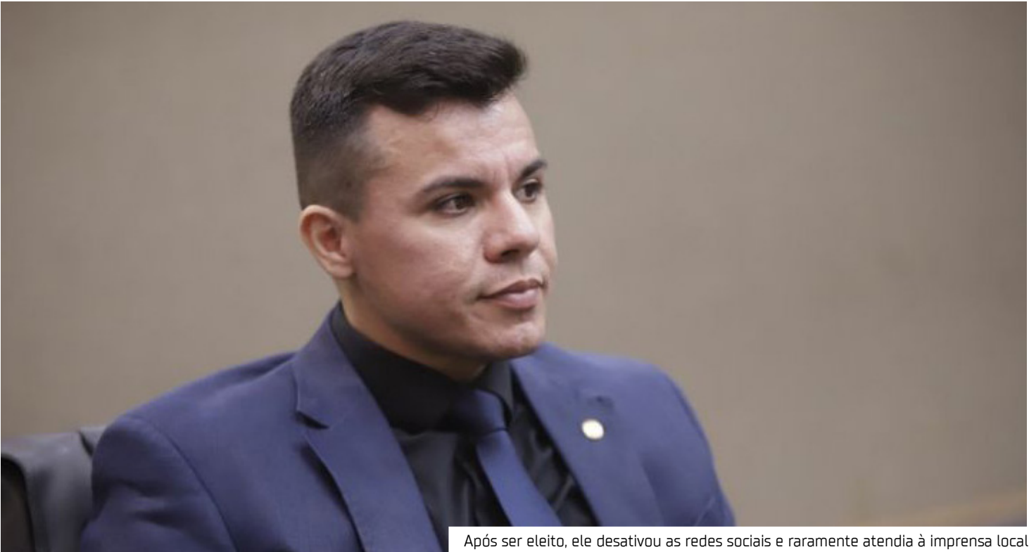
Após ser eleito, ele desativou as redes sociais e raramente atendia à imprensa local