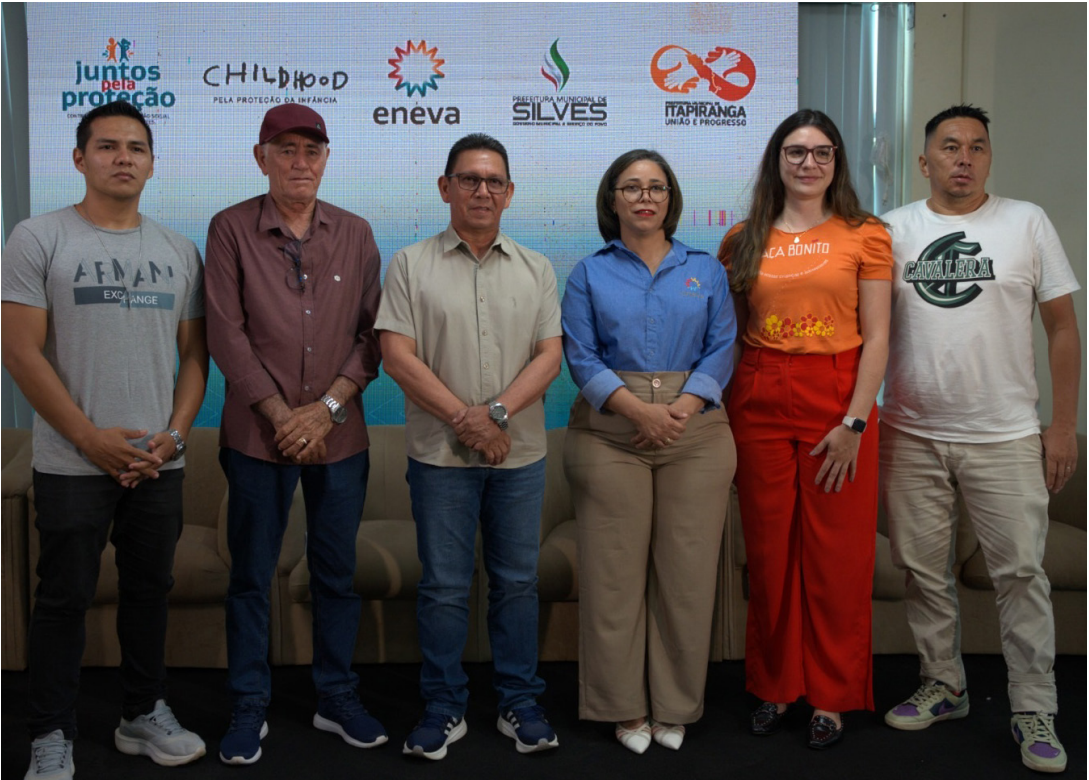
Projeto “Juntos pela Proteção” chega a Silves e Itapiranga para capacitar rede de proteção