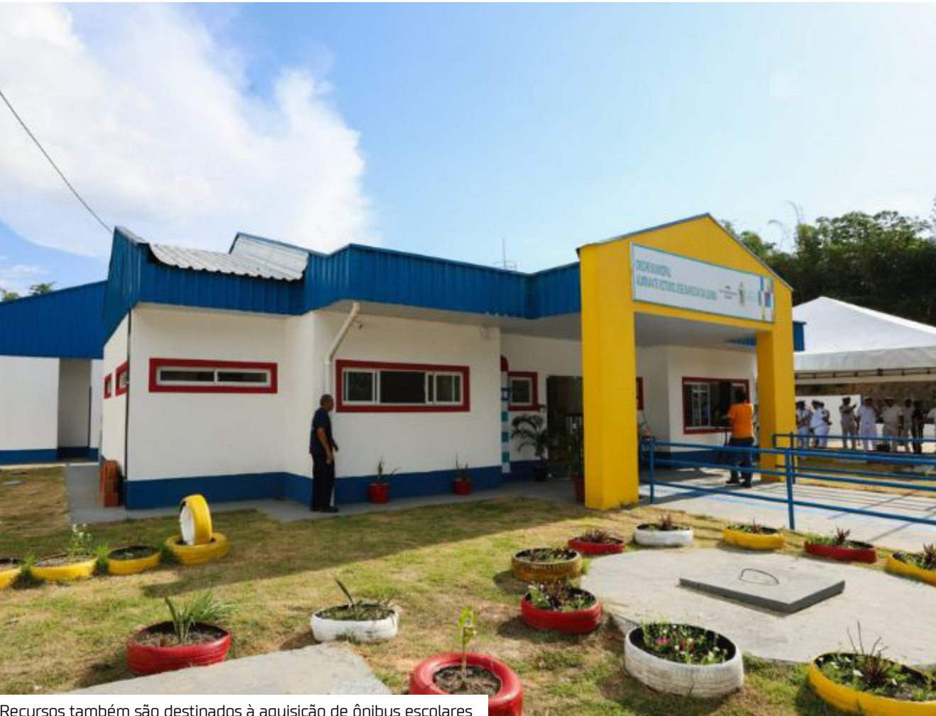
Recursos também são destinados à aquisição de ônibus escolares

O Tribunal de Contas do Amazonas (TCE-AM), por meio do Departamento de Auditoria em Educação (DEAE), orienta os 26 municípios amazonenses contemplados pelo Novo Programa de Aceleração do Crescimento (Novo PAC – Educação) a manifestarem, dentro do prazo legal, o interesse em receber os recursos destinados à construção de creches e à aquisição de ônibus escolares. No total, o estado receberá 28 novas unidades de educação infantil, sendo três em Manaus, e 30 veículos escolares para o transporte de es-