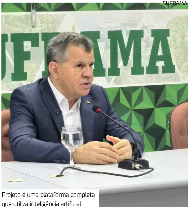
Projeto é uma plataforma completa que utiliza inteligência artificial

apresentação do projeto “Pap-Online”, uma iniciativa inovadora, desenvolvida com recursos de Pesquisa, Desenvolvimento e Inovação (PDSI) da Lei de Informática da Zona Franca de Manaus, que utiliza inteligência artificial e outras tecnologias para o diagnóstico precoce de câncer do colo do útero e de mama no Amazonas. O “Pap-Online” é executado pela startup WIT Tecnologia, dentro do escopo do Programa Prioritário de Indústria 4.0.