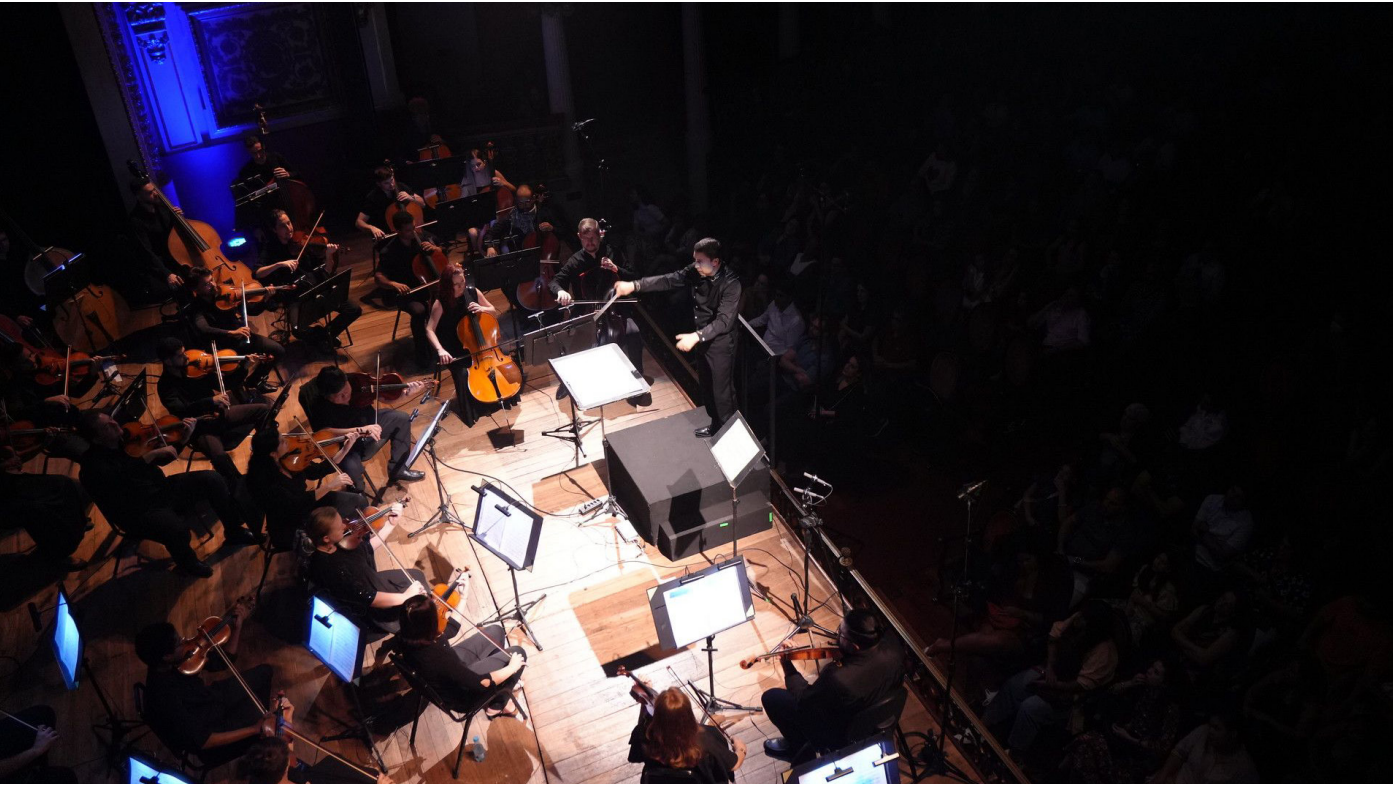
Programa contempla uma das composições mais densas e espiritualmente marcantes do repertório sacro

O Governo do Estado do Amazonas, por meio da Secretaria de Cultura e Economia Criativa, promove, hoje (14), às 20h, no Teatro Amazonas, a apresentação da obra Requiem, op. 89, do compositor tcheco Antonín Dvořák, interpretada pela Amazonas Filarmônica e pelo Coral do Amazonas, sob a regência do maestro Luiz Fernando Malheiro. Os ingressos para o concerto estão disponíveis na bilheteria do Teatro e pelo site https://www.shoppingressos.com.br .