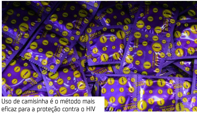
Uso de camisinha é o método mais eficaz para a proteção contra o HIV