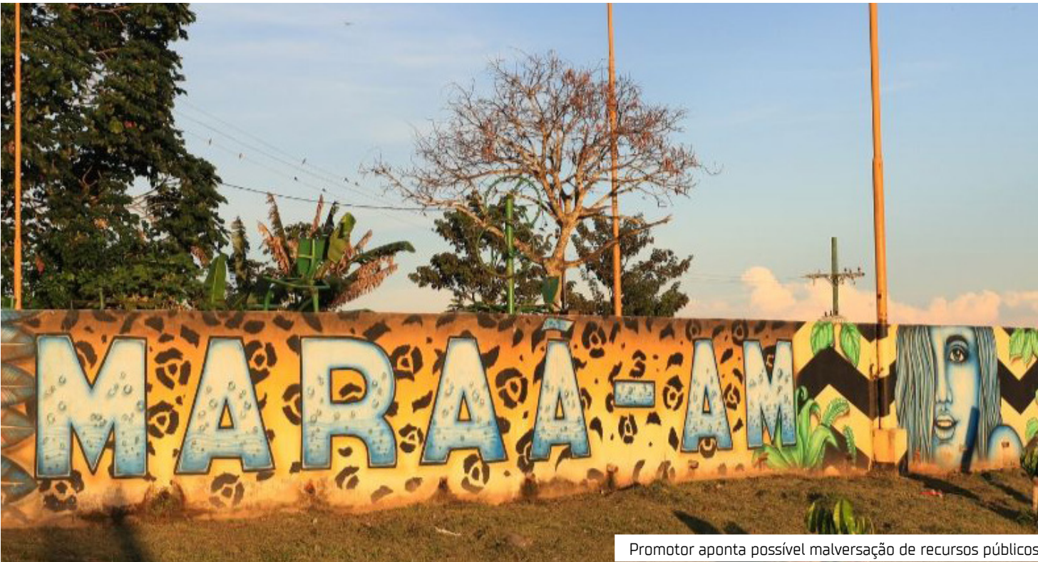
Promotor aponta possível malversação de recursos públicos

Entre as medidas determinadas, está o envio de novos ofícios à Prefeitura e à Secretaria Municipal de Educação, que terão 15 dias para apresentar esclarecimentos e documentos solicitados. A publicação da portaria deverá ser feita no Diário Oficial do Ministério Público do Estado (DOMPE). O inquérito busca identificar eventuais irregularidades na folha de pagamento da secretaria e responsabilizar os envolvidos, caso seja comprovada a existência de servidores fantasmas. A investigação integra a