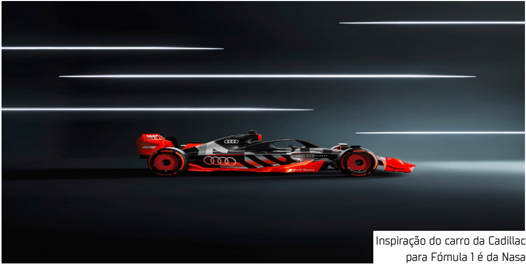
Inspiração do carro da Cadillac para Fórmula 1 é da Nasa

para uma equipe que construirá seus carros em Fishers, Indiana. Há também um local de design e fabricação perto do circuito do Grande Prêmio da Inglaterra, em Silverstone, mas a Cadillac tem a visão de operar uma “equipe americana”, disse Lowdon. A ideia é obter o máximo de perspectivas diferentes possível ao projetar um carro de corrida. “A Fórmula 1 é um negócio muito criativo”, disse Lowdon. “Com a diversidade de pensamento, vem a inovação e, com sorte, o tempo de volta”. A nova equipe pode ser um caminho de volta à F-1 para pilotos como Sergio Pérez, Valtteri Bottas ou Zhou Guanyu, que perderam suas vagas na Fórmula 1 para 2025.