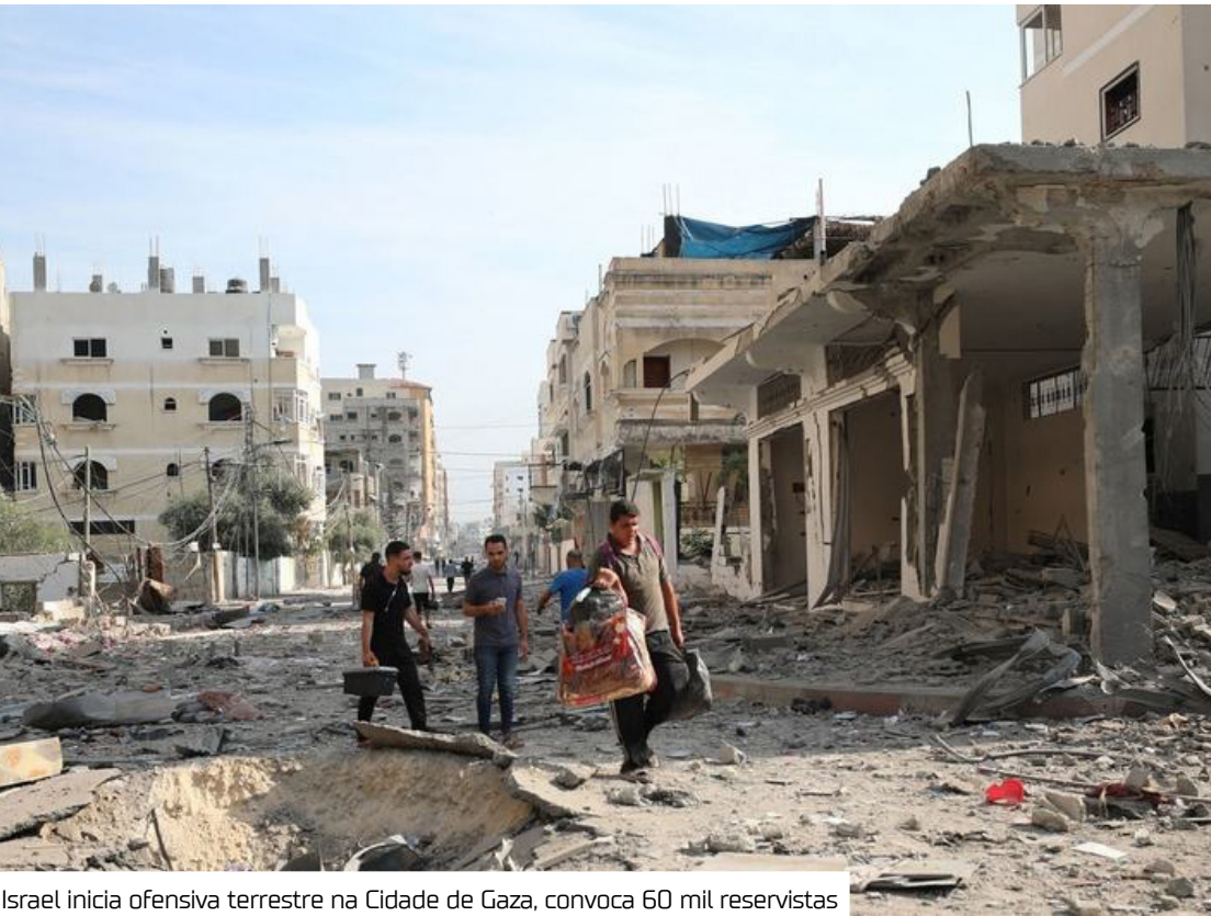
Israel inicia ofensiva terrestre na Cidade de Gaza, convoca 60 mil reservistas

Ontem (20), o gabinete de Netanyahu ordenou ao Exército israelense que “reduza os prazos” para capturar os redutos do Hamas e eliminar o grupo, classificado como terrorista por Israel e aliados ocidentais. O comunicado, no entanto, não apresentou um novo cronograma. Effie Defrin informou que a nova fase da ofensiva começou após um confronto com o Hamas, mas não divulgou detalhes. Para reforçar a ação militar, Israel convocou mais 60 mil reservistas nesta quarta-feira.