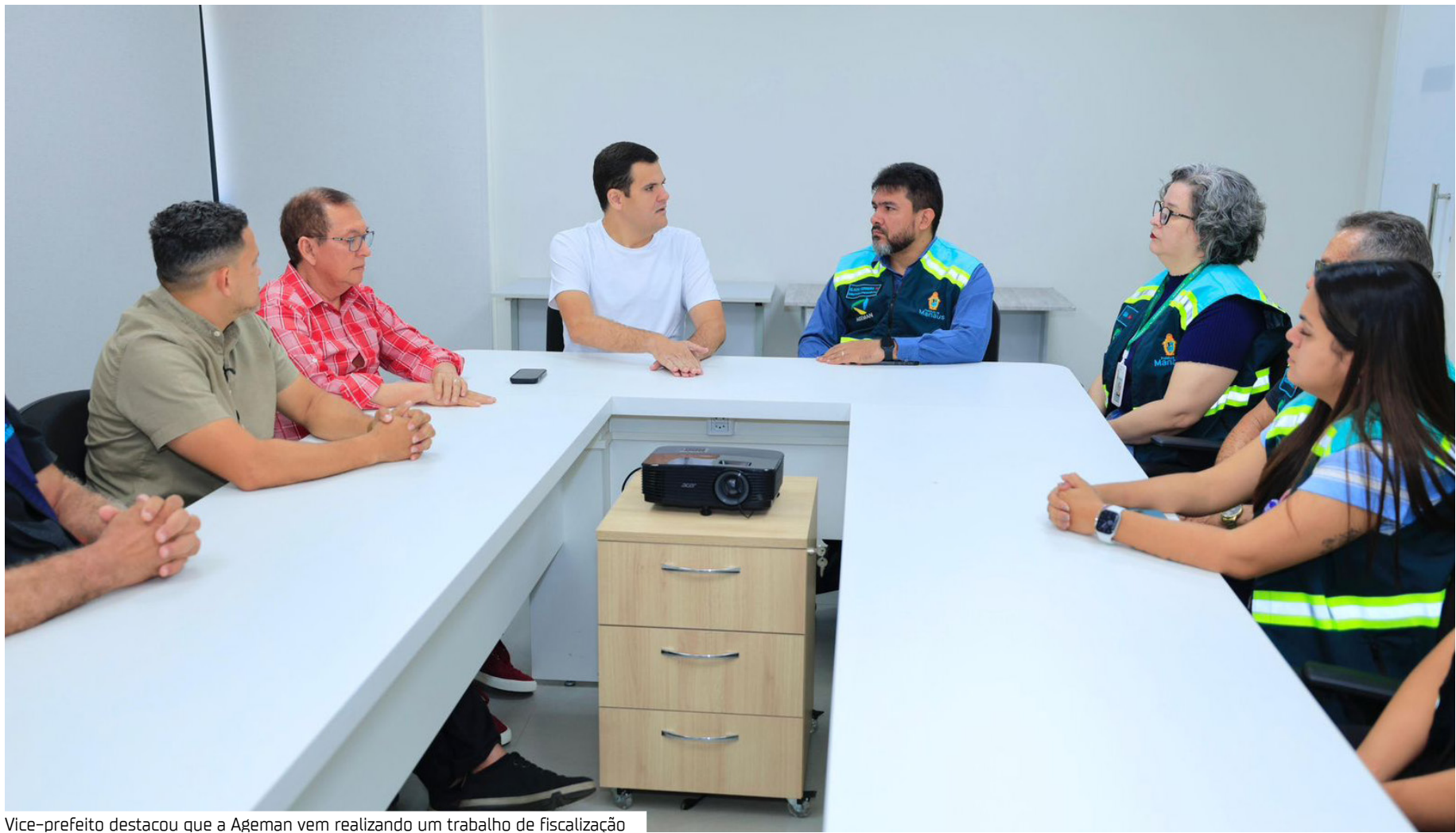
Vice-prefeito destacou que a Ageman vem realizando um trabalho de fiscalização

"Sabemos que a nossa cidade é muito grande e