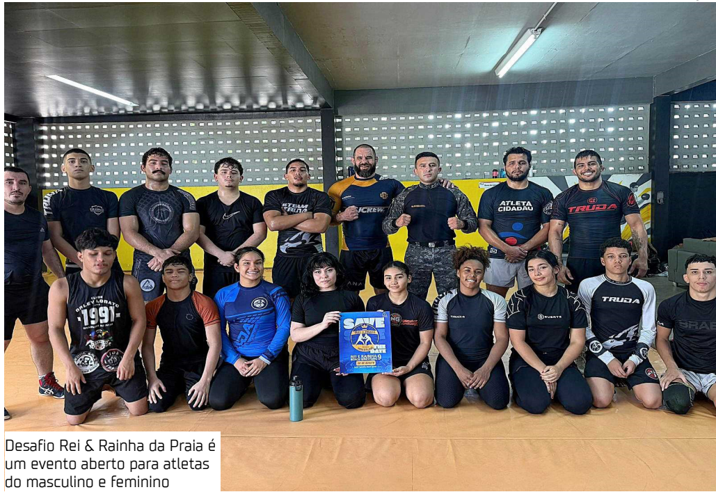
Desafio Rei & Rainha da Praia é um evento aberto para atletas do masculino e feminino