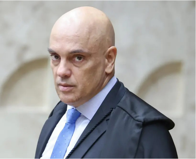
Ministro do STF critica aplicação de sanções americanas no Brasil

O ministro do Supremo Tribunal Federal (STF), Alexandre de Moraes, afirmou em entrevista à Reuters que instituições financeiras brasileiras podem ser penalizadas caso cumpram ordens de bloqueio de ativos com base em sanções dos Estados Unidos sem validação da Justiça brasileira. As declarações foram dadas em meio a uma crise que afetou diretamente as ações de grandes bancos nacionais. O impasse envolve a aplicação de sanções dos EUA contra Moraes e a resposta do STF, que exige a observância da legislação nacional.