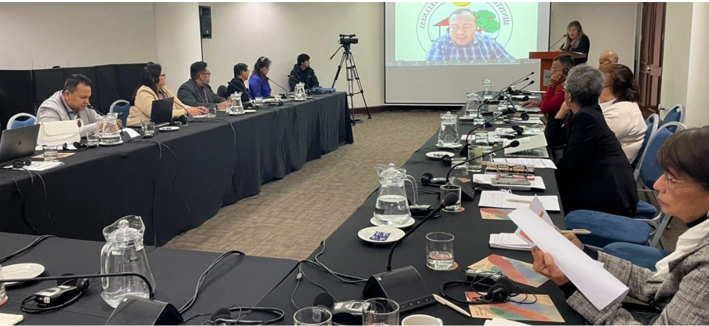
Iniciativa reuniu especialistas e gestores para avançar na eliminação da malária vivax

A Fundação de Vigilância em Saúde do Amazonas – Dra. Rosemary Costa Pinto (FVS–RCP), da Secretaria de Estado de Saúde do Amazonas (SES–AM), destacou a experiência exitosa pioneira de implementação da tafenoquina, como estratégia para eliminação da malária vivax no estado, durante o encontro internacional realizado nos dias 19 e 20 de agosto, em Lima, no Peru.