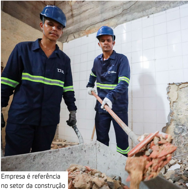
Empresa é referência no setor da construção