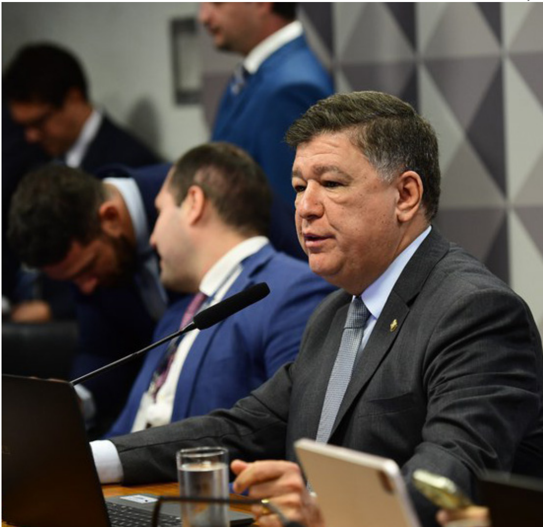
CPMI terá 180 dias para investigar os descontos indevidos

Já o senador Omar Aziz desejou boa sorte ao presidente. Ele disse esperar que o trabalho seja conduzido com isenção e sem pré-julgamentos.