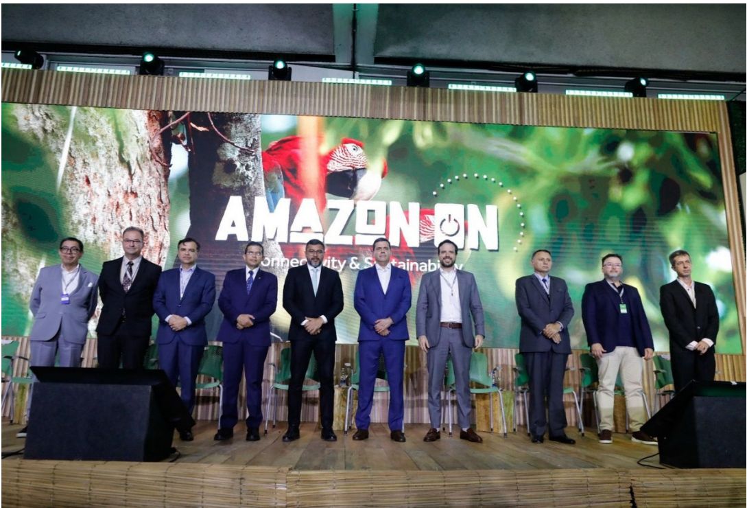
Governador destaca inclusão digital em comunidades isoladas

Na área da saúde, o governador citou como exemplo o Telessaúde, que já permite consultas com especialistas em comunidades isoladas, e o teliagnóstico com inteligência artificial, capaz de emitir laudos de exames como eletrocardiogramas em até dez minutos, enviados diretamente ao apli-