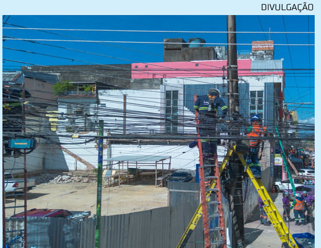
Mutirão do Bairro remove fios antigos e organiza postes no Centro

O Implurb informou que o trabalho continuará de forma gradual até contemplar todo o Centro, e deverá ser replicado em outras áreas da cidade.