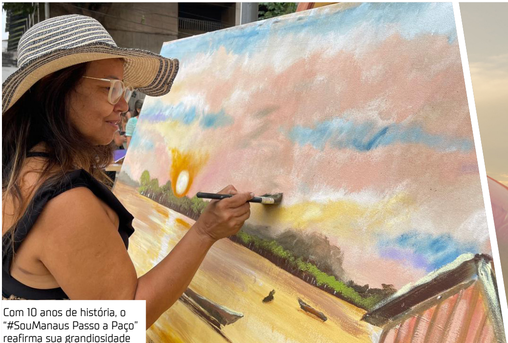
Com 10 anos de história, o “#SouManaus Passo a Paço” reafirma sua grandiosidade

Entre as grandes novidades deste ano está a criação do espaço Estação das Artes, que será montado no estacionamento do mirante Lúcia Almeida, no coração do Centro. A iniciativa é realizada pela Prefeitura de Manaus, por meio da Fundação Municipal de Cultura, Turismo e Eventos [Manauscult], em parceria com o Serviço So-