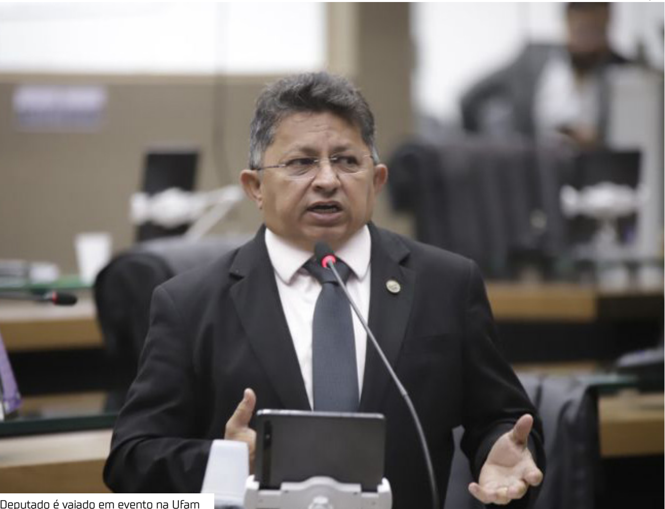
Deputado é vaiado em evento na Ufam