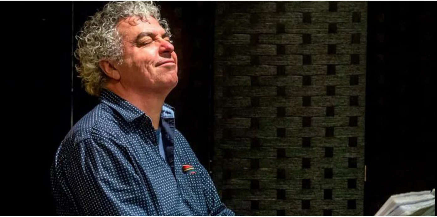
Atividades seguem até sexta-feira (8), com músicos renomados no Palácio da Justiça e Teatro Gebes Medeiros, no Centro de Manaus

Pessoas interessadas em aprender mais sobre a cultura jazzística podem participar de workshops, palestras e masterclasses gratuitas, que compõem a programação do Amazonas Green Jazz Festival. As atividades seguem até amanhã (8), com artistas nacionais e internacionais no Centro Cultural Palácio da Justiça (CCPJ) e no Teatro Gebes Medeiros, ambos localizados no bairro Centro, Zona Sul de Manaus.