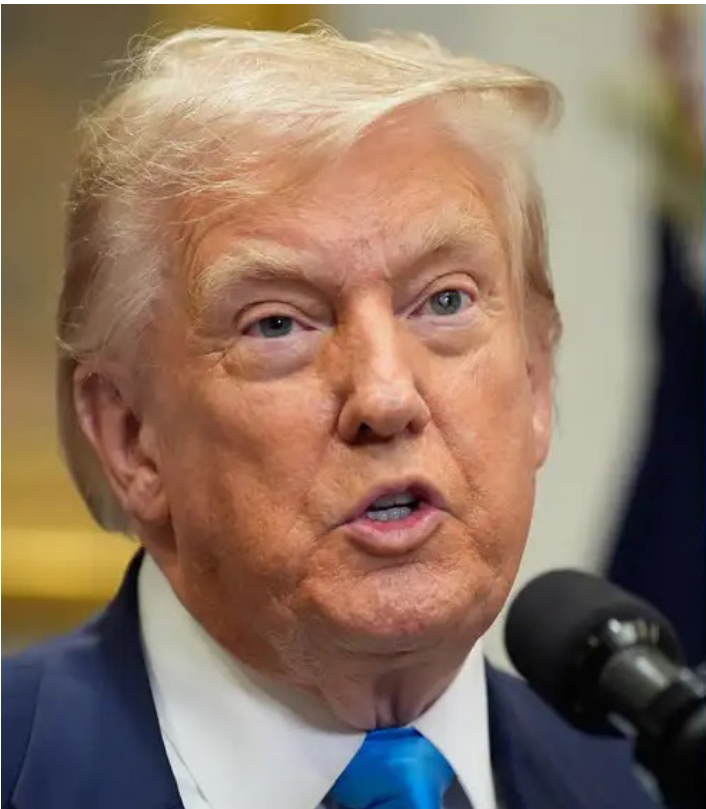
Lula descarta negociar com Trump após tarifas dos EUA subirem para 50%

Apesar da crise comercial, o presidente deixou claro que não tem intenção de ligar para Trump neste momento. “Pode ter certeza de uma coisa: o dia que a minha intuição me disser que o Trump está disposto a conversar, eu não terei dúvida de ligar para ele. Mas hoje a minha intuição diz que ele não quer