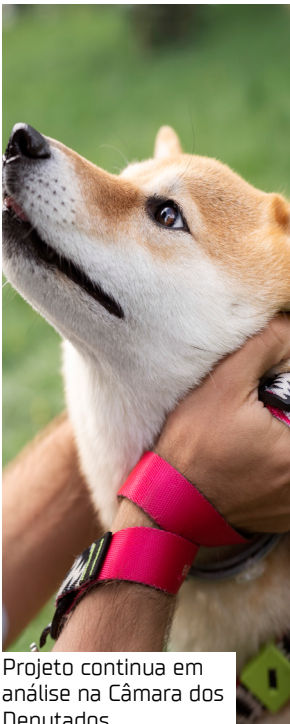
Projeto continua em análise na Câmara dos Deputados