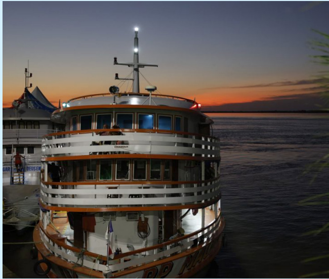
MP investiga se idosos têm passagem grátis negada em barcos