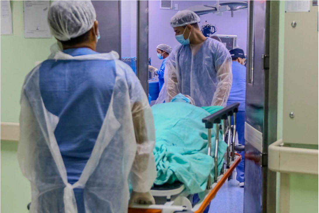
Transplantes, exames de alta complexidade e mutirões cirúrgicos integram o novo formato padrão Delphina

Outra frente de expansão está no Hospital 28 de Agosto, integrante do Complexo Hos-