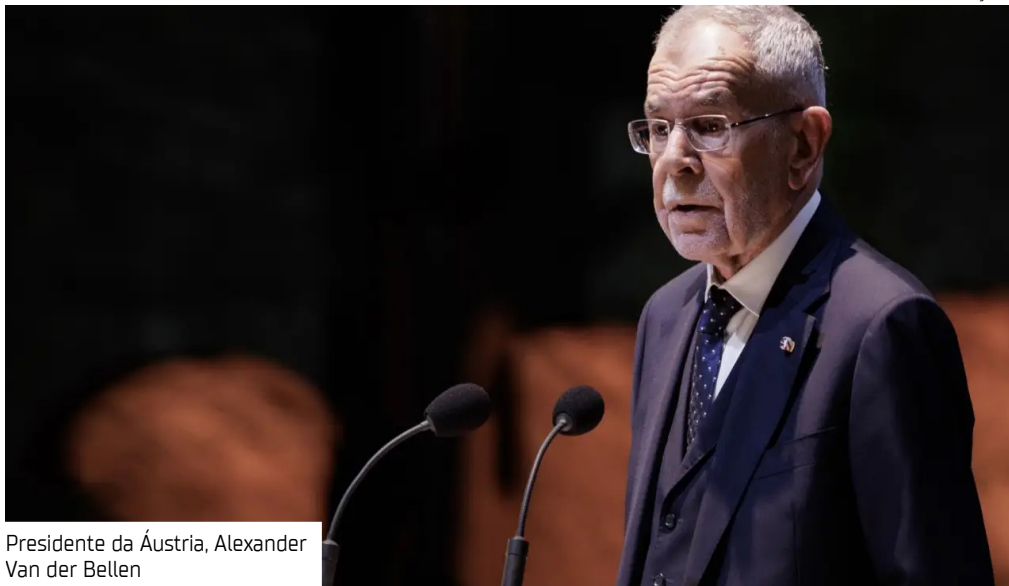
Presidente da Áustria, Alexander Van der Bellen

O alto custo da viagem à Belém, somado à escassez de vagas na rede hoteleira, pode comprometer a participação de países com menos recursos — justamente os mais afetados pela crise climáti-