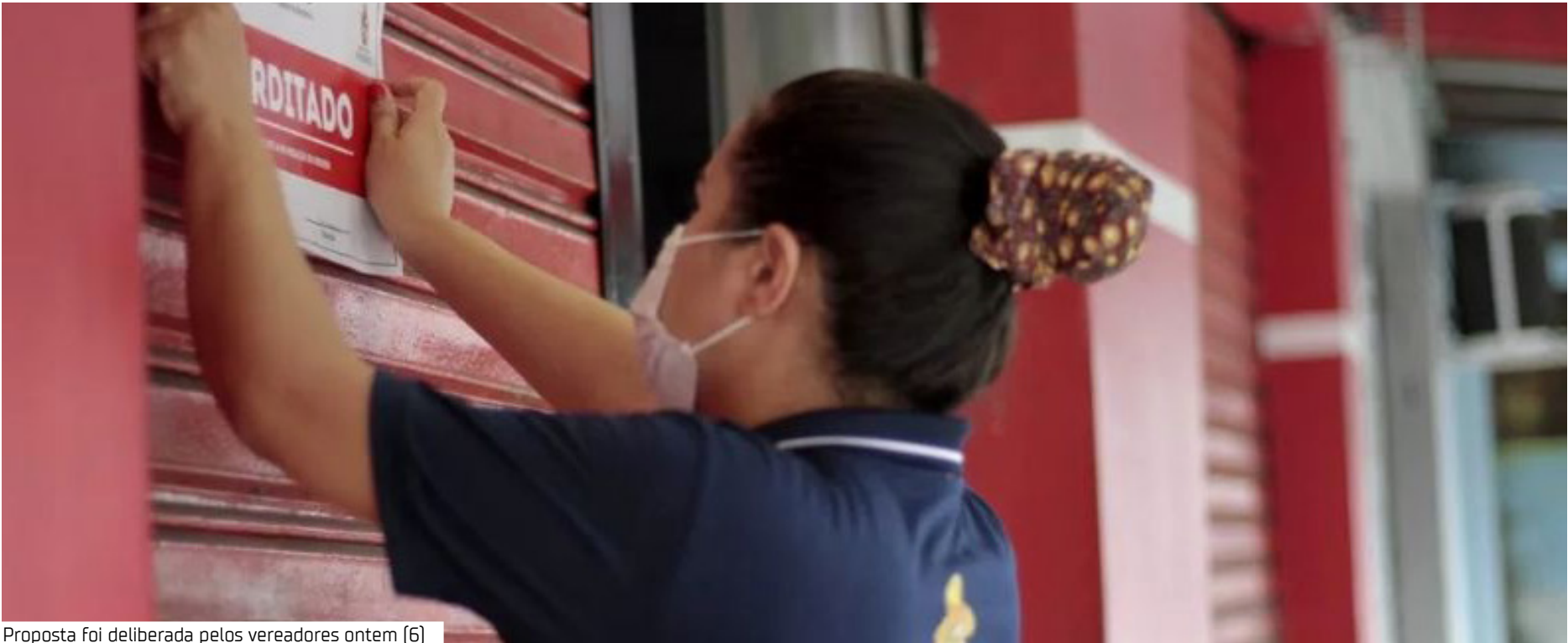
Proposta foi deliberada pelos vereadores ontem (6)

Segundo a Prefeitura, a Secretaria Municipal de Finanças, Planejamento e Tecnologia da Informação (Semef) é hoje a responsável por execu-