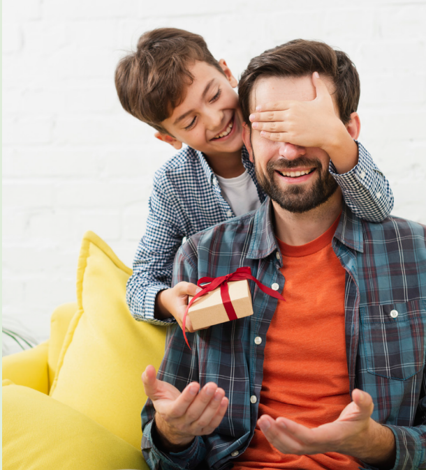
Varejista aposta no valor emocional da data para impulsionar as vendas