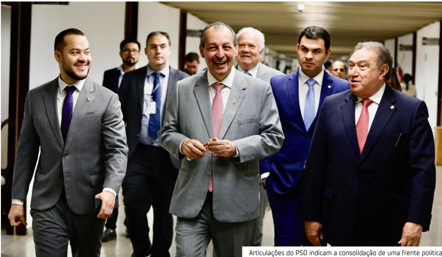
Articulações do PSD indicam a consolidação de uma frente política

As articulações do PSD indicam a consolidação de uma frente política em torno do projeto eleitoral de Omar Aziz, que aparece como líder isolado na corrida pelo governo do Amazonas. Uma pesquisa