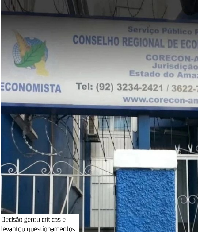
Decisão gerou críticas e levantou questionamentos