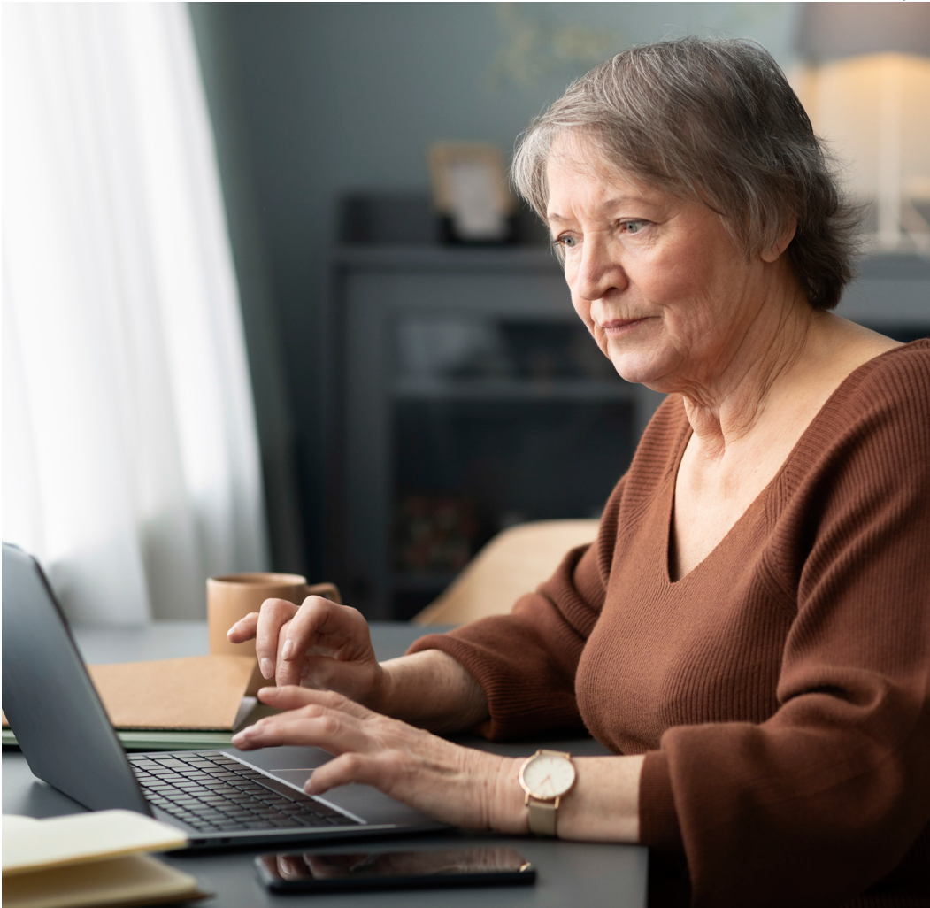
Proposta proíbe a discriminação por idade na concessão de empréstimos

Para virar lei, a proposta precisa ser aprovada pela Câmara e pelo Senado.