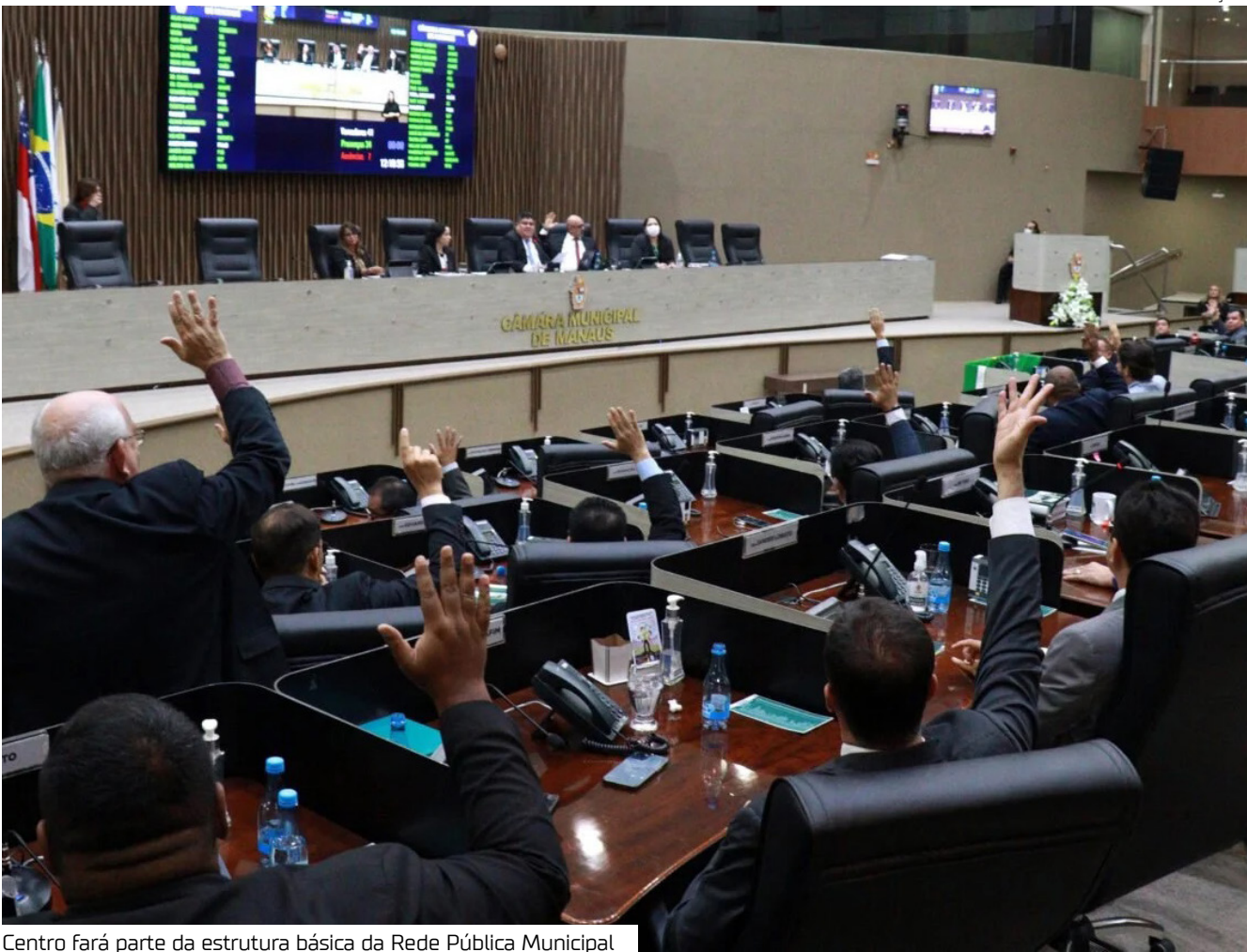
Centro fará parte da estrutura básica da Rede Pública Municipal