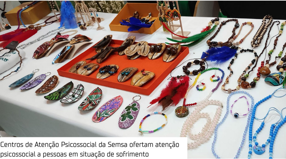
Centros de Atenção Psicossocial da Semsu ofertam atenção psicossocial a pessoas em situação de sofrimento