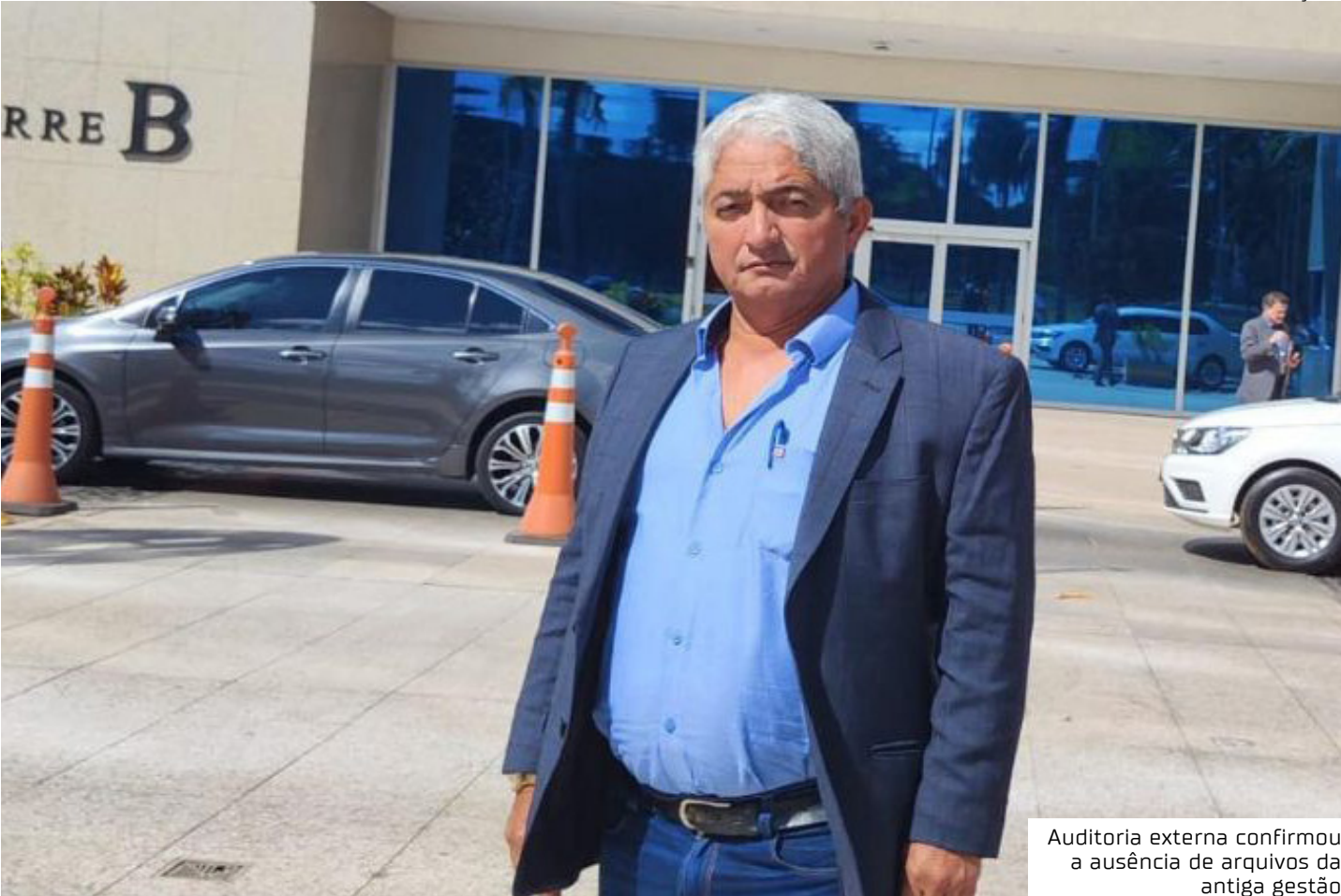
Auditoria externa confirmou a ausência de arquivos da antiga gestão