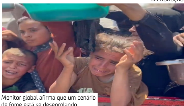
Monitor global afirma que um cenário de fome está se desenrolando

Israel interrompeu o fornecimento de água e eletricidade no início da guerra, restando apenas parcialmente o serviço. A infraestrutura foi amplamente destruída e os poços dependem de pequenos geradores, que raramente contam com combustível disponível.