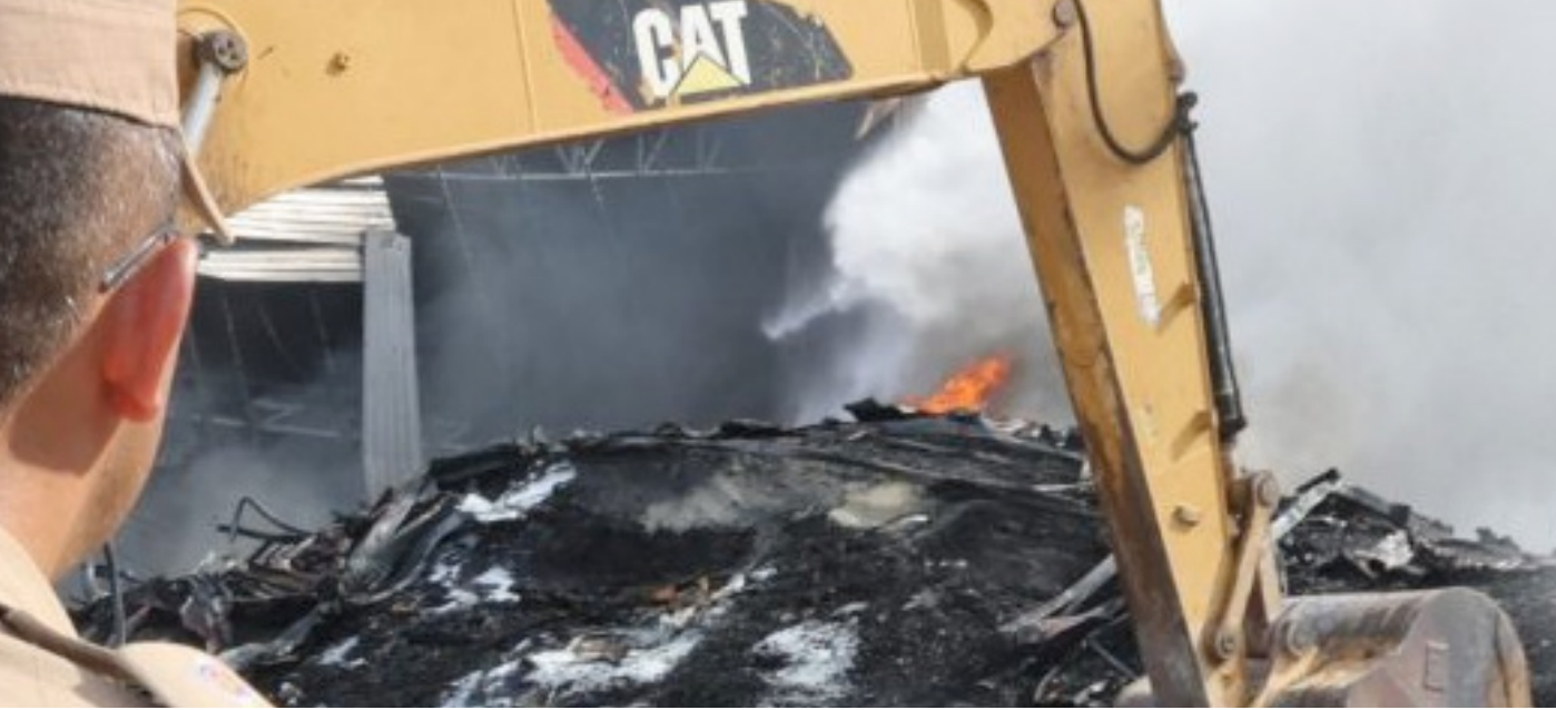
Incêndio acabou com fábrica da Effa Motors, localizada no Distrito 2

O Governo do Amazonas montou uma força-tarefa para controlar um grande incêndio que atinge as empresas Effa Motors e Valfilm da Amazônia, no Distrito Industrial 2, Zona Leste de Manaus.