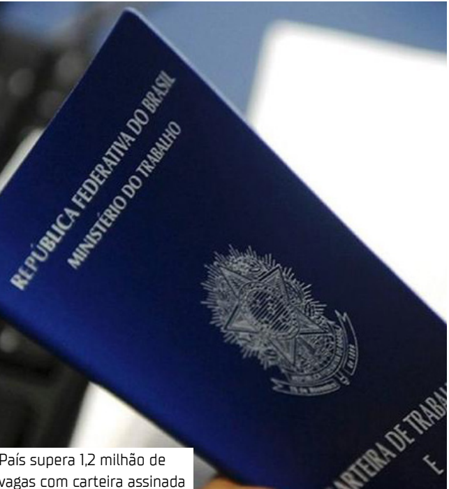
País supera 1,2 milhão de vagas com carteira assinada