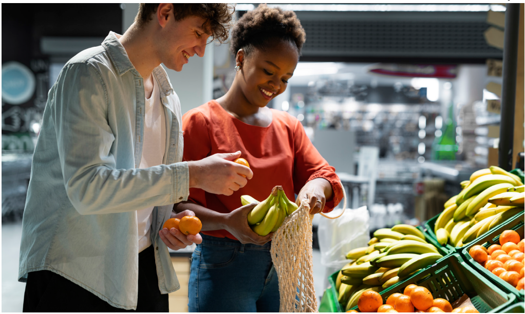
Alta vem após uma retração de 6,2% em junho