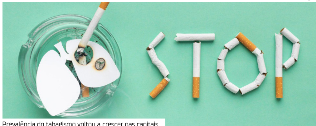
Prevalência do tabagismo voltou a crescer nas capitais

O percentual de adultos fumantes nas capitais brasileiras subiu de 9,3% em 2023 para 11,6% em 2024, de acordo com dados da pesquisa Vigitel, divulgada pelo Ministério da Saúde em maio de 2025. A alta interrompeu uma trajetória de queda contínua desde 2007 e marca o Dia Nacional de Combate ao Fumo, celebrado hoje (29), como um momento de alerta para o país.