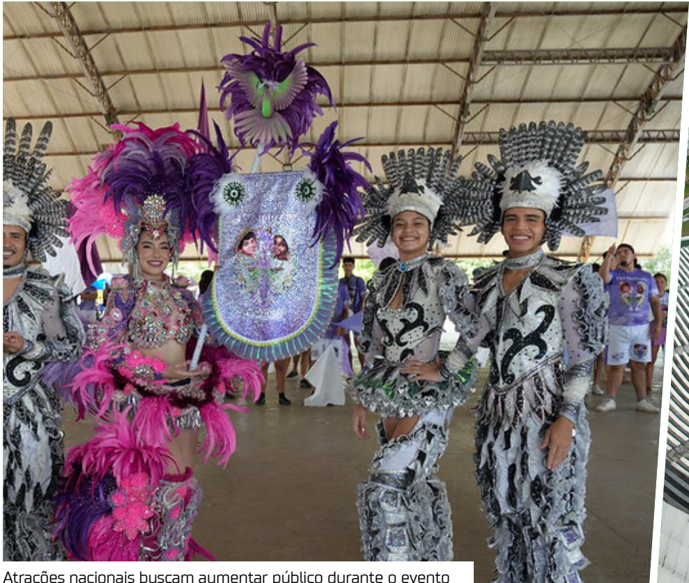
Atrações nacionais buscam aumentar público durante o evento

“Nós estamos trabalhando para que o Festival das Cirandas seja o maior de todos os tempos. Nossas cirandas já fazem um grande espetáculo e os shows vêm para incrementar ainda mais essa grande festa. Aproveito para convidar a todos para vir conhecer e curtir essa grande expressão cultural do Amazonas” convidou o secretário de Estado de Cultura e Economia Criativa, Caio André.