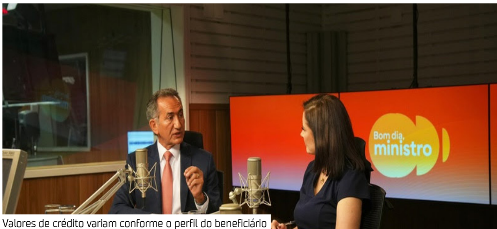
Valores de crédito variam conforme o perfil do beneficiário

A expansão do programa do Governo Federal de microcrédito produtivo orientado para pequenos produtores, o AgroAmigo, para as regiões Norte e Centro-Oeste foi tema da entrevista do ministro da Integração e do Desenvolvimento Regional, Waldez Góes, no programa Bom Dia, Ministro, da EBC, ontem (28). A política pública visa garantir que comunidades indígenas, quilombolas, pescadores artesanais e agricultores familiares tenham acesso efetivo a crédito e assistência técnica.