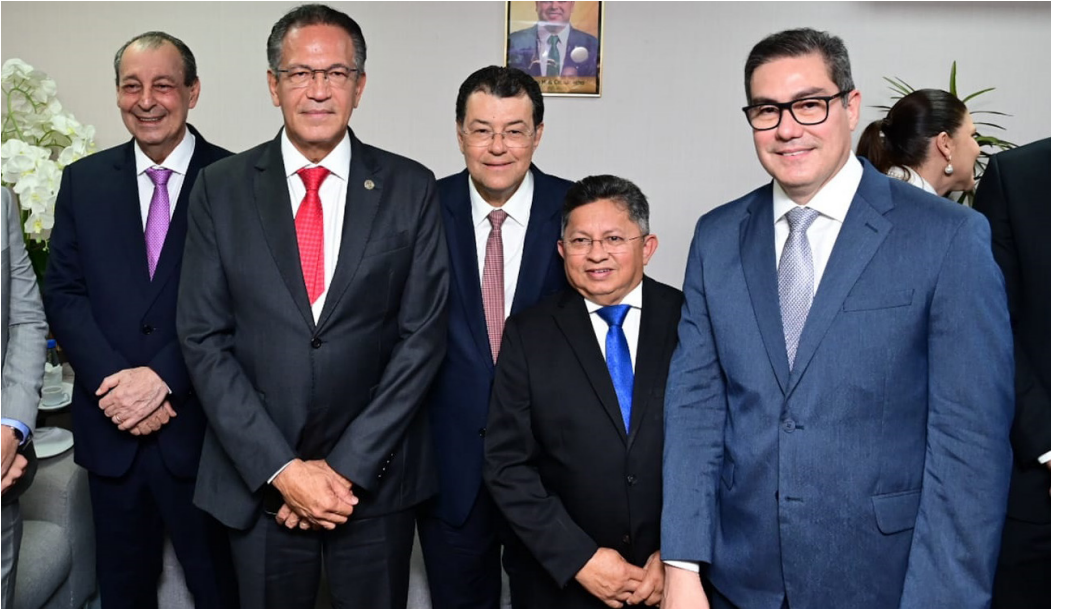
Campbell ressaltou a importância de valorizar o povo amazonense

“Fiz questão de estar aqui para me somar à homenagem que é feita pela Aleam a dois amazonenses. A trajetória de dois homens que são uma inspiração. Como estamos no norte do