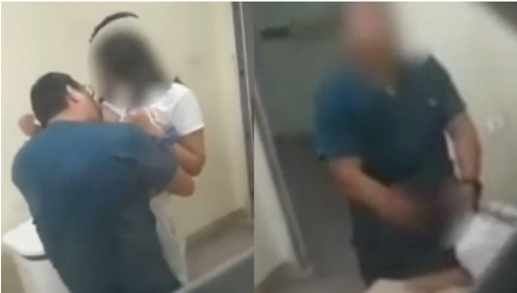
SES-AM notificou as empresas terceirizadas e solicitou o afastamento dos envolvidos

Um vídeo que viralizou na quarta-feira (27) mostra um médico e uma enfermeira mantendo relações sexuais dentro da Unidade de Pronto Atendimento (UPA) José Rodrigues, na avenida Camapuã, Zona Norte de Manaus, durante o expediente de trabalho.