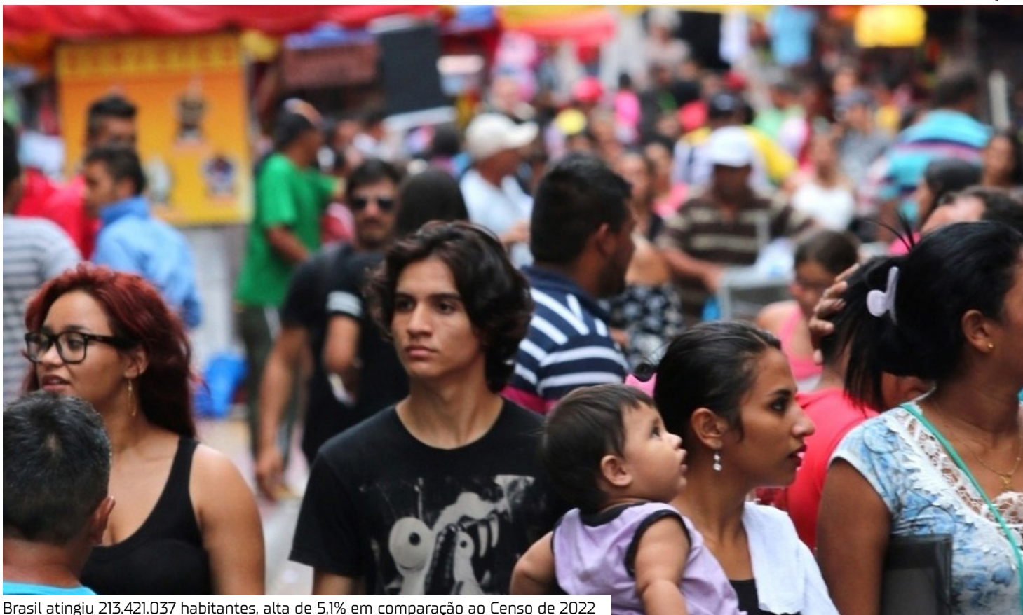
Brasil atingiu 213.421.037 habitantes, alta de 5,1% em comparação ao Censo de 2022

No cenário nacional, o Brasil atingiu 213.421.037 habitantes, alta de 5,1% em comparação ao Censo de 2022, quando o país tinha 203.062.512 pessoas. Em outubro de 2023, o IBGE já havia revisado a estimativa para 203.080.756. A projeção de 2024 indicava