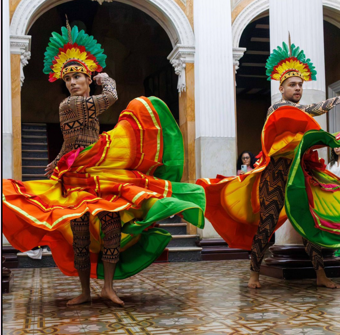
Evento acontece hoje e amanhã (29 e 30/08)

O Fórum Permanente de Dança do Amazonas (FPDAM) promove, hoje e amanhã (29 e 30/08), o 4º Encontro de Profissionais da Dança do Amazonas (Enprodam). A programação será realizada no Palacete Provincial, das 9h às 17h, e no Teatro Amazonas, a partir das 19h, com entrada gra-