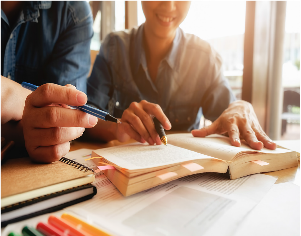
Novos conselheiros foram eleitos para o quadriênio 2025 e 2029