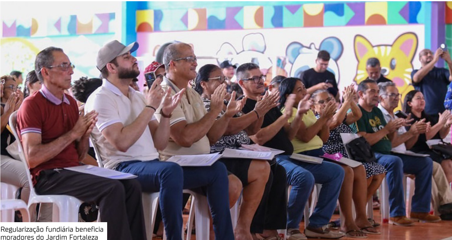
Regularização fundiária beneficia moradores do Jardim Fortaleza

conquista para as famílias. “Hoje é um dia que fica marcado na história. Um dia que repõe um direito que já deveria estar em suas mãos há mais de 28 anos. Essas áreas aqui do Santa Etelvina carregavam um impasse de décadas, resultado de uma promessa não cumprida. Hoje, eu posso