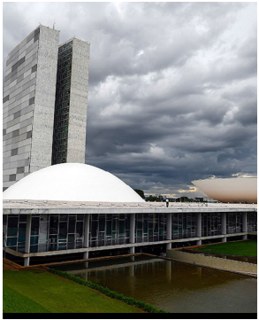
Comissão é presidida pelo senador Efraim Filho

Proposta de anulação da licença foi rejeitada pelo plenário da Corte