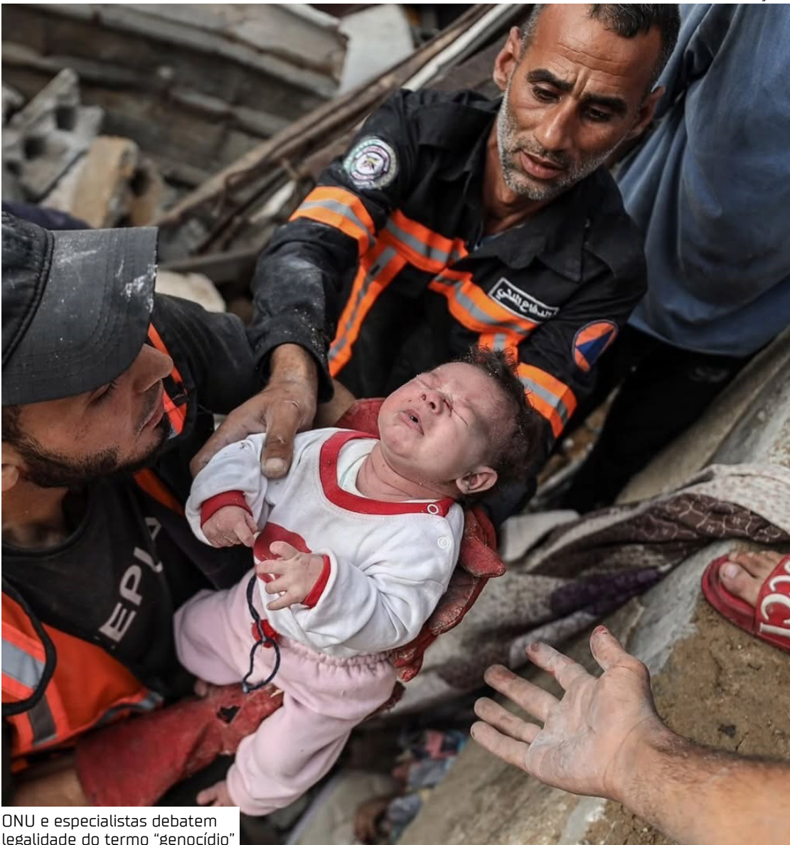
ONU e especialistas debatem legalidade do termo “genocídio”

Centenas de funcionários do Escritório do Alto Comissariado das Nações Unidas para os Direitos Humanos (ACNUDH), liderado por Volker Turk, pediram que a guerra em Gaza seja oficialmente classificada como um genocídio em andamento. A solicitação foi feita por meio de uma carta enviada na quarta-feira (27), conforme revelou a agência Reuters. Carta interna cobra posicionamento público No documento, os autores afirmam que os critérios legais para genocídio já foram cumpridos, citando a escala, a abrangência e a natureza das violações documentadas durante a guerra de quase dois anos entre Israel e o Hamas. “O ACNUDH tem uma forte responsabilidade legal e moral de denunciar atos de genocídio”, afirma a carta, assinada pelo Comitê de Funcionários em nome de mais