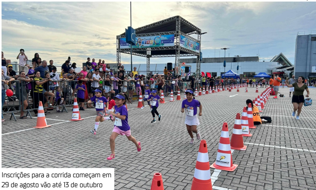
Inscrições para a corrida começam em 29 de agosto e vão até 13 de outubro