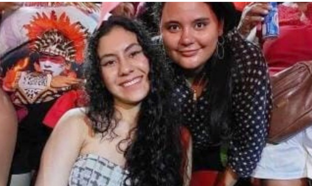
Criança foi asfixiada no pescoço pela dupla, aponta perícia