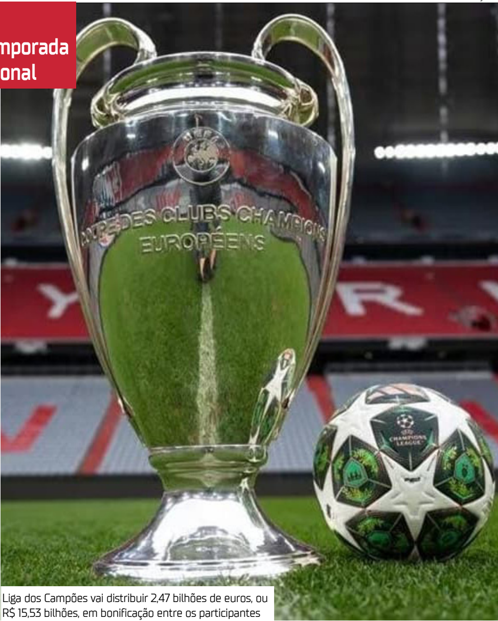
Liga dos Campeões vai distribuir 2,47 bilhões de euros, ou R$ 15,53 bilhões, em bonificação entre os participantes

Na fase de liga, composta por oito rodadas de pontos corridos, a premiação fixa é de 18,6 milhões de euros (R$ 117,7 milhões) apenas pela