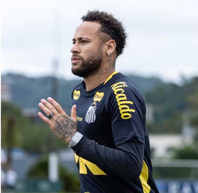
Neymar pode ser selecionado pelo novo técnico do Santos