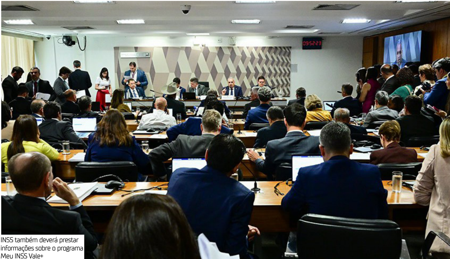
INSS também deverá prestar informações sobre o programa Meu INSS Vale+