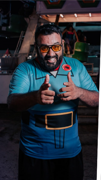
Humorista Carlos Papagaio reúne nomes em alta na comédia de Manaus em novo stand up