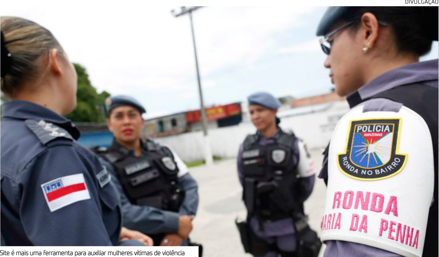
Site é mais uma ferramenta para auxiliar mulheres vítimas de violência

Com o objetivo de ampliar os mecanismos de proteção às mulheres vítimas de violência doméstica no Amazonas, o deputado estadual João Luiz (Republicanos) criou a Lei nº 6.354, que prevê a criação do site Maria da Penha Online. A plataforma digital vai reunir informações, serviços e canais de denúncia, atuando como ferramenta de apoio e acolhimento às vítimas. A proposta busca integrar o sistema estadual de justiça à rede de enfrentamento à violência contra a mulher, alinhando-se à Lei Federal nº 11.340/2006, a conhecida Lei Maria da Penha, que, nesta quarta-feira (7), completa 18 anos de vigência. Segundo o parlamentar, a iniciativa representa um passo importante para garantir o acesso rápido e seguro a órgãos de proteção. “O site é mais uma fer-