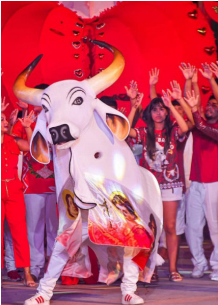
Festival nasceu oficialmente em 1980, mas suas raízes remontam à década de 1930