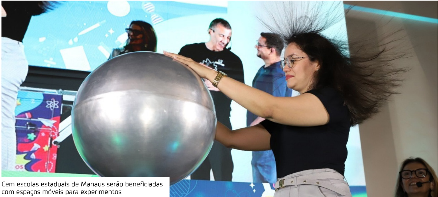
Cem escolas estaduais de Manaus serão beneficiadas com espaços móveis para experimentos

Apoiando a aprendizagem científica e consolidando habilidades na área da experimentação, o laboratório móvel conta com componentes que ficam montados em um carrinho com rodas, possibilitando que o