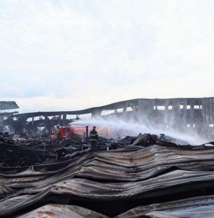
Incêndio destruiu fábricas de automóveis no Distrito Industrial 2

Com a fase final dos trabalhos, o efetivo que ainda atua no local deve ser reduzido.