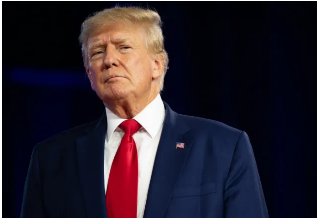
Câmara de Belém aprova moção simbólica após tarifa de 50% dos EUA prejudicar exportações

A Câmara Municipal de Belém declarou o presidente dos Estados Unidos, Donald Trump, persona non grata na capital paraense. A moção foi aprovada na quarta-feira (6) e ocorre a poucos meses da COP30, conferência da ONU sobre o clima, que será realizada na cidade entre 10 e 21 de novembro de 2025.