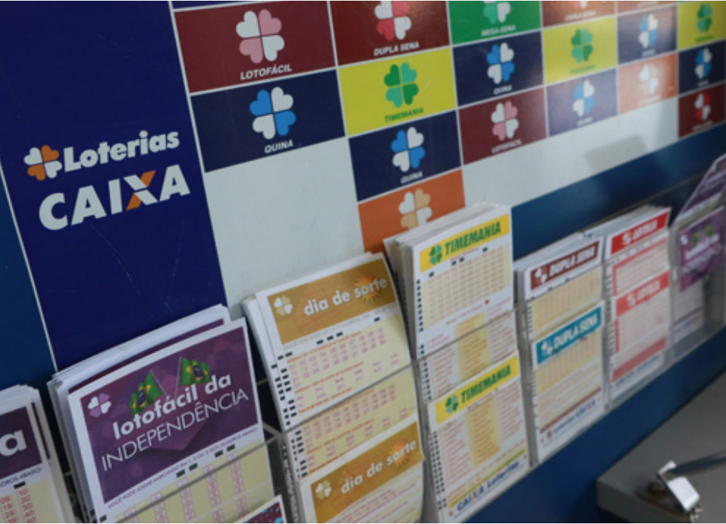
Para virar lei, a proposta precisa ser aprovada pela Câmara e pelo Senado