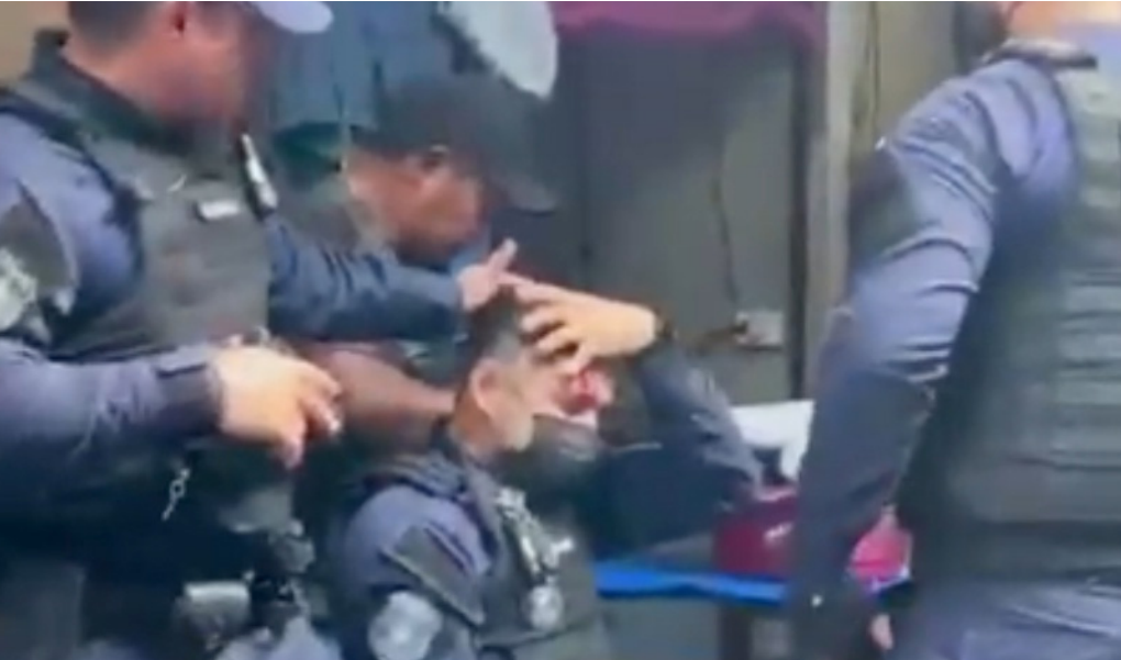
Guarda municipal de Manaus teve cabeça atingida por pedrada

“O compromisso com a saúde pública, o ordenamento urbano e o cumprimento das normas sanitárias permanecem firme, e ações semelhantes continuarão em diferentes pontos da cidade, sempre visando proteger a população manauara”, informou a prefeitura, em nota.