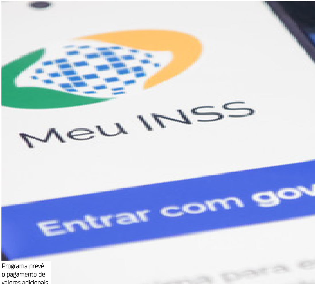
Programa prevê o pagamento de valores adicionais

Com orçamento previsto de R$ 200 milhões em 2025, o programa prevê o pagamento de valores adicionais a servidores que atuarem fora do expediente regular na revisão e reavaliação de benefícios previdenciários e assistenciais. A remuneração extra será de R$ 68 por processo revisado para servidores da carreira de seguro social, e de R$ 75 para peritos médicos federais e supervisores médicos periciais.