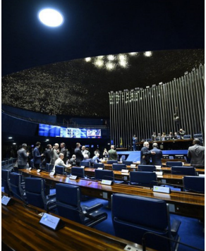
Indicações foram lidas nas comissões nesta semana