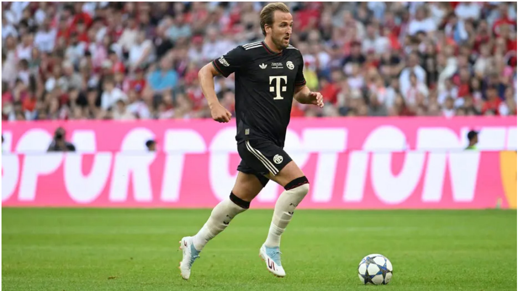
Harry Kane protagoniza vitória do Bayern sobre o Tottenham

O Tottenham, por sua vez, teve a derrota de hoje como o último ato de aquecimento das turbinas para a jornada que vem por aí. Na quarta-feira (13), o time, agora comandado por Thomas Frank, duela com ninguém menos do que o Paris Saint-Germain, pela Supercopa da Uefa, em condição de atual campeão da Europa League.