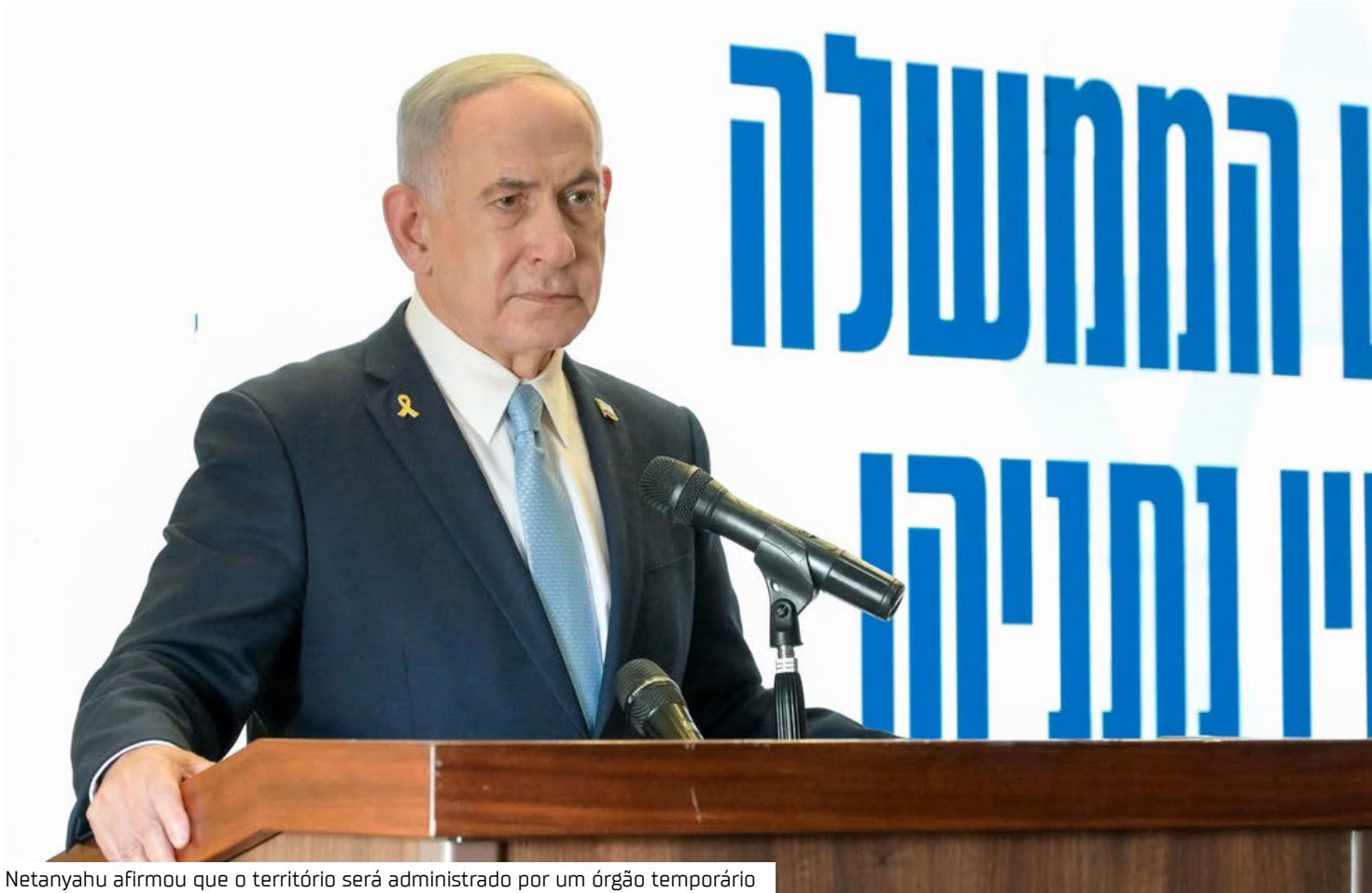
Netanyahu afirmou que o território será administrado por um órgão temporário

Governo militar temporário Netanyahu afirmou que o território será administrado por um órgão temporário, controlado pelos militares, até que haja condições para a formação de um governo local. Em entrevista à “Fox News”, ele reforçou que