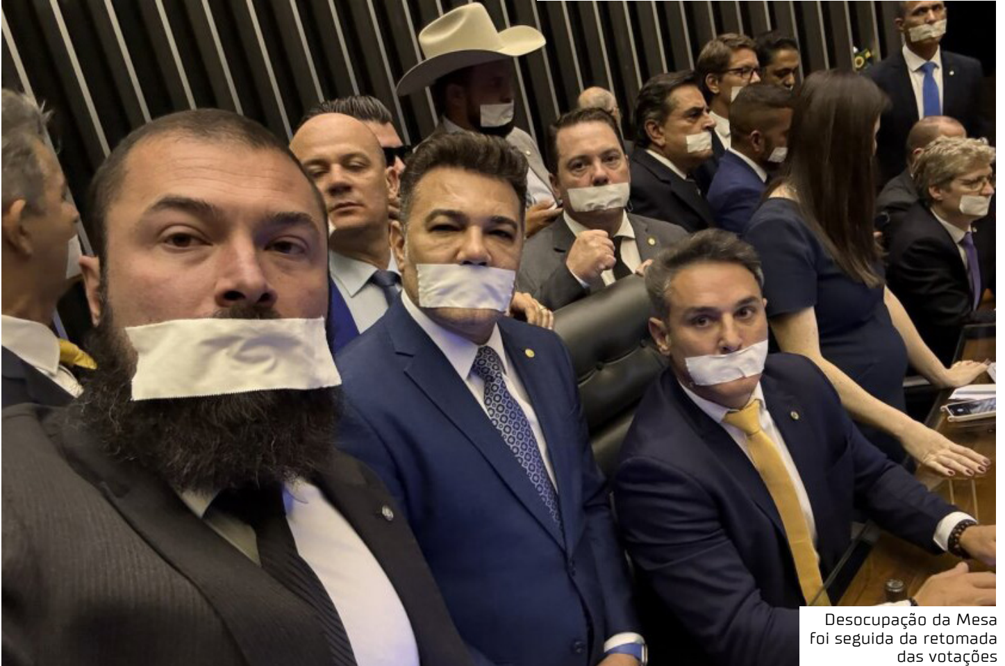
Desocupação da Mesa foi seguida da retomada das votações

Antes da sessão, em entrevista coletiva, os parlamentares da oposição afirmaram que seguirão com a atuação “de forma ativa” nas deliberações, com foco nas pautas que consideram prioritárias: a proposta de anistia aos investigados pelos atos de 8 de janeiro e o