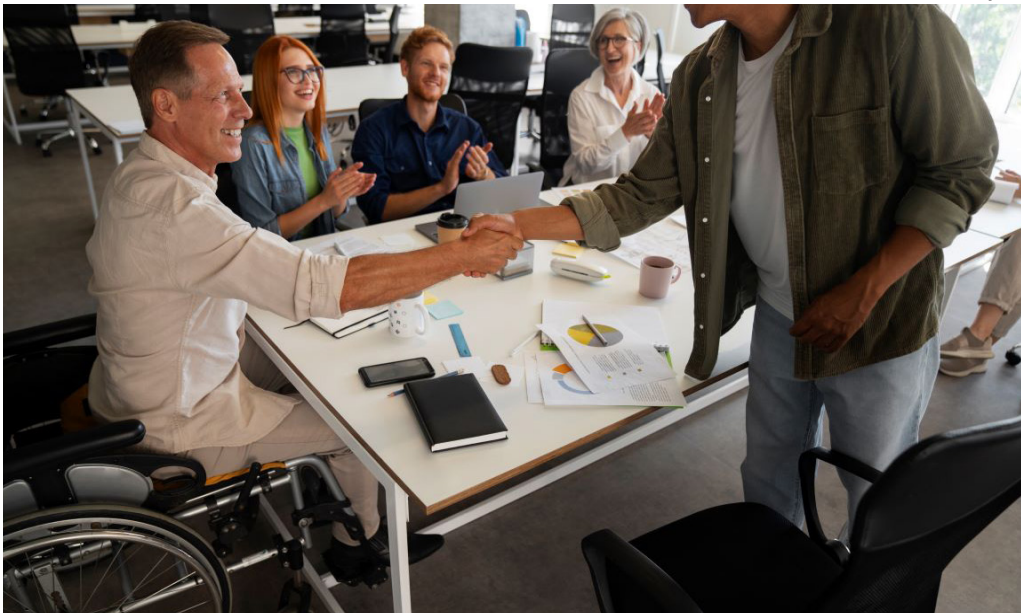
Triagem presencial oferece oportunidades para pessoas com diferentes tipos de deficiências

A proposta é oferecer não somente segurança e bem-estar, mas também oportunidades reais de crescimento na empresa.