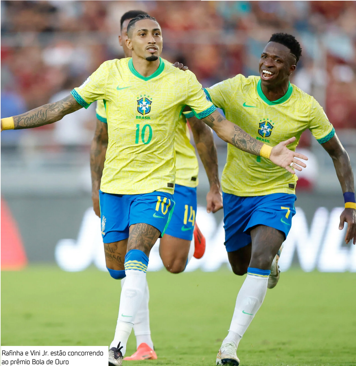
Rafinha e Vini Jr. estão concorrendo ao prêmio Bola de Ouro

Quem também aparece entre os finalistas é Vinicius Júnior, do Real Madrid. Em 2024, o brasileiro ficou em segundo lugar,