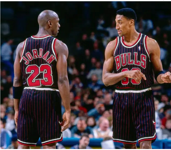
Uniforme da era Jordan vai retornar as quadras

A campanha histórica à qual o uniforme está atrelado, a de 1995-96, é frequentemente citada como uma das mais dominantes da história do esporte profissional. Ela marcou o primeiro ano completo de Michael Jordan de volta às