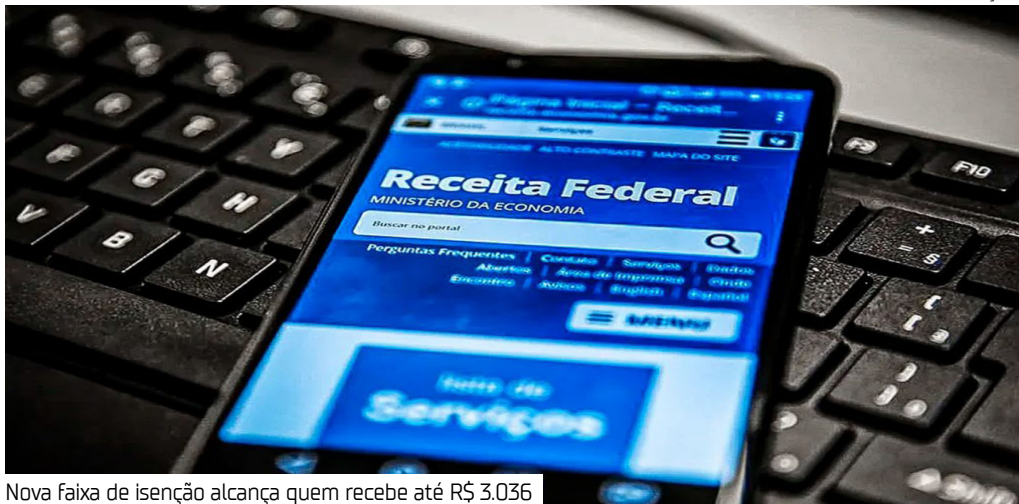
Nova faixa de isenção alcança quem recebe até R$ 3.036

O Senado Federal aprovou ontem (7) o Projeto de Lei (PL) 2.692/2025, que amplia a faixa de isenção do Imposto de Renda da Pessoa Física (IRPF) para contribuintes com renda mensal de até dois salários mínimos — atualmente o equivalente a R$ 3.036. A proposta segue agora para sanção presidencial e, uma vez sancionada, terá validade a partir de maio de 2025.