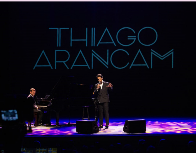
Arancam protagonizou mais de 700 apresentações em 40 países

Manaus será palco de uma noite emocionante para os amantes da música italiana. O tenor Thiago Arancam, um dos maiores intérpretes líricos do país, apresenta o espetáculo “Uma Viagem Pela Itália”, no dia 30 de agosto, às 20h, no Teatro Manauara.