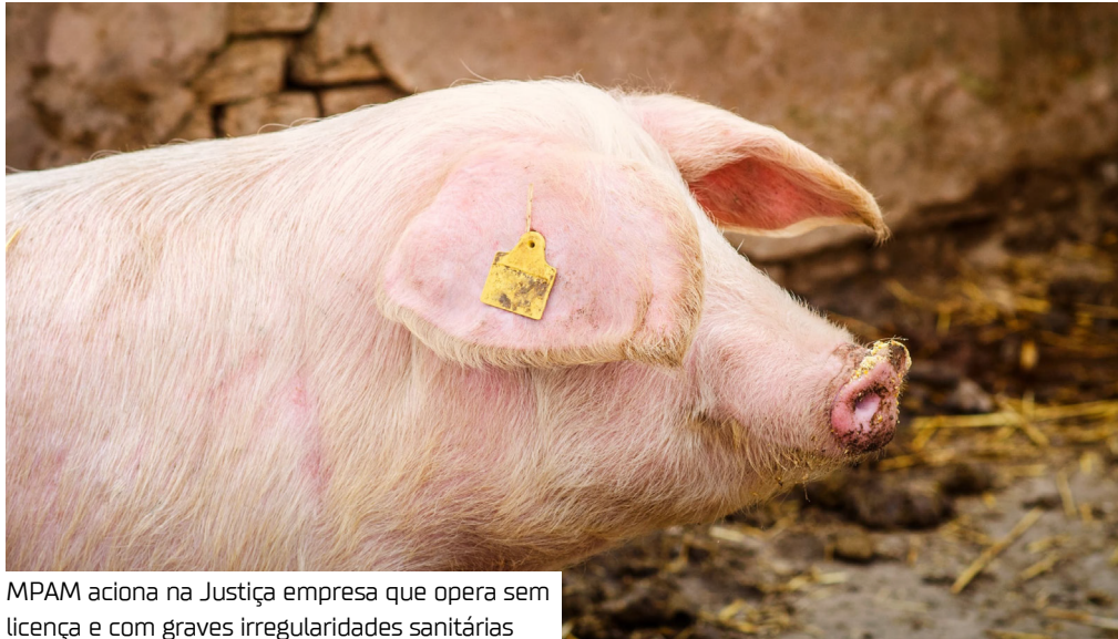
MPAM aciona na Justiça empresa que opera sem licença e com graves irregularidades sanitárias

O Ministério Público do Amazonas (MPAM) ajuizou uma ação civil pública (ACP) contra a empresa Agro Rio Comércio e Serviços de Resíduos Reciclados Ltda., responsável por uma granja de suínos localizada na zona rural de Manaus. A ação é conduzida pela 52ª Promotoria de Justiça Especializada na Proteção e Defesa do Consumidor (Prodecon). Segundo o Inquérito Civil nº 06.2021.00000712-7, a empresa apresenta infrações sanitárias graves que colocam em risco direto a saúde dos consumidores. Falhas sanitárias Durante a investigação, relatórios da Adaf, Visa Manaus e Ipaam identificaram diversas irregularidades: - Falta de controle sani-