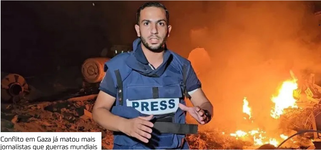
Conflito em Gaza já matou mais jornalistas que guerras mundiais

“Tudo isso acontece porque minha cobertura dos crimes da ocupação israelense na Faixa de Gaza os prejudica e mancha sua imagem no mundo. Eles me acusam de terrorista porque a ocupação quer me assassinar moralmente”.