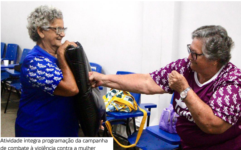
Atividade integra programação da campanha de combate à violência contra a mulher