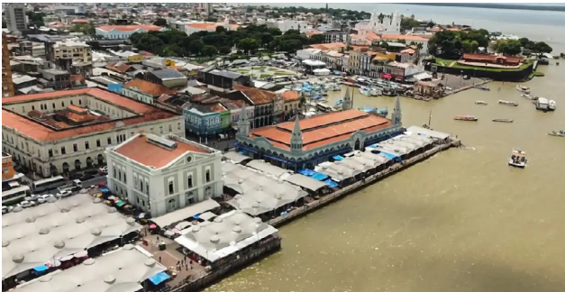
Encontro será realizado na próxima quinta-feira