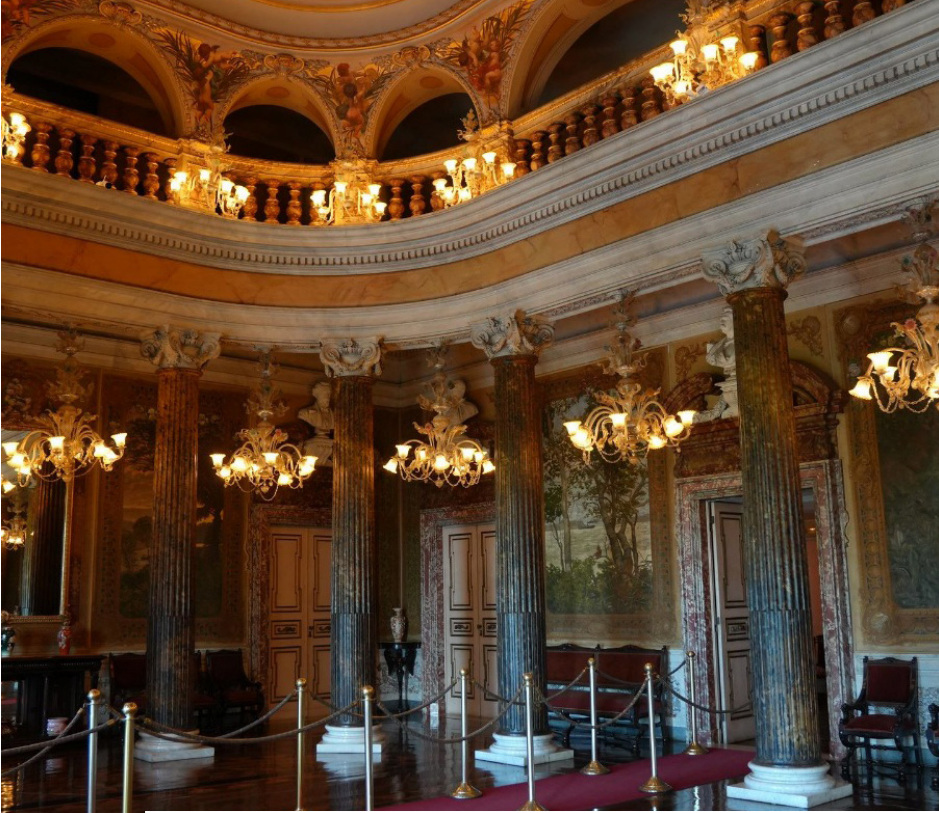
Visita ao Teatro Amazonas é uma oportunidade única de conexão com a arte