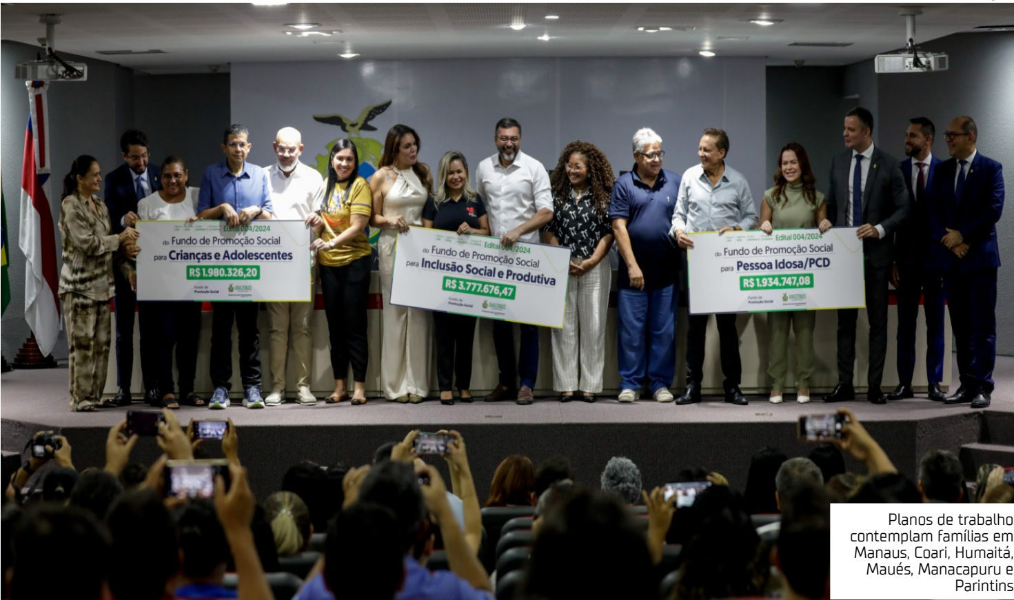
Planos de trabalho contemplam famílias em Manaus, Coari, Humaitá, Maués, Manacapuru e Parintins