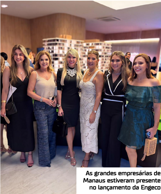
As grandes empresárias de Manaus estiveram presente no lançamento da Engeco