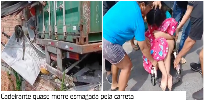
Cadeirante quase morre esmagada pela carreta

A família, que inclui uma mulher, seus três filhos menores, entre eles uma adolescente cadeirante, já havia denunciado o perigo do trecho, onde outro veículo também já havia atingido a residência.