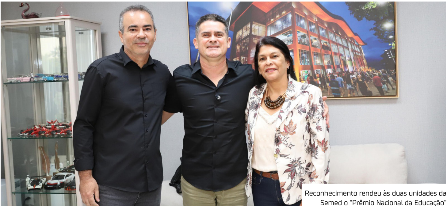
Reconhecimento rendeu às duas unidades da Semed o “Prêmio Nacional da Educação”

A escola municipal José Carlos Martins Mestrinho, con-