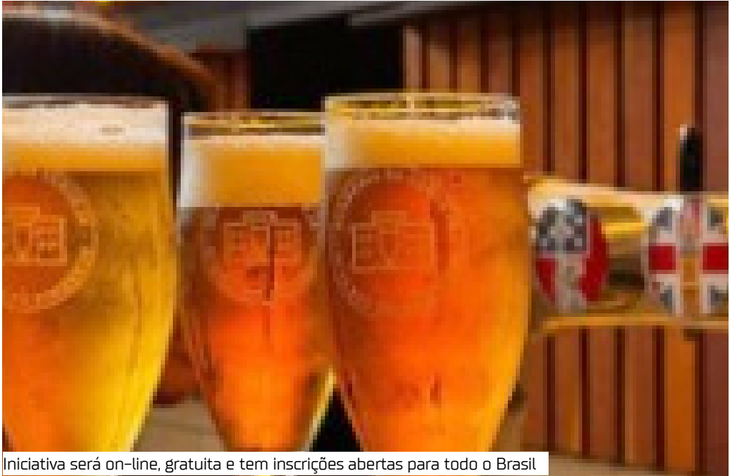
Iniciativa será on-line, gratuita e tem inscrições abertas para todo o Brasil

Mais do que simples pontos de encontro, os bares são espaços de socialização e fazem parte da cultura, e do coração, dos brasileiros. E quem dá vida a esse cenário são os garçons, almas dos bares e balcões, que têm o dia 11 de agosto dedicado a eles. Para celebrar os homens e mulheres tão importantes para esse setor, a partir do dia 15, estarão abertas as inscrições para o curso Bora Formar: Garçons, oferecido gratuitamente pela Academia da Cerveja, a escola de conhecimento e cultura cervejeira da Ambev. A ação, que vai capacitar até 5 mil profissionais em todo o Brasil, é