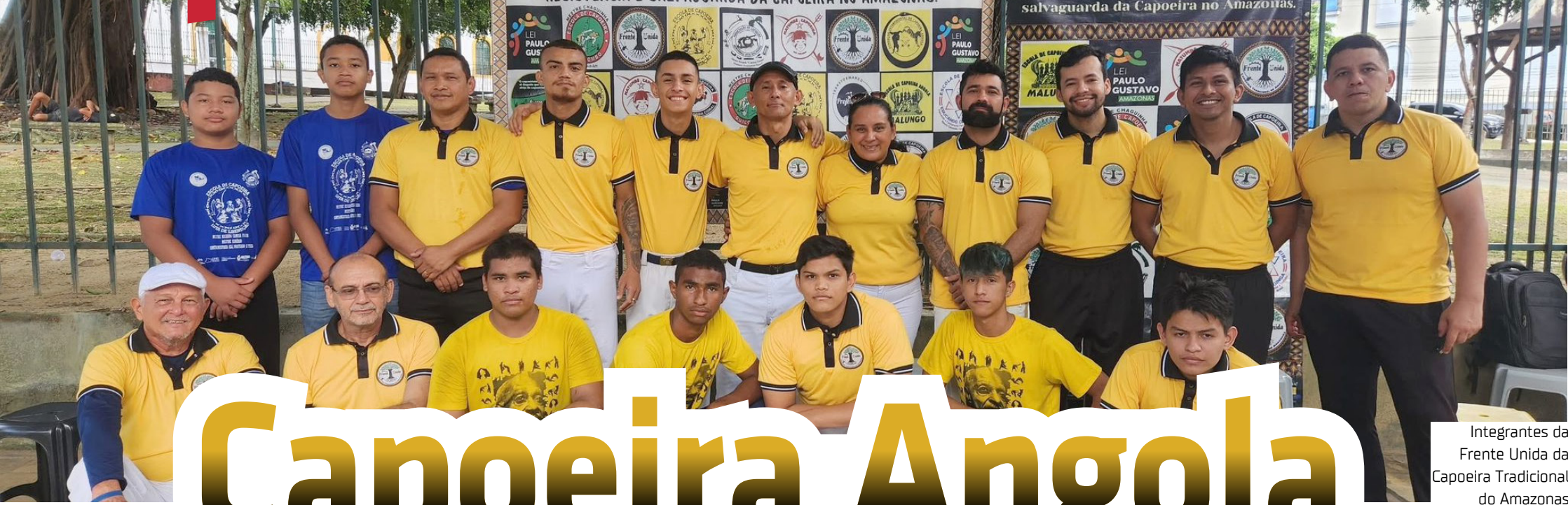
Integrantes da Frente Unida da Capoeira Tradicional do Amazonas

Manaus recebe Encontro Internacional de Capoeira Tradicional de 14 a 17 de agosto