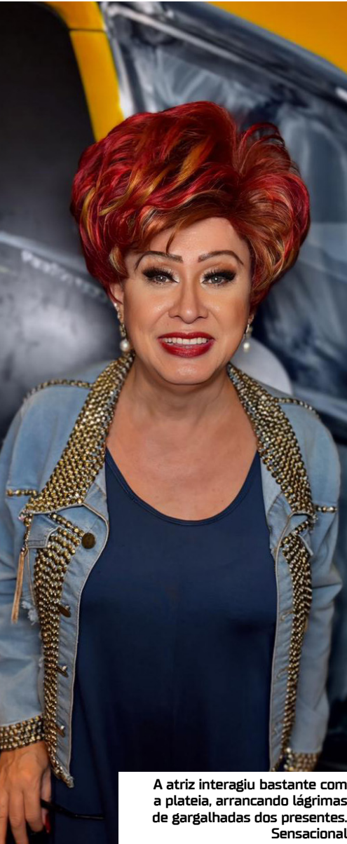
A atriz interagiu bastante com a plateia, arrancando lágrimas dos presentes. Sensacional