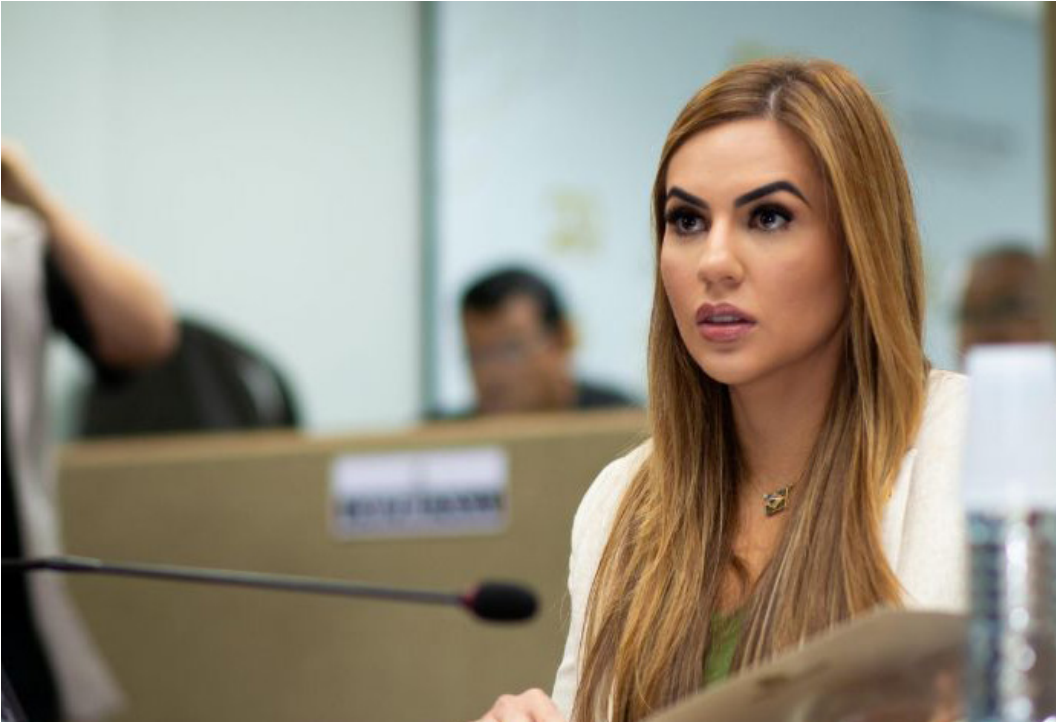
Deputada preferiu não comentar sobre a proposta apresentada