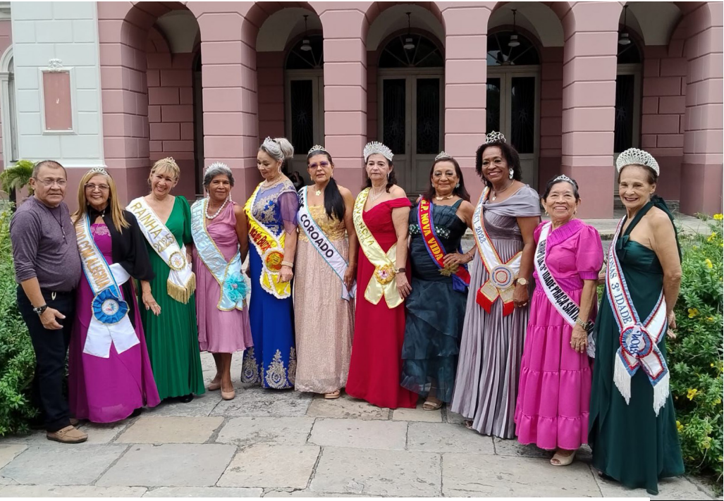
Evento gratuito celebra a cultura popular com danças de idosos no Centro de Manaus

O Fórum dos Direitos da Pessoa Idosa do Amazonas (DPI/AM) realizará a 1ª Mostra de Dança Folclórica 60+ no dia 29 de agosto, com o objetivo de celebrar e valorizar as diversas expressões culturais dos grupos de idosos da capital. O evento, que promete uma tarde de muita core e movimento, acontecerá no Mercado de Origem, no Centro de Manaus, das 15h às 18h.