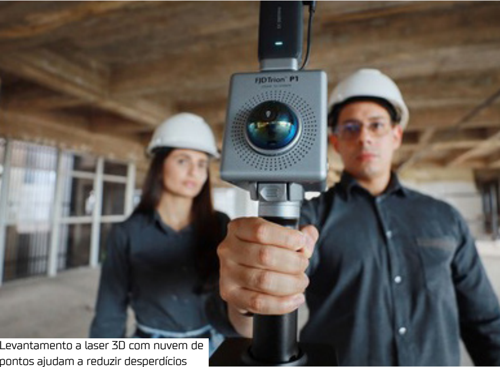
Levantamento a laser 3D com nuvem de pontos ajudam a reduzir desperdícios

De acordo com o arquiteto da TecObras, essas tecnologias estão mudando a rotina da empresa. “Elas nos permitem entregar obras com prazos mais curtos, alto nível de precisão construtiva e mais segurança no canteiro. Não se trata apenas de inovação, mas de uma base para decisões estratégicas que envolvem todos os profissionais, do projetista ao operador”, afirma.