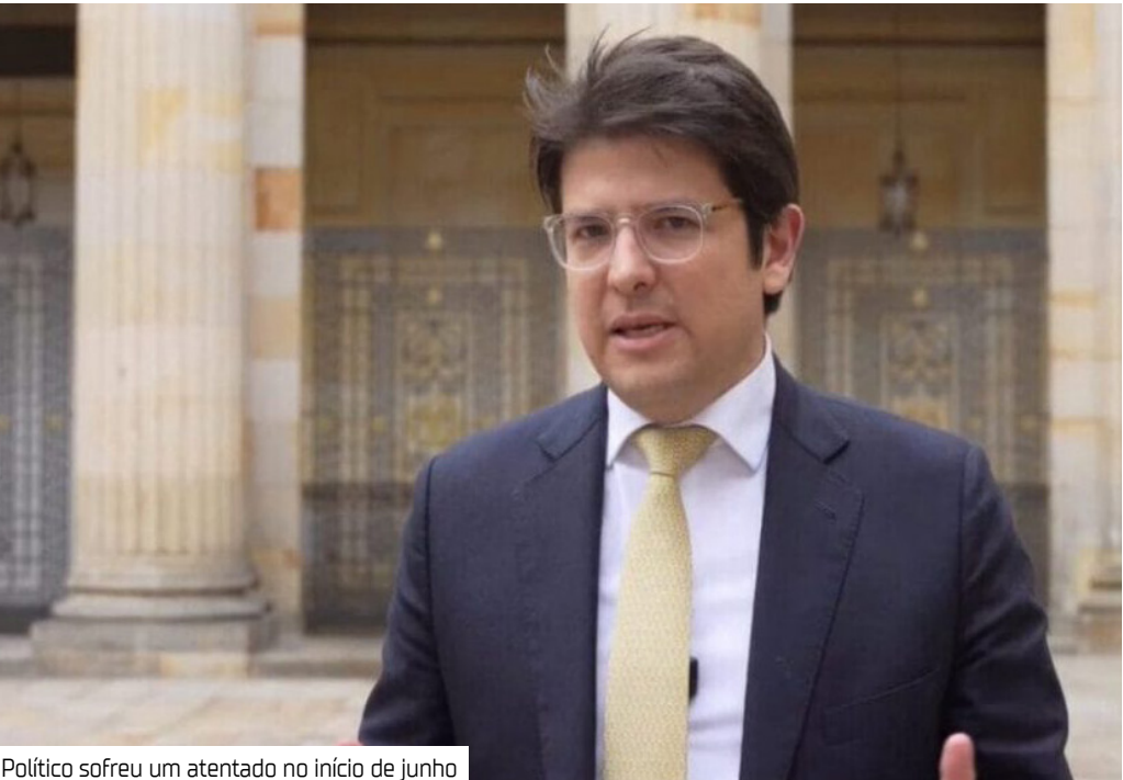
Político sofreu um atentado no início de junho

O pré-candidato à Presidência da Colômbia, Miguel Uribe Turbay, que também era senador, faleceu nesta segunda-feira (11). A notícia foi confirmada por sua esposa, Claudia Tarazona, por meio de uma postagem nas redes sociais. O político, de 39 anos, foi baleado no dia 7 de junho, durante um comício em Bogotá. Desde então, estava hospitalizado. Na homenagem publicada nas redes sociais, Tarazona escreveu: “Você sempre será o amor da minha vida. Obrigada por uma vida repleta de amor, obrigada por ser um pai para as meninas e o melhor pai para Alejandro”. Até agora, seis suspeitos foram detidos por possível envolvimento no atentado contra o parlamentar. Sua avó, Nydia Quintero