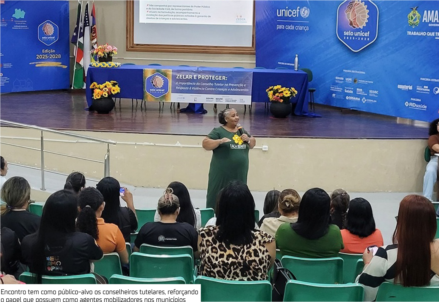
Encontro tem como público-alvo os conselheiros tutelares, reforçando o papel que possuem como agentes mobilizadores nos municípios

Durante o encontro, será estimulado, ainda, o uso do Sistema de Informação para a Infância e Adolescência (Sipia), como ferramenta de apoio à atuação diária, além do fortalecimento da aplicação da Lei