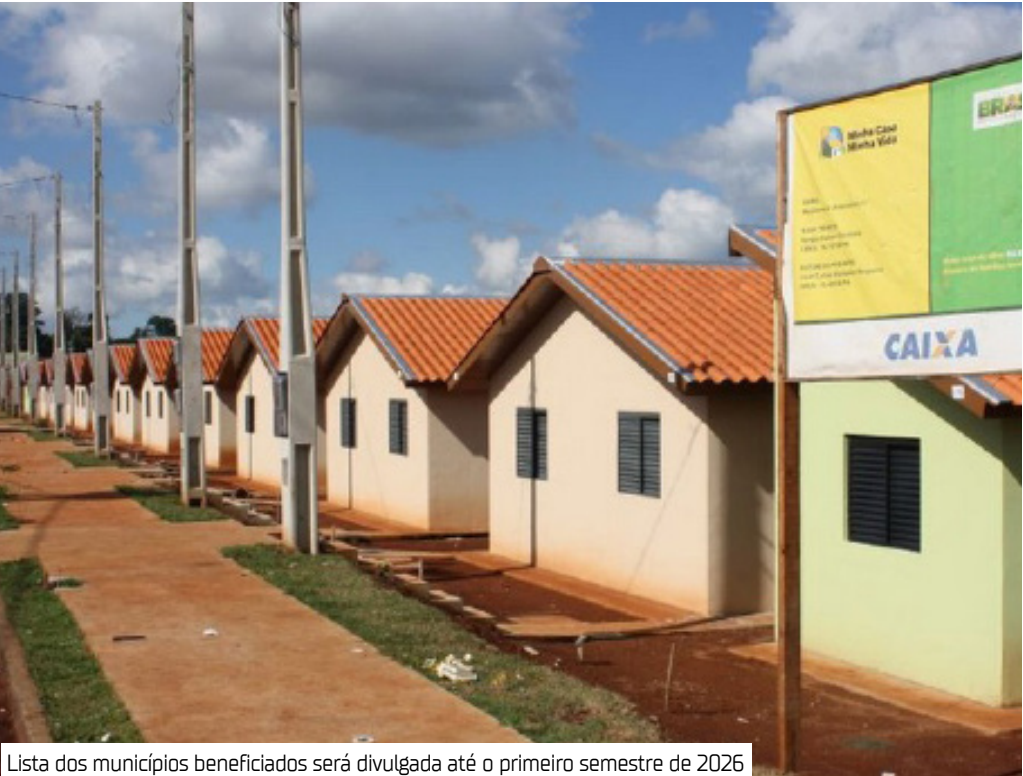
Lista dos municípios beneficiados será divulgada até o primeiro semestre de 2026

O Ministério das Cidades recebeu novas propostas para construção de moradias do Minha Casa, Minha Vida, por meio da modalidade Urbano Sub50 (FNHIS). O objetivo é beneficiar famílias com renda bruta mensal de até R$ 2.850. No Amazonas serão construídas 897 residências em municípios de até 50 mil habitantes. A lista dos municípios beneficiados será divulgada até o primeiro semestre de 2026. A linha de atendimento Urbano Sub50 foi uma das modalidades recriadas com a volta do Minha Casa, Minha Vida em 2023. Desde o seu retorno, já foram selecionadas e contratadas 38,5 mil unidades habitacionais em municípios de até 50 mil habitantes em todo Brasil.