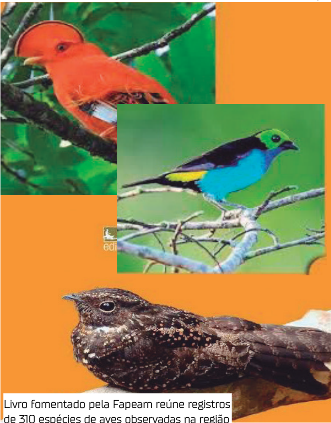
Livro fomentado pela Fapeam reúne registros de 310 espécies de aves observadas na região