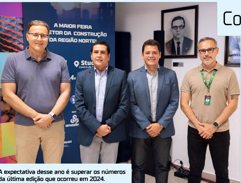
A expectativa desse ano é superar os números da última edição que ocorreu em 2024.

Cerca de 50% dos stands já foram negociados e a procura tem sido grande por empresas interessadas em participar do evento esse ano, que acontecerá nos dias 12, 13 e 14 de novembro, no Centro de Convenções do Studio 5.