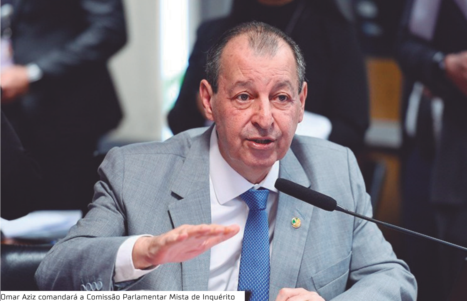
Omar Aziz comandará a Comissão Parlamentar Mista de Inquérito

“Desejo a Omar Aziz e a todos os integrantes um excelente trabalho nesta pauta tão relevante para o país”, escreveu em rede social.