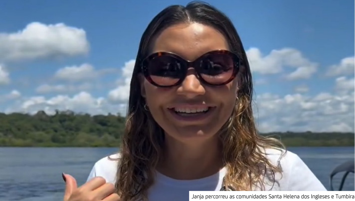
Janja percorreu as comunidades Santa Helena dos Ingleses e Tumbira

dorismo local e a importância do turismo sustentável para o desenvolvimento da região. “Aqui a gente tem novamente a questão do turismo muito forte, valorizando as culturas locais e oferecendo experiências para visitantes do Brasil e do mundo. É um exemplo de como é possível gerar renda e conservar a floresta em pé. Essas escutas que estamos fazendo pelos biomas brasileiros vão nos guiar até Belém, na COP30”, afirmou a primeira-dama. No local, a primeira-dama também conhecerá o projeto “Elas Repararam”, uma iniciativa que surgiu a partir da reflexão sobre os impactos ambientais causados pelo descarte de eletrodomésticos sem consento, devido à ausência de assistência técnica no interior do Amazonas. O programa capacita mulheres ribeirinhas e indígenas para atuarem como técnicas autorizadas das marcas Consul e Brastemp, unindo geração de renda, autonomia feminina e redução de resíduos na floresta. Agenda de Janja Além da visita às comunida-