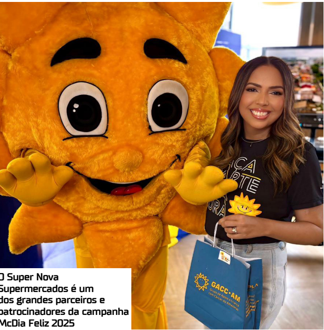
O Super Nova Supermercados é um dos grandes parceiros e patrocinadores da campanha McDia Feliz 2025