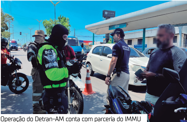
Operação do Detran-AM conta com parceria do IMMU