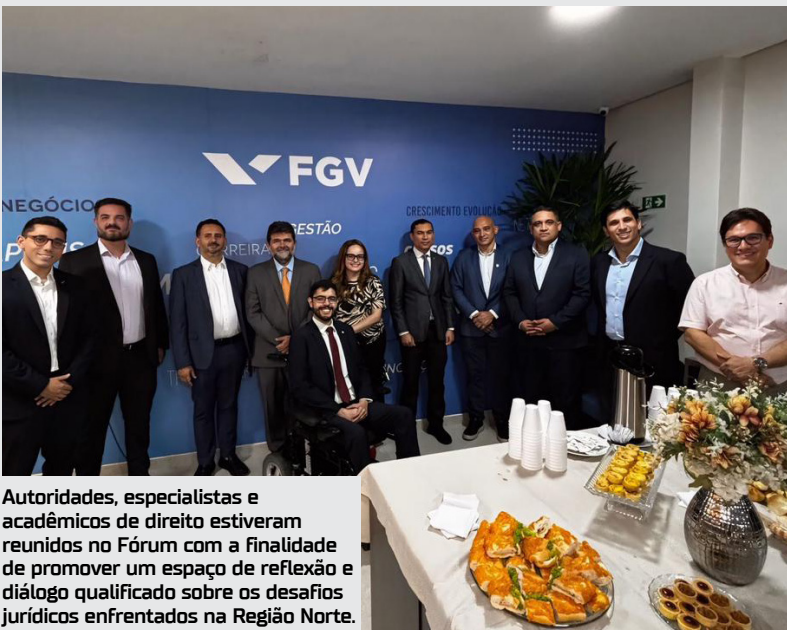
Autoridades, especialistas e acadêmicos de direito estiveram reunidos no Fórum com a finalidade de promover um espaço de reflexão e diálogo qualificado sobre os desafios jurídicos enfrentados na Região Norte.

O Fórum Conexões do Direito Amazônico, edição “Desafios da Educação Jurídica na Região Norte”, uma realização conjunta da Fundação Getúlio Vargas(FGV) e do Grupo Sapiens, reuniu na noite da última quinta-feira(14), autoridades, especialistas e acadêmicos para o debate de questões jurídicas relevantes e específicas da Amazônia.