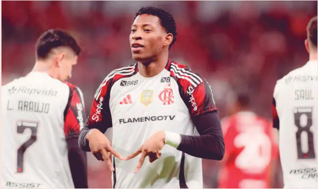
Betano vai estampar a camisa do Rubro-Negro na temporada

presas globais de apostas esportivas, é reconhecida por sua atuação inovadora no setor. Sua presença internacional reforça a estratégia de expansão global do Flamengo”, disse o clube. Anteriormente, a PixBet, que estampava a sua marca na parte principal da camisa rubro-negra, tinha um contrato de R$ 125 milhões por ano. O contrato também contava com a participação da FlaBet. O Clube de Regatas do Flamengo anuncia a Betano como sua nova parceira master. O acordo contempla o futebol profissional, os esportes olímpicos, incluindo vôlei, basquete e futebol feminino, além da FlamengoTV.