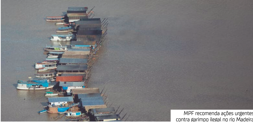
MPF recomenda ações urgentes contra garimpo ilegal no rio Madeira

Em manifestação, o procurador afirmou que, sem prejuízo de futuras medi-