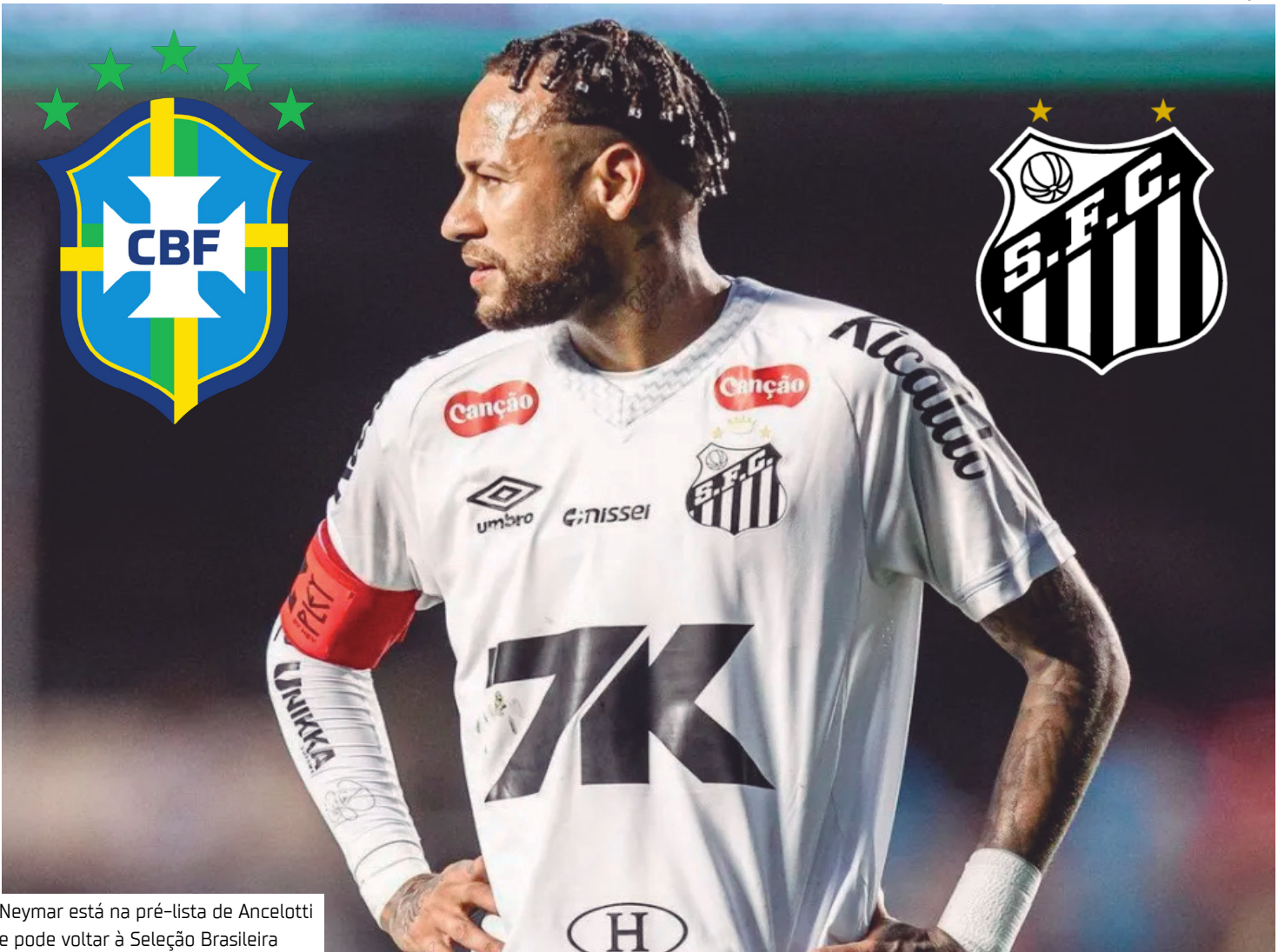
Neymar está na pré-lista de Ancelotti e pode voltar à Seleção Brasileira

Neymar está entre os nomes previamente selecionados pela comissão técnica de Carlo Ancelotti. O craque pode para aparecer na próxima convocação da Seleção Brasileira. A lista prévia já foi enviada pela Confederação Brasileira de Futebol (CBF) à Fifa. Em duas semanas, a Amarelinha se reapresenta para as últimas rodadas das Eliminatórias, em jogos contra Chile e Bolívia, mesmo já classificada para a Copa do Mundo. O camisa 10 do Santos ficou fora da última convocação, mas teve conversas com Ancelotti e companhia. No papo, o treinador italiano reafirmou o compromisso de recuperar Neymar, que pode ser peça importante no Mundial em 2026. Ao todo, o craque já disputou 19 jogos pelo Santos nesta temporada. Neymar marcou seis gols e distribuiu seis assistências, mas o Peixe vive momento complicado após goleada histó-