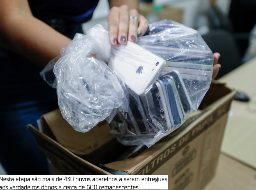
Nesta etapa são mais de 430 novos aparelhos a serem entregues aos verdadeiros donos e cerca de 600 remanescentes