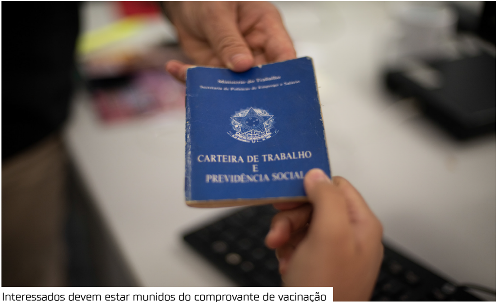
Interessados devem estar munidos do comprovante de vacinação

A Prefeitura de Manaus, por meio do Sine Manaus, oferta 397 vagas de emprego em várias áreas de atuação, hoje (26), das 8h às 14h. O candidato pode validar a Carteira Digital e Previdência Social (CTPS) no aplicativo “Carteira de Trabalho Digital” ou acessar o site http://gov.br/trabalho . Para participar da pré-seleção e concorrer a uma das vagas disponíveis, ou receber orientação de cadastro, Carteira de Trabalho Digital e seguro-desemprego, os candidatos devem comparecer a um dos postos do Sine Manaus: na avenida Constantino Nery, nº 1.272, bairro São Geraldo, zona Cen-