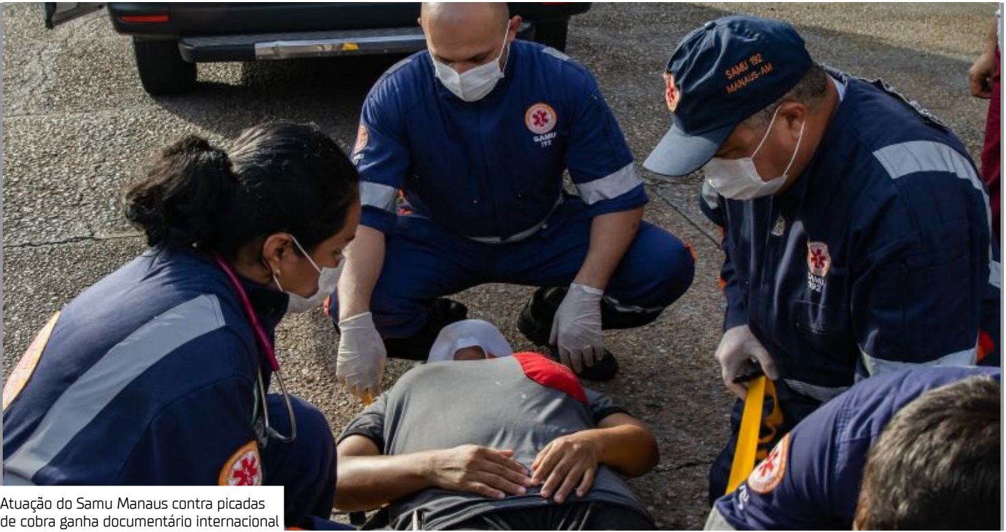
Atuação do Samu Manaus contra picadas de cobra ganha documentário internacional