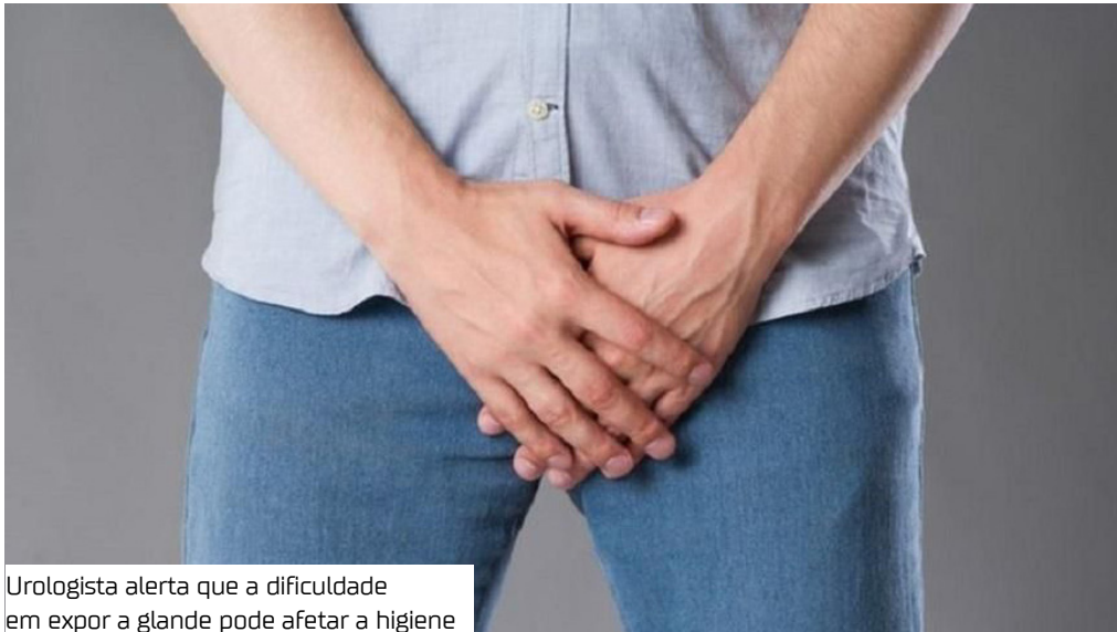
Urologista alerta que a dificuldade em expor a glândula pode afetar a higiene