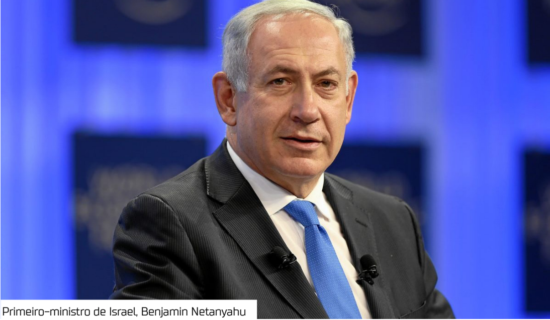
Primeiro-ministro de Israel, Benjamin Netanyahu

Bombardeio ao Hospital Nasser, em Khan Younis, deixou cerca de 20 mortos, incluindo cinco jornalistas O primeiro-ministro de Israel, Benjamin Netanyahu, declarou, ontem (25), que o bombardeio lançado por forças israelenses contra o Hospital Nasser, em Khan Younis, foi um “acidente trágico”. A ação resultou na morte de cerca de 20 pessoas, entre elas cinco jornalistas que trabalhavam para veículos de imprensa internacionais. “Israel lamenta profundamente o trágico acidente ocorrido hoje no Hospital Nasser em Gaza. Israel valoriza o trabalho de jornalistas, equipe médica e todos os civis. As autoridades militares estão conduzindo uma investigação completa”, disse Netanyahu, segundo um comunicado oficial. “Nossa guerra é contra os terroristas do Hamas. Nossos justos objetivos são derrotar o Hamas e trazer nossos reféns para casa”. Duplo bombardeio O Hospital Nasser, uma das últimas unidades de saúde ainda operando em Gaza, foi alvo de dois ataques consecutivos nesta segunda-feira. Fontes palestinas afirmaram que o primeiro bombardeio foi realizado com um drone explosivo. Minutos depois, uma segunda explosão ocorreu justamente quando equipes de resgate prestavam socorro aos feridos.