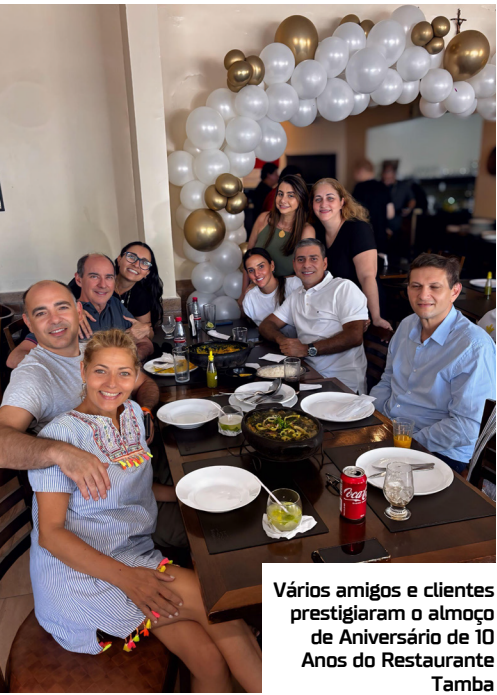
Vários amigos e clientes prestigiaram o almoço de Aniversário de 10 Anos do Restaurante Tamba

Na última quinta-feira(21), o Restaurante Tamba - Peixaria em Manaus, celebrou 10 anos de funcionamento. Especialista em peixes regionais, o Tamba se destaca por um excelente paladar, ótima apresentação e excelência no atendimento. Que venha mais sucesso!