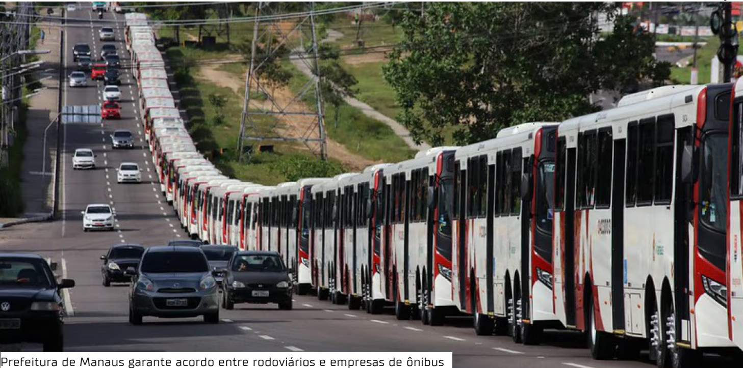
Prefeitura de Manaus garante acordo entre rodoviários e empresas de ônibus

No dia 03 de julho, o Sindicato dos Rodoviários suspendeu a greve da categoria que estava programada para ocorrer em Manaus. A informação foi confirmada pelo presidente do