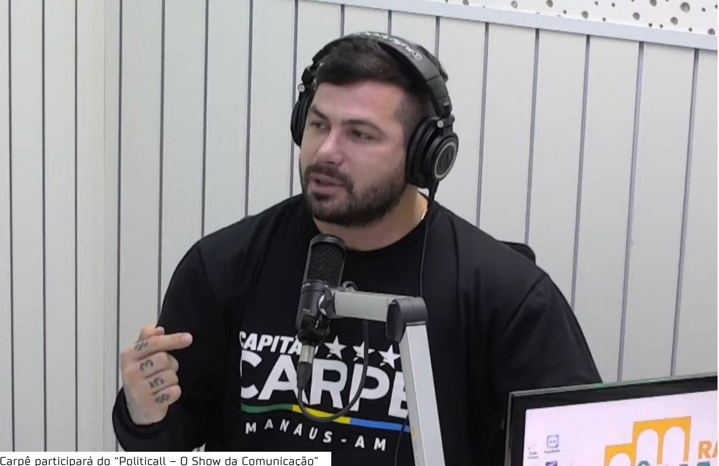
Carpê participará do “Politicall – O Show da Comunicação”

Outras despesas da CMM Em abril, o presidente da Câmara Municipal prorrogou o contrato de R$ 2,1 milhões com empresa para prestação de serviços de manutenção funcional da Casa Legislativa. A informação foi publicada no Diário Oficial (DOM). Com valor global de R$ 2,1 milhões, o presidente da Casa, David Reis, emitiu nota de Empenho nº 2025NE00244, no valor de R$ 1.938.000,00. A prorrogação está relacionada ao Termo Aditivo ao Contrato nº 005/2021 e terá vigência de 12 meses, no período compreendido entre 25 de março de 2025 e 24 de março de 2026.