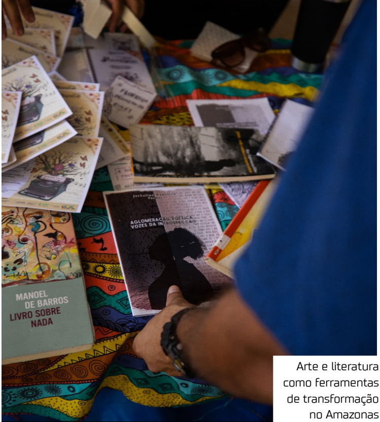
Arte e literatura como ferramentas de transformação no Amazonas

Após passar, também, por Iranduba e Rio Preto da Eva, o projeto passou por Novo Airão, com oficinas na Fundação Almerinda Malaquias, encerrando com um sarau gratuito no Parque Pinheiral, localizado na avenida