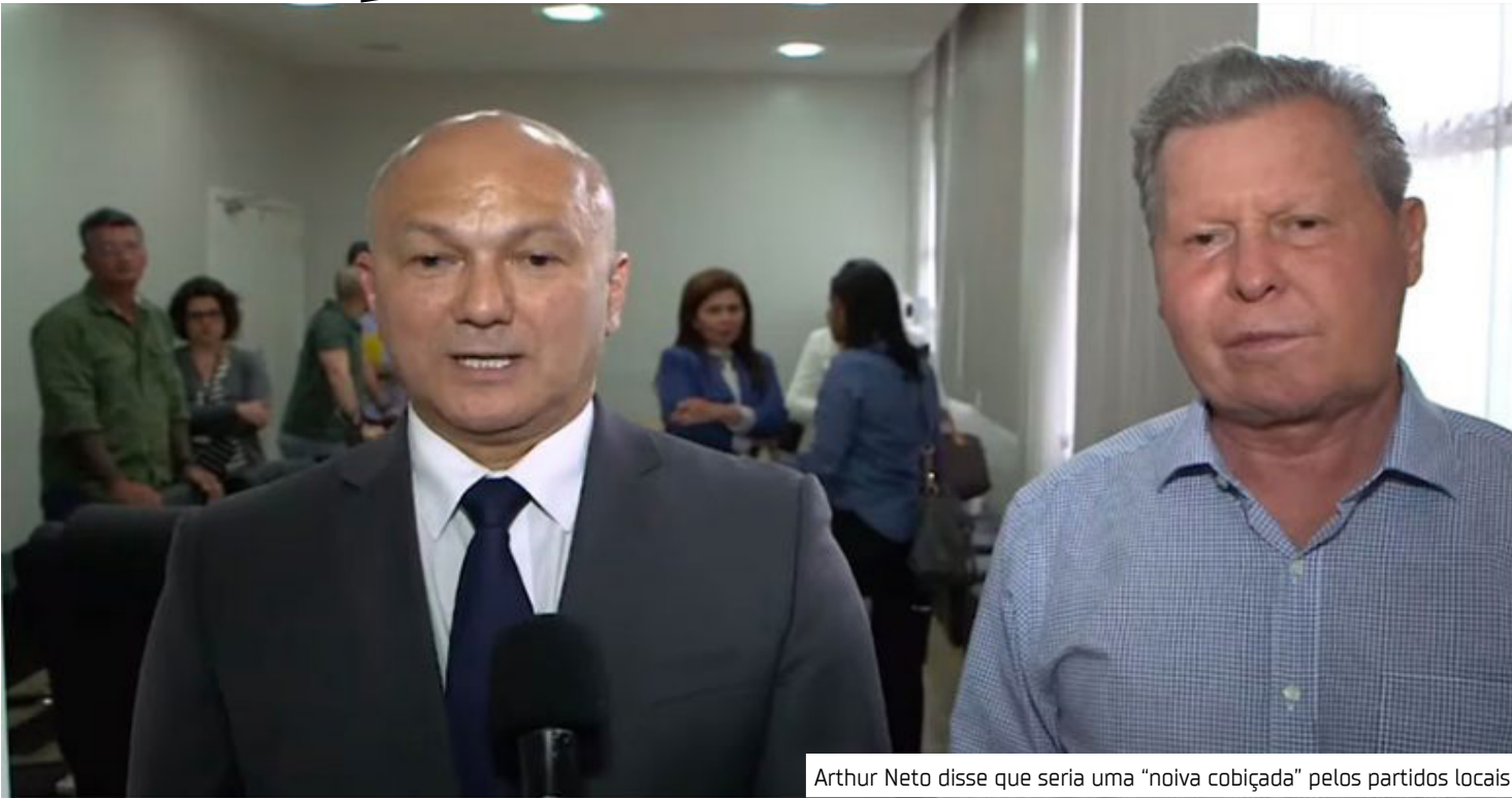
Arthur Neto disse que seria uma “noiva cobiçada” pelos partidos locais