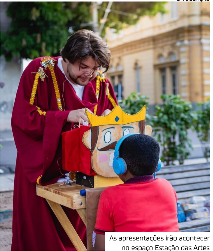
As apresentações irão acontecer no espaço Estação das Artes