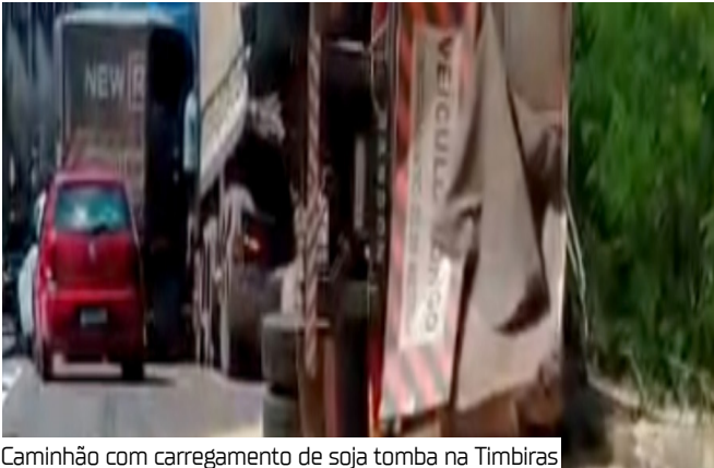
Caminhão com carregamento de soja tomba na Timbiras