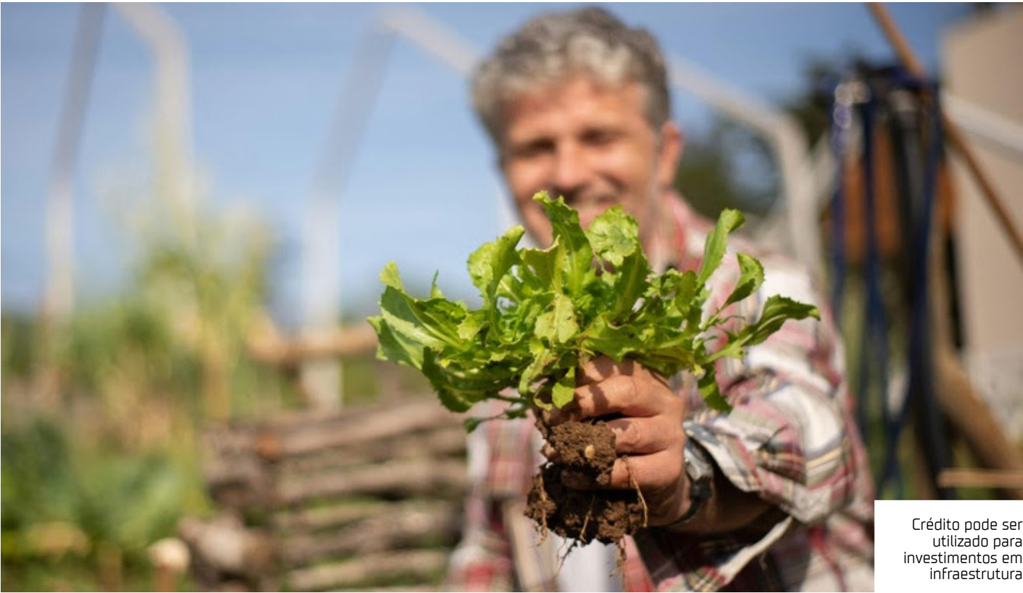
Crédito pode ser utilizado para investimentos em infraestrutura

R$ 12,1 milhões), Tocantins (269; R$ 3,07 milhões), Roraima (214; R$ 2,42 milhões) e Rondônia (74; R$ 965 mil). O AgroAmigo surgiu a partir da articulação da reserva de parte dos Fundos Constitucionais de Financiamento para os pequenos produtores. A medida cumpre uma determinação do Governo Federal de reafirmar o compromisso de reduzir desigualdades, incluir os mais pobres e combater a fome, destinando à agricultura familiar recursos historicamente voltados a grandes projetos e empresas. Com orçamento reforçado em R$ 1 bilhão com recursos dos Fundos Constitucionais de Financiamento (FNO e FCO), o programa busca beneficiar mais de 100 mil famílias com crédito acessível para custeio e investimento nas pequenas propriedades. A operação será realizada em parceria com a Caixa Econômica Federal, com juros de 0,5% ao ano, prazos de até três anos para pagamento e bônus de adimplência de até 40%. Fortalecimento Segundo o ministro Waldez Góes, o AgroAmigo é um