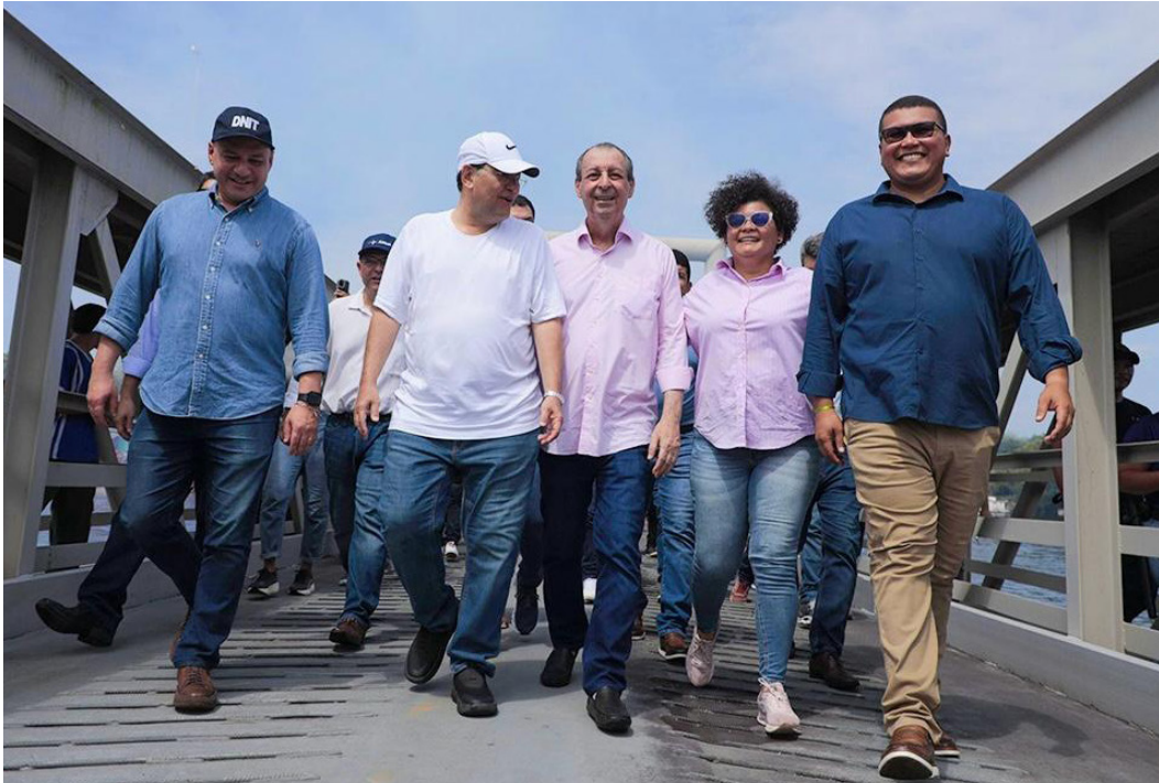
Valor será aplicado na construção e revitalização da orla da cidade

res, agora os viajantes podem contar com mais segurança na hora de embarcar para viajar pelo interior do Amazonas. O espaço conta com rampa de acesso, pontes móveis e cais flutuante, estruturas que modernizam a navegação e fortalecem setores vitais da economia barcelense, como a pesca ornamental, reconhecida mundialmente, e o turismo de pesca esportiva, que atrai visitantes de várias partes do Brasil e do exterior. Deputado ‘marca presença’ Quem também acompanhou a agenda dos senadores em Barcelos foi o secretário de Assistência Social de Manaus e deputado federal licenciado, Saullo Vianna (UB). Na ocasião, ele anunciou o envio de R$ 2 milhões em emendas parlamentares para o município. Segundo Vianna, os recursos serão destinados ao custeio da Atenção Básica em saúde. De acordo com sua equipe, o parlamentar tem cumprido uma extensa agenda pelo in-