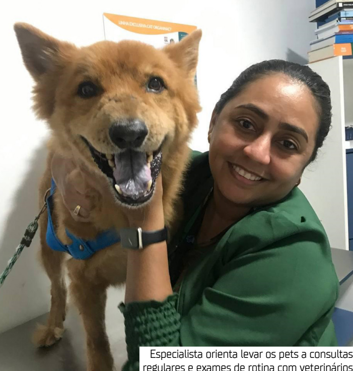
Especialista orienta levar os pets a consultas regulares e exames de rotina com veterinários