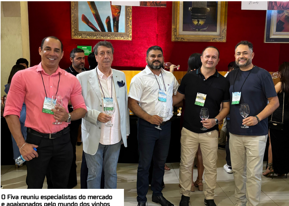
O Fiva reuniu especialistas do mercado e apaixonados pelo mundo dos vinhos

Nos dias 21 e 22 de agosto, aconteceu a 6ª Edição da Feira Internacional de Vinhos na Amazônia, no Teatro Mauara. Experiência Única, reunindo rótulos nacionais e internacionais, marcas consagradas, especialistas do mercado e apaixonados pelo mundo dos vinhos. + de 250 rótulos, conteúdos técnicos e experiências sensoriais. Parabéns aos idealizadores por inserirem Manaus no roteiro das grandes feiras de vinho e gastronomia, no Brasil.