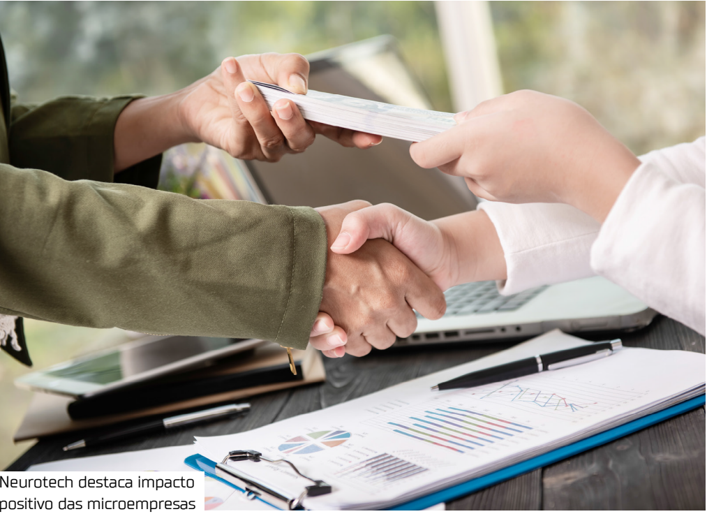
Neurotech destaca impacto positivo das microempresas