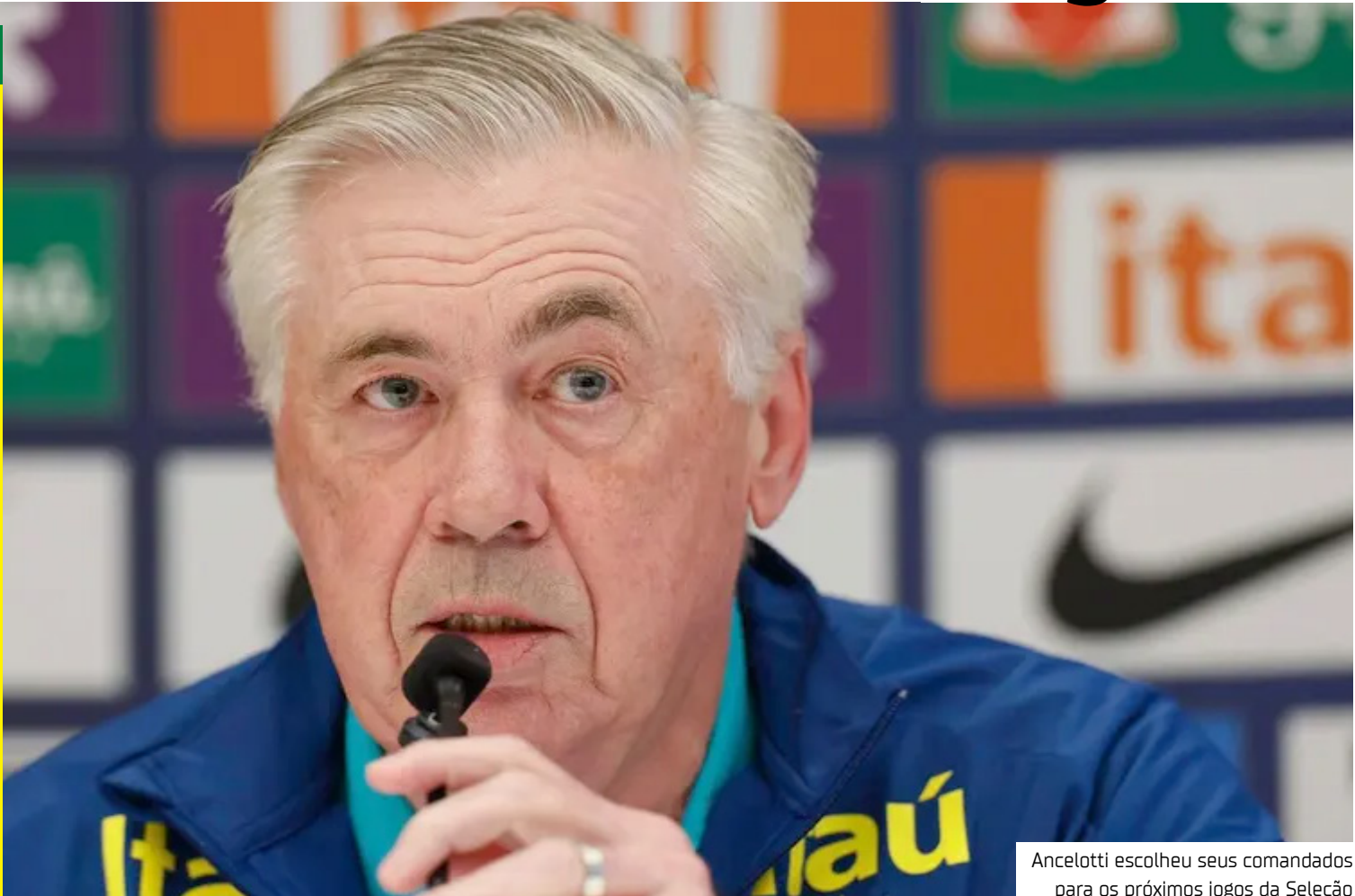
Ancelotti escolheu seus comandados para os próximos jogos da Seleção

te representa uma grande dificuldade para qualquer visitante. Na tabela das Eliminatórias, a Argentina já confirmou o primeiro lugar com 35 pontos, enquanto Equador e Brasil aparecem logo atrás, ambos com 25, mas com os equatorianos levando