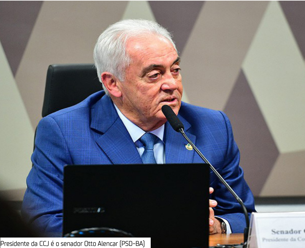
Presidente da CCJ é o senador Otto Alencar (PSD-BA)

A Comissão de Constituição, Justiça e Cidadania (CCJ) do Senado se reúne amanhã (27), a partir das 9h, para votar uma pauta com sete projetos de lei. Um deles proíbe a fiança em casos de pedofilia, outro tipifica o crime de violência eletrônica contra a mulher e também há uma proposta sobre crimes violentos. Os outros projetos tratam de incentivo ao aleitamento materno, criação de cargos na Justiça do Trabalho de Minas Gerais, alterações no Código de Trânsito e uso de créditos tributários em contratos de obras e serviços de engenharia. O presidente da CCJ é o senador Otto Alencar (PSD-BA).