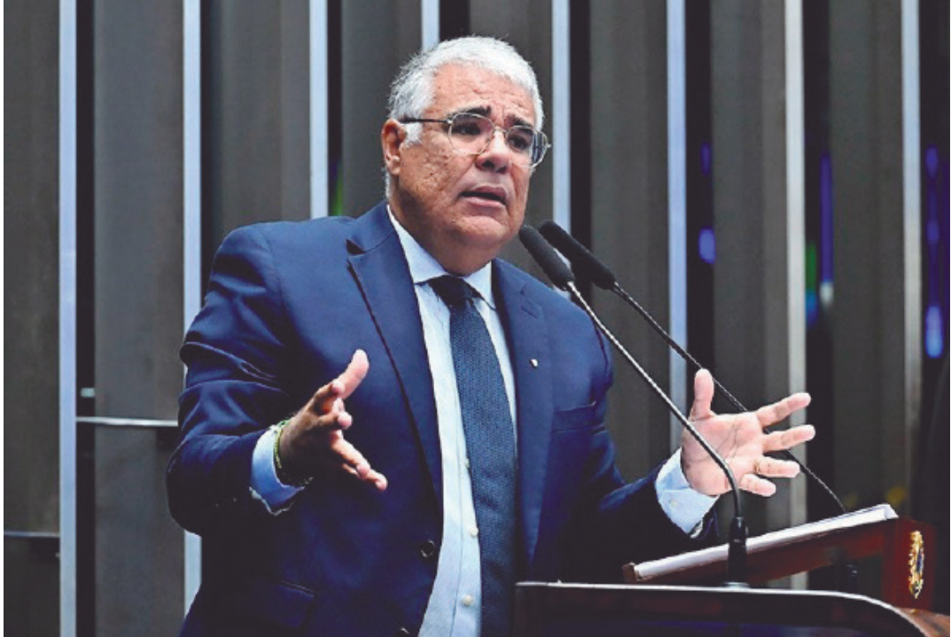
Segundo o parlamentar, os atos foram motivados por supostos abusos

O parlamentar fez um apelo ao Senado para que reaja diante do que classificou como excessos do Judiciário. Segundo ele, o Parlamento não pode permanecer inerte diante de ações que violam,