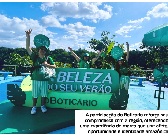
A participação do Boticário reforça seu compromisso com a região, oferecendo uma experiência de marca que une afeto, oportunidade e identidade amazônica

O Boticário, marca de beleza preferida dos nortistas, marca presença na 33ª edição da Festa do Cupuaçu, que aconteceu no fim de semana, em Presidente Figueiredo, com uma ativação especial voltada para experiências sensoriais, conexão com o público e incentivo ao empreendedorismo local.