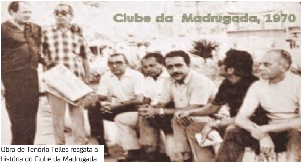
Obra de Tenório Telles resgata a história do Clube da Madrugada