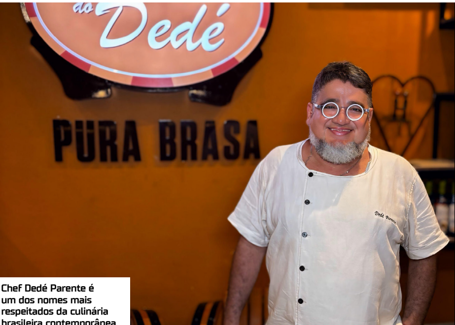
Chef Dedé Parente é um dos nomes mais respeitados da culinária brasileira contemporânea

Na noite, foram apresentados assados, defumados, grelhados e braseados, com equipamentos de ponta para a diversão dos clientes.