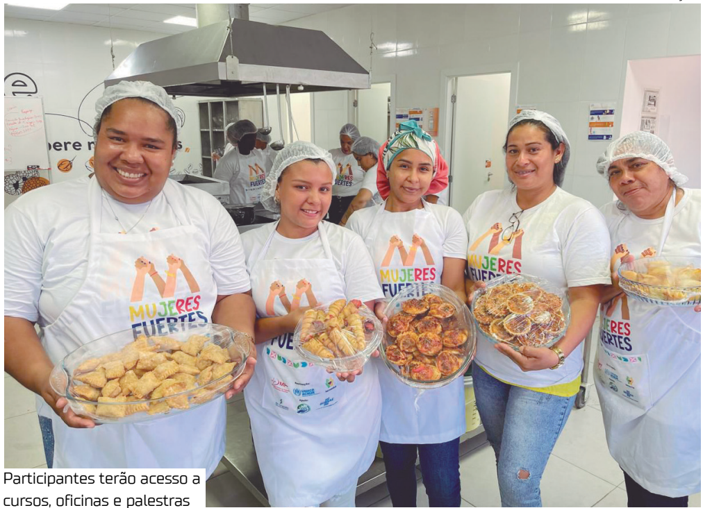
Participantes terão acesso a cursos, oficinas e palestras

um convite especial. “Aqui, nenhuma mulher caminha sozinha. Estamos sempre dispostas a ajudar umas às outras e crescer em união. Venha e dê o primeiro passo rumo ao seu futuro empreendedor”, afirma. Para esclarecimento de dúvidas, a organização disponibiliza o seguinte contato de WhatsApp: (92) 99237-4215. O Instituto Hermanitos atua na promoção da dignidade, acolhimento e geração de oportunidades para pessoas refugiadas e migrantes nos estados do Amazonas e Roraima.