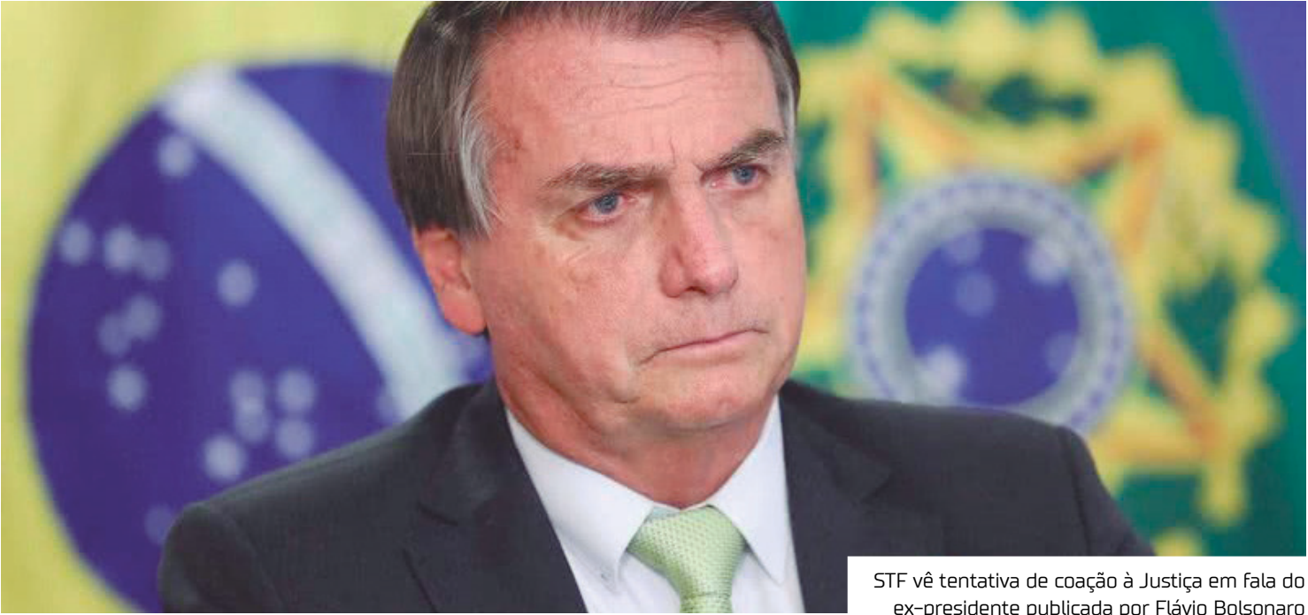
STF vê tentativa de coação à Justiça em fala do ex-presidente publicada por Flávio Bolsonaro

Segundo o magistrado, “os apoiadores de Jair Bolsonaro e seus filhos, deliberadamente, utilizaram as falas e a participação – ainda que por telefone e pelas redes sociais – do réu para a propagação de ataques e impulsionamento dos manifestantes com a nítida intenção de pressionar e coagir esta Suprema Corte”.