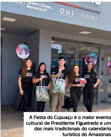
A Festa do Cupuaçu é o maior evento cultural de Presidente Figueiredo e um dos mais tradicionais do calendário turístico do Amazonas

Um novo atrativo chegou ao Shopping Via Norte. Agora, os proprietários de veículos elétricos terão disponíveis pontos de recarga em uma estação da Kúara Energy, empresa amazonense especializada em soluções de energia renovável e mobilidade elétrica.