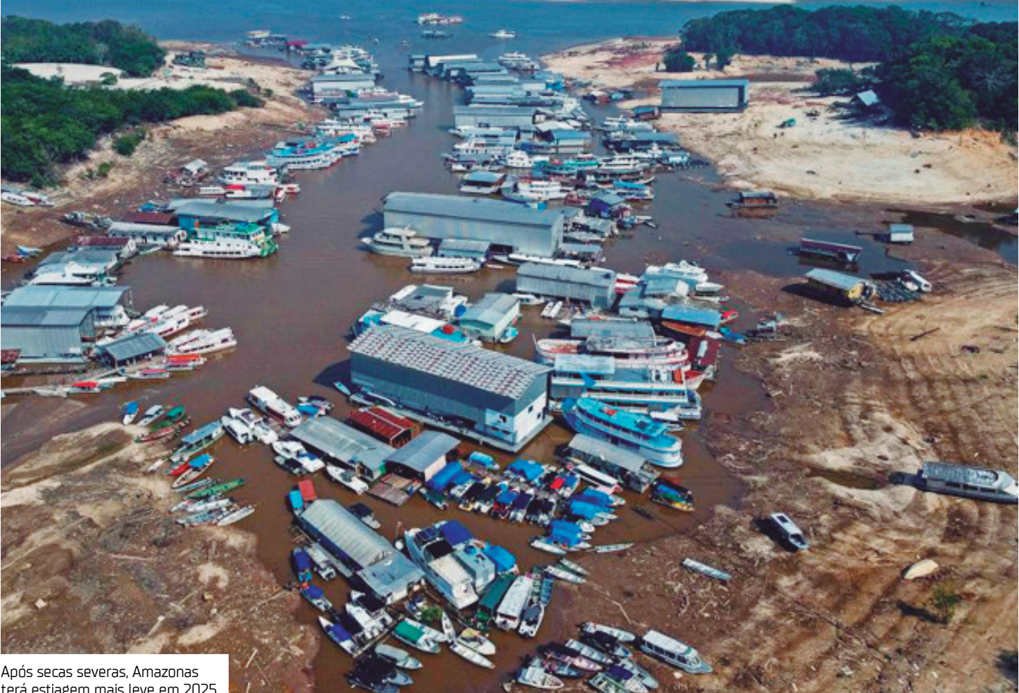
Após secas severas, Amazonas terá estiagem mais leve em 2025

sequência, é a questão da ajuda humanitária, distribuição de caixas d’água. Nós já temos o mapeamento dos anos anteriores daquelas localidades onde os rios devem baixar mais, porém a previsão indica que devemos ter uma seca moderada”, afirmou Wilson Lima. Para enfrentar a estiagem, o governo ampliou sua estrutura de resposta com a entrega de nove Grupamentos Integrados de Combate a Incêndios e Proteção Civil (GCIPIs) em municípios do interior, como Tapauá, Rio Preto da Eva, Novo Aripuanã, Maués, Lábrea, Manaquiri, Autazes, Jutai e Coari. Outras nove unidades estão em implantação para fortalecer a atuação em áreas estratégicas. O efetivo de combate ao período seco é composto por 223 bombeiros militares e 232 brigadistas contratados, distribuídos por todo o interior do estado. Além disso, o governador destacou a redução de cerca de 90% nos focos de calor entre janeiro e julho de 2025 em comparação ao mesmo período do ano anterior, atribuindo o resultado às ações de monitoramento, resposta rápida e campanhas de conscientização. No mesmo encontro, Wilson Lima apresentou o balanço da Operação Cheia