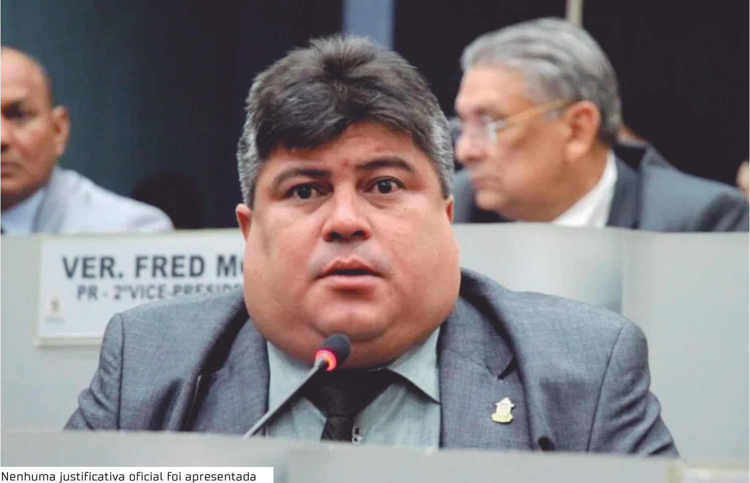
Nenhuma justificativa oficial foi apresentada