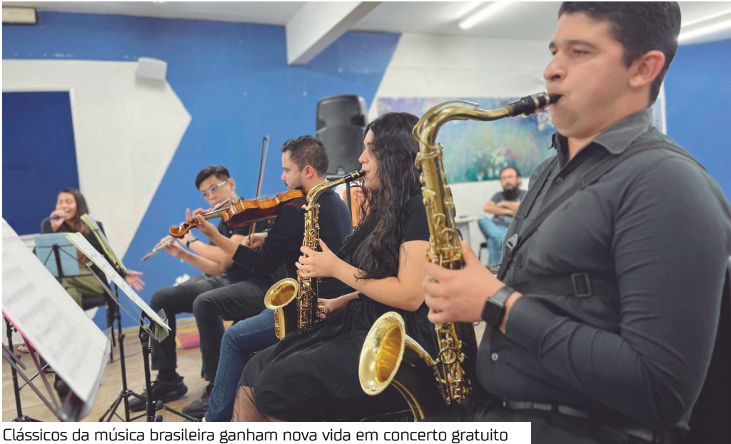
Clássicos da música brasileira ganham nova vida em concerto gratuito

A força da música popular brasileira será celebrada em um espetáculo especial na sexta-feira (8), às 19h, no Teatro da Instalação, Centro de Manaus, com a apresentação da Orquestra de Repertório Popular do Liceu de Artes e Ofícios Claudio Santoro. A iniciativa conta com o apoio do Governo do Amazonas, por meio da Secretaria de Cultura e Economia Criativa, e tem entrada gratuita.