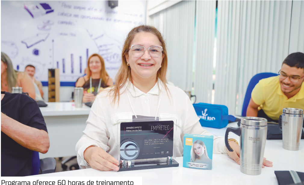
Programa oferece 60 horas de treinamento

A Prefeitura de Manaus, por meio da Secretaria Municipal do Trabalho, Empreendedorismo e Inovação (Semtepi), abre hoje, (5), as inscrições para 25 vagas no curso de capacitação empreendedora, o Empretec. As aulas vão acontecer de 25 a 30/8, no prédio do Serviço Brasileiro de Apoio às Micro e Pequenas (Sebrae), localizado na avenida Leonar do Malcher, nº 924, bairro Centro, zona Centro-Sul da capital. Em parceria com o Sebrae, a capacitação vai ofertar um conteúdo adaptado para desenvolvimento de características de comportamento empreendedor e para a