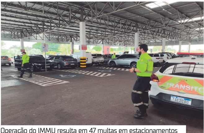
Operação do IMMU resulta em 47 multas em estacionamentos