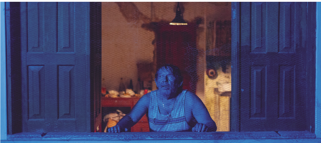
Curta “Mata-Gato” retrata uma longa e aterrorizante noite vivida por um velho solitário

A programação cultural do mês de agosto vem diversa com shows, exibição de filme e espetáculo de teatro. As atividades iniciam neste sábado (9), com a comemoração de 20 anos da banda Cabocrioulo, das 16h às 22h, no Espaço Cultural Coração Blue (rua Silva Ramos, 119, Centro).