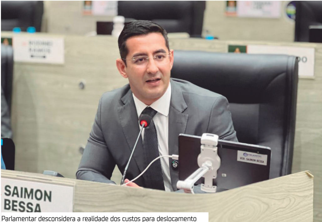
Parlamentar desconsidera a realidade dos custos para deslocamento