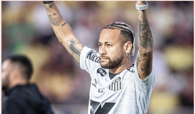
Neymar pode voltar a jogar em um time da Europa

A Velha Senhora se prepara para a estreia do Campeonato Italiano. O time larga no torneio contra o Parma, no dia 24 de agosto.