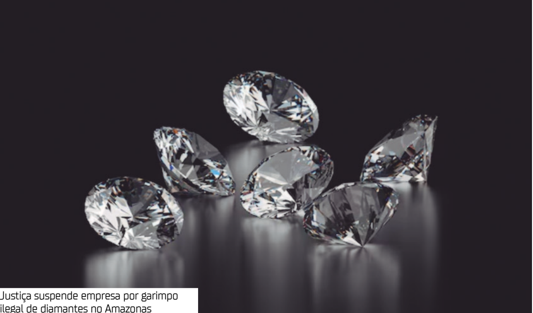
Justiça suspende empresa por garimpo ilegal de diamantes no Amazonas

A Justiça Federal suspendeu as atividades da empresa MHX Serviços de Mineração e Empreendimentos Ltda, que atuava nos municípios de Manicoré e Novo Aripuanã, no sul do Amazonas. A decisão atendeu a um pedido do Ministério Público Federal (MPF), que denunciou a empresa e três sócios por esquema de extração ilegal de diamantes. Segundo o MPF, o grupo cometeu crimes como usurpação de bens da União, lavagem de dinheiro, falsidade ideológica, uso de documentos falsos e associação criminosa. Com o recebimento da denúncia, os envolvidos se tornaram réus no processo. As investigações da Operação Adamas apontaram que a extração ilegal ocorreu entre 2013 e 2019, sem autorização válida. A empresa apresentava