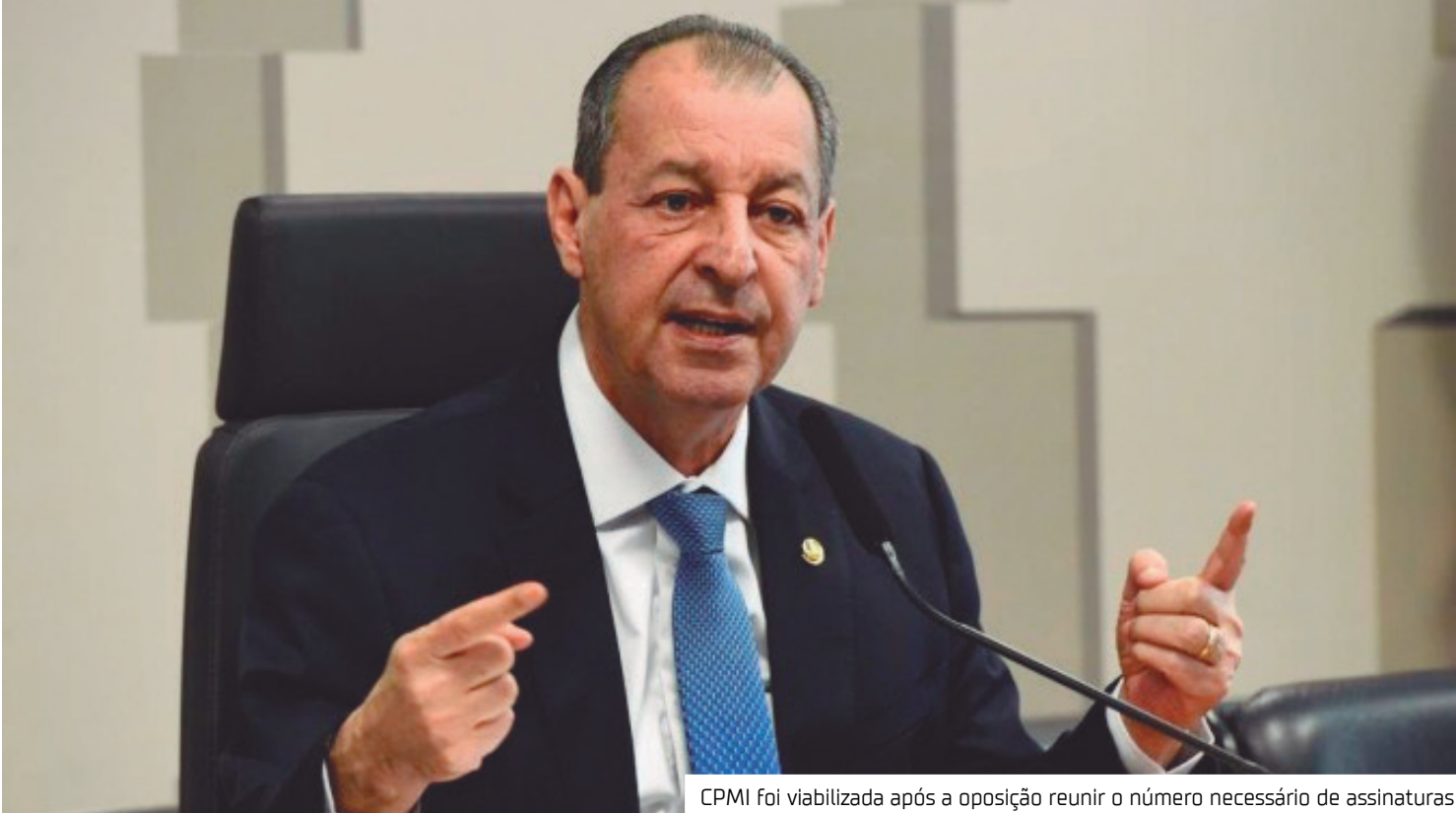
CPMI foi viabilizada após a oposição reunir o número necessário de assinaturas

O nome do parlamentar amazonense foi indicado pelo presidente do Senado, Davi Alcolumbre (União-AP), conforme publicado pelo portal Metrópoles, que ouviu fontes ligadas tanto à base do gover-