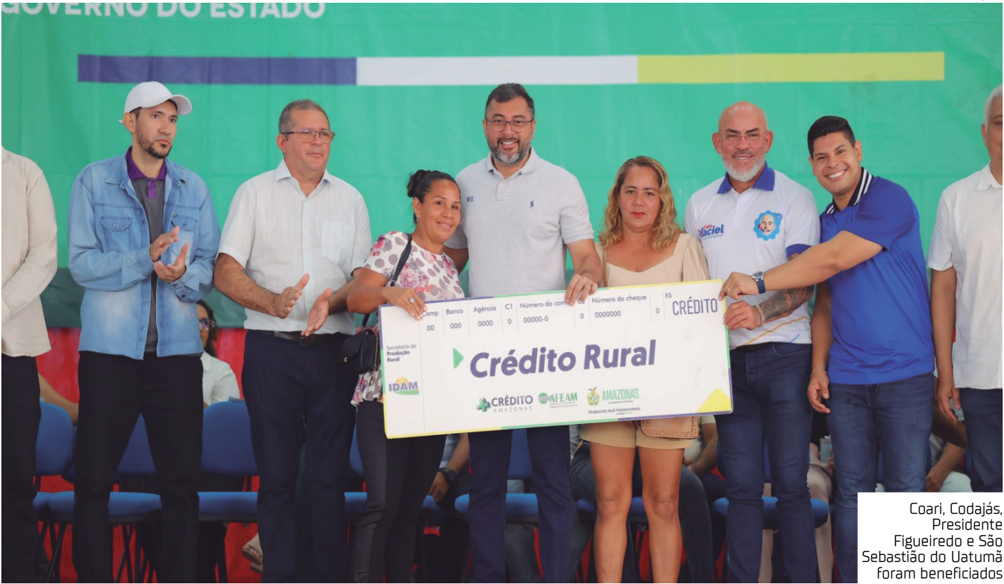
Coari, Codajás, Presidente Figueiredo e São Sebastião do Uatumã foram beneficiados

em forma de equipamentos e implementos de pesca — canoas de alumínio, motores rabeta, motores de popa, rabetas e freezers —, além de recurso para o custeio da atividade. Em relação à formalização dos trabalhadores rurais, foram destinados à agricultores familiares 154 documentos rurais a agricultores familiares de Coari, sendo 125 Cartões do Produtor Primário (CPP) e 29 Cadastros Nacionais da Agricultura Familiar (CAF). Os cartões e o cadastro foram viabilizados pela Unidade Locais (UnLoc) do Idam nos municípios. “O fomento à pesca representa o compromisso do Governo do Estado com o setor primário amazonense, com garantia de mais recursos para alavancar a atividade, além de garantir melhores condições de trabalho e elevação de renda aos trabalhadores do segmento”, avaliou a diretora-presidente do Idam, Eliane Ferreira. Mais incentivos no interior Em São Sebastião do Uatumã (a 247 quilômetros de Manaus), 16 produtores