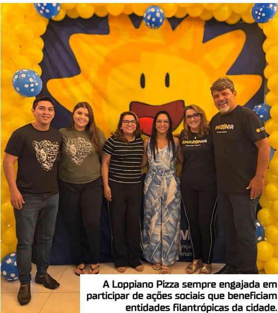
A Loppiano Pizza sempre engajada em participar de ações sociais que beneficiam entidades filantrópicas da cidade.