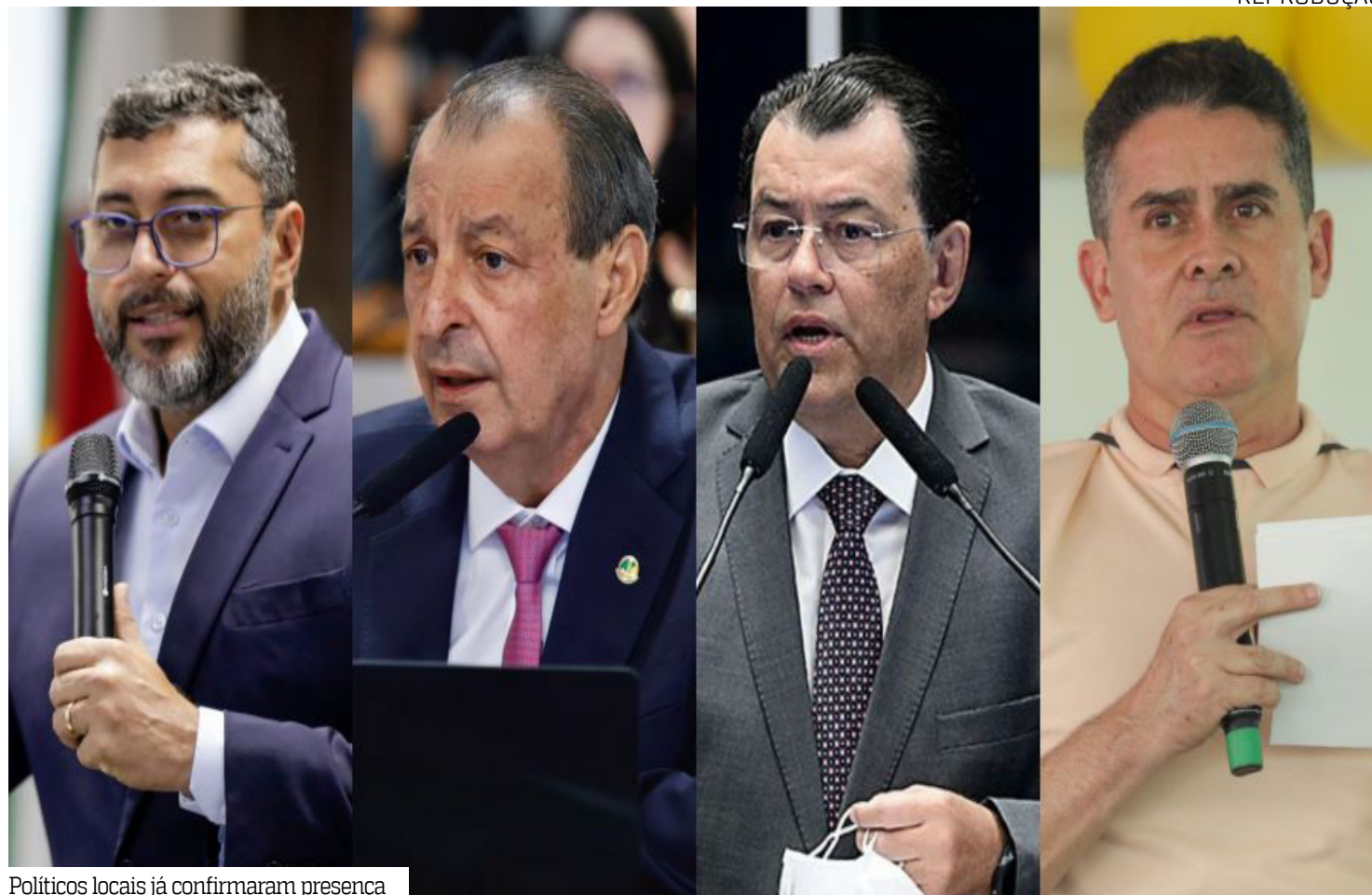
Políticos locais já confirmaram presença