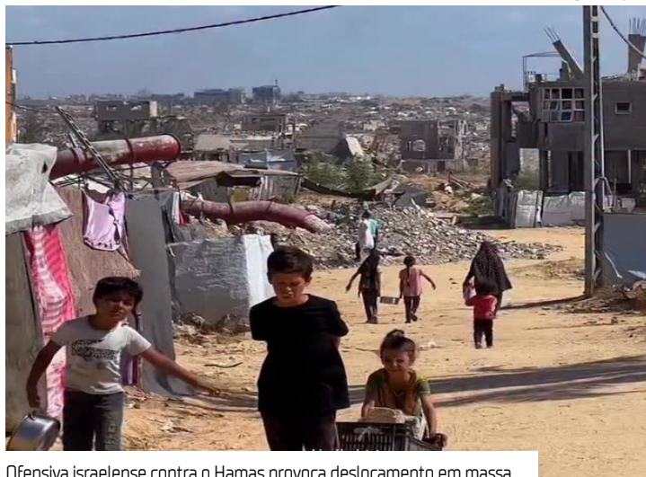
Ofensiva israelense contra o Hamas provoca deslocamento em massa

O Exército de Israel informou ontem (25) que cerca de 700 mil palestinos fugiram da Cidade de Gaza em direção ao sul do território desde o final de agosto, como consequência direta da ofensiva militar contra o grupo Hamas.