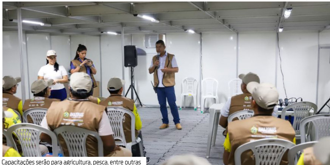
Capacitações serão para agricultura, pesca, entre outras

A 47ª edição da Exposição Agropecuária do Amazonas (Expoagro) vai oferecer 55 cursos profissionalizantes para o setor primário. As capacitações serão promovidas de forma gratuita e abertas ao público interessado.