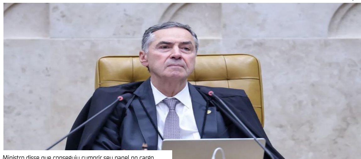
Ministro disse que conseguiu cumprir seu papel no cargo

Em discurso de despedida da presidência do Supremo Tribunal Federal (STF), o ministro Luís Roberto Barroso afirmou ontem (25) que a Corte conseguiu cumprir bem o seu papel de preservar o Estado de direito, apesar do “custo pessoal” dos ministros.