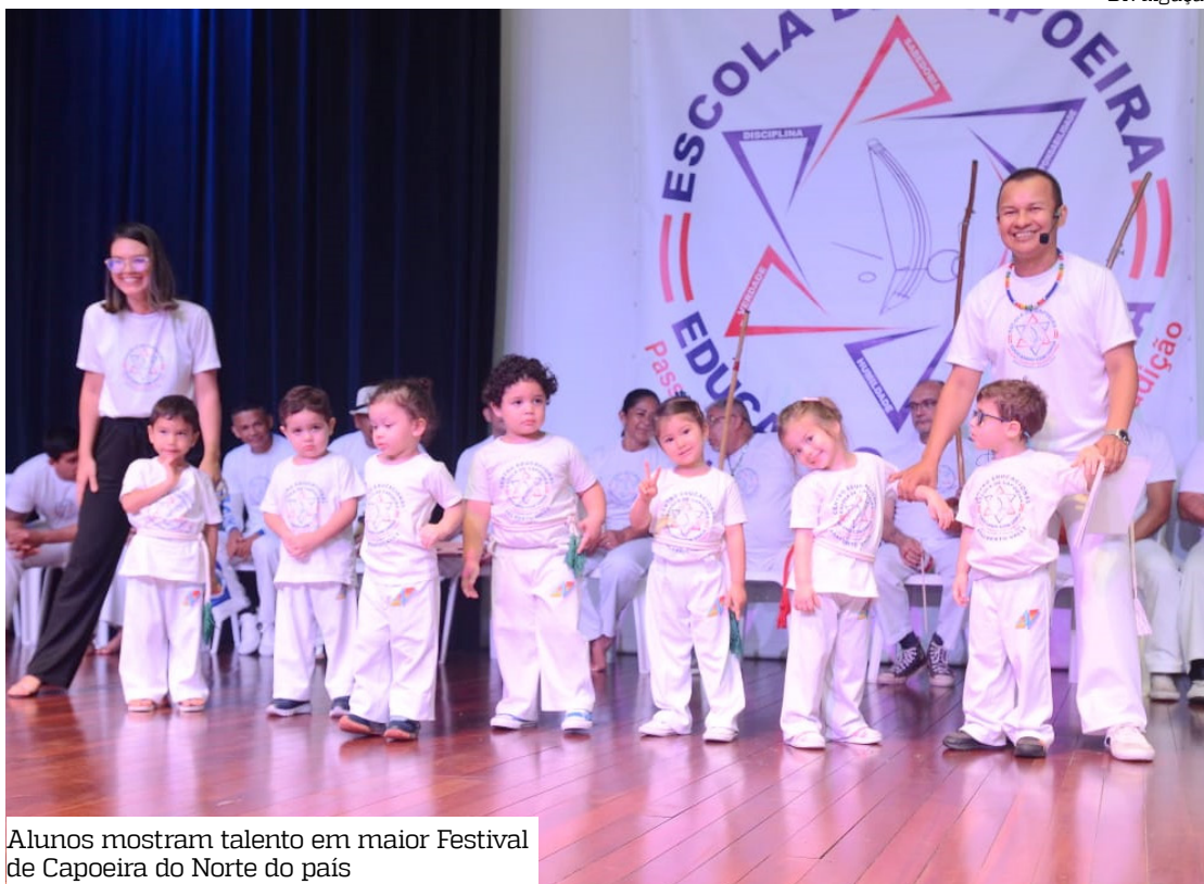
Alunos mostram talento em maior Festival de Capoeira do Norte do país