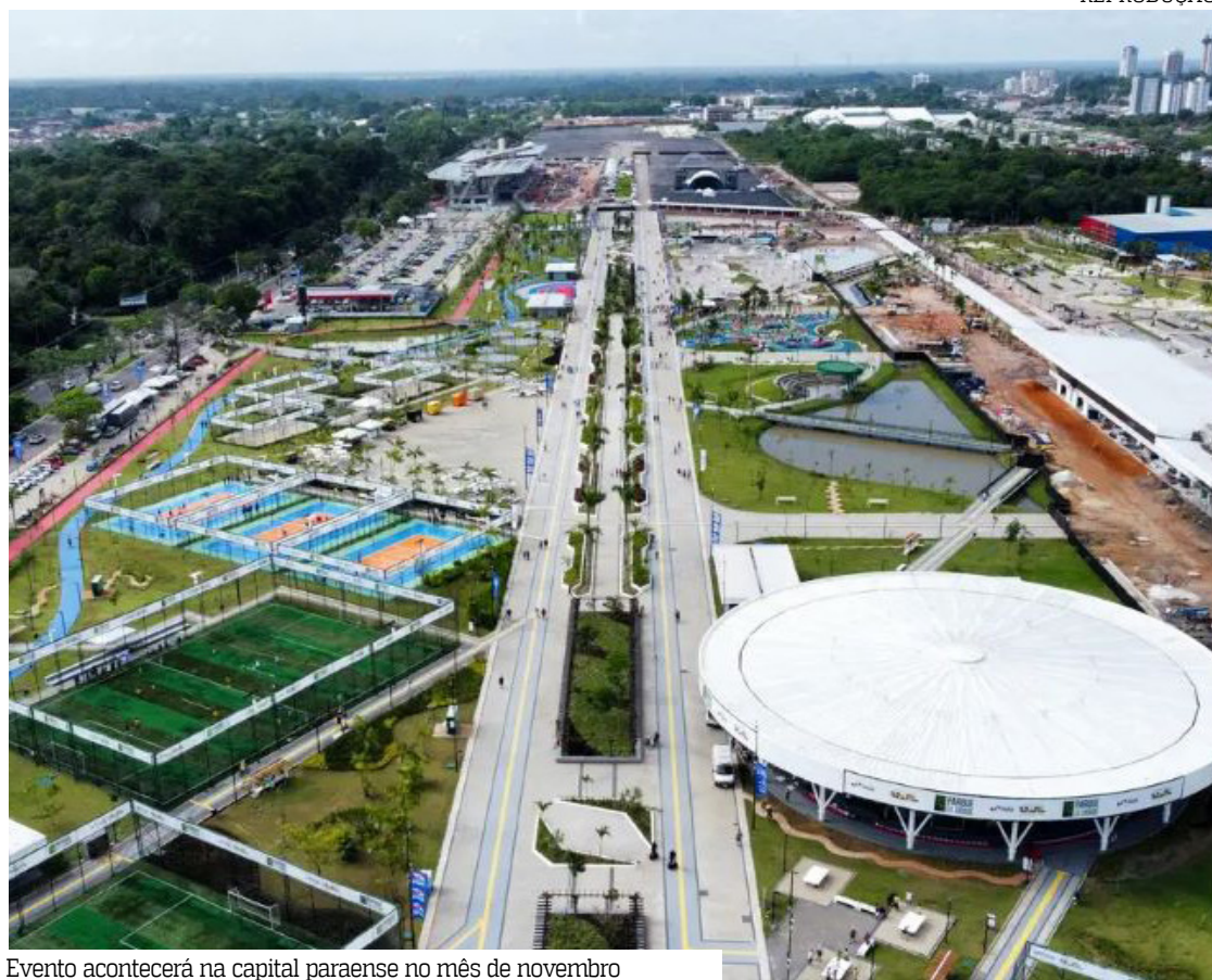
Evento acontecerá na capital paraense no mês de novembro

Foram 304 votos favoráveis e 64 contrários.