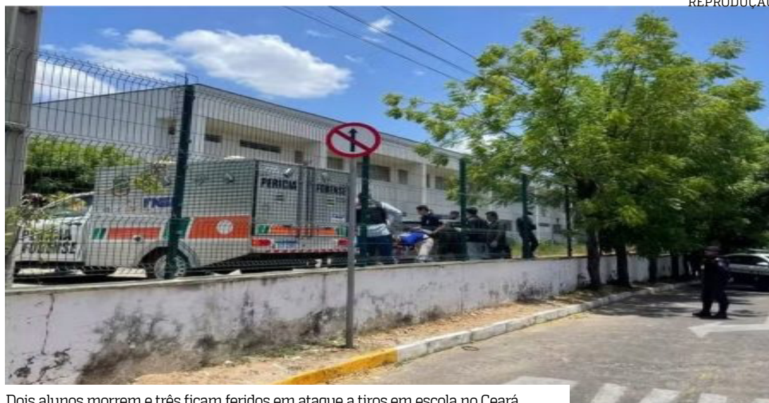
Dois alunos morrem e três ficam feridos em ataque a tiros em escola no Ceará

Uma linha de investigação aponta possível ligação do crime a disputas entre