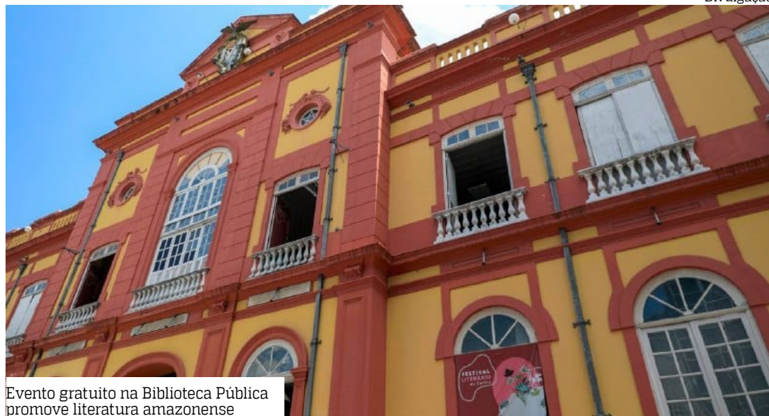
Evento gratuito na Biblioteca Pública promove literatura amazonense