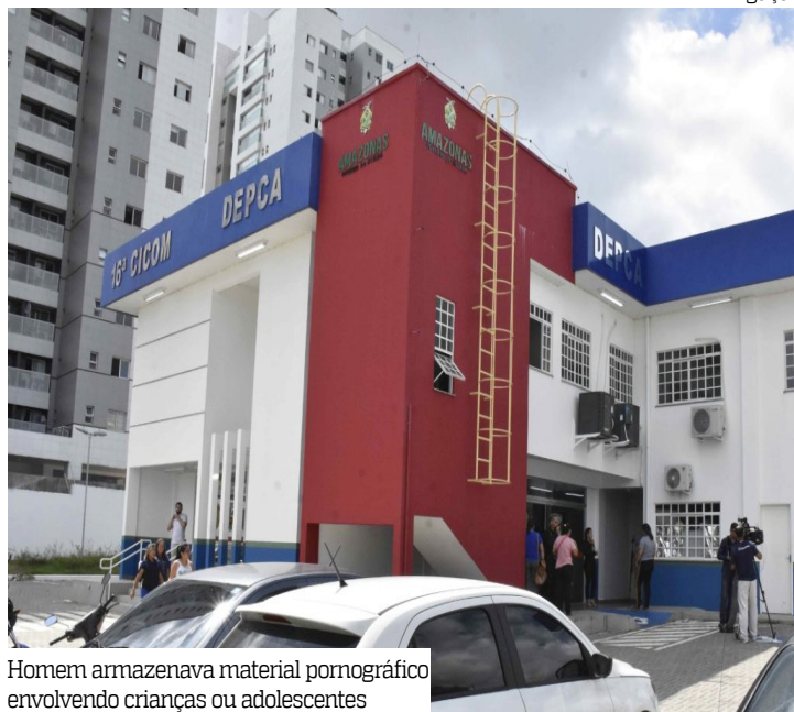
Homem armazenava material pornográfico envolvendo crianças ou adolescentes

Um idoso, de 67 anos, foi preso, na quarta-feira (24), por armazenamento de vasto material pornográfico infantil. A ação policial aconteceu no bairro Aleixo, zona centro-sul, quando também foi cumprido um mandado de busca e apreensão na casa do autor.