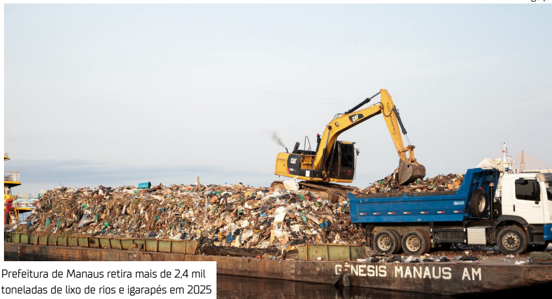
Prefeitura de Manaus retira mais de 2,4 mil toneladas de lixo de rios e igarapés em 2025

O transbordo é a etapa final de um trabalho diário, onde os resíduos são recolhidos ao longo de todo o mês pelas