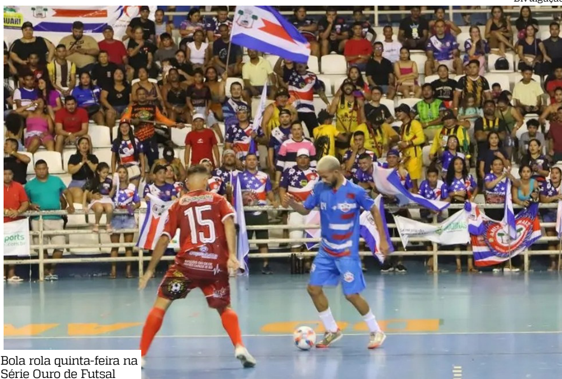
Bola rola quinta-feira na Série Ouro de Futsal

No Grupo A, o cabeça de chave é o Unidos do Alvorada, acompanhado de mais cinco clubes: Dom Jackson, Criciúma/São Jorge, Abílio Nery, Grêmio da Amazônia e Coari. No Grupo B, estão as equipes de Carauari (cabeça de