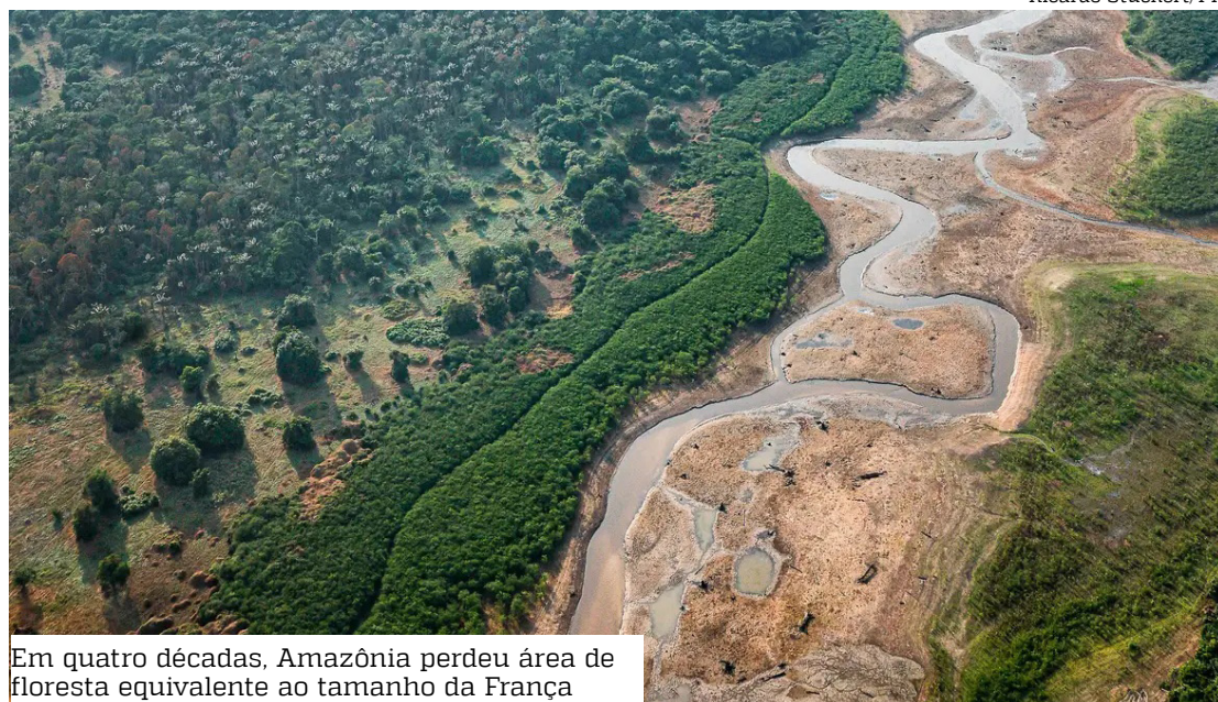
Em quatro décadas, Amazônia perdeu área de floresta equivalente ao tamanho da França

Proporcionalmente, a presença da silvicultura no bio-