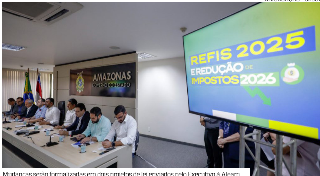
Mudanças serão formalizadas em dois projetos de lei enviados pelo Executivo à Aleam

“Essa não é uma decisão isolada do Executivo. É uma decisão de Estado, construída com base em estudos da Secretaria de Fazenda e em diálogo com a Assembleia Legislativa. Essas medidas garantem equilíbrio fiscal e permitem dividir