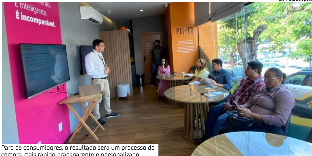
Para os consumidores, o resultado será um processo de compra mais rápido, transparente e personalizado