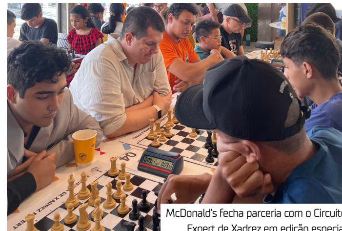
McDonald's fecha parceria com o Circuito Expert de Xadrez em edição especial

Com a proposta de democratizar o acesso ao xadrez, integrar a comunidade enxadrista e fomentar o cenário local, o Circuito Expert reafirma seu compromisso com o desenvolvimento esportivo e intelectual da juventude amazonense.