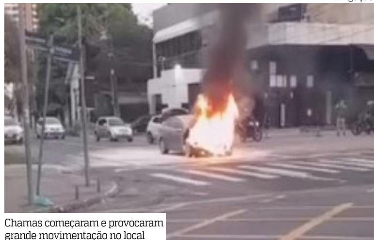
Chamas começaram e provocaram grande movimentação no local

Um carro pegou fogo na manhã desta segunda-feira (15), em um dos semáforos da avenida Umberto Calderaro, no bairro Adrianópolis, zona centro-sul de Manaus. As chamas começaram no cruzamento com a rua Teresina e provocaram grande movimentação no local.