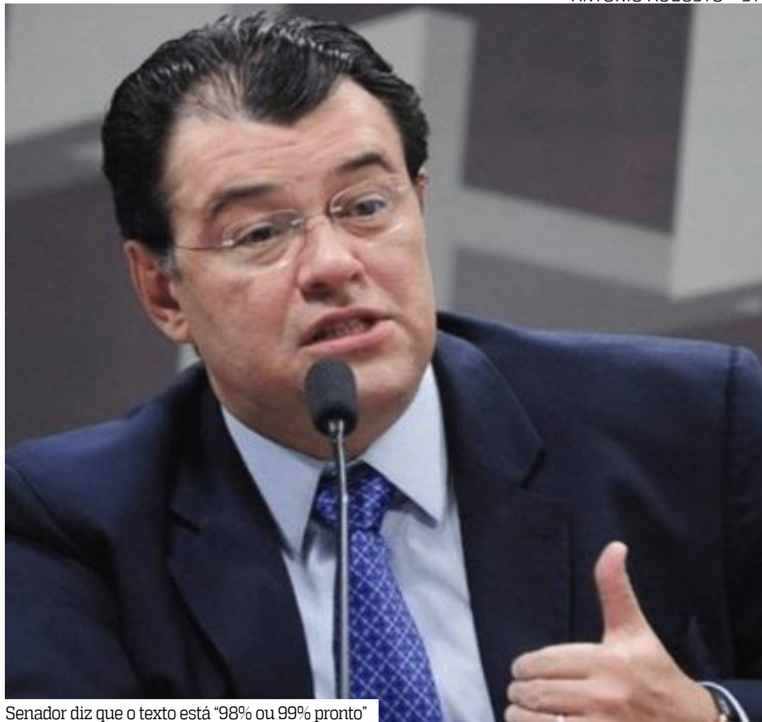
Senador diz que o texto está “98% ou 99% pronto”

Após disputa entre associações de prefeitos, Braga definiu um modelo temporário para 2025: a FNP (Frente Nacional de Prefeitas e Prefeitos) indicará 13 representantes e a CNM (Confederação Nacional de Municípios), 14. A partir das próximas eleições, haverá regras dis-