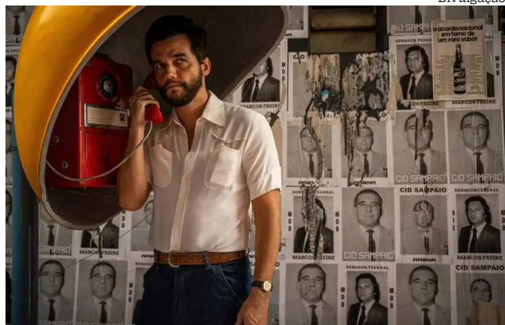
Com direção de Kleber Mendonça Filho, filme tem Wagner Moura no elenco

A Academia Brasileira de Cinema anunciou nesta segunda-feira (15) que o filme O Agente Secreto, de Kléber Mendonça Filho, será o representante brasileiro no Oscar 2026, na categoria Melhor Filme Internacional.