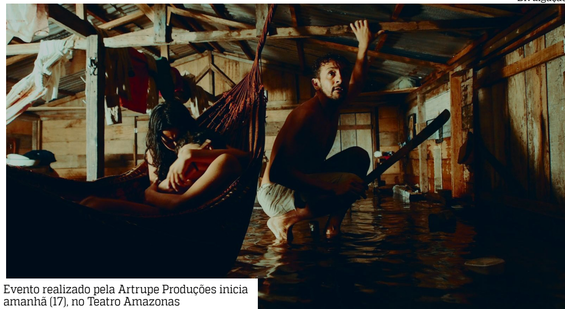
Evento realizado pela Artrupe Produções inicia amanhã (17), no Teatro Amazonas

Referência no Norte do País, o evento segue até domingo (21), com três mostras competitivas: Amazônia, Outros Nortes e Olhar Panorâmico, a mostra não-competitiva Olhinho para o público in-