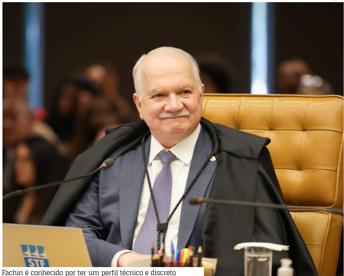
Fachin é conhecido por ter um perfil técnico e discreto

A cerimônia marca a posse de Alexandre de Moraes como vice-presidente. Nos discursos finais, são esperadas falas de Luís Roberto Barroso, do procurador-geral da República, Paulo Gonet, de representantes da OAB e do próprio Fachin, que encerra a sessão solene.