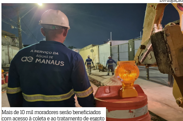
Mais de 10 mil moradores serão beneficiados com acesso à coleta e ao tratamento de esgoto

A Águas de Manaus segue com a expansão do sistema de esgotamento sanitário no bairro Cidade Nova, na zona Norte da capital. A partir desta segunda-feira (29), a concessionária inicia a implantação de redes de esgoto na Avenida Noel Nutels, no sentido bairro/Centro, nas proximidades da escola Profª Ruth Prestes Gonçalves (Aldeia do Conhecimento).