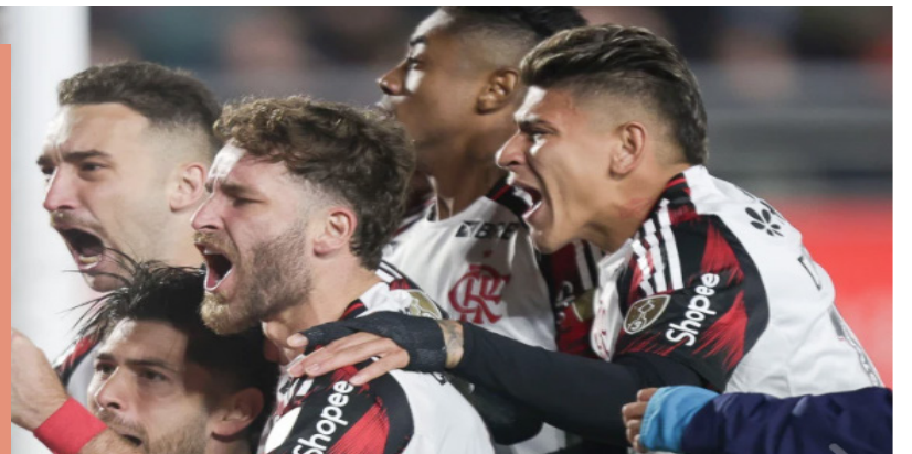
Flamengo é líder isolado do Campeonato Brasileiro de 2025