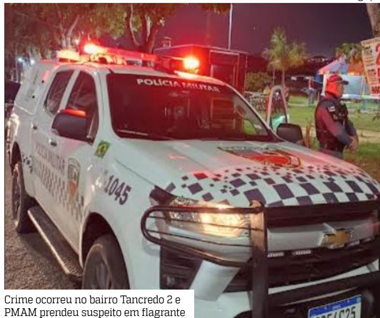
Crime ocorreu no bairro Tancredo 2 e PMAM prendeu suspeito em flagrante

Um homem de 30 anos foi preso por policiais militares suspeito de matar outro homem com 16 facadas na noite do domingo (29), no município de Juruá, a 674 quilômetros de Manaus. O crime ocorreu na rua Chiquinha Medeiros, bairro Tancredo 2.