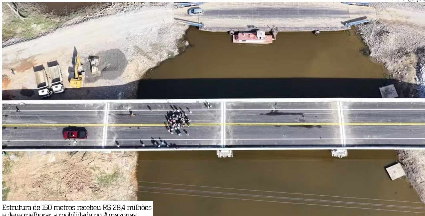
Estrutura de 150 metros recebeu R$ 28,4 milhões e deve melhorar a mobilidade no Amazonas

“O primeiro de muitos passos que nós estamos dando na BR-319. Aqueles que nos