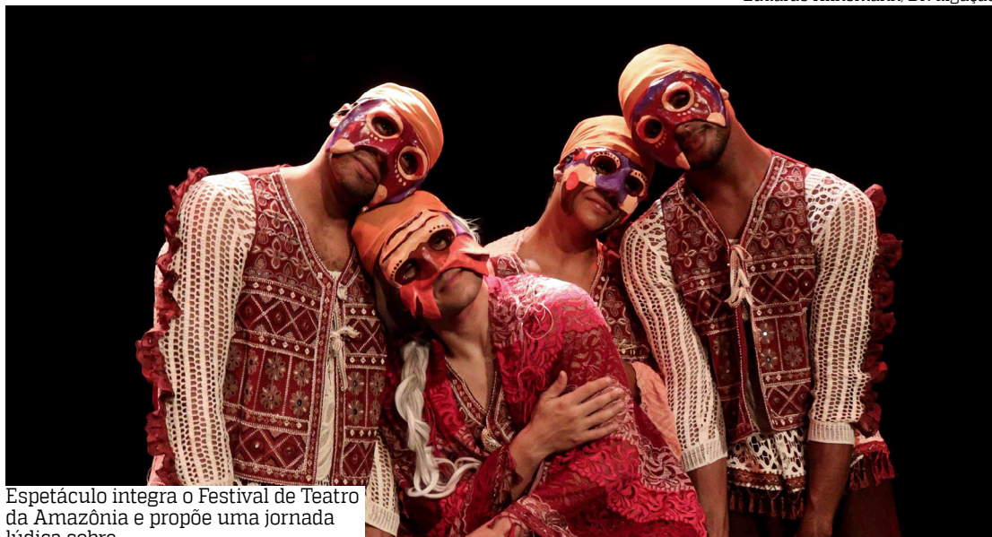
Espectáculo integra o Festival de Teatro da Amazônia e propõe uma jornada lúdica sobre

elementos simbólicos, como o uso de máscaras, que evocam memórias, arquétipos e identidades em constante transformação. Com uma linguagem que mistura dança, teatro e visualidades vibrantes, a cena se desenrola como uma travessia sensível em busca de pertencimento e coletividade.