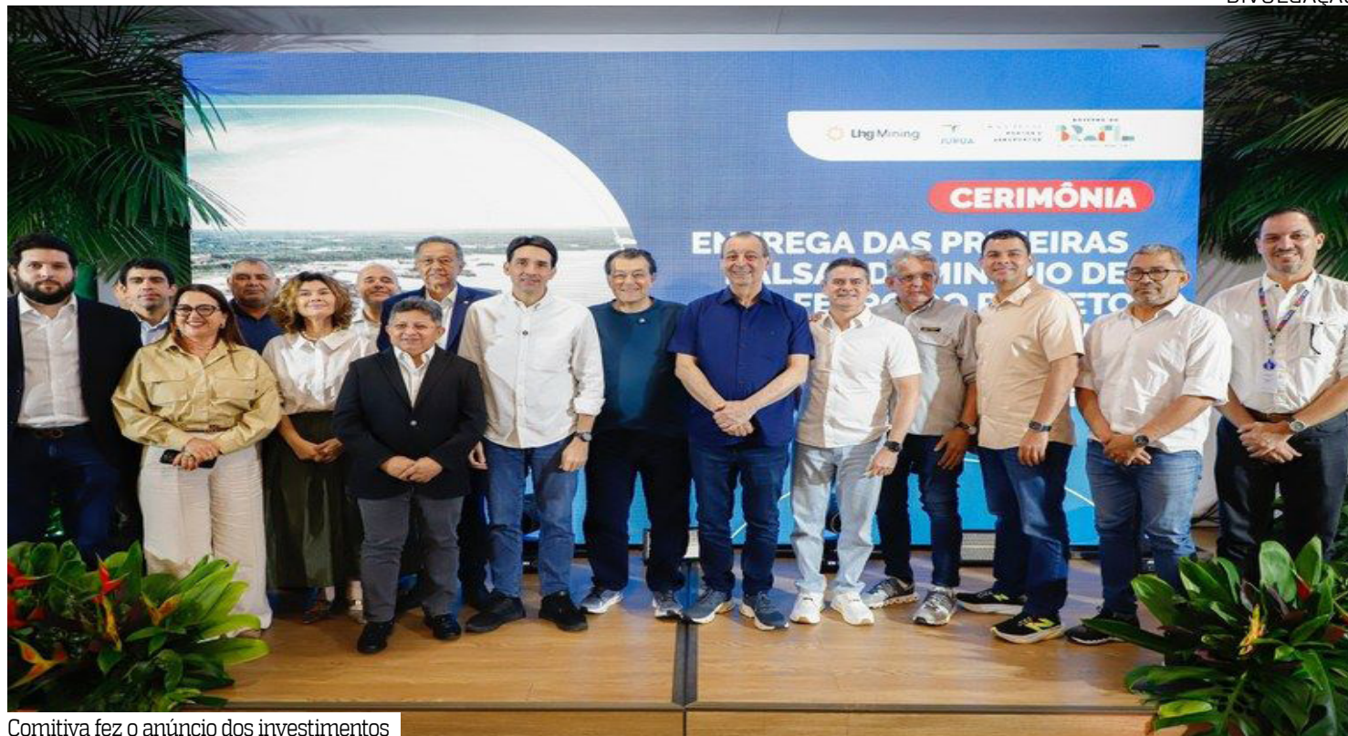
Comitiva fez o anúncio dos investimentos