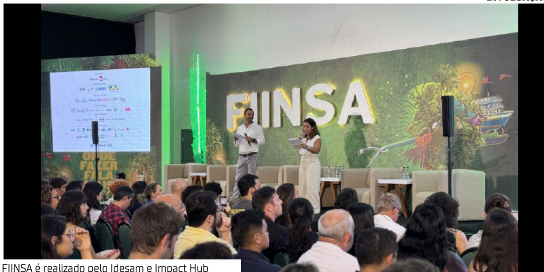
FIINSA é realizado pelo Idesam e Impact Hub

Belém será palco de um dos encontros mais estratégicos da Amazônia durante a COP30: o Festival de Investimento de Impacto e Negócios Sustentáveis da Amazônia (FIINSA). O evento acontece no dia 10 de novembro, no Campus de Direito do Centro Universitário do Estado do Pará (Cesupa), reunindo lideranças indígenas, empreendedores, gestores públicos, investidores, pesquisadores e representantes da sociedade civil em um ambiente de escuta, diálogo e construção coletiva.