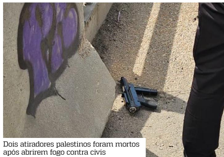
Dois atiradores palestinos foram mortos após abrirem fogo contra civis

A polícia israelense classificou os dois como terroristas. Segundo o exército, as forças armadas foram enviadas ao local para dar apoio nas investigações e prisões. Dois suspeitos já foram detidos, e operações foram realizadas na região de Ramallah, na Cisjordânia ocupada, como parte da resposta ao atentado.