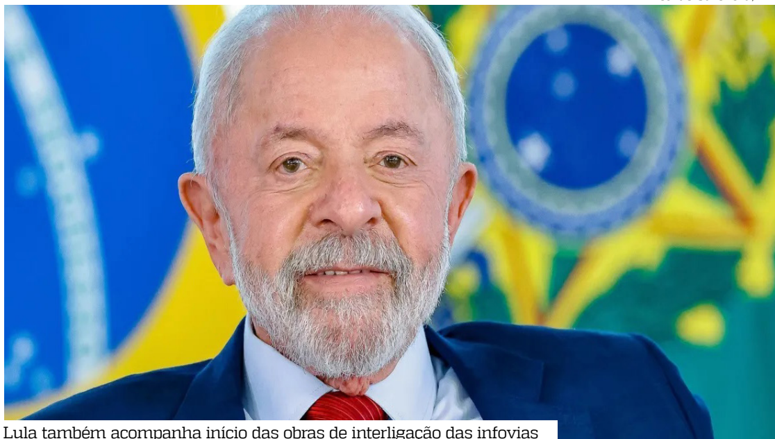
Lula também acompanha início das obras de interligação das infovias

“Aqui a gente tem novamente a questão do turismo muito forte, valorizando as culturas locais e oferecendo experiências para visitantes do Brasil