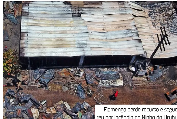
Flamengo perde recurso e segue réu por incêndio no Ninho do Urubu

Os alojamentos eram em uma estrutura de contêiner, e o fogo se iniciou devido a um problema no ar-condicionado, enquanto os jovens dormiam.