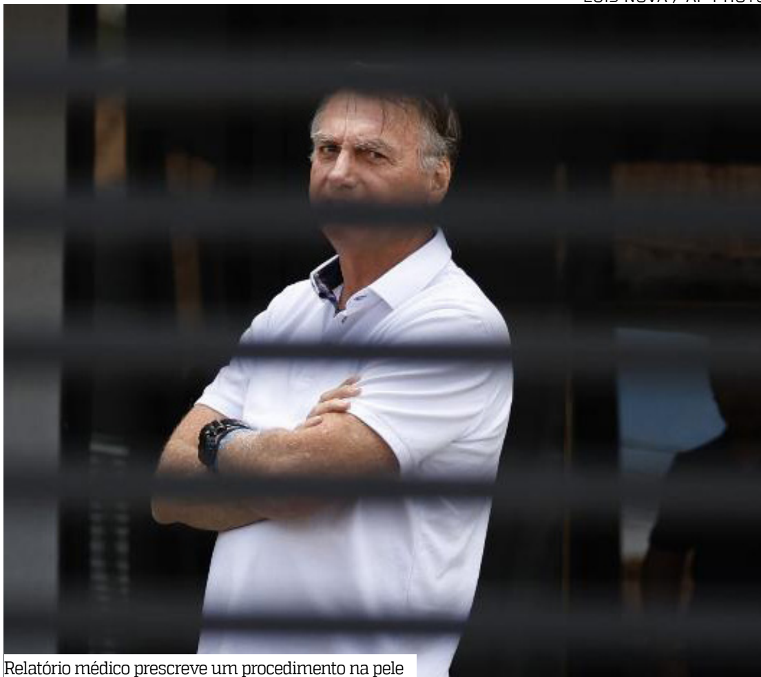
Relatório médico prescreve um procedimento na pele

Bolsonaro também é réu na ação penal da trama golpista no Supremo, cujo julgamento deve ser finalizado na sexta-feira (12).