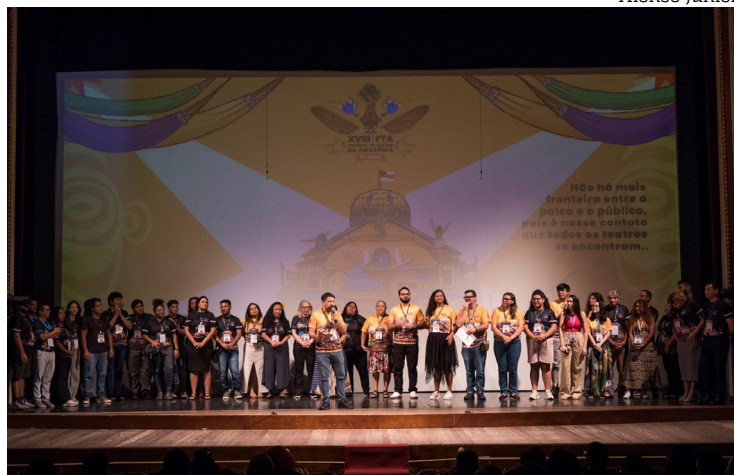
Evento acontece de 28 de setembro a 12 de outubro

O Festival de Teatro da Amazônia (FTA) 2025 está com inscrições abertas para as mostras Jurupari, Ednelza Sahdo e Chico Cardoso até 10 de setembro. Os editais de seleção dos espetáculos estão disponíveis em fetam.com.br e no perfil da Federação de Teatro do Amazonas (Fetam) no Instagram (@fetam.teatro).