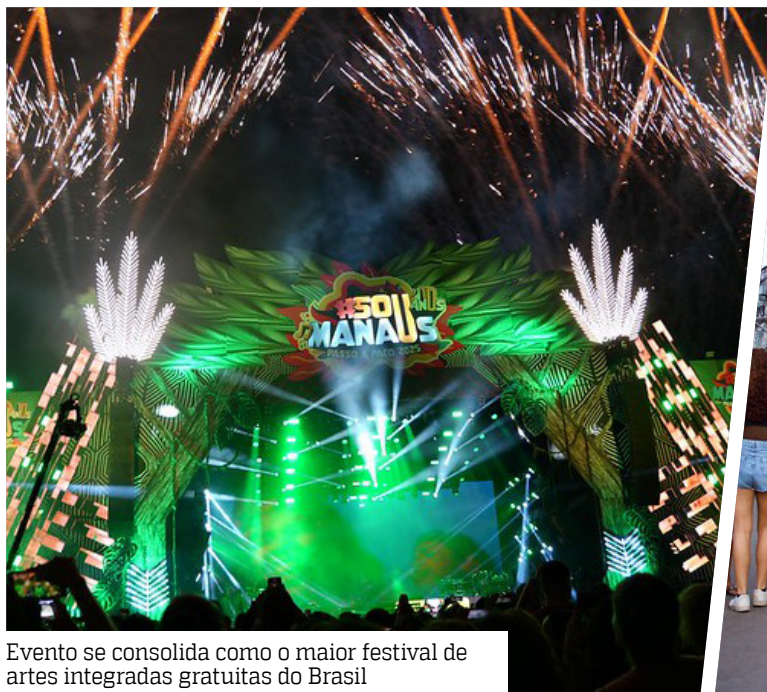
Evento se consolida como o maior festival de artes integradas gratuitas do Brasil

No domingo (7), durante coletiva de imprensa, o prefeito