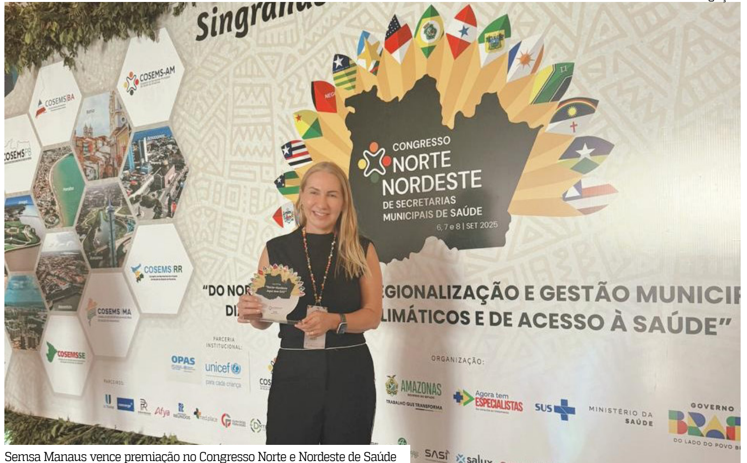
Semsu Manaus vence premiação no Congresso Norte e Nordeste de Saúde

reconhecimento, mostrando que o trabalho de planejamento desenvolvido aqui é seguro e efetivo, com resultados positivos em levar saúde de qualidade para a população”, assinala a gestora.