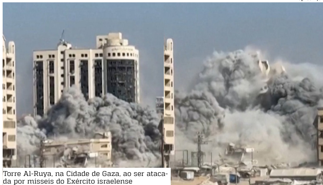
Torre Al-Ruya, na Cidade de Gaza, ao ser atacada por mísseis do Exército israelense

Ainda na segunda, Israel elevou o tom e ameaçou devastar a Cidade de Gaza se o Hamas não libertar os 48 reféns ainda sob sua custódia. “Gaza será destruída” caso o grupo terrorista não se desarme e entregue os pri-