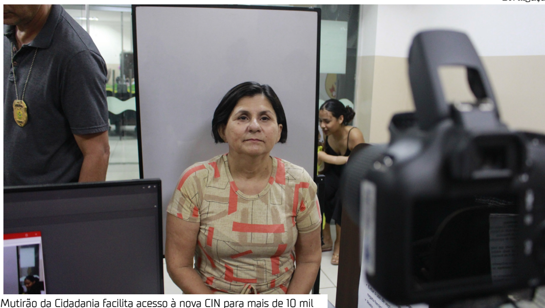
Mutirão da Cidadania facilita acesso à nova CIN para mais de 10 mil