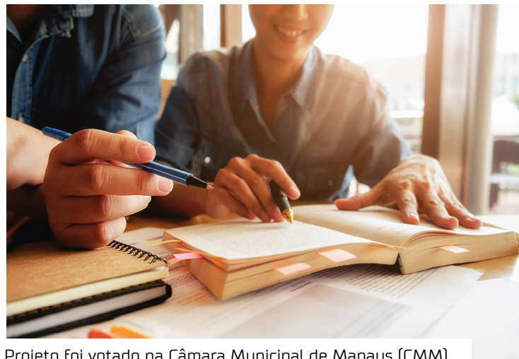
Projeto foi votado na Câmara Municipal de Manaus (CMM)

A capital amazonense pode ganhar, em breve, o programa “Escola da Cidadania”, que tem como objetivo promover a formação cidadã, a educação em direitos, o incentivo ao empreendedorismo e a valorização da participação comunitária. O Projeto de Lei foi deliberado durante a 75ª Sessão Ordinária, nesta segunda-feira (8 de setembro), na Câmara Municipal de Manaus (CMM).