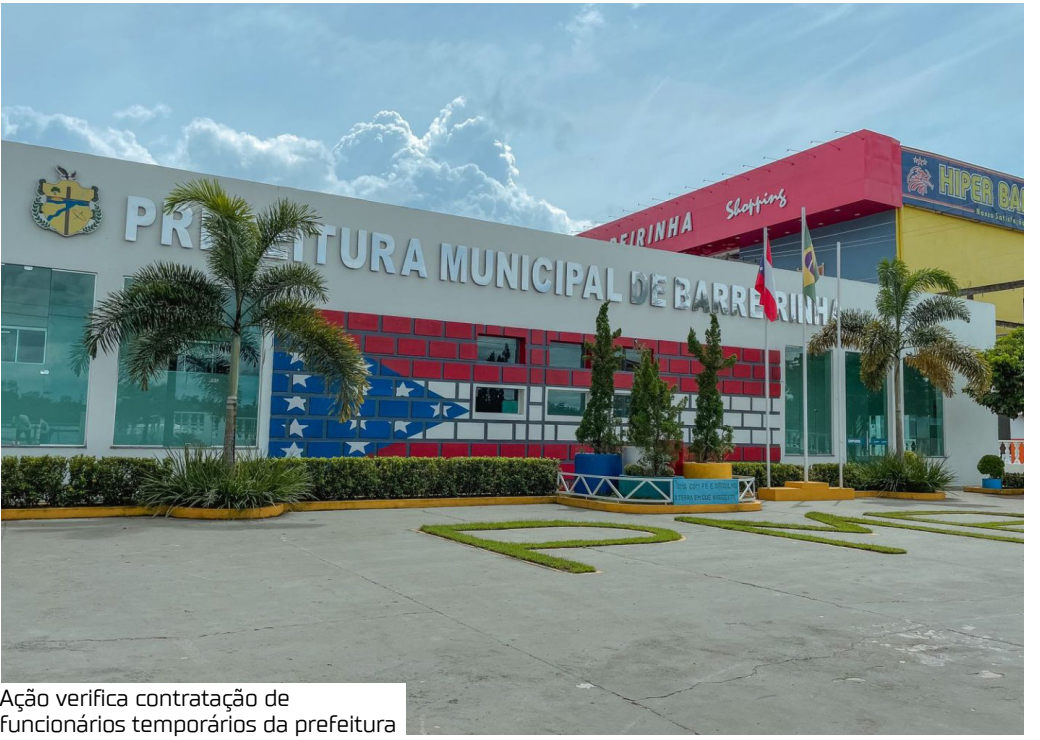
Ação verifica contratação de funcionários temporários da prefeitura