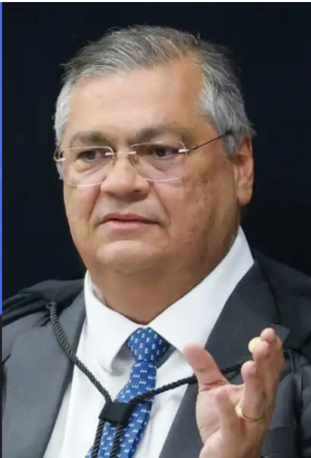
Ministro Flávio Dino acompanhou Alexandre de Moraes e votou para condenar o ex-presidente Jair Bolsonaro (PL)

Crimes não são passíveis de anistia Logo no início de seu voto, Flávio Dino reforçou que o STF já decidiu que crimes contra o Estado Democrático de Direito não podem ser perdoados. Ele citou o caso