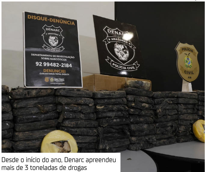
Desde o início do ano, Denarc apreendeu mais de 3 toneladas de drogas