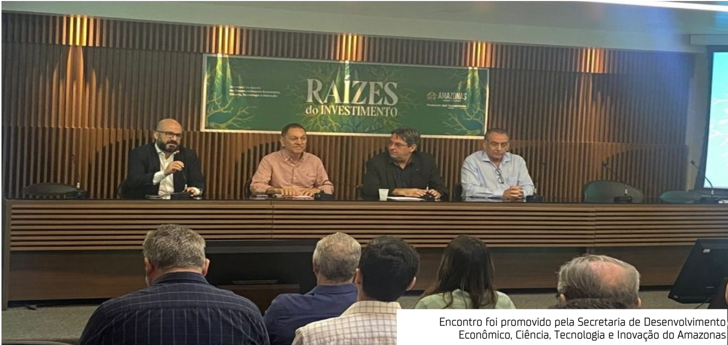
Encontro foi promovido pela Secretaria de Desenvolvimento Econômico, Ciência, Tecnologia e Inovação do Amazonas

A Tutiplast, atuante no setor termoplástico com a injeção de componentes e peças técnicas para 15 segmentos da economia, como linha branca, duas rodas, eletrônico, automotivo