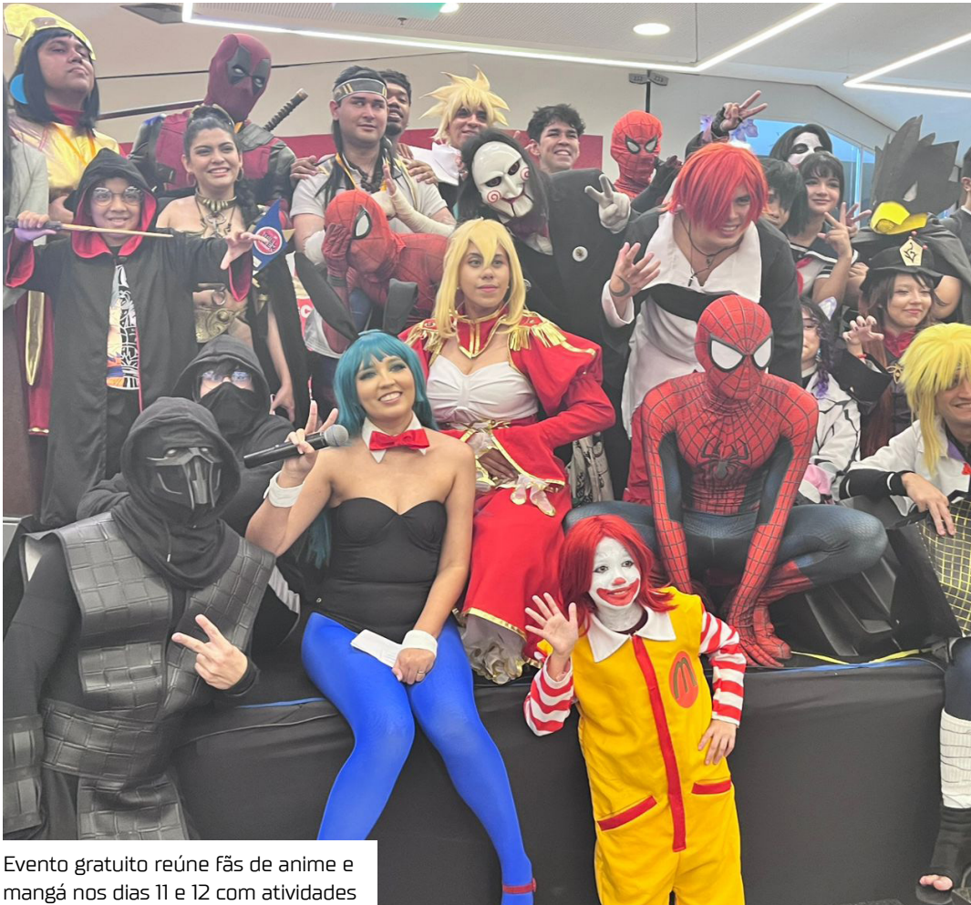
Evento gratuito reúne fãs de anime e mangá nos dias 11 e 12 com atividades

O ambiente contará com espaço temático para fotos, áreas de convivência, atividades interativas e um cronograma voltado à valorização do trabalho de artistas locais e pequenos empreendedores do setor geek.