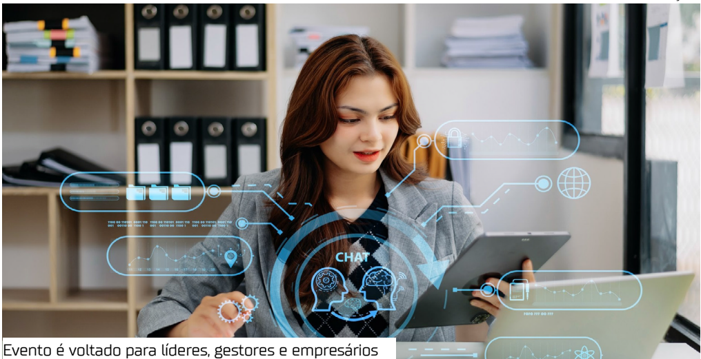
Evento é voltado para líderes, gestores e empresários

No dia 18 de outubro de 2025, o Quality Hotel Manaus sediará o Viver de IA Experience Amazônia, uma imersão exclusiva que promete transformar a forma como empresários e gestores aplicam a Inteligência Artificial (IA) em seus negócios.