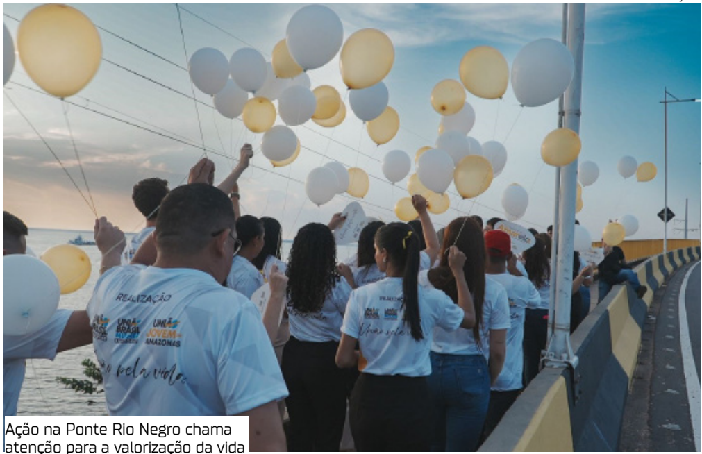
Ação na Ponte Rio Negro chama atenção para a valorização da vida

O União Brasil Amazonas, presidido pelo governador Wilson Lima, realizou segunda-feira (8) uma blitz na Ponte Rio Negro, em alusão ao Setembro Amarelo, campanha nacional de valorização da vida e de prevenção ao suicídio. O ato reuniu mais de 100 pessoas, entre dirigentes estaduais, parlamentares e representantes de secretarias do governo.