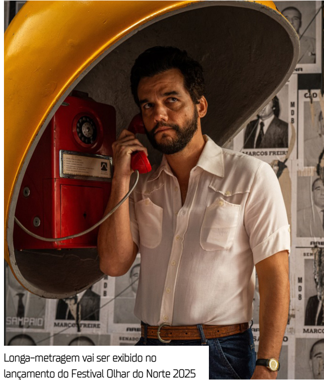
Longa-metragem vai ser exibido no lançamento do Festival Olhar do Norte 2025

O longa-metragem "O Agente Secreto", um dos seis finalistas que concorrem a uma vaga para representar o Brasil na categoria de Melhor Filme Internacional no Oscar 2026 e vencedor dos prêmios de Melhor Direção para Kleber Mendonça Filho e Melhor Ator para Wagner Moura no 78º Festival de Cannes, vai ser exibido em Manaus, no lançamento do 7º Festival de Cinema da Amazônia – Olhar do Norte. A sessão especial para convidados acontece no dia 16 de setembro, às 20h30, no Kinoplex Amazonas Shopping, na avenida Djalma Batista, 482, Chapada.