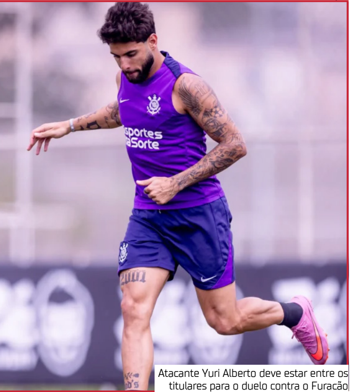
Atacante Yuri Alberto deve estar entre os titulares para o duelo contra o Furacão

pelas Eliminatórias Sul-Americanas, são dúvidas. Hugo (Brasil) deve ficar à disposição. Provável escalação Sendo assim, a provável escalação do Corinthians tem: Hugo Souza; Matheuzinho, André Ramalho, Gustavo Henrique e Matheus Bidu; Maycon, Charles (José Martínez), Breno Bidon e Rodrigo Garro; Memphis Depay (Gui Negão) e Yuri Alberto.