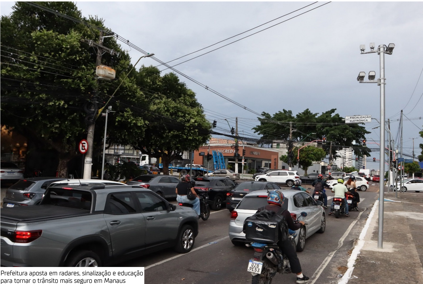
Prefeitura aposta em radares, sinalização e educação para tornar o trânsito mais seguro em Manaus

“A implantação da fiscalização eletrônica tem sido uma ferramenta fundamental para salvar vidas. Aliada às ações de educação no trânsito, reforço da sinalização e operações integradas, conseguimos reduzir os índices de acidentes graves e fatais. A meta da Prefeitura de Manaus