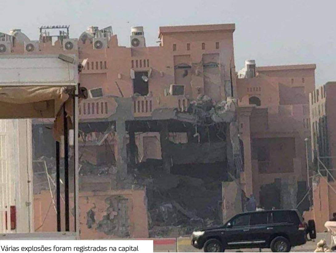
Várias explosões foram registradas na capital

O governo do Qatar, que atua como mediador no conflito entre Israel e Hamas, classificou a ação como "covarde e criminoso". Em comunicado nas redes sociais, Al Ansari afirmou que o país "não tolerará esse comportamento irresponsável de Israel