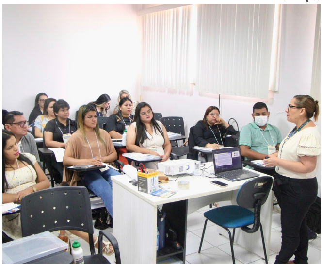
Treinamento orienta sobre atualizações no CadÚnico e uso do Sicon

A ação reforça o compromisso da Seas em qualificar os profissionais da assistência social e garantir a efetividade das políticas públicas voltadas às famílias em situação de vulnerabilidade.