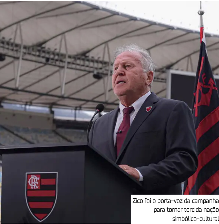
Zico foi o porta-voz da campanha para tornar torcida nação simbólico-cultural

-cultural é para representar a força cultural, social e emocional do clube dentro e fora do Brasil. Por mais que o reconhecimento por parte da ONU tenha caráter simbólico, a equipe acredita que seria uma validação internacional sobre seus torcedores. No vídeo, Zico destaca números relacionados ao alcance dos torcedores do time. “Se fôssemos um país, teríamos a 36ª maior população do mundo. Somos mais de 45 milhões de pessoas unidas por uma mesma bandeira, por uma mesma cultura e por um mesmo sentimento que atravessa gerações. O Flamengo não é apenas um clube, é uma Nação”, destaca Zico no pronunciamento. O clube divulgou um site oficial para que a torcida assine e chame a atenção para que a ONU entre com o protocolo de reconhecimento de uma nação simbólico-cultural. As assinaturas acontecem de forma digital através da página peticao.flamengo.com.br. Flamengo lidera ranking de maiores torcidas do país No final de julho, um levantamento do Ipsos-Ipec em parceria com o jornal O Globo atualizou o ranking de