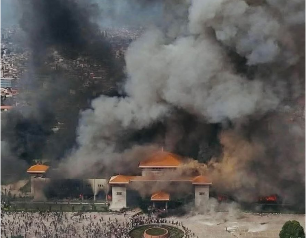
Manifestantes instauraram o caos em Catmandu

O primeiro-ministro do Nepal, KP Sharma Oli, renunciou, ontem (9), após uma onda de protestos liderados por jovens resultar em dezenas de mortos e centenas de feridos. Os manifestantes saíram às ruas contra a corrupção sistêmica, o bloqueio de redes sociais e a falta de oportunidades econômicas, desafiando o toque de recolher em várias cidades, inclusive na capital, Katmandu.