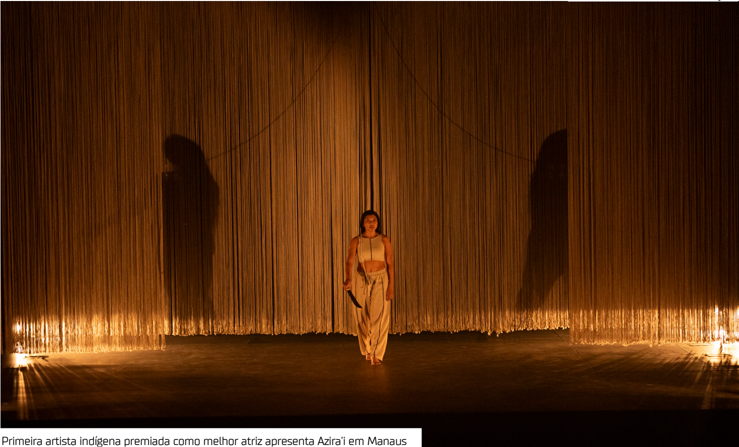
Primeira artista indígena premiada como melhor atriz apresenta Azira'i em Manaus

Espetáculo ganhou os principais prêmios Brasileiros de Teatro