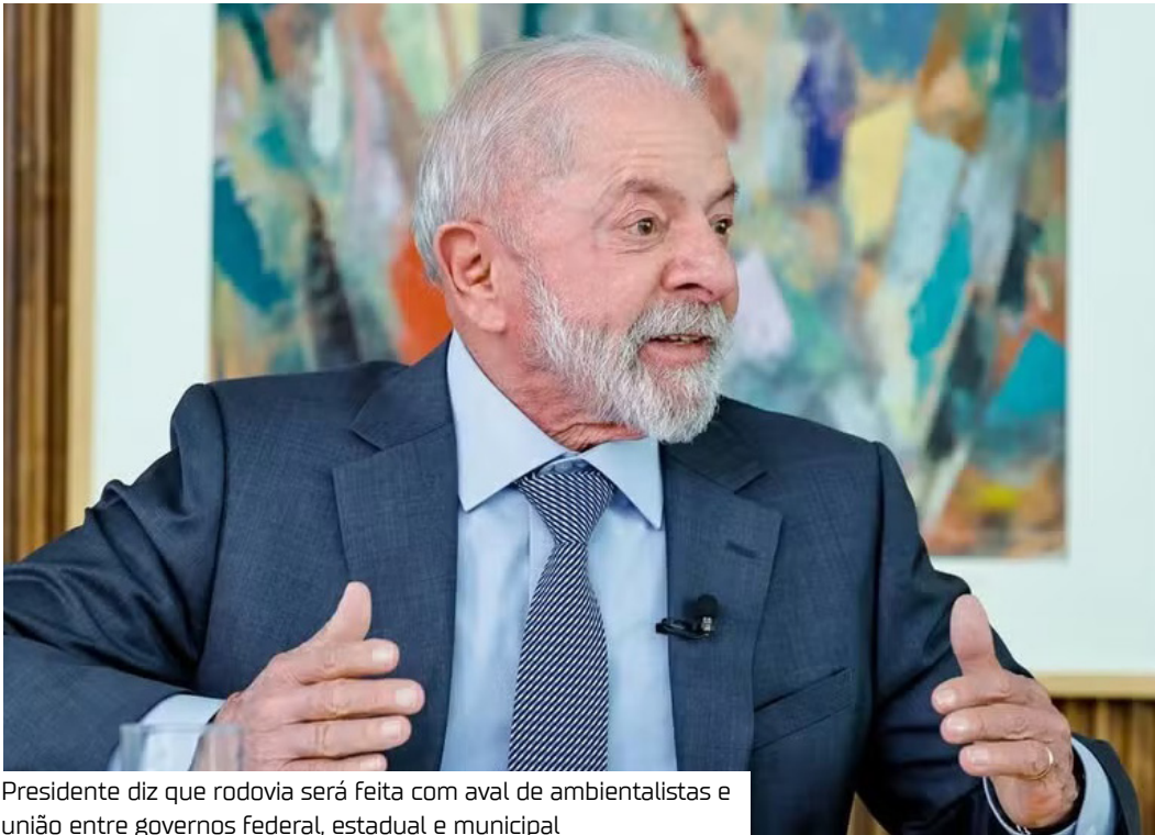
Presidente diz que rodovia será feita com aval de ambientalistas e união entre governos federal, estadual e municipal

O senador Marcos Rogério (PL) disse que Marina deveria “se por no seu lugar”. Já o senador Plínio Valério afirmou que respeita a mulher, mas não a ministra. Marina pediu um pedido de desculpas que não veio e decidiu deixar a sessão. Na audiência, o senador Omar Aziz defendeu o asfaltamento da BR-319: “Queremos, sim! Nós temos o direito de passear na BR-319, e não é a senhora que não vai permitir que a gente passeie na BR-319. A senhora