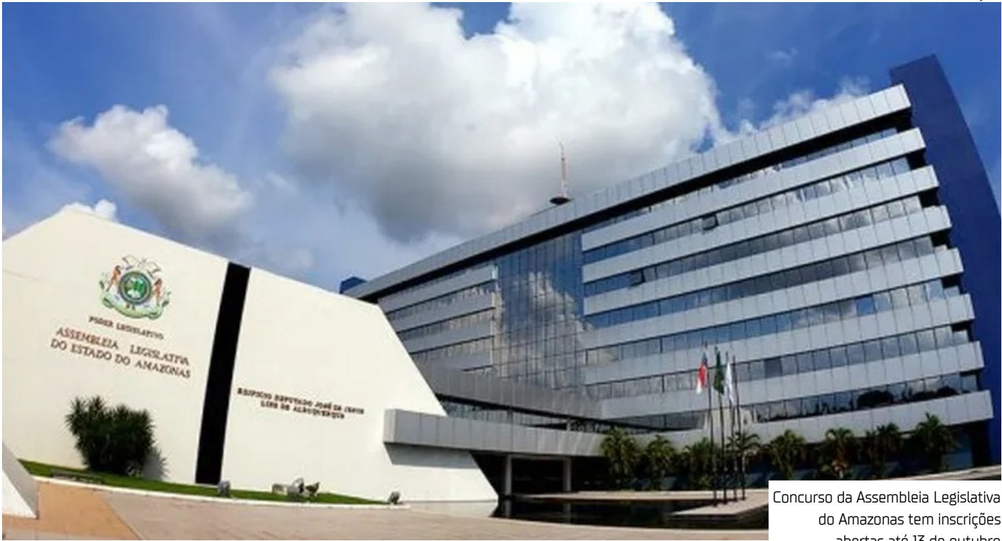
Concurso da Assembleia Legislativa do Amazonas tem inscrições abertas até 13 de outubro

“A partir de amanhã (quarta) estará iniciando o prazo para inscrições no concurso público da Aleam. As inscrições poderão ser realizadas até o dia 13 de outubro. Esse, certamente, é um avanço para todos nós, é um marco dessa gestão e para todos os 24 deputados e deputadas estaduais. Aqueles que tiverem dificuldades para fazer a inscrição podem ir até a