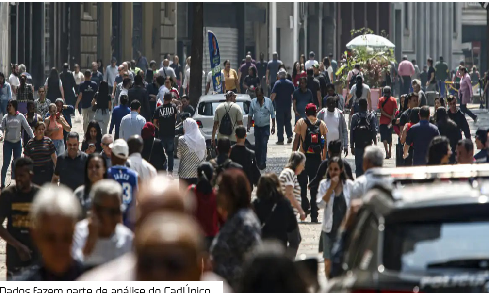
Dados fazem parte de análise do CadÚnico