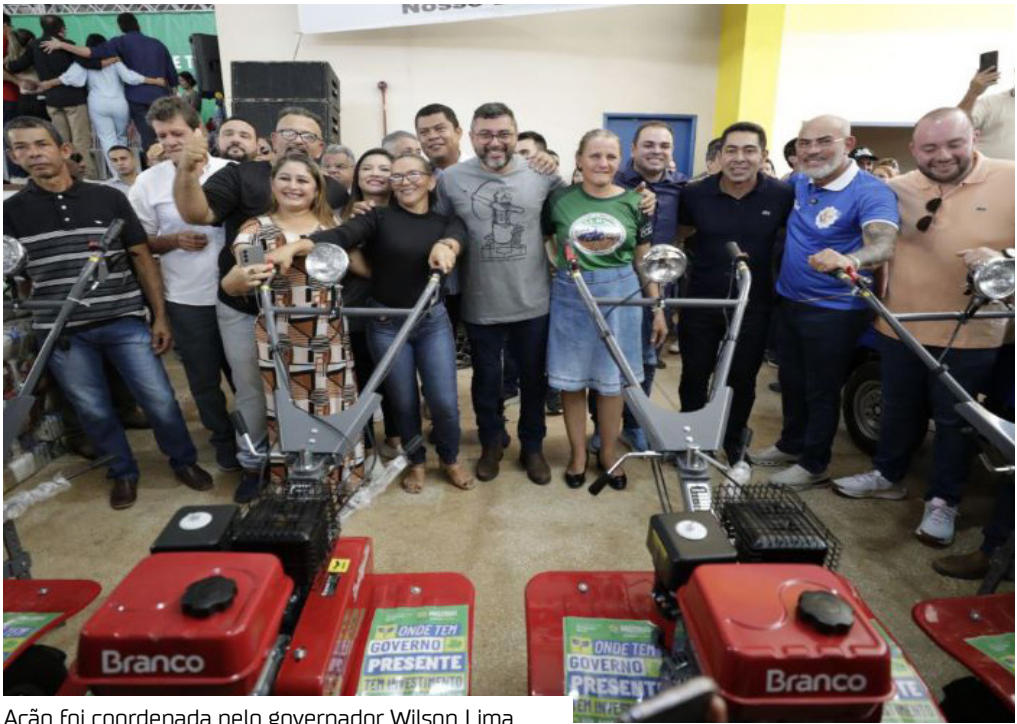
Ação foi coordenada pelo governador Wilson Lima

Produtores rurais de Presidente Figueiredo (a 117 quilômetros de Manaus) receberam implementos agrícolas e certificados digitais. A entrega foi feita na segunda-feira (22), pelo governo do Amazonas, por meio da Secretaria de Estado de Produção Rural (Sepror). Os investimentos somam mais de R$ 64,2 mil.