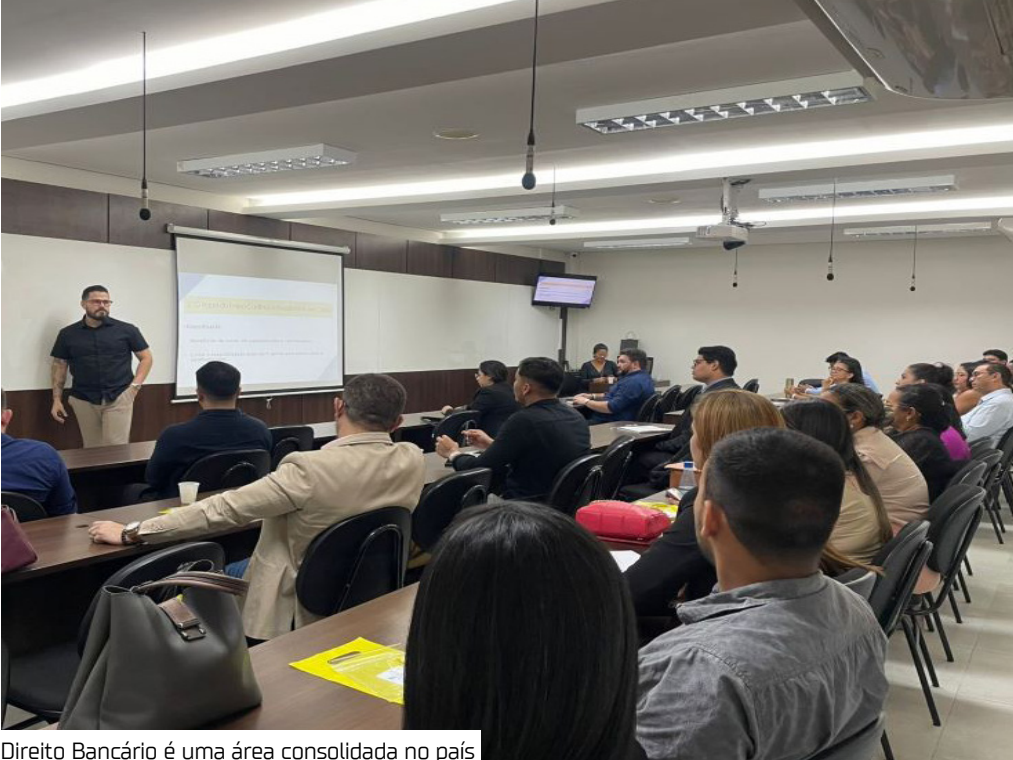
Direito Bancário é uma área consolidada no país