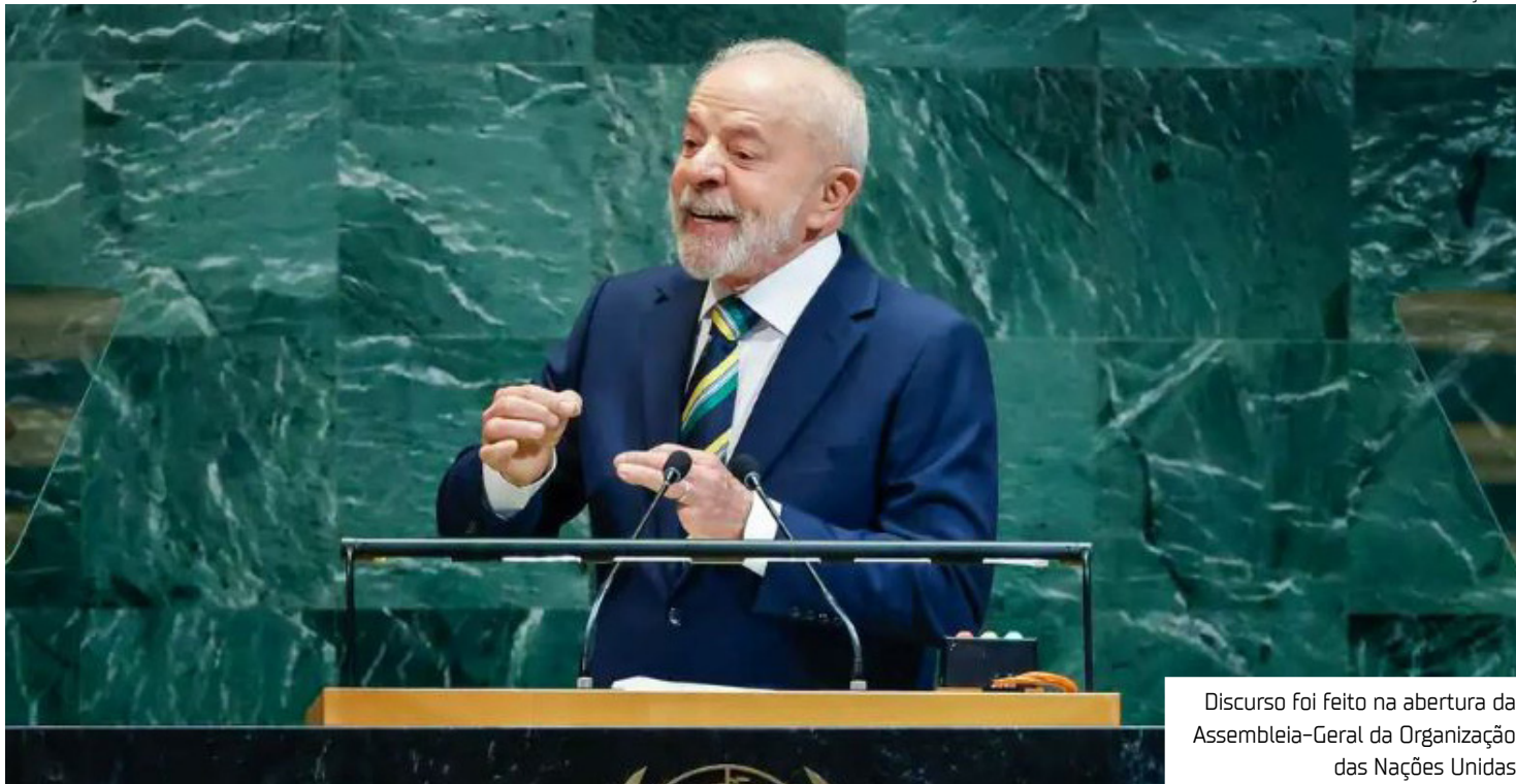
Discurso foi feito na abertura da Assembleia-Geral da Organização das Nações Unidas

Ao discursar na abertura da Assembleia-Geral da Organização das Nações Unidas (ONU), o presidente Luiz Inácio Lula da Silva criticou as sanções unilaterais dos Estados Unidos afirmando que o mundo assiste ao aumento do autoritarismo. “O multilateralismo está diante de nova encruzilhada. A autoridade desta organização [ONU] está em xeque. Assistimos à consolidação de uma desordem internacional marcada por seguidas concessões a política do poder, atentados à soberania, sanções arbitrárias. E intervenções unilaterais estão se tornando regra.” Para Lula, existe “um evidente paralelo” entre a crise do multilateralismo e o enfraquecimento da de-