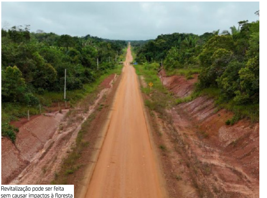
Revitalização pode ser feita sem causar impactos à floresta