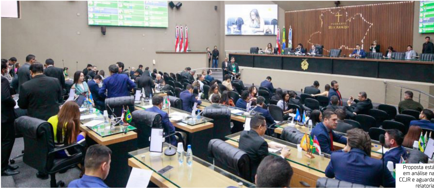
Proposta está em análise na CCJR e aguarda relatoria

implicará penalidades como a rescisão imediata do contrato, a devolução integral dos valores recebidos a título de cachê, patrocínio, apoio cultural ou equivalente, além da inabilitação do artista, pelo prazo de cinco anos, para celebrar novos contratos, convênios ou parcerias financiadas pelo Estado.