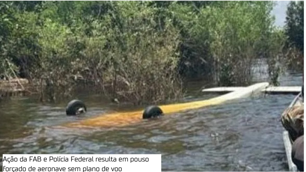
Ação da FAB e Polícia Federal resulta em pouso forçado de aeronave sem plano de voo