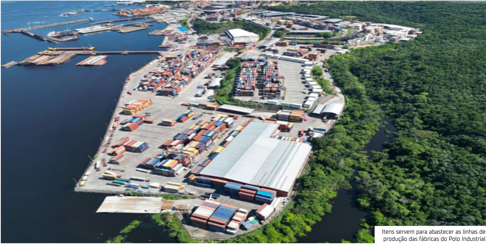
Itens servem para abastecer as linhas de produção das fábricas do Polo Industrial