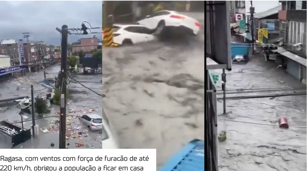
Ragasa, com ventos com força de furacão de até 220 km/h, obrigou a população a ficar em casa

Hong Kong foi fechada ontem (23) devido à passagem do supertufão Ragasa, o ciclone tropical mais poderoso do mundo neste ano. As autoridades pediram à população que ficasse em casa, enquanto a maioria dos voos de passageiros foi suspensa até quinta-feira (26).