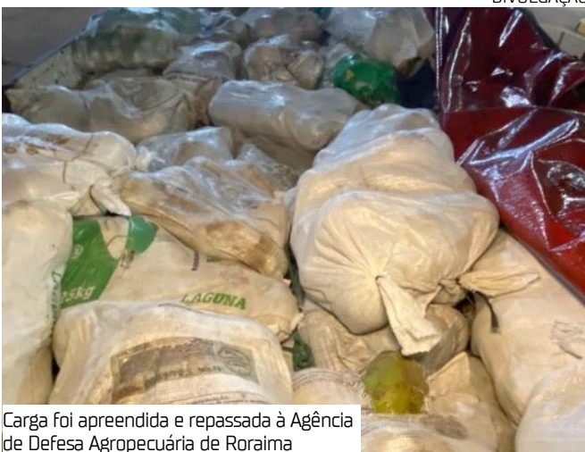
Carga foi apreendida e repassada à Agência de Defesa Agropecuária de Roraima

cia Militar de Roraima e do Ministério da Agricultura e Pecuária (Mapa), os fiscais agropecuários da Adaf também identificaram que a carga de banana estava sendo transportada em cachos, o que é proibido em todo território nacional, devido a possibilidade de disseminação de pragas, entre elas a Sigatoka negra. Desde 2023, Roraima está proibida pelo Mapa de transportar frutos hospedeiros da mosca-da-carambola para outros estados.