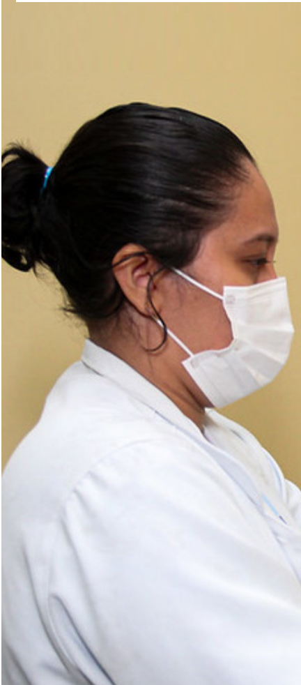
Manaus é destaque no ranking do CLP por excelência em vacinação