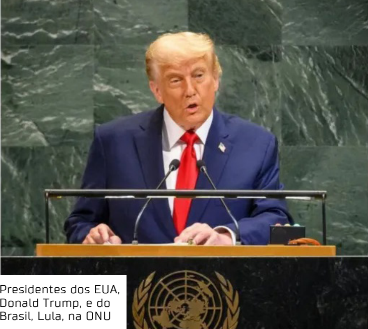
Presidentes dos EUA, Donald Trump, e do Brasil, Lula, na ONU

- Suspensão de vistos de ministros e assessores brasileiros;