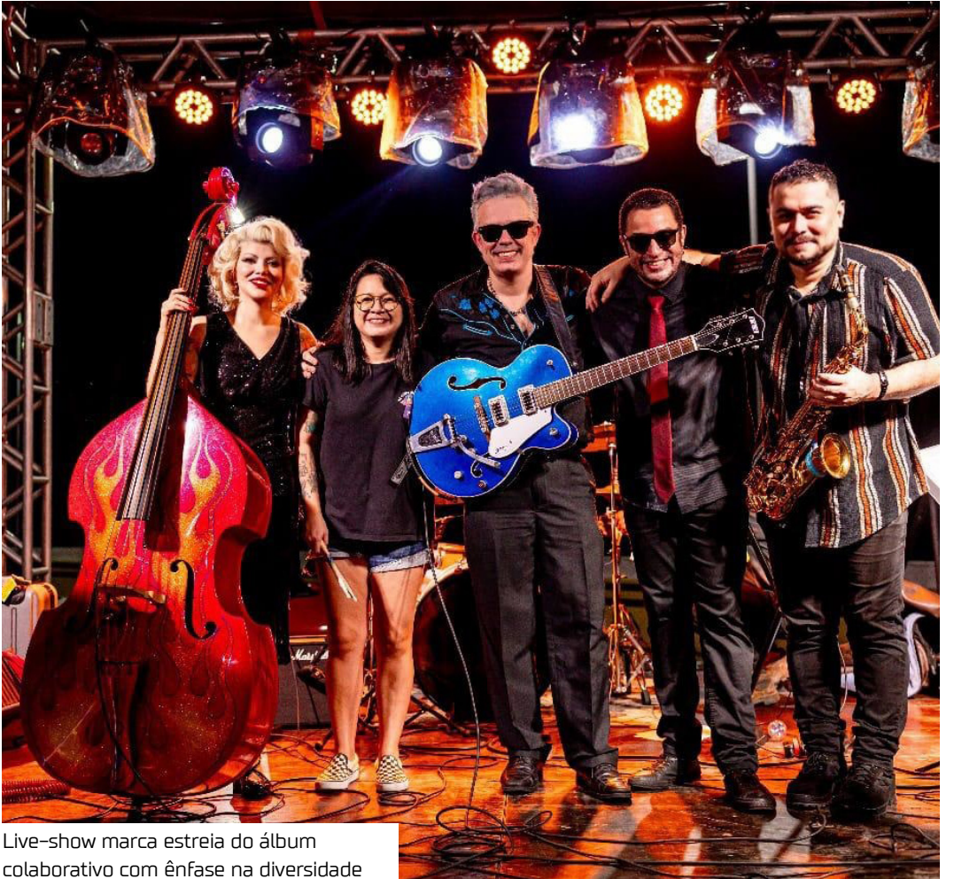
Live-show marca estreia do álbum colaborativo com ênfase na diversidade

O projeto tem o apoio do Governo Federal e da Prefeitura de Manaus, por meio do Conselho Municipal de Cultura (Concultura) e da Fundação Municipal de Cultura, Turismo e Eventos (Manauscult), através da Política Nacional Aldir Blanc (PNAB).