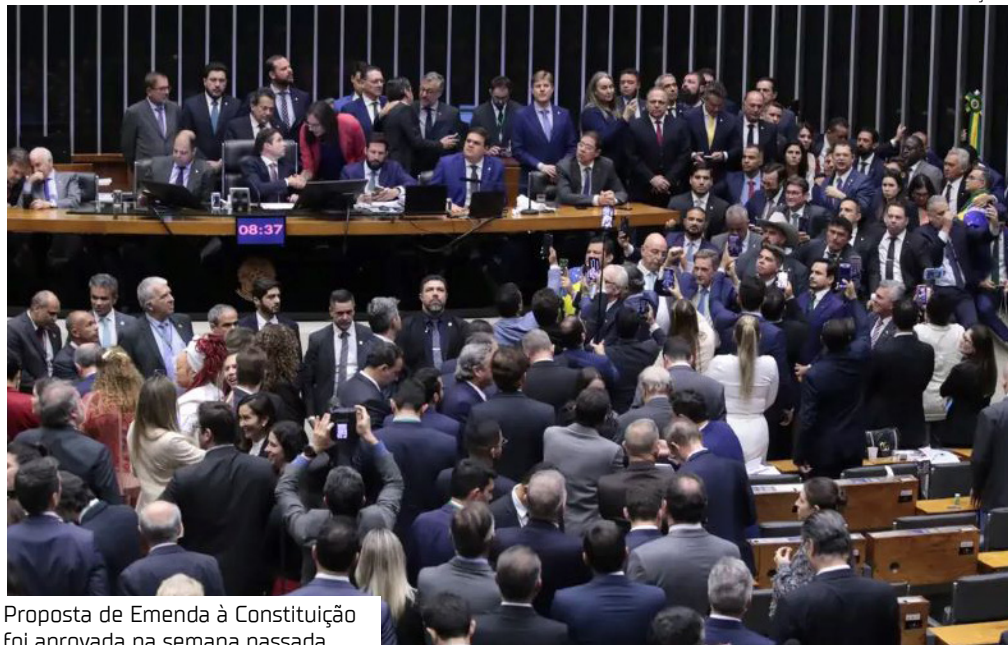
Proposta de Emenda à Constituição foi aprovada na semana passada

A Comissão de Constituição e Justiça (CCJ) pode votar hoje [24] a proposta que exige autorização prévia da Câmara dos Deputados ou do Senado para abertura de ação penal contra parlamentares. A reunião está marcada para as 9h e tem seis itens na pauta. A Proposta de Emenda à Constituição (PEC) 3/2021 foi aprovada na semana passada pela Câmara. O relator da matéria na CCJ é o senador Alessandro Vieira (MDB-SE). Em entrevistas, o parlamentar anunciou que vai votar pela rejeição da matéria. O presidente da CCJ, senador Otto Alencar (PSD-BA), descartou a possibilidade de aprovação da proposta. Para ele, a matéria representa “uma falta de respeito ao eleitor e ao povo brasileiro”.