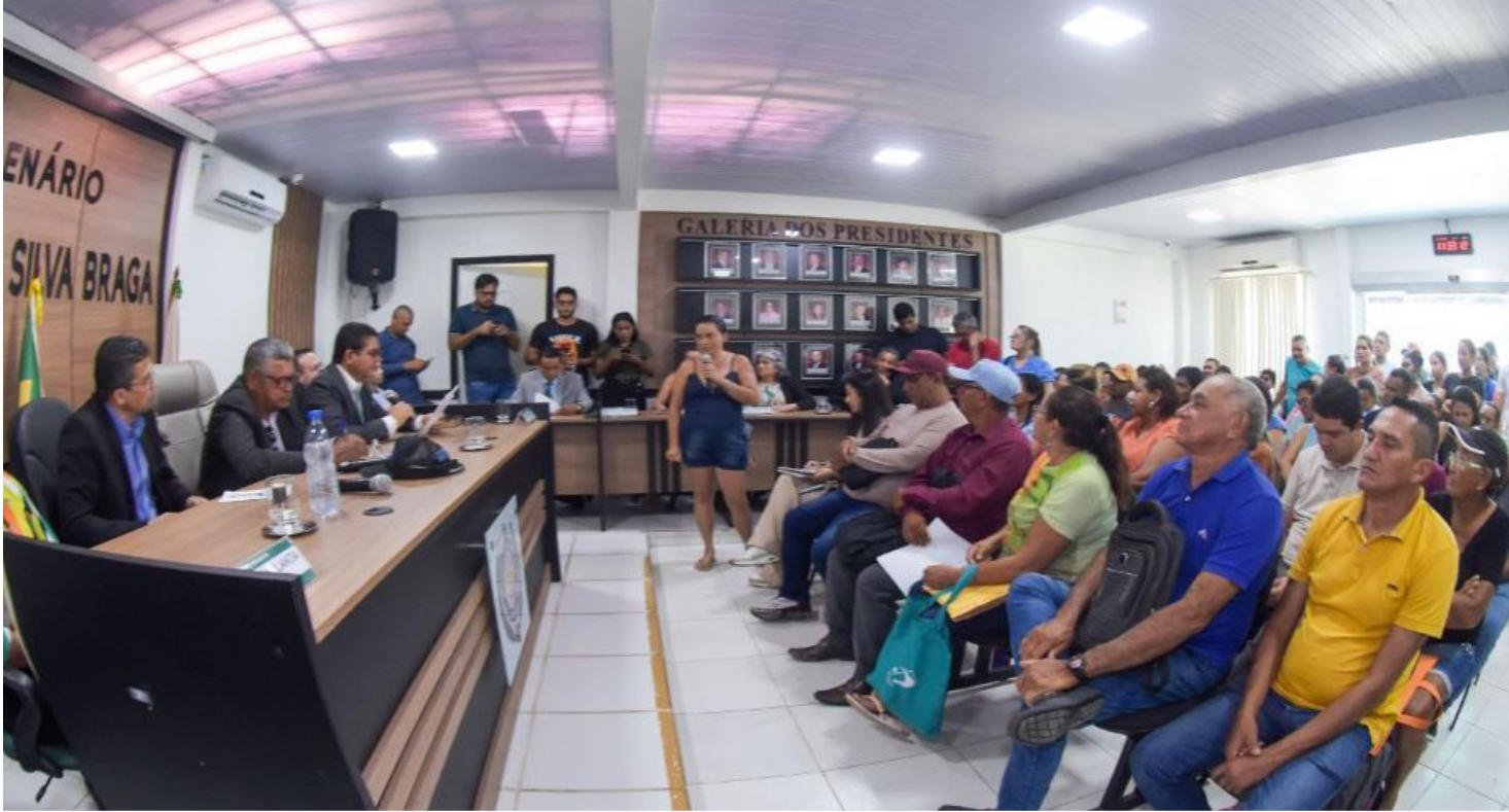
Em audiência pública realizada na Câmara Municipal do Careiro da Várzea, moradores relataram as constantes falhas no fornecimento de energia

Além dos cortes no fornecimento, as constantes oscilações de energia também têm causado prejuízos financeiros aos moradores, que relatam a queima de eletrodomésticos e equipamentos eletrônicos. “Nós pagamos nossa conta, mas nunca temos energia. Não estamos pedindo favor, estamos exigindo que nossos direitos como consumidores sejam respeitados. Não aguentamos mais viver sem energia. E, quando temos, ela vem instável e acaba queimando nossas geladeiras, televisores, ferros de passar,