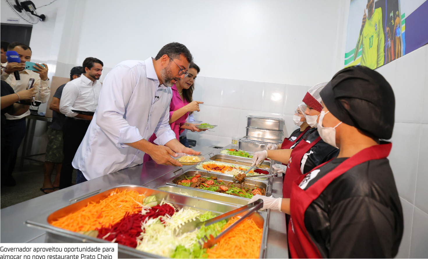
Governador aproveitou oportunidade para almoçar no novo restaurante Prato Cheio

A reinauguração contou com a presença do presidente da Assembleia Legis-