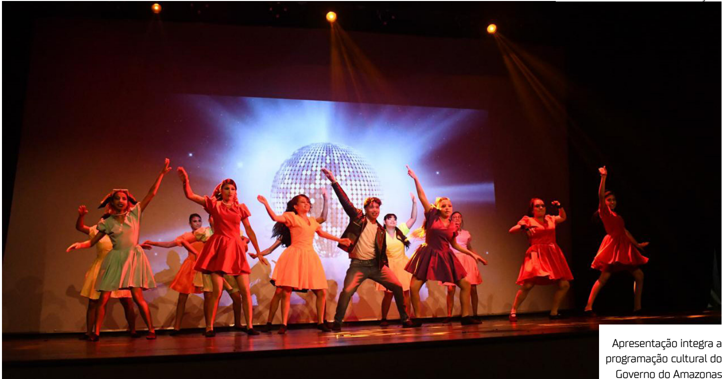
Apresentação integra a programação cultural do Governo do Amazonas