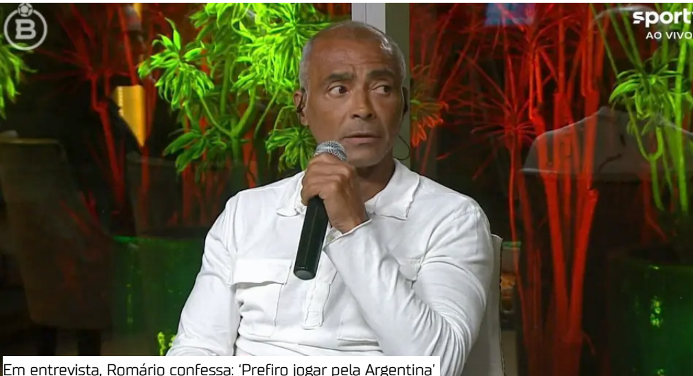
Em entrevista, Romário confessa: 'Prefiro jogar pela Argentina'

das e apenas três contra a Argentina (um empate, uma vitória e uma derrota). Sua melhor atuação contra os rivais foi na Copa América de 1989, quando anotou o gol da vitória diante 90 mil torcedores no Maracanã. Na entrevista ao programa Panela SporTV, Romário também cometeu uma gafe. Durante sua participação, o carioca, ao tentar explicar fala icônica, foi surpreendido por um vídeo, que desmentiu sua versão. Atualmente, Romário divide as funções de Senador da República e Presidente do América-RJ.