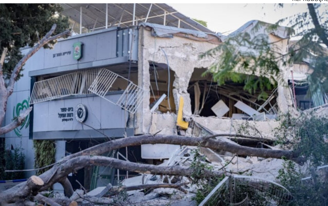
Ataques também atingem o Qatar e elevam tensão com grupos apoiados pelo Irã

Bombardeios de Israel contra o lêmen mataram pelo menos 35 pessoas e feriram outras 131, ontem (10), informou em comunicado o Ministério da Saúde dos rebeldes houthis, grupo armado que controla boa parte do país. Segundo os houthis, os ataques se concentraram na capital, Sanaa, e na província de Al-Jawf, no norte. A ofensiva, de acordo com as Forças Armadas de Israel, teve como alvo bases militares, depósitos de combustível e um “centro de propaganda” da milícia iemenita, apoiada pelo Irã. O grupo armado afirmou que os alvos atingiram apenas civis, incluindo jornalistas e sedes de veículos de comunicação. Moradores de Sanaa ouvidos pela agência de notícias Reuters disseram ter ouvido explosões nos arredores da capital e no Ministério da Defesa dos rebeldes. O ataque ocorre pouco tempo depois de um bombardeio israelense matar o primeiro-ministro e membros do governo houthi em Sanaa. A autoridade do grupo armado sobre o