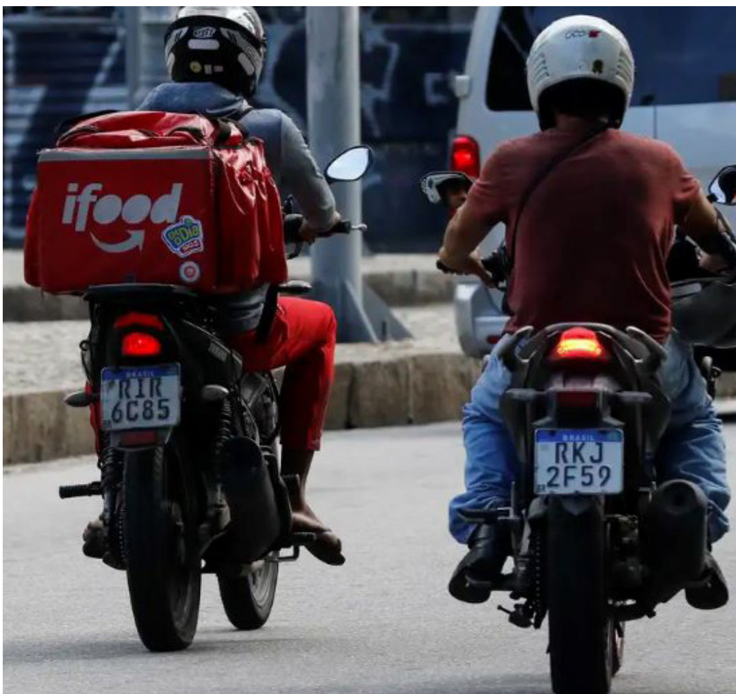
Pela proposta, empresas ficam obrigadas a conceder vale-refeição de pelo menos R$ 20 a cada quatro horas de trabalho

“A aprovação deste Projeto de Lei não só corrige uma grave injustiça com a categoria dos entregadores, mas, sobretudo, reafirma o primado do trabalho e o valor social da livre iniciativa, em conformidade com o postulado da máxima efetividade dos direitos fundamentais”, argumentou.