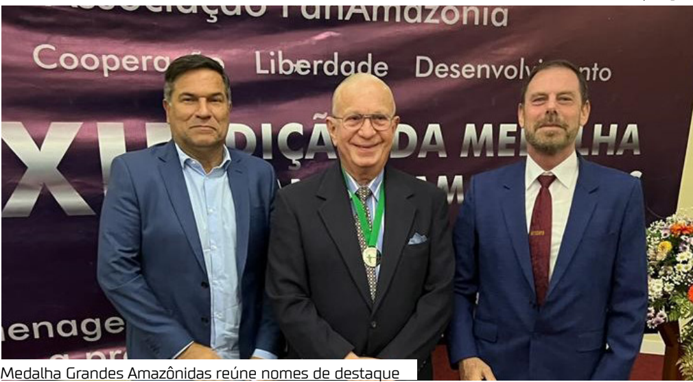
Medalha Grandes Amazônidas reúne nomes de destaque