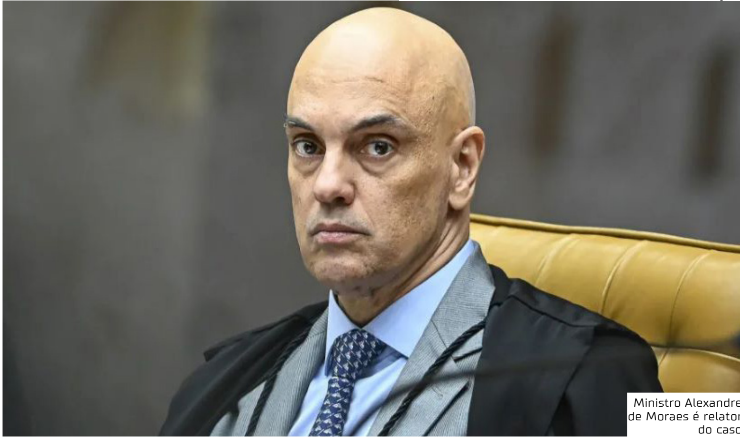
Ministro Alexandre de Moraes é relator do caso

cia do STF para julgar o caso já que não há pessoas que tenham foro especial na corte.