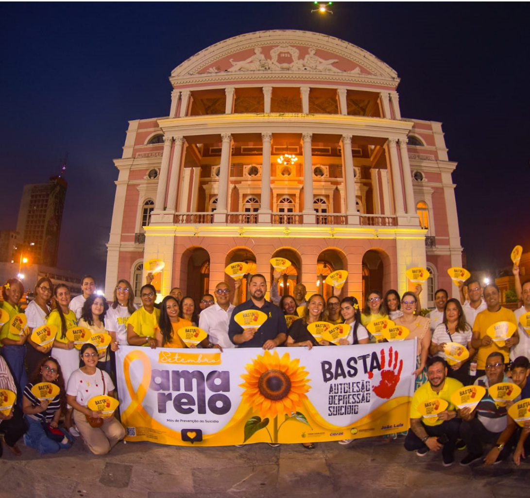
Teatro Amazonas ganhou iluminação amarela em referência ao mês de prevenção ao suicídio

Ao longo de setembro, a Fenapred realiza uma série de atividades, incluindo palestras, seminários, distribuição de materiais informativos em escolas, universidades e órgãos públicos, além de visitas a comunidades ribeirinhas e indígenas, tanto na capital quanto no interior.