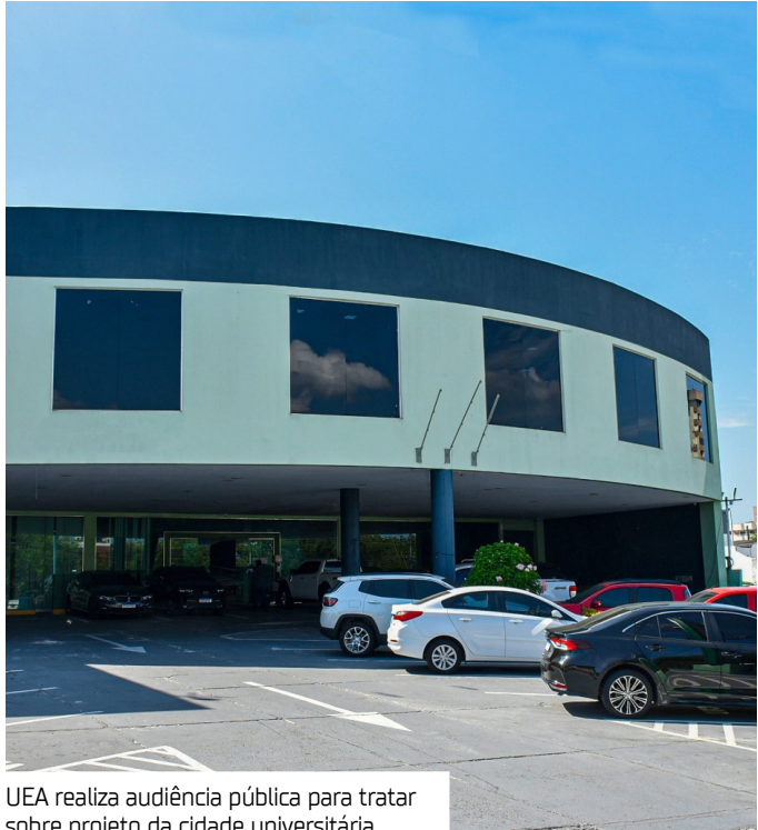
UEA realiza audiência pública para tratar sobre projeto da cidade universitária

Em cumprimento ao Acórdão n.º 577/2020 do Tribunal Pleno do Tribunal de Contas do Estado do Amazonas (TCE/AM), o encontro terá caráter consultivo e tem como objetivo colher sugestões, opiniões e contribuições de estudantes, docentes, técnicos, especialistas