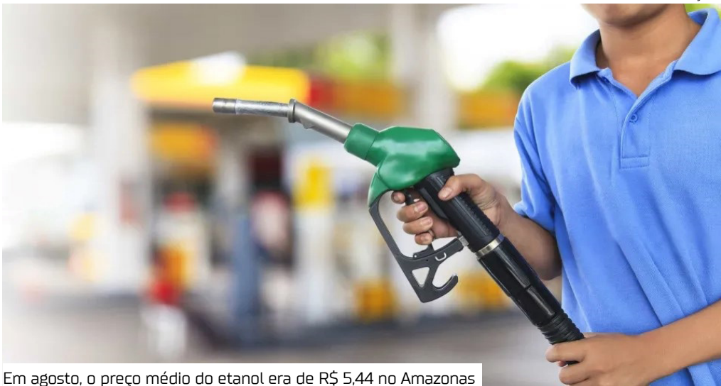
Em agosto, o preço médio do etanol era de R$ 5,44 no Amazonas

Os preços médios do etanol hidratado subiram em 13 Estados, caíram em nove e ficaram estáveis em quatro e no Distrito Federal.