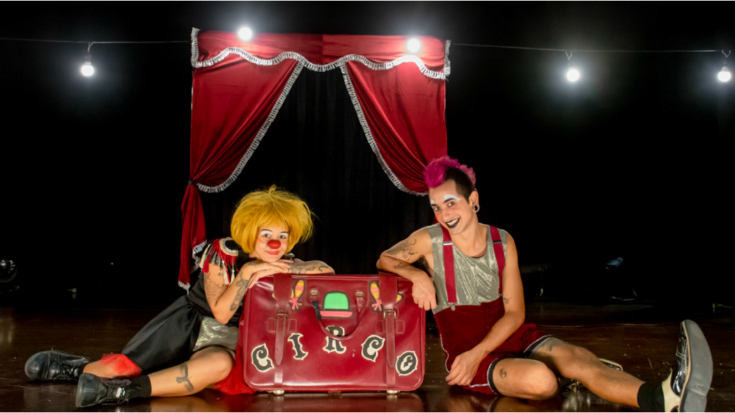
A programação dos eventos tem entrada gratuita