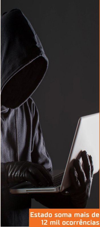
Estado soma mais de 12 mil ocorrências