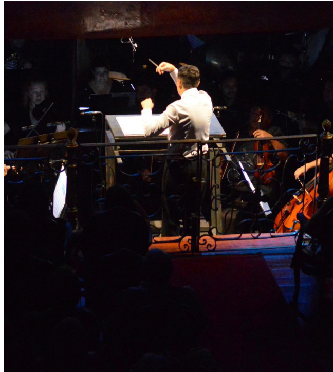
Espectáculo integra programação de popularização cultural

O palco do Teatro Amazonas será tomado, hoje [11], por um espetáculo inédito no Brasil: “Trilogia Tudor: As Três Rainhas”, uma imersão na riqueza cultural, dramática e histórica da dinastia que marcou a Inglaterra entre os séculos XV e XVI. A montagem reúne o Coral do Amazonas e a Amazonas Filarmônica na execução de trechos de três óperas de Gaetano Donizetti dedicadas às rainhas Ana Bolena, Mary Stuart e Elizabeth I.