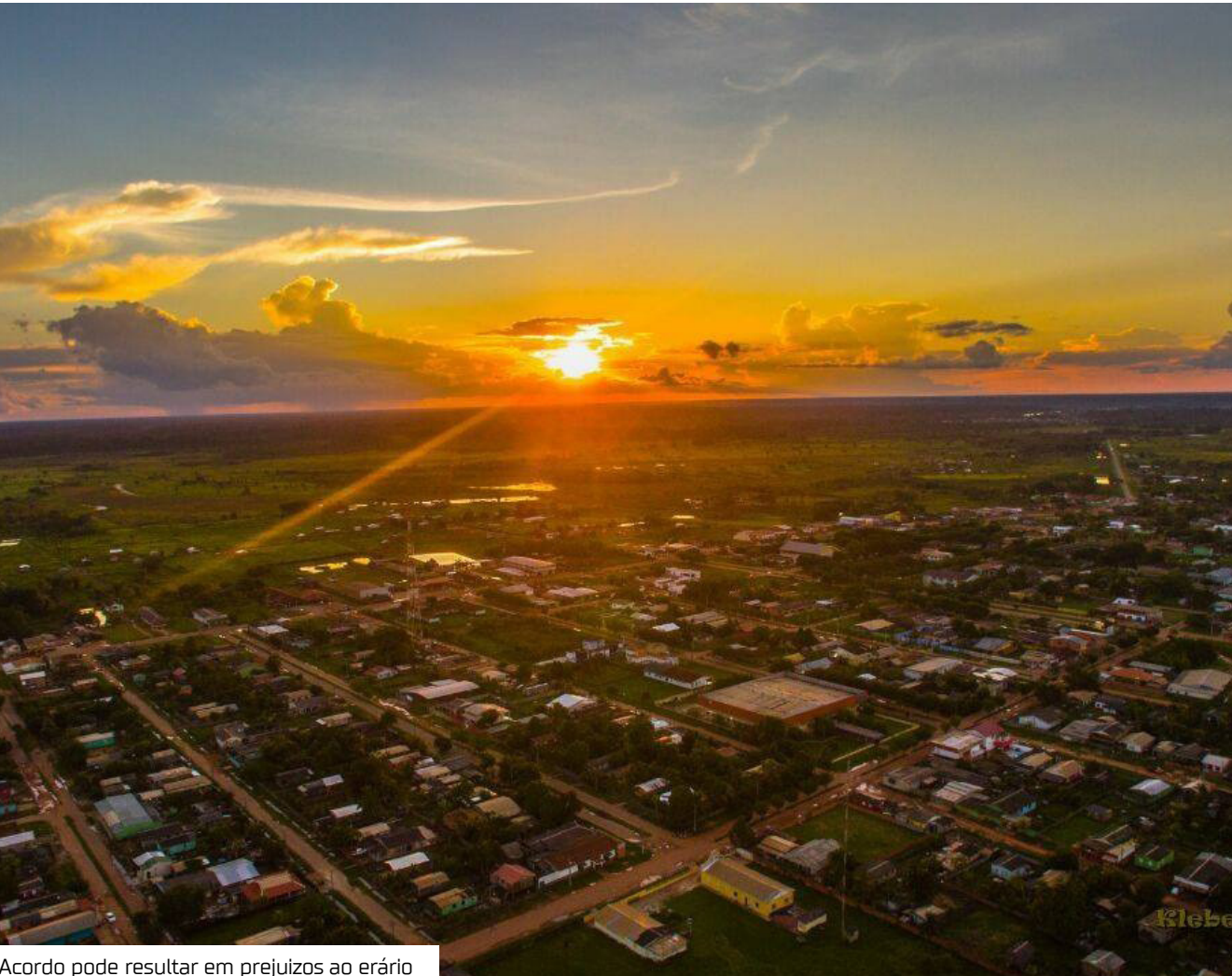
Acordo pode resultar em prejuízos ao erário

Um inquérito civil do Ministério Público do Amazonas (MPAM) vai apurar possíveis irregularidades em um contrato feito em Boca do Acre (a 1.406 quilômetros de Manaus). A ação diz respeito a um acordo firmado entre a prefeitura e uma empresa locadora de veículos, envolvendo suposto ato de improbidade administrativa e prejuízo ao erário. O procedimento decorre de um ofício do Tribunal de Contas do Amazonas (TCE/AM), reportando indícios de fraude no procedimento