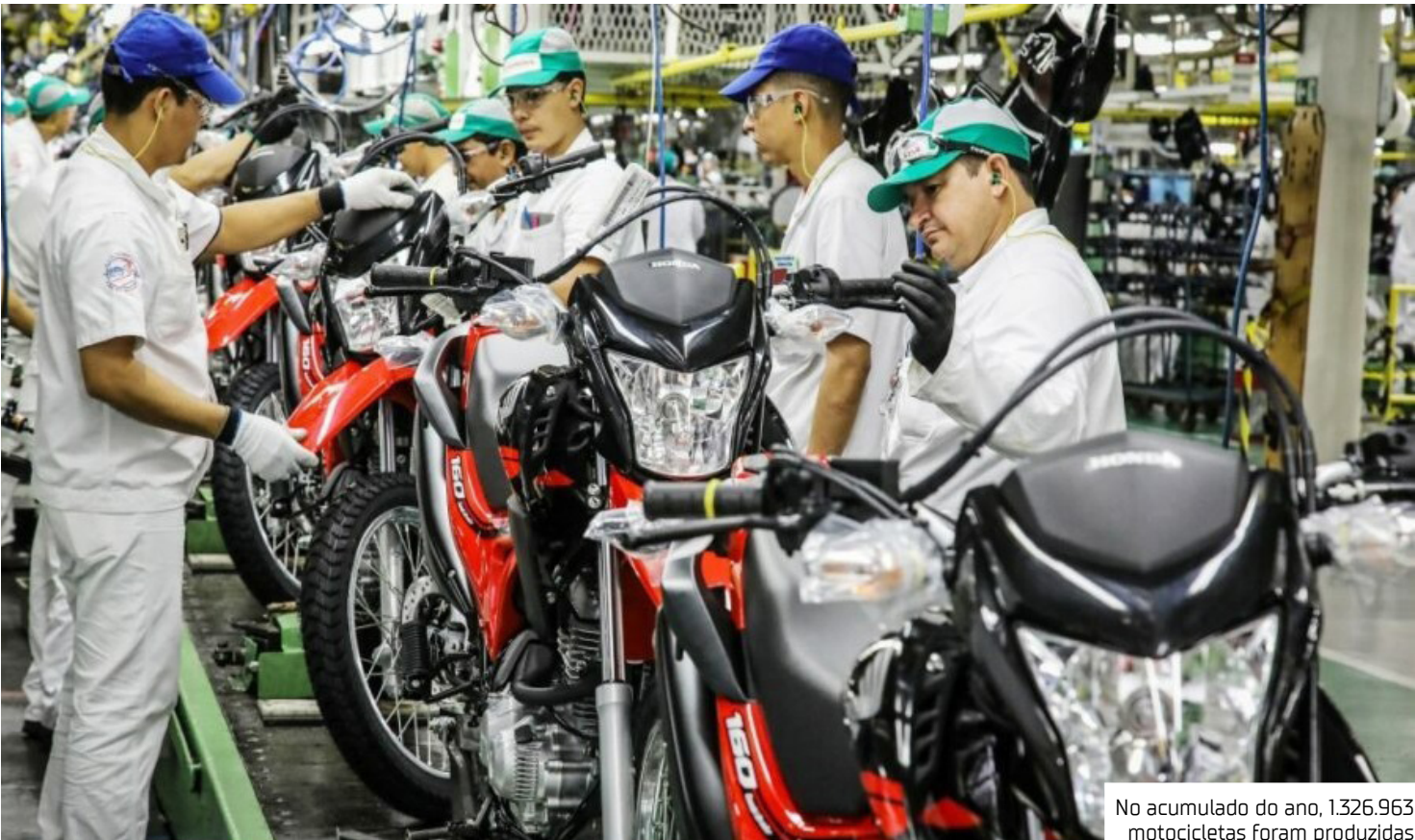
No acumulado do ano, 1.326.963 motocicletas foram produzidas

Os modelos de baixa cilindrada continuam liderando a produção nacional. Em agosto, foram fabricadas 146.067 unidades, o que representa 78,6% do total. Na sequência, vieram as motocicletas de média cilindrada, com 34.557 unidades