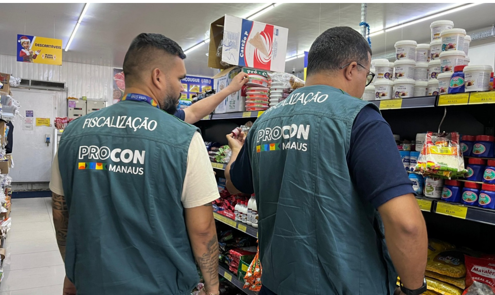
Fiscalização do Procon Manaus identificou aumento no valor da cesta básica