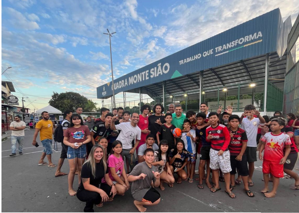
Bairro Novo Israel recebe segunda edição da “Rua do Esporte”