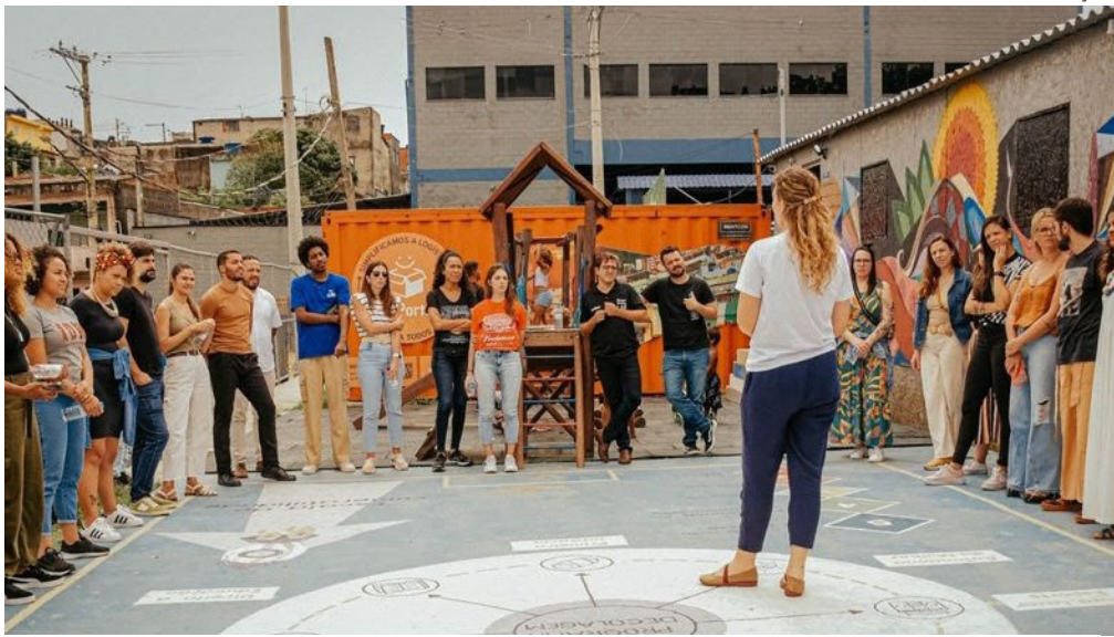
instituições do estado se unem a outras de 21 unidades da federação

Um novo ciclo de transformação social começou em agosto: 80 organizações selecionadas pela Ambev deram início à etapa de formação e mentoria do VOA — programa de voluntariado da companhia. Realizada em parceria com a Ago Social, a iniciativa contempla projetos de 22 estados brasileiros que atuam com empregabilidade e empreendedorismo, nas áreas de desenvolvimento, educação e geração de renda. Juntas, essas organizações já impactam mais de 230 mil pessoas em todo o país.