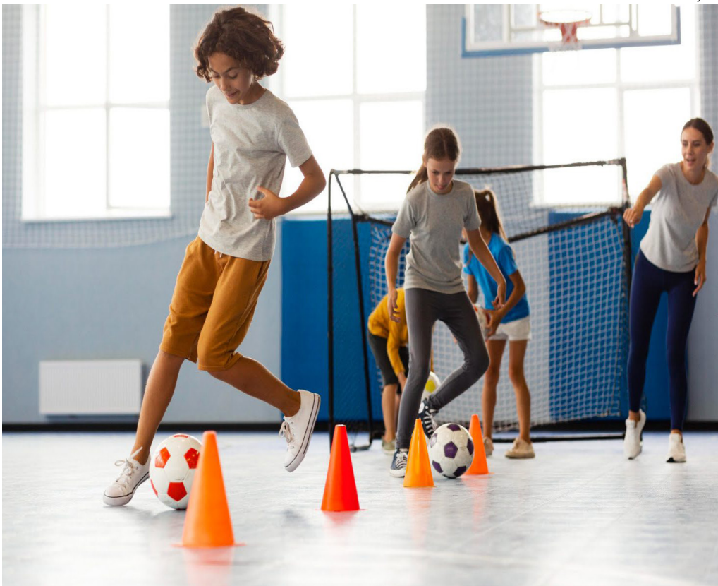
Proposta estabelece a criação de oficinas de artes e atividades esportivas