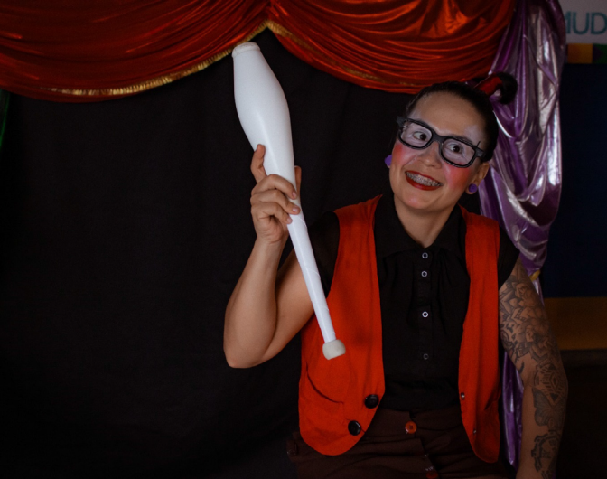
Projeto gratuito é pensado para aproximar crianças, adultos e idosos

Já imaginou aprender a manipular esferas, argolas, claves ou tecidos de forma prática e acessível? O público do “#SouManaus Passo a Paço 2025” – que acontece de 05 a 07 de setembro no Centro Histórico da capital amazonense – terá essa oportunidade graças ao espaço de malabarismo funcional “Laboratório Rojo”.