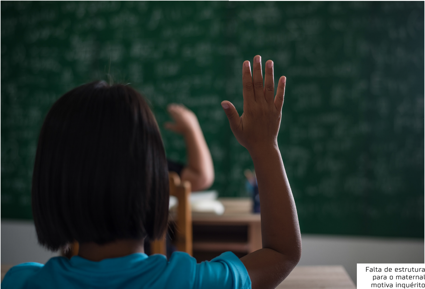
Falta de estrutura para o maternal motiva inquérito

A iniciativa do MPAM tem como base o artigo 208 da Constituição Federal, que estabelece o dever do Estado em garantir a educação básica obrigatória e gratuita dos 4 aos 17 anos, bem como o acesso à educação infantil em creches e pré-escolas para crianças de até cinco anos. Também está prevista a oferta de programas suplementares como transporte, alimentação, material didático e assistência à saúde.