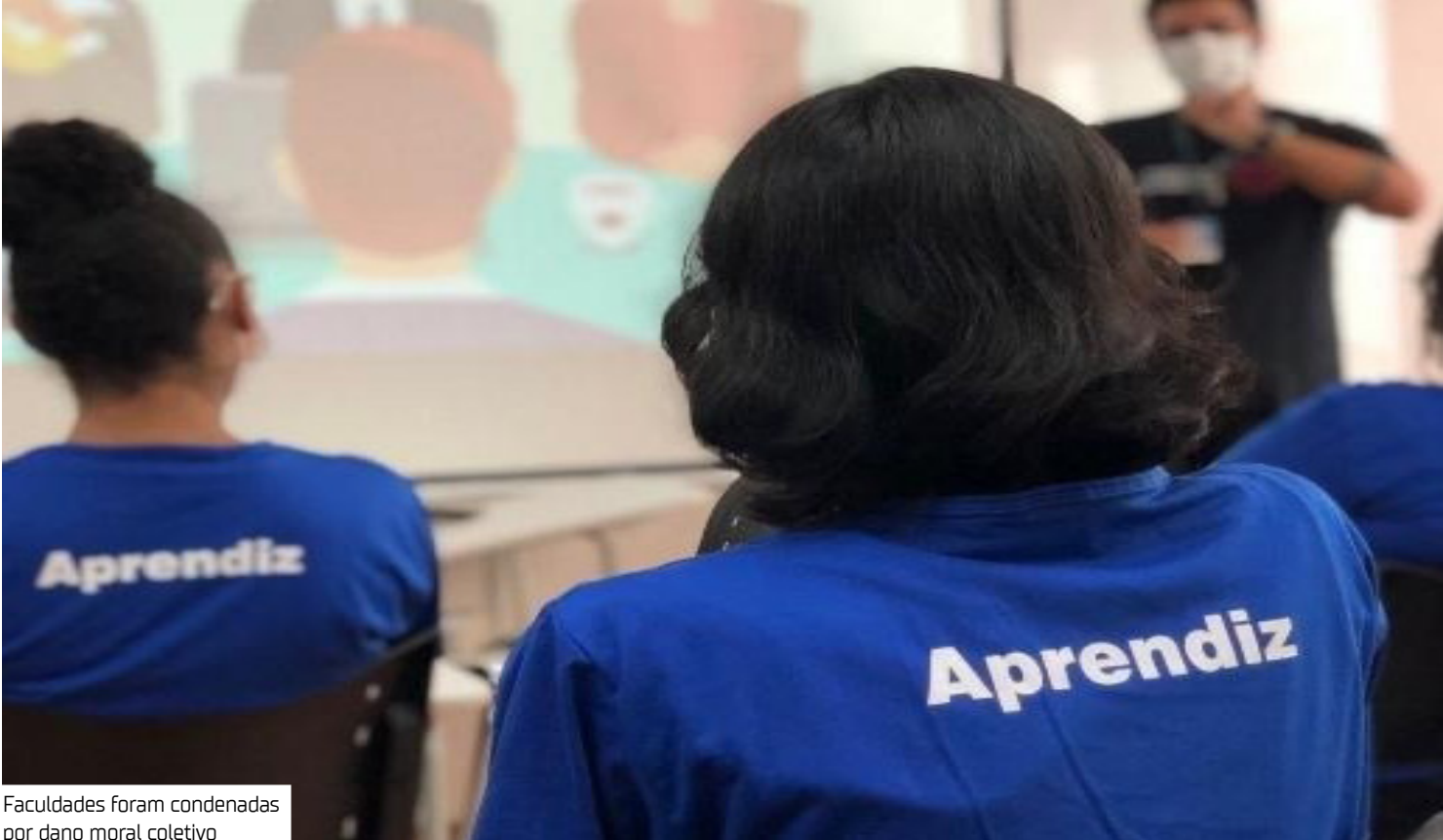
Faculdades foram condenadas por dano moral coletivo