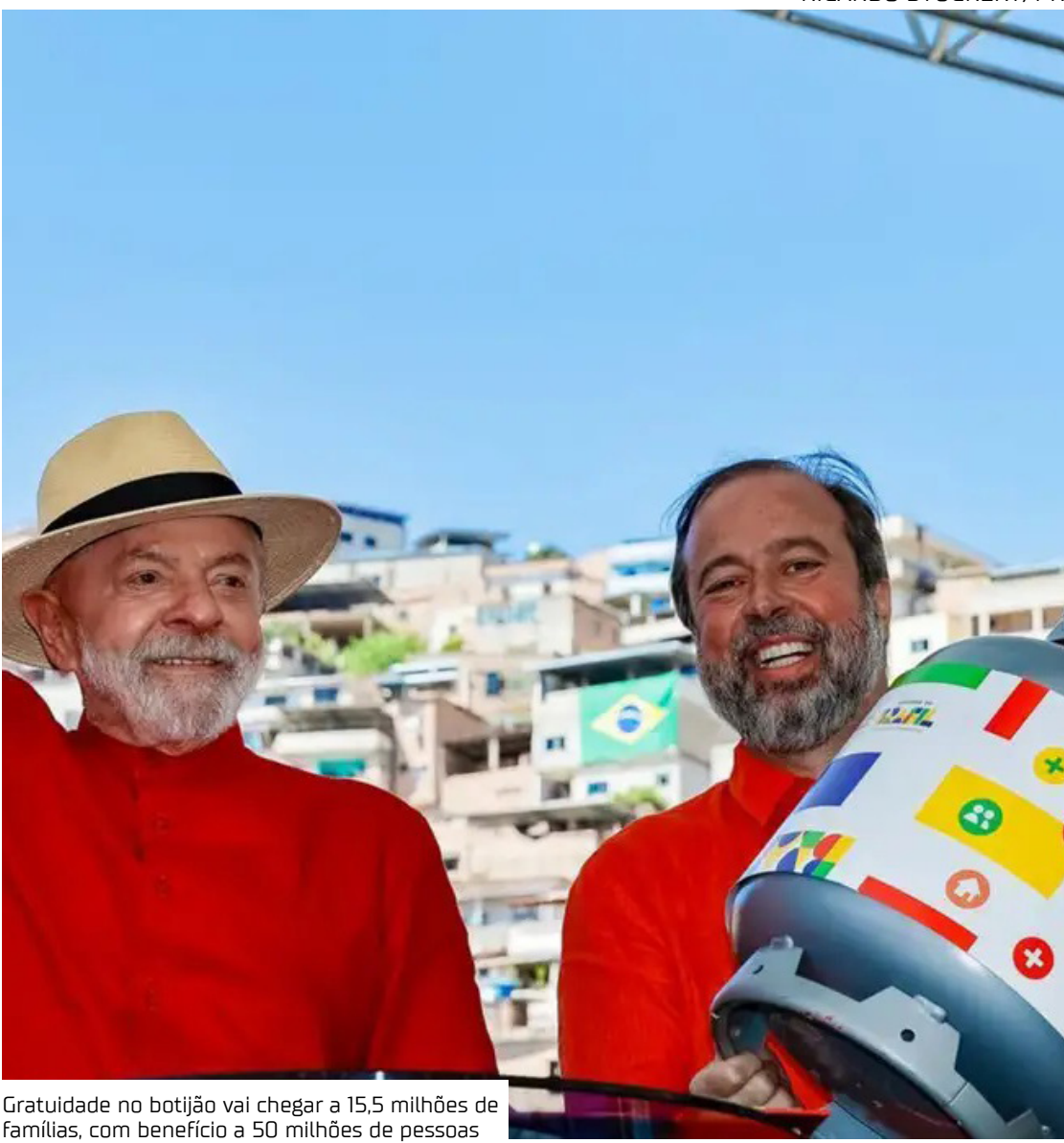
Gratuidade no botijão vai chegar a 15,5 milhões de famílias, com benefício a 50 milhões de pessoas

O estado do Amazonas terá 546.350 famílias beneficiadas pelo programa Gás do Povo. Lançado pelo presidente Luiz Inácio Lula da Silva, ontem (4), em Belo Horizonte (MG), a iniciativa garante gratuidade na aquisição do botijão de gás de cozinha. O programa foi criado para garantir mais justiça social, saúde e dignidade às famílias de baixa renda e fortalecer o acesso ao gás de cozinha. Ao todo, 15,5 milhões de famílias em todas as Unidades da Federação serão contempladas com o benefício, que chegará a 50 milhões de pessoas. Na visão do presidente Lula, o programa é uma medida essencial para reduzir desigualdades e garantir dignidade às famílias de baixa renda, assegurando que nenhum trabalhador precise comprometer parte significativa do salário para comprar um botijão de gás. “Nós estamos assumindo a responsabilidade