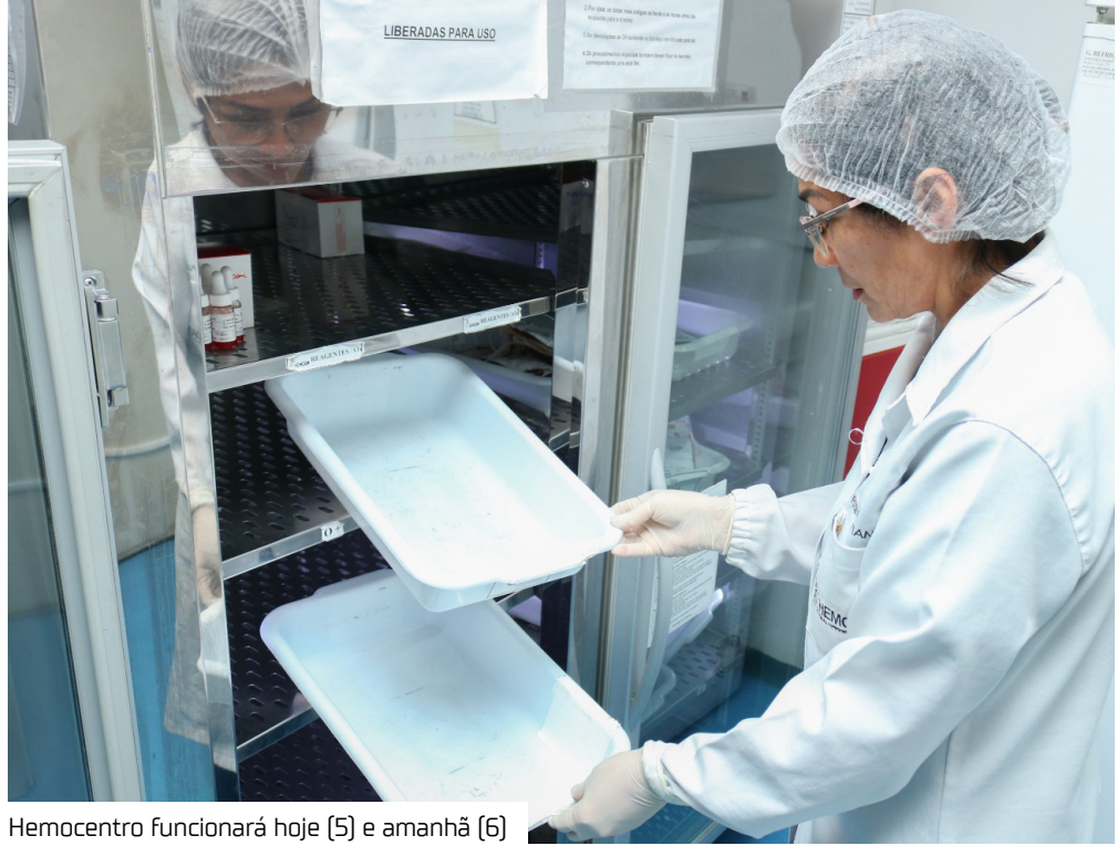
Hemocentro funcionará hoje (5) e amanhã (6)

O Hemoam está localizado na avenida Constantino Nery, nº 4397, Chapada.