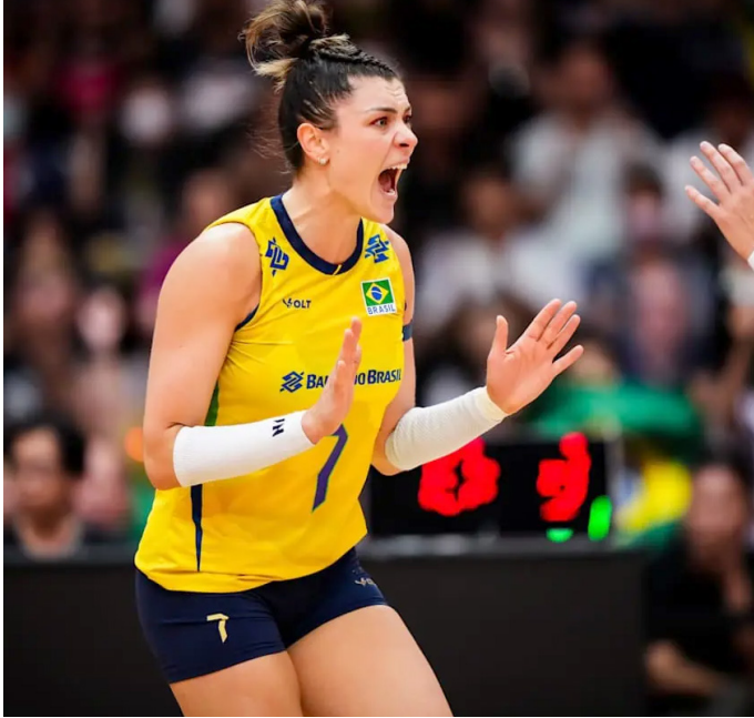
Seleção Brasileira feminina bateu a França por 3 sets a 0

O Brasil está nas se-mifinais do Mundial de vôlei! A Seleção Brasileira feminina bateu a Fran-ça por 3 sets a 0 nesta quinta-feira, na Tailân-dia, pelas quartas de fi-nal da competição. Com sets muito equilibrados, as brasileiras venceram com parciais de 27/25, 33/31 e 25/19.