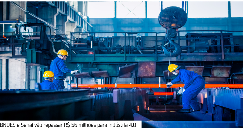
BNDES e Senai vão repassar R$ 56 milhões para indústria 4.0

Empresas inovadoras vão receber aporte de R$ 56 milhões para desenvolver soluções da chamada indústria 4.0 para micro, pequenas e médias Indústrias (MPMEs). Os recursos são originários do Banco Nacional de Desenvolvimento Econômico e Social (BNDES) e do Serviço Nacional de Aprendizagem Industrial (Senai).