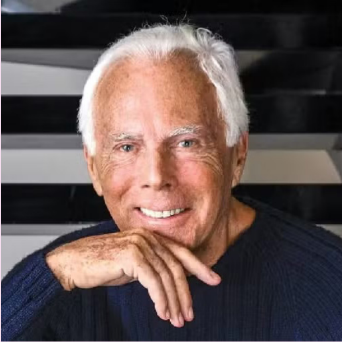
Notícia foi confirmada por meio de um comunicado oficial

Giorgio Armani, renomado estilista italiano e fundador da marca que leva seu nome, morreu ontem (4), aos 91 anos. A notícia foi confirmada por meio de um comunicado oficial divulgado pela empresa. “Sr. Armani, como sempre foi chamado com respeito e admiração pelos funcio-