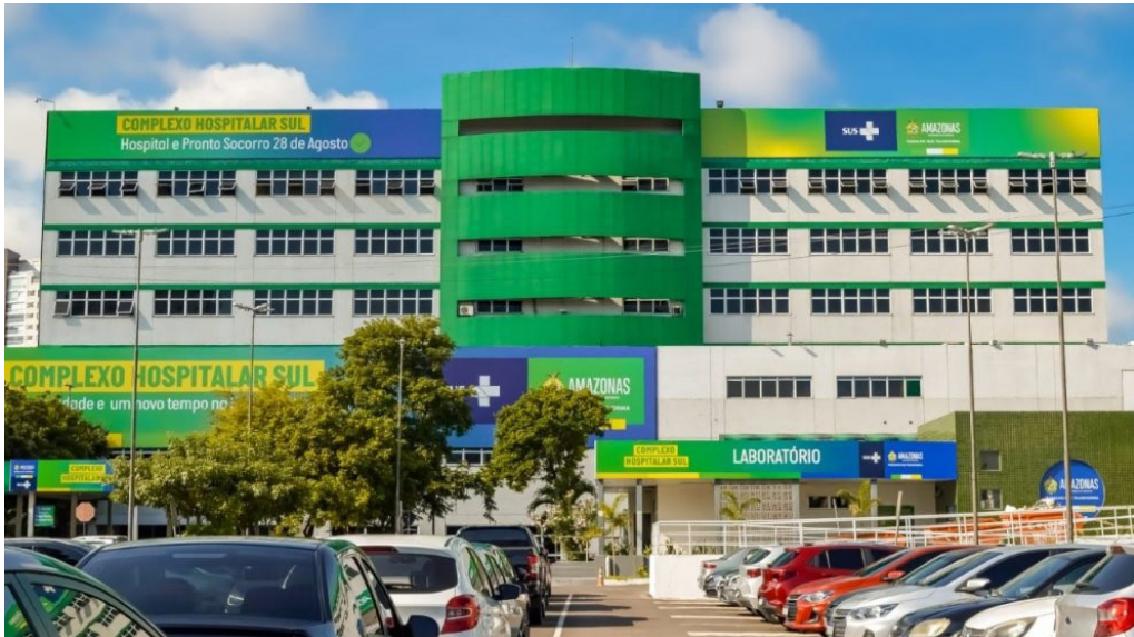
SES-AM divulga funcionamento das unidades de saúde durante o feriado de hoje (5)

Os serviços oferecidos pelas 25 unidades de urgência e emergência da Secretaria de Estado de Saúde (SES-AM) serão mantidos em plantão de 24 horas, durante o feriado da Elevação do Amazonas à categoria de Província, hoje (5). As unidades da rede estadual, incluindo os três prontos-socorros adultos, três prontos-socorros infantis, os nove Serviços de Pronto Atendimento (SPAs) distribuídos por todas as zonas da capital, além das Unidades de Pronto Atendimento (UPAs) Campos Sales (Tarumã) e José Rodrigues (Cidade Nova), estarão em regime de plantão 24 horas. O atendimento às gestan-