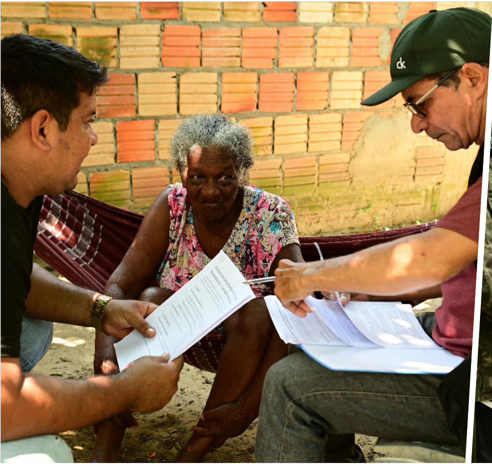
Histórias invisibilizadas ganham voz em projeto que transforma tradição oral em acervo digital gratuito

A proposta do projeto é reunir relatos, saberes e lendas de matriz africana que, por muito tempo, permaneceram invisibilizados nos registros oficiais da cultura amazô-