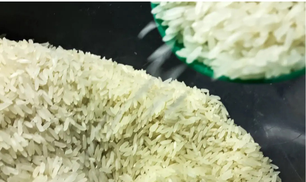
Adesão ao programa garante venda do produto ao governo por valor fixado