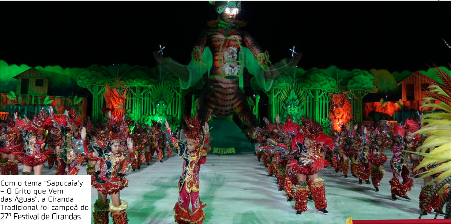
Com o tema “Sapucaia’y – O Grito que Vem das Águas”, a Ciranda Tradicional foi campeã do 27º Festival de Cirandas

Durante a apuração das notas, também foi realizada a leitura das notas da ‘melhor torcida’ da edição de 2025 do Festival de Cirandas. Gabaritando em todos os quesitos, a Ciranda Flor Matizada levou o título de campeã da melhor torcida do festival. A Torcida Família Ma-