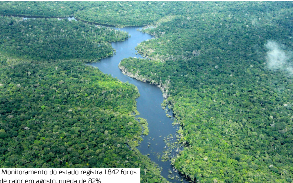
Monitoramento do estado registra 1.842 focos de calor em agosto, queda de 82%