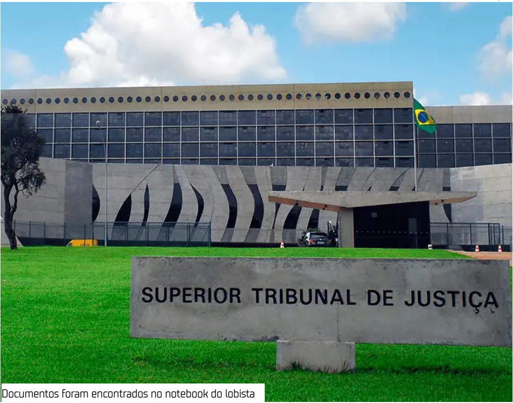
Documentos foram encontrados no notebook do lobista