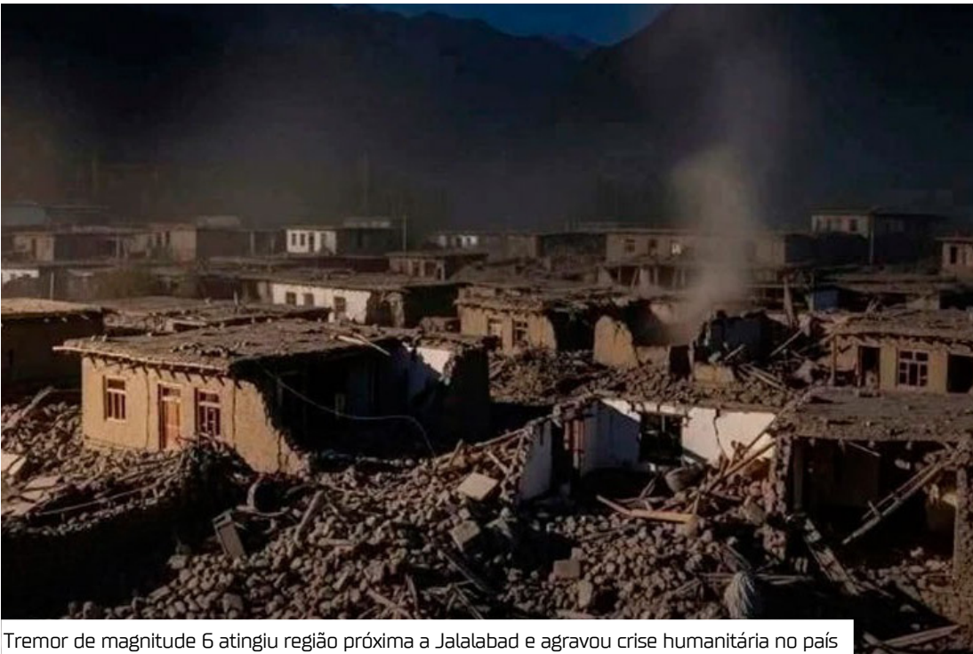
Tremor de magnitude 6 atingiu região próxima a Jalalabad e agravou crise humanitária no país

Mais de 2.500 mil pessoas ficaram feridas depois do terremoto de 6 graus de magnitude