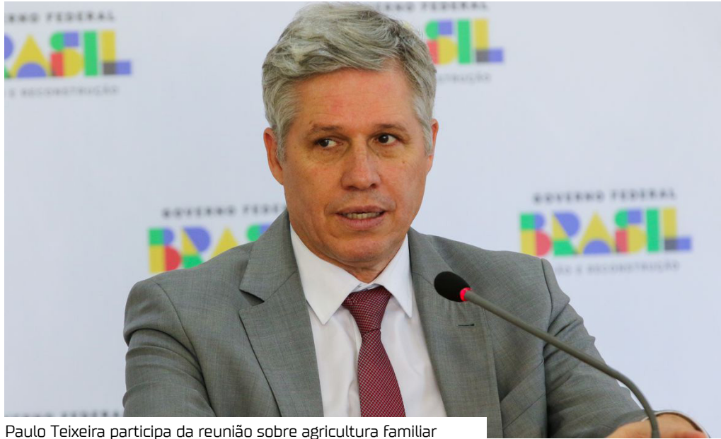
Paulo Teixeira participa da reunião sobre agricultura familiar

O ministro do Desenvolvimento Agrário e Agricultura Familiar, Paulo Teixeira, cumpre agenda em Manaus nesta terça-feira (2), onde lançará oficialmente o Plano Safra da Agricultura Familiar 2025/2026 no Amazonas. A cerimônia será realizada às 10h no Auditório Projeto Aranoua, no Instituto Federal do Amazonas (IFAM), zona Leste da capital.