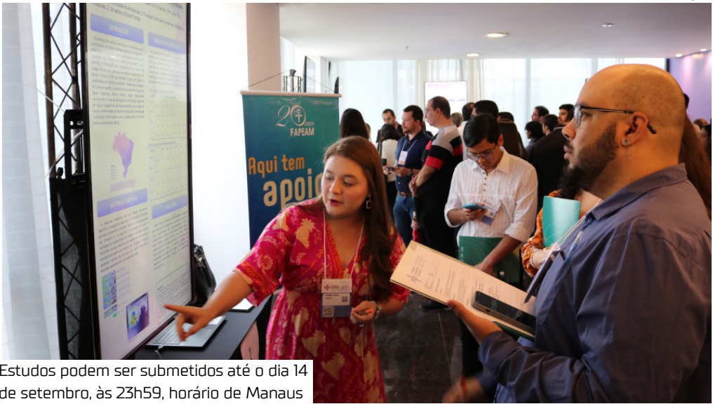
Estudos podem ser submetidos até o dia 14 de setembro, às 23h59, horário de Manaus

A Fundação Centro de Controle de Oncologia do Estado do Amazonas (FCecon), órgão vinculado à Secretaria de Estado de Saúde (SES-AM), prorrogou para o dia 14 de setembro, até às 23h59, horário de Manaus, o prazo para submissão de trabalhos científicos para o 8º Congresso Pan-Amazônico de Oncologia. Os interessados podem submeter os estudos pelo link https://panamazonicodeoncologia.com/2025/trabalhos/ .