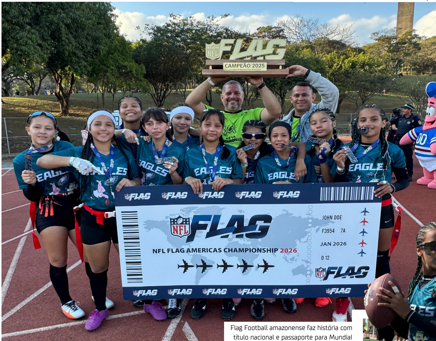
Flag Football amazonense faz história com título nacional e passaporte para Mundial

salto: “Estávamos confiantes em chegar à final. Prometi isso às meninas e conseguimos cumprir a missão, coroando nosso esforço com o título. Já me vejo em janeiro com elas no México.”