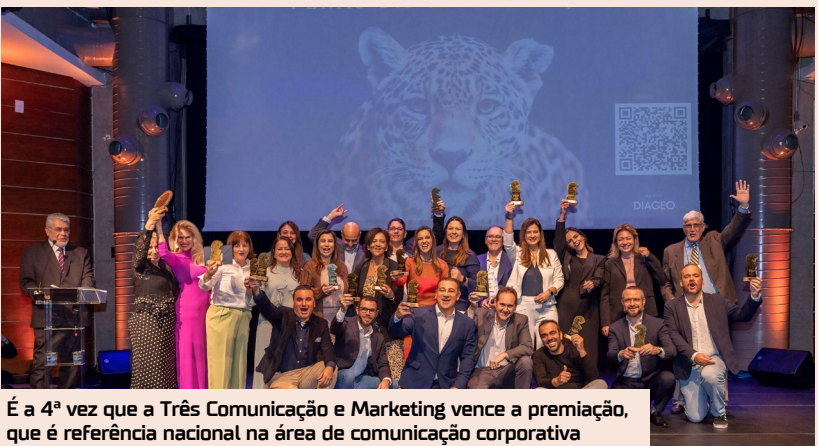
É a 4ª vez que a Três Comunicação e Marketing vence a premiação, que é referência nacional na área de comunicação corporativa

Todos os domingos, das 6h da manhã às 12h, a Avenida Getúlio Vargas, a mais arborizada da cidade, é Faixa Liberada. Nota 10 para a Prefeitura de Manaus que deu a população um novo point de lazer e trouxe vida ao centro histórico. Que essa iniciativa possa ser estendida a outras zonas, dando mais qualidade de vida ao povo amazonense. Garanto que será um sucesso.