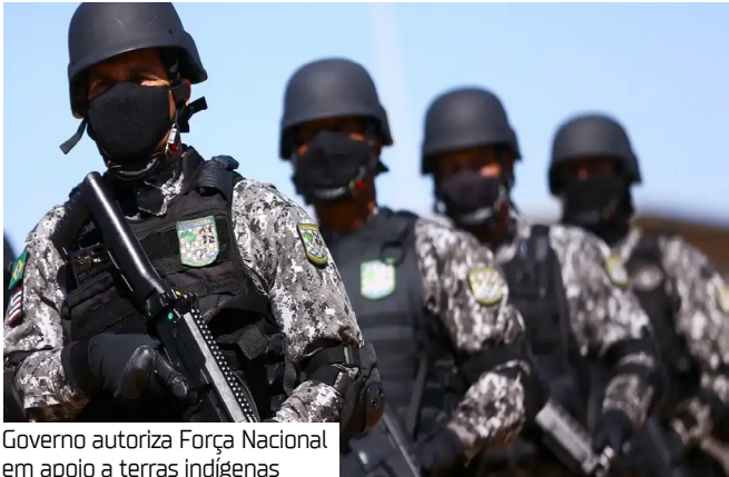
Governo autoriza Força Nacional em apoio a terras indígenas