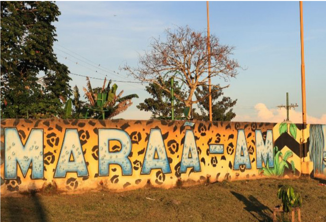
MP recomendou que a prefeitura informe os períodos de vigência de cada contrato

“A gestão também deve apresentar, no prazo de 15 dias, cópias de todos os comprovantes de pagamento realizados às empresas fornecedoras de medicamentos nos últimos 12 meses; e solicitar, no prazo de 20 dias, às empresas fornecedoras de medicamentos, informações detalhadas sobre os preços praticados no mercado para os mesmos medicamentos fornecidos ao município, bem como os preços pelos quais essas empresas adquirem tais medicamentos de seus distribuidores ou fabricantes, encaminhando ao Ministério Público as respostas obtidas”, destacou o promotor.