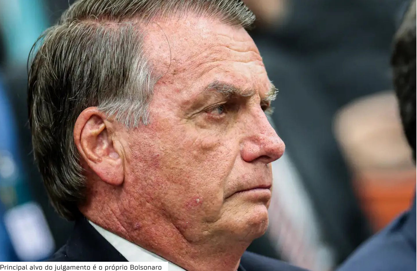
Principal alvo do julgamento é o próprio Bolsonaro

“Se chegarmos à conclusão que esse crime houve e que há a prova suficiente, que a defesa foi exercida corretamente suficientemente, então a grande importância é o recado institucional de que a