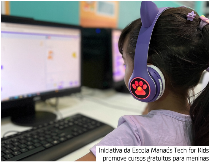
Iniciativa da Escola Manaós Tech for Kids promove cursos gratuitos para meninas

“Nosso projeto visa promover o acesso qualificado, lúdico e inspirador à tecno-