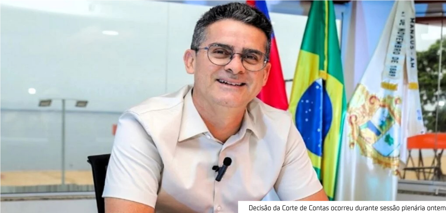
Decisão da Corte de Contas ocorreu durante sessão plenária ontem