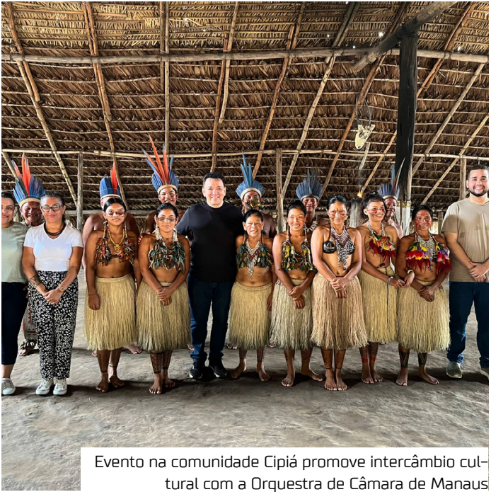
Evento na comunidade Cipiá promove intercâmbio cultural com a Orquestra de Câmara de Manaus

A “Orquestra na Floresta” integra as ações do Concultura voltadas para difusão cultural e intercâmbio artístico, reafirmando o compromisso da Prefeitura de Manaus com a democratização do acesso à arte e a valorização das identidades locais.