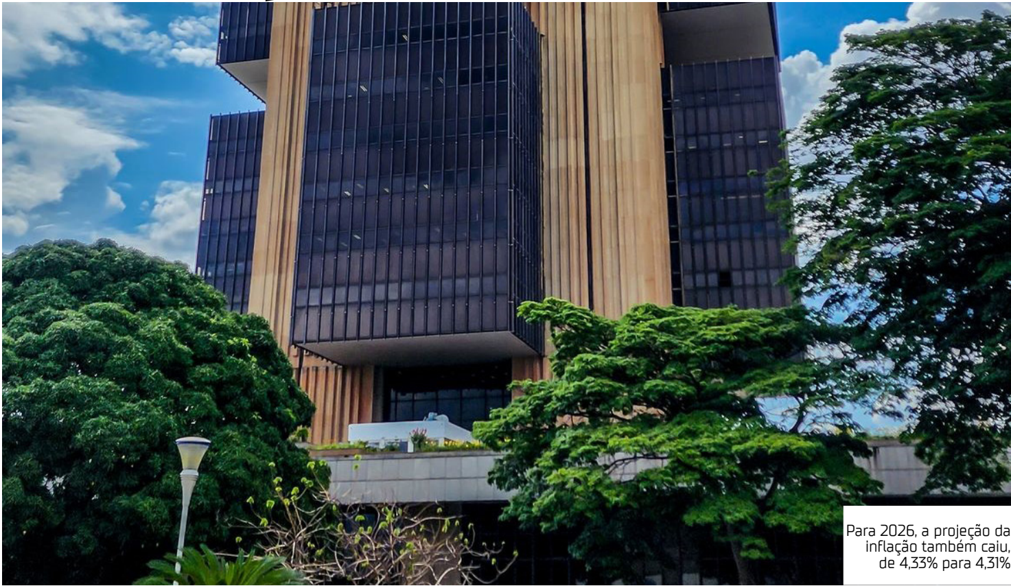
Para 2026, a projeção da inflação também caiu, de 4,33% para 4,31%

Em comunicado, o Copom informou que a política comercial dos Estados Unidos aumentou as incertezas na relação aos preços. A autoridade monetária informou