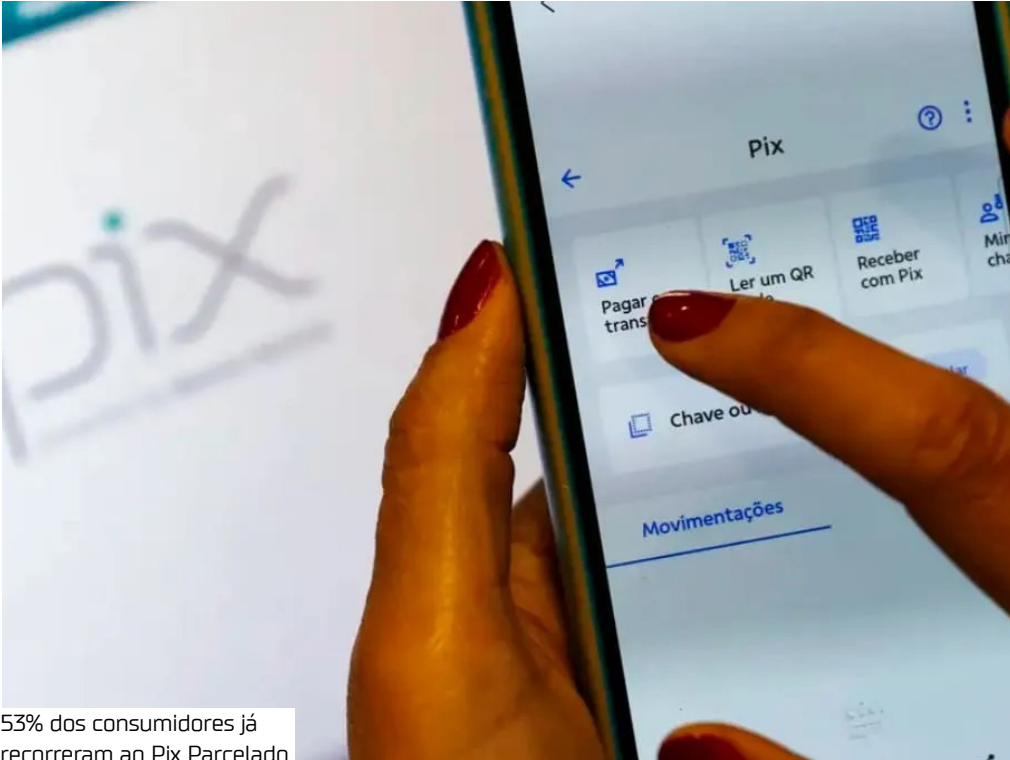
53% dos consumidores já recorreram ao Pix Parcelado