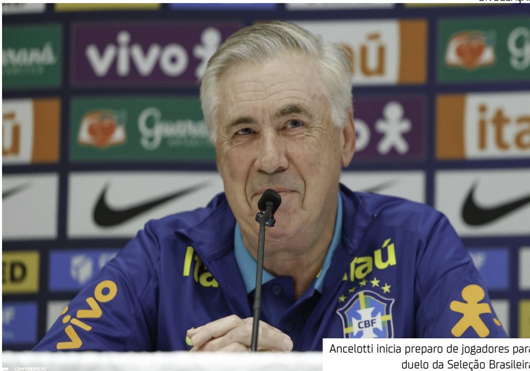
Ancelotti inicia preparo de jogadores para duelo da Seleção Brasileira

Já classificada para a Copa do Mundo de 2026, a Seleção Brasileira ocupa a terceira posição, com 25 pontos.