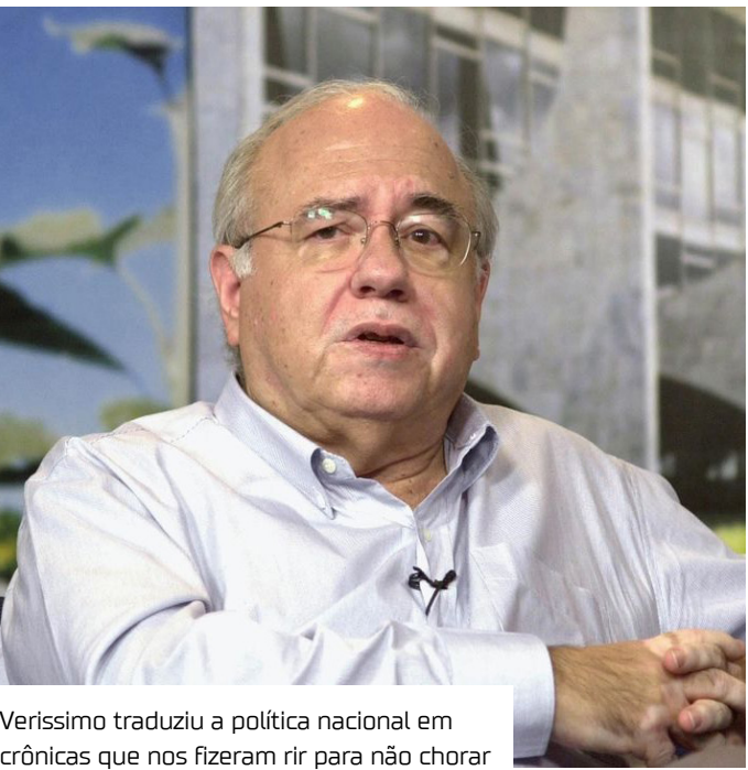
Veríssimo traduziu a política nacional em crônicas que nos fizeram rir para não chorar

ção política não tenha sido nem cobra nem homem, mas uma senhora de Taubaté, a Velhinha. A criatura doce, crédula, devota do governo, fosse ele qual fosse. Deliberadamente, a Velhinha acreditava nos mandatários de todos os matizes.