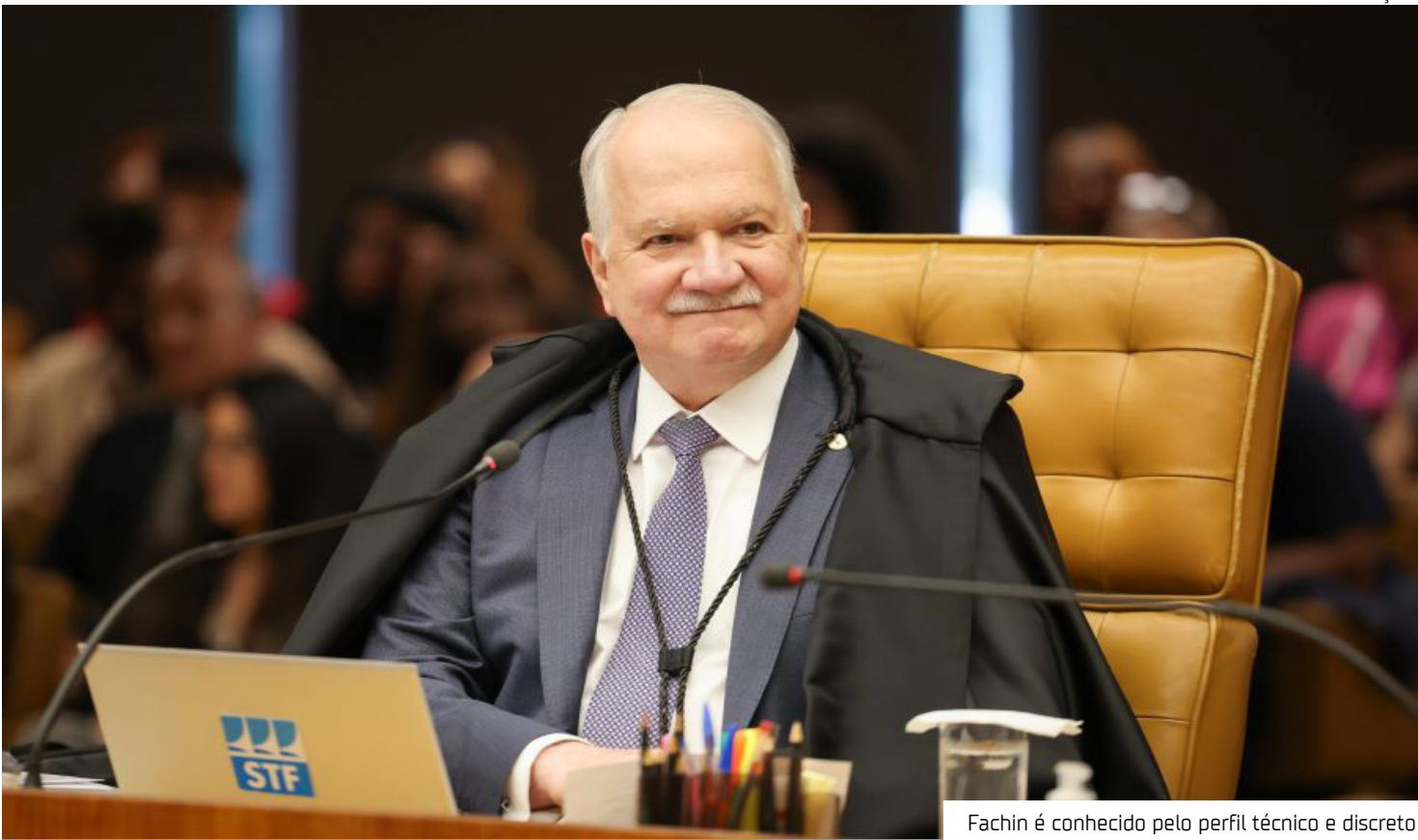
Fachin é conhecido pelo perfil técnico e discreto

Ele ganhou projeção em 2017, quando herdou a relatoria das ações sobre a Operação Lava Jato após a morte do ministro Teori Zavascki.