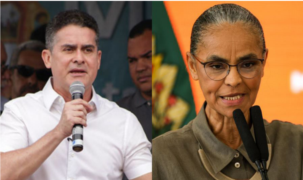
Prefeito também mencionou a BR-317, no Acre, que foi asfaltada com liberação do governo federal