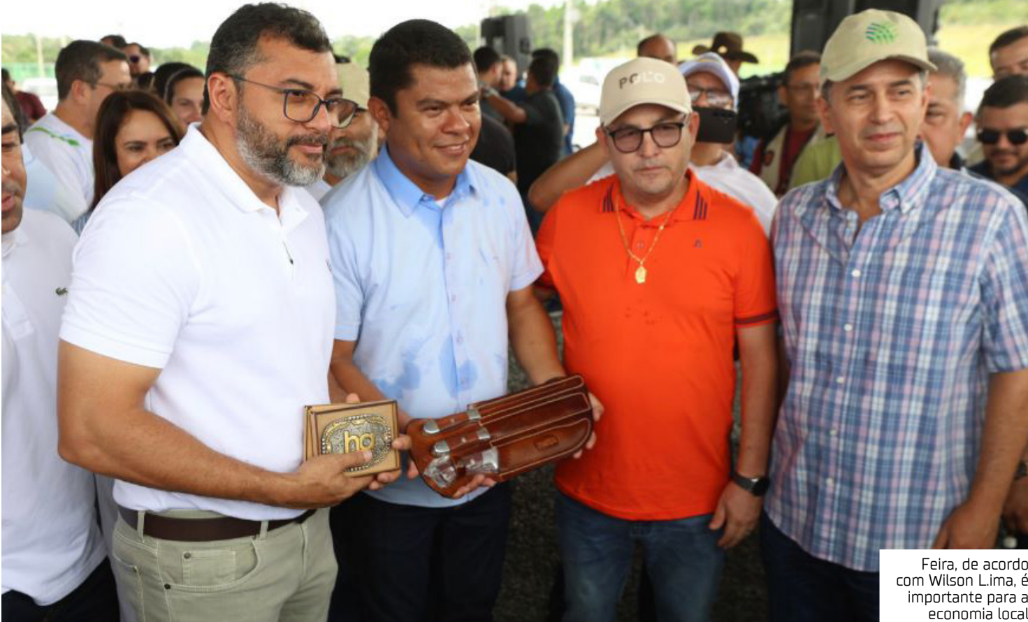
Feira, de acordo com Wilson Lima, é importante para a economia local

pedes Ferreira Lins, inaugurado em 2023, é a nova casa do produtor rural e sedia a feira pela segunda vez consecutiva. Com investimento de R$ 25,1 milhões, a estrutura conta com três pavilhões de exposição,