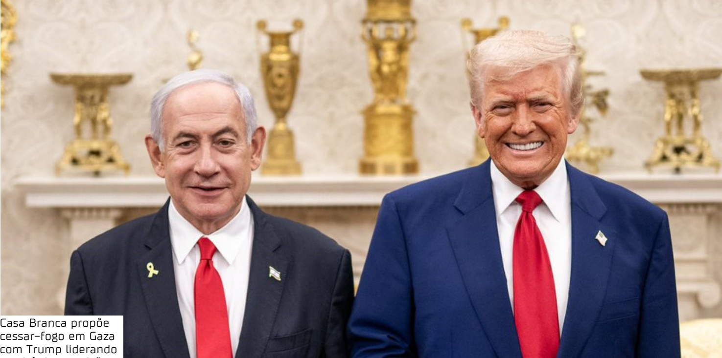
Casa Branca propõe cessar-fogo em Gaza com Trump liderando comitê de transição

O chamado “Plano abrangente para acabar com o conflito de Gaza”, divulgado pela Casa Branca poucos minutos após a entrevista coletiva de Trump e Netanyahu, prevê a liberação de todos os 48 reféns israelenses em até 72