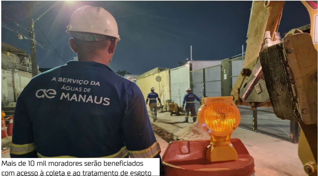
Mais de 10 mil moradores serão beneficiados com acesso à coleta e ao tratamento de esgoto

A Águas de Manaus segue com as obras de expansão do sistema de esgotamento sanitário no bairro Cidade Nova, Zona Norte da cidade. Para levar os serviços de coleta e tratamento de esgoto a mais de 10 mil pessoas na região, as equipes da concessionária iniciaram ontem (29) a implantação de rede na avenida Noel Nutels, no sentido bairro/centro (próximo à escola Profª Ruth Prestes Gonçalves – Aldeia do Conhecimento). As obras ocorrem de segunda a sexta-feira no período noturno e durante a madrugada, das 20h às 4h. A via será recapeada conforme a evolu-