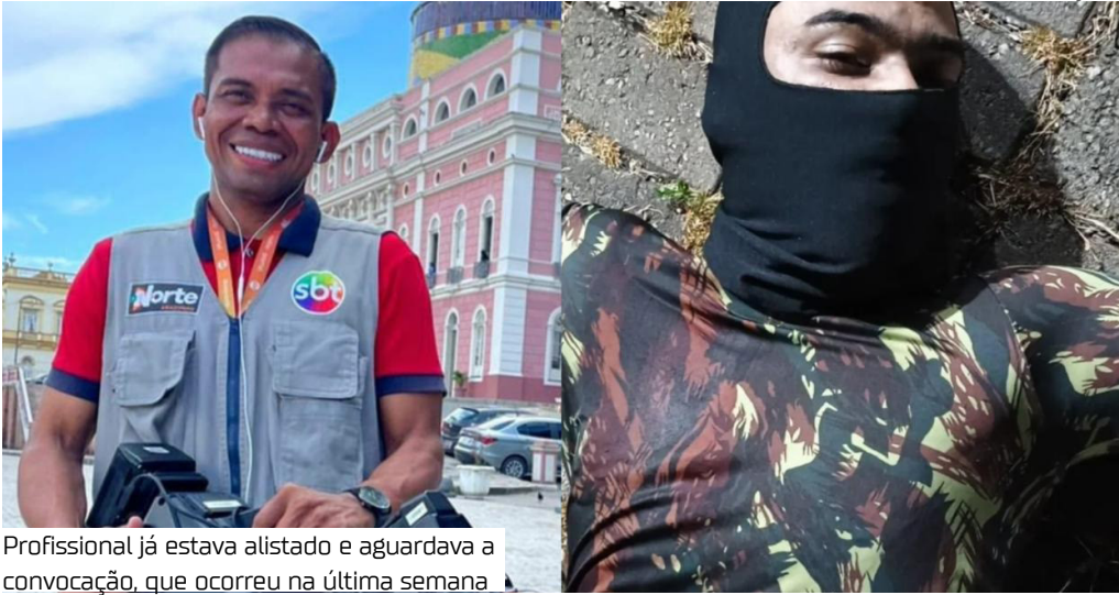
Profissional já estava alistado e aguardava a convocação, que ocorreu na última semana