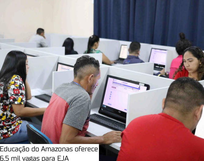
Educação do Amazonas oferece 6,5 mil vagas para EJA