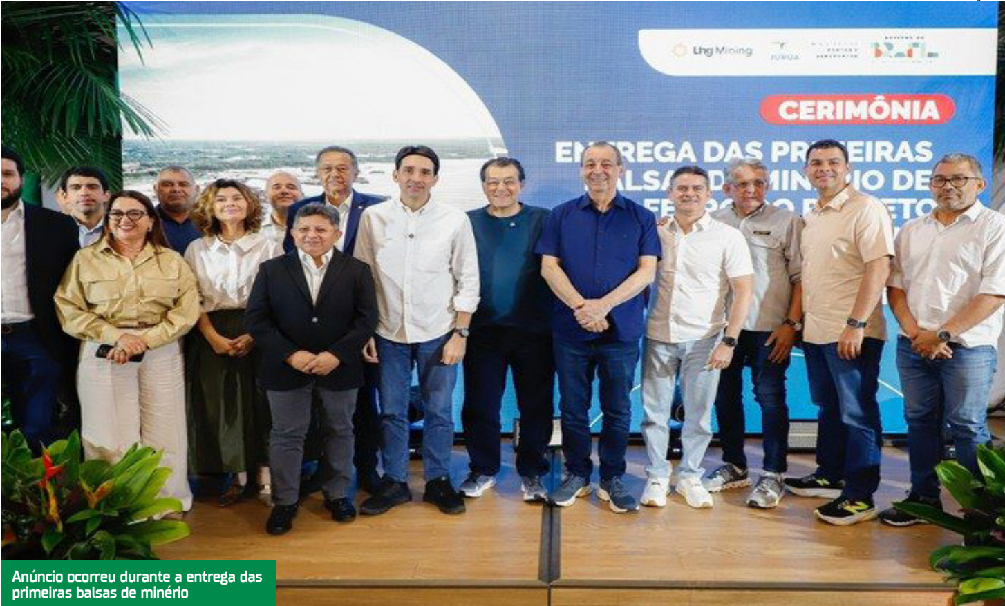
Anúncio ocorreu durante a entrega das primeiras balsas de minério

O senador ressaltou ainda a importância da navegação como um dos principais meios