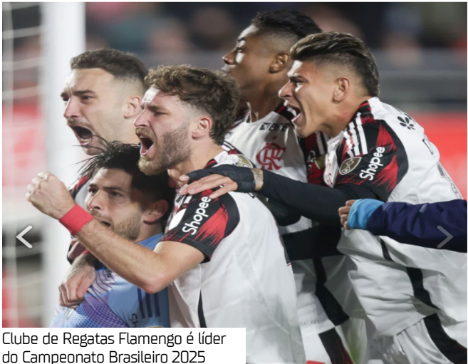
Clube de Regatas Flamengo   l der do Campeonato Brasileiro 2025