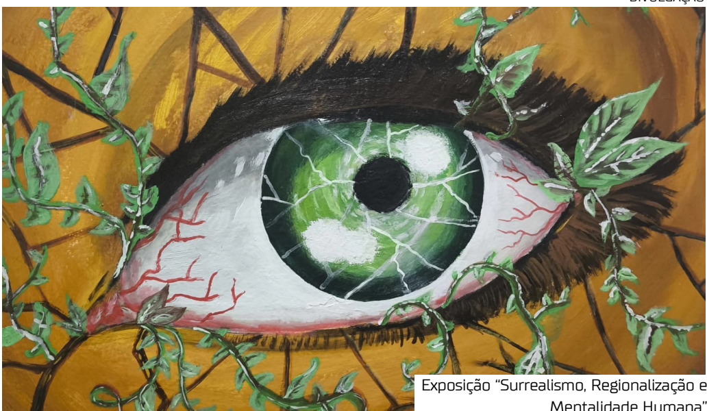
Exposição “Surrealismo, Regionalização e Mentalidade Humana”