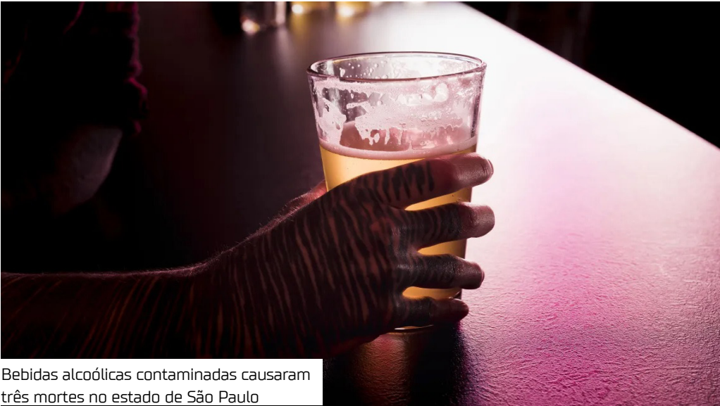
Bebidas alcoólicas contaminadas causaram três mortes no estado de São Paulo

A Prefeitura de São Bernardo do Campo, por meio da Secretaria de Saúde, informou ontem (29) mais uma morte suspeita por ingestão de bebida alcoólica adulterada com metanol, a segunda na cidade.