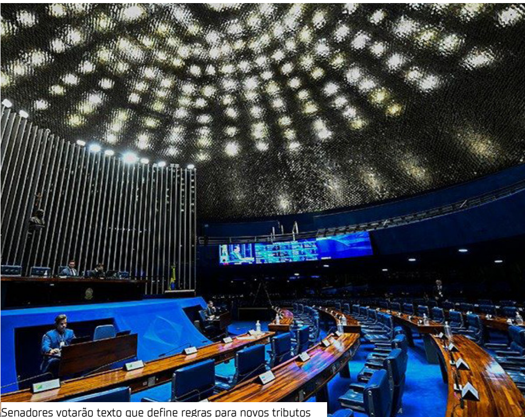
Senadores votarão texto que define regras para novos tributos

O Plenário do Senado deve votar hoje (30), a partir das 14h, o projeto de lei complementar que regulamenta a segunda parte da reforma tributária.