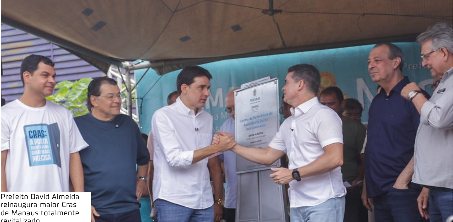
Prefeito David Almeida reinaugura maior Cras de Manaus totalmente revitalizado

possamos investir em todas as áreas, incluindo a assistência social, e muito em breve estaremos inaugurando a última estrutura do Cras reformada e ampliada. O Cras é a porta de entrada para as pessoas que mais precisam, para quem precisa de auxílio, BPC ou encaminhamento, e eu estou muito feliz com a gestão do Saulo, juntamente com a Dermi, e com toda a equipe envolvida. Temos trabalho, entregas e, acima de tudo, compromisso de transformar vidas”, disse. O prefeito também ressaltou a importância da preservação ambiental, conectando o cuidado com o social e com a floresta amazônica. “É preservação que permeia essa estrada e nós somos um exemplo para o Brasil de preservação ambiental, um estado que tem 96% do seu território preservado. Temos que ensinar para o Brasil e o mundo o que é preservação e o cuidado com as pessoas”. A revitalização do Cras Cidade Nova contemplou cozinha, sala de múltiplas atividades, sala de técnicos, sala de atendimento individual às famílias, ampliação dos banheiros e a criação de uma subcentral do Cadastro Único, ampliando a capacidade de atendimento da unidade. Durante a obra, o atendimento às famílias foi mantido no Conselho