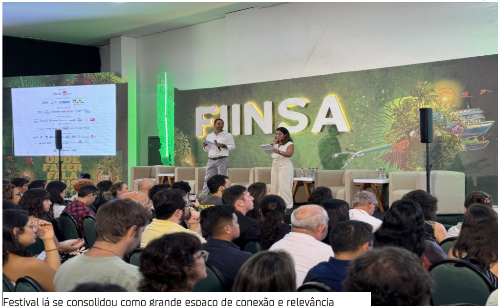
Festival já se consolidou como grande espaço de conexão e relevância

Belém será palco de um dos encontros mais estratégicos da Amazônia durante a COP30: o Festival de Investimento de Impacto e Negócios Sustentáveis da Amazônia (FIINSA).