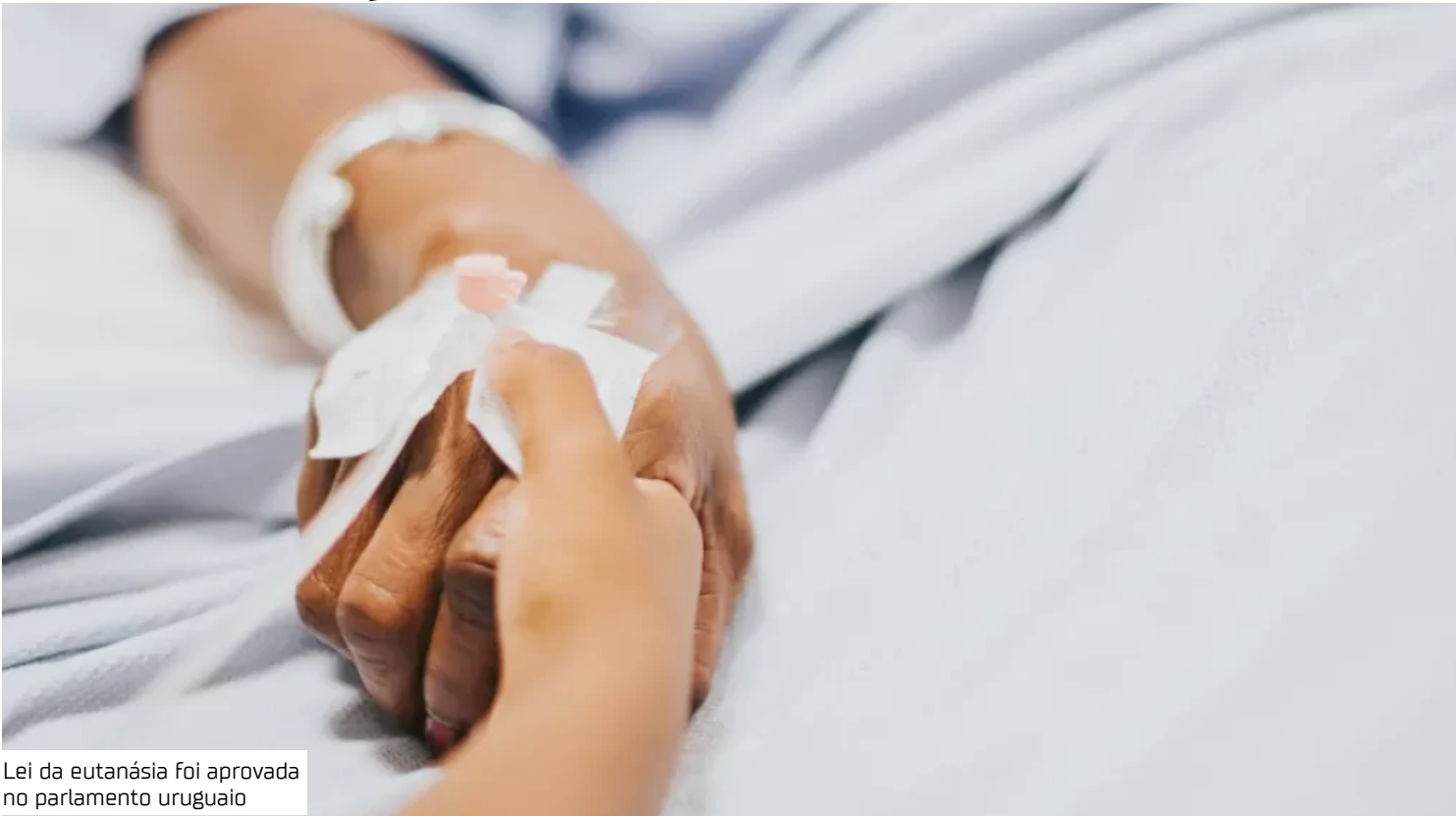
Lei da eutanásia foi aprovada no parlamento uruguaio

lação aprovada no Uruguai prevê que é necessário ser maior de idade, cidadão ou residente no Uruguai, estar em plena saúde mental e em fase terminal de doença incurável ou que cause sofrimento insuportável, com grave deterioração da qua-