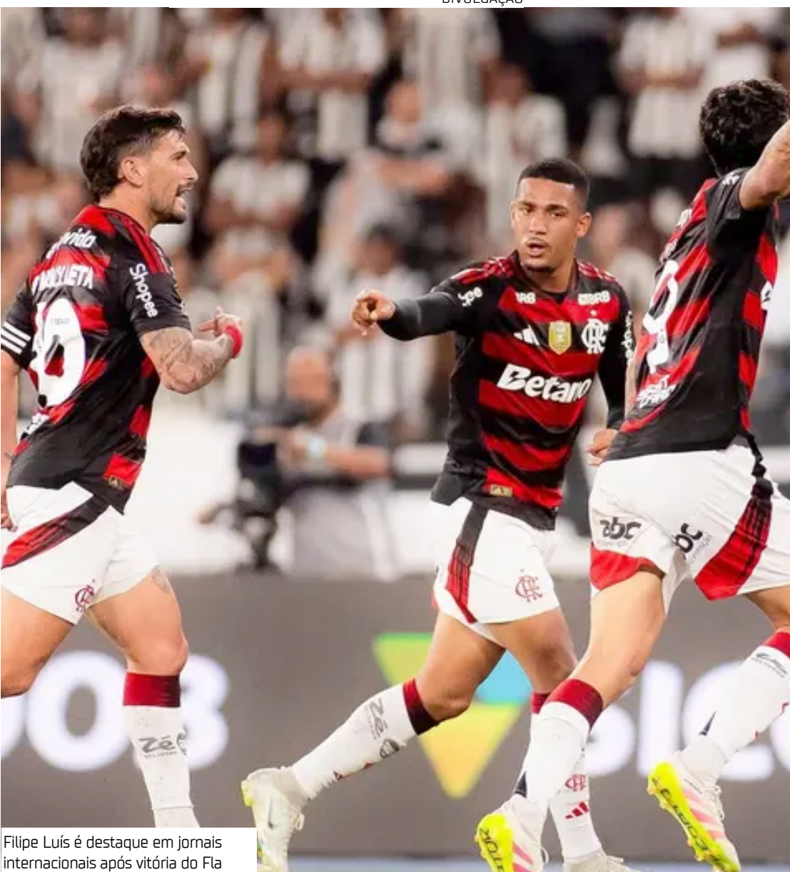
Filipe Luís é destaque em jornais internacionais após vitória do Fla

Assim como foi no clássico com o Botafogo, Saúl, De La Cruz e Allan podem ser desfalques contra o Palmeiras. Afinal, o trio não treinou nesta semana. Em coletiva de imprensa no Estádio Nilton Santos, o técnico Filipe Luís abordou o tema. "Os três não treinaram na semana da Data Fifa, estão se recuperando de incômodos. Cada um tem um problema. Esperamos recuperá-los o mais rápido possível. Não sei se vão chegar para o jogo contra o Palmeiras, sinceramente. Estão na fase final", disse o treinador. Responsável por goleada O Flamengo derrotou o Botafogo no estádio Nilton Santos, em confronto válido pela 28ª rodada do Brasileirão. O Rubro-Negro controlou o jogo desde os minutos iniciais, neutralizando as ações do rival e impondo ampla superioridade técnica e tática. A atuação, inclusive, chamou atenção da imprensa internacional: o jornal espanhol "As" destacou o principal responsável pelo resultado e exaltou a dominância flamenguista ao longo da partida. Responsável pela vitória Trata-se de Filipe Luís. O técnico atribuiu o domínio ao comando estratégico do ex-Atlético de