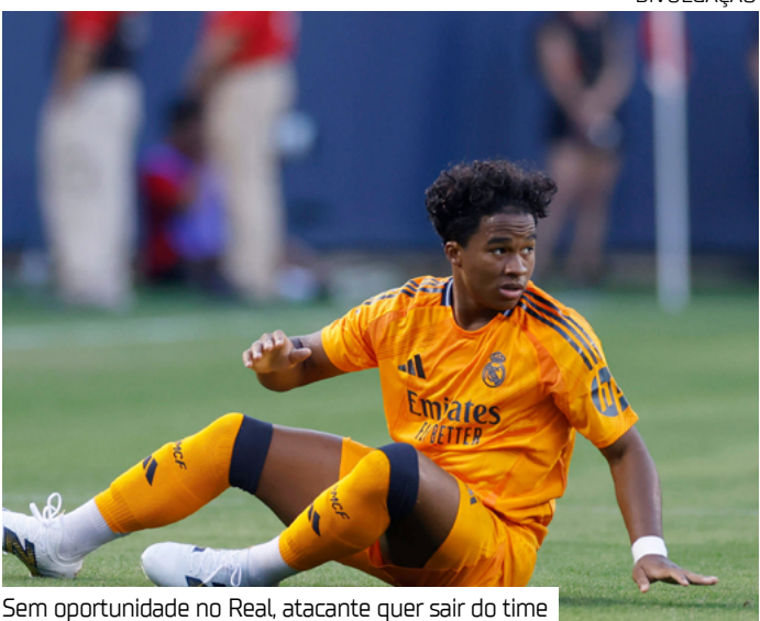
Sem oportunidade no Real, atacante quer sair do time

Nesse contexto, os primeiros clubes interessados na contratação de Endrick já sinalizam disposição para uma negociação que poderia ser concluída durante a próxima janela de transferências, em janeiro, no inverno europeu. Entre os principais candidatos, segundo o veículo, está o Olympique de Marselha, da França, comandado pelo técnico italiano Roberto De Zerbi e que conta com o atacante brasileiro Igor Paixão no elenco. Apesar da movimentação no mercado, o Cria da Academia e seu estafe entendem que o assunto não deve ser tratado de forma precipitada, por envolver decisões estra-