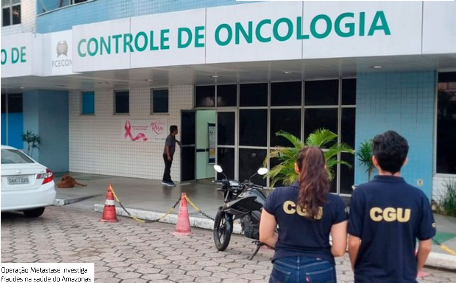
Operação Metástase investiga fraudes na saúde do Amazonas

As investigações começaram após o MPAM identificar que uma única família