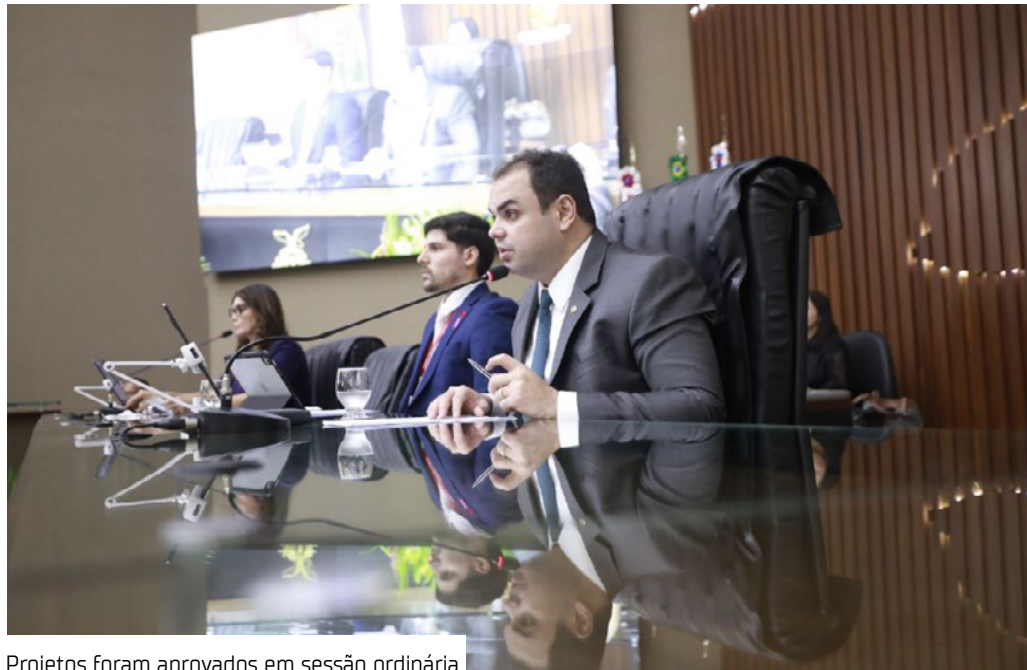
Projetos foram aprovados em sessão ordinária

Durante a sessão ordinária de ontem (16), os deputados da Assembleia Legislativa do Amazonas (Aleam) aprovaram o Projeto de Lei (PL) nº 887/2025, oriundo da Mensagem Governamental nº 118/2025, que altera a remuneração dos servidores públicos do Sistema Estadual de Saúde. A proposta visa à recomposição das perdas inflacionárias e à valorização dos profissionais da área. O texto estabelece um reajuste de 12,13% referente à data-base de 2022, sendo 6,13% aplicados a partir de 1º de outubro de 2025. O percentual restante será concedido de forma gradual, com acréscimo de 0,5% ao