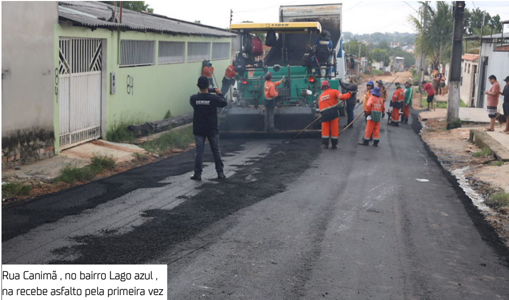
Rua Canimã, no bairro Lago azul, na recebe asfalto pela primeira vez