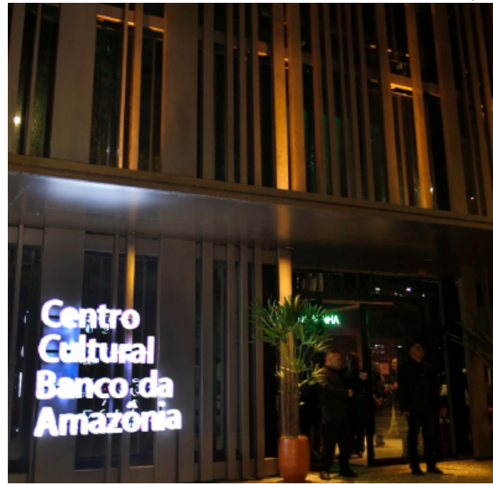
As inscrições estão abertas até 28 de novembro de 2025

O Banco da Amazônia lançou, na quarta-feira (15), dois editais de patrocínio para o ano de 2026, com o objetivo de fomentar a cultura, a cidadania, o empreendedorismo e o desenvolvimento sustentável. Com investimentos de R$ 8,9 milhões, o Edital de Seleção Pública de Patrocínios e o Edital de Ocupação do Centro Cultural Banco da Amazônia reforçam o propósito do banco em impulsionar quem cria o