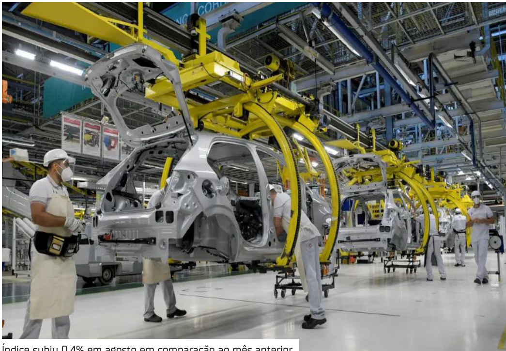
Índice subiu 0,4% em agosto em comparação ao mês anterior

A atividade econômica brasileira apresentou crescimento no mês de agosto deste ano, de acordo com informações divulgadas ontem (16) pelo Banco Central (BC). O Índice de Atividade Econômica do Banco Central (IBC-Br) subiu 0,4% em agosto em relação ao mês anterior, considerando os dados dessazonalizados (ajustados para o período). Na comparação com agosto de 2024, houve variação positiva de 0,1%, sem ajuste para o período, já que