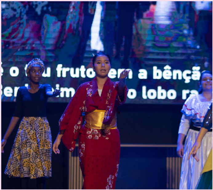
Espetáculo une fé, cultura e arte para narrar a história da Festa bíblica

A Festa dos Tabernáculos, também conhecida como “Festa das Cabanas”, remonta à época em que os israelitas habitavam cabanas (ou sucás) no deserto. Embora originalmente fosse uma festa agrícola, como a Páscoa e Pentecostes, a Bíblia atribuiu à celebração um significado histórico: a lembrança da peregrinação pelo deserto e do sustento providenciado por Deus. Essa história será narrada, por meio das danças e artes, neste sábado, dia 18