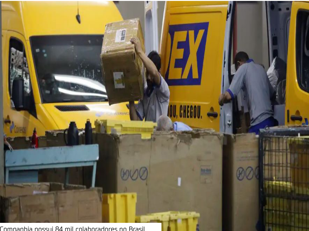
Companhia possui 84 mil colaboradores no Brasil