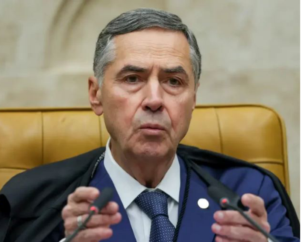
Ministro apresentou melhora e foi liberado pelos médicos para seguir com a medicação em casa