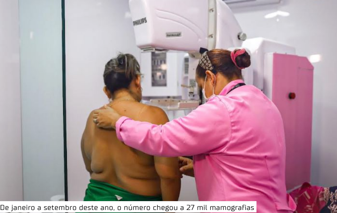
De janeiro a setembro deste ano, o número chegou a 27 mil mamografias

Mamografia é ofertada gratuitamente na rede pública de saúde